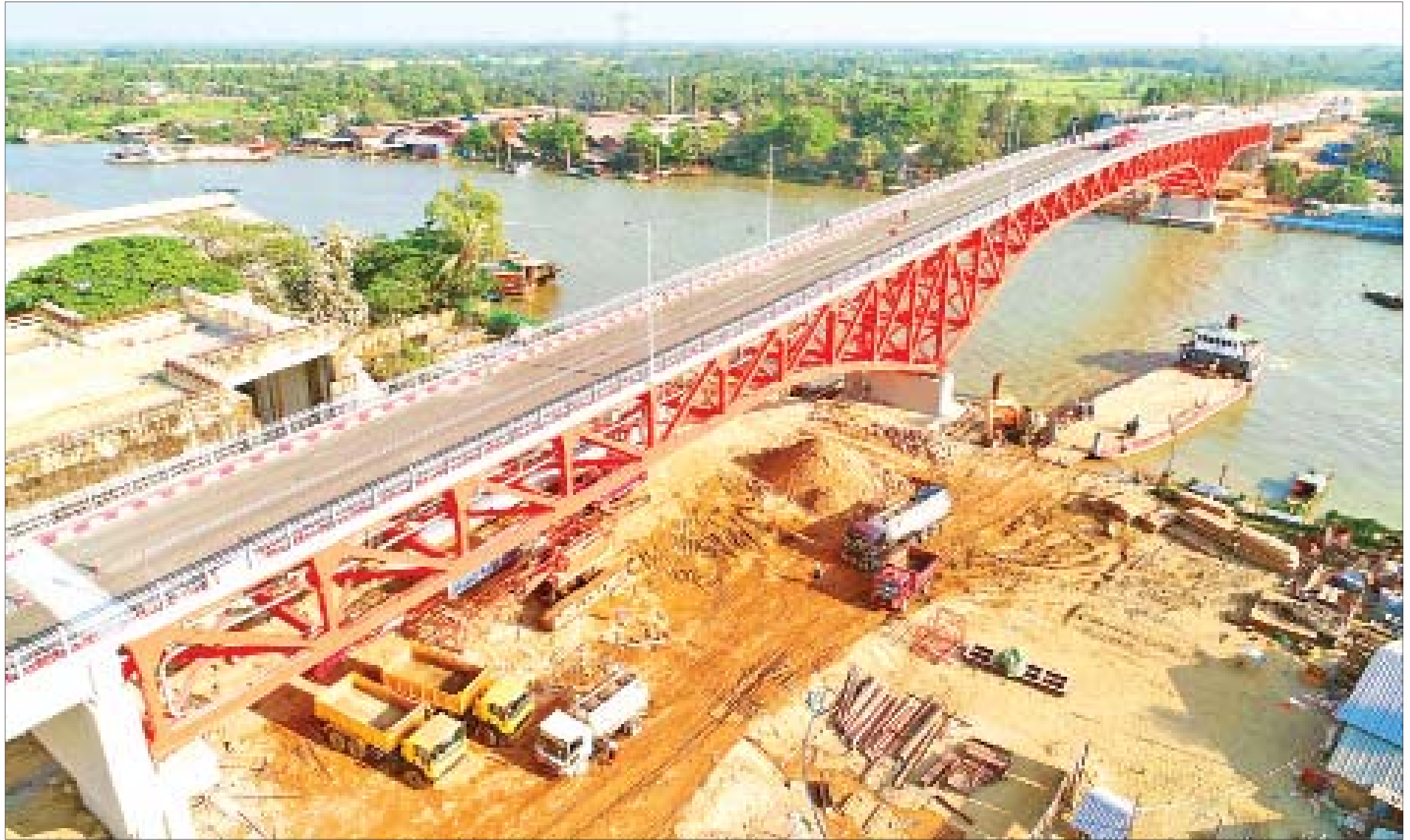
၂၀၁၉ ခုနှစ် ဧပြီ ၁ ရက်က ဖွင့်လှစ်လိုက်သော မြောင်းမြတံတားသစ်ကြီးကို တွေ့ရစဉ်။