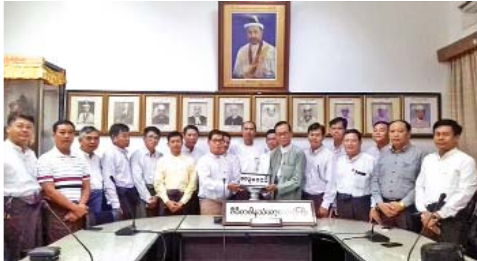
ဧပြီ ၁ ရက် နံနက်ပိုင်းက စစ်တက္ကသိုလ်ဗိုလ်လောင်းသင်တန်းအမှတ်စဉ် (၂၉) ကျောင်းဆင်းနှစ်ပတ်လည် (၃၁)နှစ်မြောက် အထိမ်းအမှတ်အဖြစ် ဇီဝိတဒါနသံဃာ့ဆေးရုံကြီး၌ ဆွမ်းနှင့် ဆေးပဒေသာပင် လှူဒါန်းငွေကျပ် ၁၁၃၀၀၀၀ ကို ပေးအပ်လှူဒါန်းရာ ဆေးရုံအုပ်ချုပ်ရေးအဖွဲ့ဥက္ကဋ္ဌ လက်ခံစဉ်။