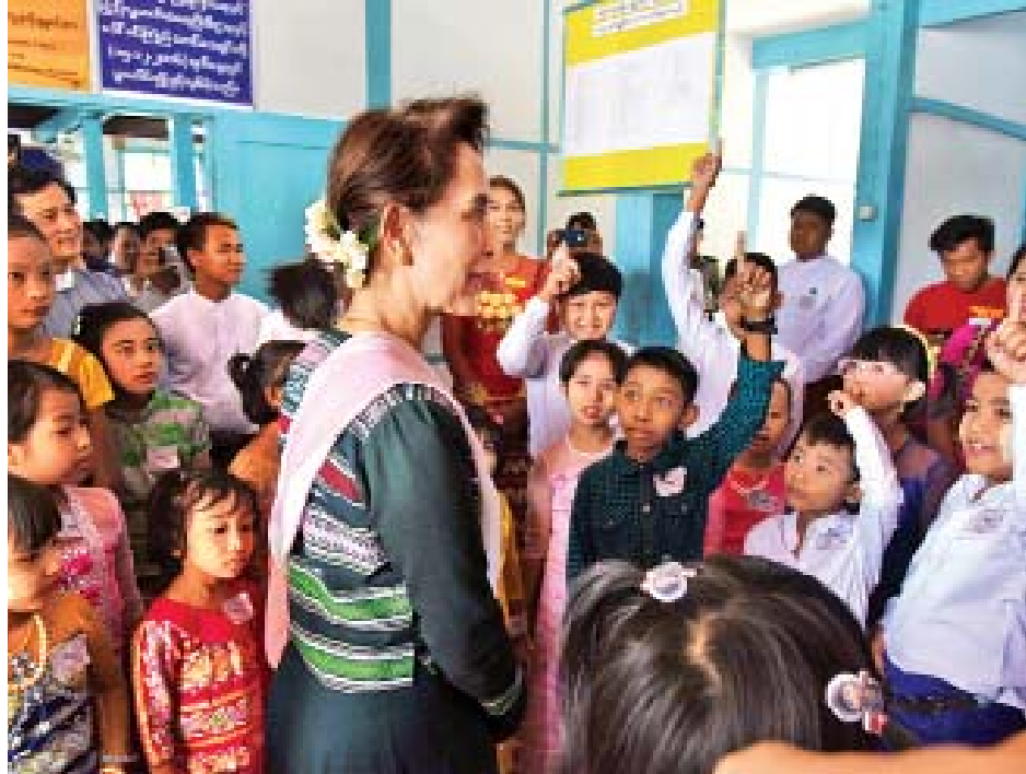
နိုင်ငံတော်၏အတိုင်ပင်ခံပုဂ္ဂိုလ် ဒေါ်အောင်ဆန်းစုကြည် ဒေါ်ခင်ကြည်ဖောင်ဒေးရှင်း ရွှေလျားစာကြည့်တိုက် တွင် ကလေးငယ်များနှင့် ရင်းရင်းနှီးနှီးတွေ့ဆုံစဉ်။

မဖွဲ့နိုင်ရဲ့ မဟာဗျူဟာတွေထဲမှာလည်း စဉ်ဆက်မပြတ် ဖွံ့ဖြိုးမှုနဲ့ စီးပွားရေးလုပ်ငန်း အမျိုးမျိုးကို ပံ့ပိုးပေးမယ့် ဦးစားပေးအခြေခံအဆောက်အအုံများ တည်ဆောက်ရေး ဆိုပြီး မျှော်မှန်းချက်၊ ရည်မှန်းချက်တွေ ထည့်သွင်းချမှတ် ကြိုးပမ်းလျက်ရှိပါတယ်။ ဒါကြောင့် အစိုးရအနေနဲ့ လမ်း၊ တံတားများ တည်ဆောက်ခြင်း၊ ပြုပြင်ခြင်း အပါအဝင် အခြေခံအဆောက်အအုံ ဖွံ့ဖြိုးတိုးတက်ရေးလုပ်ငန်းများ ကို ဦးစားပေးဆောင်ရွက်နေတာ ဖြစ်ပါတယ်။