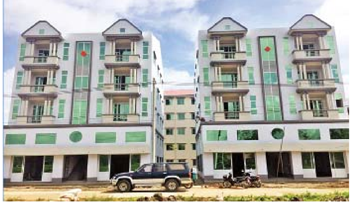
ရာဝတီတိုင်းဒေသကြီး ပုသိမ်မြို့တွင် တည်ဆောက်ပေးထားသည့် ဥမ္မာဒန္တအိမ်ရာ စီမံကိန်းကို တွေ့ရစဉ်။

ကော့မှူး - ဝါးဘလောက်သောက် - သရက်တောလမ်းပိုင်းတွေကို ဆောင်ရွက်နိုင်သလို ဒေါပုံကနေ ပုဇွန်တောင်သွားတဲ့ ဒေါပုံ (သာကေတ) တံတားကိုလည်း တည်ဆောက်နိုင်ခဲ့ပြီး ဖြစ်ပါတယ်။