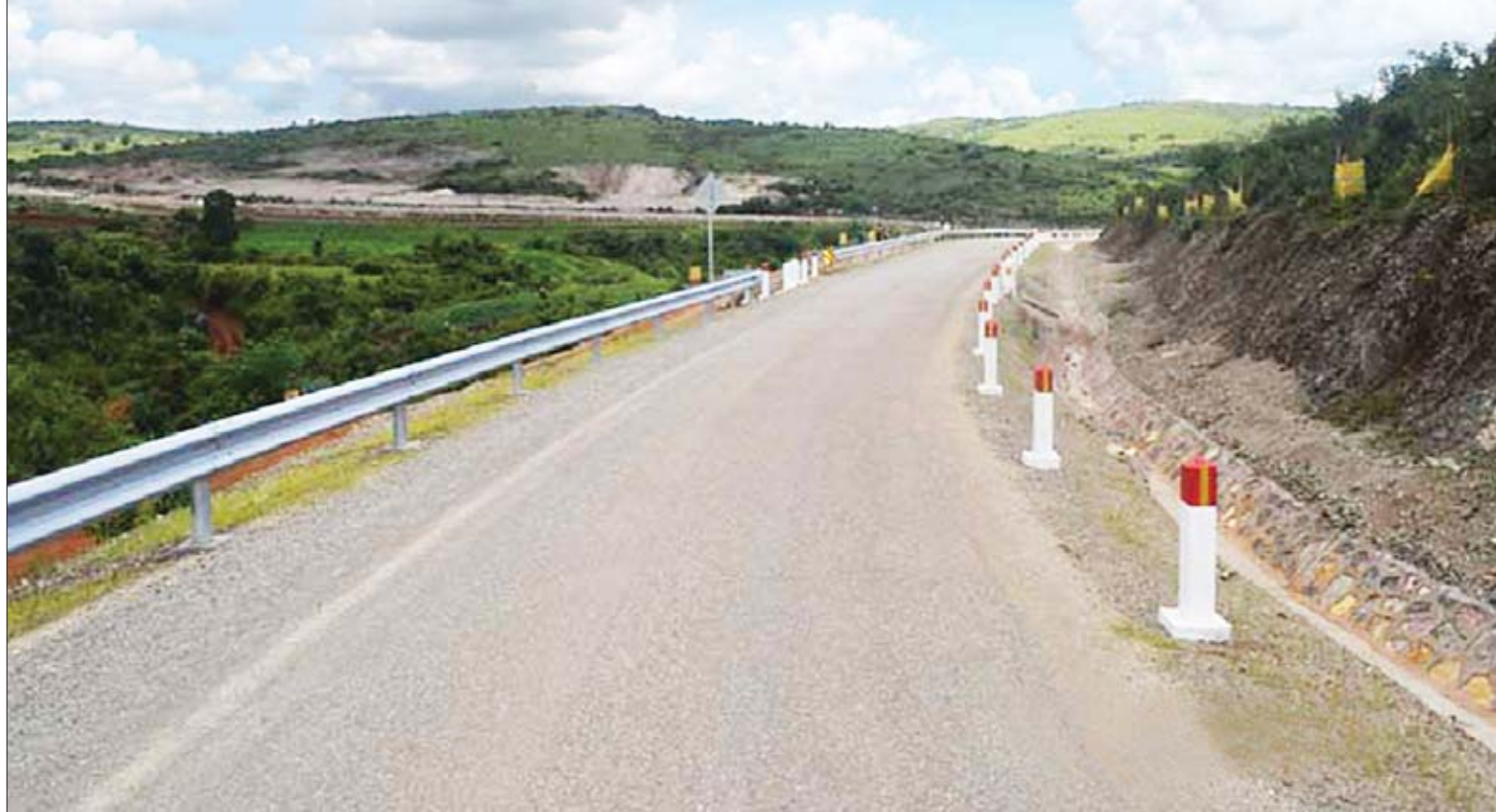
ဂျာမနီဖွံ့ဖြိုးရေးဘဏ် အထောက်အပံ့ဖြင့် ဆောင်ရွက်သည့် ကလေးမြို့နယ် ဘော်နင်း-ဆူးပန်းအင်း-ကမ်းပါးနီ-သရက်ပုလမ်း ကတ္တရာခင်းခြင်းလုပ်ငန်း ဆောင်ရွက်ပြီးစီးမှုကို တွေ့ရစဉ်။

ဖြေ။ ။ ပြည်ထောင်စုအဆင့် အဖွဲ့အစည်း တွေ၊ ပြည်ထောင်စုဝန်ကြီးဌာန တွေက အပ်နှံတဲ့ တရားလွှတ်တော်တွေ၊ ဆေးရုံကြီးတွေ၊ တက္ကသိုလ်ကောလိပ်တွေ ၃၈၄ ခု တည်ဆောက်ခဲ့ပြီး ၃၁၉ ခုကို တည်ဆောက်လျက်ရှိပါတယ်။ အရည်အသွေး ထိန်းသိမ်းစစ်ဆေးခြင်းလုပ်ငန်း ဆောင်ရွက် မှုအနေနဲ့ အဆောက်အအုံသုတေသန ဓာတ်ခွဲ ခန်းများကို အထက်မြန်မာပြည်နဲ့ အောက် မြန်မာပြည်ဆိုပြီး နှစ်ခုရှိပါတယ်။ ပြီးခဲ့တဲ့ ၂၀၁၈ ခုနှစ် အထူးကဏ္ဍ [ ၈ ] သို့ >>>