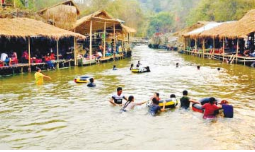
အစဉ်အလာမပျက် စည်ကားသိုက်မြိုက်စွာ ကျင်းပ လျက်ရှိရာ ထိုင်းနိုင်ငံ ချင်းရှင်ခရိုင်နှင့် မယ်ဆိုင် မြို့တို့မှ ဧည့်သည်များ၊ မြို့နေပြည်သူများနှင့် အနယ်နယ်အရပ်ရပ်မှ လာရောက်သူများ ပျော်ရွှင်စွာ ပါဝင်ဆင်နွှဲကြကြောင်း သိရသည်။ ဝေယံလင်း(ပြန်/ဆက်)

တာချီလိတ် ဧပြီ ၁ မြန်မာ-ထိုင်း နှစ်နိုင်ငံနယ်စပ် ရှမ်းပြည်နယ် (အရှေ့ပိုင်း) တာချီလိတ်မြို့နယ်ရှိ ချောင်းများ၌ သင်္ကြန်မတိုင်မီကာလ ရေကစားသူများ၊ အပန်းဖြေ အနားယူသူများဖြင့် စည်ကားနေပြီဖြစ်ကြောင်း သိရသည်။ တာချီလိတ်မြို့နယ်တွင် ပုန်းထွန်ချောင်း၊ မယ်ဟုတ်ချောင်း၊ တာလေမြို့၊ မိုင်းလင်း(အရှေ့) ကျေးရွာအုပ်စုရှိ နှစ်မြစ်ချောင်းတို့တွင် သင်္ကြန် ကာလအတွက် အပန်းဖြေရေကစားရန်နှင့် ရေပေါ် စားသောက်ဆိုင်များ ဖွင့်လှစ်ထားရာ ဒေသခံပြည်သူ များနှင့် အနယ်နယ်အရပ်ရပ်မှ လာရောက်သူများ အပန်းဖြေအနားယူ ရေကစားလျက်ရှိ သည်။ အလားတူ တာချီလိတ်မြို့တွင် မြန်မာ့ရိုးရာ ယဉ်ကျေးမှု အတာသင်္ကြန်ပွဲတော်ကို နှစ်စဉ်