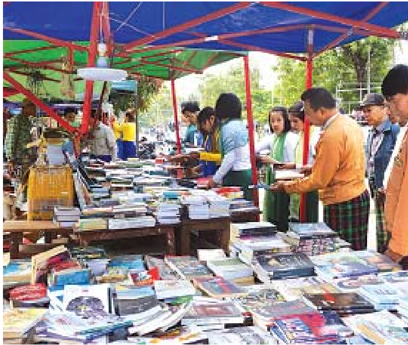
စုံလင်စွာ ရောင်းချပေးသွားမည်ဖြစ်ရာ စာပေ ပြည်သူများ လာရောက်ဝယ်ယူ အားပေးလျက်ရှိ ချစ်သူများ၊ စာဖတ်ဝါသနာရှင်များနှင့် ဒေသခံ ကြောင်း သိရသည်။ ခရိုင် (ပြန်/ဆက်)

ပန်းမော် ဧပြီ ၁ ကချင်ပြည်နယ် ပန်းမော်မြို့တွင် ခရိုင်ပြန်ကြားရေးနှင့် ပြည်သူ့ဆက်ဆံရေးဦးစီးဌာနနှင့် စာချစ်သူများ အဖွဲ့တို့က ပူးပေါင်း၍ နှစ်သစ်ကူးအကြို ကလေးစာပေပြပွဲနှင့် ရှားပါးစာအုပ် သုတ၊ ရသ စာအုပ် ဈေးရောင်းပွဲတော်ကို ဧပြီ ၁ ရက် နံနက် ၉ နာရီက ပန်းမော်မြို့အမှတ်(၂)အခြေစိုက်ပညာအထက်တန်းကျောင်းရှေ့တွင် ကျင်းပသည်။