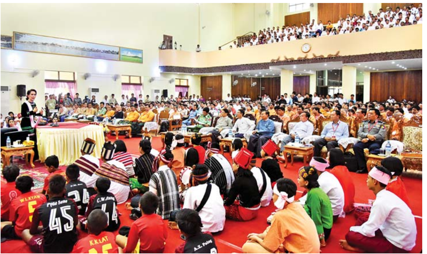
နိုင်ငံတော်၏အတိုင်ပင်ခံပုဂ္ဂိုလ် ဒေါ်အောင်ဆန်းစုကြည် ပုသိမ်မြို့၊ မြို့တော်ခန်းမ၌ ဒေသခံပြည်သူများနှင့် တွေ့ဆုံပွဲတွင် အမှာစကားပြောကြားစဉ်။

တင်ပြချက်များနှင့်စပ်လျဉ်း၍ ပြည်ထောင်စုဝန်ကြီး ဒေါက်တာအောင်သူ၊ တိုင်းဒေသကြီးဝန်ကြီးများနှင့် တာဝန်ရှိသူများက ပြန်လည်ရှင်းလင်းဖြေကြားကြပြီး နိုင်ငံတော်၏ အတိုင်ပင်ခံပုဂ္ဂိုလ်က ဖြည့်စွက်ရှင်းလင်း သည်။ ယင်းနောက် နိုင်ငံတော်၏အတိုင်ပင်ခံပုဂ္ဂိုလ်က နိဂုံးချုပ်အမှာစကား ပြောကြားရာတွင် မိမိအနေဖြင့် ယခုကဲ့သို့ ပြည်သူနှင့် တွေ့နိုင်သည့်အခွင့်အရေးကို များစွာ တန်ဖိုးထားပါကြောင်း၊ ပြည်သူများ တင်ပြသည့်အခါတွင် ဒေါသမပါဘဲ အေးအေးချမ်းချမ်းဖြစ်နေသည်ကို သတိ ထားမိပါကြောင်း၊ မကျေနပ်ချက်များလည်း ရှိမည်ဖြစ်ပါ ကြောင်း၊ ထိုသို့ မကျေနပ်ချက်များကို တင်ပြသွားကြခြင်း သည် မိမိတို့နိုင်ငံအတွက် ကောင်းမွန်သည့် လက္ခဏာ ဖြစ်ပါကြောင်း၊ နိုင်ငံသူ၊ နိုင်ငံသားများ သိက္ခာရှိမှသာ နိုင်ငံလည်း သိက္ခာရှိမည်ဖြစ်ပါကြောင်း၊ ယနေ့ မိမိတို့၏ စိုးရိမ်ကြောင့်ကြမှု၊ နားမလည်သည့် ကိစ္စရပ်များနှင့် မရှင်းလင်းသည့် ကိစ္စရပ်များကို တင်ပြကြခြင်းသည်