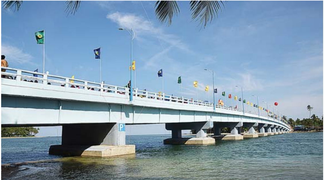
၂၀၁၈ ခုနှစ် အောက်တိုဘာ ၂၀ ရက်က ဖွင့်လှစ်ပေးခဲ့သော ဧရာဝတီတိုင်းဒေသကြီး ပုသိမ်မြို့နယ်ရှိ ရွှေသောင်ယံတံတား(မကျီးချောင်း)ကို တွေ့ရစဉ်။