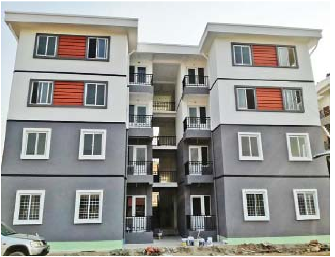
ကရင်ပြည်နယ် ဘားအံမြို့တွင် တည်ဆောက်ပေးထားသည့် ကြာအင်းတောင်အိမ်ရာများကို တွေ့ရစဉ်။

တချို့အပိုင်းတွေမှာ ကွန်ကရစ်လမ်းခင်း တာတွေ၊ တံတားတည်ဆောက်တာတွေကို လက်ရှိဆောင်ရွက်လျက်ရှိပါတယ်။ ပုဏ္ဏားကျွန်း - ရသေ့တောင် - ဘူးသီးတောင်လမ်းမှာ ကွန်ကရစ်လမ်း ရှစ်မိုင်ခင်းခြင်း၊ ငါးသိုင်းချောင်း - ဝှ - သံတွဲလမ်းမှာ World Bank ချေးငွေနဲ့ လမ်းအဆင့်မြှင့်တင်ခြင်းတွေ