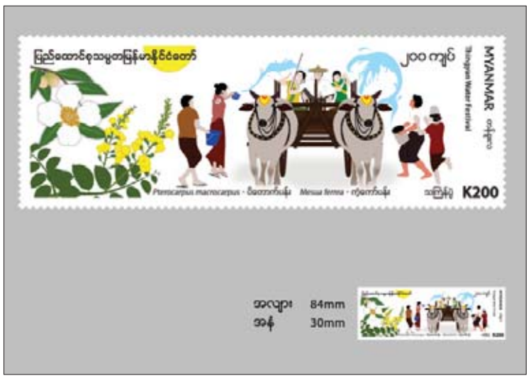
အလျား 84mm အနံ 30mm

လုပ်ငန်းပြည်စာတိုက် အသီးသီး တွင် ရောင်းချပေးသွားမည် ဖြစ်သည်။ အထူးအစီအစဉ် တစ်ရပ် အနေဖြင့် နေပြည်တော် ဗဟို စာတိုက်ကြီး၊ ရန်ကုန်စာတိုက် ကြီးနှင့် မန္တလေးစာတိုက်ကြီးတို့ တွင် ဧပြီ ၅ ရက်၌ ဝယ်ယူသော စာပို့တံဆိပ်ခေါင်းများနှင့် ပထမ နေ့စာအိတ် (firstday cover) ပေါ်တွင် နေ့စွဲအမှတ်အသား တံဆိပ်ရိုက်နှိပ်ပေးမည် ဖြစ် ကြောင်း သိရသည်။ သတင်းစဉ်