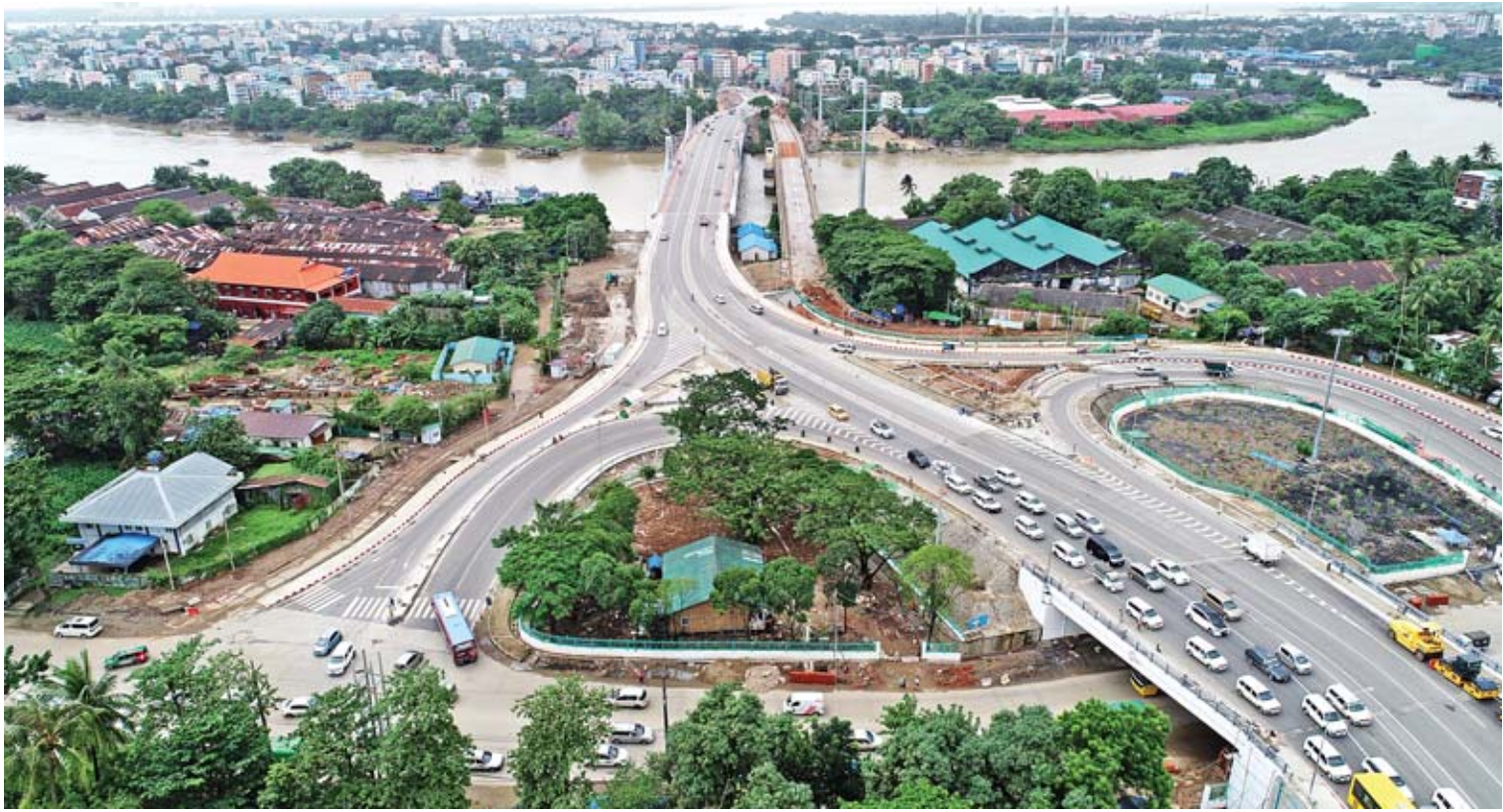
၂၀၁၈ ခုနှစ် ဩဂုတ် ၂၅ ရက်က ဖွင့်လှစ်ခဲ့သော ရန်ကုန်တိုင်းဒေသကြီးရှိ ဒေါ်ပုံတံတားသစ်ကြီးကို တွေ့ရစဉ်။

ဖြေ။ ။ နေပြည်တော်ကောင်စီနယ်မြေမှာ နေပြည်တော် - တောင်ညို - မြို့သစ် - ကံပြား (မကျေး)လမ်း၊ နေပြည်တော် - တောင်ညို - ချောင်းနက် - တောင်တွင်းကြီး လမ်း၊ တပ်ကုန်းကနေ ရန်ကုန် - မန္တလေး အမြန်လမ်းကို ဆက်သွယ်တဲ့လမ်း၊ ဘီလပ် မြေစက်ရုံ (တောင်စဉ်အေး) - နန်လွင်စန်း -