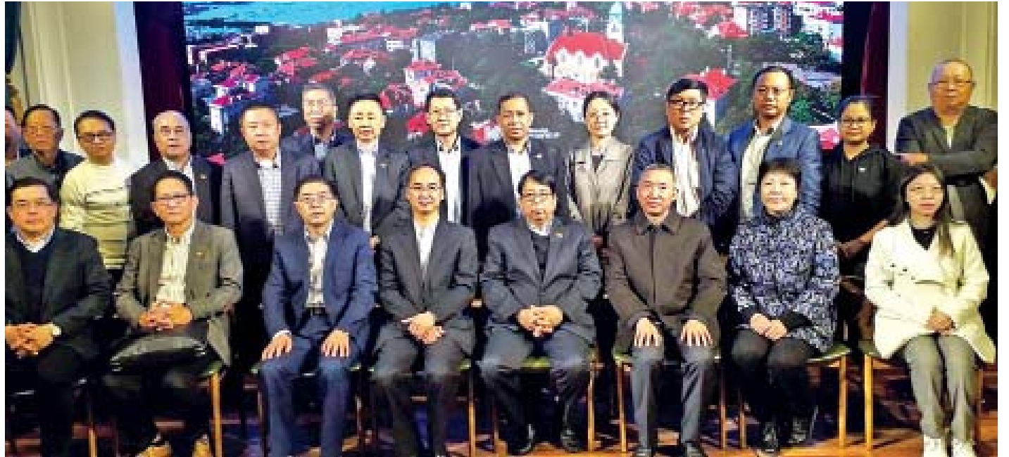
ခရစ်တွင် ဆောက်လုပ်ခဲ့သော သုံးထပ်ရုပ်ရှင်ရုံ အဆောက်အအုံဖြစ်သည်။ ယင်းရုပ်ရှင်ရုံအဆောက်အအုံကို ၂၀၁၃ ခုနှစ်တွင် ရှေးမူပျက်ပြုပြင်မွမ်းမံထိန်းသိမ်းခဲ့ပြီး ပြတိုက်အဖြစ် ခင်းကျင်းပြသထားရှိမှုအပြင် ရုပ်ရှင်ပြခန်းငယ်များပြုလုပ်ပြသခြင်း၊ စားသောက်ဖွယ်ရာ အရောင်းဆိုင် တွဲဖက်ဖွင့်လှစ်ခြင်းများဖြင့် တရုတ်နိုင်ငံ၏ ရှေးအကျဆုံး ရုပ်ရှင်သမိုင်းသက်သေနှင့် ဂုဏ်ယူဖွယ်ရာ ပြယုဂ်တစ်ခုအဖြစ် ထိန်းသိမ်းထားရှိသည်။

ချင်းတောင်မြို့ရှိ ရုပ်ရှင်ပြတိုက်ကို ဂျာမန်ပညာရှင်များက ၁၈၉၉ ခုနှစ်တွင် ပုံစံထုတ်ဒီဇိုင်းရေးဆွဲခဲ့ပြီး ၁၉၀၇