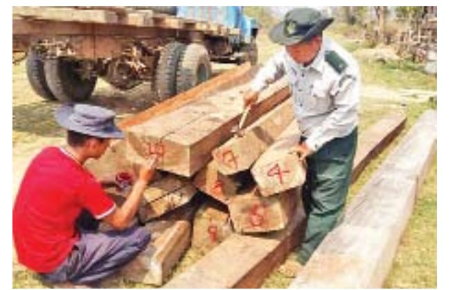
အရေးယူနိုင်ရေး ဆောင်ရွက်လျက်ရှိကြောင်း သစ်တောဦးစီးဌာနမှ သိရသည်။ မောင်လူမော်

နေပြည်တော် ဧပြီ ၁ သစ်တောဦးစီးဌာနသည် တရားမဝင်သစ်နှင့် သစ်တောထွက်ပစ္စည်းများကို နည်းလမ်းမျိုးစုံဖြင့် ရှာဖွေဖော်ထုတ်သိမ်းဆည်းလျက်ရှိရာ မတ် ၂၈ ရက်မှ ၃၀ ရက်အတွင်း သစ်တောဦးစီးဌာနမှ ဝန်ထမ်းများနှင့် သစ်တောလုံခြုံရေးရဲတပ်ဖွဲ့ဝင်တို့ ပါဝင်သည့် ပူးပေါင်းအဖွဲ့သည် ဧရာဝတီတိုင်းဒေသကြီး သာပေါင်းမြို့နယ် ဘိုးတော်ချောင်းအတွင်းမှ တရားမဝင် တောင်သရက်သစ်ခွဲသား ၄၃ ဒသမ ၃၅၇၆ တန်၊ စစ်ကိုင်းတိုင်းဒေသကြီး တမူးမြို့နယ်အတွင်းမှ တရားမဝင် အင်ဒိုသားဆိုင်ခုံ ၅ ဒသမ ၃၈၂၀ တန်နှင့် ကချင်ပြည်နယ် မံစီမြို့နယ်အတွင်းမှ တရားမဝင် ကျွန်းလုံးပတ် သုံးပေအောက်ကျွန်းသစ် ၁၀ ဒသမ ၈၃၆၀ တန်တို့ကို ပိုင်ရှင်မဲ့သိမ်းဆည်းရမိခဲ့ကြောင်း သိရသည်။