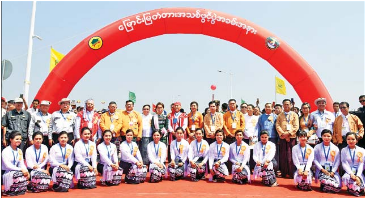
နိုင်ငံတော်၏အတိုင်ပင်ခံပုဂ္ဂိုလ် ဒေါ်အောင်ဆန်းစုကြည်နှင့်အဖွဲ့ မြောင်းမြတံတားသစ်ဖွင့်ပွဲအခမ်းအနားသို့ တက်ရောက်လာကြသူများနှင့်အတူ စုပေါင်းမှတ်တမ်းတင် ဓာတ်ပုံရိုက်စဉ်။

“ကျွန်မတို့ဟာ တည်ဆောက်ရုံနဲ့မလုံလောက်ပါဘူး။ ဆက်ပြီးတော့ ထိန်းသိမ်းဖို့ အင်မတန်အရေးကြီးပါတယ်။ ပြည်သူပြည်သားများ အားလုံးဟာ တစ်ဦးချင်း တစ်ဦးချင်း ကနေ ကိုယ့်ရဲ့တာဝန်လို့ နှလုံးထဲမှာထားပြီး ကူညီပေးစေ ချင်ပါတယ်။ အခုလို လမ်း၊ တံတားတွေဟာ နိုင်ငံတစ်ခု ဖွံ့ဖြိုးတိုးတက်ဖို့ အခြေခံအကျဆုံး အချက်တစ်ခုဖြစ်ပါတယ်။ မြန်မာနိုင်ငံရဲ့ ရေရှည်တည်တံ့ခိုင်မြဲပြီး ဟန်ချက်ညီတဲ့ ဖွံ့ဖြိုးတိုးတက်ရေးစီမံကိန်း(၂၀၁၈-၂၀၃၀)မှာ ချမှတ်ထားတဲ့ သာယာဝပြောမှုနဲ့ ပူးပေါင်း ဆောင်ရွက်မှု