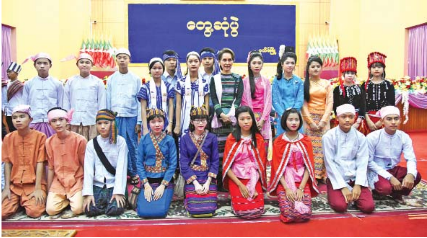
နိုင်ငံတော်၏အတိုင်ပင်ခံပုဂ္ဂိုလ် ဒေါ်အောင်ဆန်းစုကြည် ပုသိမ်မြို့ ဒေသခံပြည်သူများနှင့် တွေ့ဆုံပွဲသို့ တက်ရောက်လာသည့် တိုင်းရင်းသား တိုင်းရင်းသူလေးများနှင့် စုပေါင်းမှတ်တမ်းတင်ဓာတ်ပုံရိုက်စဉ်။

ပြည်သူလူထု၏ ခံစားမှု၊ ပြည်သူလူထု၏ စိုးရိမ်ကြောင့်ကြမှု၊ ပြည်သူလူထု၏ မျှော်လင့်ချက်၊ ပြည်သူများ