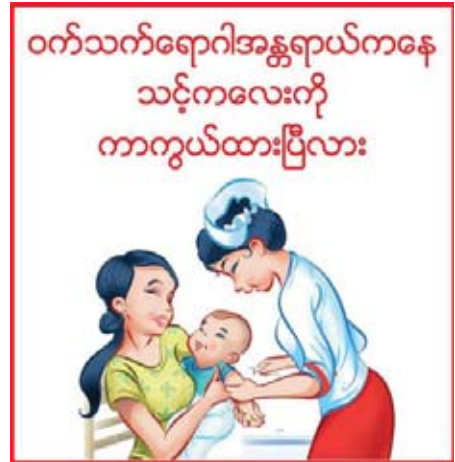
အခြေအနေကောင်းမွန်သွားမည် ဖြစ်ပေသည်။

ဝမ်းပျက်နိုင်သည်။ ကျန်းမာရေးဆေးခန်း၊ ဆေးရုံ၊ ဆရာဝန်၊ ဆရာမများနှင့် ပြု၍ ဆေးကုသလျှင် အနီဖုများထွက်ပြီး လေး၊ ငါးရက်အကြာတွင်