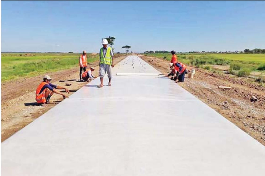
ကမ္ဘာ့ဘဏ်အကူအညီဖြင့် ဆောင်ရွက်သော ကွန်ကရစ်လမ်း ခင်းထားသည့်လမ်းပိုင်းတစ်နေရာကို တွေ့ရစဉ်။

ဖြေ။ ။ ၂၀၃၀ ပြည့်နှစ်မှာ မြန်မာနိုင်ငံ အတွင်းက ကျေးလက်လမ်းစုစုပေါင်း မိုင် ၅၅၅၀၀ ကျော်အနက် Class A အဆင့်ရှိ လမ်းမိုင် ၂၅၆၀၀ ကျော်ကို ၁၂ ပေအကျယ် ကတ္တရာလမ်း သို့မဟုတ် ကွန်ကရစ်လမ်း ဆောင်ရွက်သွားပါမယ်။ Class B အဆင့်ရှိ လမ်းမိုင် ၁၇၃၀၀ ကျော်ကို ၁၂ ပေအကျယ် ကတ္တရာလမ်း/ ကွန်ကရစ်လမ်း/ ကျောက် လမ်းတွေအဖြစ် ဆောင်ရွက်သွားဖို့ ဖြစ်ပါတယ်။ အလားတူပဲ Class C အဆင့်ရှိ