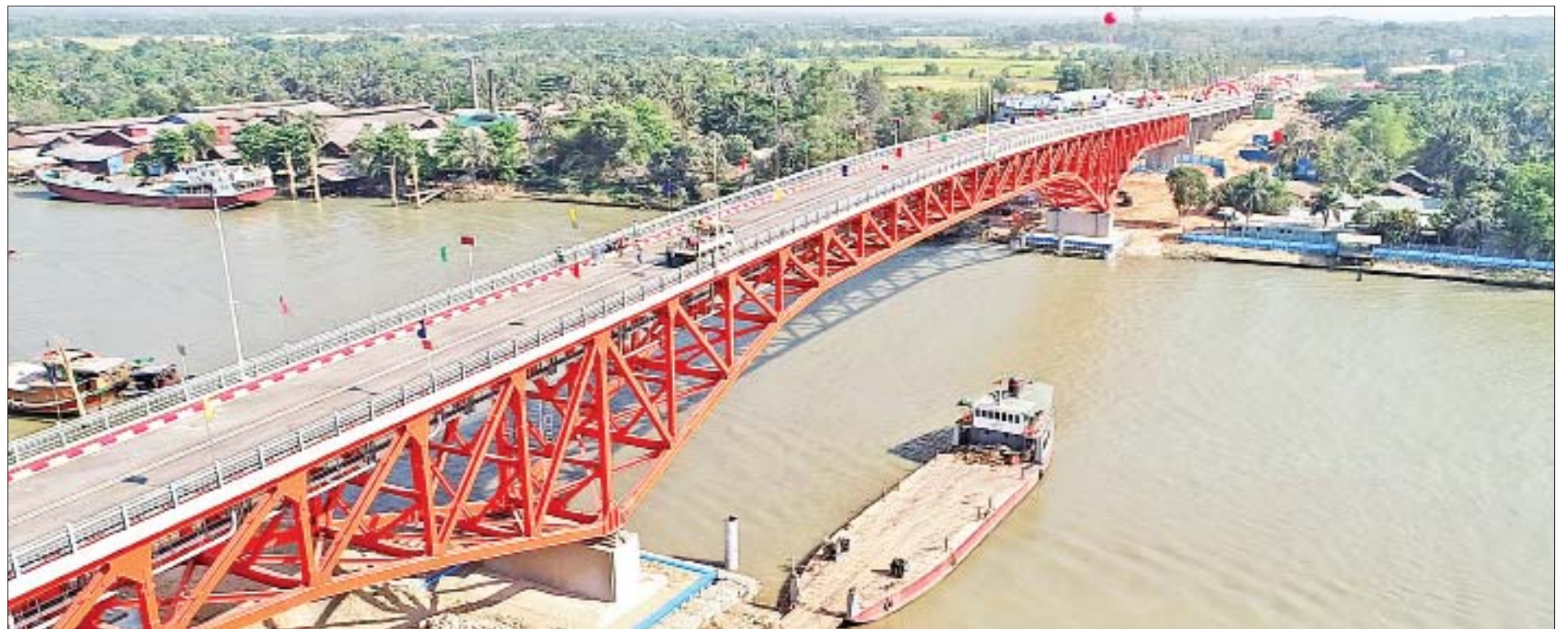
ရွေးမြစ်ကိုဖြတ်၍ တည်ဆောက်ထားသော သံကူကွန်ကရစ်အမျိုးအစား မြောင်းမြတံတားသစ်အား ဧပြီ ၁ ရက်က ဖွင့်လှစ်ပြီး တွေ့ရစဉ်။