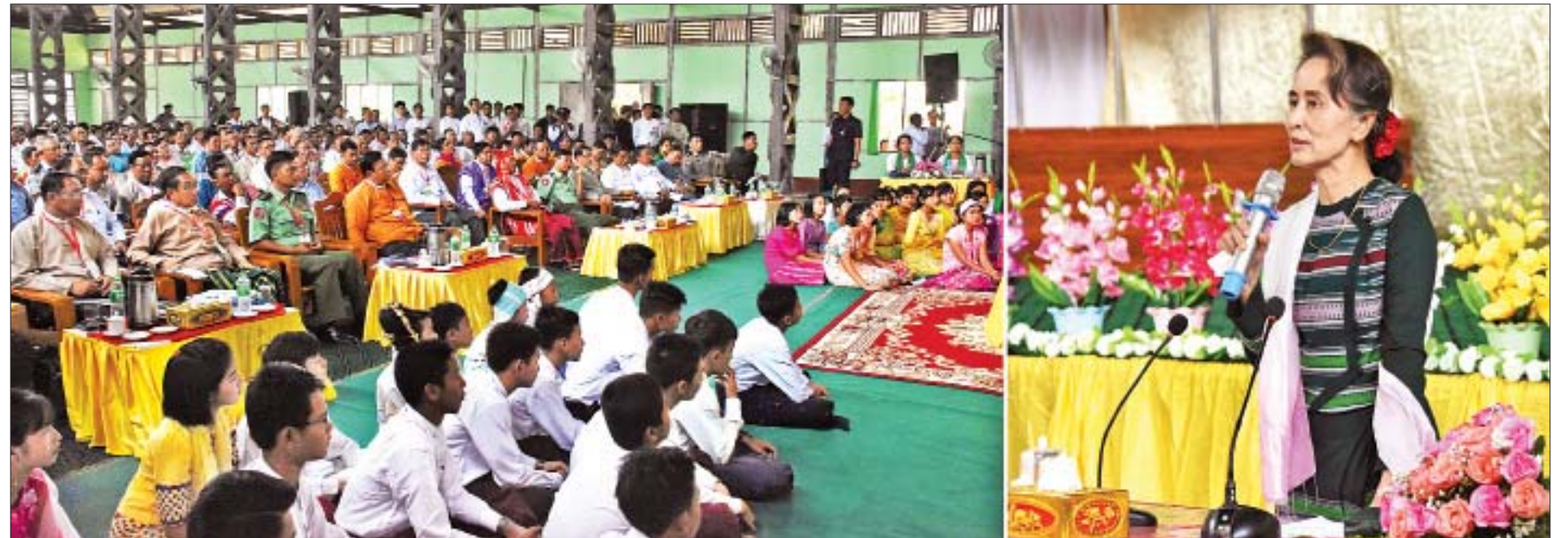
နိုင်ငံတော်၏အတိုင်ပင်ခံပုဂ္ဂိုလ် ဒေါ်အောင်ဆန်းစုကြည် ကျောင်းကုန်းမြို့ မြို့နယ်အားကစားခန်းမ၌ ဒေသခံပြည်သူများနှင့် တွေ့ဆုံအခမ်းအနားတွင် အမှာစကားပြောကြားစဉ်။

မိမိတို့နိုင်ငံ၏ ဒီမိုကရေစီသည် အပြည့်အဝမဟုတ်သေး သော်လည်း ယင်းလမ်းကို မိမိတို့ လျှောက်လာခဲ့ပြီးဖြစ် ကြောင်း၊ လျှောက်လာသည့်အချိန်တွင် မိမိတို့အားလုံးတွင် တာဝန်ရှိလာပါကြောင်း၊ ပြည်သူလူထုမှ ရွေးချယ်တင်မြှောက် ထားသည့် မိမိတို့အစိုးရတွင် အထူးတာဝန်ရှိပါကြောင်း၊ ပြည်သူလူထုက မိမိတို့ကို တာဝန်ပေးခဲ့သည်ဆိုသည်မှာ မျှော်လင့်ချက်၊ ယုံကြည်ချက်နှင့် တာဝန်ပေးခြင်းဖြစ်ပါ ကြောင်း၊ မျှော်လင့်ချက်နှင့် ယုံကြည်ချက်ဆိုသည်မှာ မိမိတို့ ချိုးဖောက်၍ မဖြစ်ပါကြောင်း။