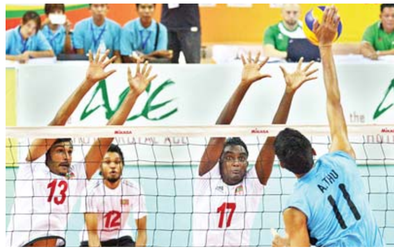
အိမ်ရှင်အဖြစ် လက်ခံကျင်းပမည့် ၂၀၁၅ ပြိုင်ပွဲတွင် မြန်မာအသင်း ယှဉ်ပြိုင်နေစဉ်။