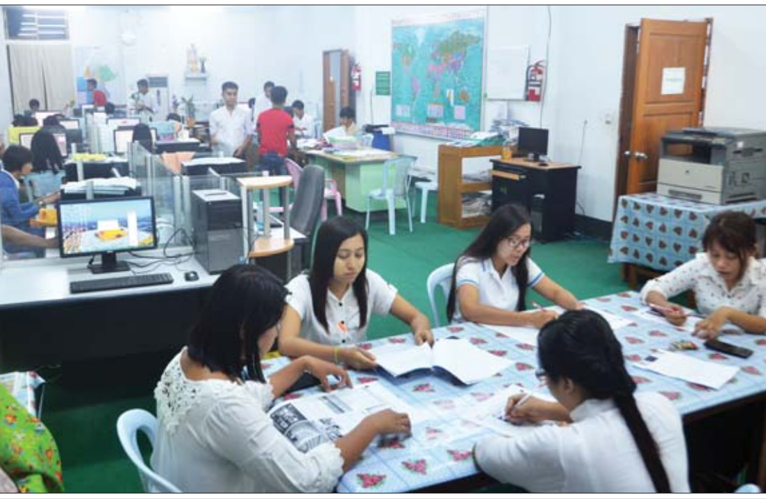
ကြေးမုံသတင်းစာတိုက်၏ သတင်းခန်းအတွင်း သတင်းစာလုပ်ငန်းဆောင်ရွက်နေစဉ်။

ခေတ်မီစက်ကို ပြောင်းလဲအသုံးပြု ၂၀၀၆ ခုနှစ်က တပ်ဆင်ဝယ်ယူထားခဲ့ သည့် ရောင်စုံ ၁၆ မျက်နှာပုံနှိပ်နိုင်သော စက်နေရာ၌ ၂၀၁၆ ခုနှစ် မေလ ၈ ရက်တွင် ၃၂ မျက်နှာ တစ်ပြိုင်တည်း ရိုက်နှိပ်နိုင်သည့် အလိုအလျောက် စက္ကူလုံးလဲလှယ်စနစ်ပါရှိ သော Goss Community 4 Hi Tower 4 Unit Web offset (with splicer) ပုံနှိပ်စက်အား ပြောင်းလဲအသုံးပြုနိုင်ခဲ့သည့် အတွက် အရည်အသွေးကောင်းမွန်သော