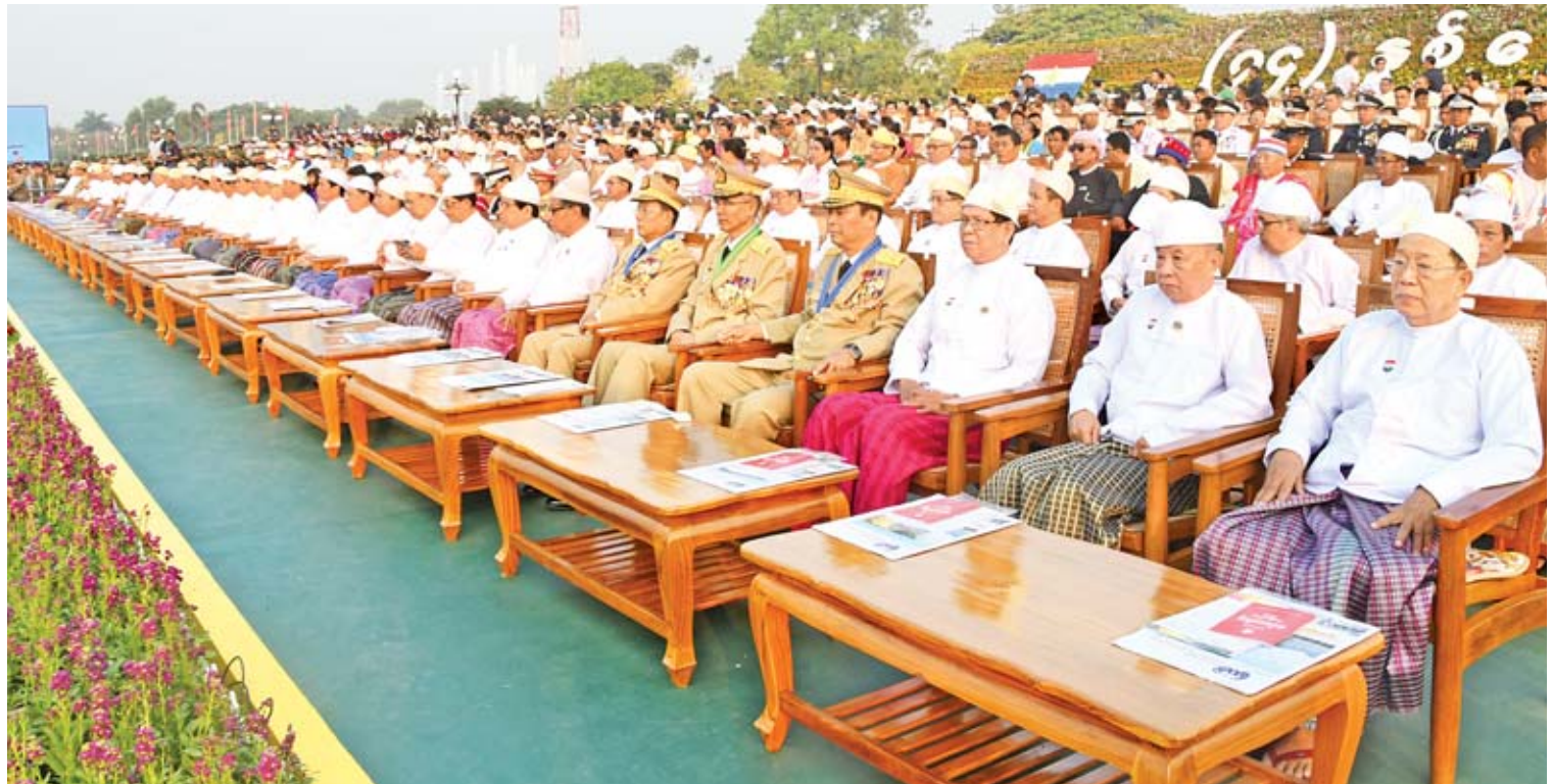
(၇၄)နှစ်မြောက် တပ်မတော်နေ့အခမ်းအနားသို့ တက်ရောက်လာသည့် နိုင်ငံတော်ဖွဲ့စည်းပုံအခြေခံဥပဒေဆိုင်ရာခုံရုံးဥက္ကဋ္ဌ ဦးမျိုးညွန့်၊ ပြည်သူ့လွှတ်တော် ဒုတိယဥက္ကဋ္ဌ ဦးထွန်းထွန်းဟိန်၊ အမျိုးသားလွှတ်တော် ဒုတိယဥက္ကဋ္ဌ ဦးအေးသာအောင်၊ တပ်မတော်အရာရှိကြီးများနှင့် ဖိတ်ကြားထားသူများကို တွေ့ရစဉ်။

ယင်းနောက် ဒုတိယတပ်မတော် ကာကွယ်ရေးဦးစီးချုပ်သည် အခမ်းအနားသို့ တက်ရောက်လာကြသူများအား နှုတ်ဆက်၍ စစ်ရေးပြကွင်းကြီးမှ ပြန်လည်ထွက်ခွာပြီး ၂၀၁၉ ခုနှစ် (၇၄)နှစ်မြောက် တပ်မတော်နေ့ စစ်ရေးပြအခမ်းအနားကို ရုပ်သိမ်းလိုက် သည်။ သတင်းစဉ်