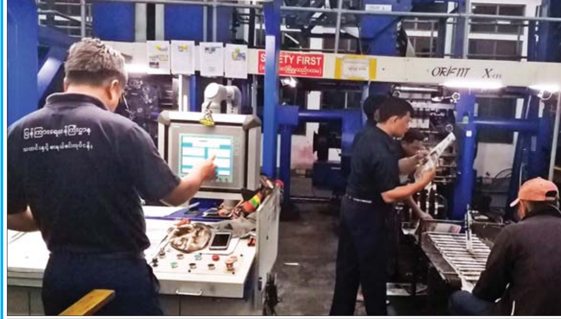
နေ့စဉ်ထုတ် သတင်းစာများ ရိုက်နှိပ်ထုတ်ဝေရာတွင် မင်ကျမင်ကောင်းမွန်ရေး ပုံနှိပ်စက်အဖွဲ့သားများ ချိန်ညှိဆောင်ရွက်နေစဉ်။

တစ်ထောင့်တစ်နေရာမှ နိုင်ငံပိုင် သတင်းစာလုပ်ငန်းသည် အမြတ်အစွန်းကို အဓိကထား ဦးတည် ဆောင်ရွက်ခြင်း မရှိသော၊ စီးပွားရေး ဆန်ဆန် လုပ်ဆောင်နေခြင်းမဟုတ်သော နိုင်ငံပိုင်စီးပွားရေး အဖွဲ့အစည်းအဖြစ် ရပ်တည်နေသည့်အပြင် ပြည်သူနှင့် အစိုးရ အကြား ပေါင်းကူးပေးနေသည့် ပြည်သူ့ အကျိုးပြု သတင်းစာများသာ ဖြစ်ပါသည်။ ပြည်သူ့အပေါ် ဆန့်ကျင်ခြင်း၊ ပြည်သူ့ အတွက် နှစ်နာအောင်ပြုလုပ်ခြင်းနှင့် ပြည်သူ၏ ကိုယ်စိတ်နှလုံးကို ညစ်ညူး အောင် ပြုလုပ်ခြင်းများကို ရှောင်ရှားပြီး အများပြည်သူ ဝန်ဆောင်မှုမီဒီယာ၏ လုပ်နည်းလုပ်ဟန်များနှင့်အညီ သတင်းစာ ကျင့်ဝတ်နှင့် တာဝန်ကို ပြဋ္ဌာန်းလိုက်နာ ဆောင်ရွက်လျက်ရှိနေပါသည်။ ထို့ပြင် ပြည်သူတို့၏ သတင်းသိရှိပိုင်ခွင့်အပေါ် တစ်ထောင့်တစ်နေရာမှ တတ်စွမ်းသမျှ ကြိုးပမ်းဖြည့်ဆည်းဆောင်ရွက်ပေးမှုဖြင့် အများပြည်သူအတွက် ဝန်ဆောင်မှု ပေးလျက်ရှိနေမည်သာဖြစ်ကြောင်း။ ။