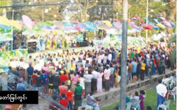
၁၃၇၉ ခုနှစ် ဖျာပုံသင်္ကြန်ပွဲတော်မြင်ကွင်း

ဖျာပုံမြို့၌ မဟာသင်္ကြန်ပွဲတော် ဖွင့်ပွဲအခမ်း အနားကို ဖျာပုံမြို့ ဒုတိယလမ်းရှိ သီရိအဏ္ဍဝါ မြို့နယ်ခန်းမရှေ့ ဗဟိုမဏ္ဍပ်၌ ဧပြီ ၁၃ ရက် ညနေ ၄ နာရီမှာ စတင်၍ ဖွင့်ပွဲအခမ်းအနားကို စည်ကား သိုက်မြိုက်စွာ ကျင်းပမည်ဖြစ်ပြီး သင်္ကြန်ရက်များ တွင် ဖျာပုံမြို့ဒုတိယလမ်းမပေါ်(မာလာမြိုင်လမ်း နှင့် သီရိမြိုင်လမ်းကြား) ဗဟိုမဏ္ဍပ်နှင့် Dr.G မဏ္ဍပ် ရှိရာနေရာများသို့ ယာဉ်အသွားအလာပိတ် ထားကာ လူတန်းစားအလွှာစုံ လမ်းလျှောက်၍