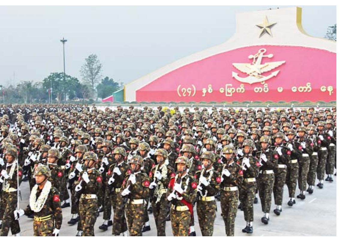
(၇၄)နှစ်မြောက် တပ်မတော်နေ့စစ်ရေးပြအခမ်းအနားသို့ စစ်ကြောင်းကြီးများ ချီတက်လာစဉ်။

တပ်လှုပ်ရှားမှုရပ်ဆိုင်းထားသည့် ကာလအတွင်း စစ်ဆင်ရေးနယ်မြေအလိုက် တိုင်းရင်းသား လက်နက်ကိုင်အဖွဲ့များအနေဖြင့် ပစ်ခတ်တိုက်ခိုက်မှုရပ်စဲရေး အပါအဝင် ငြိမ်းချမ်းရေးဆိုင်ရာများကို ညှိနှိုင်းဆွေးနွေးသွားရန် လမ်းဖွင့်ပေးခြင်း ဖြစ်ပါကြောင်း၊ ပစ်ခတ်တိုက်ခိုက်မှု ရပ်စဲထားသည့်ကာလအတွင်းတွင် ငြိမ်းချမ်းရေးလုပ်ငန်းစဉ်ကို ထိခိုက်စေသည့်လုပ်ရပ်များ ဆက်လက်ဆောင်ရွက်ခြင်းမပြုဘဲ အမျိုးသားပြန်လည်သင့်မြတ်ရေးနှင့် ငြိမ်းချမ်းရေးဗဟိုဌာနနှင့် ဖြစ်စေ၊ တပ်မတော်၏ ညှိနှိုင်းဆွေးနွေးရေးအဖွဲ့နှင့်ဖြစ်စေ ငြိမ်းချမ်းရေးအတွက် ညှိနှိုင်းဆွေးနွေးခြင်းများ အမြန်ဆုံးပြုလုပ်သွားကြရန်