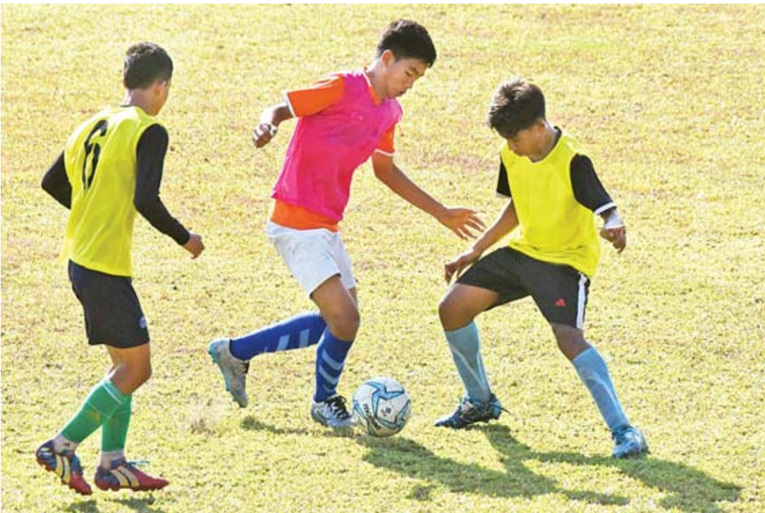
မတ်လဒုတိယပတ်က မြန်မာ ယူ-၁၅ အသင်း ဖွဲ့စည်းရန် လူရွေးပွဲကျင်းပစဉ်။