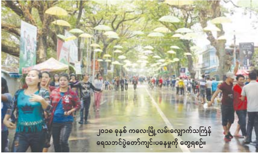
၂၀၁၈ ခုနှစ် ကလေးမြို့လမ်းလျှောက်သင်္ကြန် ရေသဘင်ပွဲတော်ကျင်းပနေမှုကို တွေ့ရစဉ်။

စည်ပင်သာယာရေးရုံးရှေ့ပြုလုပ်ရန်လျာထားပြီး ကလေးမြို့ ဝိုက်ချုပ်လမ်းမပေါ်ရှိ လမ်းဆုံဦးပွင့်မှ စည်ပင်သာယာရေးရုံးအနီး ရိုးမာဏ်ရှေ့ လမ်းအရှည်ပေပေါင်း ၁၅၀၀ အထိ လူတန်းစား အလွှာစုံ လမ်းလျှောက်၍ ရေကစားနိုင်ရန် တစ်မူ ထူးခြားစွာ ပုသိမ်ထီးများနှင့် သင်္ကြန်ထီးများ ချိတ်ဆွဲ အလှဆင်ကာ လမ်းလျှောက်သင်္ကြန်ရေသဘင်ပွဲ ကို ကျင်းပမည်ဖြစ်သည့်အပြင် ဌာနဆိုင်ရာများ၊ စေတနာရှင်ပြည်သူများက စတုဒိသာကျွေးမွေးခြင်း များ ပြုလုပ်သွားမည်ဖြစ်သည်။