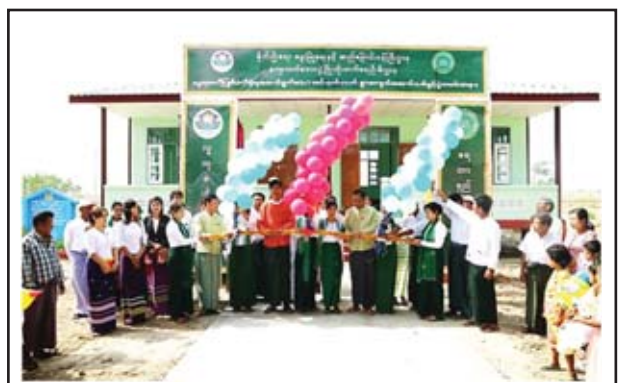
ပဲခူးတိုင်းဒေသကြီး ရေတာရှည်မြို့နယ် အင်းပက်လက်ကျေးရွာ၌ မြို့နယ် ကျေးလက်ဒေသဖွံ့ဖြိုးတိုးတက်ရေးဦးစီးဌာနမှ လူထုပဟိုပြုစီမံကိန်း ခွင့်ပြုရန်ပုံငွေကျပ် ၃၀၉၀၀၀၀ ဖြင့် ကျောင်းဆောင်သစ်၊ နှစ်ခန်းတွဲ အိမ်သာ၊ ကျောင်းအဝင်ကွန်ကရစ်လမ်းတို့အား ပြန်လည်တည်ဆောက်ပေး ခဲ့ရာ မတ် ၂၇ ရက် နံနက်ပိုင်းတွင် ဖွင့်ပွဲကျင်းပခဲ့ကြောင်း သိရသည်။ ကိုလွင်(ဆွာ)

ယင်းအပြင် ပြည်တွင်းရှိ ပြည်သူများ လေလံရောင်းချခွင့်အတွက် လက်ရှိတွင် မော်တော်ယာဉ်လေလံပွဲကို သယ်ယူကုန်သွယ်ရေး၊ မြို့နယ်ရှိ အမျိုးသား အားကစားပြိုင်ပွဲရုံ (၁) သုဇာတိ မတ် ၂၄ ရက်မှစတင်၍ ခင်းကျင်းပြသ လျက်ရှိကြောင်း သိရသည်။ ပွင့်သစ္စာ