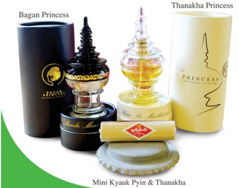
Mini Kyauk Pyin & Thanakha