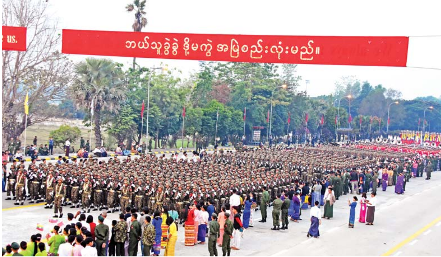
(၇၄)နှစ်မြောက် တပ်မတော်နေ့အခမ်းအနားတွင် စစ်ကြောင်းကြီးများချီတက်ရာ လမ်းတစ်လျှောက်၌ ကာကွယ်ရေးဦးစီးချုပ်ရုံး(ကြည်း)မှ အရာရှိ၊ စစ်သည်မိသားစုများ၊ နေပြည်တော်တိုင်းစစ်ဌာနချုပ်နှင့် တပ်နယ်အသီးသီးတို့မှ အရာရှိ၊ စစ်သည်မိသားစုများ၊ ဒေသခံမိဘပြည်သူများက စစ်ကြောင်းကြီးများမှ တပ်မတော်သားများနှင့် မြန်မာနိုင်ငံရဲတပ်ဖွဲ့ဝင် များကို ဂုဏ်ပြုပန်းကုံးများစွပ်၍ ကြိုဆိုကြစဉ်။

အဆုံးအဖြတ်ပေးလျက်ရှိ မျက်မှောက်ကာလ စစ်ပွဲများတွင် စစ်နည်းဗျူဟာကျွမ်းကျင်မှု၊ လေကြောင်း အက်သာမှုနှင့် အီလက်ထရောနစ် နည်းပညာ သာယာမှု၊ လက်နက်ဓါးယမ်းများ ခေတ်မီ ကောင်းမွန်မှု၊ ထိုရောက်တီကျမှုတို့သည် စစ်ပွဲ၏ အနိုင်၊ အရှုံးကို အဓိက အဆုံးအဖြတ် ပေးလျက်ရှိပါကြောင်း၊ နည်းပညာတိုးတက် လာမှုနှင့်အတူ ပြောင်းလဲကျင့်သုံးလာသည့် စစ်နည်းဗျူဟာများနှင့် စစ်လက်နက်ပစ္စည်း များကို ခေတ်နှင့်အညီ ကျွမ်းကျင်စွာ အသုံး ချနိုင်ရန်အတွက် ကြိုးစားဆောင်ရွက်သွားကြ ရမည်ဖြစ်ပါကြောင်း၊ ထိုသို့ ကျွမ်းကျင်စွာ အသုံးချသွားနိုင်ရန်အတွက်လည်း ပညာရည် မြင့်မားရန် စာမျက်နှာ ၄ သို့ >>>