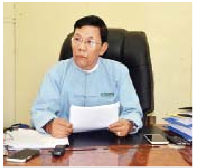
ရန်ကုန်မြို့တော် စည်ပင်ရွေးကောက်ပွဲကော်မရှင်ဥက္ကဋ္ဌ ဦးအောင်ခိုင်

ဖြေ။ ။ နည်းဥပဒေမှာသတ်မှတ်ထားတဲ့အတိုင်း မဲဆန္ဒနယ် ခြောက်ခုမှာ မြို့တော် ကော်မတီဝင် ဝင်ပြိုင်မယ့် ပုဂ္ဂိုလ်တစ်ဦးကို သိန်း ၂၀၀ သတ်မှတ်ထားတယ်။ သိန်း ၂၀၀ ထက်ကျော်ပြီး မဲဆွယ်စည်းရုံးတဲ့နေရာမှာ မသုံးရဘူး။ မြို့နယ်ထဲမှာပဲ မဲဆွယ်စည်းရုံးမယ့် ပုဂ္ဂိုလ်များကတော့ သိန်းတစ်ရာ ထိ ခွင့်ပြုထားတယ်။ မဲဆွယ်ကုန်ကျစရိတ်တွေကို ရွေးကောက်ပွဲအပြီး တစ်လ အတွင်း ကော်မရှင်ကို လာတင်ရမယ်။ ကော်မရှင်မှာ စာရင်းစစ်မှားတွေ ဖွဲ့စည်း ထားတယ်။ တကယ်တရားဝင် ဟုတ်၊ မဟုတ်ဆိုတာ မြို့နယ်မှာလည်း မြို့နယ် စာရင်းစစ်မှားတွေရှိတယ်။ တိုင်းဒေသကြီးမှာလည်း တိုင်းဒေသကြီးစာရင်းစစ် တွေရှိတယ်။ ခွင့်ပြုထားတာထက်ကျော်သွားရင် မှတ်တမ်းလုပ်ထားမယ်။ ခွင့်ပြုထားတာထက်ကျော်သွားတယ်ဆိုပြီး တစ်ယောက်ယောက်က တိုင်လာရင် သူ့ကိုပြန်စစ်မယ်။ ဒီစာရင်းထဲမှာ မဖော်ပြထားတဲ့ အသုံးစရိတ်တွေ ပါကောင်း ပါလာနိုင်မယ်။ သေသေချာချာပြန်စစ်ပြီး ခုံဖွဲ့မယ်။ ပြစ်မှုထင်ရှားတယ်ဆိုရင် ခုံအဖွဲ့ရဲ့အဆုံးအဖြတ်၊ ကော်မရှင်ရဲ့အဆုံးအဖြတ်နဲ့ ကိုယ်စားလှယ်အဖြစ်ကနေ ပြန်ရုပ်သိမ်းပိုင်ခွင့်ရှိတယ်။ ကိုယ်စားလှောင်း ၂၇၂ ဦးဟာ မဲဆွယ်ကုန်ကျစရိတ်