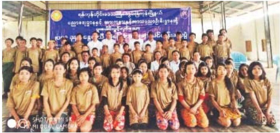
ရန်ကုန်တိုင်းဒေသကြီး ကွမ်းခြံကုန်းမြို့နယ်ပညာရေးဌာနနှင့် အားကစားနှင့်ကာယပညာဦးစီးဌာနတို့ ပူးပေါင်းဖွင့်လှစ်ခဲ့သည့် ၂၀၁၉ ခုနှစ် နွေရာသီအခြေခံအားကစားသင်တန်းဆင်းပွဲကို အောင်ဆန်းသူရိယလှသောင်းအားကစားခန်းမ၌ မတ် ၂၂ ရက်က ပြုလုပ်ရာ ဘောလုံး၊ ဘော်လီဘော၊ ပိုက်ကျော်ခြင်း၊ စားပွဲတင်တန်းနစ်၊ Physical Fitness၊ Dance၊ ရိုးရာလက်စွဲ၊ မြန်မာ့သိုင်း၊ မြန်မာ့ဝိုင်းခြင်း သင်တန်းသား သင်တန်းသူများကို တွေ့ရစဉ်။