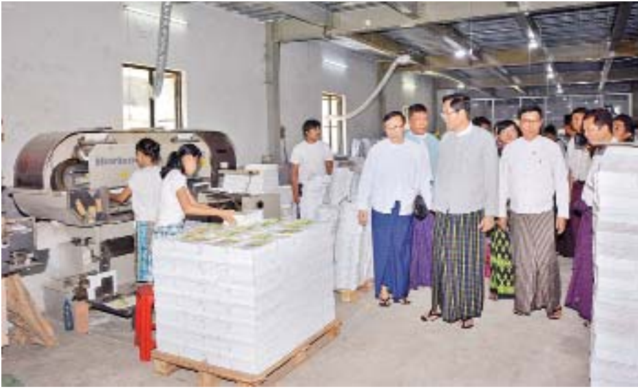
လိုကြောင်း ပြောကြားသည်။

တွေ့ဆုံရာတွင် ဒုတိယဝန်ကြီး ဦးအောင်လှထွန်းက တစ်နိုင်ငံလုံးအတွက် ၂၀၁၉-၂၀၂၀ ပညာသင်နှစ် အခြေခံပညာကျောင်းသုံးစာအုပ်များ အချိန်မီ ပုံနှိပ် ထုတ်လုပ်ပြီးစီးနိုင်ရေးအတွက် ပေါင်းစပ်ညှိနှိုင်းဆွေးနွေးပေးရန် တွေ့ဆုံခြင်းဖြစ်ကြောင်း၊ ပြီးခဲ့သည့်အပတ်က မန္တလေးမြို့ရှိ ပုံနှိပ်စက်ရုံများကို သွားရောက်စစ်ဆေးရာ လုပ်ငန်း အတော်အသင့် ပြီးစီးနေသည်ကို တွေ့ရကြောင်း၊ ကျောင်းဖွင့်ချိန်အမီ အရည်အသွေးပြည့်မီသည့် ကျောင်းသုံးစာအုပ်များ ကျောင်းသားများ လက်ဝယ် ရောက်ရှိရန် အရေးကြီးပါကြောင်း၊ ယနေ့တွင် ရန်ကုန် မြို့ရှိ နိုင်ငံပိုင် ပုံနှိပ်စက်ရုံများနှင့် ပုဂ္ဂလိကပုံနှိပ်တိုက်များ၏ တိုးတက်မှု၊ ဆောင်ရွက်ပြီးစီးမှု အခြေအနေများကို သိရှိ