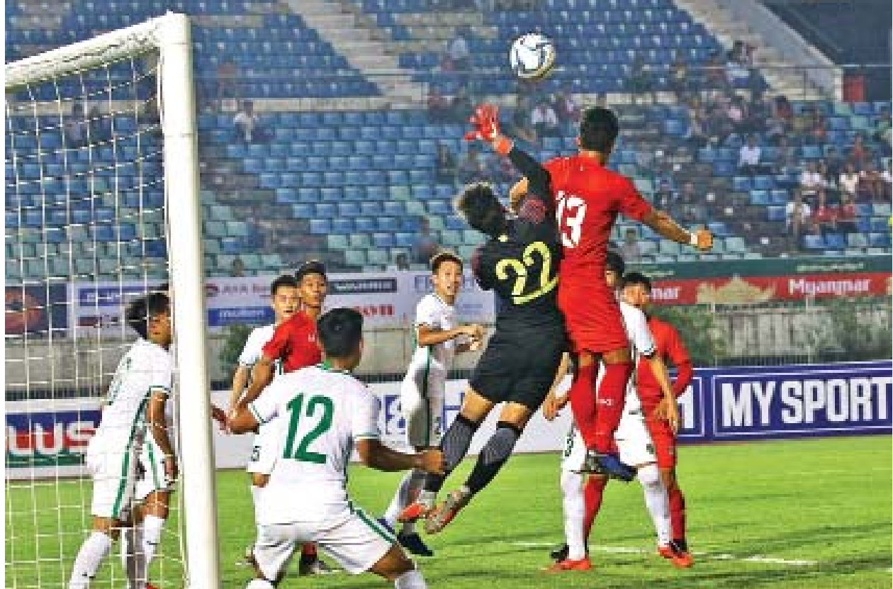
မြန်မာအသင်းနှင့် မကာအိုအသင်းတို့ ယှဉ်ပြိုင်ကစားနေစဉ်။