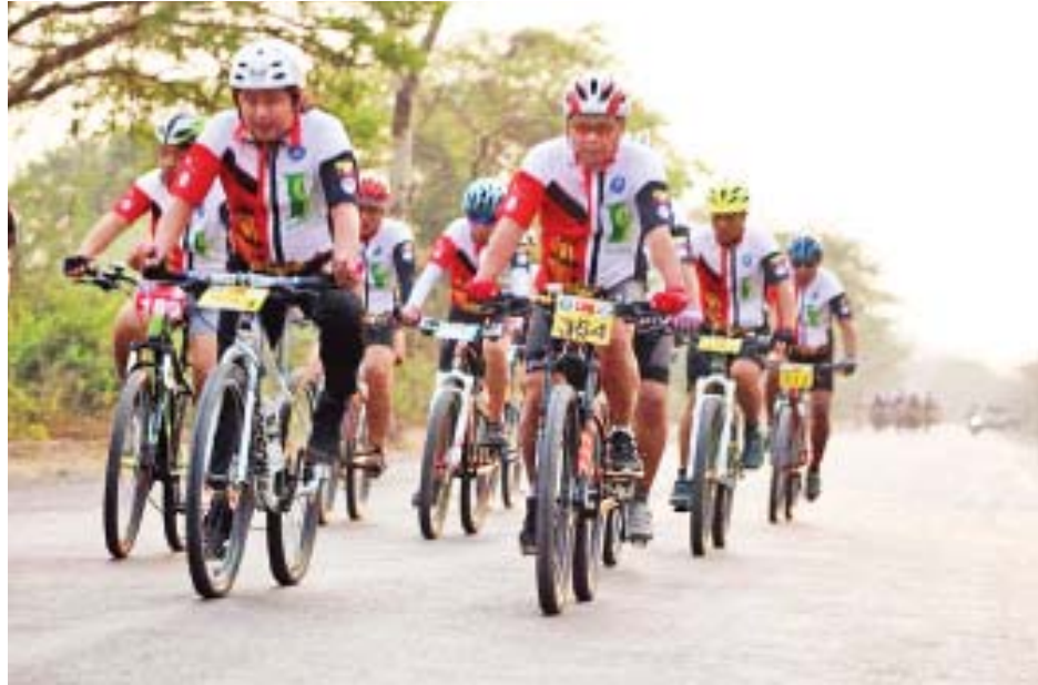
က အမှာစကားပြောကြား၍ သက်တမ်းအလိုက် စက်ဘီးစီးပြိုင်ပွဲကို အချက်ပြသေနတ်ပစ်ဖောက်ကာ တာလွတ်ပေးလိုက်သည်နှင့် တစ်ပြိုင်နက် ပြိုင်ပွဲဝင်စက်ဘီးစီးသမား

စက်ဘီးစီးပြိုင်ပွဲသို့ မန္တလေးတိုင်းဒေသကြီးဝန်ကြီးချုပ် ဒေါက်တာဇော်မြင့်မောင်၊ တိုင်းဒေသကြီးလွှတ်တော် ဒုတိယဥက္ကဋ္ဌ ဒေါက်တာခင်မောင်ဌေးနှင့် အစိုးရအဖွဲ့ဝင် ဝန်ကြီးများ၊ လွှတ်တော်ကိုယ်စားလှယ်များ၊ တိုင်းဒေသကြီးအားကစားနှင့်ကာယပညာဦးစီးဌာန ညွှန်ကြားရေးမှူး ဦးဝေဇင်နှင့် ဌာနဆိုင်ရာများ၊ မြန်မာနိုင်ငံနှင့် တံတားဦးမြို့နယ် စက်ဘီးအဖွဲ့ချုပ်မှ တာဝန်ရှိသူများ၊ ဖိတ်ကြားထားသူများ၊ ပြိုင်ပွဲပံ့ပိုးအလှူရှင်များ၊ စက်ဘီးအားကစားဝါသနာရှင်ပြည်သူများ၊ စက်ဘီးခိုင်လူကြီးများ တက်ရောက်ကြပြီး တိုင်းဒေသကြီးဝန်ကြီးချုပ် ဒေါက်တာဇော်မြင့်မောင်