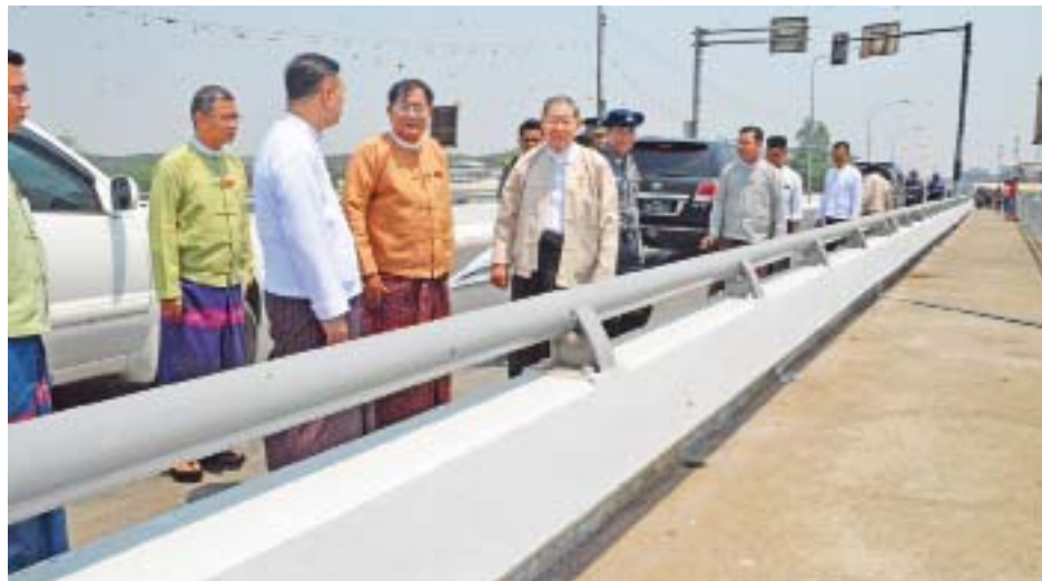
များအားလည်းကောင်း။ လူဝင်မှုကြီးကြပ်ရေးနှင့် ပြည်သူ့အင်အား ဦးစီးဌာန၊ မွေးမြူရေးနှင့် ကုသရေး ဦးစီးဌာန၊ ငါးလုပ်ငန်းဦးစီးဌာန၊ စိုက်ပျိုးရေးဦးစီးဌာန၊ အစားအသောက်နှင့် ဆေးဝါး ကွပ်ကဲရေးဦးစီးဌာန၊ ကုသရေးဦးစီးဌာန၊ မြန်မာနိုင်ငံ ရဲတပ်ဖွဲ့တို့မှ တာဝန်ရှိသူများက ၎င်းတို့ဆောင်ရွက်နေသည့်

မော်လမြိုင် မတ် ၂၄ စီမံကိန်းနှင့် ဘဏ္ဍာရေးဝန်ကြီးဌာန ပြည်ထောင်စုဝန်ကြီး ဦးစိုးဝင်းသည် ယနေ့နံနက်ပိုင်းတွင် ကရင်ပြည်နယ် မြဝတီ မြို့ မြန်မာ-ထိုင်းချစ်ကြည်ရေးတံတား အမှတ်(၂) နယ်စပ် စစ်ဆေးရေးစခန်း (Border Control Facilities-BCF) တွင် CIQ(Customs, Immigration & Quarantine) နေရာချထားရေးကိစ္စရပ်များနှင့် လုပ်ငန်းဆောင်ရွက်နေမှုများကို ကြည့်ရှုစစ်ဆေးခဲ့သည်။