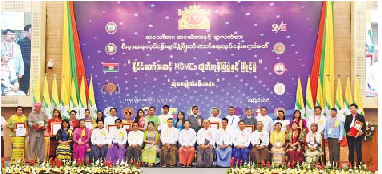
စီးပွားရေးဘဏ်မှ အတိုးနှုန်းသက်သာသည့် ဘဏ်ချေးငွေများ ကူညီဆောင်ရွက်ပေးသွားမည်ဖြစ်ကြောင်း လည်း သိရသည်။ သုံးရက်ကြာ ကျင်းပခဲ့သည့် ပြပွဲနှင့် ပြိုင်ပွဲအခမ်းအနားတွင် အိမ်သုံးနှင့် လက်မှုပစ္စည်းလုပ်ငန်း၊ စားသောက်ကုန်လုပ်ငန်း၊ စက်ပစ္စည်း ထုတ်လုပ်မှုလုပ်ငန်း၊ ချည်မျှင်နှင့် အထည်လုပ်ငန်း၊ ဝန်ဆောင်မှုလုပ်ငန်းများနှင့် စက်မှု နောက်ဆုံးနေ့တွင် လာရောက် နှောင့်နှေးမှုကြောင့် ပြခန်းစုစုပေါင်း ကြည့်ရှု လေ့လာကြသူများနှင့် စည်ကားလျက်ရှိသည်။ သတင်းစဉ်

ယနေ့ကျင်းပသည့် နိုင်ငံတော်အဆင့် MSMEs ထုတ်ကုန်ပြပွဲနှင့် ပြိုင်ပွဲတွင် ဆုများရရှိခဲ့ကြသည့် MSMEs လုပ်ငန်း ၁၄ ခုကို အသိအမှတ်ပြုသည့်အနေဖြင့် မြန်မာ