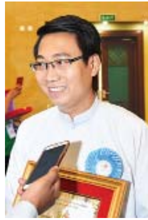
ကိုကောင်းဆက်နိုင်

အခုလို နိုင်ငံတော်အဆင့်ဆုရတဲ့အတွက် အတိုင်းမသိပျော်ပါတယ်။ ရှေ့ဆက်လုပ်မယ့် လုပ်ငန်းတွေအတွက်လည်း အားပိုရှိသွားပါတယ်။ အခု SME တွေက ကျွန်တော်တို့နိုင်ငံမှာ ၉၉ ရာခိုင်နှုန်းကျော်ရှိတယ် ဆိုတော့ ဒါဟာ နိုင်ငံတော်စီးပွားရေးတိုးတက်မှုအတွက် အဓိကဒေါက်တိုင်ဖြစ်ပါတယ်။ ကျွန်တော်တို့လိုလုပ်ငန်းငယ်လေးတွေ အများကြီးကြီးစားမှ