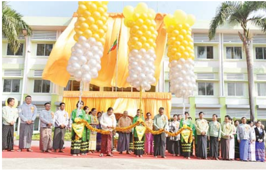
မယ့်သူတွေအားလုံး အဆင်ပြေချောမွေ့နိုင်ဖို့အတွက် ဒီရုံးဟာ အရေးကြီးပါတယ်။ နိုင်ငံခြားက ရင်းနှီးမြှုပ်နှံမယ့်

ဝန်ကြီးချုပ်က နှုတ်ခွန်းဆက်စကား ပြောကြားရာတွင် “မြန်မာနိုင်ငံရဲ့ စီးပွားရေးအချက်အချာကြောင့် ရန်ကုန် မြို့တော်ကြီးမှာ နိုင်ငံတကာက လာရောက်ရင်းနှီးမြှုပ်နှံ