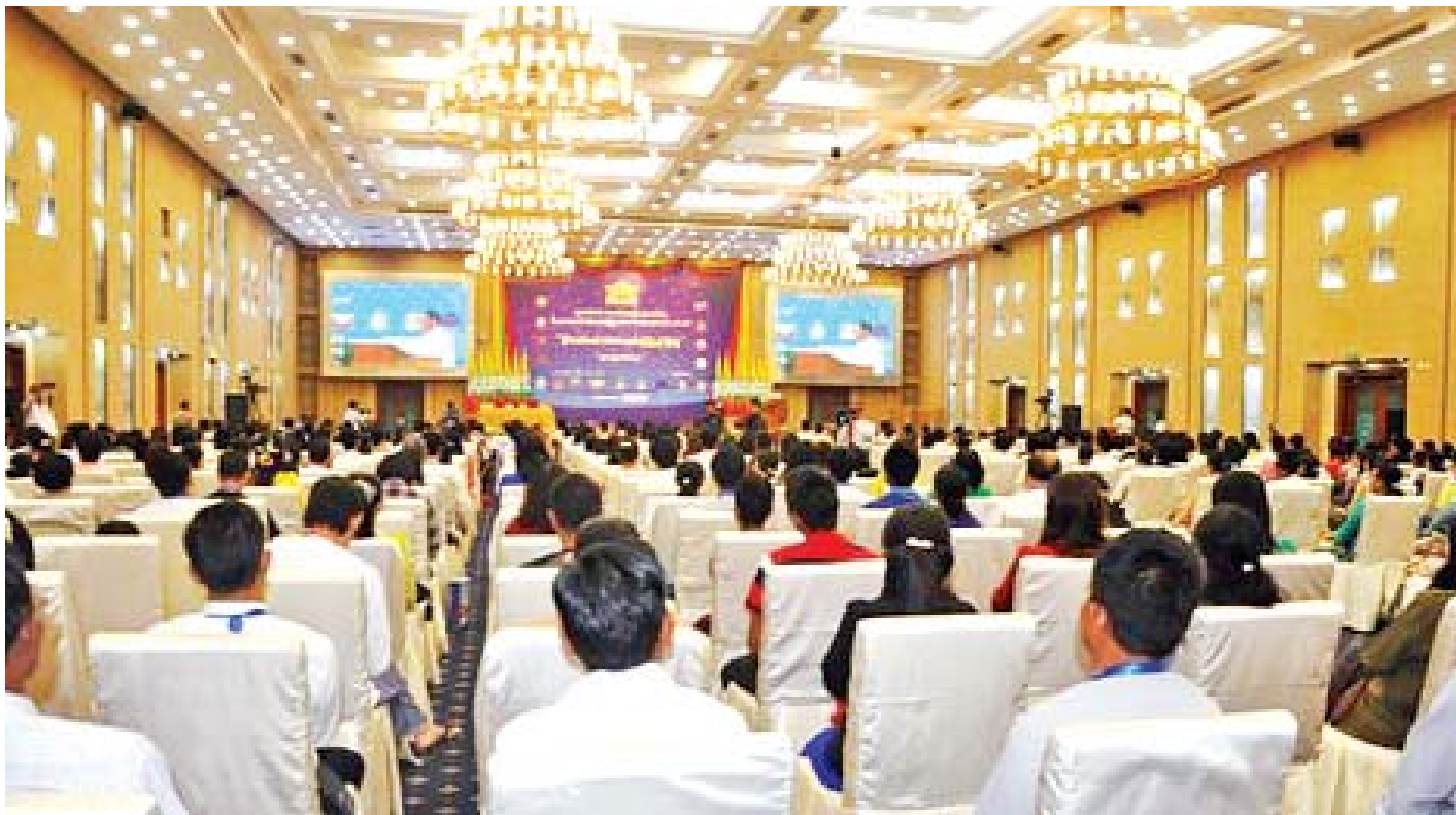
နိုင်ငံတော်အဆင့် MSMEs ထုတ်ကုန်ပြပွဲနှင့် ပြိုင်ပွဲ ဆုပေးပွဲအခမ်းအနား ကျင်းပစဉ်။

ထို့နောက် ဆုပေးပွဲအခမ်းအနားကို ကျင်းပရာ ပြည်ထောင်စုဝန်ကြီး ဦးခင်မောင်ချိုက ပထမဆုရရှိကြသည့် အသေးစား၊ အငယ်စားနှင့် အလတ်စား စီးပွားရေး လုပ်ငန်းရှင်များအား လည်းကောင်း၊ လုပ်ငန်းကော်မတီ အဖွဲ့ဝင် ပညာရေးဝန်ကြီးဌာန ဒုတိယဝန်ကြီး ဦးဝင်းမော် ထွန်းက ဒုတိယဆုရရှိကြသည့် အသေးစား၊ အငယ်စားနှင့် အလတ်စား စာမျက်နှာ ၃ ကော်လံ ၁ သို့