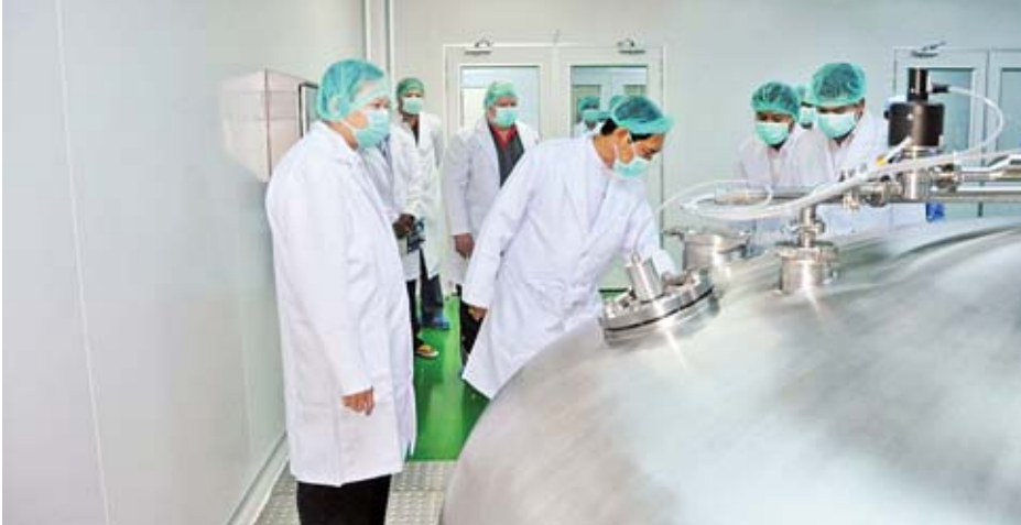
ပြည်ထောင်စုဝန်ကြီး ဦးခင်မောင်ချို သွေးကြောသွင်းဆေးရည် ထုတ်လုပ်သည့်စက် စမ်းသပ်လည်ပတ်မှုအား ကြည့်ရှုစစ်ဆေးစဉ်။

စက်မှုဝန်ကြီးဌာန ပြည်ထောင်စုဝန်ကြီး ဦးခင်မောင်ချိုသည် ယမန်နေ့ မွန်းလွဲပိုင်းတွင် မန္တလေးတိုင်းဒေသကြီး ကျောက်ဆည်မြို့ရှိ International Glass Co., Ltd. သို့ PPP စနစ်ဖြင့် ဆောင်ရွက်လျက်ရှိသည့် အမှတ် (၃၆) အကြီးစားစက်ရုံသို့ ရောက်ရှိပြီး မှန်ရည်ကျိုမီးဖိုတွင် သဘာဝဓာတ်ငွေ့အသုံးပြုမှု လျော့နည်းစေရေးအတွက် မီးတောက် Position နှင့် ဖိအားထိန်းညှိမှုနည်းပညာများ အောင်မြင်စွာ အသုံးပြုနေမှု Tin အရည်ကန်အတွင်း အပူချိန်ထိန်းချုပ်ထားမှုနှင့် လောင်စာအချိုး ထိန်းချုပ်မှုတို့ တွင် နည်းပညာသစ်များ ထပ်မံဖြည့်တင်းသုံးစွဲနေမှု၊ အပူစွမ်းအင်လေလွင့်ဆုံးရှုံးမှု အနည်းဆုံးဖြစ်အောင် စီစဉ်ဆောင်ရွက်ထားရှိမှု၊ ကွန်ပျူတာစနစ်အသုံးပြု၍ စက်များအားထိန်းချုပ်မောင်းနှင်နေမှု၊ အလိုအလျောက် မှန်အရည်အသွေးစစ်ဆေးနေမှု၊ အလိုအလျောက် မှန်ကောက် / မှန်သိမ်းဆောင်ရွက်နေမှုအခြေအနေတို့ကို လှည့်လည်ကြည့်ရှုစစ်ဆေးပြီး ဈေးကွက်ဝင် အရည် အသွေးမီမှန်များတိုးမြှင့်ထုတ်လုပ်နိုင်ရေး ကြိုးစားဆောင်ရွက်ရန် လှုပ်စစ်နှင့် စွမ်းအင်ဝန်ကြီးဌာနသို့ ပေးချေရမည့် သဘာဝဓာတ်ငွေ့နှင့် လျှပ်စစ်ဓာတ် အဖိုးငွေများကို စာချုပ်ပါစည်းကမ်းနှင့်အညီ အချိန်မီပျက်မကွက် ပေးချေရန် မှာကြားသည်။