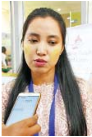
ကိုကောင်းဆက်နိုင်

အခုလို နိုင်ငံတော်အဆင့်ဆုရတဲ့အတွက် အတိုင်းမသိပျော်ပါတယ်။ ရှေ့ဆက်လုပ်မယ့် လုပ်ငန်းတွေအတွက်လည်း အားပိုရှိသွားပါတယ်။ အခု SME တွေက ကျွန်တော်တို့နိုင်ငံမှာ ၉၉ ရာခိုင်နှုန်းကျော်ရှိတယ် ဆိုတော့ ဒါဟာ နိုင်ငံတော်စီးပွားရေးတိုးတက်မှုအတွက် အဓိကဒေါက်တိုင်ဖြစ်ပါတယ်။ ကျွန်တော်တို့လိုလုပ်ငန်းငယ်လေးတွေ အများကြီးကြီးစားမှ