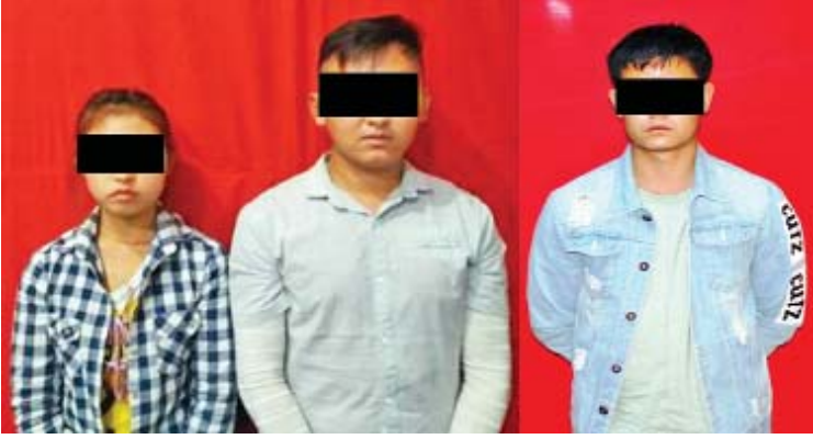
နေပြည်တော် မတ် ၂၄

မဟာအောင်မြေမြို့နယ်ဟေမာလာ(တောင်) ရပ်ကွက်ရှိ ဟိုတယ်မန္တလေးတွင် ဖွင့်လှစ်ထားသည့် DHL အမြန်ချောပို့(ပြည်ပသီးသန့်ဌာန)ပါဆယ်ပစ္စည်းပို့လုပ်ငန်းသို့ အပ်နှံလာသည့် မသင်္ကာဖွယ်ပုံးတစ်ပုံး ရောက်ရှိနေကြောင်း သတင်းအရ မတ် ၂၃ ရက် နံနက် ၁၁ နာရီတွင် မန္တလေးတိုင်းဒေသကြီး ရဲတပ်ဖွဲ့နှင့် မူးယစ်အထူးအဖွဲ့က သက်သေများနှင့်အတူ သွားရောက်စစ်ဆေးခဲ့ရာ အဆိုပါ ကတ္တူပုံးအတွင်းမှ ခဲစက္ကူဖြင့်ပတ်ထားသည့်