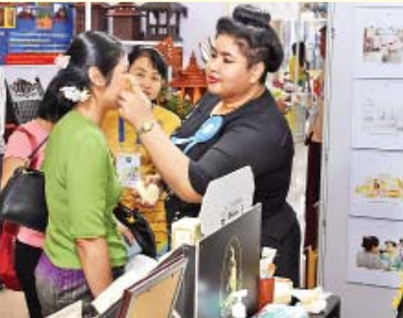
ရွှေသုန္ဒရီ မြန်မာသနပ်ခါးထုတ်လုပ်ရေးလုပ်ငန်း၏ ပြခန်း