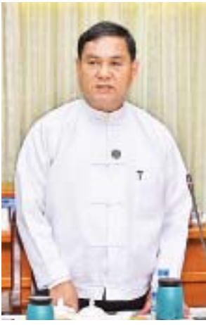
ဒုတိယဝန်ကြီး ဦးကြည်မင်း