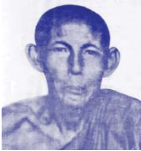
ဦးစန္ဒမာလာလင်္ကာရ

၁၉၄၂ ခုနှစ်တွင် စစ်တွေခရိုင်တောင်ပိုင်း အရှေ့ပိုင်းအဖြစ် လည်းကောင်း တာဝန်များထမ်းဆောင်ခဲ့ပါသည်။ ၁၉၅၇ ခုနှစ်တွင် လှည်းကျွန်းမြို့ အထက်တန်းကျောင်း၏ ကျောင်းအုပ်ဆရာကြီးအဖြစ် ခန့်အပ်ခြင်းခံခဲ့ရပြီး ထိုစဉ်ကပင် ရခိုင်ရာဇဝင်စာအုပ်၊ ရခိုင်လေ့ထုံးတမ်းစဉ်းကြီး (၁၉၆၀) မှတ်တမ်းစာအုပ်များကို ကိုယ်တိုင်လေ့လာပြုစုခဲ့ပါသည်။ ရခိုင်စာပေယဉ်ကျေးမှုသမိုင်း ဟောပြောပွဲများကို နေရာအနှံ့ လှည့်လည်ဟောပြောခဲ့ပါသည်။ ယဉ်ကျေးမှုအဖွဲ့ (ရန်ကုန်) ဥက္ကဋ္ဌအဖြစ် ဆောင်ရွက်ရင်း (၁၉၉၀) ပြည်နှစ် မတ်လ ၂ ရက်နေ့တွင် ကွယ်လွန်ခဲ့ပါသည်။ ဆရာကြီးရေးသားခဲ့သော ဆောင်းပါးများမှာ ရခိုင်စာပေ ယဉ်ကျေးမှုနှင့် ရခိုင်သမိုင်းအကြောင်းကို မီးမောင်းထိုး ပြလျက် ရှိနေပါသည်။