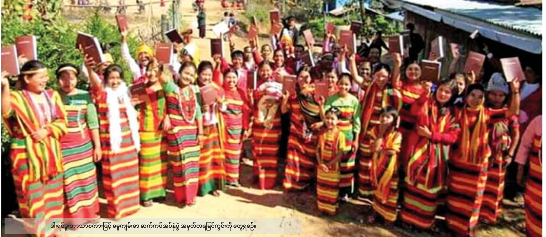
ဒါးရင်ဒူးဘာသာစကားဖြင့် ဓမ္မကျမ်းစာ ဆက်ကပ်အပ်နှံပွဲ အမှတ်တရမြင်ကွင်းကို တွေ့ရစဉ်။

မတူညီကြပေ။ ယင်းလူမျိုးစု ၅၃ စုအနက်မှ ဒါးရင်ဒူးမျိုးနွယ်စု(ခေါ်) ဒေသအခေါ် ဒါးလူမျိုးဖြစ်လာမည့် ချင်းမျိုးနွယ်စုတစ်ခုသည်လည်း “ချင်းမှန်လျှင် ပုဂံက”ဆိုသည့်အတိုင်း ပုဂံ၊ ပုပ္ပားတစ်ဝိုက်တွင် အခြေချနေထိုင်လာခဲ့ကြသည်။ လူမျိုးဆင်းသက်လာပုံ “ချင်းမှန်လျှင် ပုဂံက”ဆိုသည့်အတိုင်း ဒါးရင်ဒူးမျိုးနွယ်စုဖြစ်လာမည့် ချင်းတို့သည် ရေကြည်ရာမြက်နုရာကိုရှာရင်း မကွေးတိုင်းဒေသကြီး၊ ရွှေပေါင်းလောင်း ဘုရားနှင့် စစ်ကိုင်းတိုင်းဒေသကြီး အထူးကဏ္ဍ [ ၈ ] သို့ >>