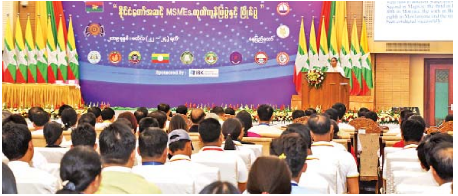
ဒုတိယသမ္မတ ဦးမြင့်ဆွေ နိုင်ငံတော်အဆင့် MSMEs ထုတ်ကုန်ပြပွဲနှင့် ပြိုင်ပွဲ(နေပြည်တော်)ဖွင့်ပွဲအခမ်းအနားတွင် အမှာစကားပြောကြားစဉ်။

နေပြည်တော် မတ် ၂၂ နိုင်ငံတော်အဆင့် MSMEs ထုတ်ကုန်ပြပွဲနှင့် ပြိုင်ပွဲ(နေပြည်တော်)ဖွင့်ပွဲအခမ်းအနားကို ယနေ့နံနက် ၉ နာရီတွင် နေပြည်တော်ရှိ မြန်မာအပြည်ပြည်ဆိုင်ရာ ကွန်ဗင်းရှင်းဗဟိုဌာန-၂၅ ကျင်းပရာ အသေးစား၊ အငယ်စားနှင့် အလတ်စားစီးပွားရေးလုပ်ငန်းများ ဖွံ့ဖြိုးတိုးတက်ရေးလုပ်ငန်းကော်မတီဥက္ကဋ္ဌ ဒုတိယသမ္မတဦးမြင့်ဆွေ တက်ရောက်၍ ဖွင့်လှစ်ပေးသည်။