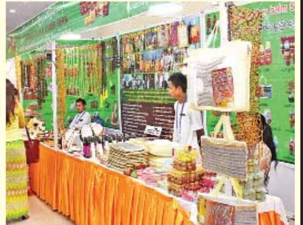
ပယင်းရတနာနှင့် ကချင်ပြည်နယ်ဒေသထွက်ကုန်များ ပြခန်း