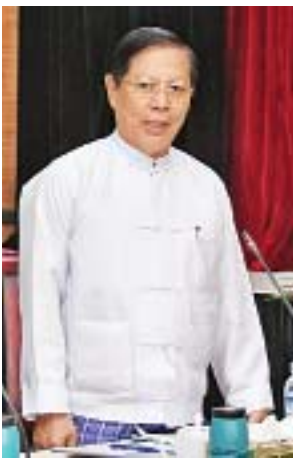
ပြည်ထောင်စုဝန်ကြီး သူရဦးအောင်ကို

ဆက်လက်၍ မြောက်ဦးယဉ်ကျေးမှုအမွေအနှစ်ဒေသကို ကမ္ဘာ့အမွေအနှစ်စာရင်းဝင်ဖြစ်ရေးအတွက် ပြည်တွင်း၊ ပြည်ပပညာရှင်များနှင့်ကော်မတီများဖွဲ့စည်း၍ အဆိုပြုစာတွဲ (Nomination Dossier)ကို ကမ္ဘာ့အမွေအနှစ်ကော်မတီသို့ တင်ပြနိုင်ရေးအတွက် ကဏ္ဍအသီးသီးတွင် ဆက်လက်ဆောင်ရွက်လျက်ရှိပါကြောင်း၊ ထိုသို့သော ဆောင်ရွက်ချက်များသည် မြန်မာနိုင်ငံ၏ အမျိုးသားယဉ်ကျေးမှု အမွေအနှစ်များကို ကမ္ဘာ့အမွေအနှစ်အဖြစ် တက်လှမ်း