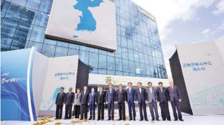
မြောက်ကိုရီးယားနိုင်ငံ ကင်ဆောင်စက်မှုဇုန်ရုံ နှစ်နိုင်ငံဆက်ဆံရေးအရာရှိရုံး။

နှစ်နိုင်ငံဆက်ဆံရေးပိုမိုတိုးတက်မြှင့်တင်ရေးအတွက် တာဝန်ရှိသူများအား ဆက်ဆံရေးရုံးသို့ ပြန်လည်ပို့ဆောင်တာဝန်ချထားစေလိုကြောင်း