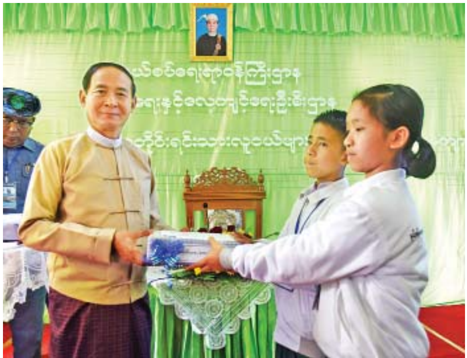
နိုင်ငံတော်သမ္မတ ဦးဝင်းမြင့် မြစ်ကြီးနားမြို့ နယ်စပ်ဒေသတိုင်းရင်းသားလူငယ်များဖွံ့ဖြိုးရေးသင်တန်းကျောင်း ကျောင်းသား ကျောင်းသူများအတွက် ထောက်ပံ့ငွေများ ပေးအပ်စဉ်။

ထို့နောက် နိုင်ငံတော်သမ္မတက မိမိတို့နိုင်ငံသည် ပြည်ထောင်စုနိုင်ငံဖြစ်ပါကြောင်း၊ ပြည်ထောင်စုနိုင်ငံဆိုသည်မှာ ပြည်ထောင်စုဖွားတိုင်းရင်းသားများအားလုံးပါဝင်ပြီး တည်ဆောက်ထားခြင်းကြောင့် ဖြစ်ပါကြောင်း၊ နယ်စပ်ရေးရာဝန်ကြီးဌာနအနေဖြင့် ပြည်ထောင်စုတိုင်းရင်းသားများအတွက် ပညာရေးဖွံ့ဖြိုးတိုးတက်မှုအလုပ်အကိုင်အခွင့်အရေးနှင့် လူသားအရင်းအမြစ်ဖွံ့ဖြိုးတိုးတက်ရေးတို့အတွက် ဆောင်ရွက်နေပါကြောင်း၊ ပြည်ထောင်စုသားသမီးတို့အနေဖြင့် ပညာသင်ကြားပေးသည့် ဆရာ ဆရာမများ၏ သွန်သင်ဆုံးမမှုကို လေးစားလိုက်နာရန် လိုအပ်ပါကြောင်း၊ ဆရာ ဆရာမများ၏ သင်ကြားပြသပေးမှုများသည် သားတို့သမီးတို့၏ အနာဂတ်အတွက် များစွာအရေးပါပါကြောင်း၊ ယခုသင်တန်းကျောင်းများတွင် ပညာရေး၊ သက်မွေးပညာနှင့် ပြည်ထောင်စုစိတ်ဓာတ် တည်တံ့ခိုင်မြဲရေးအတွက် အလေးထားသင်ကြားပေးနေသည်ကို တွေ့ရပါကြောင်း၊ ပြည်ထောင်စုစိတ်ဓာတ်ကို သားတို့ သမီးတို့အနေဖြင့် မိမိပတ်ဝန်းကျင်၊ မိမိဒေသ၊ မိမိတိုင်းရင်းသားများအကြား သိရှိပြန့်ပွားအောင် ပြောကြားပေးရန် လိုအပ်ပါကြောင်း၊ ပြည်ထောင်စုသားသမီးများ၏ ပညာရေးဖွံ့ဖြိုးတိုးတက်လာသည်ကို တွေ့ရပါကြောင်း၊ တိုင်းပြည်ဖွံ့ဖြိုးတိုးတက်မှုမှာ ပညာရေးရင်းနှီးမြှုပ်နှံမှုအပေါ် မူတည်ပါကြောင်း၊ နယ်စပ်ဒေသ