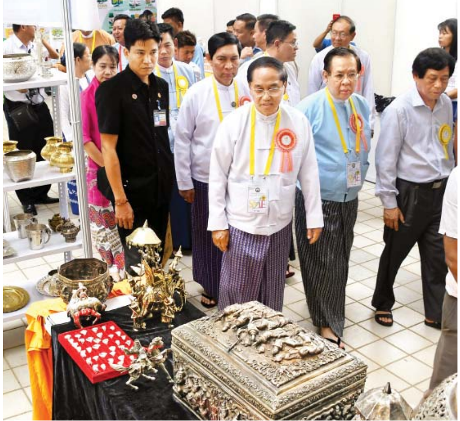
ဒုတိယသမ္မတ ဦးမြင့်ဆွေ နိုင်ငံတော်အဆင့် MSMEs ထုတ်ကုန်ပြပွဲနှင့် ပြိုင်ပွဲ(နေပြည်တော်) ဖွင့်ပွဲအခမ်းအနားတွင် ခင်းကျင်းပြသထားသည့် ပြခန်းများကို လှည့်လည်ကြည့်ရှု အားပေးစဉ်။

MSME များအတွက် လိုအပ်သော ငွေကြေးအရင်းအနှီးများရရှိရန် ချေးငွေ အစီအစဉ်များ ဆောင်ရွက်ပေးလျက်ရှိရာ နိုင်ငံတော်အစိုးရ အစီအစဉ်ဖြစ်သည့် SME ချေးငွေ ဘီလီယံ ၃၀၊ အပေါင်မဲ့အာမခံစနစ် (CGI) ချေးငွေ (၇ ဒသမ ၃၉၃) ဘီလီယံ၊ ဂျပန်နိုင်ငံ၏ တရားဝင်ဖွံ့ဖြိုးရေးအကူအညီ (ODA) ချေးငွေအဖြစ် JICA Two Step Loan ချေးငွေဂျပန်ယန်း ဘီလီယံ ၂၀၊ မြန်မာ့စီးပွားရေးဘဏ်ချေးငွေ ဘီလီယံ ၂၅၀၊ မြန်မာ့လယ်ယာဖွံ့ဖြိုးရေးဘဏ်မှ စိုက်ပျိုးရေးချေးငွေ ဘီလီယံ ၂၀၀၊ ဂျာမန် ဖွံ့ဖြိုးရေးဘဏ် (KfW) ချေးငွေယူရို (၁၅ ဒသမ ၃၀) သန်း စသည့်ချေးငွေများကို ပြည်တွင်းပုဂ္ဂလိကဘဏ်များနှင့် ပူးပေါင်းပြီး MSMEs လုပ်ငန်းရှင်များသို့ ထုတ်ချေးပေး လျက်ရှိပါကြောင်း။