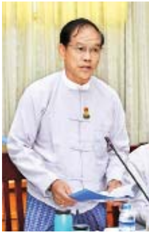
ဒုတိယဝန်ကြီး ဦးလှမော်ဦး

နိုင်ရန် ကြိုးပမ်းဆောင်ရွက်မှုများပင်ဖြစ်ပါကြောင်း၊ အမျိုးသားယဉ်ကျေးမှုအမွေအနှစ်များသည် မြန်မာနိုင်ငံအနှံ့အပြားတွင် တည်ရှိနေပြီး ထင်ရှားသည့် ယဉ်ကျေးမှုအမွေအနှစ်များအပြင် တိမ်မြုပ်နေသည့် ယဉ်ကျေးမှုအမွေအနှစ်များကို ရှာဖွေဖော်ထုတ် ထိန်းသိမ်းကာကွယ်သုတေသနပြုရန် လိုအပ်နေပြီးမည်ဖြစ်ပါကြောင်း၊ မြန်မာ့ယဉ်ကျေးမှု အမွေအနှစ်များကို ရေရှည်တည်တံ့အောင် ဆောင်ရွက်ကြရန် မြန်မာနိုင်ငံသားအားလုံးတွင် တာဝန်ရှိသည်ကို ဖွဲ့စည်းပုံအခြေခံဥပဒေတွင် အတိအလင်းဖော်ပြထားပါကြောင်း။