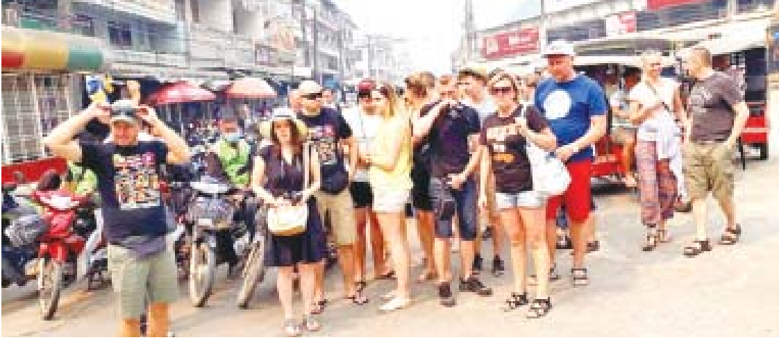
တာချီလိတ် မတ် ၂၂ တာချီလိတ်နယ်စပ်ဝင်ပေါက်မှတစ်ဆင့် ထိုင်နိုင်သား အများစုပါဝင်သည့် နိုင်ငံခြားသား ကမ္ဘာလှည့်ခရီးသွားဧည့်သည်များ ဝင်ရောက်လည်ပတ်လျက်ရှိရာ မတ် ၁၅ ရက်မှ ၂၁ ရက်ထိ နေချင်းပြန်နှင့် ညအိပ်ခရီးစဉ်

အဖြစ် စုစုပေါင်း ၂၂၈၇၂ ဦး ဝင်ရောက်လည်ပတ်ခဲ့ကြောင်း ဟိုတယ်နှင့်ခရီးသွားညွှန်ကြားမှုဦးစီးဌာန တာချီလိတ်ရုံးခွဲမှ သိရသည်။ နိုင်ငံခြားသား ခရီးသွားဧည့်သည်များသည် မြန်မာနိုင်ငံအတွင်း ဘုရားဖူးခြင်း၊ ရေမြေတောတောင် သဘာဝအလှရှုခင်းများနှင့် အထင်ကရနေရာများ တိုင်းရင်းသားများ၏ ရိုးရာယဉ်ကျေးမှု ဓလေ့ထုံးစံများကို ဗဟုသုတအဖြစ် ကြည့်ရှုလေ့လာရန် ဝင်ရောက်လျက်ရှိရာ တာချီလိတ်သို့ နေချင်းပြန်အဖြစ် ထိုင်နိုင်သား ၂၀၅၈၈ ဦးနှင့် တာချီလိတ်နယ်စပ်(နိုင်ငံခြားသား) ၃၀၀၊ ညအိပ်ခရီးစဉ်အဖြစ် မိုင်းဖြတ်မြို့နှင့် ကျိုင်းတုံမြို့သို့ ထိုင်နိုင်သား အများစုပါဝင်သည့် တာချီလိတ်နယ်စပ်ဝင်ပေါက်မှ ၂၀၁၈ ခုနှစ် ဧပြီ ၁ ရက်မှ ၂၀၁၉ ခုနှစ် မတ် ၂၁ ရက်ထိ ထိုင်နိုင်သားနှင့် တာချီလိတ်နယ်စပ် နေချင်းပြန်ခရီးသည် စုစုပေါင်း ၁၀၀၇၀၉၄ ဦး၊ မိုင်းဖြတ်နှင့် ကျိုင်းတုံခရီးစဉ်အဖြစ် ခရီးသည် ၁၃၀၄၀၊ တာချီလိတ်မြို့မှ ဝင်ရောက်လည်ပတ်ခဲ့ကြောင်း သိရသည်။ ဝေယံလင်း(ပြန်/ဆက်)