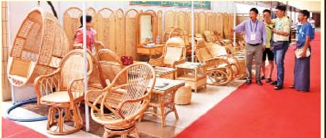
ကြိမ်နှင့် ကြိမ်ပရိဘောဂပြခန်း