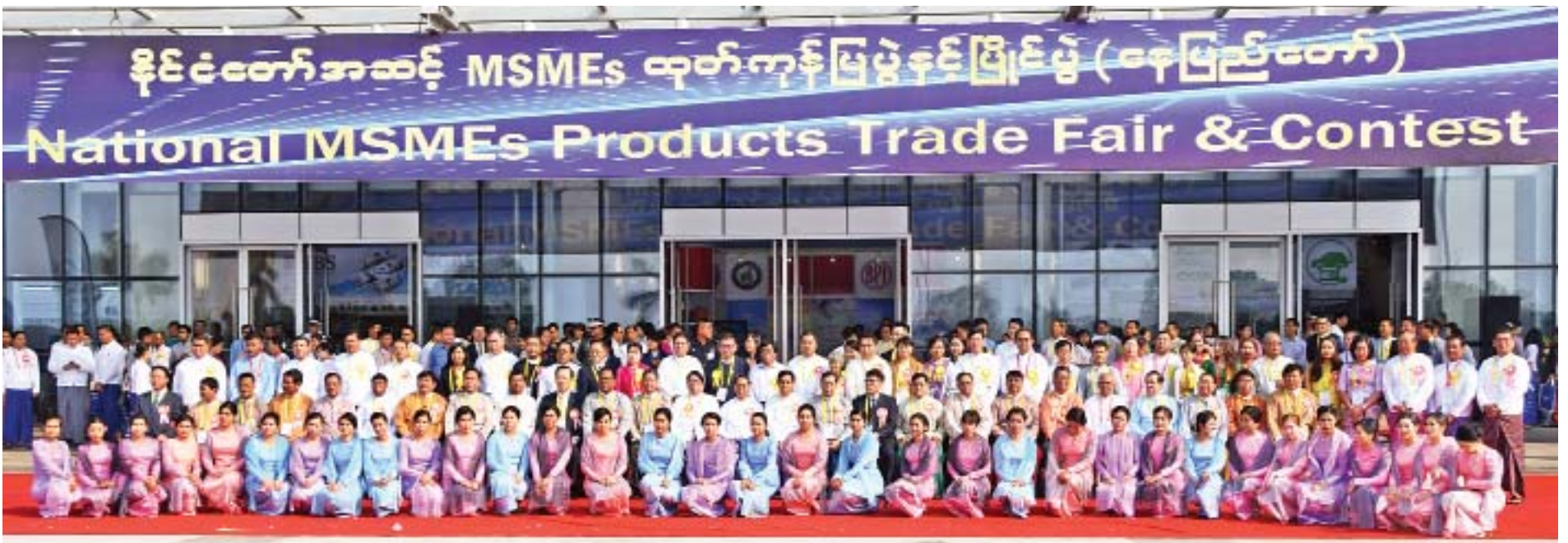
ဒုတိယသမ္မတ ဦးမြင့်ဆွေ နိုင်ငံတော်အဆင့် MSMEs ထုတ်ကုန်ပြပွဲနှင့် ပြိုင်ပွဲ(နေပြည်တော်) ဖွင့်ပွဲအခမ်းအနားသို့ တက်ရောက်လာကြသူများနှင့်အတူ စုပေါင်းမှတ်တမ်းတင်ဓာတ်ပုံရိုက်စဉ်။

○ ဒုတိယသမ္မတ ဦးမြင့်ဆွေမှ ဦးမောင်မောင်ဝင်း၊ နေပြည်တော် ကောင်စီဝင် ဦးအောင်မြင်ထွန်း၊ တိုင်းဒေသကြီး/ပြည်နယ်အစိုးရအဖွဲ့များမှ ဝန်ကြီးများ၊ မြန်မာနိုင်ငံတော်ဗဟိုဘဏ် ဒုတိယဥက္ကဋ္ဌဦးစိုးသိန်း၊ ဌာနဆိုင်ရာ တာဝန် ရှိသူများ၊ ပြည်ထောင်စုသမ္မတ မြန်မာနိုင်ငံ ကုန်သည်များနှင့် စက်မှုလက်မှုလုပ်ငန်းရှင် များအသင်းချုပ်ဥက္ကဋ္ဌနှင့် ဗဟိုအလုပ်အမှု ဆောင်အဖွဲ့ဝင်များ၊ ပြည်တွင်း ပြည်ပအဖွဲ့ အစည်းများနှင့် အသင်းအဖွဲ့များ၊ အစိုးရ မဟုတ်သော အဖွဲ့အစည်းများ၊ အသိပညာရှင်၊ အတတ်ပညာရှင်များ၊ အလှူရှင်များ၊ လုပ်ငန်း ရှင်များနှင့် တာဝန်ရှိသူများ တက်ရောက်ကြ သည်။