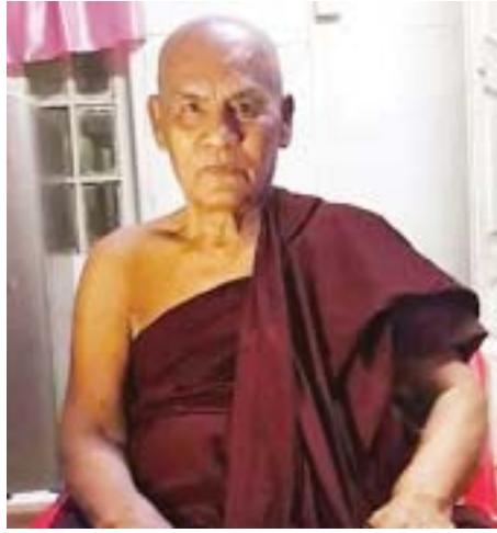
ဆရာတော် အသျှင်စက္ကိန္ဒ