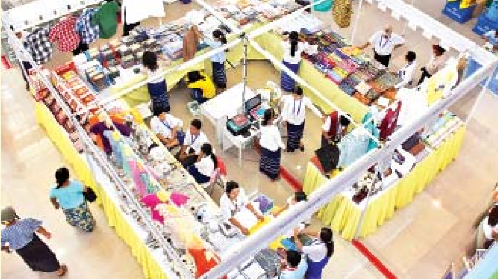
အမှတ်(၃) အကြီးစားစက်မှုလုပ်ငန်းပြခန်း