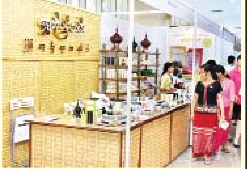
မြန်မာ့ရိုးရာသနပ်ခါးပြခန်း