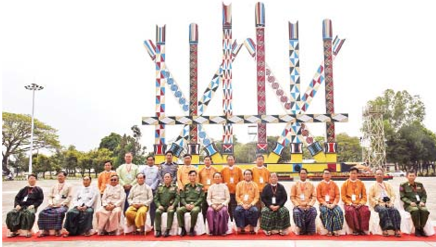
နိုင်ငံတော်သမ္မတ ဦးဝင်းမြင့် မြစ်ကြီးနားမြို့ စိတာပူမနောကွင်း၌ ပြည်ထောင်စုဝန်ကြီးများ၊ ကချင်ပြည်နယ်ဝန်ကြီးချုပ်၊ ပြည်နယ်ဝန်ကြီးများ၊ တာဝန်ရှိသူများနှင့်အတူ စုပေါင်းမှတ်တမ်းတင်ဓာတ်ပုံရိုက်စဉ်။

ခေါင်းဆောင်မည့်သူများ သားတို့သမီးတို့ထံမှ ပေါ်ထွက်လာမည်ဟု ထင်မြင်ယူဆပါကြောင်း၊ သားတို့ သမီးတို့သည် ပညာအင်အား၊ စိတ်ဓာတ်ခွန်အားပြည့်ဝပြီး နိုင်ငံတော်အား ပြန်လည်အလုပ်အကျွေးပြုရန် လိုအပ်ပါကြောင်း၊ ပြည်ထောင်စုစိတ်ဓာတ်ကို သားတို့ သမီးတို့ရင်ထဲတွင် ထာဝစဉ်ကိန်းအောင်းပြီး ပြည်ထောင်စုကြီးငြိမ်းချမ်းသာယာဝပြောအောင် ဆောင်ရွက်သွားကြစေလိုကြောင်း မှာကြားသည်။