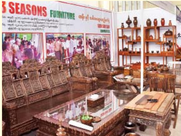
ထန်းနှင့် သစ်အချောထည်ပရိဘောဂပြခန်း