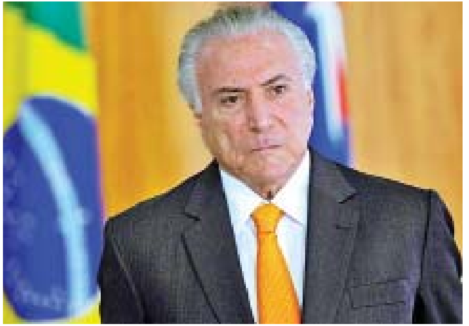
လာဘ်ယူခဲ့မှုကို ဖော်ထုတ်တွေ့ရှိ၍ ထောင်ဒဏ် ၁၂ နှစ်နှင့် ၂၀၁၁ ခုနှစ် ကုန်ဆုံးသည်အထိ ဘရာဇီးသမ္မတအဖြစ် တစ်လ ပြစ်ဒဏ်ကျခံခဲ့ရသည်။ ဒါလ်ဆေးဗားသည် ရှစ်နှစ်တာဝန်ယူခဲ့သူဖြစ်သည်။ အင်န်အိတ်ချ်ကေ

မစ်ချယ်တီမာသည် အကျင့်ပျက်ခြစားမှုစွဲချက်ဖြင့် အဖမ်းခံရသည့် ဒုတိယမြောက် ဘရာဇီးသမ္မတဟောင်း ဖြစ်သည်။ ယမန်နှစ်အတွင်းက သမ္မတဟောင်း လူးဇစ်အန်နာစီယို လူလာဒါလ်ဆေးဗားသည် ဆောက်လုပ်ရေးကုမ္ပဏီတစ်ခုထံမှ အမေရိကန်ဒေါ်လာတစ်သန်း