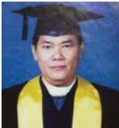
ဦးထွန်းရွှေခိုင်(မဟာဝိဇ္ဇာ)

ဖော်ထုတ်ခဲ့သည်။ ၁၉၇၂ ခုနှစ်မှစ၍ ရခိုင်သမိုင်းနှင့် ယဉ်ကျေးမှုများကို သုတေသနပြုလုပ်၍ အေဒီ တစ်ထောင် မတိုင်မီ ရခိုင်သမိုင်းနှင့်ပတ်သက်သော စာအုပ်များကို ရေးသားထုတ်ဝေခဲ့သည်။ ၁၉၈၁ ခုနှစ် မေလ ၂၅ ရက် နေ့တွင် ကွယ်လွန်အနိစ္စ ရောက်ခဲ့ပါသည်။