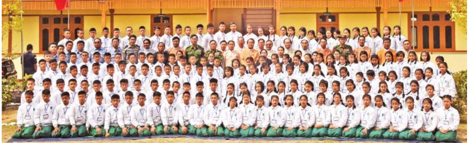
နိုင်ငံတော်သမ္မတ ဦးဝင်းမြင့်နှင့်အဖွဲ့ မြစ်ကြီးနားမြို့ နယ်စပ်ဒေသတိုင်းရင်းသားလူငယ်များဖွံ့ဖြိုးရေးသင်တန်းကျောင်းမှ ဆရာ ဆရာမများ၊ ကျောင်းသား ကျောင်းသူများနှင့်အတူ စုပေါင်းမှတ်တမ်းတင်ဓာတ်ပုံရိုက်စဉ်။

တိုင်းရင်းသားလူငယ်များဖွံ့ဖြိုးရေးသင်တန်းကျောင်းများတွင် စာကြည့်တိုက်များ ထားရှိပေးသည့်အတွက် ဝမ်းမြောက်ပါကြောင်း၊ သားတို့သမီးတို့အနေဖြင့် အချိန်ကို အကျိုးရှိစွာ အသုံးပြုတတ်စေရန်နှင့် စာကြည့်တိုက်သို့ သွားရောက်လေ့လာဖတ်ရှုမှုများ မှတ်ဖွယ်မှတ်ရာများကို မှတ်သားကြစေလိုကြောင်း၊ နိုင်ငံတော်ကို