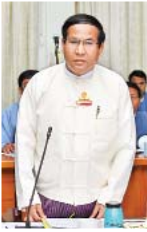
ဒုတိယဝန်ကြီး ဦးတင်မြင့်