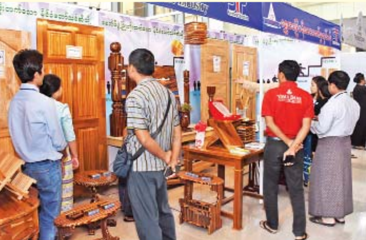
သစ်အချောထည်ပရိဘောဂပြခန်း