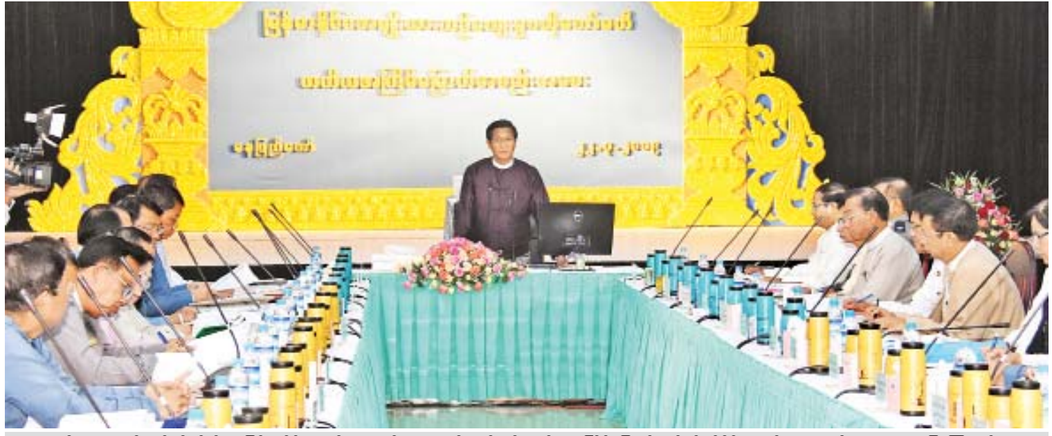
ဒုတိယသမ္မတ ဦးဟင်နရီဗန်ထီးယူ မြန်မာနိုင်ငံ အမျိုးသားယဉ်ကျေးမှုဗဟိုကော်မတီ တတိယအကြိမ်မြောက် လုပ်ငန်းညှိနှိုင်းအစည်းအဝေးတွင် အမှာစကားပြောကြားစဉ်။

နေပြည်တော် မတ် ၂၂ မြန်မာနိုင်ငံ အမျိုးသားယဉ်ကျေးမှု ဗဟိုကော်မတီ၏တတိယအကြိမ်မြောက် လုပ်ငန်းညှိနှိုင်းအစည်းအဝေးကို ယနေ့နံနက် ၉ နာရီတွင် နေပြည်တော်ရှိ သာသနာရေးနှင့် ယဉ်ကျေးမှုဝန်ကြီးဌာန အစည်းအဝေးခန်းမ၌ ကျင်းပရာ မြန်မာနိုင်ငံအမျိုးသားယဉ်ကျေးမှုဗဟိုကော်မတီဥက္ကဋ္ဌ ဒုတိယသမ္မတ ဦးဟင်နရီဗန်ထီးယူ တက်ရောက်အမှာစကားပြောကြားသည်။ အစည်းအဝေးသို့ ပြည်ထောင်စုဝန်ကြီးသူရဦးအောင်ကို၊ ဒုတိယဝန်ကြီးဦးတင်မြင့်၊ ဦးကြည်မင်းနှင့် ဦးလှမော်ဦး၊ အမြဲတမ်းအတွင်းဝန်များ၊ ညွှန်ကြားရေးမှူးချုပ်များ၊ ရန်ကုန်နှင့် မန္တလေးအနုပညာတက္ကသိုလ်များမှ ပါမောက္ခချုပ်များ၊ ကျွမ်းကျင်ပညာရှင်များ၊ မြန်မာနိုင်ငံသမိုင်းအဖွဲ့၊ မြန်မာနိုင်ငံဝန်ချိစာမျက်နှာ ၇ ကော်လံ ၁ သို့ ❖