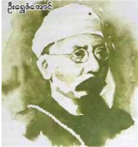
ဦးရွှေခင်အောင်

အဖ ဦးရွှေသာနှင့်အမိ ဒေါ်မိမိဖြူတို့မှ ၁၈၇၁ ခုနှစ် ဇန်နဝါရီ ၂၀ ရက်တွင် စစ်တွေမြို့ ကျောင်းတက်လမ်း ရပ်ကွက်၌ မွေးဖွားခဲ့ပြီး စစ်တွေမြို့၊ ရန်ကုန်မြို့တို့၌ ပညာ ဆည်းပူးခဲ့သည်။ အသက်(၂၀) အရွယ် ၁၈၉၂ ခုနှစ်တွင် ရန်ကုန်တက္ကသိုလ်မှ ဝိဇ္ဇာဘွဲ့ရရှိခဲ့ပြီး ပညာအုပ်၊ လယ်ဝန် တာဝန်များကို ထမ်းဆောင်ခဲ့သည်။ ဗုဒ္ဓအဘိဓမ္မာ တရားတော်ကို ဥရောပတိုက်သားများပါ လေ့လာသိရှိနိုင် အောင် မြန်မာနိုင်ငံ၌ အင်္ဂလိပ်ဘာသာဖြင့် ပထမဦးဆုံး