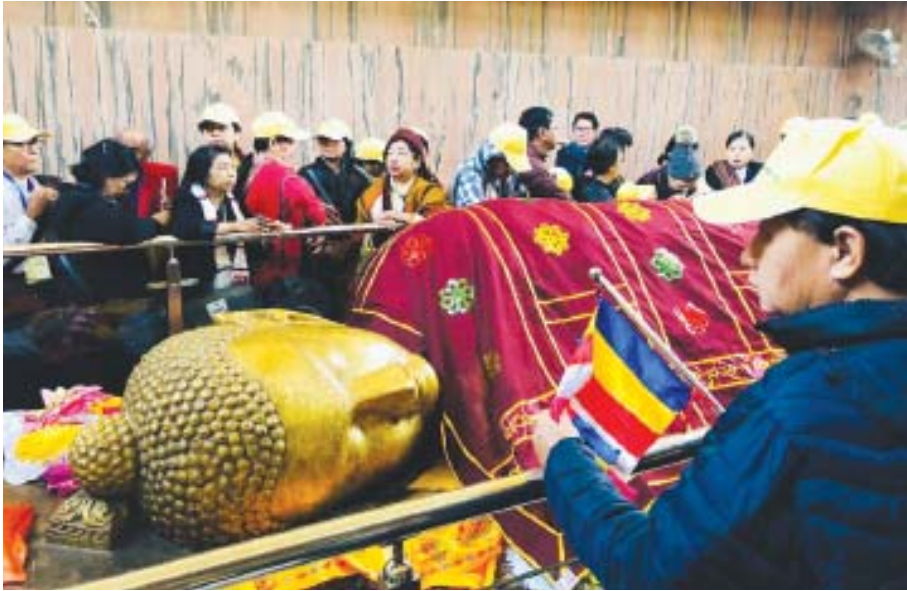
မဟာပရိနိဗ္ဗာန်စေတီတွင်းရှိ ဗုဒ္ဓမြတ်စွာ ပရိနိဗ္ဗာန်စံလှုံတော်မူဟန် ရုပ်ပွားတော်။