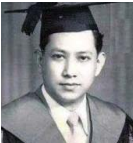
ဦးစံသာအောင်

ဦးစန္ဒမာလာလင်္ကာရ ခမည်းတော် ဦးကျော်ဇောနှင့် မယ်တော် ဒေါ်ဝင်းလှဖြူတို့မှ သက္ကရာဇ် ၁၆၆၁ ခုနှစ်တွင် ရမ်းဗြဲမြို့နယ် ရွာပုလဲရွာ၌ ဖွားမြင်ခဲ့ပါသည်။ ငယ်မည်မှာ ကျော်စောအောင်ဟုခေါ်၍ လောကုတ္တရာစာပေများကို လေ့လာရင်း ရှင်သာမဏေပြုခဲ့ပါသည်။ ယင်းနောက် ရမ်းဗြဲမြို့ တောင်ကျောင်းဆရာတော် ဦးသာရမေဓာကို ဥပဇ္ဈာယ်ပြု၍ ရဟန်းအဖြစ်ရောက်တော်မူပြီး သရက်မြို့နှင့် မန္တလေးမြို့များတွင် စာပေကျမ်းဂန်များ လေ့လာသင်ယူ ခဲ့ပါသည်။