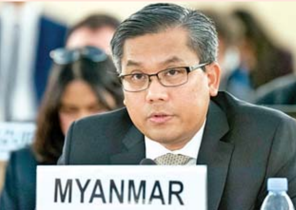
မြန်မာအမြဲတမ်းကိုယ်စားလှယ် ဦးကျော်မိုးထွန်း။

မဟာမင်းကြီး၏ အစီရင်ခံစာတွင် တစ်ဖက်မှ ပြောကြားချက်များသာ ထင်ဟပ်လျက်ရှိပြီး မြန်မာအစိုးရ ၏ ကြိုးပမ်းအားထုတ်မှုများနှင့် ထင်သာမြင်သာသည့် တိုးတက်မှုများကို လျစ်လျူရှုထားကြောင်း၊ အစီရင်ခံစာ သည် မြေပြင်မှ ရှုပ်ထွေးမှုများနှင့် စိန်ခေါ်မှုများကို ကောင်းစွာနားလည်မှုမရှိခြင်းကို ပြသနေကြောင်း၊ မြန်မာ နိုင်ငံကဲ့သို့ လူမျိုးပေါင်းစုံနှင့် ဘာသာပေါင်းစုံ စုပေါင်း နေထိုင်သည့် နိုင်ငံတစ်နိုင်ငံအတွက် ဒီမိုကရေစီဖက်ဒရယ် ပြည်ထောင်စု တည်ထောင်ရေးနှင့် လူ့အခွင့်အရေး ကာကွယ်မြှင့်တင်ရေးတို့တွင် မျှတမှုနှင့် အားလုံးပါဝင်မှု တို့သည် အရေးကြီး