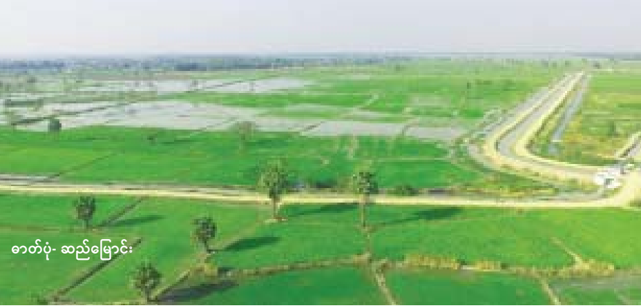
ဓာတ်ပုံ- ဆည်မြောင်း

အဆိုပါ ကညင်ရေလှောင်တမံမှ ဆည်ရေဖြင့် ယခင်နှစ်က နွေစပါးစိုက် ဧက ၆၂၆၃ ဧကကို ရေပေးဝေစိုက်ပျိုး နိုင်ခဲ့ပြီး မိုးစပါး ၁၈၄၆၂ ဧကကို ဖြည့် စွက်ရေနှင့် အောင်ရေပေးဝေခဲ့ ကြောင်း၊ ယခုနှစ်တွင် နွေစပါး ၁၈၄၆၂ ဧကကို ရေပေးဝေနိုင်ရန် ရေသိုလှောင်ထားရှိပြီး တူးမြောင်း များ ပြုပြင်ထားသော်လည်း တောင်သူများစိုက်ပျိုးမှုအရ ၈၄၂၇ ဧကသာရှိကြောင်း သိရသည်။ ထိုသို့ ကညင်ရေလှောင်တမံမှ