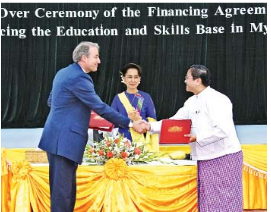
နိုင်ငံတော်၏အတိုင်ပင်ခံပုဂ္ဂိုလ် ဒေါ်အောင်ဆန်းစုကြည် ရှေ့မှောက်၌ စီမံကိန်းနှင့် ဘဏ္ဍာရေးဝန်ကြီးဌာန အမြဲတမ်းအတွင်းဝန် ဦးထွန်းထွန်းနိုင်နှင့် မြန်မာနိုင်ငံဆိုင်ရာ ဥရောပသမဂ္ဂ သံအမတ်ကြီး H.E. Mr. Kristian Schmidt တို့ ပညာရေးနှင့် ကျွမ်းကျင်မှုအခြေခံများမြှင့်တင်ရေး စီမံချက်နှင့်စပ်လျဉ်းသည့် ငွေကြေးထောက်ပံ့မှုဆိုင်ရာ သဘောတူစာချုပ်ကို အပြန်အလှန်လဲလှယ်ကြစဉ်။