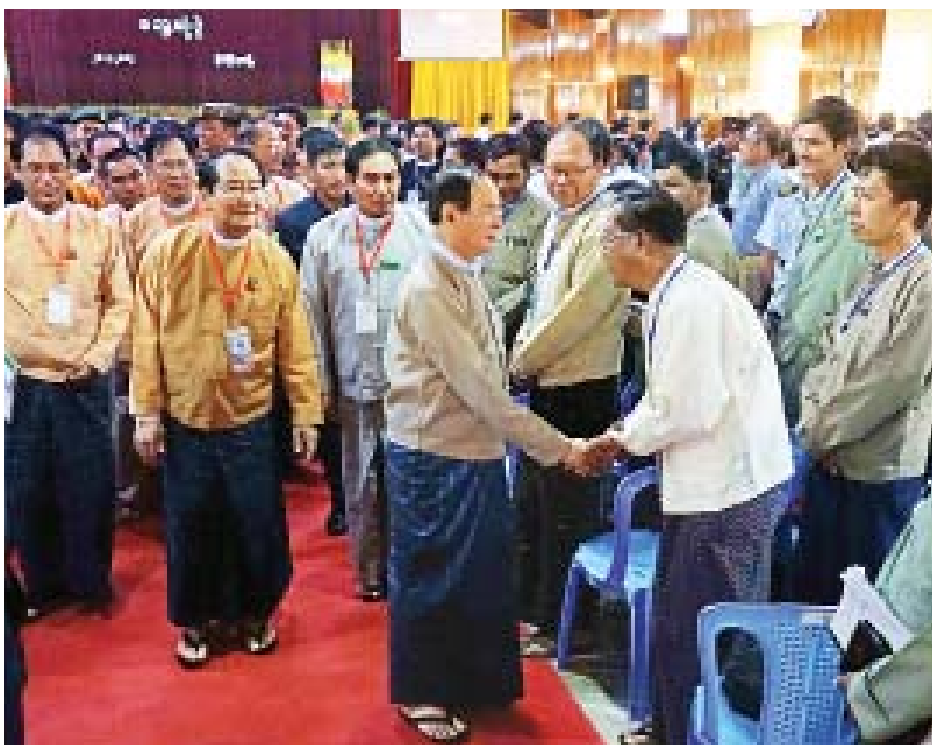
နိုင်ငံတော်သမ္မတ ဦးဝင်းမြင့် ကချင်ပြည်နယ်ရှိ အုပ်ချုပ်ရေး၊ ဥပဒေပြုရေးနှင့် တရားစီရင်ရေးမဏ္ဍိုင်တို့မှ တာဝန်ရှိသူများနှင့် တွေ့ဆုံပွဲသို့ တက်ရောက်လာသူများအား ရင်းရင်းနှီးနှီး လိုက်လံနှုတ်ဆက်စဉ်။