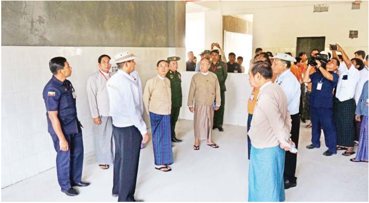
နိုင်ငံတော်သမ္မတ ဦးဝင်းမြင့် မြစ်ကြီးနားမြို့၊ ပြည်သူ့ဆေးရုံကြီး လေးထပ်ဆောင်သစ် တည်ဆောက်နေမှုကို ကြည့်ရှုစစ်ဆေးစဉ်။