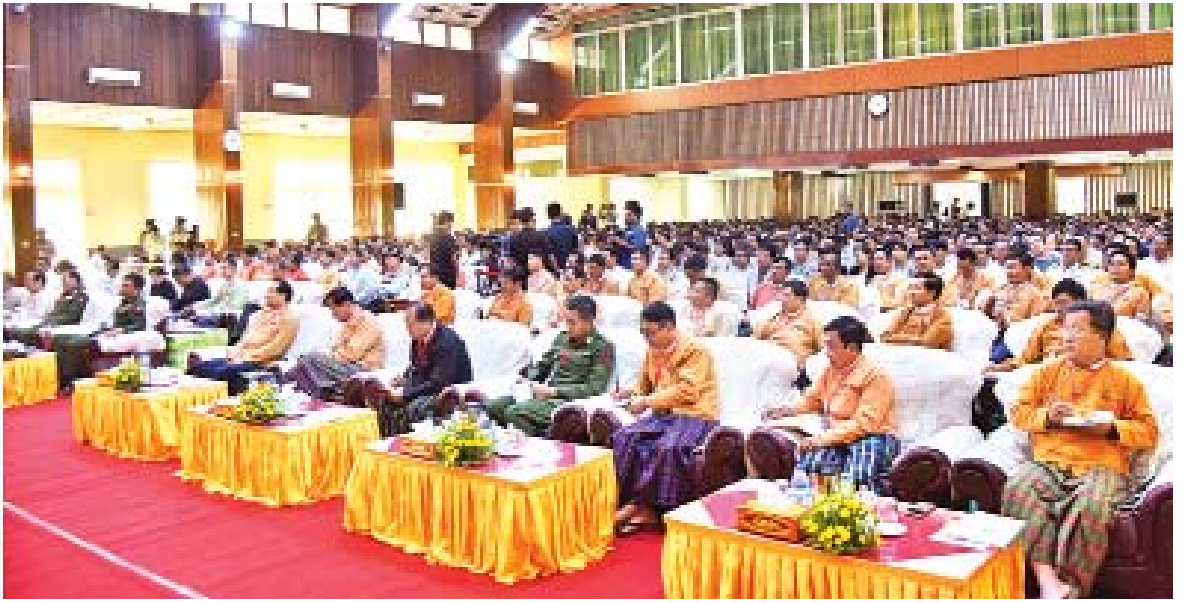
နိုင်ငံတော်သမ္မတ ဦးဝင်းမြင့် ကချင်ပြည်နယ်ရှိ အုပ်ချုပ်ရေး၊ ဥပဒေပြုရေးနှင့် တရားစီရင်ရေးမဏ္ဍိုင်တို့မှ တာဝန်ရှိသူများနှင့် တွေ့ဆုံစဉ်။