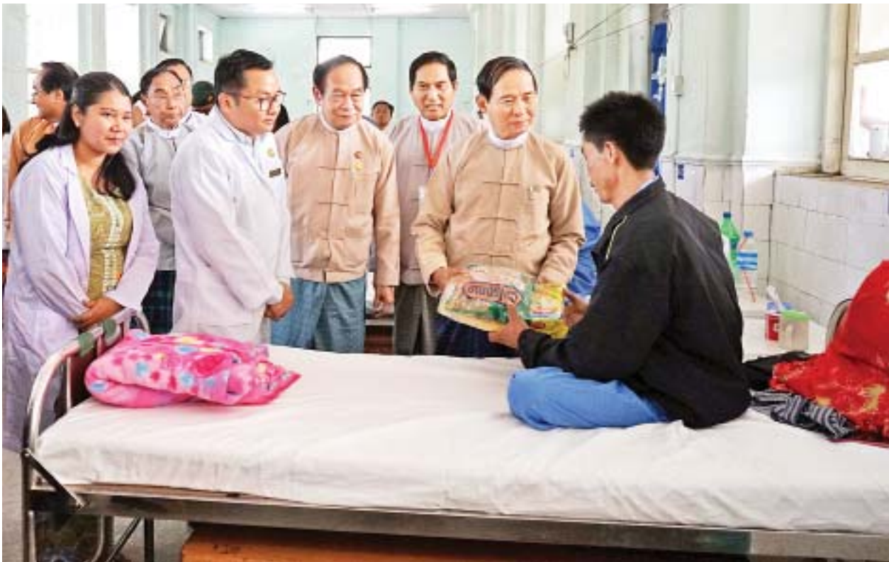
နိုင်ငံတော်သမ္မတ ဦးဝင်းမြင့် မြစ်ကြီးနားမြို့၊ ပြည်သူ့ဆေးရုံကြီးတွင် ဆေးကုသမှုခံယူနေကြသည့်လူနာများအား ကြည့်ရှုအေးပေးပြီး စားသောက်ဖွယ်ရာများ ပေးအပ်စဉ်။

ဒီမိုကရေစီစနစ်ဆိုသည်မှာ တရားမျှတမှု၊ လုံခြုံမှု၊ ပျော်ရွှင်မှု၊ အခွင့်အရေး တန်းတူညီမျှမှုဖြစ်ပါကြောင်း၊ ပြည်ထောင်စုစနစ်ဆိုသည်မှာ ကိုယ်ပိုင်ပြဋ္ဌာန်းခွင့်၊ ကိုယ်ပိုင်အုပ်ချုပ်ခွင့်၊ သာတူညီမျှခွင့်များ ပေးထားသည့်စနစ်တစ်ခုဖြစ်ပါကြောင်း။