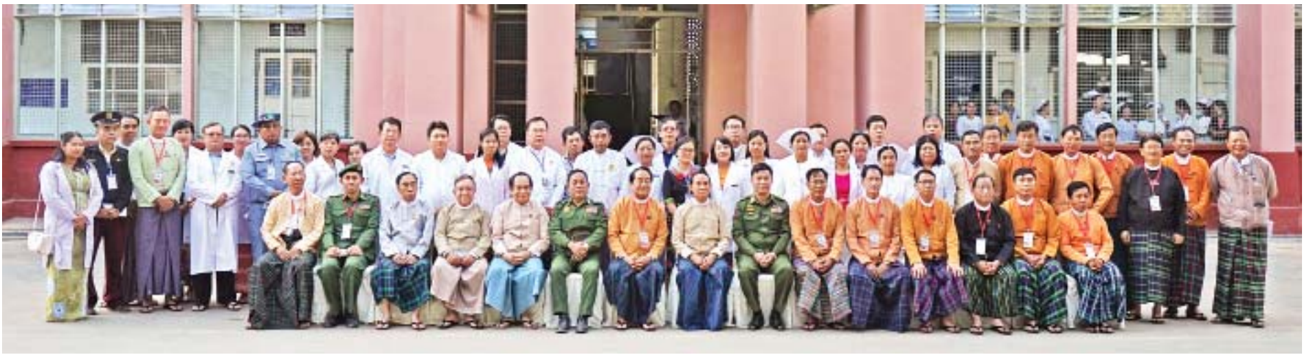
နိုင်ငံတော်သမ္မတ ဦးဝင်းမြင့်နှင့်အဖွဲ့၊ မြစ်ကြီးနားမြို့၊ ပြည်သူ့ဆေးရုံကြီးရှိ ဆေးရုံအုပ်ကြီး၊ ဆရာဝန်များ၊ သူနာပြုများ၊ ဆေးရုံဝန်ထမ်းများနှင့်အတူ စုပေါင်းမှတ်တမ်းတင်ဓာတ်ပုံရိုက်စဉ်။