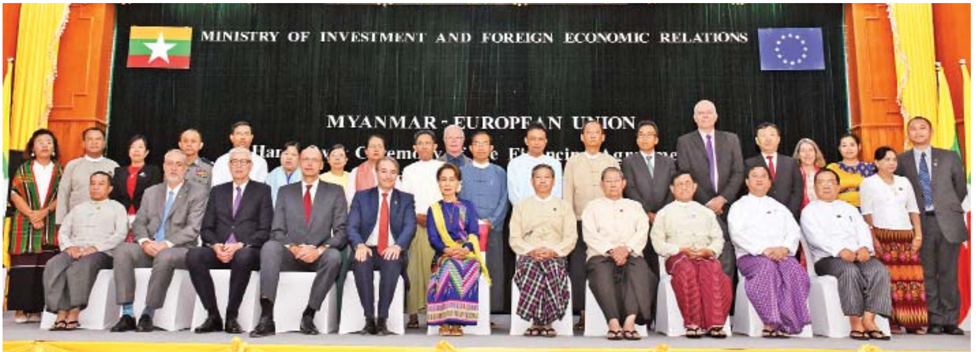
နိုင်ငံတော်၏အတိုင်ပင်ခံပုဂ္ဂိုလ် ဒေါ်အောင်ဆန်းစုကြည် အခမ်းအနားသို့ တက်ရောက်လာသူများနှင့်အတူ စုပေါင်းမှတ်တမ်းတင်ဓာတ်ပုံရိုက်စဉ်။