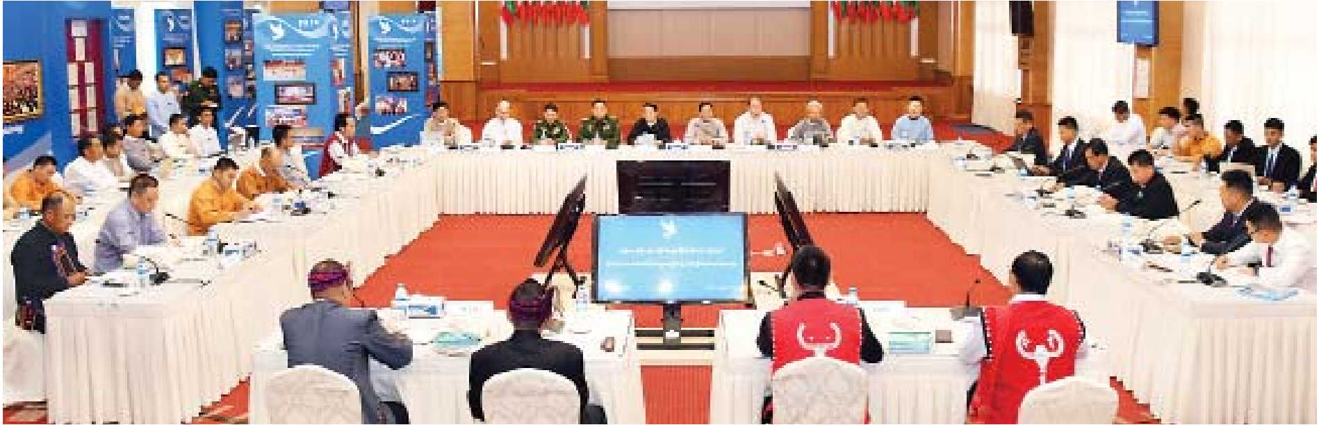
အမျိုးသားပြန်လည်သင့်မြတ်ရေးနှင့် ငြိမ်းချမ်းရေးဗဟိုဌာနနှင့် တိုင်းရင်းသားလက်နက်ကိုင်အဖွဲ့အစည်းရှစ်ဖွဲ့တို့၏ ငြိမ်းချမ်းရေးဆွေးနွေးပွဲ ကျင်းပစဉ်။