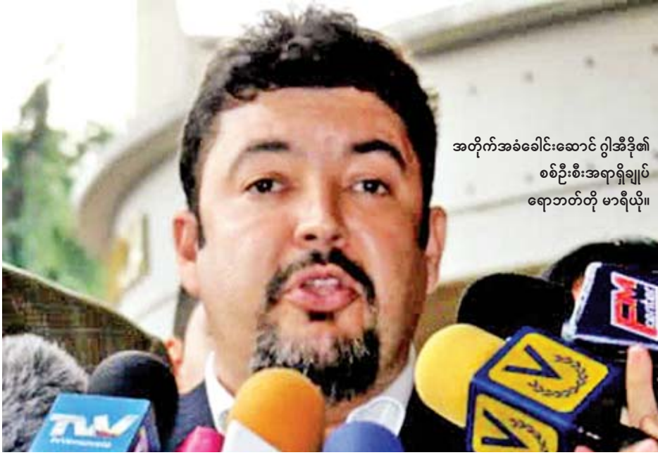
အတိုက်အခံခေါင်းဆောင် ဂွါအီဒို၏ စစ်ဦးစီးအရာရှိချုပ် ရောဘတ်တို မာရီယို။

ကာရာကတ်စ် မတ် ၂၁ ပင်နီဇွဲလားစစ်ဦးစီးအရာရှိများက အတိုက်အခံခေါင်းဆောင် ဂွါအီဒို၏ အရာရှိချုပ်အား ယနေ့ဖမ်းဆီးခဲ့ကြောင်း အတိုက်အခံခေါင်းဆောင် ဂွါအီဒိုနှင့် အတိုက်အခံအဖွဲ့က တွစ်တာစာမျက်နှာတွင် ဖော်ပြထားသည်။ အတိုက်အခံ ခေါင်းဆောင်၏ စစ်ဦးစီးအရာရှိချုပ် ရောဘတ်တို မာရီယိုသည် ကာရာကတ်စ်မြို့ရှိ သူ၏ နေအိမ်တွင်ရှိနေစဉ် ပင်နီဇွဲလားစစ်ဦးစီးအရာရှိများက ရှောင်တခင် ဝင်ရောက်ဖမ်းဆီးခဲ့ကြောင်း အတိုက်အခံခေါင်းဆောင် ဂွါအီဒိုက ဆိုသည်။