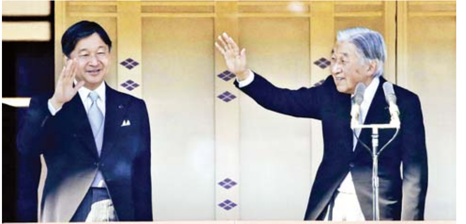
ကေရာဇ်ဘုရင်အာခီဟီတိုနှင့် မင်းသား နာယူဟီတိုတို့ကို ကေရာဇ်နန်းတော် လသာဆောင်တွင် ဇန်နဝါရီ ၁ ရက်က တွေ့ရစဉ်။