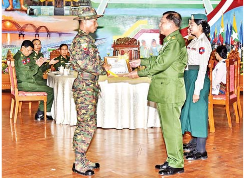
အားကစားသမားများနှင့် နည်းပြများအား ရင်းရင်းနှီးနှီး ချီးမြှင့်သည့် အခမ်းအနား အခမ်းအနားအပြီးတွင် တပ်မတော်ကာကွယ်ရေးဦးစီးချုပ် နှုတ်ဆက်ခဲ့ကြောင်း တပ်မတော်ကာကွယ်ရေးဦးစီးချုပ် သတင်းစဉ်

အခမ်းအနားအပြီးတွင် တပ်မတော်ကာကွယ်ရေး ဦးစီးချုပ်သည် နိုင်ငံ့ဂုဏ်ဆောင် တပ်မတော်သား