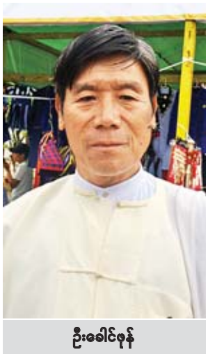
ဦးခေါင်စုန်