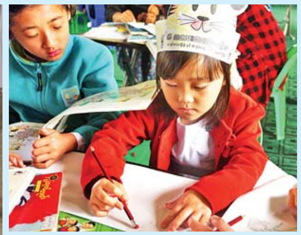
ကလေးငယ်တစ်ဦး ပန်းချီရေးဆွဲနေစဉ်။