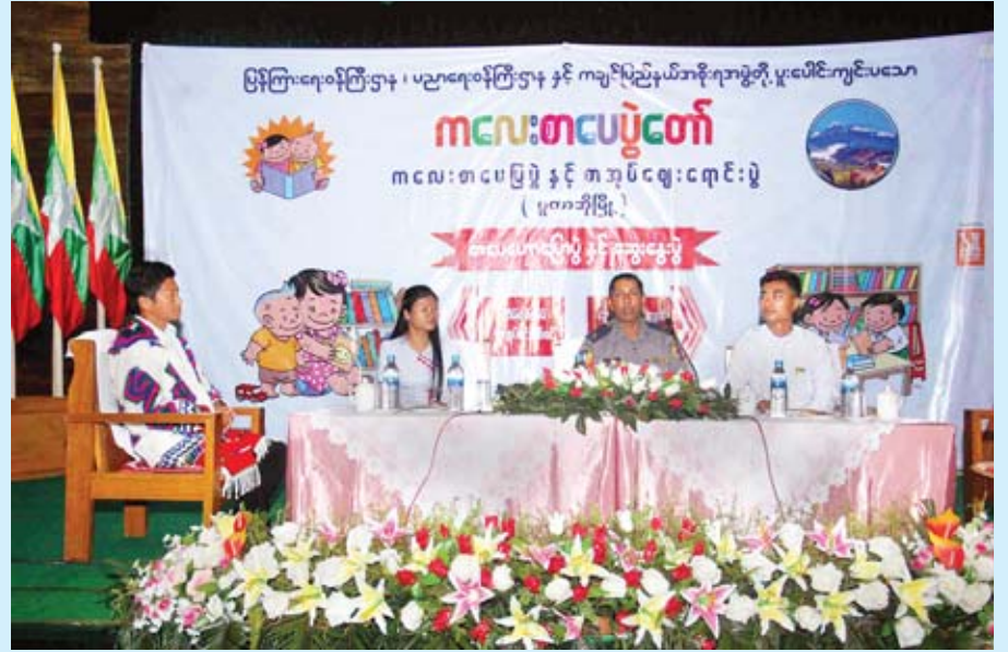
ကလေးစာပေပွဲတော်(ပူတာအို)တွင် စာပေဆွေးနွေးနေမှုကို တွေ့ရစဉ်။