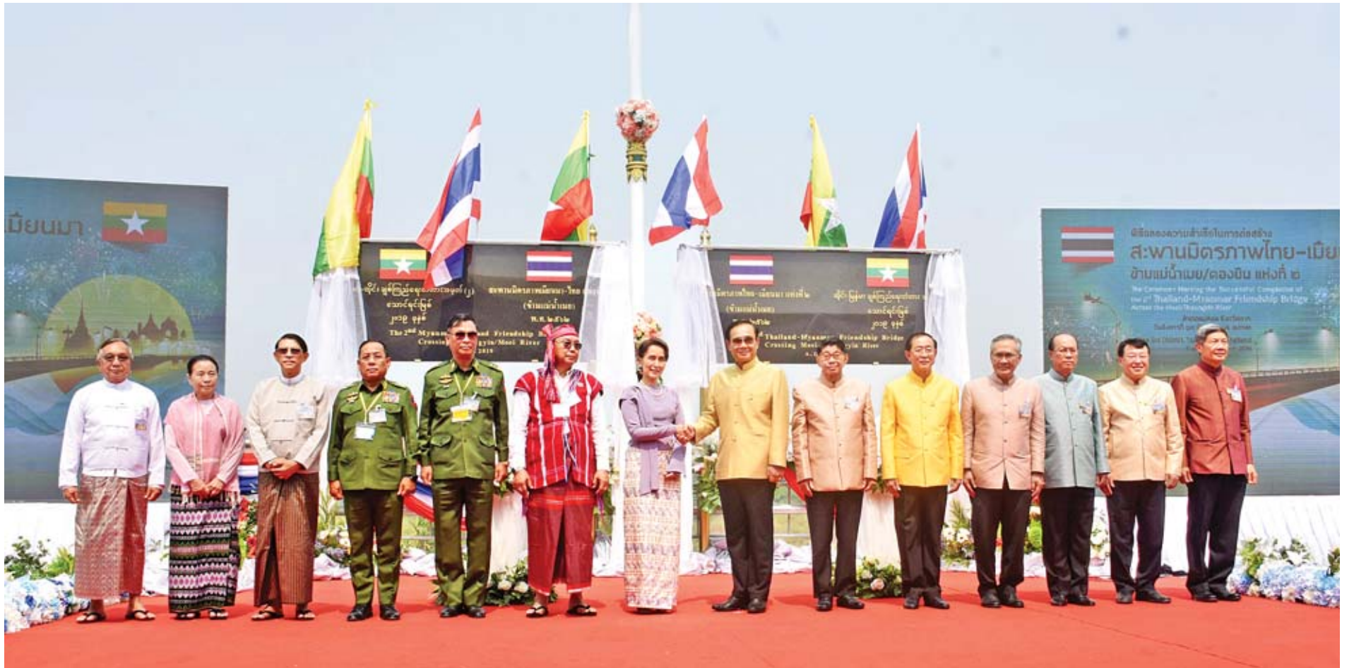
နိုင်ငံတော်၏အတိုင်ပင်ခံပုဂ္ဂိုလ် ဒေါ်အောင်ဆန်းစုကြည်၊ ထိုင်းနိုင်ငံဝန်ကြီးချုပ် မစ္စတာ ပရာယုဒ်ချန်အိုချာ၊ အမျိုးသားလွှတ်တော်ဥက္ကဋ္ဌ မန်းဝင်းခိုင်သန်း၊ မြန်မာ-ထိုင်း နှစ်နိုင်ငံ ဝန်ကြီးများ စုပေါင်းမှတ်တမ်းတင်ဓာတ်ပုံ ရိုက်ကြစဉ်။