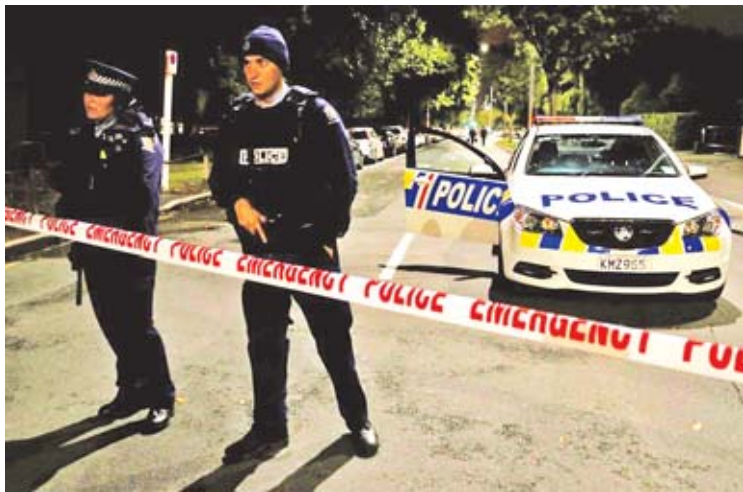
နယူးဇီလန်နိုင်ငံတွင် သေနတ်ပစ်ခတ်မှုဖြစ်ပွားခဲ့သည့် ဘာသာရေးကျောင်းရှေ့တွင် တာဝန်ကျနေသည့် ရဲတပ်ဖွဲ့ဝင်များကို တွေ့ရစဉ်။

အာဏာပိုင်များက အကြမ်းဖက်သမား သြစတြေးလျနိုင်ငံသား ဘရန်တန်တာရန် အား လက်ရဖမ်းဆီးထားပြီး လူအစုလိုက် အပြုလိုက်သတ်မှုဖြင့် တရားစွဲဆိုထားသည်။ အခင်းဖြစ်ပွားချိန်တွင် ဘရန်တန်တာရန် ထံတွင် မှတ်ပုံတင်ထားသော သေနတ် ငါးလက် တွေ့ရှိခဲ့သည်။