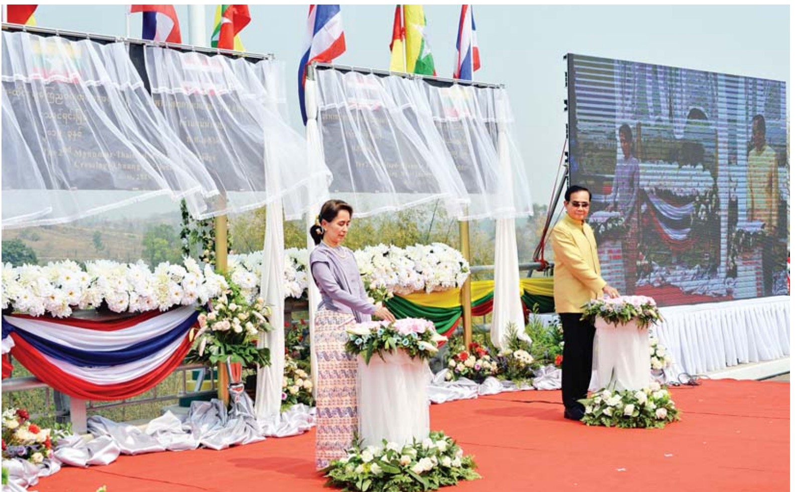
နိုင်ငံတော်၏အတိုင်ပင်ခံပုဂ္ဂိုလ် ဒေါ်အောင်ဆန်းစုကြည်နှင့် ထိုင်းနိုင်ငံဝန်ကြီးချုပ် မစ္စတာ ပရာယုဒ်ချန်အိုချာတို့ မြန်မာ-ထိုင်း ချစ်ကြည်ရေးတံတား အမှတ်(၂) တည်ဆောက်ပြီးစီးခြင်း အထိမ်းအမှတ် ကမ္ဘည်းမော်ကွန်းကို စက်ခလုတ်နှိပ် ဖွင့်လှစ်ပေးကြစဉ်။

မြဝတီ မတ် ၁၉ ကရင်ပြည်နယ် ဘားအံမြို့၌ ရောက်ရှိနေသည့် နယ်စပ်ဒေသနှင့် တိုင်းရင်းသားလူမျိုးများ ဖွံ့ဖြိုး တိုးတက်ရေး ဗဟိုကော်မတီဥက္ကဋ္ဌ နိုင်ငံတော်၏အတိုင်ပင်ခံပုဂ္ဂိုလ် ဒေါ်အောင်ဆန်းစုကြည်သည် ယနေ့ နံနက်ပိုင်းတွင် ရဟတ်ယာဉ်ဖြင့် မြဝတီမြို့သို့ ရောက်ရှိပြီး မြန်မာ-ထိုင်း ချစ်ကြည်ရေးတံတား အမှတ်(၂) ဖွင့်ပွဲအခမ်းအနားသို့ တက်ရောက် ဖွင့်လှစ်ပေးသည်။