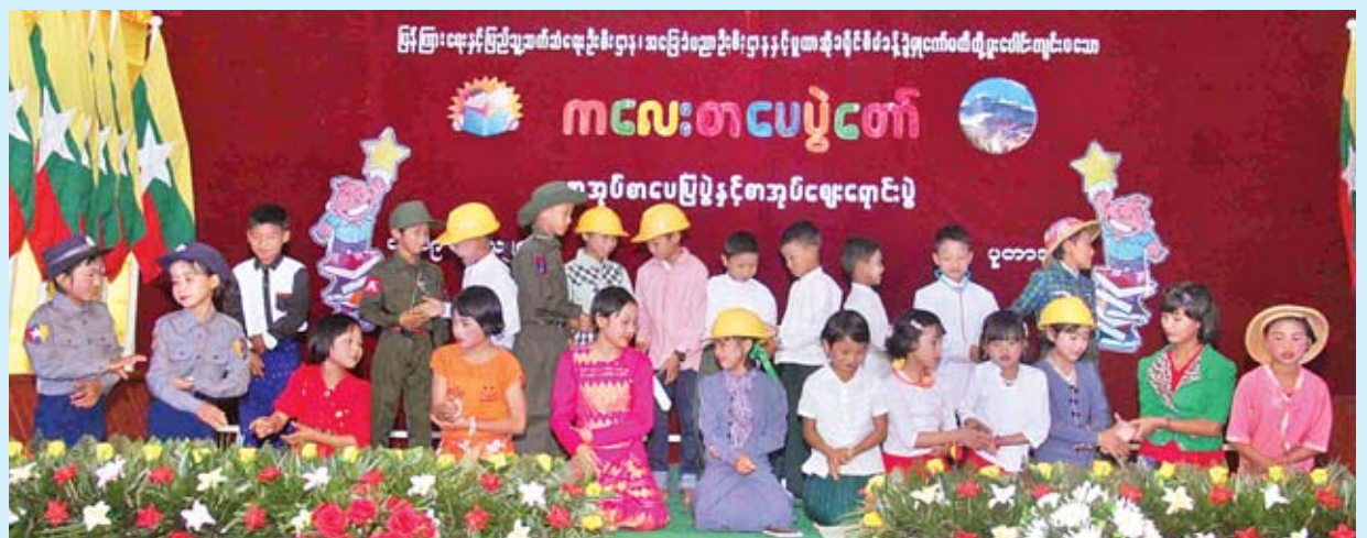
ကျောင်းသား ကျောင်းသူများ သရုပ်ဖော်တင်ဆက်နေမှုကို တွေ့ရစဉ်။