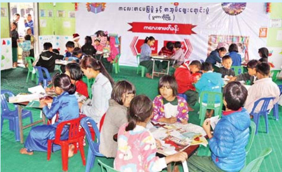
ကလေးစာဖတ်ခန်းတွင် စာပေပွဲတော်အမှတ်တရသရဖူများ ဆေးရောင်ခြယ်နေကြစဉ်။