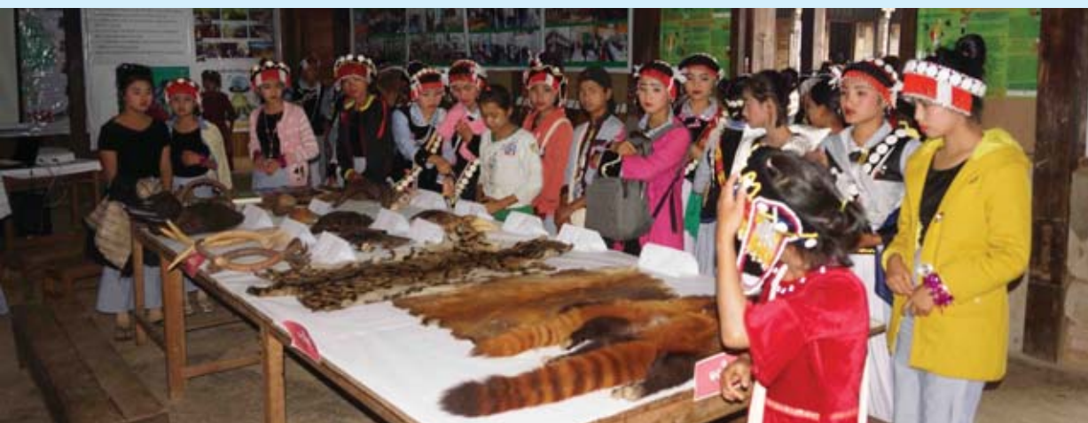
ရိုးရာယဉ်ကျေးမှုပြခန်းတွင် ကြည့်ရှုလေ့လာနေကြစဉ်။