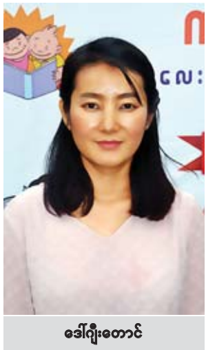
ဒေါ်ဂျိုးတောင်