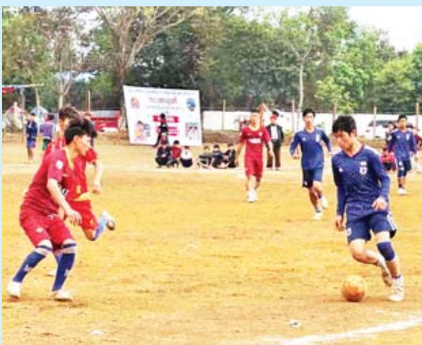
ဇူဆယ်အားကစားပြိုင်ပွဲ ကျင်းပစဉ်။