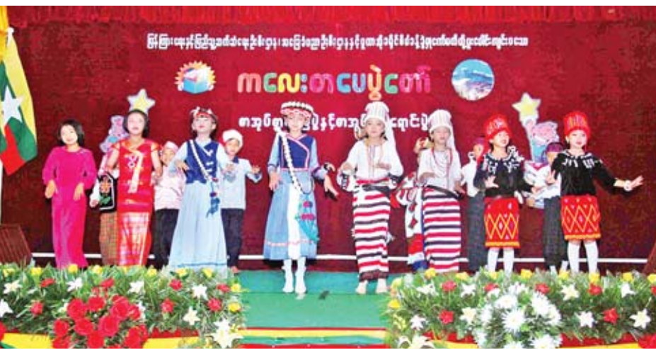
ကျောင်းသား ကျောင်းသူများက တိုင်းရင်းသားရိုးရာယဉ်ကျေးမှုအကဖြင့် ဖျော်ဖြေနေမှုကို တွေ့ရစဉ်။

အလားတူ ရဝမ်၊ လီဆူ၊ ဂျိန်းဖောနှင့် တိုင်းခမ်းတီရမ်း တိုင်းရင်းသားများ၏ ရိုးရာယဉ်ကျေးမှု ပြခန်းများ၊ ပြည်ထဲ