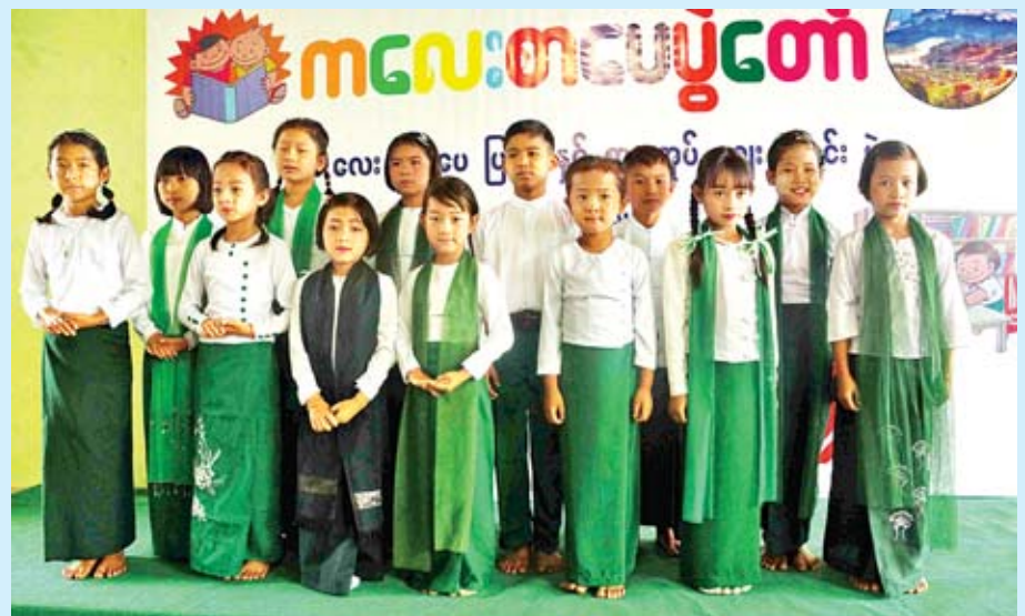
ကျောင်းသား ကျောင်းသူများ ကဗျာရွတ်ဆိုနေကြစဉ်။