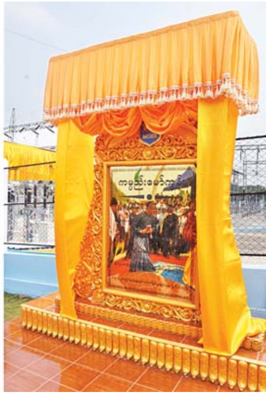
နိုင်ငံတော်၏အတိုင်ပင်ခံပုဂ္ဂိုလ် ဒေါ်အောင်ဆန်းစုကြည်၊ အမျိုးသားလွှတ်တော်ဥက္ကဋ္ဌ မန်းဝင်းခိုင်သန်းနှင့် ပြည်ထောင်စုဝန်ကြီး ဦးဝင်းခိုင်တို့ ၂၃၀/၆၆/၁၁ ကေစီ ၁၀၀ အမ်စီအေ မြဝတီပင်မဓာတ်အားခွဲရုံ ကမ္ပည်းကျောက်စာကို စက်လှေတံဆိပ်ဖွင့်လှစ်ပေးကြစဉ်။