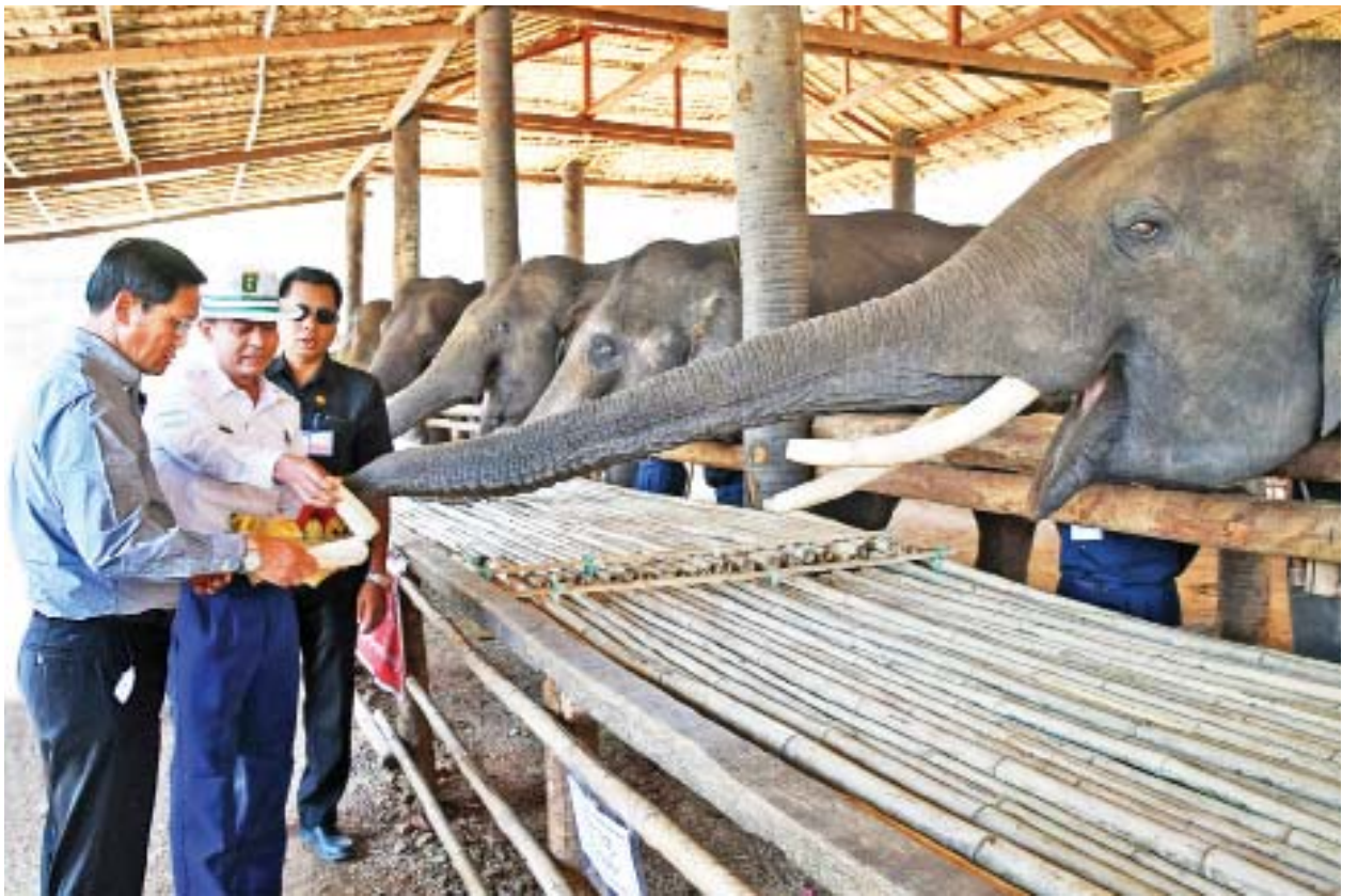
ဒုတိယသမ္မတ ဦးဟင်နရီပန်ထီးယူ ရွှေစက်တော် မန်းချောင်းအပန်းဖြေဆင်စခန်းတွင် ဆင်များအား အစာကျွေးစဉ်။

မြန်မာ့ကြယ်လိပ်သည် ကမ္ဘာ့အလှပဆုံး ကုန်းလိပ်များစာရင်းတွင် တစ်ခုအပါအဝင်ဖြစ်ပြီး မျိုးသုဉ်းလုနီးပါးလိပ်မျိုးစိတ်တစ်ခုဖြစ်ကြောင်း၊ ကမ္ဘာ့အခြား မည်သည့်နေရာတွင်မှမတွေ့ရှိရဘဲ မြန်မာနိုင်ငံအလယ်ပိုင်း ခြောက်သွေ့သစ်တောများတွင်သာတွေ့ရှိရသည့် မြန်မာလူမျိုးတို့၏ ဂုဏ်ယူဖွယ်ရာ ဇီဝရတနာဖြစ်ပါကြောင်း၊ သဘာဝတောတွင်းနေ မြန်မာ့ကြယ်လိပ်များ မျိုးသုဉ်းမှုမှ ကယ်တင်နိုင်ရန် ရွှေစက်တော် ဘေးမဲ့တောနယ်မြေအတွင်း ခြံခတ်မွေးမြူခြင်းမှ ပေါက်ဖွားလာသော မြန်မာ့ကြယ်လိပ်များအား သင့်တင့်လျောက်ပတ်သည့် ကာကွယ်ရေးနယ်မြေများသို့ ပြန်လွှတ်ပေးခြင်းကို မြန်မာနိုင်ငံသစ်တောဦးစီးဌာန သားငှက်ထိန်းသိမ်းရေးအဖွဲ့နှင့် လိပ်မျိုးစိတ်