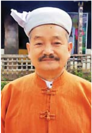
ဦးစစ်ဗလတ္တာ

ကလေးစာပေပွဲတော်လုပ်ပေးခြင်းအားဖြင့် မျိုးဆက်သစ်ကလေးတွေကို လက်ဆင့်ကမ်းပေးခြင်းပါ။ ပညာလည်းပေးနိုင်တယ်။ ဒီလိုပွဲတော်ကြောင့် စာပေပတ်သက်လို့ ဗဟုသုတတွေ တိုးလာမယ်။ စာအုပ်စာပေလည်း စိတ်ဝင်စားလာမယ်။ နောက်ပြီးတော့ မကြာခဏ သုံးနှစ်တစ်ခါ၊ လေးနှစ်တစ်ခါ လုပ်ပေးစေ