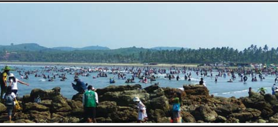
ဧရာဝတီတိုင်းဒေသကြီး ငပုတောမြို့နယ် ဟိုင်းကြီးကျွန်းမြို့ရှိ သမိုင်းဝင် ဆံတော်ရှင်မြတ်မော်တင်စွန်းဘုရား ပွဲတော်ကာလအတွင်း မြေတောင်(ခ) ငွေတောင်ပင်လယ်ကမ်းခြေ၌ အနယ် နယ်အရပ်ရပ်မှ ဘုရားဖူးလာပြည်သူ များ၊ အပန်းဖြေသူများ၊ ရေလှိုင်းစီးသူ များ၊ ကျောက်ဆောင်များတွင် အလှ ဓာတ်ပုံရိုက်သူများဖြင့် စည်ကားလျက် ရှိသည်ကို မတ် ၁၇ ရက်က တွေ့ရစဉ်။ နန်းထိုက်(ပြန်/ဆက်)

လှူဒါန်းလိုသူများသည် လူကိတ်တိုင်းလာရောက်၍ ဖြစ်စေ၊ အဆိုပါ ဆေးရုံကြီးရှိ သံယာတော်များ ပြင်ပလူနာဌာန ဖုန်း-၅၅၂၉၇၅၊ သီလရှင်များ ပြင်ပလူနာဌာန ဖုန်း-၅၄၂၇၀၆၊ လူပုဂ္ဂိုလ်များ ပြင်ပလူနာဌာန ဖုန်း-၅၅၂၅၄၂၊ ဆေးရုံအုပ်ကြီးရုံး ဖုန်း-၅၅၈၄၄၄၊ လူမှုဆက်ဆံရေးဌာနစု ဖုန်း-၅၄၁၇၉၂/၅၅၈၄၄၇ တို့သို့ တယ်လီဖုန်းဖြင့် ဖြစ်စေ ဖေပြီ ၄ ရက်အတွင်း စာရင်းပေးသွင်းနိုင် ကြောင်း သိရသည်။ သတင်း-စဉ်