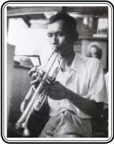
မြို့မငြိမ်း