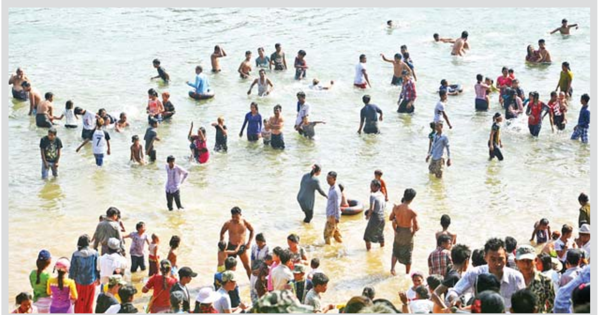
ဒုဋ္ဌဝတီမြစ်အတွင်းဝယ် ရေချိုးမယ်။

ရွှေစာရုံဗုဒ္ဓပူဇော်ဇာယဉ်တော်ကို နှစ်စဉ်နှစ်တိုင်း တပေါင်းလပြည့်နေ့ မှ လပြည့်ကျော် ၉ ရက်နေ့အထိ ကျင်းပသွားမည်ဖြစ်ရာ အနီး ပတ်ဝန်းကျင် ရှမ်းကုန်းမြေမြင့်မှ ရှမ်းတိုင်းရင်းသားများ၊ အညာဒေသ မှ ပြည်သူ့ ပြည်သားများ၊ အမြို့မြို့ အနယ်နယ်မှ လာရောက်ကြသူ များဖြင့် အထူးစည်ကား