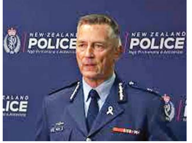
နယူးဇီလန် ရဲမင်းကြီး မိုက်ဘရိုက်။