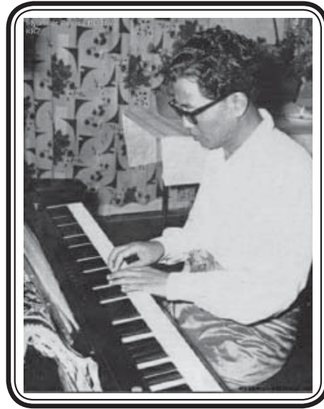
ဆရာဒဂုန်တာရာ