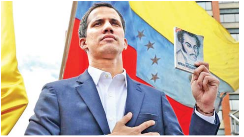
ပင်နီဇွဲလား အတိုက်အခံ ခေါင်းဆောင် ဂွါအီဒို။