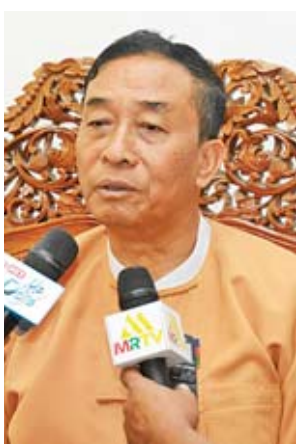
ချင်းပြည်နယ်ဝန်ကြီးချုပ် ဦးဆလင်းလျန်လွယ်