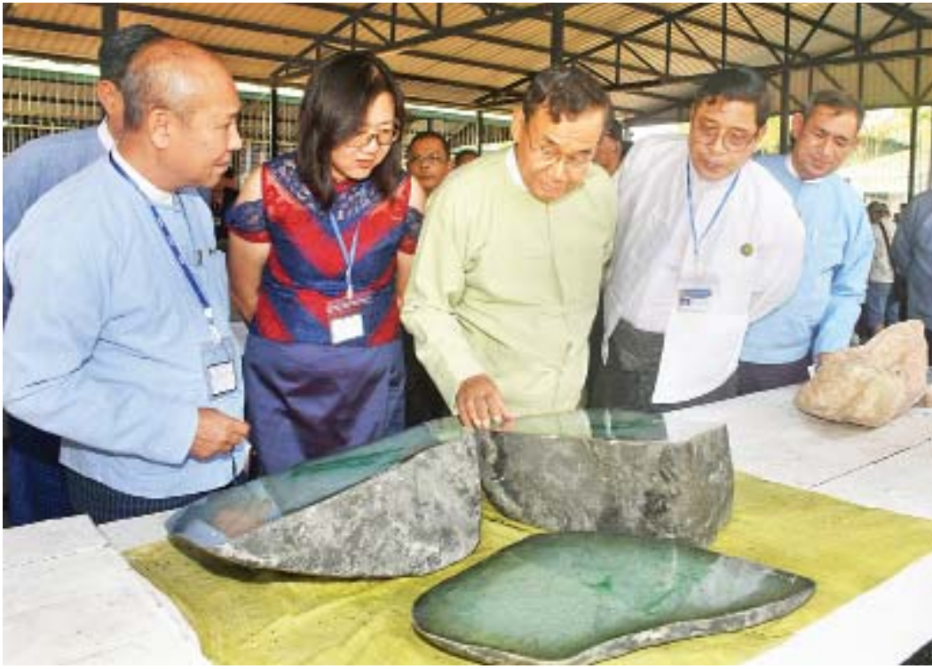
ပြည်ထောင်စုဝန်ကြီး ဦးအုန်းဝင်းနှင့် တာဝန်ရှိသူများ မဏိရတနာကျောက်စိမ်းခန်းမအတွင်း ခင်းကျင်းပြသထားသော ကျောက်စိမ်းပြခန်းများကို လှည့်လည်ကြည့်ရှုစဉ်။

နေပြည်တော် မတ် ၁၇ ၂၀၁၉ ခုနှစ်(၅၆) ကြိမ်မြောက် မြန်မာ့ကျောက်မျက်ရတနာပြပွဲ သတ္တမနေ့ကို ယနေ့တွင် နေပြည်တော်ရှိ မဏိရတနာကျောက်စိမ်းခန်းမ၌ ဆက်လက်ကျင်းပသည်။