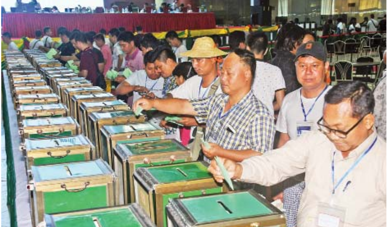
ပြည်တွင်းပြည်ပ ရတနာကုန်သည်များ ကျောက်စိမ်းအတွဲများအား အိတ်ဖွင့်တင်ဒါစနစ်ဖြင့် ဝယ်ယူနေကြစဉ်။