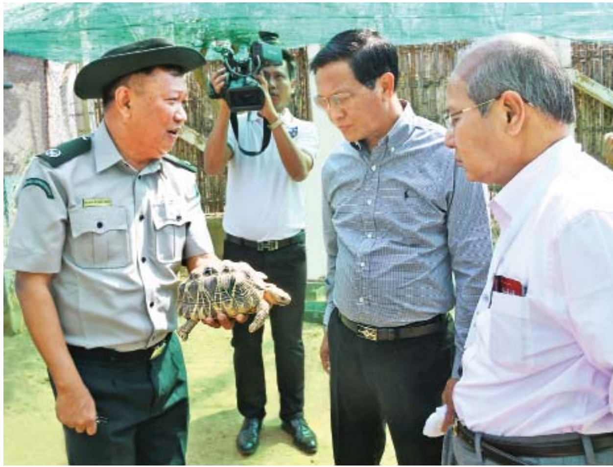
ဒုတိယသမ္မတ ဦးဟင်နရီပန်ထီးယူအား ဒုတိယညွှန်ကြားရေးမှူးချုပ် ဦးကျော်ကျော်လွင်က ရွှေစက်တော် တော်ရိုင်းတိရစ္ဆာန်ဘေးမဲ့တောဥယျာဉ်အတွင်း မြန်မာ့ကြယ်လိပ်များ မွေးမြူထားရှိမှုကို ရှင်းလင်းပြသစဉ်။

ရှင်သန်ရေးအဖွဲ့တို့က ပိုင်းဝန်းကြီးပမ်းဆောင်ရွက်လျက်ရှိကြောင်း သိရသည်။ ထို့ပြင် ရွှေစက်တော်တော်ရိုင်းတိရစ္ဆာန်ဘေးမဲ့တောသည် မြန်မာနိုင်ငံ၏ အမျိုးအစားစုံလင်လှသော ဂေဟစနစ်များနှင့် ဇီဝမျိုးစုံမျိုးကွဲများကို ထိန်းသိမ်းကာကွယ်ရန် သတ်မှတ်ဖွဲ့စည်းထားသည့် သဘာဝထိန်းသိမ်းရေးနယ်မြေ ၄၃ ခုအနက် တစ်ခုအပါအဝင်ဖြစ်ပြီး နို့တိုက်သတ္တဝါ ၁၄ မျိုး၊ ငှက် ၁၄၆ မျိုး၊ ကုန်းနေရေနေတွားသွားသတ္တဝါ ၄၃ မျိုး၊ လိပ်ပြာမျိုး ၃၉ မျိုး၊ ရေချိုငါးမျိုးစိတ် ၂၂ မျိုး၊ သစ်မျိုး ၈၉ မျိုး၊ သစ်ခွသုံးမျိုးနှင့် ဆေးဖက်ဝင် အပင် ၂၆ မျိုးရှိကြောင်း သိရသည်။