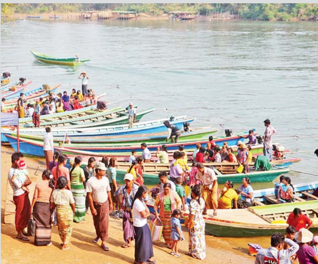
ရွှေစာရုံဗုဒ္ဓတော် လှေဆိပ်မှာ ဂြူနီဝါပြာရောင်စုံများ ပျားပန်းခပ်လျက်ပါ။