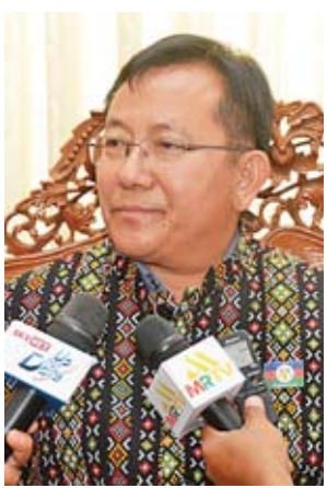
စည်ပင်သာယာရေး၊ လျှပ်စစ်နှင့် စက်မှုလက်မှုဝန်ကြီး ဦးစိုးထက်