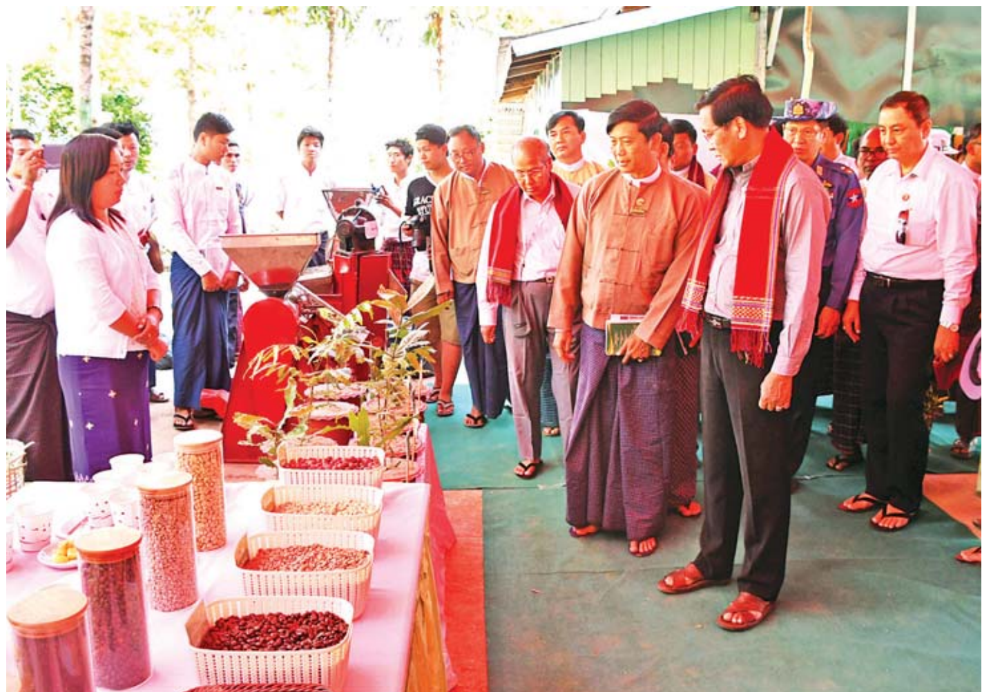
ဒုတိယသမ္မတ ဦးဟင်နရီပန်ထီးယူ မင်းဘူးခရိုင် ငမဲမြို့နယ်ရှိ ကော်ဖီနည်းပညာဖွံ့ဖြိုးရေးမြေ (နတ်ရေကန်)၌ ကော်ဖီကုန်ကြမ်းနှင့် ထုတ်ကုန်နမူနာများကို လှည့်လည်ကြည့်ရှုစဉ်။

ဒုတိယသမ္မတ ဦးဟင်နရီပန်ထီးယူသည် မတ် ၁၆ ရက်က ရွှေစက်တော် တောရိုင်းတိရစ္ဆာန်ဘေးမဲ့တော၊ မန်းချောင်းအပန်းဖြေဆင်စခန်း၊ ကော်ဖီနည်းပညာဖွံ့ဖြိုးရေးမြေ (နတ်ရေကန်) နှင့် မျိုးကောင်းမျိုးသန့် နွားမွေးမြူရေးမြေတို့အား လှည့်လည်ကြည့်ရှု၍ လိုအပ်သည်များမှာကြားသည်။