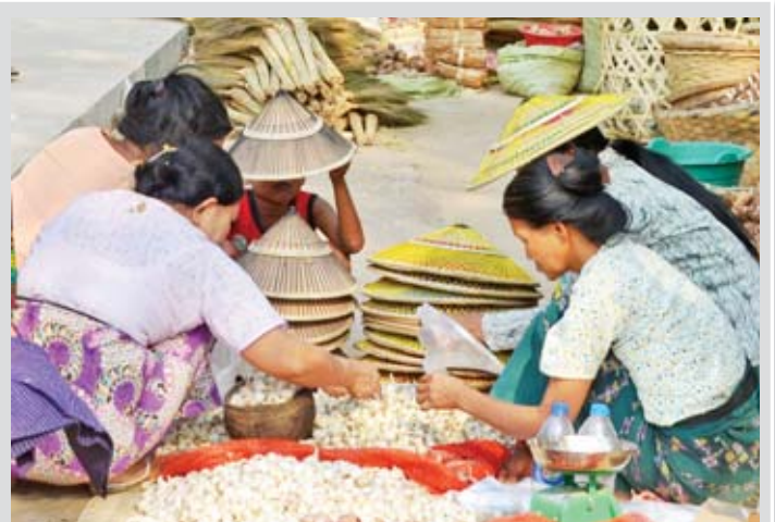
ပွဲတော်တွင် ဒေသထွက်ကုန်များ ရောင်းဝယ်ရာတွင် ဈေးသည် ဈေးဝယ် အမည်(မယ်)စုံလိုရယ်။