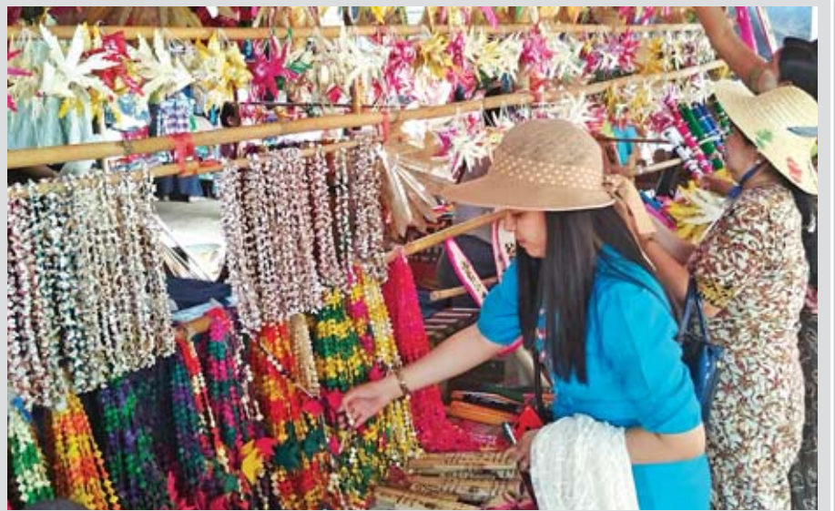
ထန်းရွက်ငါး၊ ထန်းရွက်ယပ်တောင်၊ ထန်းရွက်ပုတီးလေးများ အမှတ်တရဝယ်။