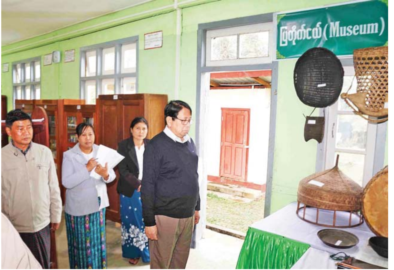
ပြည်ထောင်စုဝန်ကြီး ဒေါက်တာဖေမြင့် ပူတာအိုခရိုင် ပြန်ကြားရေးနှင့် ပြည်သူ့ဆက်ဆံရေးရုံး ပြတိုက်ငယ်အား ကြည့်ရှုစစ်ဆေးစဉ်။