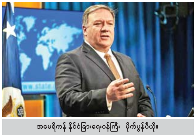
အမေရိကန် နိုင်ငံခြားရေးဝန်ကြီး မိုက်ပွန်ပီယို။