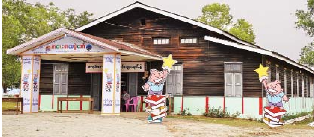
ကလေးစာပေပွဲတော်(ပူတာအို)ပွဲအခမ်းအနားနှင့် ဖျော်ဖြေရေးအစီအစဉ်များပြုလုပ်မည့် ဖုန်ကန်ရာဇီခန်းမကို တွေ့ရစဉ်။

ကလေးစာပေပွဲတော်မှာ ကလေးတွေရဲ့ ကာယ၊ ဉာဏ်ပြိုင်ပွဲတွေလည်း စီစဉ်ထားပါတယ်။ စုဖွဲ့ပြီး စုပေါင်းညီညွတ်ဆောင်ရွက်တတ်စေဖို့ Team Building ကစားပွဲတွေလည်း ပါဝင်ပါတယ်။ ကလေးစာပေပွဲတော် ကျင်းပတဲ့ နှစ်ရက်တာမှာ ဖျော်ဖြေရေးအစီအစဉ်တွေလည်း ပါဝင်မှာဖြစ်ပြီး တိုင်းရင်းသားယဉ်ကျေးမှုအဖွဲ့တွေလည်း ပါဝင်ဖျော်ဖြေသွားမှာ ဖြစ်ပါတယ်။ တိုင်းရင်းသားဘာသာစကားနဲ့ ကဗျာရွတ်ပြိုင်ပွဲနဲ့ ပုံပြောပြိုင်ပွဲတွေလည်း ပါဝင်ပါတယ်။