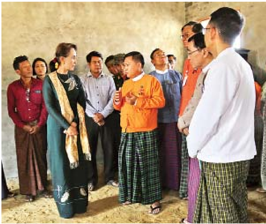
နိုင်ငံတော်၏အတိုင်ပင်ခံပုဂ္ဂိုလ် ဒေါ်အောင်ဆန်းစုကြည် ကျွန်းတောစုကျေးရွာတွင် ဒေါ်ခင်ကြည်ဖောင်ဒေးရှင်းက ဆောက်လုပ်လှူဒါန်းထားသည့် အခြေခံပညာအလယ်တန်းကျောင်း(ခွဲ)ကျောင်းဆောင်သစ်ဆောက်လုပ်နေမှုကို ကြည့်ရှုစစ်ဆေးစဉ်။

ယင်းနောက် နိုင်ငံတော်၏အတိုင်ပင်ခံပုဂ္ဂိုလ်သည် ရေဘေးဒဏ်ခံခဲ့ရသော ကျွန်းတောစုကျေးရွာ ပြန်လည်ထူထောင်ရေးအတွက် ကျေးရွာသစ်ပြန်လည်နေရာချထားသည့်နေရာတွင် ဒေါ်ခင်ကြည်ဖောင်ဒေးရှင်းက