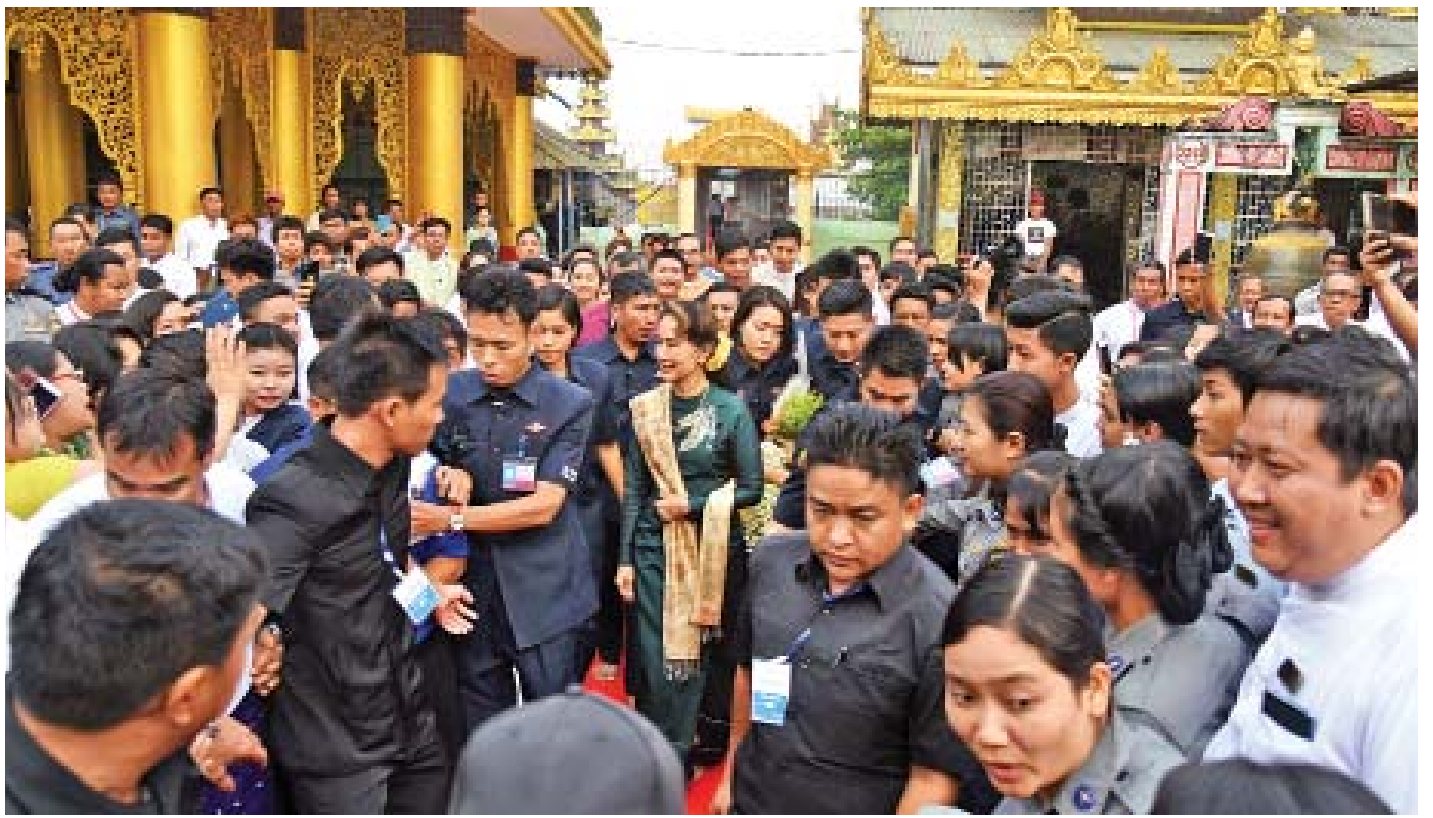
နိုင်ငံတော်၏အတိုင်ပင်ခံပုဂ္ဂိုလ် ဒေါ်အောင်ဆန်းစုကြည် ပဲခူးမြို့ ဆုတောင်းပြည့်ရွှေမော်ဓောစေတီတော်မြတ်ကြီးအား လှည့်လည်ဖူးမြော်ကြည့်စဉ်။

“နောက်အစိုးရပိုင်းပါ။ ဒီမိုကရေစီအစိုးရဆိုတာ ပြည်သူလူထုကနေပြီးတော့ ရွေးချယ်တင်မြှောက်ထားတဲ့ အစိုးရ ဒါကြောင့် ပြည်သူကို တာဝန်ခံရပါတယ်။ ပြည်သူရဲ့ အကျိုးအတွက် တာဝန်ထမ်းဆောင်ရမှာဖြစ်ပါတယ်။ ပြည်သူ့အတွက်အကောင်းဆုံး၊ နိုင်ငံအတွက် အကောင်းဆုံး ကိစ္စရပ်တွေကို လုပ်ရမှာဖြစ်ပါတယ်။ နိုင်ငံအပေါ်မှာ