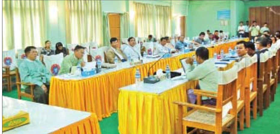
ယနေ့ကျင်းပသည့် လုပ်ငန်းညှိနှိုင်းအစည်းအဝေးတွင် ပတ်ဝန်းကျင်ထိန်းသိမ်းရေးနှင့် ရာသီဥတုပြောင်းလဲမှုဆိုင်ရာကိစ္စရပ်များနှင့်စပ်လျဉ်းသည့် အချက်(၁၂)ချက်ကို ဆွေးနွေးအတည်ပြုခဲ့ကြောင်း သိရသည်။ မျိုးသူထွန်း

ထို့နောက် အစည်းအဝေးတွင် ပတ်ဝန်းကျင်ထိန်းသိမ်းရေးနှင့် ရာသီဥတုပြောင်းလဲမှုဆိုင်ရာ အချက်အလက်များကိုတင်ပြပြီး တက်ရောက်လာကြသည့် ကော်မတီဝင်များက ဝိုင်းဝန်းဆွေးနွေးအတည်ပြုကြသည်။