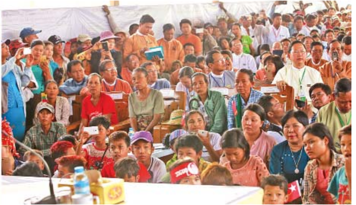
နိုင်ငံတော်၏အတိုင်ပင်ခံပုဂ္ဂိုလ် ဒေါ်အောင်ဆန်းစုကြည် ကျွန်းတောစုကျေးရွာသစ် အခြေခံပညာအလယ်တန်းကျောင်း(ခွဲ)ခန်းမဆောင်တွင် ဒေသခံပြည်သူများနှင့် တွေ့ဆုံစဉ်။

ဆောက်လုပ်လှူဒါန်းထားသည့် ကျွန်းတောစုကျေးရွာသစ် အခြေခံပညာအလယ်တန်းကျောင်း(ခွဲ)ပေ(၃၀ x ၆၀)ရှိ RC အမျိုးအစား တစ်ထပ်ကျောင်းဆောင် နှစ်ဆောင် အသစ်ဆောက်လုပ်နေမှုအား သွားရောက်ကြည့်ရှုစစ်ဆေးသည်။