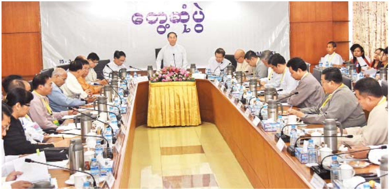
ဒုတိယသမ္မတ ဦးမြင့်ဆွေ (၂၅)ကြိမ်မြောက် မြန်မာ့စီးပွားရေးလုပ်ငန်းရှင်များနှင့် ပုံမှန်တွေ့ဆုံဆွေးနွေးပွဲတွင် အမှာစကားပြောကြားစဉ်။

နိုင်ငံတော်၏ ပို့ကုန်ဖွံ့ဖြိုးတိုးတက်ရေး အတွက် စီးပွားရေးနှင့်ကူးသန်းရောင်းဝယ် ရေးဝန်ကြီးဌာနက ဦးဆောင်ပြီး နိုင်ငံတကာ ကုန်သွယ်မှုဗဟိုဌာန၏ နည်းပညာအကူအညီ နှင့် အမျိုးသားပို့ကုန်မဟာဗျူဟာ (၂၀၁၅-၂၀၁၉)ကို ဦးစားပေးကဏ္ဍ(၇)ခုနှင့် အထောက်အကူပြုကဏ္ဍ(၄)ခု စုစုပေါင်း (၁၁)ခုကို ရွေးချယ်ပြီးအကောင်အထည်ဖော် ဆောင်ရွက်ခဲ့ရာ ယခုဆိုလျှင် (၅)နှစ်တာ ကာလပြီးဆုံးတော့မည်ဖြစ်ပြီး ထိုကဲ့သို့သည့် အောင်မြင်မှုများ ရရှိခဲ့သည်ကို အားလုံးအသိ ပင်ဖြစ်ပါကြောင်း၊ အဆိုပါ အမျိုးသား ပို့ကုန်မဟာဗျူဟာသည် မြန်မာ့ပို့ကုန်များ ဖွံ့ဖြိုးတိုးတက်ပြီး နိုင်ငံတကာနှင့် ယှဉ်ပြိုင် နိုင်စွမ်းရှိလာစေရန်အတွက် ဆောင်ရွက်သင့် သည့် လုပ်ငန်းစီမံချက်များကို လမ်းပြခြေပုံ