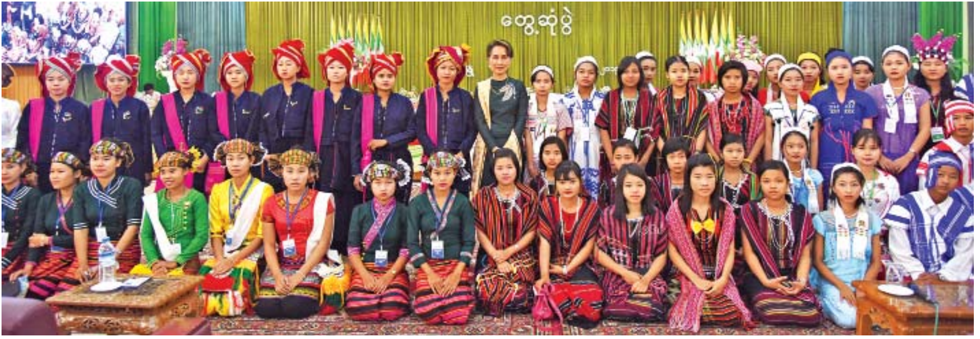
နိုင်ငံတော်၏အတိုင်ပင်ခံပုဂ္ဂိုလ် ဒေါ်အောင်ဆန်းစုကြည် ပဲခူးမြို့၌ တွေ့ဆုံပွဲသို့တက်ရောက်လာကြသည့် ဒေသခံပြည်သူများ၊ ကျောင်းသား၊ ကျောင်းသူများနှင့်အတူ စုပေါင်းမှတ်တမ်းတင်ဓာတ်ပုံရိုက်စဉ်။