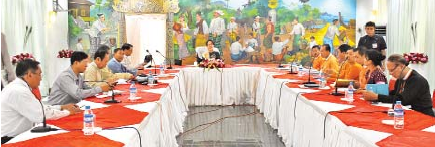
နိုင်ငံတော်၏အတိုင်ပင်ခံပုဂ္ဂိုလ် ဒေါ်အောင်ဆန်းစုကြည် ရွှေဝါထွန်းဟိုတယ်ညွှန်ခန်းမ၌ တိုင်းဒေသကြီးဝန်ကြီးချုပ်၊ တိုင်းဒေသကြီးဝန်ကြီးများ၊ တာဝန်ရှိသူများနှင့် တွေ့ဆုံစဉ်။

ပဲခူးသည် အစဉ်အလာအရ နိုင်ငံရေးပိုင်းတွင် အင်မတန်တက်ကြွသော တိုင်းဒေသကြီးဖြစ်သည့်အတွက် လေးလေးနက်နက်ဖြင့် ပြည်သူများ၏အသံကို နားထောင် ပါကြောင်း၊ နားထောင်ပြီး နိုင်ငံတွင်မည်သို့သော ပြဿနာ ရှိသည်ကို သိရသည့်အတွက် များစွာအကျိုးရှိပါကြောင်း၊ ထို့ကြောင့် မိမိတို့၏ဆွေးနွေးပွဲကို ပိုင်းဝန်းပုံပိုးပေးသည့် ပြည်သူများအားလုံးကို ကျေးဇူးတင်ပါကြောင်း၊ အများ အတွက် အကောင်းဆုံးဖြစ်ရန် ကြိုးစားသွားမည်ဖြစ်ပါ ကြောင်း ပြောကြားသည်။