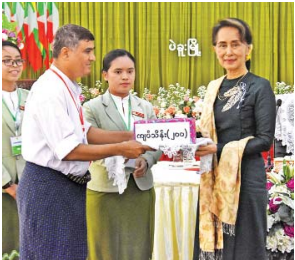
နိုင်ငံတော်၏အတိုင်ပင်ခံပုဂ္ဂိုလ် ဒေါ်အောင်ဆန်းစုကြည် ဦးတင်စိုးက ငြိမ်းချမ်းရေးလုပ်ငန်းများဆောင်ရွက် နိုင်ရေးအတွက် အလှူငွေကျပ် သိန်း ၂၀၀ ပေးအပ်လှူဒါန်းစဉ်။

ထိုနောက် ဒေသခံပြည်သူများကြိုတင်တင်ပြထား သည့် ပဲခူးခရိုင် နှစ်စဉ်နီးပါး ရေကြီးနှစ်မြုပ်သည့် ဘေးဒုက္ခ လျော့ပါးသက်သာစေရန် ကူညီဆောင်ရွက်ပေးနိုင်ရေး၊ ညောင်လေးပင်မြို့နယ်တွင် အချို့သောမူလတန်းလွန် ကျောင်းများ၌ ကျောင်းသားနှင့်ဆရာဦးရေ မမျှခြင်းနှင့် နယ်မြေဒေသလမ်းပန်းဆက်သွယ်ရေး စသည်တို့ကို ပြန်လည်သုံးသပ်၍ မူလတန်းလွန်ကျောင်းအချို့အား ကျောင်းအဆင့်ပြန်လည်လျှော့ချပေးရေး၊ ပဲခူးခရိုင် ဒိုက်ဦးမြို့နယ် စက်မှုဝန်ကြီးဌာန အချို့မှန်စက်ရုံ (ယခု ကော်စီစက်ရုံ) နိုင်ငံပိုင် စိုက်ကင်းမြေအတွင်း အသုံးပြုခြင်း မရှိသည့် မြေဧရိယာများကို ပြန်လည်စွန့်လွှတ်ပေးပါရန်နှင့် စွန့်လွှတ်ခြင်းမရှိပါက ဒေသဖွံ့ဖြိုးရေးအတွက် ဆောင်ရွက် ပေးရေး၊ ဝေါမြို့နယ်အတွင်း နွေစပါးရေရရှိရေးအတွက် မိုးယွန်းကြီးရေလှောင်ကန်ရေကို စာမျက်နှာ ၄ သို့ ❖