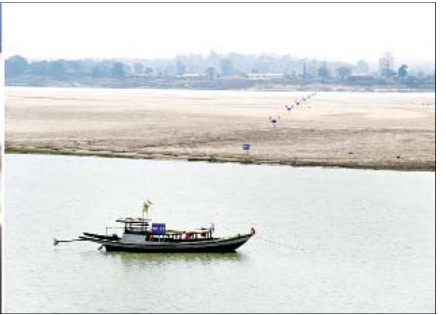
ဒုတိယသမ္မတ ဦးဟင်နရီပန်ထီးယူ သရက်-အောင်လံ ရောဝတီမြစ်ကူးတံတား တည်ဆောက်မည့်နေရာကို ကြည့်ရှုစဉ်။

များ၏ ပူးပေါင်းဆောင်ရွက်မှုလည်း လိုအပ်ပါကြောင်း၊ ထို့ပြင် နိုင်ငံအတွင်းရှိ သက်တမ်းကြာရှည်သည့် ဆည်တံခံများ ရေရှည်တည်တံ့ရေးအတွက် ပြုပြင်ထိန်းသိမ်းခြင်းလုပ်ငန်းများကို ယခင်ကထက် ပိုမိုအလေးထားဆောင်ရွက်ကြရန် လိုအပ်ကြောင်း မှာကြားသည်။