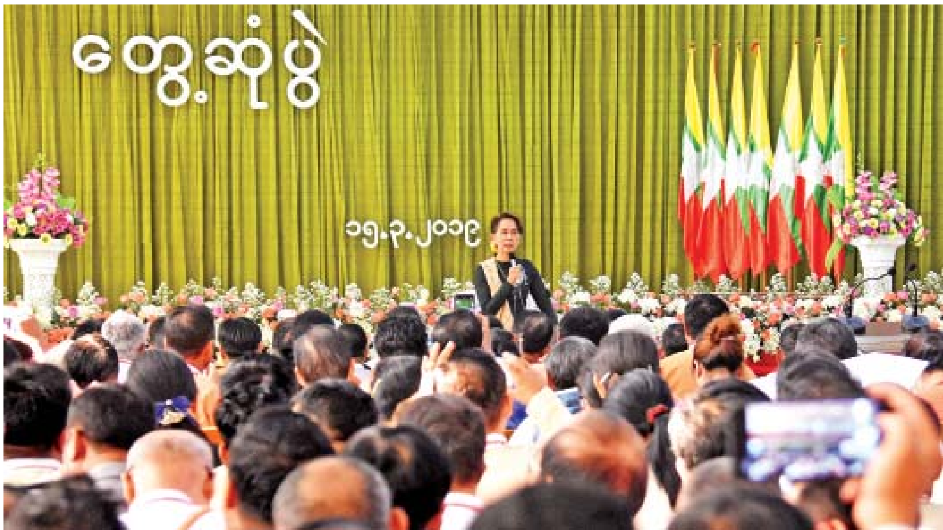
နိုင်ငံတော်၏အတိုင်ပင်ခံပုဂ္ဂိုလ် ဒေါ်အောင်ဆန်းစုကြည် ပဲခူးမြို့နယ်ခန်းမ၌ ဒေသခံပြည်သူများနှင့်တွေ့ဆုံပွဲတွင် အမှာစကားပြောကြားစဉ်။

ပဲခူးတိုင်းဒေသကြီး ပဲခူးမြို့၌ ရောက်ရှိနေသည့် နယ်စပ်ဒေသနှင့် တိုင်းရင်းသားလူမျိုးများဖွံ့ဖြိုးတိုးတက်ရေးဗဟိုကော်မတီဥက္ကဋ္ဌ နိုင်ငံတော်၏အတိုင်ပင်ခံပုဂ္ဂိုလ် ဒေါ်အောင်ဆန်းစုကြည်သည် ပြည်ထောင်စုဝန်ကြီး ဦးမင်းသူ၊ ဒေါက်တာအောင်သူ၊ ဦးအုန်းဝင်း၊ ဒေါက်တာမျိုးသိမ်းကြီးနှင့် ဒေါက်တာမြင့်ထွေး၊ တိုင်းဒေသကြီးဝန်ကြီးချုပ် ဦးဝင်းသိန်း၊ တိုင်းဒေသကြီးဝန်ကြီးများ၊ တာဝန်ရှိသူများနှင့်အတူ ယနေ့နံနက်ပိုင်းတွင် ဆုတောင်းပြည့်ရွှေမော်စောစေတီတော်မြတ်ကြီးသို့ ရောက်ရှိကြပြီး ပန်း၊ ရေချမ်း၊ ဆီမီး၊ သစ်သီး၊ ဆွမ်းနှင့် အမွှေးနံ့သာတိုင်များ ကပ်လှူပူဇော်ကြည်ညိုကြသည်။