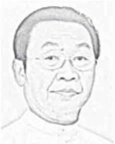
မောင်စာဂ

တောရိုင်းတိရစ္ဆာန်များဆိုင်ရာ ဧဝမဟုတ်မဟုတ် မဟာ မဲခေါင်ဒေသရှိ ဇီဝမျိုးစိတ်မျိုးကွဲများ အပေါ်တွင် ကြီးမားစွာခြိမ်းခြောက်လျက်ရှိနေကြောင်း ဥပဒေပညာရှင်တစ်ဦးက ထုတ်ပြန်သည်။ ကျားထက် သာလွန်၍ အစီရင်ခံစာတွင် ဖော်ပြထားသည်။ အဆိုပါအစီရင်ခံစာ ထုတ်ပြန်ခြင်းအခမ်းအနားကို ရန်ကုန်မြို့၊ Goethe Institute တွင် ၅-၂၀၁၉ ရက်နေ့ မွန်းလွဲ ၁ နာရီခွဲက ပြုလုပ်ခဲ့သည်။