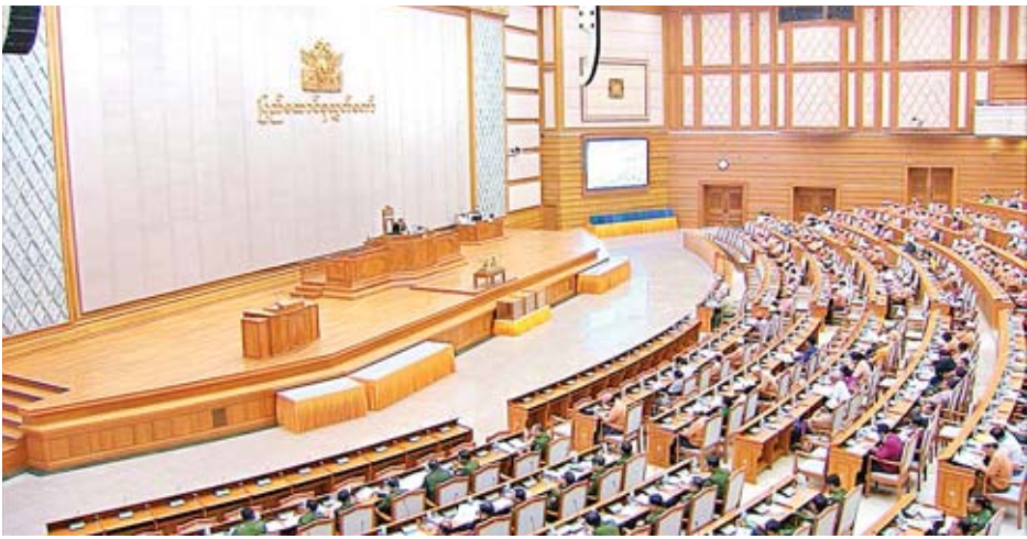
ဒုတိယအကြိမ် ပြည်ထောင်စုလွှတ်တော် (၁၁)ကြိမ်မြောက်ပုံမှန်အစည်းအဝေး (၁၅)ရက်မြောက်နေ့ ကျင်းပစဉ်။

စီမံကိန်းနှင့် ဘဏ္ဍာရေးဝန်ကြီးဌာနအနေဖြင့် ပြည်ထဲရေးဝန်ကြီးဌာန၊ မြန်မာနိုင်ငံတော်ဗဟိုဘဏ်တို့နှင့် ပူးပေါင်း၍ ဖော်ထုတ်သွားမည်ဖြစ်ပါကြောင်း၊ အခွန်တိမ်းရှောင်ကြောင်း စိစစ်တွေ့ရှိရပါက တည်ဆဲအခွန်ဆိုင်ရာဥပဒေ ပြဋ္ဌာန်းချက်များနှင့်အညီ ဒဏ်ငွေတပ်ရိုက်ပေးဆောင်စေခြင်းကို ဆောင်ရွက်သွားမည်ဖြစ်ပါကြောင်း၊ ဝန်ထမ်းများအနေဖြင့် ညွှန်ကြားချက်များနှင့်အညီ လိုက်နာဆောင်ရွက်ခြင်း ရှိ မရှိ ကို အဆင့်ဆင့်ကြီးကြပ်ဆောင်ရွက်သွားမည်ဖြစ်ပြီး ပေါ့လျောစွာ ဆောင်ရွက်သည့် ဝန်ထမ်းကို နိုင်ငံ့ဝန်ထမ်းစည်းမျဉ်းစည်းကမ်းများနှင့်အညီ ထိရောက်စွာ အရေးယူသွားမည်ဖြစ်ပါကြောင်း၊ နောင်တွင် ပုဂ္ဂလိကကုမ္ပဏီများအား ကျောက်မျက်ရတနာ