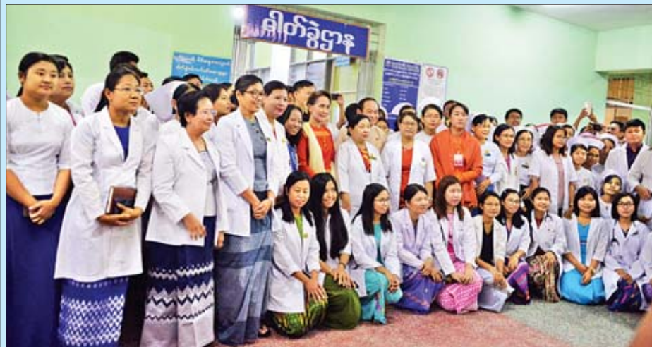
နိုင်ငံတော်၏အတိုင်ပင်ခံပုဂ္ဂိုလ် ဒေါ်အောင်ဆန်းစုကြည် ပြည်မြို့အထွေထွေရောဂါကုဆေးရုံကြီး(ခုတင်-၅၀၀) မှ ကျန်းမာရေးဝန်ထမ်းများနှင့် စုပေါင်းမှတ်တမ်းတင်ဓာတ်ပုံရိုက်စဉ်။