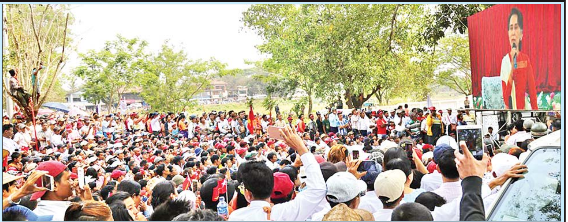
နိုင်ငံတော်၏အတိုင်ပင်ခံပုဂ္ဂိုလ် ဒေါ်အောင်ဆန်းစုကြည် သာယာဝတီမြို့၊ ဆရာစံခန်းမ၌ ဒေသခံပြည်သူများနှင့် တွေ့ဆုံရာ ခန်းမအပြင်ဘက်ရှိ ဒေသခံပြည်သူများက ပရိဂျက်တာဖြင့် ပြသထားမှုကို ကြည့်ရှုကြစဉ်။