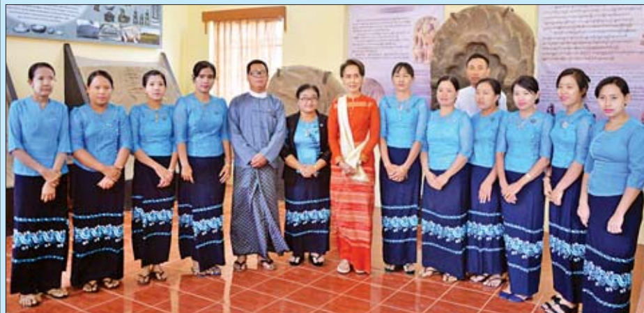
နိုင်ငံတော်၏အတိုင်ပင်ခံပုဂ္ဂိုလ် ဒေါ်အောင်ဆန်းစုကြည် သရေခေတ္တရာမြို့ဟောင်းရှိ သီရိခေတ္တရာပြတိုက်မှ ဝန်ထမ်းများနှင့် စုပေါင်းမှတ်တမ်းတင်ဓာတ်ပုံရိုက်စဉ်။