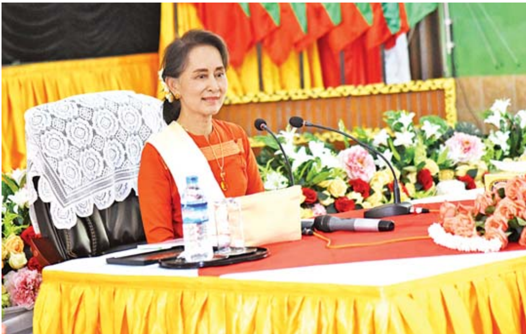
ပဲခူး မတ် ၁၄

နယ်စပ်ဒေသနှင့် တိုင်းရင်းသားလူမျိုးများဖွံ့ဖြိုးတိုးတက်ရေးဗဟိုကော်မတီဥက္ကဋ္ဌ နိုင်ငံတော်၏အတိုင်ပင်ခံပုဂ္ဂိုလ် ဒေါ်အောင်ဆန်းစုကြည်သည် ပြည်ထောင်စုဝန်ကြီး ဦးမင်းသူ၊ ဒေါက်တာအောင်သူနှင့် ဒေါက်တာမြင့်ထွေး၊ တာဝန်ရှိသူများနှင့်အတူ ယနေ့နံနက်ပိုင်းတွင် နေပြည်တော်မှ ရဟတ်ယာဉ်များဖြင့်ထွက်ခွာရာ ပဲခူးတိုင်းဒေသကြီး ပြည်မြို့သို့ ရောက်ရှိကြသည်။