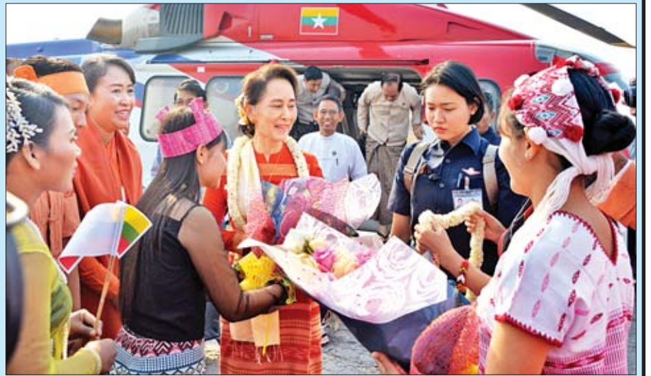
နိုင်ငံတော်၏အတိုင်ပင်ခံပုဂ္ဂိုလ် ဒေါ်အောင်ဆန်းစုကြည်အား ပြည်မြို့လေဆိပ်၌ ပြည်သူများက ပန်းစည်းဖြင့် ကြိုဆိုစဉ်။