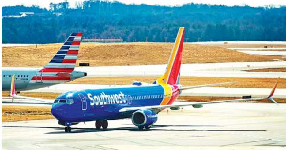
လိုင်းရင်းအေလေကြောင်းလိုင်းမှ ဘိုးရင်း ဂုဏ် အမ်အေအိတ်-၈ လေယာဉ်တို့မှ ပျက်ကျခဲ့ရသည့် အကြောင်းရင်းများမှာ ဆင်တူယိုးမှားနီးပါးမျှရှိသည်ကို ပြသခဲ့ကြောင်း

ဝါရှင်တန် မတ် ၁၄ ဘိုးရင်း ဂုဏ် အမ်အေအိတ်-၈ အမျိုးအစားလေယာဉ်များ၏ ပျံသန်းမှုများကို ကမ္ဘာတစ်ဝန်းရှိ နိုင်ငံများက ရပ်ဆိုင်းခဲ့ပြီး နောက်တွင် အမေရိကန်သမ္မတ ဒေါ်နယ်ထရန့်က ကနဒါနိုင်ငံနှင့် အခြားနိုင်ငံများနှင့်အတူ ပူးပေါင်းပြီး ၎င်းအမျိုးအစားလေယာဉ်များကို ပျံသန်းမှုရပ်ဆိုင်းခဲ့ကြောင်း အေအက်ဖ်ဒီသတင်းတွင် ဖော်ပြသည်။