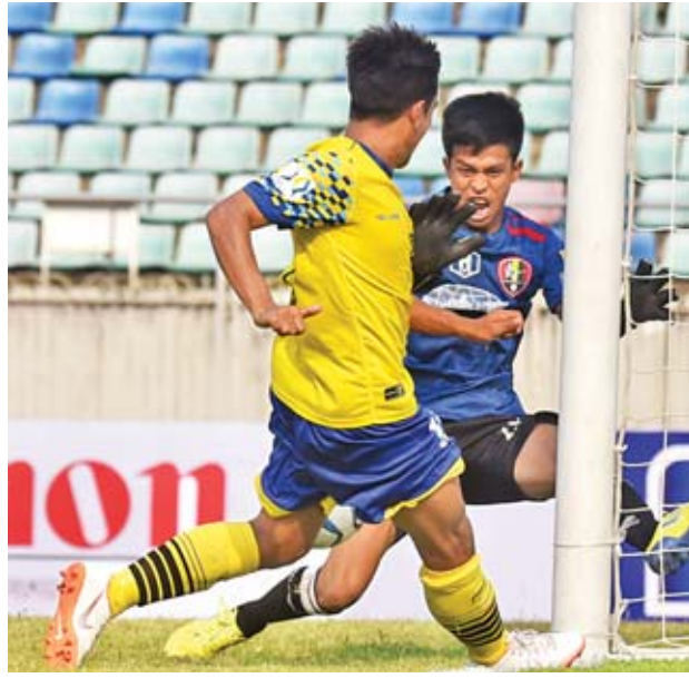
ဒဂုံအသင်း၏ ရိုးသွင်းရန် ကြိုးပမ်းမှုကို မောရဝတီရိုးသမားကာကွယ် နေစဉ်။

၂၀၁၉ ဘောလုံးရာသီ ဗိုလ်ချုပ်အောင်ဆန်းဒိုင်း ရုံးထွက်ပြိုင်ပွဲ ပထမအဆင့် (ဒုတိယနေ့)ကို ယနေ့ညနေပိုင်းက ဆက်လက်ကျင်းပရာ ဒဂုံအသင်းနှင့် ငွေကြယ်ပွင့်အသင်းတို့ နောက်တစ်ဆင့်တက်သွားသည်။