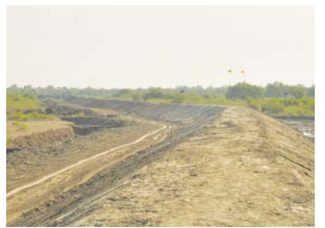
မည်ဖြစ်ကြောင်း ချောင်းဆုံမြို့နယ် မော်ဇော်ထံမှ သိရသည်။ ဆည်မြောင်းဦးစီးမှူး ဦးခင်မောင် မြို့နယ်(ပြန်/ဆက်)

၁၃၁၅၅၀၀၀၀ ဖြင့် ဇန်နဝါရီ နောက်ဆုံးပတ်က အရှည်ပေ ၁၄၀၀၀၊ အောက်ခြေအကျယ်ပေ ၄၀၊ ထိပ်ဝအကျယ် ရှစ်ပေ၊ အမြင့်ရှစ်ပေရှိ လယ်သမားတာတမံကို စတင်ပြီး တူးဖော်လျက်ရှိရာ ယခုမတ်လ နောက်ဆုံးပတ်တွင် တာတမံတူးဖော်ခြင်းလုပ်ငန်းကို အပြီးသတ်ဆောင်ရွက်နိုင်မည်ဖြစ်ကြောင်းသိရသည်။ အဆိုပါလယ်သမားတာတမံပြီးစီးသွားပါက ယခုလာမည့်စိုက်ပျိုးရာသီတွင် လယ်ဧက ၆၀၀ ကျော်အား အကျိုးပြုပေးနိုင်မည်ဖြစ်ပြီး လယ်သမားများမှာ ရေငန်ဝင်ရောက်မှု၊ ရေကြီးရေလျှံမှုဒဏ်မှ ကာကွယ်နိုင်