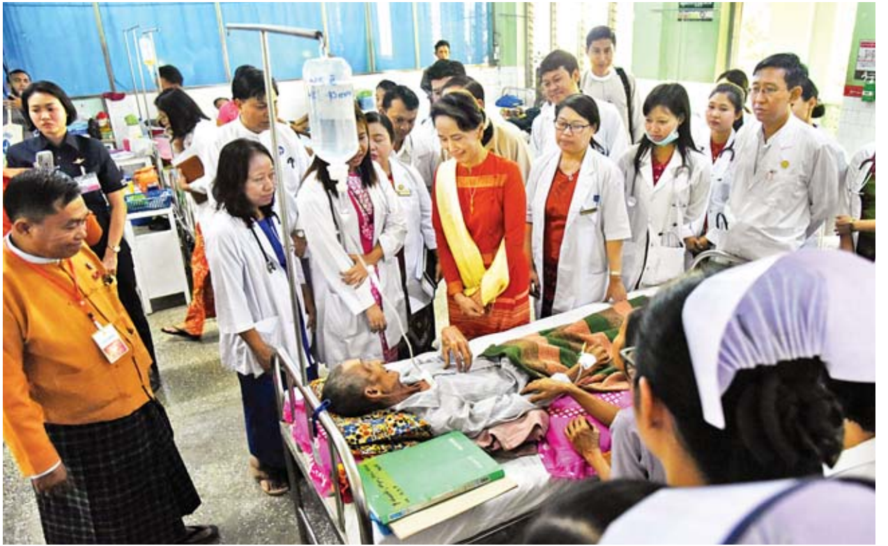
နိုင်ငံတော်၏အတိုင်ပင်ခံပုဂ္ဂိုလ် ဒေါ်အောင်ဆန်းစုကြည် ပြည်မြို့အထွေထွေရောဂါကုဆေးရုံကြီး (ခုတ်-၅၀၀) တွင် ဆေးကုသမှုခံယူနေသူများအား ကြည့်ရှုအားပေးစဉ်။

“ကျွန်ုပ်တို့နိုင်ငံဟာ အင်မတန်မှ ပြေးဖို့လိုနေတဲ့နိုင်ငံဖြစ်တဲ့အတွက်