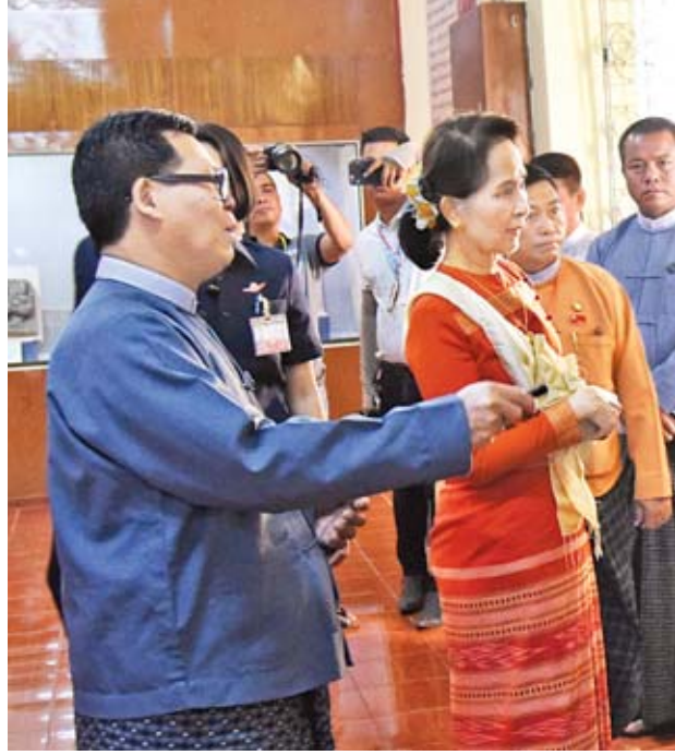
နိုင်ငံတော်၏အတိုင်ပင်ခံပုဂ္ဂိုလ် ဒေါ်အောင်ဆန်းစုကြည် သရေခေတ္တရာမြို့ဟောင်းရှိ သီရိခေတ္တရာပြတိုက်အတွင်း လှည့်လည်ကြည့်ရှုစဉ်။