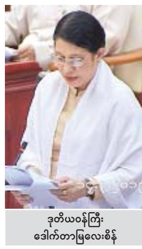
ဒုတိယဝန်ကြီး ဒေါက်တာမြလေးစိန်