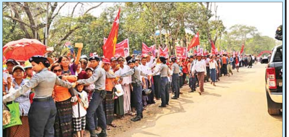
နိုင်ငံတော်၏အတိုင်ပင်ခံပုဂ္ဂိုလ် ဒေါ်အောင်ဆန်းစုကြည်အား ကြိုဆိုနေကြသည့် သာယာဝတီမြို့မှ ဒေသခံ ပြည်သူများကို တွေ့ရစဉ်။