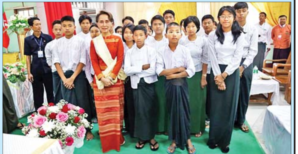
နိုင်ငံတော်၏အတိုင်ပင်ခံပုဂ္ဂိုလ် ဒေါ်အောင်ဆန်းစုကြည် သာယာဝတီမြို့၌ အခမ်းအနားသို့ တက်ရောက်လာသည့် ကျောင်းသား ကျောင်းသူများနှင့်အတူ စုပေါင်းမှတ်တမ်းတင်ဓာတ်ပုံရိုက်စဉ်။