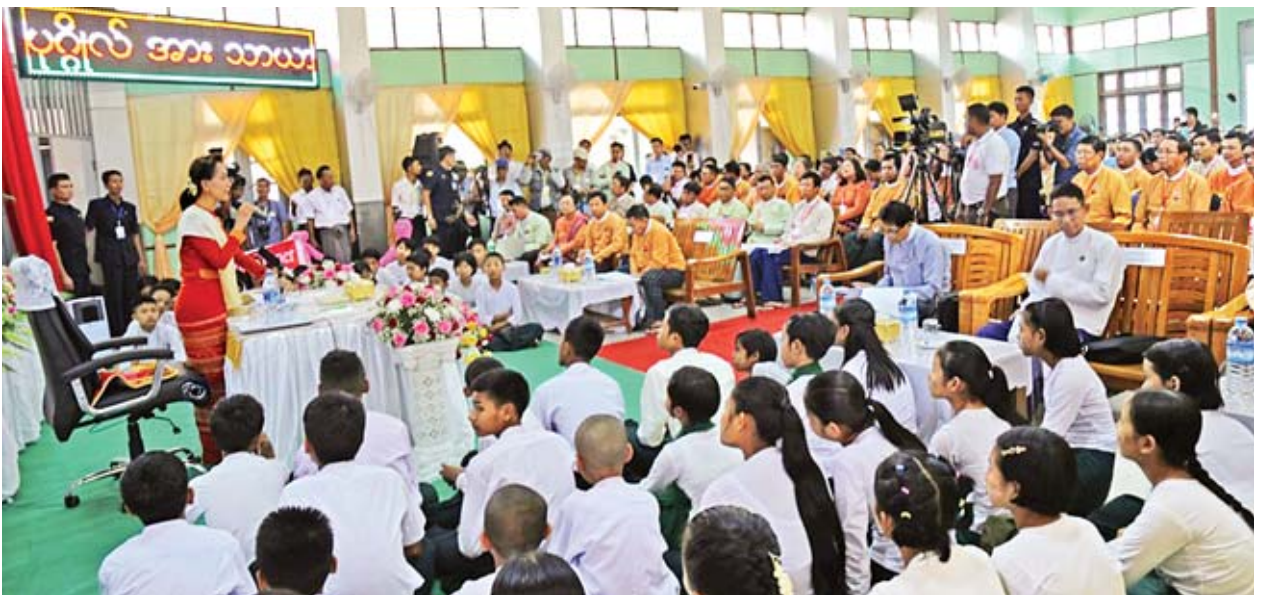
နိုင်ငံတော်၏အတိုင်ပင်ခံပုဂ္ဂိုလ် ဒေါ်အောင်ဆန်းစုကြည် သာယာဝတီမြို့၊ ဆရာစခန်းမ၌ ဒေသခံပြည်သူများနှင့် တွေ့ဆုံပွဲတွင် အမှာစကားပြောကြားစဉ်။

“ပြည်ထောင်စုတည်တံ့ခိုင်မြဲရေးကို ကူညီပေးမယ်၊ ထောက်ပံ့ပေးမယ်၊ အားပေးမယ် စီမံကိန်းတွေဟာ ကျွန်မတို့အတွက် အရေးအကြီးဆုံးစီမံကိန်း ဖြစ်ပါတယ်။ တချို့လမ်းပန်းဆက်သွယ်ရေးတွေဟာ ဦးစားပေးပါ။ ဘာဖြစ်လို့ လဲဆိုတော့ ပြည်ထောင်စုအတွင်းမှာ ဆက်သွယ်ရေးကောင်းမှ တစ်ယောက်နဲ့ တစ်ယောက် ပိုပြီးနီးစပ်လာပြီး တကယ့်ညီရင်းမောင်နှမတွေလို ဖြစ်လာစေမှာ