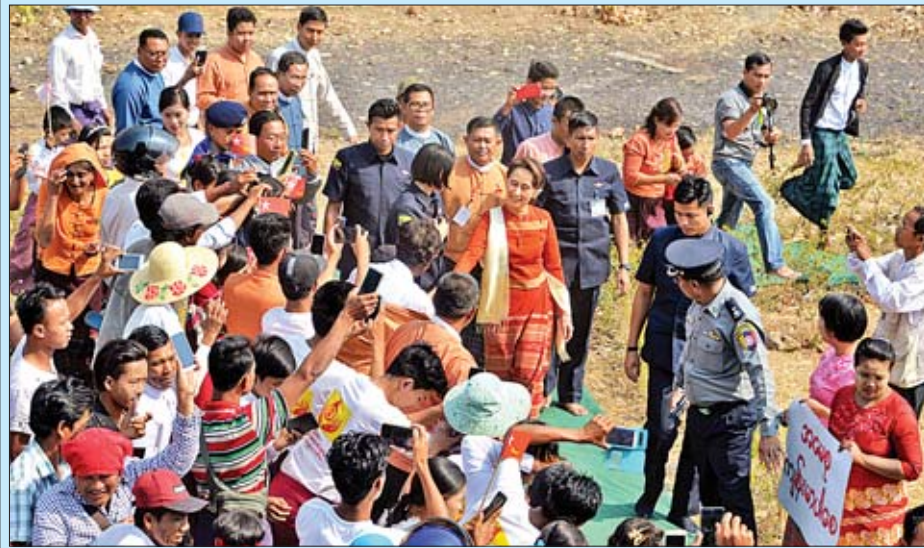
နိုင်ငံတော်၏အတိုင်ပင်ခံပုဂ္ဂိုလ် ဒေါ်အောင်ဆန်းစုကြည် ဘောဘောကြီးဘုရားသို့ သွားရောက်ဖူးမြော်ရာ လမ်းတစ်လျှောက် ဒေသခံပြည်သူများက ကြိုဆိုကြစဉ်။