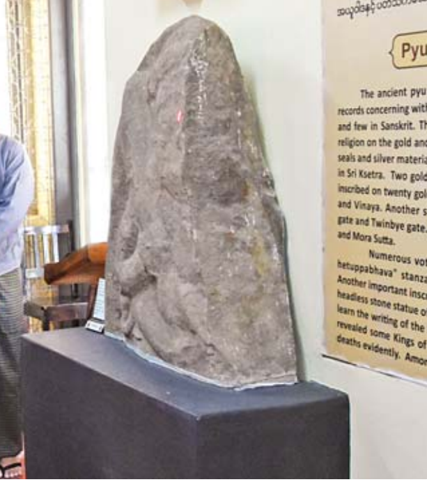
နိုင်ငံတော်၏အတိုင်ပင်ခံပုဂ္ဂိုလ် ဒေါ်အောင်ဆန်းစုကြည် သရေခေတ္တရာမြို့ဟောင်းရှိ သီရိခေတ္တရာပြတိုက်အတွင်း လှည့်လည်ကြည့်ရှုစဉ်။

စကားများဟာ ကျွန်မတို့နိုင်ငံရဲ့အကျိုးကို ဦးတည်တဲ့စကားများဖြစ်ပါစေလို့ သတိပေးချင်ပါတယ်။ တစ်ယောက်ယောက်ကို တိုက်ခိုက်ချင်လို့၊ အဖွဲ့အစည်း တစ်ခုခုကို တိုက်ခိုက်ချင်လို့၊ အစိုးရကိုတိုက်ခိုက်ချင်လို့မဟုတ်ဘဲ နိုင်ငံရဲ့ အကျိုးကိုဦးတည်ပြီးတော့ ပြောဆိုချက်တွေ၊ မေးခွန်းတွေဖြစ်စေချင်ပါတယ်။