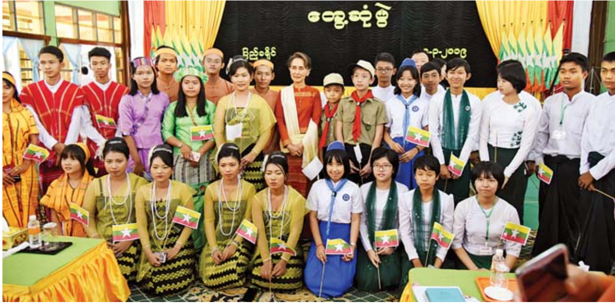
နိုင်ငံတော်၏အတိုင်ပင်ခံပုဂ္ဂိုလ် ဒေါ်အောင်ဆန်းစုကြည် ပြည်မြို့တွေ့ဆုံပွဲအခမ်းအနားသို့ တက်ရောက်လာသည့် ဒေသခံပြည်သူများ၊ ကျောင်းသား ကျောင်းသူများနှင့်အတူ စုပေါင်းမှတ်တမ်းဓာတ်ပုံရိုက်စဉ်။

ပြေးတဲ့အတွက် အနာကိုတော့ ရှောင်လို့မရဘူး။ ဒီအနာကိုခံနိုင်တဲ့ သတ္တိ၊ သဘာဝဖြစ်အောင်လို့ မိမိကိုယ်ကိုပြုစုပျိုးထောင်ရမယ်။ ဒီအတိုင်းပဲကျွန်ုပ် တို့နိုင်ငံဟာ တိုးတက်ချင်တယ်ဆိုရင် ကမ္ဘာ့အလယ်မှာ တင့်တင့်တယ်တယ်နဲ့ ဂုဏ်ရောင် တောက်ချင်တယ်ဆိုရင် အားလုံးဟာ နိစ္စဓူဝ အပင်ပန်းခံကြိုးစား ရမှာ ဖြစ်ပါတယ်။ အားလုံးအတူတူလက်တွဲပြီး သွေးစည်းရမယ်။ ရင်ဆိုင်နေရတဲ့ စိန်ခေါ်မှုတွေဟာ အတူတူပဲဖြစ်လို့ တစ်လှေတည်းသွားနေတဲ့သူတွေက မိမိ လိုချင်တဲ့ ကမ်းစပ်ကို ရောက်နိုင်တဲ့အထိ အားလုံး တက်ညီလက်ညီသွားကြမယ် ဆိုတဲ့ စိတ်ဓာတ်တွေကို ထားစေချင်ပါတယ်။ ကျွန်ုပ်တို့ တာဝန် ထမ်းဆောင် နေတဲ့ကာလမှာ လွတ်လွတ်လပ်လပ်ပြောပိုင်ခွင့်၊ ဆိုပိုင်ခွင့်၊ မေးပိုင်ခွင့်ရှိ တယ်။ အဲဒီလိုအခွင့်အရေးတွေကို အလှည့်စားမလုပ်ပါနဲ့၊ နိုင်ငံအကျိုး၊ ပြည်သူ ပြည်သားတွေ အကျိုးအတွက်သုံးပါ။ အဓိကအားဖြင့် ပြည်ထောင်စုစိတ်ဓာတ် ပိုမိုပြီးတော့ ဖွံ့ဖြိုးတိုးတက်ရေးအတွက်သုံးပါလို့ ကျွန်ုပ်အနေနဲ့မေတ္တာရပ်ခံချင်ပါ တယ်”ဟု ပြောကြားသည်။