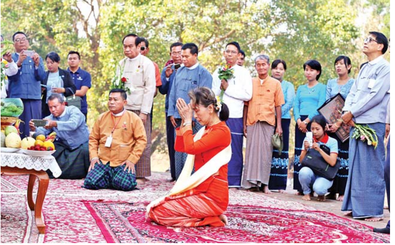
နိုင်ငံတော်၏အတိုင်ပင်ခံပုဂ္ဂိုလ် ဒေါ်အောင်ဆန်းစုကြည် ဘောဘောကြီးစေတီတော်မြတ်အား ဖူးမြော်ကြည့်ညှိစဉ်။ ဓာတ်ပုံ-သက်အောင်

“ပြည်သူလူထုနဲ့တွေ့ဆုံပွဲတွေ လုပ်တယ်ဆိုတာလည်း ပစ္စုပ္ပန်အခြေ အနေကို သုံးသပ်ချင်လို့ပါ။ ပစ္စုပ္ပန်အခြေအနေကို မှန်မှန်ကန်ကန်သုံးသပ်မှ အနာဂတ်အတွက် မှန်ကန်တဲ့ဆုံးဖြတ်ချက်တွေချနိုင်မှာဖြစ်ပါတယ်။ ပြည်သူ တွေ့ဆုံပွဲတွေအခါ ပြည်သူတွေရဲ့မေးခွန်းတွေဟာ ကျွန်မတို့အတွက် အဓိက ကဏ္ဍဖြစ်ပါတယ်။ အဲဒီလိုမေးတဲ့နေရာမှာ ကျွန်မတို့မေးသမျှမေးခွန်း၊ ပြောသမျှ