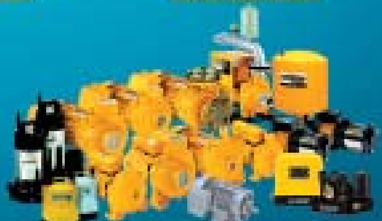
Water Pumps & Electric Motor