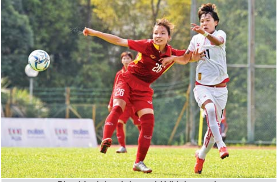
မြန်မာနှင့် ဝီယက်နမ်အသင်းတို့ ၂၀၁၇ ဆီးဂိမ်းပြိုင်ပွဲ၌ တွေ့ဆုံခဲ့စဉ်။

(သုဝဏ္ဏကွင်း) ဒဂုံ - လေးရိုး မောရဝတီ - ရိုးမရှိ ဒဂုံအသင်းအတွက် ခက်ခဲသည် ပွဲမဟုတ်ခဲ့ဘဲ အလွယ်တကူနိုင်ပွဲရယူ ကာ ဒုတိယအဆင့်သို့ တက်ရောက် ခဲ့သည်။ ပထမတန်းကလပ် မောရဝတီ အသင်းသည် MNL ကလပ် ဒဂုံ အသင်းကို ယှဉ်ကစားနိုင်ခြင်းမရှိဘဲ ရိုးပြတ်အရှုံးပေးခဲ့ခြင်းဖြစ်သည်။ ဒဂုံနှင့် မောရဝတီအသင်းသည် နိုင်ငံခြားသားကစားသမားများအပါ အဝင် အမာခံကစားသမား အများစု ဖြင့် ပွဲထွက်ခဲ့သော်လည်း ဒဂုံအသင်း က ပွဲစကတည်းက ဖိကစားနိုင်ခဲ့သည်။ မောရဝတီအသင်း ကစားကွက် တည်မရသောကြောင့် ဒဂုံအသင်း စာမျက်နှာ ၁၄ ကော်လံ ၃ သို့ □