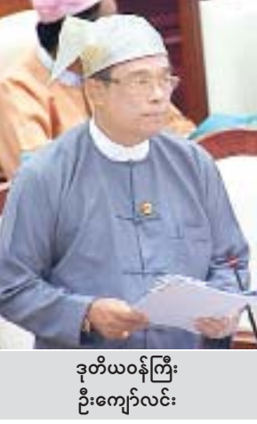
ဒုတိယဝန်ကြီး ဦးကျော်လင်း