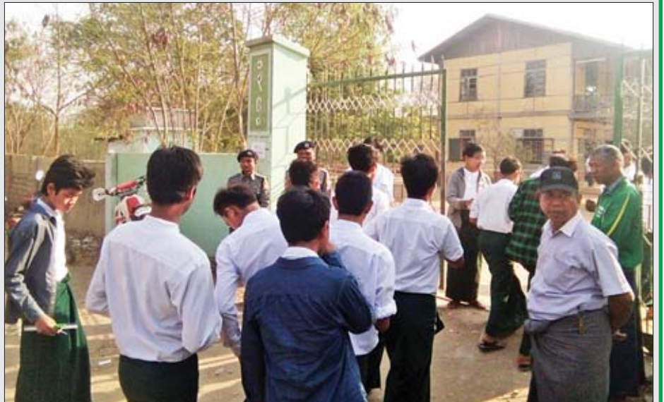
ခွားထိုးကြီးမြို့နယ်တွင် ဇီဝဗေဒဘာသာနှင့် ဘောဂဗေဒဘာသာရပ်များ ဖြေဆိုမည့် ကျောင်းသား ကျောင်းသူများကို တွေ့ရစဉ်။