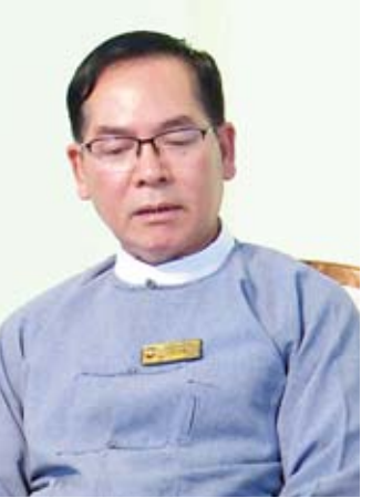
ပါမောက္ခချုပ် ဒေါက်တာဆင့်စိုး

ယှဉ်ပြိုင်မှုသည် တိုးတက်မှုကို ဆက်စပ်တယ်။ အဲဒီတော့ ယှဉ်ပြိုင်မှု အခင်းအကျင်း တစ်ခုရဲ့အောက်မှာ ကျွန်တော်တို့ အဆင့်မြင့်ပညာရေးရဲ့ ပညာရေးအဆင့် အတန်းတွေဟာလည်း တိုးတက်လာမယ်။ ယခင်က ကျွန်တော်တို့ တက္ကသိုလ်တွေရဲ့ စီမံခန့်ခွဲမှုတွေက အဆင့်ဆင့်သော စီမံခန့်ခွဲမှုတွေရဲ့အောက်မှာ နှစ်ပေါင်းများစွာ လမ်းညွှန်ချက်တွေပေါ် မူတည်ပြီးတော့ အကောင်အထည်ဖော်တယ်ဆိုတဲ့ လုပ်ငန်းစဉ်ပဲ ကျွန်တော်တို့ ဆောင်ရွက်ခဲ့တယ်။ ဒီနေ့ တက္ကသိုလ်တွေဟာ ကိုယ့်တက္ကသိုလ်ကောင်စီ၊ ကိုယ့်တက္ကသိုလ်ရဲ့ ပညာရေးအဖွဲ့၊ စီမံခန့်ခွဲရေးအဖွဲ့တွေနဲ့ ကိုယ်ကိုယ်တိုင်လုပ်ကြရမယ်ဆိုတော့ ဒီနေ့အတွေ့အကြုံအရ ကျွန်တော်တို့လိုနေတယ်။ အဲဒီတော့ ကျွန်တော်တို့ ဒီလိုနေတဲ့ကွက်လပ်ကို ပါမောက္ခချုပ်များကော်မတီက တက္ကသိုလ်တစ်ခု သူတက္ကသိုလ်နဲ့သူ လွတ်လွတ်လပ်လပ်နဲ့ ကဏ္ဍအသီးသီးမှာ စီမံခန့်ခွဲနိုင်ဖို့ လုပ်ရမယ့်အလုပ်တွေ၊ လုပ်ငန်းစဉ်တွေကို ကျွန်တော်တို့ လုပ်ပေးဖို့၊ ကူညီပေးဖို့လိုတယ်လို့ ဒီလိုပဲဖြစ်ပါတယ်။ နောင်တစ်ချိန်မှာ တက္ကသိုလ်တွေဟာ ဒီမှာဆိုရင် လုပ်ငန်းကော်မတီ ကိုးရဲ့ ဖွဲ့စည်းပုံပါတယ်။ အဲဒီလုပ်ငန်းကော်မတီ ကိုးရဟာ တက္ကသိုလ်တစ်ခု တည်ထောင်လိုရင် လုပ်ရမယ့် အဓိကကျတဲ့ လုပ်ငန်းစဉ်ကြီးတွေကိုပဲ အခြေခံပြီးတော့ လုပ်ငန်းကော်မတီအနေနဲ့ ဖွဲ့စည်းထားတာဖြစ်ပါတယ်။