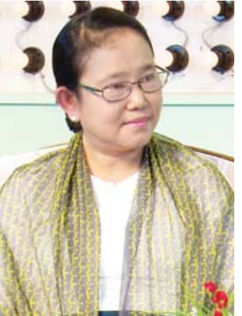
ပါမောက္ခချုပ် ဒေါက်တာမိမိသက်သွင်