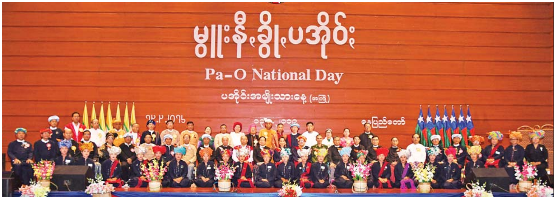
နိုင်ငံတော်၏အတိုင်ပင်ခံပုဂ္ဂိုလ် ဒေါ်အောင်ဆန်းစုကြည်၊ ပြည်သူ့လွှတ်တော်ဥက္ကဋ္ဌ၊ အမျိုးသားလွှတ်တော်ဥက္ကဋ္ဌ၊ ပြည်သူ့လွှတ်တော်ဒုတိယဥက္ကဋ္ဌ၊ ပြည်ထောင်စုဝန်ကြီးများ၊ အခမ်းအနားသို့ တက်ရောက်လာကြသည့် တိုင်းရင်းသားလူမျိုးရေးရာဝန်ကြီးများ၊ ပအိုဝ်းကိုယ်ပိုင်အုပ်ချုပ်ခွင့်ရဒေသဦးစီးအဖွဲ့ဝင်များ၊ ပအိုဝ်းအကြီးအကဲများ စုပေါင်းမှတ်တမ်းတင်ဓာတ်ပုံရိုက်ကြစဉ်။

ရန် ကြိုးစားနေပါကြောင်း၊ ဒီမိုကရေစီဖက်ဒရယ် ပြည်ထောင်စုသည် ပြည်သူလူထုကို အခြေခံသည့် နိုင်ငံတစ်ခုဖြစ်ပါကြောင်း၊ ထို့ကြောင့် ပြည်သူလူထု၏ စွမ်းအားများ၊ စိတ်နေစိတ်ထားများသည် အဓိကဖြစ်ပါကြောင်း၊ ဒီမိုကရေစီ မဟုတ်သည့်နိုင်ငံများတွင် အစိုးရက အဓိကဆိုသော်လည်း ဒီမိုကရေစီနိုင်ငံများတွင် အစိုးရကို တင်မြှောက်ထားသည့် ပြည်သူများကသာ အဓိကဖြစ်ပါကြောင်း၊ ထို့ကြောင့် ပြည်သူများ၏ အစွမ်းအစ၊ သတ္တိနှင့် မှန်ကန်မှုသည် ဒီမိုကရေစီနိုင်ငံတစ်ခုအတွက် အဓိကလိုအပ်ချက်ဖြစ်ပါကြောင်း၊ ယင်းအဓိကလိုအပ်ချက်ကို ရယူနိုင်ရန်အတွက်၊ ဖြည့်ဆည်းပေးနိုင်ရန်အတွက် အားလုံး ညီညီညွတ်ညွတ်ဖြင့် လက်တွဲဆောင်ရွက်ပါက