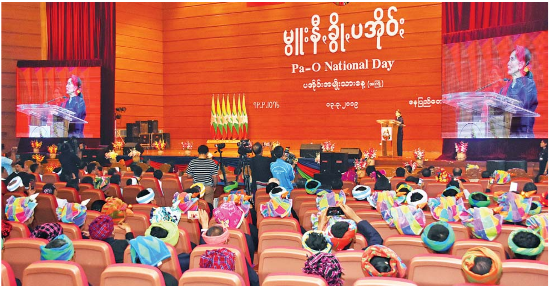
နိုင်ငံတော်၏အတိုင်ပင်ခံပုဂ္ဂိုလ် ဒေါ်အောင်ဆန်းစုကြည် နှစ်(၇၀)ပြည့် ပအိုဝ်းအမျိုးသားနေ့ (အကြို)အခမ်းအနားတွင် မိန့်ခွန်းပြောကြားစဉ်။

နှစ်(၇၀)ပြည့် ပအိုဝ်းအမျိုးသားနေ့(အကြို)အခမ်းအနားကို ယနေ့ညနေပိုင်းတွင် နေပြည်တော်ရှိ မြန်မာအပြည်ပြည်ဆိုင်ရာကွန်ပင်းရှင်းပဟိုဌာန(၂)၌ ကျင်းပရာ နိုင်ငံတော်၏အတိုင်ပင်ခံပုဂ္ဂိုလ် ဒေါ်အောင်ဆန်းစုကြည် တက်ရောက်မိန့်ခွန်း ပြောကြားသည်။