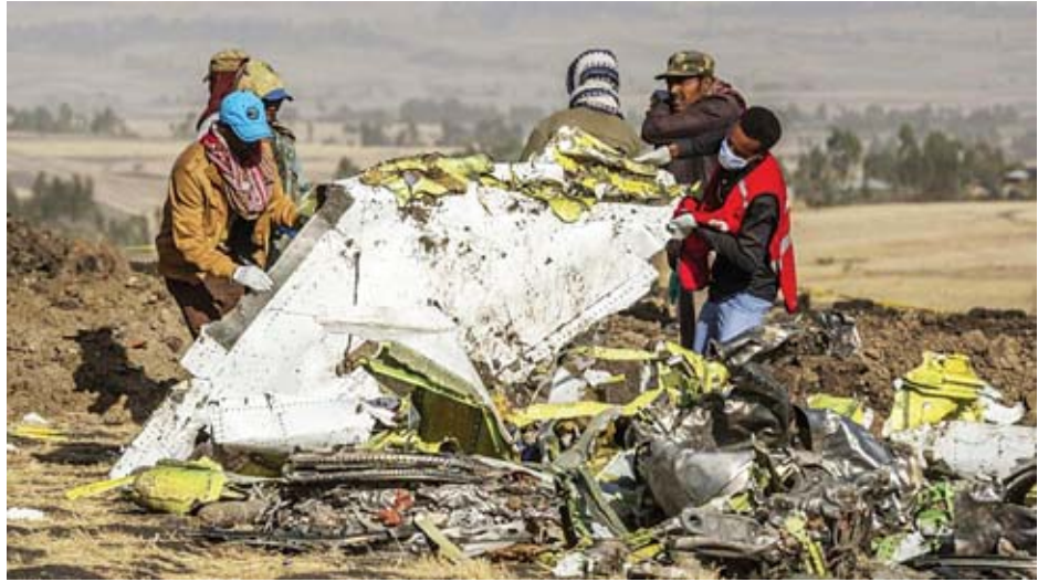
ပြုလုပ်မည်ဖြစ်ကြောင်း ပြောကြားခဲ့သည်။ မည်သည့်နိုင်ငံ သို့ ပေးပို့မည်ဆိုသည်ကို ဘိုးရင်းကုမ္ပဏီအနေဖြင့် ဆုံးဖြတ်ချက်ချမှတ်ရမည်ဖြစ်သည်ဟု ၎င်းကဆက်လက် ပြောကြားခဲ့သည်။ အေအက်ဖ်ပီ

အိသီယိုးပီးယားလေကြောင်းလိုင်းမှ ပြောရေးဆိုခွင့် ရှိသူ အာစ်ရတ်ဘီဂါရောက ပျက်ကျသွားသည့် ဘိုးရင်း 737 Max 8 လေယာဉ်၏ လေယာဉ်အချက်အလက် မှတ်တမ်းများကို ဥရောပသို့ ပေးပို့ကာ စစ်ဆေးမှုများ