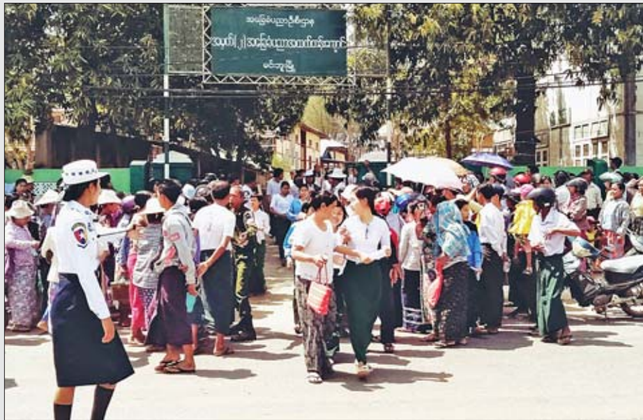
အထက(၂)မင်းဘူးတွင် တက္ကသိုလ်ဝင်စာမေးပွဲ သိပ္ပံဘာသာတွဲနောက်ဆုံးနေ့ဖြေဆိုပြီး ကျောင်းသား ကျောင်းသူများ ကို ယာဉ်အန္တရာယ်ကင်းရှင်းစေရန် ဆောင်ရွက်ပေးနေစဉ်။