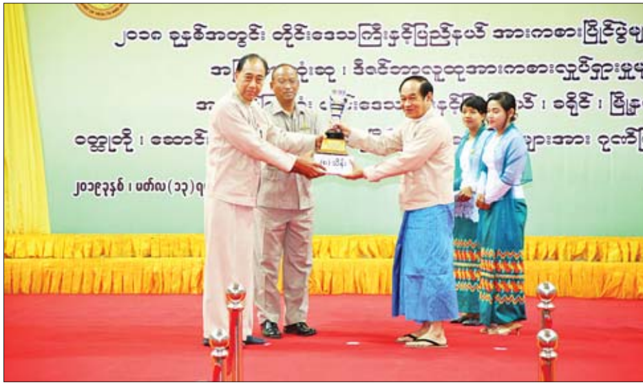
ပိုမိုအကျိုးရှိရန်နှင့် အားကစားပြိုင်ပွဲများတွင် အောင်မြင်မှု များ ပိုမိုရရှိရန်အတွက် အထူးအရေးကြီးသော အာဟာရ ဖွံ့ဖြိုးမှုလုပ်ငန်းများကိုလည်း မဟာဗျူဟာများနှင့် စီမံချက် များချမှတ်ကာ အရှိန်အဟုန်ဖြင့် ဆက်လက်ဆောင်ရွက်

အခမ်းအနားတွင် မြန်မာနိုင်ငံအိုလံပစ်ကော်မတီ ဥက္ကဋ္ဌ ပြည်ထောင်စုဝန်ကြီး ဒေါက်တာမြင့်ထွေးက ဝန်ကြီးဌာနအနေဖြင့် “ကိုယ်လက်လှုပ်ရှားဆေးတစ်ပါး” ဆောင်ပုဒ်နှင့်အညီ ဝန်ကြီးဌာနများ၊ တိုင်းဒေသကြီးနှင့် ပြည်နယ်များ၌ ပြည်သူများ အားကစားလှုပ်ရှားမှုကို စိတ်ပါဝင်စားစွာ ပါဝင်လှုပ်ရှားကြရေးအတွက် လူထု ပညာပေးစည်းရုံးရေးလုပ်ငန်းများ ဆောင်ရွက်ခြင်း၊ ပြည်သူများ အားကစားလေ့ကျင့်မှု အထောက်အကူပစ္စည်း ကိရိယာများကို လက်လှမ်းမီရေးအတွက် ဖြည့်ဆည်း ပေးခြင်းတို့ကို အရှိန်အဟုန်ဖြင့် ဆောင်ရွက်လျက်ရှိပါ ကြောင်း၊ ကိုယ်လက်လှုပ်ရှား အားကစားပြုလုပ်ရာတွင်