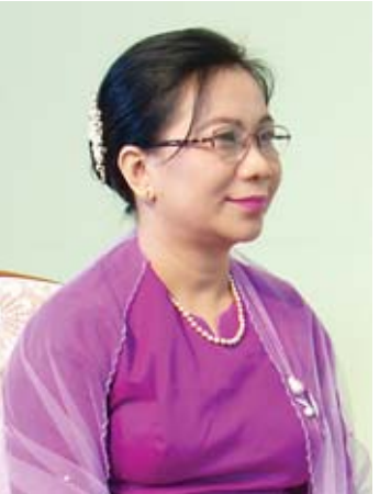
ပါမောက္ခချုပ် ဒေါက်တာရီရီဝင်း