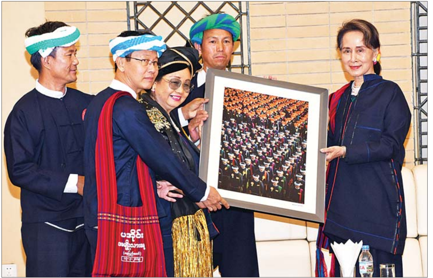
နိုင်ငံတော်၏အတိုင်ပင်ခံပုဂ္ဂိုလ် ဒေါ်အောင်ဆန်းစုကြည်ထံ ပအိုဝ်းတိုင်းရင်းသားများက အမှတ်တရလက်ဆောင်ပေးအပ်စဉ်။

သီချင်းထဲတွင်လည်း တို့စည်းလုံးမှု အင်အားဖြစ်မည် ဟု သီဆိုသွားသည်ကို ကြားလိုက်ပါကြောင်း၊ စည်းလုံးမှု အင်အားဖြစ်မည်ဆိုသည်မှာ အမှန်ဖြစ်ပါကြောင်း၊ မိမိတို့ နိုင်ငံသည် ပြည်ထောင်စုဖြစ်ပါကြောင်း၊ ပြည်ထောင်စုဆိုသည် ဝေါဟာရသည် အင်မတန်မှ လှပသည့် ဝေါဟာရ ဖြစ်ပါကြောင်း၊ စုပေါင်းပြီးထူထောင်ထားသည့် တိုင်းပြည်ကြီးဟု အဓိပ္ပာယ်ရပါကြောင်း၊ စုပေါင်းပြီး ထူထောင်ထားသည့် တိုင်းပြည်သည် ညီညွတ်မှုကို အခြေခံပါကြောင်း၊ ညီညွတ်မှု၏အရင်းခံမှာ မေတ္တာနှင့်သစ္စာ ဖြစ်ပါကြောင်း၊ တစ်ဦးနှင့်တစ်ဦး မေတ္တာထားနိုင်မှ တစ်ဦးအပေါ်တစ်ဦး