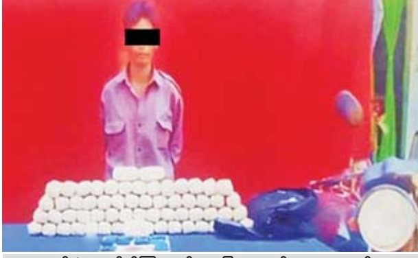
တွမ်အဲအား စိတ်ကြွရူးသွပ်ဆေးပြားများနှင့်အတူ တွေ့ရစဉ်။

အလားတူ ယင်းနေ့ မွန်းလွဲ ၁၂ နာရီ ၄၅ မိနစ်တွင် မူးယစ်တပ်ဖွဲ့ ၂၂ မူဆယ်မှ တပ်ဖွဲ့ဝင်များပါဝင်သော ပူးပေါင်းအဖွဲ့သည် မူဆယ်မြို့ စွမ်းစော် ရပ်ကွက် စွမ်းစော်(၃)လမ်း စိန်ကမ္ဘာတိုက်တန်း အခန်းအမှတ်(G-8)နေ ညီထွန်း၏နေအိမ်ကို ရှာဖွေရာ စိတ်ကြွရူးသွပ်ဆေးပြား ၆၀၇၀ ကိုလည်းကောင်း