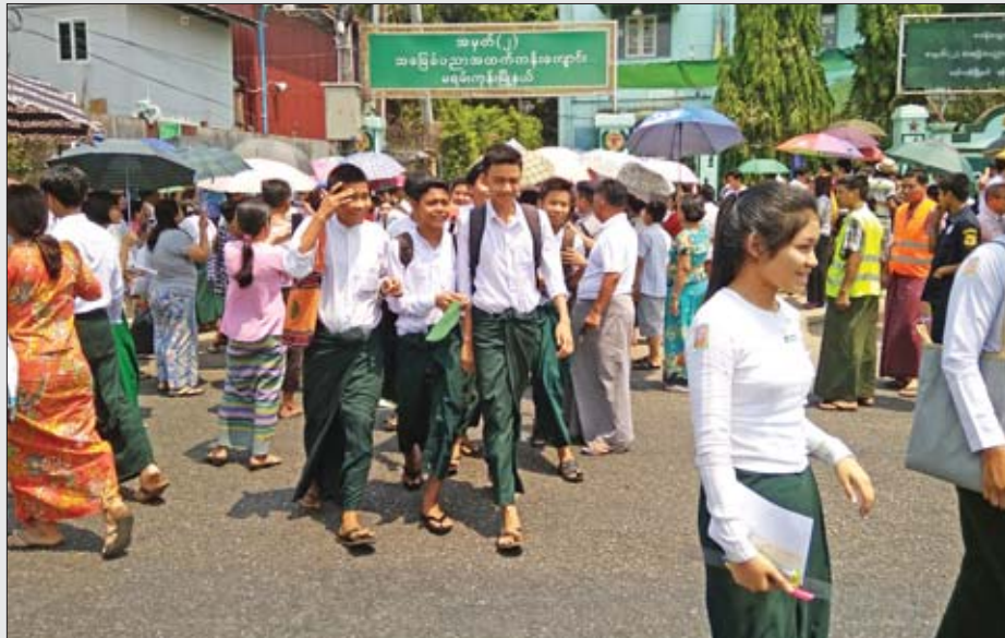
အထက(၂)မရမ်းကုန်းတွင် ဇီဝဗေဒဘာသာနှင့် ဘောဂဗေဒဘာသာရပ်များ ဖြေဆိုပြီး ပြန်လည်ထွက်ခွာလာသည့် ကျောင်းသား ကျောင်းသူများကို တွေ့ရစဉ်။