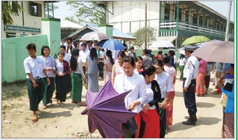
အထက(၂)ဘူးသီးတောင်တွင် ဇီဝဗေဒဘာသာနှင့် ဘောဂဗေဒဘာသာရပ်များဖြေဆိုပြီး ပြန်လည်ထွက်ခွာလာသည့် ကျောင်းသား ကျောင်းသူများကို တွေ့ရစဉ်။