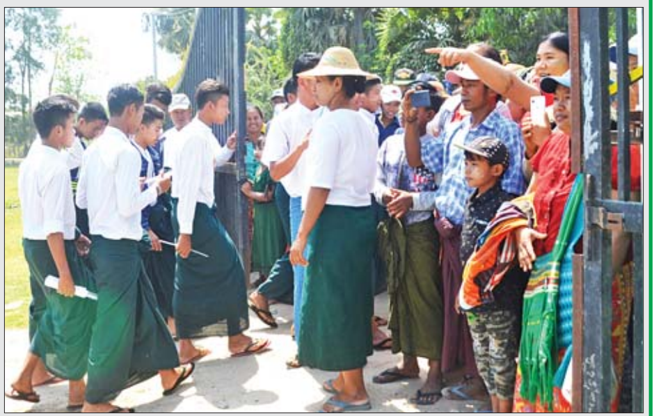
မတ္တရာမြို့နယ် သုံးဆယ်ပေးရွာ အခြေခံပညာအထက်တန်းကျောင်းတွင် တက္ကသိုလ်ဝင်စာမေးပွဲဖြေဆိုပြီး ပြန်လည် ထွက်ခွာလာသည့် ကျောင်းသား ကျောင်းသူများကို တွေ့ရစဉ်။