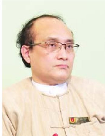
ပါမောက္ခချုပ် ဒေါက်တာဇော်ဝေစိုး

ဒေါက်တာဆင့်စိုး။ ။ အခုကျွန်တော်တို့တက္ကသိုလ်တွေ အတွက်က အမျိုးသားပညာရေး ဥပဒေရဲ့ ပြဋ္ဌာန်းချက်တွေရဲ့အောက်မှာ အမျိုးသားပညာရေးမူဝါဒကော်မရှင်ရဲ့ မူတွေနဲ့အညီ ပညာရေးပန်းတိုင်ကို အားလုံးကြိုးစားပြီးတော့ ဆောင်ရွက်နေကြတယ်။ ဒီလို ဆောင်ရွက်တဲ့အခါမှာ တက္ကသိုလ်တွေအနေနဲ့ လွတ်လပ်တဲ့ သင်ကြားမှု၊ သင်ယူမှုနဲ့ လွတ်လပ်တဲ့ စီမံခန့်ခွဲမှုတွေ ကျွန်တော်တို့ကိုယ်တိုင်ကျင့်သုံးပြီးတော့ ဆောင်ရွက်ရမယ်ဆိုတာ တော်တော်လေး အဓိကကျပါတယ်။ ဒါမှလည်းပဲ ကျွန်တော်တို့ မျှော်မှန်းတဲ့ ယှဉ်ပြိုင်တဲ့ အခင်းအကျင်းတစ်ခုပါ။