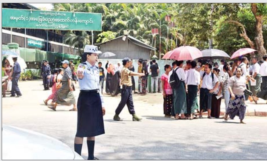
အထက(၁)မင်္ဂလာတောင်ညွန့် တက္ကသိုလ်ဝင်စာမေးပွဲ သိပ္ပံဘာသာတွဲ နောက်ဆုံးနေ့တွင် ကျောင်းသား ကျောင်းသူများ ယာဉ်အန္တရာယ်ကင်းရှင်းစေရန် ဆောင်ရွက်ပေးနေစဉ်။