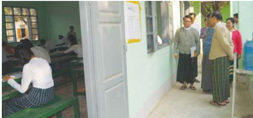
စီမံဆောင်ရွက်ထားရှိမှုများကို ရှင်းလင်းတင်ပြသည်။ ၂၅ ဦးရှိပြီး တောဂဗေဒဘာသာရပ်တွင် ဖြေဆိုသူ ၅၂၇၇ ဦး၊ ပျက်ကွက် ၂၆၆ ဦးရှိကြောင်း သိရသည်။ မြို့နယ်(ပြန်/ဆက်) ဇီဝဗေဒဘာသာရပ်တွင် ဖြေဆိုသူ ၆၈၀၊ ပျက်ကွက်

နေပြည်တော်ကောင်စီ ဥက္ကဋ္ဌ ဒေါက်တာမျိုးအောင်သည် နေပြည်တော်ကောင်စီဝင်များဖြစ်သည့် ဦးတင်ထွန်း၊ ဦးအေးမောင်စိန်နှင့် အတူ မတ် ၁၃ ရက် နံနက်ပိုင်းက လယ်ဝေးမြို့နယ်အတွင်းရှိ စာစစ်ဌာနများတွင် တက္ကသိုလ်ဝင်စာမေးပွဲ ဖြေဆိုနေမှုများကို သွားရောက်ကြည့်ရှုသည်။