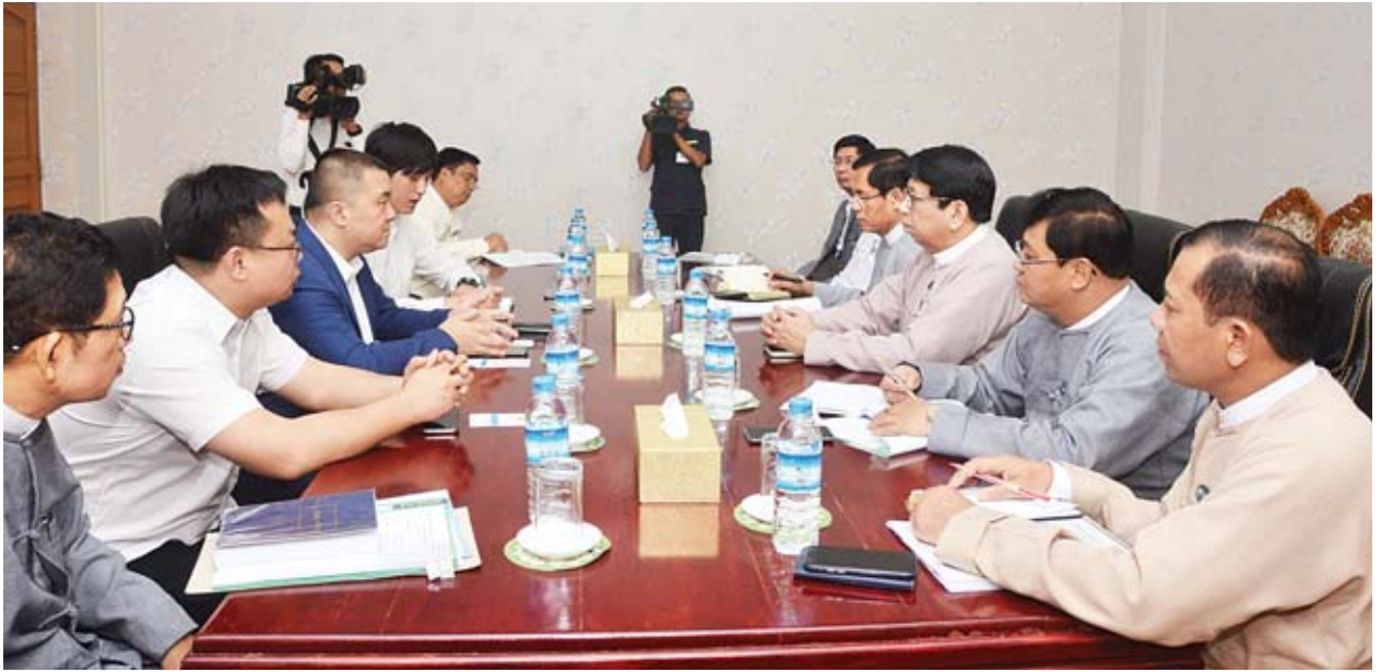
ပြည်ထောင်စုဝန်ကြီး ဒေါက်တာဖေမြင့်နှင့် တာဝန်ရှိသူများ Exploring Myanmar Culture & Tourism Organization အဖွဲ့အား လက်ခံတွေ့ဆုံစဉ်။

တရုတ်ပြည်သူ့သမ္မတနိုင်ငံ သံအမတ်ကြီး မစ္စတာဟန်လျန်နှင့် တွေ့ဆုံစဉ် တရုတ်ပြည်သူ့သမ္မတနိုင်ငံ၏ ရုပ်ရှင်လုပ်ငန်း၊ မီဒီယာနှင့် စာကြည့်တိုက်များ လေ့လာကြည့်ရှုရေး၊ နှစ်နိုင်ငံမီဒီယာခရီးစဉ်များ အပြန်အလှန်ဖလှယ်ရေး၊ Documentary အစီအစဉ်များ ရိုက်ကူးရေး၊ သမ္မတ ရှိကျင့်ဖျင်၏ The Governance of China စာအုပ် လှူဒါန်းရေးကိစ္စရပ်များကို ဆွေးနွေးသည်။