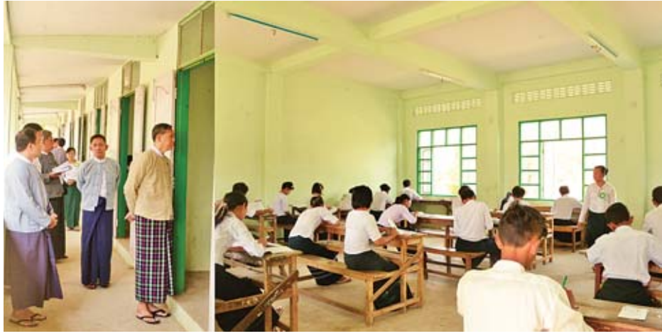
အလားတူ ပြည်ထောင်စုဝန်ကြီးသည် မိတ္ထီလာမြို့ အမှတ်(၃)အခြေခံပညာအထက်တန်းကျောင်းစာစစ်ဌာန၊ ပျော်ဘွယ်မြို့အခြေခံပညာအထက်တန်းကျောင်း စာစစ် ဌာနနှင့် ရမည်းသင်းမြို့နယ် အမှတ် (၁) အခြေခံပညာ အထက်တန်းကျောင်း စာစစ်ဌာနများသို့ သွားရောက် ကြည့်ရှုအားပေးကာ ကြီးကြပ်ရေးမှူး၊ လက်ထောက် ကြီးကြပ်ရေးမှူးများနှင့်တွေ့ဆုံပြီး လိုက်နာဆောင်ရွက်ကြ ရမည့် တာဝန်ဝတ္တရားများကို ကျေပွန်စွာဆောင်ရွက်ကြရန်။

နေပြည်တော် မတ် ၁၃ ပညာရေးဝန်ကြီးဌာန ပြည်ထောင်စုဝန်ကြီး ဒေါက်တာ မျိုးသိမ်းကြီးသည် ယနေ့ နံနက်ပိုင်းတွင် မန္တလေးတိုင်း ဒေသကြီး မိတ္ထီလာမြို့ အမှတ် (၄) အခြေခံပညာ အထက်တန်းကျောင်းစာစစ်ဌာနသို့ ရောက်ရှိပြီး ၂၀၁၉ ခုနှစ် တက္ကသိုလ်ဝင်စာမေးပွဲ ဇီဝဗေဒ၊ ဘောဂဗေဒ ဘာသာရပ် ဖြေဆိုနေမှုများနှင့် စာမေးပွဲဆိုင်ရာလုပ်ငန်း များ ဆောင်ရွက်နေမှုတို့ကို လှည့်လည်ကြည့်ရှုအားပေး သည်။