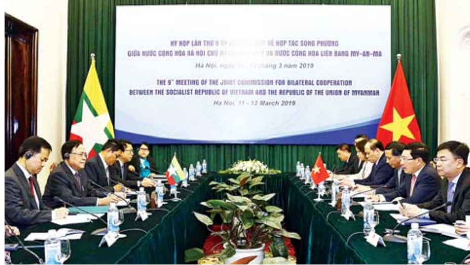
(၉)ကြိမ်မြောက် မြန်မာ-ဗီယက်နမ် နှစ်နိုင်ငံပူးပေါင်းဆောင်ရွက်ရေးဆိုင်ရာ ပူးတွဲကော်မရှင်အစည်းအဝေး ကျင်းပစဉ်။

နေပြည်တော် မတ် ၁၃ အပြည်ပြည်ဆိုင်ရာပူးပေါင်းဆောင်ရွက်ရေးဝန်ကြီးဌာန ပြည်ထောင်စုဝန်ကြီး ဦးကျော်တင်နှင့် အဖွဲ့သည် ဗီယက်နမ်နိုင်ငံ ဟနွိုင်းမြို့တွင် မတ် ၁၁ ရက်မှ ၁၂ ရက်အထိ ကျင်းပခဲ့သည့် (၉)ကြိမ်မြောက် မြန်မာ-ဗီယက်နမ် နှစ်နိုင်ငံပူးပေါင်းဆောင်ရွက်ရေးဆိုင်ရာ ပူးတွဲ ကော်မရှင် အစည်းအဝေးသို့ တက်ရောက်ခဲ့ပြီး မတ် ၁၃ ရက် ညနေပိုင်းတွင် ရန်ကုန်မြို့သို့ ပြန်လည်ရောက်ရှိသည်။ (၉)ကြိမ်မြောက် မြန်မာ-ဗီယက်နမ် နှစ်နိုင်ငံပူးပေါင်း ဆောင်ရွက်ရေးဆိုင်ရာ ပူးတွဲကော်မရှင်အစည်းအဝေးကို မတ် ၁၂ ရက်က ဗီယက်နမ်နိုင်ငံ ဟနွိုင်းမြို့ နိုင်ငံတော် ဧည့်ဂေဟာတွင် ကျင်းပရာ အစည်းအဝေး၌ အပြည်ပြည် ဆိုင်ရာပူးပေါင်းဆောင်ရွက်ရေးဝန်ကြီးဌာန ပြည်ထောင်စု ဝန်ကြီး ဦးကျော်တင်နှင့် ဗီယက်နမ်ဆိုရှယ်လစ်သမ္မတ နိုင်ငံ ဒုတိယဝန်ကြီးချုပ်နှင့် နိုင်ငံခြားရေးဝန်ကြီး မစ္စတာ ဖန်ဘင်မင်းတို့က ပူးတွဲဥက္ကဋ္ဌများအဖြစ် ဆောင်ရွက်ခဲ့ သည်။