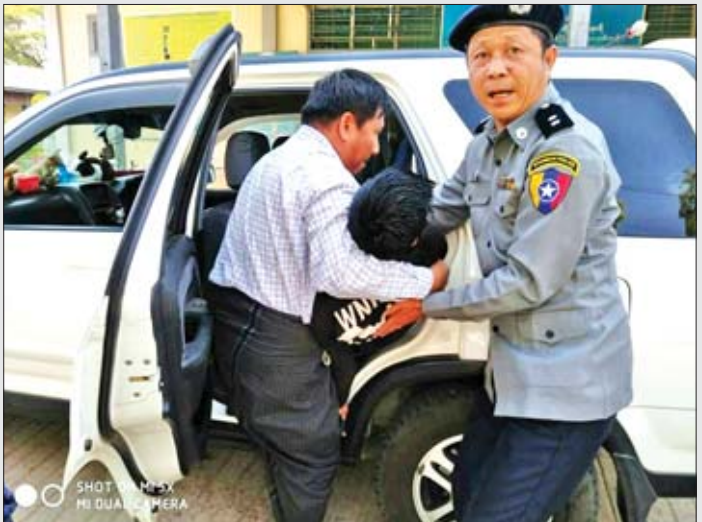
ကျောက်ပန်းတောင်း မြို့နယ် အမှတ်(၁) အခြေခံပညာ အထက်တန်းကျောင်း(ပုပ္ပား) စာစစ်ဌာန၌ တက္ကသိုလ်ဝင်စာမေးပွဲ ဖြေဆိုနေသည့် ကျောင်းသူတစ်ဦး မတ် ၁၂ ရက် နံနက် ၈ နာရီ ၅၅ မိနစ်တွင် သွေးအားနည်းရောဂါဖြင့် မူးလဲသွား၍ ပျော်ဘွယ်ရဲကင်းစခန်း မှ ရဲအုပ် ဂျူးလီယို မော်တော်ယာဉ် ဖြင့် ကျောက်ပန်းတောင်း ပြည်သူ့ ဆေးရုံသို့ ကူညီပို့ဆောင်ပေးစဉ်။