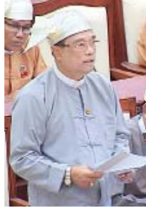
ဒုတိယဝန်ကြီး ဦးကျော်လင်း

ဆက်လက်၍ မင်းကင်းမဲဆန္ဒနယ်မှ ဦးမောင်မြင့်၊ မာဘိမ်းမဲဆန္ဒနယ်မှ ဦးအောင်မြင့်ရှိန်၊ လက်ပံတန်းမဲဆန္ဒနယ်မှ ဦးကျော်မင်း၊ ကျောက်ကြီးမဲဆန္ဒနယ်မှ ဦးမြင့်ဌေးနှင့် အိမ်မဲမဲဆန္ဒနယ်မှ ဒေါ်သန္တာတို့၏ မေးခွန်းများနှင့်စပ်လျဉ်း၍ မြန်မာနိုင်ငံ ရင်းနှီးမြှုပ်နှံမှုကော်မရှင်အဖွဲ့ဝင်၊ စီမံကိန်းနှင့် ဘဏ္ဍာရေးဝန်ကြီးဌာန ဒုတိယဝန်ကြီး ဦးဆက်အောင်နှင့် ဒုတိယဝန်ကြီး ဦးကျော်လင်းတို့က ရှင်းလင်းဖြေကြားကြသည်။