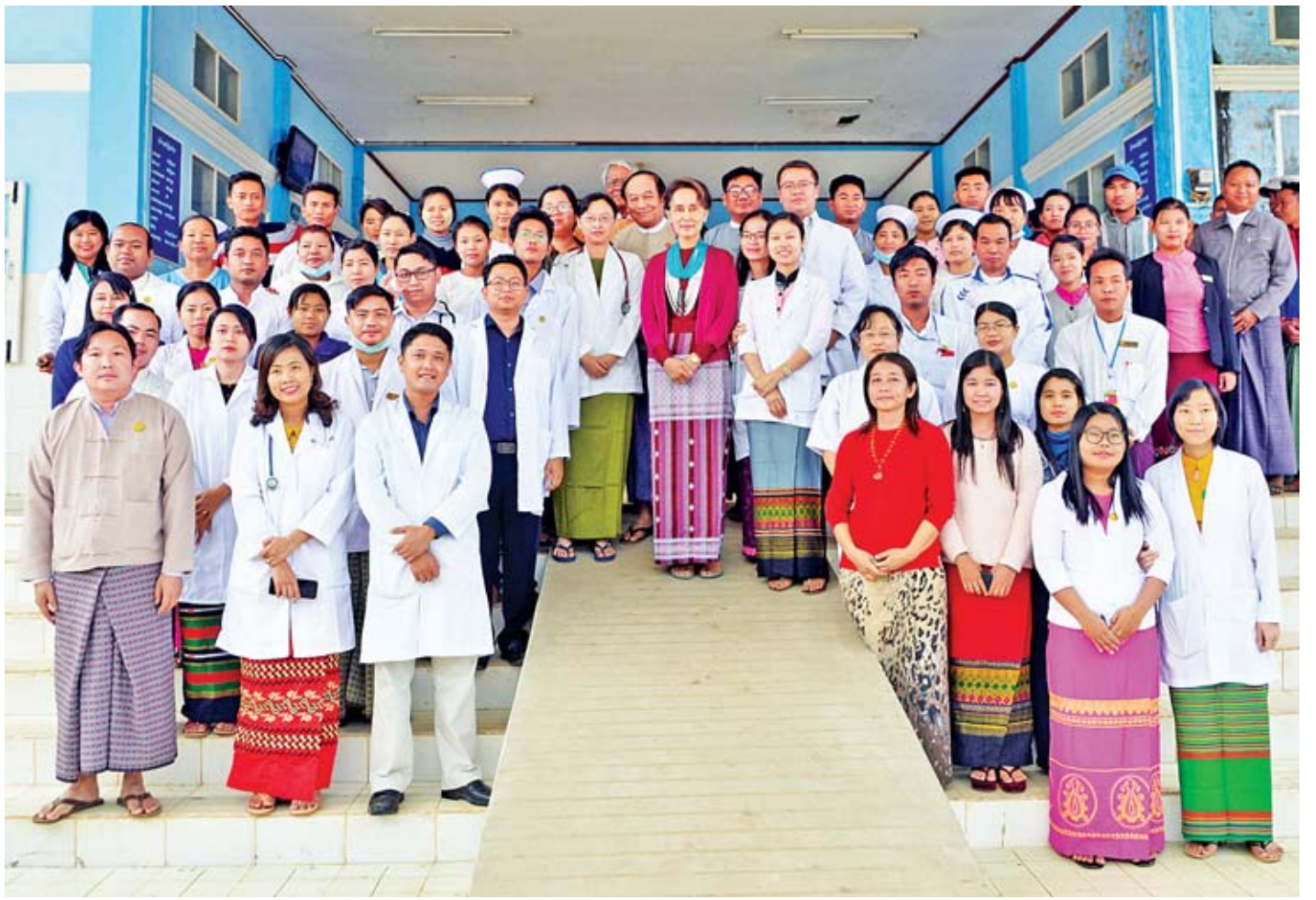
နိုင်ငံတော်၏အတိုင်ပင်ခံပုဂ္ဂိုလ် ဒေါ်အောင်ဆန်းစုကြည် ဟုမ္မလင်းပြည်သူ့ဆေးရုံရှိ ဆရာဝန်များ၊ ကျန်းမာရေးဝန်ထမ်းများနှင့်အတူ စုပေါင်းမှတ်တမ်းတင်ဓာတ်ပုံရိုက်စဉ်။

တင်ပြချက်များအပေါ် နိုင်ငံတော်၏အတိုင်ပင်ခံ ပုဂ္ဂိုလ်က လျှပ်စစ်မီးရရှိရေးအတွက် တစ်နိုင်ငံလုံး အတိုင်းအတာဖြင့် ဆောင်ရွက်လျက်ရှိရာ တစ်နိုင်ငံလုံး၌ ၅၀ ရာခိုင်နှုန်း လျှပ်စစ်ဓာတ်အားရရှိတော့မည်ဖြစ်ကြောင်း၊ ထမံသီကျေးရွာပါဝင်ခြင်း ရှိ မရှိကိုလည်း စိစစ်ဆောင်ရွက်ပေးမည်ဖြစ်ကြောင်း၊ ထမံသီမြစ်ကူးတံတားတည်ဆောက်ရန်အတွက် ရန်ပုံငွေတင်ပြထားပြီး ရန်ပုံငွေရရှိပါက ဆောင်ရွက်ပေးသွားမည် ဖြစ်ပါကြောင်း၊ မူးယစ်ဆေးဝါး ပြဿနာမှာ အစိုးရတစ်ရပ်တည်းဖြင့်ဆောင်ရွက်ရန် ခက်ခဲပါကြောင်း၊ မူးယစ်ဆေးဝါးသုံးစွဲသူများမှာ ရေရှည်တွင် ၎င်းတို့ကိုယ်တိုင် ရောင်းချသူများ ဖြစ်လာပါကြောင်း၊ မူးယစ်ဆေးဝါးကာကွယ်တားဆီးရေး လုပ်ငန်းများကိုလည်း အထူးအလေးထားဆောင်ရွက်လျက်ရှိပါကြောင်း၊ ပြည်သူများ ပူးပေါင်းပါဝင်မှသာ အောင်မြင်မည်ဖြစ်ပါကြောင်း၊ ရဲတပ်ဖွဲ့ဝင်များ၏ အရည်အသွေး၊ အရည်အချင်း မြင့်မားရေးအတွက် ဆောင်ရွက်လျက်ရှိပါကြောင်း။