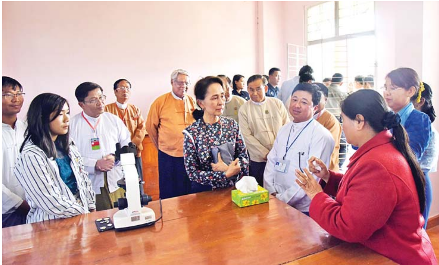
နိုင်ငံတော်၏အတိုင်ပင်ခံပုဂ္ဂိုလ် ဒေါ်အောင်ဆန်းစုကြည် မုံရွာတက္ကသိုလ် ရူပဗေဒ၊ ဓာတုဗေဒနှင့် ဘူမိဗေဒ လက်တွေ့စာသင်ခန်းများကို လှည့်လည်ကြည့်ရှုစဉ်။