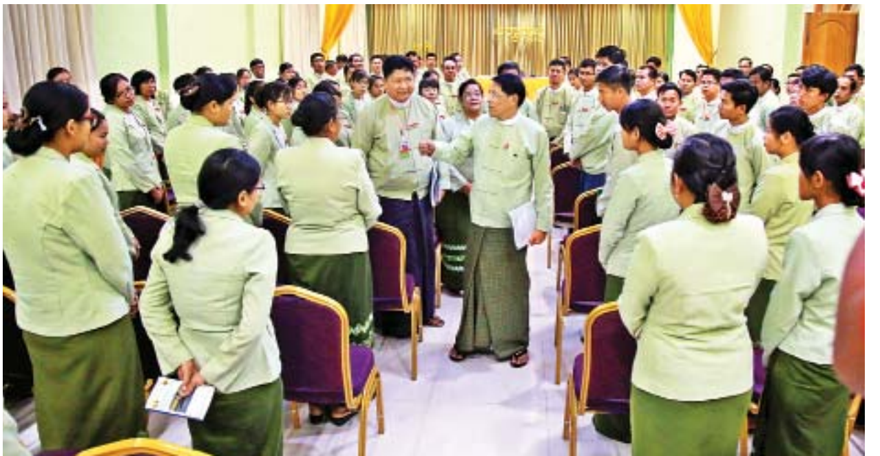
ပြည်ထောင်စုဝန်ကြီး ဦးမင်းသူ စစ်ကိုင်းတိုင်းဒေသကြီး၊ ခရိုင်နှင့် မြို့နယ်များမှ အထွေထွေအုပ်ချုပ်ရေးဦးစီးဌာန ဝန်ထမ်းများအား ရင်းရင်းနှီးနှီး နှုတ်ဆက်စဉ်။

“ အထွေထွေအုပ်ချုပ်ရေးဦးစီးဌာနသည် နိုင်ငံတော်နှင့် ပြည်သူလူထုအတွက် ခေတ်အဆက်ဆက် နိုင်ငံရေးစနစ်များအကြား တွင် အုပ်ချုပ်ရေးယန္တရား ခိုင်ခိုင်မာမာရှိစေရန် ကြိုးပမ်းဆောင်ရွက်ခဲ့သည့် အဖွဲ့အစည်း တစ်ရပ်ဖြစ်သည်နှင့်အညီ ယခုအချိန်တွင် လည်း ပြည်သူလူထုလိုလားသည့် နိုင်ငံရေး စနစ်နှင့် လိုက်လျောညီထွေ ပြုပြင်ပြောင်းလဲ နိုင်မည်ကို ယုံကြည်ထား ”