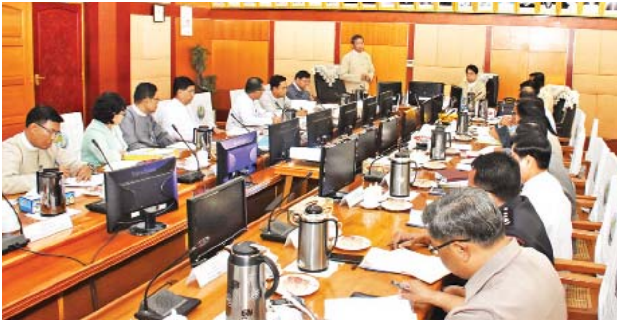
ပြည်ထောင်စုဝန်ကြီး ဒေါက်တာမျိုးသိမ်းကြီး ကလေးစာပေပွဲတော်(ပဲခူး) အောင်မြင်စွာကျင်းပနိုင်ရေးအတွက် ညှိနှိုင်းအစည်းအဝေးတွင် အမှာစကား ပြောကြားစဉ်။

ထို့နောက် ပြန်ကြားရေးနှင့် ပြည်သူ့ဆက်ဆံရေးဦးစီးဌာန ညွှန်ကြား ရေးမှူးချုပ် ဦးရဲနိုင်က ကလေးစာပေပွဲတော်(ပဲခူး) အောင်မြင်စွာ ကျင်းပ နိုင်ရေးအတွက် ဆောင်ရွက်ထားရှိမှုနှင့်စပ်လျဉ်း၍ လည်းကောင်း၊ ပဲခူးတိုင်း ဒေသကြီး ကရင်တိုင်းရင်းသားလူမျိုးရေးရာဝန်ကြီး ဒေါ်နော်ပွယ်စေးက