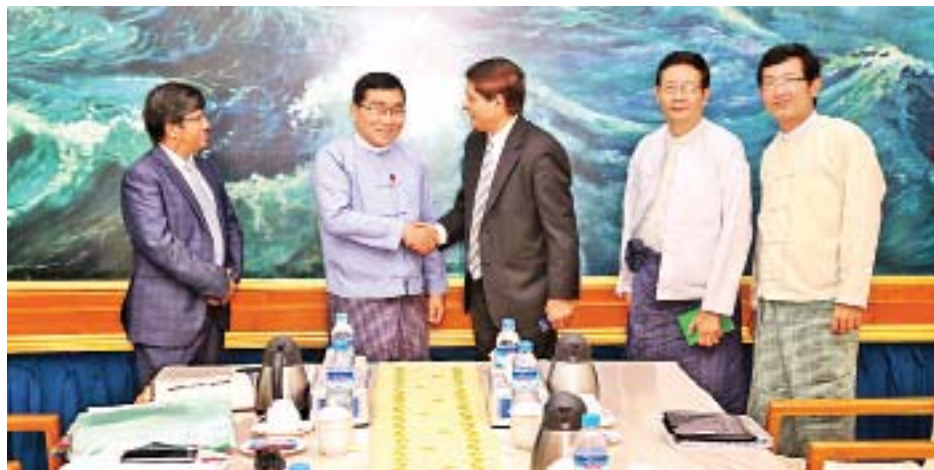
ဘေးအန္တရာယ် စီမံခန့်ခွဲမှုများ ဆောင်ရွက်ရာတွင် တည်တံ့ခိုင်မြဲပြီး ဟန်ချက်ညီသော ဖွံ့ဖြိုးတိုးတက်မှု နိုင်ငံတော်အဆင့် စီမံကိန်းများ မြန်မာနိုင်ငံ၏ ရေရှည် စီမံကိန်း၊ မြန်မာနိုင်ငံ သဘာဝဘေးအန္တရာယ်လျော့ပါးရေး

BRAC International အဖွဲ့နှင့်တွေ့ဆုံစဉ် သဘာဝ ဘေးအန္တရာယ်လျော့ပါးရေး၊ ဘေးဒဏ်ကြုံကြုံခံ နိုင်သည့် လူမှုအသိုက်အဝန်းများ ဖြစ်ပေါ်လာရေးအတွက် အသိပညာပေးဆိုင်ရာနှင့် အခြေခံအဆောက်အအုံပိုင်း ဆိုင်ရာ ပေါင်းစပ်၍ မျှတစွာဆောင်ရွက်နိုင်ရေး၊ သဘာဝ