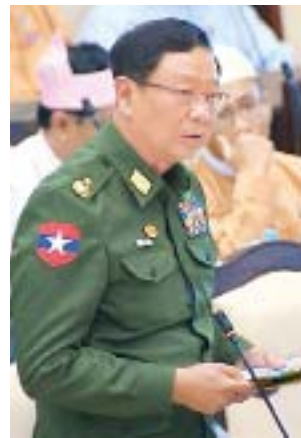
ဒုတိယဝန်ကြီး ဗိုလ်ချုပ်အောင်သူ