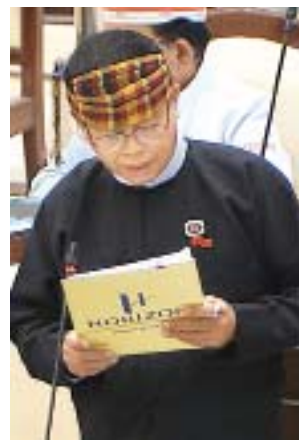
ကချင်ပြည်နယ်မဲဆန္ဒနယ်အမှတ် (၁၁)မှ ဒေါက်တာခွန်ဝင်းသောင်း

အလားတူ ရခိုင်ပြည်နယ် မဲဆန္ဒနယ်အမှတ်(၃)မှ ဦးခင်မောင်လတ်၊ ချင်းပြည်နယ် မဲဆန္ဒနယ်အမှတ်(၁၁) မှ ဦးဝေတင်နှင့် မွန်ပြည်နယ် မဲဆန္ဒနယ်အမှတ်(၁၂)မှ ဒေါ်သီရိရာတနာတို့၏ မေးခွန်းများနှင့် စပ်လျဉ်း၍ ဒုတိယ ဝန်ကြီး ဗိုလ်ချုပ်အောင်သူနှင့် ဦးလှကျော်တို့က ပြန်လည် ရှင်းလင်းဖြေကြားခဲ့ကြသည်။ ထို့နောက် မွန်ပြည်နယ် မဲဆန္ဒနယ်အမှတ်(၈)မှ ဦးမျိုးဝင်းက ပြည်ထောင်စုရာထူးဝန်အဖွဲ့ဥပဒေကို ဒုတိယ အကြိမ်ပြင်ဆင်သည့် ဥပဒေကြမ်းနှင့် စပ်လျဉ်း၍ ဆွေးနွေး သည်။ ယင်းနောက် အမျိုးသားလွှတ်တော်ဥက္ကဋ္ဌ မန်းဝင်း ခိုင်သန်းက အမျိုးသားလွှတ်တော်က အတည်ပြုပြီး ပေးပို့ ထားသော တရားလွှတ်တော် ရှေ့နေများကောင်စီ အက်ဥပဒေကို ပြင်ဆင်သည့် ဥပဒေကြမ်းအား ပြည်သူ့ လွှတ်တော်က ပြင်ဆင်ချက်ဖြင့် ပြန်လည်ပေးပို့လာခြင်းကို အသိပေးတင်ပြ၍ ဆွေးနွေးလိုသည့် လွှတ်တော်ကိုယ်စား လှယ်များရှိပါက အမည်စာရင်းတင်သွင်းနိုင်ကြောင်း ကြေညာသည်။ ထို့နောက် အမျိုးသားလွှတ်တော်ဥက္ကဋ္ဌက အမျိုးသား