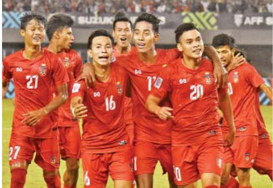
၂၀၁၈ အာဆီယံဆူပူကီးဖလားပြိုင်ပွဲ ယှဉ်ပြိုင်ခဲ့သည့် မြန်မာ့လက်ရွေးစင်အသင်း။

မြန်မာ့လက်ရွေးစင်အသင်းသည် ကမ္ဘာ့ဘောလုံးအဖွဲ့ချုပ်(ဖီဖာ)မှ သတ်မှတ်ထားသည့် နိုင်ငံတကာရက်သတ္တပတ်တွင် တရုတ်တိုင်ပေး အင်ဒိုနီးရှားလက်ရွေးစင်အသင်းတို့နှင့် ခြေစမ်းပွဲယှဉ်ပြိုင်ကစားမည်ဖြစ်သည်။ မြန်မာ့လက်ရွေးစင်အသင်းသည် ခြေစမ်းပွဲများအဖြစ် မတ် ၁၉ ရက်တွင် တရုတ်တိုင်ပေးအသင်း၊ မတ် ၂၅ ရက်တွင် အင်ဒိုနီးရှားအသင်းနှင့် ယှဉ်ပြိုင်ကစားမည်ဖြစ်သည်။