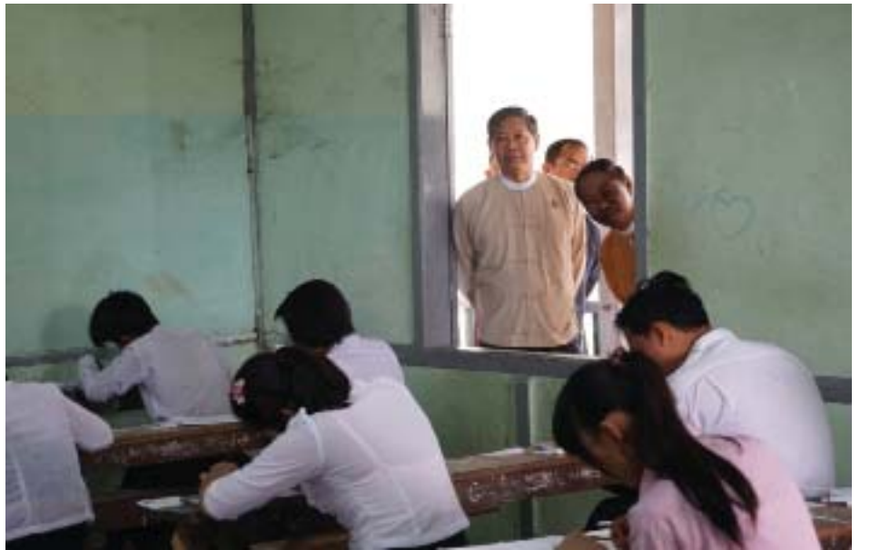
သတင်းစဉ်

ကျောင်း၊ ဇေယျာသီရိမြို့နယ် အခြေခံပညာအထက်တန်းကျောင်း (ရေဆင်း)၊ ပုဗ္ဗသီရိမြို့နယ် အမှတ်(၃)အခြေခံပညာအထက်တန်းကျောင်းနှင့် အမှတ်(၁၃) အခြေခံပညာအထက်တန်းကျောင်းများရှိ စာစစ်ဌာနများ၌ ကျောင်းသားကျောင်းသူများ၏ စာမေးပွဲဖြေဆိုနေမှုများနှင့် စာမေးပွဲဆိုင်ရာလုပ်ငန်း ဆောင်ရွက်နေမှုများကို လှည့်လည်ကြည့်ရှုသည်။