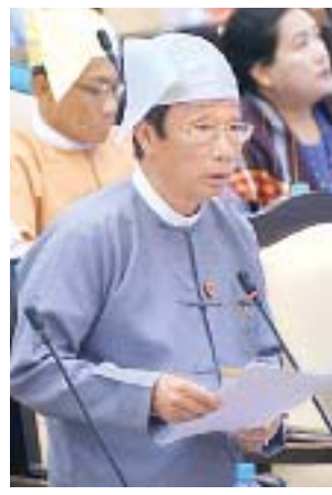
ဒုတိယဝန်ကြီး ဦးလှကျော်