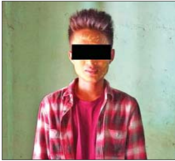
ဒဂုံဆိပ်ကမ်းမြို့မရဲစခန်းက အမှုဖွင့်စုံစမ်းခဲ့သည်။

ရန်ကုန်တိုင်းဒေသကြီး ဒဂုံဆိပ်ကမ်းမြို့နယ် (၉၄)ရပ်ကွက် အ(၉)လမ်း တိုက်(၅/၂၀၄) တွင် အမျိုးသားတစ်ဦးနှင့် အမျိုးသမီးတစ်ဦး တို့မှာ ဒဏ်ရာများဖြင့် သေဆုံးနေကြောင်း သိရသည်။