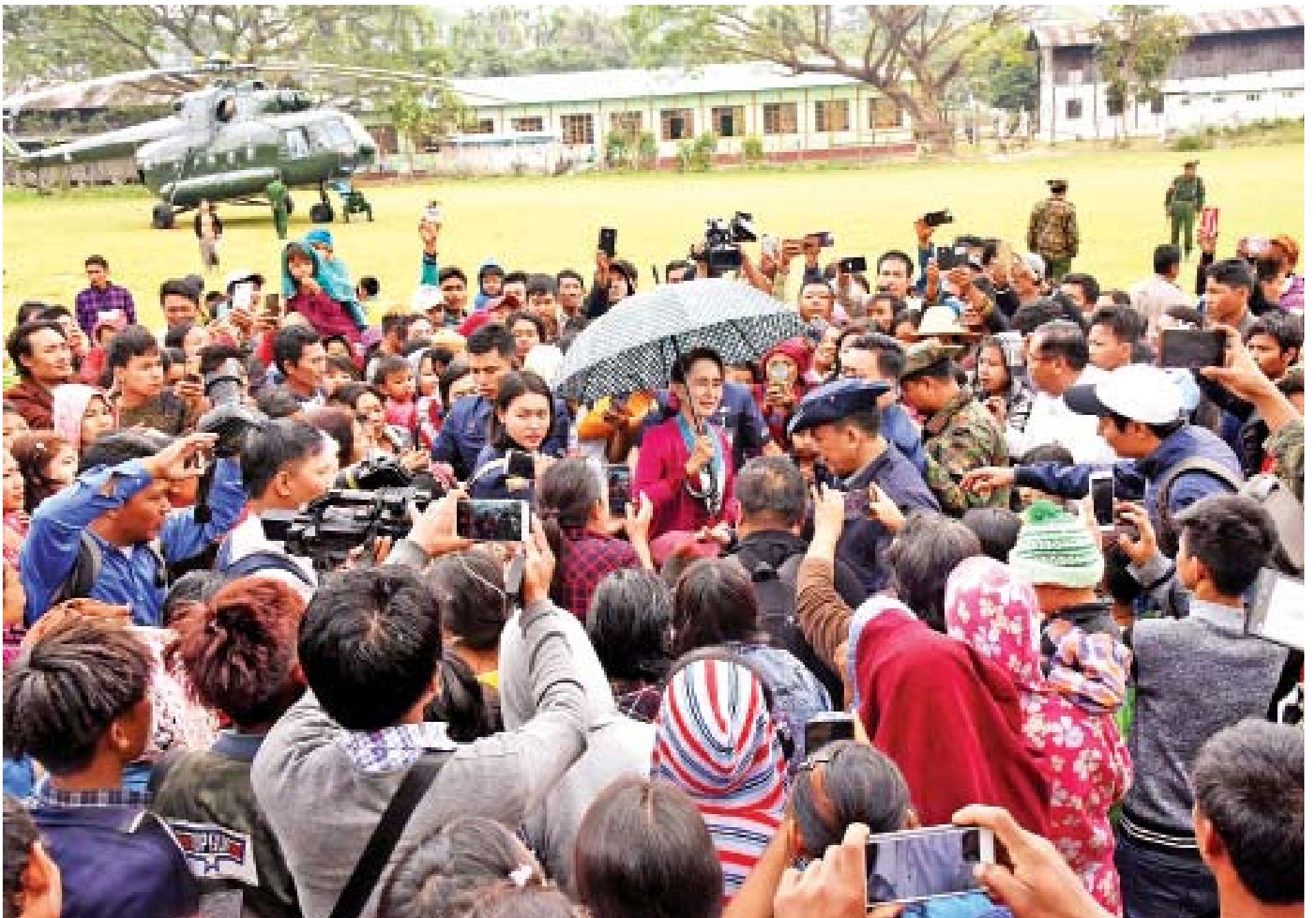
နိုင်ငံတော်၏အတိုင်ပင်ခံပုဂ္ဂိုလ် ဒေါ်အောင်ဆန်းစုကြည်အား ဟုမ္မလင်းမြို့နယ် ထမံသီကျေးရွာမှ ဒေသခံပြည်သူများက ကြိုဆိုနှုတ်ဆက်ကြစဉ်။