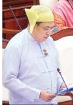
ဒုတိယဝန်ကြီး ဦးဆက်အောင်

ထို့နောက် ပညာရေးဝန်ကြီးဌာန ဒုတိယဝန်ကြီး ဦးဝင်းမော်ထွန်းက အခြေခံပညာရေးဥပဒေကြမ်းကို တင်သွင်းသည်။