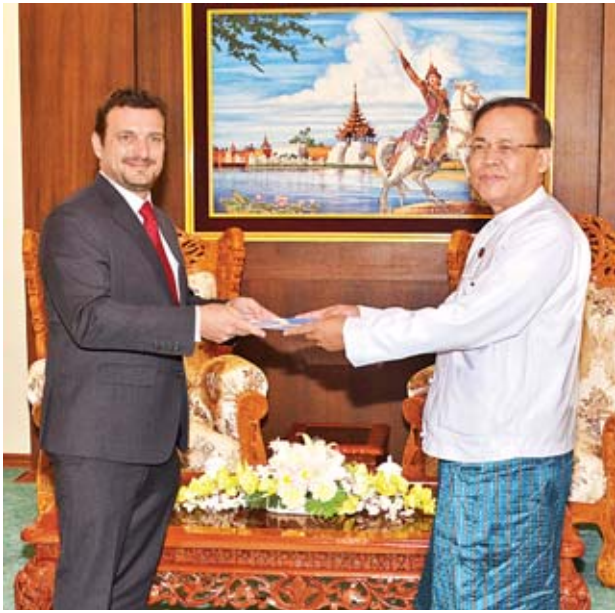
ပြည်ထောင်စုဝန်ကြီး ဦးကျော်တင်ထံ မြန်မာနိုင်ငံဆိုင်ရာ ကုလသမဂ္ဂအမျိုးသမီးရေးရာအဖွဲ့ ဌာနကော်ယ်စားလှယ် ခန့်အပ်လွှာပေးအပ်