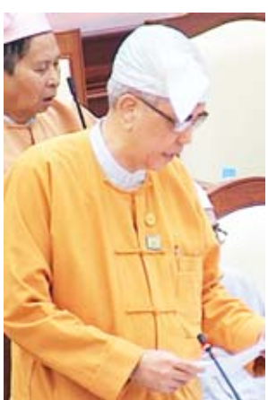
ဒုတိယဝန်ကြီး ဦးကျော်မျိုး