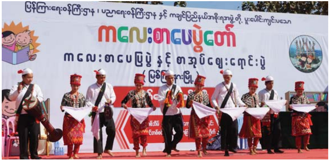
ကလေးစာပေပွဲတော် (မြစ်ကြီးနား) တွင် တိုင်းရင်းသား တိုင်းရင်းသူများက စုပေါင်းအကဖြင့် ဖျော်ဖြေနေမှုကို တွေ့ရစဉ်။

ကျင်းပခဲ့မှုအနက် ကချင်ပြည်နယ် မြစ်ကြီးနား တက္ကသိုလ်တွင် ကျင်းပခဲ့သည့် ကလေးစာပေ ပွဲတော်သည် ထူးခြားသည်ဟု ဆိုရပါမည်။ ကလေးစာပေပွဲတော်(မြစ်ကြီးနား) ဖွင့်ပွဲအခမ်း အနားကို မြစ်ကြီးနားတက္ကသိုလ် ဘွဲ့နှင်းသဘင် ခန်းမကြီး၌ကျင်းပရာ မနောမြေမှတေးသံသာ၊ အိုဝမ် ကချင်ရိုးရာသီချင်း၊ ရှမ်းရိုးရာအက၊ ရဝမ်ရိုးရာအက၊ လီဆူရိုးရာအက၊ တိုင်းလုံ ရိုးရာအကများဖြင့် စတင်ဖွင့်လှစ်ခဲ့ကြပြီး ပွဲတော်ကျင်းပသည့် သုံးရက်လုံးတွင်လည်း ကျောင်းသား ကျောင်းသူလေးများ၏ ဖျော်ဖြေ မှုများနှင့်အတူ တိုင်းရင်းသားရိုးရာအကအလှ များ ပါဝင်ကပြဖျော်ဖြေခဲ့ကြသည်။ ဘွဲ့နှင်း သဘင်ခန်းမရေရှိ ဖျော်ဖြေရေးစင်မြင့်၌လည်း လီဆူ၊ ရဝမ်၊ ဇိုင်ဝါ၊ လာချီဒါ၊ တိုင်းလုံ၊ တိုင်း လိုင်နှင့် တိုင်းဆာတိုင်းရင်းသားတို့၏ ရိုးရာ အကများဖြင့် သီဆိုကပြဖျော်ဖြေခဲ့ကြသည်။ နိုင်ငံတော်၏ အတိုင်ပင်ခံပုဂ္ဂိုလ် ဒေါ်အောင်ဆန်းစုကြည်သည် ကချင်ပြည်နယ် သို့ ကလေးစာပေပွဲတော်(မြစ်ကြီးနား) ပွဲတော် မကျင်းပမီရောက်ရှိခဲ့စဉ် “ ကလေးစာပေပွဲတော် များတွင် အင်္ဂလိပ်ဘာသာ ပုံပြောပြိုင်ပွဲများ၊ ကဗျာရွတ်ပြိုင်ပွဲများ၊ သာမက တိုင်းရင်းသား ဘာသာ ပုံပြောပြိုင်ပွဲ၊ ကဗျာရွတ်ပြိုင်ပွဲများပါ ထည့်သွင်းကျင်းပစေရန် ” လမ်းညွှန်ခဲ့ပါသည်။ ထိုကဲ့သို့ လမ်းညွှန်မှုနှင့်အညီ တိုင်းရင်းသား ပြည်သူများ၏ ပူးပေါင်းပါဝင်မှုဖြင့် တိုင်းရင်းသား များ၏ ကိုယ်ပိုင်စာပေနှင့် ယဉ်ကျေးမှုများ