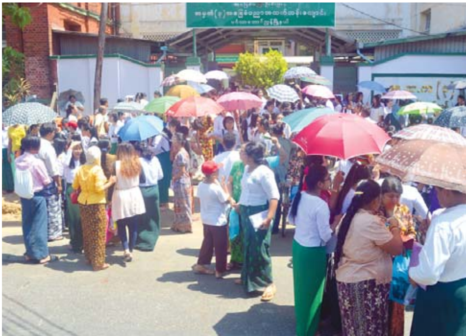
ရန်ကုန်တိုင်းဒေသကြီး မင်္ဂလာတောင်ညွန့်မြို့နယ် အမှတ် (၃) အခြေခံပညာအထက်တန်းကျောင်း၌ မတ် ၆ ရက်က တက္ကသိုလ်ဝင်စာမေးပွဲ မြန်မာစာဘာသာရပ်ဖြေဆိုပြီး ပျော်ရွှင်စွာထွက်လာကြသည့် ကျောင်းသား ကျောင်းသူများအား မိဘဆွေမျိုးများက စောင့်ဆိုင်းကြိုဆိုနေကြစဉ်။