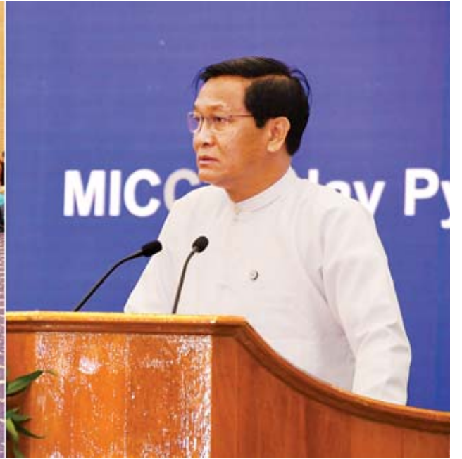
ဒုတိယသမ္မတ ဦးဟင်နရီပန်ထီးယူ ကမ္ဘာ့ရေနေ့ (၂၀၁၉) အထိမ်းအမှတ်အခမ်းအနားတွင် အမှာစကားပြောကြားစဉ်။