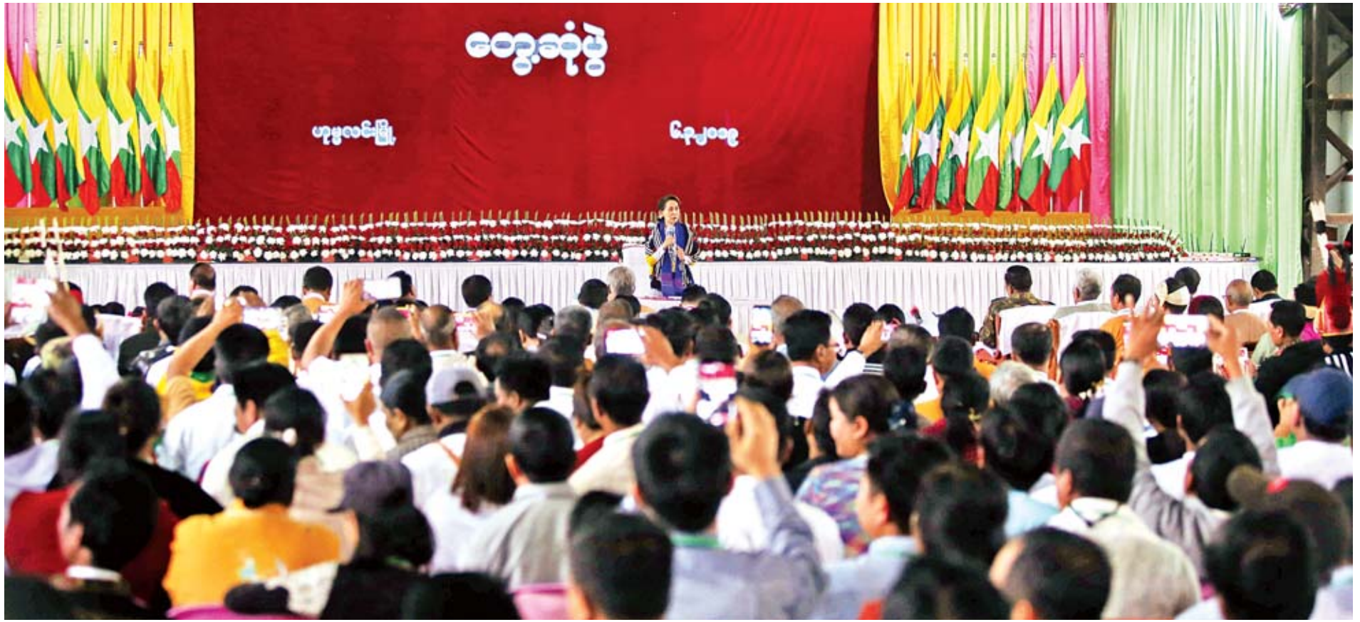
နိုင်ငံတော်၏အတိုင်ပင်ခံပုဂ္ဂိုလ် ဒေါ်အောင်ဆန်းစုကြည် ဟုမ္မလင်းမြို့နယ် အားကစားခန်းမ၌ ဒေသခံပြည်သူများနှင့် တွေ့ဆုံပွဲတွင် အမှာစကားပြောကြားစဉ်။

များအဖြစ် ခန့်အပ်ပေးနိုင်ရေးမှာလည်း ဘာသာစကား ကျွမ်းကျင်မှုကို အခြေခံ၍ ဦးစားပေးခန့်အပ်ရန် စီစဉ်လျက် ရှိပါကြောင်း ဖြည့်စွက်ရှင်းလင်းပြောကြားသည်။ ထို့နောက် နိုင်ငံတော်၏အတိုင်ပင်ခံပုဂ္ဂိုလ်သည် ပြည်ထောင်စုဝန်ကြီးများ၊ တိုင်းဒေသကြီးဝန်ကြီးချုပ်၊ နာဂကိုယ်ပိုင်အုပ်ချုပ်ခွင့်ရဒေသ ဦးစီးအဖွဲ့ဝင်များ၊ တာဝန် ရှိသူများ၊ မြို့မြို့မြို့များနှင့် မှတ်တမ်းတင်စာတံပုံရိုက်သည်။ ဟုမ္မလင်းမြို့သို့ ရောက်ရှိ ယင်းနောက် နိုင်ငံတော်၏အတိုင်ပင်ခံပုဂ္ဂိုလ်က ဒေသဖွံ့ဖြိုးရေးအတွက် ထောက်ပံ့ငွေကျပ် သိန်း ၂၀၀ နှင့် စားသောက်ကုန်ပစ္စည်းများကိုပေးအပ်ရာ မြို့မြို့မြို့များက လက်ခံကြပြီး နိုင်ငံတော်၏အတိုင်ပင်ခံပုဂ္ဂိုလ်အား ဂါရဝပြု လက်ဆောင်ပစ္စည်း ပြန်လည်ပေးအပ်သည်။ ထို့နောက် နိုင်ငံတော်၏အတိုင်ပင်ခံပုဂ္ဂိုလ်နှင့်အဖွဲ့ သည် ခန္တီးမြို့မှ အထူးလေယာဉ်ဖြင့် ထွက်ခွာခဲ့ကြရာ ဟုမ္မလင်းမြို့သို့ ရောက်ရှိကြသည်။ ယင်းနောက် နိုင်ငံတော်၏အတိုင်ပင်ခံပုဂ္ဂိုလ်သည်