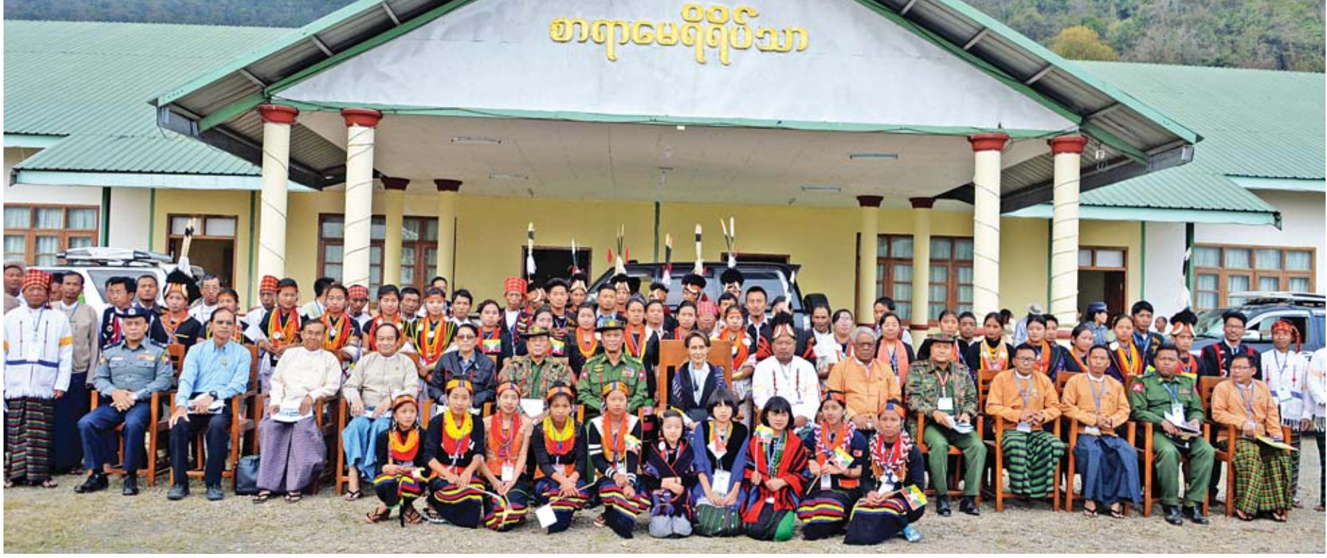
နိုင်ငံတော်၏အတိုင်ပင်ခံပုဂ္ဂိုလ် ဒေါ်အောင်ဆန်းစုကြည် ပြည်ထောင်စုဝန်ကြီးများ၊ တိုင်းဒေသကြီးဝန်ကြီးချုပ်၊ နာဂကိုယ်ပိုင်အုပ်ချုပ်ခွင့်ရဒေသ ဦးစီးအဖွဲ့ဝင်များ၊ တာဝန်ရှိသူများ၊ မြို့မိ မြို့ဖများနှင့် မှတ်တမ်းတင်ဓာတ်ပုံရိုက်စဉ်။

ခန္တီးပြည်သူ့ဆေးရုံသို့ ရောက်ရှိပြီး ဆေးရုံတက်ရောက်ကုသနေသည့် လူနာများအား အားပေးစကား ပြောကြားကာ လက်ဆောင်ပစ္စည်းများ ပေးအပ်သည်။ ယင်းနောက် နိုင်ငံတော်၏အတိုင်ပင်ခံပုဂ္ဂိုလ်နှင့် အဖွဲ့သည် ခန္တီးမြို့မှ ရဟတ်ယာဉ်များဖြင့် ထွက်ခွာခဲ့ကြရာ လဟယ်မြို့သို့ ရောက်ရှိကြပြီး လဟယ်မြို့၊ စာရာမေရီရိပ်သာ၌ နာဂကိုယ်ပိုင်အုပ်ချုပ်ခွင့်ရဒေသ ဦးစီးအဖွဲ့ဝင်များ၊ ဝန်ထမ်းများ၊ မြို့မိမြို့ဖများ၊ ဒေသခံပြည်သူများနှင့် တွေ့ဆုံသည်။