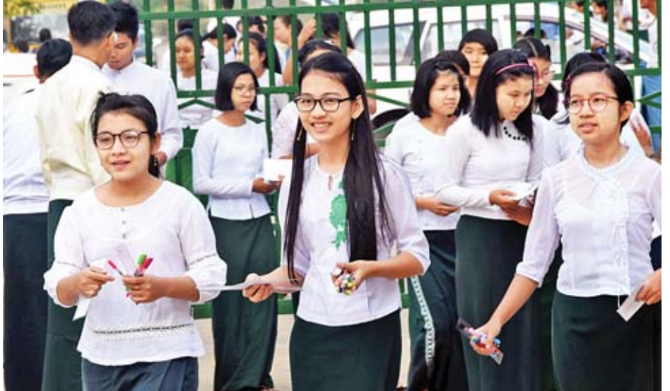
တက္ကသိုလ်ဝင်စာမေးပွဲ ဖြေဆိုသည့် ဗျူသီရိမြို့နယ် အထက(၇)မှ ကျောင်းသား ကျောင်းသူများကို တွေ့ရစဉ်။