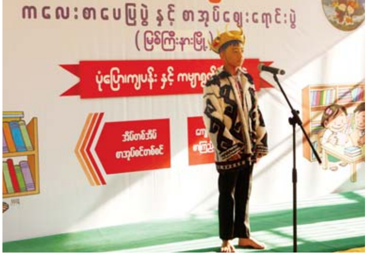
ကလေးစာပေပွဲတော် (မြစ်ကြီးနား) တွင် ရဝမ်ဘာသာဖြင့် ပုံပြောပြိုင်ပွဲ ယှဉ်ပြိုင်နေစဉ်။

ကလေးများ စာအုပ်စာပေ၌ နှစ်သက်မွေ့လျော်ကာ ရာသက်ပန် ပညာရှာမှီးသူများဖြစ်လာစေရန်၊ ပွဲတော်၌ ပျော်ရွှင်စွာဆင်နွှဲရင်း စုပေါင်းအလုပ်များတွင် ဝိုင်းဝန်း ပါဝင်တတ်သည့် အလေ့အထကောင်းများ ရရှိလာစေရန်၊ ပညာဗဟုသုတရော လူရည်လူသွေးပါ ပြည့်ဝ၍ အနာဂတ် တွင် တိုင်းပြည်အတွက် ဦးဆောင်ဦးရွက်ပြုနိုင်သူများ ဖြစ်လာစေရန် ရည်ရွယ်ချက်များဖြင့် ကလေးစာပေပွဲတော် များကို ၂၀၁၆ ခုနှစ်မှစ၍ နိုင်ငံ အနှံ့အပြားတွင် ကျင်းပပေး လျက်ရှိ