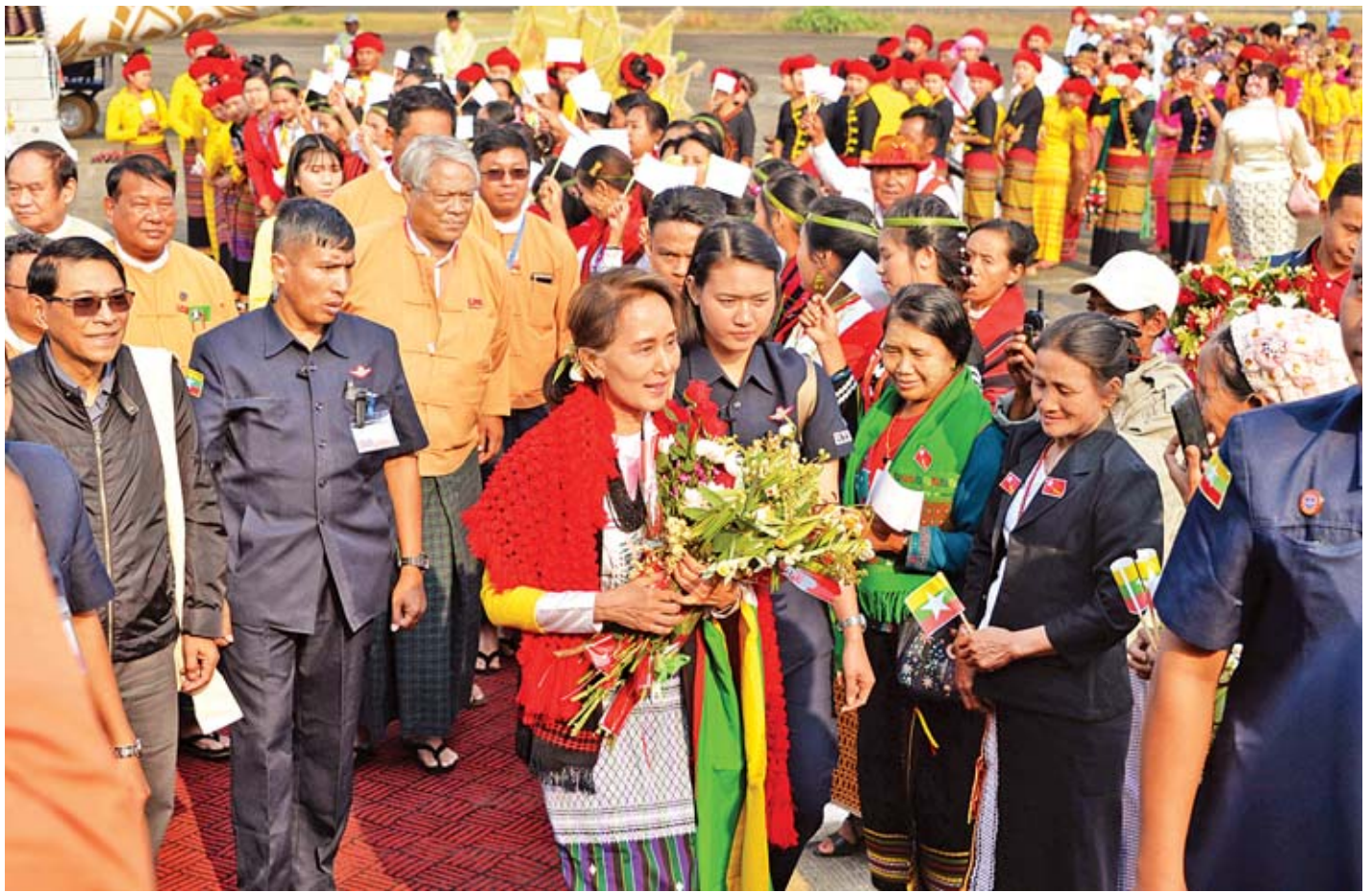
နိုင်ငံတော်၏အတိုင်ပင်ခံပုဂ္ဂိုလ် ဒေါ်အောင်ဆန်းစုကြည်အား ဟုမ္မလင်းမြို့မှ ဒေသခံတိုင်းရင်းသားပြည်သူများက ကြိုဆိုနှုတ်ဆက်ကြစဉ်။

ယင်းနောက် မြို့မြို့မြို့များ၊ ဒေသခံပြည်သူများ တင်ပြထားသည့် လိုအပ်ချက်များအပေါ် ပြည်ထောင်စု ဝန်ကြီးများ၊ တိုင်းဒေသကြီးဝန်ကြီးချုပ်တို့က ပြန်လည် ရှင်းလင်းဖြေကြားကြပြီး နိုင်ငံတော်၏အတိုင်ပင်ခံ ပုဂ္ဂိုလ်က သိမ်းဆည်းခံလယ်ယာမြေများနှင့် စပ်လျဉ်း၍ မူလပိုင်ရှင်များထံ ပြန်လည်ပေးအပ်နိုင်ရေးအတွက် ၂၀၁၃ ခုနှစ်တွင် ပြည်ထောင်စုလွှတ်တော်က ဆုံးဖြတ်ထားပါ ကြောင်း၊ သိမ်းဆည်းမြေ ပြန်လည်စိစစ်ရာတွင် ၁၉၈၈ နောက်ပိုင်း သိမ်းဆည်းမြေများသာ အကျုံးဝင်ပါကြောင်း၊ သိမ်းဆည်းမြေများနှင့် စပ်လျဉ်း၍ ဆောင်ရွက်ရာတွင် သိမ်းဆည်းသူများကိုယ်တိုင်က ပြန်လည်ပေးအပ်လိုခြင်း၊ အချို့တွင် အုပ်ချုပ်ရေးအဖွဲ့များ၏ စီမံခန့်ခွဲမှုကြန့်ကြာ နေခြင်း၊ ပိုင်ဆိုင်မှုအငြင်းပွားနေခြင်းတို့ကြောင့် ဖြစ်ပါ ကြောင်း၊ သို့သော် ဒုတိယသမ္မတ ဦးဟင်နရီဗန်ထီးယူ ဦးဆောင်ပြီး ဆောင်ရွက်နေပါကြောင်း၊ လဟယ်မြို့ပေါ် သောက်သုံးရေဖူလုံရေးလုပ်ငန်းဆောင်ရွက်ရန် ဘဏ္ဍာ ငွေရရှိပြီးဖြစ်သည်ဟု သိရပါကြောင်း၊ သိမ်းဆည်းမြေမှ အသုံးမပြုသည့်မြေအား မြို့မြေတိုးချဲ့ရေးတင်ပြချက် ကိုလည်း စိစစ်ဆောင်ရွက်ပေးသွားမည်ဖြစ်ကြောင်း၊ လဟယ်-ရန်လုံးလမ်း ရာသီမရွေးသွားလာနိုင်ရန်အတွက် ၂၀၁၉-၂၀၂၀ ဘဏ္ဍာနှစ်မှစတင်ပြီး ရန်ပုံငွေတင်ပြ ဆောင်ရွက်ပေးသွားမည်ဖြစ်ကြောင်း၊ နာဂကုန်သွယ်ရေး ဇုန် ဖွင့်လှစ်နိုင်ရန် လဟယ်-ရန်လုံးလမ်း ရာသီမရွေးသွားနိုင် ရေးဆောင်ရွက်ပြီးစီးသည့်အခါမှသာ အဆင်ပြေနိုင်မည် ဖြစ်ကြောင်း၊ နာဂရိုးရာပြတိုက် တည်ဆောက်နိုင်ရန် တိုင်းဒေသကြီးအစိုးရက ကူညီပံ့ပိုးပေးသွားမည်ဖြစ် ကြောင်း၊ လဟယ်မြို့မှ ဒေသခံများအား ပညာရေးဝန်ထမ်း