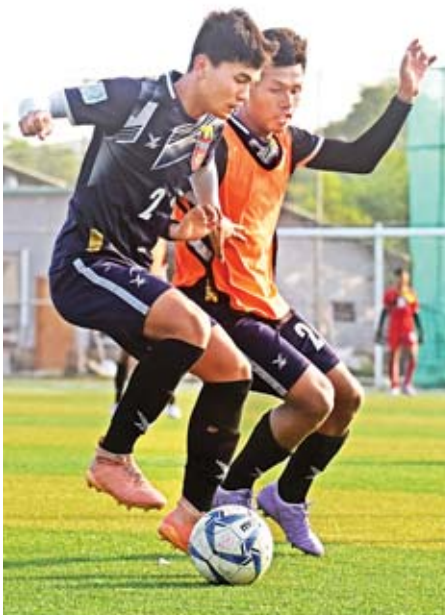
မြန်မာ ယူ-၁၈ အသင်း လေ့ကျင့်နေစဉ်။