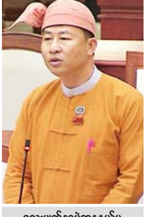
လေးမျက်နှာမဲဆန္ဒနယ်မှ ဦးဖော်မင်းသိန်း