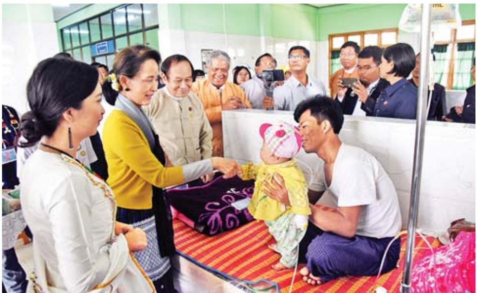
နိုင်ငံတော်၏အတိုင်ပင်ခံပုဂ္ဂိုလ် ဒေါ်အောင်ဆန်းစုကြည် ခန္တီမြို့ ပြည်သူ့ဆေးရုံ၌ တက်ရောက်ကုသနေသည့် ကလေးငယ်တစ်ဦးအား ကြည့်ရှုအားပေးစဉ်။

ဝန်ထမ်းများကို အထူးမေတ္တာရပ်ခံလိုသည်မှာ မိမိ တို့၏ တာဝန်ကို ကျေပွန်ရုံမက ပြည်သူအပေါ် စေတနာ အပြည့်အဝနှင့် လုပ်ဆောင်ပေးကြရန် သတိပေးလိုပါ ကြောင်း၊ ပြည်သူနှင့်ဝန်ထမ်းများ၏ ဆက်ဆံရေးသည် နှစ်ဦးနှစ်ဖက်စလုံး အပြန်အလှန် လေးစားမှုရှိရမည်ဖြစ်ပါ ကြောင်း၊ ဝန်ထမ်းများကလည်း ပြည်သူကိုလေးစားပြီး ပြည်သူကလည်း ဝန်ထမ်းများကို လေးစားရမည်ဖြစ်ပါ ကြောင်း၊ အချို့သော ပြည်သူများ၏ စိတ်ထဲတွင် ဝန်ထမ်း များသည် ဩဇာပြုရန်နှင့် ဖိနှိပ်ရန်ဟု ထင်နေကြပါကြောင်း၊ ယင်းသို့ အထင်ခံနေရသည့်ဝန်ထမ်းများကလည်း မိမိ ကိုယ်ကိုပြန်ပြီး သုံးသပ်စေလိုပါကြောင်း၊ မိမိအနေဖြင့် ဘာကြောင့် အထင်ခံရသလဲဆိုသည်ကို စဉ်းစားပြီး ယင်းသို့အထင်မခံရအောင် နေစေလိုပါကြောင်း၊ ပြည်သူ ပြည်သားများအနေဖြင့်လည်း ဝန်ထမ်းများ၏ အလုပ်ကို နားလည်ပေးစေလိုပါကြောင်း။