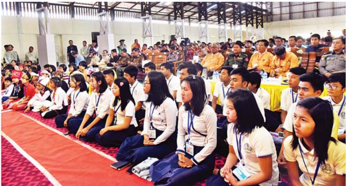
နိုင်ငံတော်၏အတိုင်ပင်ခံပုဂ္ဂိုလ် ဒေါ်အောင်ဆန်းစုကြည် ခန္တီမြို့မြို့နယ်အားကစားခန်းမ၌ ဒေသခံပြည်သူများနှင့် တွေ့ဆုံပွဲတွင် အမှာစကားပြောကြားစဉ်။

»» ရှေ့မှ စုစည်းခြင်း၊ ညီညွတ်ခြင်းသည် မိမိတို့ အင်အားများ ဖြစ်စေပြီး မတူကွဲပြားမှုများသည်လည်း အင်အားများ၏ အခြေခံတစ်ခုပင်ဖြစ်ပါကြောင်း၊ မတူကွဲပြားမှုများကြောင့် အားနည်းသွားခြင်း မဖြစ်စေလိုပါကြောင်း၊ ယင်း ရည်ရွယ်ချက်များဖြင့် ပြည်ထောင်စုအတွင်းရှိသည့် မိမိတို့ တိုင်းရင်းသားညီအစ်ကို မောင်နှမများနှင့် တွေ့ဆုံထိတွေ့ ပြောဆိုရန်နှင့် တစ်ဦးနှင့်တစ်ဦး အမြင်ချင်းဖလှယ်ရန် ကြိုးစားခြင်းဖြစ်ပါကြောင်း၊ အဓိကအားဖြင့် ဒေသခံများ၏ အသံကို ကြားလိုပါကြောင်း၊ ပြည်သူပြည်သားများ၏ မျှော်လင့်ချက်များ၊ စိုးရိမ်မှုများ ဘာတွေရှိလဲဆိုသည်ကို သိချင်ပါကြောင်း။