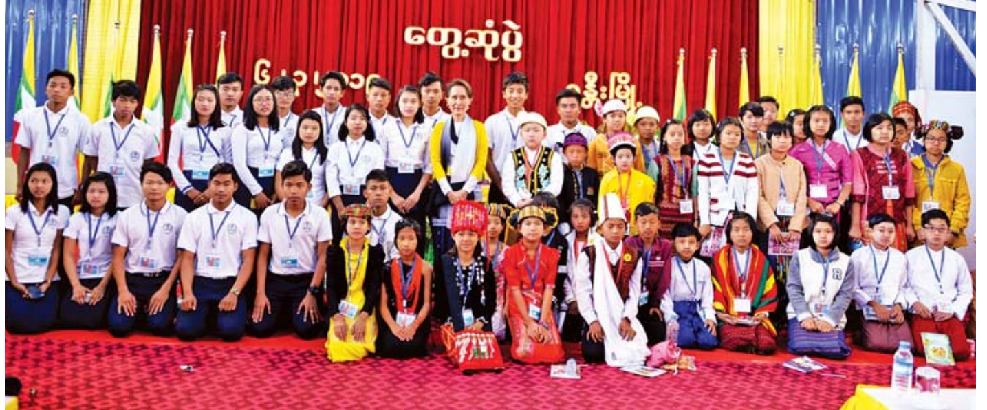
နိုင်ငံတော်၏အတိုင်ပင်ခံပုဂ္ဂိုလ် ဒေါ်အောင်ဆန်းစုကြည် ခန္တီမြို့နယ် ဒေသခံပြည်သူများနှင့် တွေ့ဆုံပွဲသို့ တက်ရောက်လာသည့် ဒေသခံတိုင်းရင်းသား ကျောင်းသား ကျောင်းသူများနှင့်အတူ စုပေါင်း မှတ်တမ်းတင်ဓာတ်ပုံရိုက်စဉ်။

ငြိမ်းငြိမ်းချမ်းချမ်းနှင့် နိုင်ငံ၏ ညီညွတ်ရေးကို ရှေးရှုပြီး သွားကြရန် မေတ္တာရပ်ခံလိုပါကြောင်း၊ ပြည်သူ ပြည်သား များအတွက် ဖွံ့ဖြိုးတိုးတက်ရန် များစွာလိုအပ်နေပါ သေးကြောင်း၊ ယခုကဲ့သို့ ဖွံ့ဖြိုးတိုးတက်ရန် လိုသည့်အချိန် တွင် မကျေနပ်မှုများကို အားလုံးအတူလက်တွဲပြီး ဖြေရှင်း ချိန်ညှိရန်ပါကြောင်း၊ အားလုံးအတူလက်တွဲပြီး ဖြေရှင်းရာ တွင် မိမိတို့ ပြည်သူပြည်သားများ၊ နိုင်ငံဝန်ထမ်းများ၊ အစိုးရတာဝန်ကို ထမ်းဆောင်နေသည့် အစိုးရအဖွဲ့ဝင်များ လည်း ပါဝင်ရမည်ဖြစ်ပါကြောင်း။