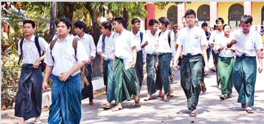
ရန်ကင်းတိုင်းဒေသကြီး ဝိုင်းတထောင်မြို့နယ် အမှတ်(၆) အခြေခံပညာအထက်တန်းကျောင်းမှ ကျောင်းသား ကျောင်းသူများကို ၂၀၁၈-၂၀၁၉ ပညာသင်နှစ် တက္ကသိုလ်ဝင်စာမေးပွဲ မြန်မာစာဖြေဆိုမှုအပြီး မတ် ၆ ရက်က တွေ့ရစဉ်။

၂၀၁၉ ခုနှစ် တက္ကသိုလ်ဝင် စာမေးပွဲ ယနေ့ မြန်မာစာဘာသာရပ် ဖြေဆိုကြသည့် ရန်ကင်းမြို့ အင်းစိန် ဗဟိုအကျဉ်းထောင်မှ အကျဉ်းသား ကျောင်းသားများကို တွေ့ရစဉ်။ (၂၀၁၉ ခုနှစ် တက္ကသိုလ်ဝင်စာမေးပွဲ တွင် ရန်ကင်းမြို့ အင်းစိန်ဗဟို အကျဉ်းထောင်မှ အကျဉ်းသား ကျောင်းသား ကျောင်းသူ ၇၃ ဦး ဝင်ရောက်ဖြေဆိုလျက်ရှိကြောင်း သိရသည်။)