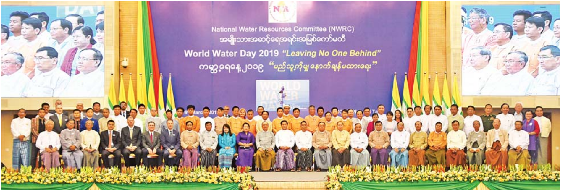
ဒုတိယသမ္မတ ဦးဟင်နရီဝန်ထီးယူ ကမ္ဘာ့ရေနေ့ (၂၀၁၉) အထိမ်းအမှတ်အခမ်းအနားသို့ တက်ရောက်လာကြသူများနှင့်အတူ စုပေါင်းမှတ်တမ်းတင်ဓာတ်ပုံ ရိုက်ဓဉ်။