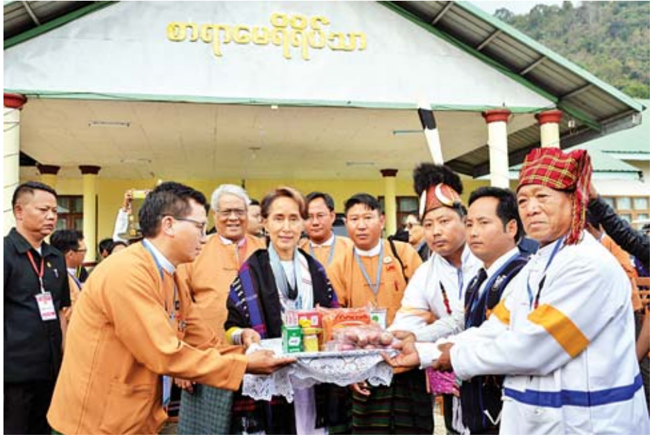
နိုင်ငံတော်၏အတိုင်ပင်ခံပုဂ္ဂိုလ် ဒေါ်အောင်ဆန်းစုကြည် လဟယ်မြို့၌ ဒေသဖွံ့ဖြိုးရေးအတွက် ထောက်ပံ့ငွေ ကျပ်သိန်း ၂၀၀ နှင့် စားသောက်ကုန်ပစ္စည်းများ ပေးအပ်ရာ မြို့မိမြို့ဖများက လက်ခံကြစဉ်။

ဆောင်ရွက်ပေးရမည်ဖြစ်ကြောင်း၊ မိမိတို့နိုင်ငံသည် ပြည်ထောင်စုနိုင်ငံဖြစ်ပါကြောင်း၊ ဒေသတိုင်းတွင် ပြောဆိုသည့် ဘာသာစကားများ ကွာခြားပါကြောင်း၊ မိမိတို့အစိုးရ အနေဖြင့် ဘာသာစကားကွဲပြားသည့် ဒေသများကို ဦးစားပေးရွေးချယ်ရေးအတွက် မူဝါဒချမှတ်ရန် စီစဉ်လျက် ရှိပါကြောင်း၊ နာဂရိုးရာ ထုံးတမ်းအစဉ်အလာများဖြစ်သည့် တောင်ယာစိုက်ပျိုးမှုများနှင့် ပတ်သက်ပြီး ခွင့်ပြုချက်များ ရယူရာတွင် လွယ်ကူလျင်မြန်စေရန် အုပ်ချုပ်ရေးဘက် တာဝန်ရှိသူများက ဆောင်ရွက်ပေးရမည်ဖြစ်ကြောင်း၊ ဥပဒေနှင့်အညီ လျင်မြန်စွာဆောင်ရွက်နိုင်ရေး တိုင်းဒေသကြီးအစိုးရအား မှာကြားခဲ့ပါကြောင်း၊ တိုင်းရင်းသား ရိုးရာယဉ်ကျေးမှု ဓလေ့ထုံးတမ်း ထိန်းသိမ်းမြှင့်တင်ရေးနှင့် ပတ်သက်၍ တိုင်းရင်းသားလူမျိုးများရေးရာဝန်ကြီးဌာနနှင့် တိုင်းဒေသကြီးအစိုးရတို့က ဖြည့်ဆည်းဆောင်ရွက်ပေးရန်ဖြစ်ကြောင်း အကျယ်တဝင့် ရှင်းလင်းပြောကြားသည်။