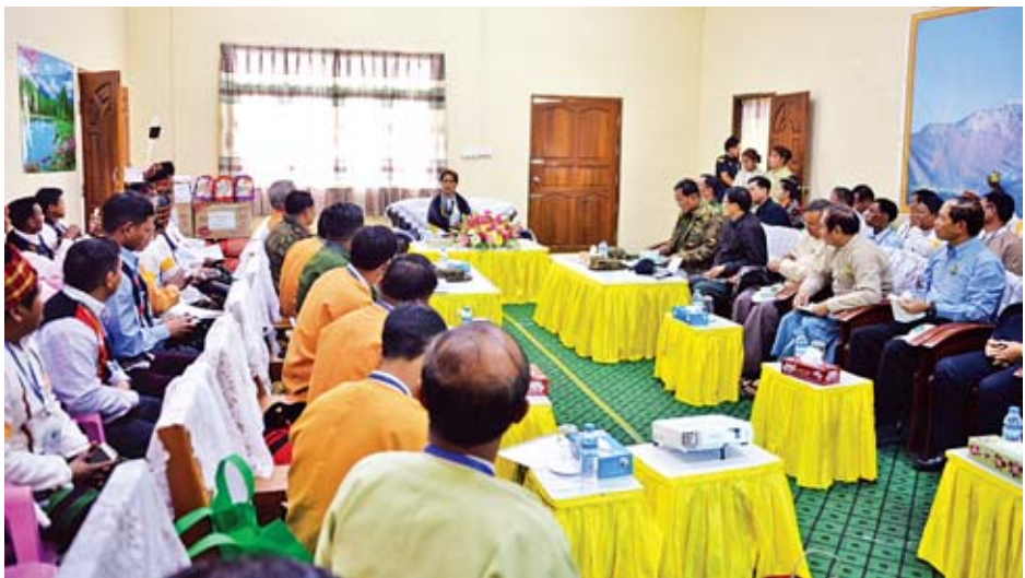
နိုင်ငံတော်၏အတိုင်ပင်ခံပုဂ္ဂိုလ် ဒေါ်အောင်ဆန်းစုကြည်နှင့်အဖွဲ့ လဟယ်မြို့၊ စာရာမေရီရိပ်သာ၌ နာဂကိုယ်ပိုင်အုပ်ချုပ်ခွင့်ရဒေသ ဦးစီးအဖွဲ့ဝင်များ၊ ဝန်ထမ်းများ၊ ရပ်မိရပ်ဖများ၊ ဒေသခံပြည်သူများနှင့် တွေ့ဆုံစဉ်။

ရှင်းလင်းပြောကြား ထိုနောက်တက်ရောက်လာကြသူများက သိမ်းဆည်းမြေ ပြန်လည်ရရှိရေး၊ မြေယာနစ်နာမှုအတွက် မြေကွက်အစားရရှိရေး၊ နာဂရိုးရာ ထုံးတမ်းအစဉ်အလာများအား မြှင့်တင်ရာတွင် နိုင်ငံတော်အစိုးရက ပံ့ပိုးကူညီပေးရေး၊ ဝန်ထမ်းများ ခန့်အပ်ရာတွင် ဒေသခံများအား ဦးစားပေးခန့်ထားရေး၊ မြေယာသိမ်းဆည်းပြီး မြေကွက်များ ထုတ်ဖော်ခဲ့ရာတွင် ကျန်မြေကွက်များတွင် နစ်နာသူများ နေထိုင်ခွင့်ရရှိရေး၊ ဟုမ္မလင်းမှ ခန္တီးသို့ သစ်သယ်ယူခွင့် ရရှိရေး၊ နန်စီပွန်ကျေးရွာမှ ဒေသခံပြည်သူများ၏ ပညာရေး၊ ကျန်းမာရေး၊ လူမှုဘဝဖွံ့ဖြိုးတိုးတက်ရေးအတွက် ဆောင်ရွက်ပေးရေးနှင့် တရားဥပဒေစိုးမိုးရေးအတွက် ဆောင်ရွက်ပေးရေး၊ ဆရာ ဆရာမ ဖြည့်ဆည်းပေးရေး၊ တိုင်းရင်းသားဘာသာစာအုပ်များ ထောက်ပံ့ပေးရေး၊ တိုင်းရင်းသားစာပေသင်ကြားသည့် ဆရာ ဆရာမများအား သင်တန်းများ တက်ရောက်ခွင့်ရရှိရေး၊ ခန္တီးမြို့၊ လှုပ်စစ်ဓာတ်အား ရရှိရေး၊ နန်စီပွန်ဒေသတွင် ကျောက်စိမ်း တူးဖော်ခွင့်ရရှိသည့် ကုမ္ပဏီများအနေဖြင့် ခွင့်ပြုရက်နှင့်