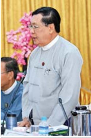
ပြည်ထောင်စုဝန်ကြီး ဦးသိန်းဆွေ