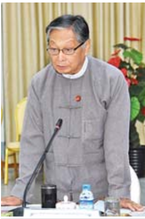
ပြည်ထောင်စုဝန်ကြီး ဦးကျော်တင်ဆွေ

ထားဝယ်အထူးစီးပွားရေးဇုန် အကောင်အထည်ဖော်ခဲ့မှုကို ကြည့်မည်ဆိုလျှင် တိုးတက်မှုနေ့စွဲအားနည်းနေသည်ကို တွေ့ရပါကြောင်း၊ တိုးတက်