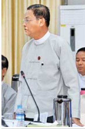
ပြည်ထောင်စုရှေ့နေချုပ် ဦးထွန်းထွန်းဦး

မှုအနေဖြင့် ထားဝယ်အထူးစီးပွားရေးဇုန်မှ ထီးစီးသို့ ဆက်သွယ်ထားသည့် နှစ်လမ်းသွားကားလမ်း အဆင့်မြှင့်တင် ဖောက်လုပ်ခြင်းအား ထိုင်နိုင်ငံမှ NEDA နှင့် ဆောက်လုပ်ရေးဝန်ကြီးဌာနတို့ Terms of Reference (TOR) မှုကြမ်းညှိနှိုင်းနိုင်ခဲ့ပြီး ကွင်းဆင်းစစ်ဆေးမှုများ ဆောင်ရွက်နေသည်ကို တွေ့ရပါကြောင်း၊ တိုးတက်မှုနေ့စွဲအပိုင်းသည် ကနဦးစီမံကိန်းများ ရှေ့ဆက်နိုင်ရေးဖြစ်ပါကြောင်း၊ ထားဝယ်အထူးစီးပွားရေးဇုန်အတွက် ဆွေးနွေးညှိနှိုင်းမှုများ ဆောင်ရွက်ရာတွင် အစိုးရချင်းပူးပေါင်းညှိနှိုင်းဆောင်ရွက်မှုအပိုင်းများ ရှိသကဲ့သို့ ပုဂ္ဂလိကကုမ္ပဏီ ITD နှင့် ညှိနှိုင်းဆောင်ရွက်ရမည့် အပိုင်းများလည်းရှိပါကြောင်း၊ စီမံခန့်ခွဲမှုကော်မတီအနေဖြင့် ဥပဒေကြောင်းအရ ကြိုတင်လေ့လာသုံးသပ်ထားမှုများနှင့် ဆက်လက်ဆောင်ရွက်သင့်သည့်အစီအမံများကို ပွင့်လင်းမြင်သာစွာ ဆွေးနွေးကြစေလိုပါကြောင်း၊ ကနဦးစီမံကိန်းများ နှေးကွေးနေသည့်အတွက် မြန်မာထိုင်းဂျပန် သုံးနိုင်ငံ ညှိနှိုင်းဆောင်ရွက်ရမည့် သဘောဖြစ်ပါကြောင်း၊ ထားဝယ်ဇုန်နှင့်ပတ်သက်၍ (Joint Coordination Committee-JCC) ညှိနှိုင်းအစည်းအဝေးခေါ်နိုင်ရေး ညှိနှိုင်းဆောင်ရွက်ရမည်ဖြစ်ပါကြောင်း၊ အထူးစီးပွားရေးဇုန်များကို ထိရောက်သည့် တိုးတက်မှုများရရှိရန် ကြိုးပမ်းဆောင်ရွက်ကြရမည်ဖြစ်ပါကြောင်း၊ ထားဝယ်အထူးစီးပွားရေးဇုန် စီမံကိန်းများအတွက် ဖွဲ့စည်းထားသည့် Special Purpose Vehicle (SPV) အခန်းကဏ္ဍပိုမိုလှုပ်ရှားရှင်သန်တက်ကြွစွာ ဆောင်ရွက်နိုင်ရေးကိုလည်း အလေးထားဆောင်ရွက်ကြစေလိုပါကြောင်း၊ ပင်မစီမံကိန်းစတင်နိုင်ရန် မည်သို့သောနည်းလမ်းများဖြင့် ဆောင်ရွက်သင့်သည်ကို ဆွေးနွေးကြစေလိုပါကြောင်း။