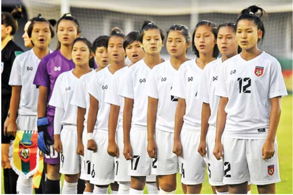
အာရှခြေစစ်ပွဲယှဉ်ပြိုင်နေသည့် မြန်မာ ယူ-၁၆ အမျိုးသမီးအသင်း။