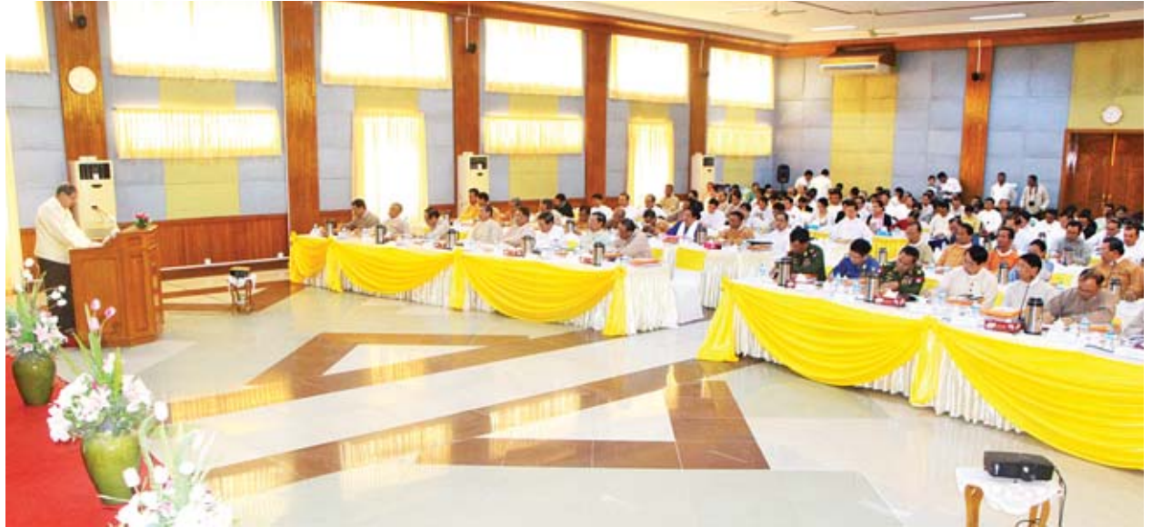
Development Plan(MSDP)နှင့် Project Bankတို့ကို စီမံကိန်းနှင့် ဘဏ္ဍာရေးဝန်ကြီးဌာန ဒုတိယဝန်ကြီး ဦးဆောင်အောင်ကလည်းကောင်း ဖြည့်စွက်ရှင်းလင်းတင်ပြခဲ့သည်။

ထို့နောက် ၂၀၁၉-၂၀၂၀ ဘဏ္ဍာရေးနှစ်၊ အမျိုးသားစီမံကိန်းရေးဆွဲခြင်းကို စီမံကိန်းရေးဆွဲရေးဦးစီးဌာန ညွှန်ကြားရေးမှူးချုပ်ကလည်းကောင်း၊ အရအသုံးခန့်မှန်းခြေငွေစာရင်း ရေးဆွဲခြင်းကို ရသုံးမှန်းခြေငွေစာရင်းဦးစီးဌာန ညွှန်ကြားရေးမှူးချုပ်က လည်းကောင်း၊ Myanmar Sustainable