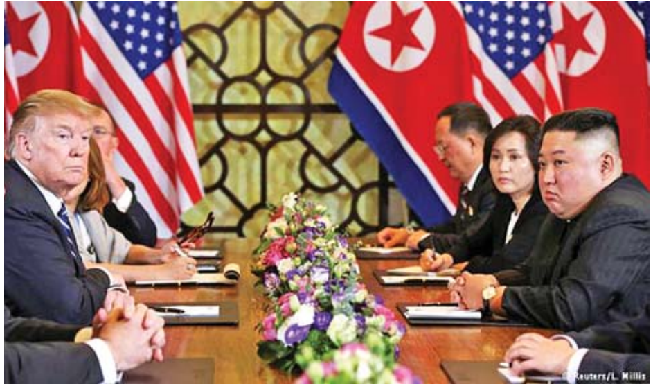
သမ္မတထရန်က ပြောကြားခဲ့သည်။

သို့သော် နှစ်နိုင်ငံထိပ်သီးအစည်းအဝေးပွဲကို နောက်တစ်ကြိမ် ကျင်းပရန် အစီအစဉ်မရှိသေးပါကြောင်း