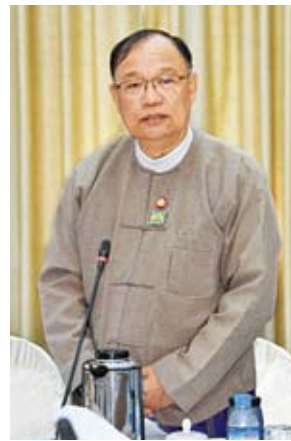
ပြည်ထောင်စုဝန်ကြီး ဦးသန်းစင်မောင်

လျက်ရှိသည့် အထူးစီးပွားရေးဇုန်များ ထိရောက်အောင်မြင်စွာ အကောင်အထည်ဖော်နိုင်ရေးအတွက် စနစ်တကျသေချာစွာ ဝိုင်းဝန်းကြိုးပမ်းဆောင်ရွက်ကြရမည်ဖြစ်ပါကြောင်း၊ နိုင်ငံခြားသားရင်းနှီးမြှုပ်နှံမှုများ ယုံကြည်စိတ်ချစွာ လာရောက်ရင်းနှီးမြှုပ်နှံရန်လိုပါကြောင်း၊ ရင်းနှီးမြှုပ်နှံသူများအတွက် ဥပဒေနှင့်အညီ ဝန်ဆောင်မှုပေးရမည့်ကိစ္စရပ်များ၊ နိုင်ငံတကာစံချိန်စံညွှန်းများနှင့် ကိုက်ညီသည့် လုပ်ထုံးလုပ်နည်းများကို သက်ဆိုင်ရာဝန်ကြီးဌာနများအနေဖြင့် ပေါင်းစပ်ညှိနှိုင်းဆောင်ရွက်ပေးကြရမည်ဖြစ်ပါကြောင်း၊ နိုင်ငံတကာစံချိန်စံညွှန်းများ၊ လုပ်ထုံးလုပ်နည်းများဖြင့် ကိုက်ညီသည့် အာမခံချက်များ ပေးနိုင်မှသာ ရင်းနှီးမြှုပ်နှံသူများ ဝင်ရောက်လာမည်ဖြစ်ပါကြောင်း၊ အစည်းအဝေး