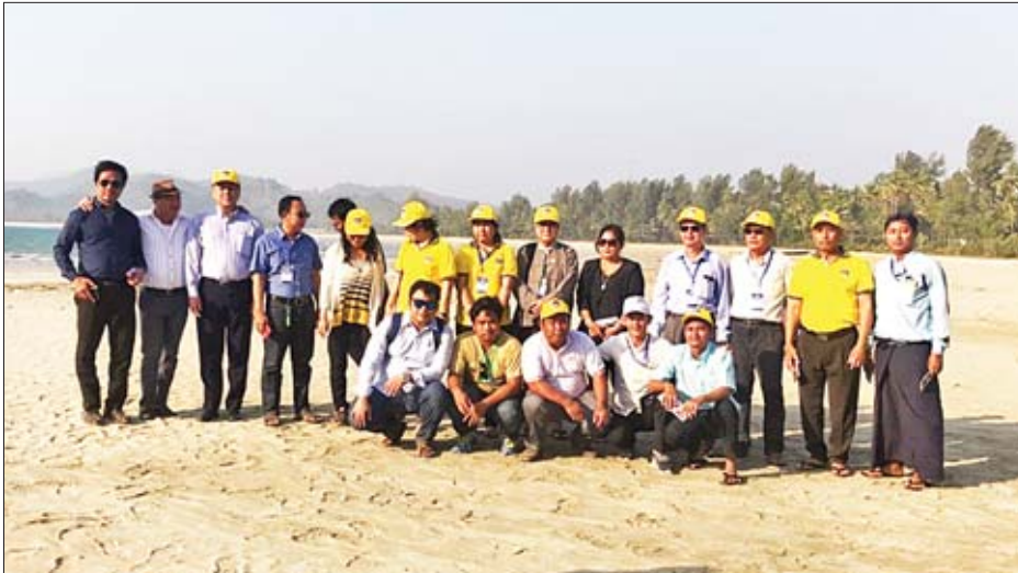
ငပလီကမ်းခြေ၌ ဖေဖော်ဝါရီ ၂၁ ရက်မှ ၂၃ ရက်အထိ ကျင်းပခဲ့သည့် ရခိုင်ပြည်နယ် ရင်းနှီးမြှုပ်နှံမှုပြုလုပ်ရန် အလားအလာရှိသည့် နေရာများသို့ သွားရောက်လေ့လာစဉ်။

»» ရခိုင်ပြည်နယ်မှ ရင်းနှီးမြှုပ်နှံဆောင်ရွက်ရန် အဆိုပြုရာ၌ ဟိုတယ်နှင့် ခရီးသွားကဏ္ဍကို အထူးစိတ်ဝင်စားမှုများပြားပြီး စိုက်ပျိုးရေး၊ စွမ်းအင်၊ မွေးမြူရေးနှင့် ရေလုပ်ငန်း၊ ကုန်ထုတ်လုပ်မှု၊ ဆောက်လုပ်ရေး၊ လူ့စွမ်းအားအရင်းအမြစ်ဖွံ့ဖြိုးတိုးတက်ရေးနှင့် အခြားကဏ္ဍတွင်လည်း စိတ်ဝင်စားမှုရှိကြောင်း သိရသည်။ “ဟိုတယ်နှင့် ခရီးသွားလာရေးကဏ္ဍမှာ စိတ်ဝင်စားမှုရှိတဲ့နေရာတွေကို ပြောရရင် မာန်အောင်နဲ့ ငပလီကမ်းခြေ တစ်ဝိုက်ရှိမယ်။ ဝှက်ကမ်းခြေရှိမယ်။ အဲဒီနေရာတွေက ဟိုတယ်နှင့် ခရီးသွားကဏ္ဍမှာ စိတ်ဝင်စားမှုအရှိဆုံးလို့ ပြောလို့ရပါတယ်။ မွေးမြူရေးနှင့် ရေလုပ်ငန်းမှာဆိုရင် ရခိုင်ပြည်နယ် တောင်ပိုင်းနဲ့ မြောက်ပိုင်းကိုပါ စိတ်ဝင်စားမှုရှိတယ်။ အဓိကက ငါ၊ ပုစွန်မွေးမြူရေး လုပ်ငန်းအတွက် ဝင်ရောက်လာဖို့ရှိတယ်။ ပြည်နယ်အစိုးရက လုပ်ငန်းတွေ အကောင်အထည်ဖော်နိုင်ဖို့ စတင်ဖိတ်ခေါ်နေပါပြီ။ လုပ်ငန်းရှင်တွေဘက်ကလည်း ဆက်သွယ်မှုတွေ ရှိနေပါပြီ”ဟု