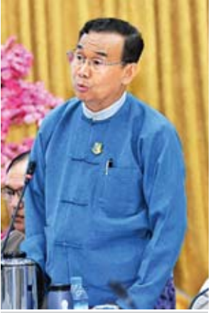
ပြည်ထောင်စုဝန်ကြီး ဦးအုန်းဝင်း