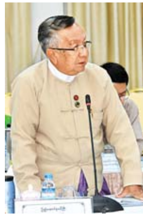
ပြည်ထောင်စုဝန်ကြီး ဦးဟန်ဇော်