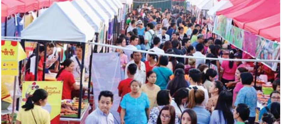
ယမန်နှစ်ကျင်းပခဲ့သည့် ရန်ကုန်ညဈေးတန်းပွဲတော်ကို တွေ့ရစဉ်။

ရန်ကုန် ဖေဖော်ဝါရီ ၂၀ ဥရောပအစားအစာများနှင့် မြန်မာ့ရိုးရာအစားအစာများပါဝင်သော ရန်ကုန်ညဈေးတန်းပွဲတော်ကို ပြည်သူ့ရင်ပြင် (ပြည်လမ်းဝင်ပေါက်)ရှိ ကွင်းအမှတ် (၁)၌ မတ် ၁ ရက်မှ ၃ ရက်အထိ ညနေ ၄ နာရီမှ ည ၁၀ နာရီအထိ စည်ကားသိုက်မြိုက်စွာ ကျင်းပသွားမည်ဖြစ်ကြောင်း သိရသည်။