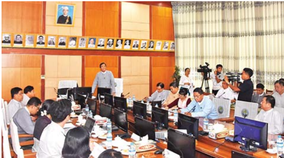
စာအုပ်ဆိုင်ရာ အရည်အသွေး ပိုမိုမြင့်တင်နိုင်ရေးအတွက် ကျောင်းသုံးစာအုပ်များ၏ အရည်အသွေး စံချိန်စံညွှန်းများ နှင့် ကုန်ကြမ်းများ၏ အရည်အသွေး ပုံနှိပ်လုပ်ငန်း