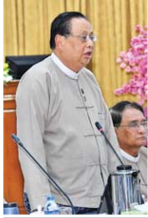
ပြည်ထောင်စုဝန်ကြီး ဦးဝင်းခိုင်