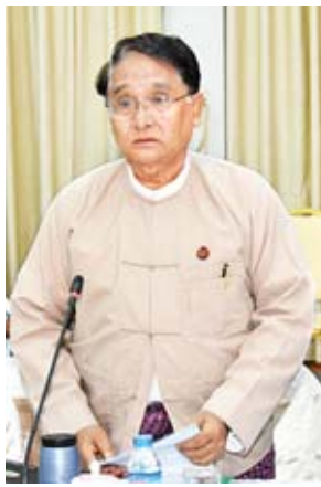
ပြည်ထောင်စုဝန်ကြီး ဒေါက်တာ သန်းမြင့်