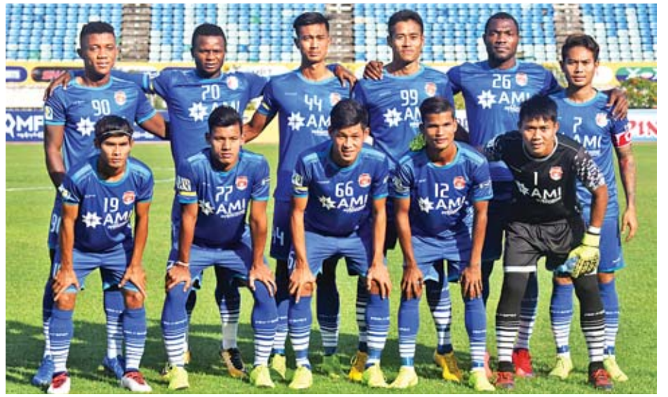
ဒုတိယနေရာတွင် ရပ်တည်နေသည့် ဧရာဝတီအသင်း။