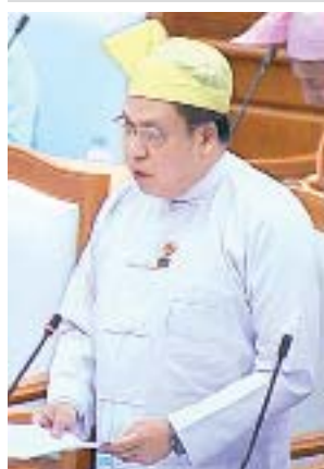
ဒုတိယဝန်ကြီး ဦးဆက်အောင်