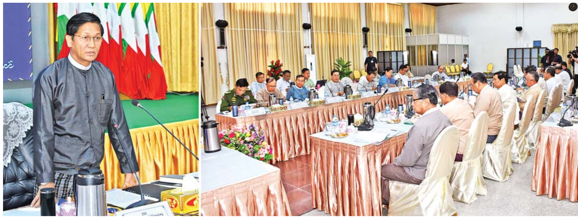
ဒုတိယသမ္မတ ဦးဟင်နရီဗန်ထီးယူ မြန်မာအထူးစီးပွားရေးဇုန်ဆိုင်ရာပဟိုအဖွဲ့ လုပ်ငန်းညှိနှိုင်းအစည်းအဝေး (၁/၂၀၁၉) တွင် အမှာစကားပြောကြားစဉ်။

မြန်မာအထူးစီးပွားရေးဇုန်ဆိုင်ရာပဟိုအဖွဲ့၏ လုပ်ငန်းညှိနှိုင်းအစည်းအဝေး (၁/၂၀၁၉) ကို ယနေ့ညနေ ၃ နာရီတွင် နေပြည်တော်ရှိ စီးပွားရေးနှင့် ကူးသန်းရောင်းဝယ်ရေးဝန်ကြီးဌာန အစည်းအဝေးခန်းမ၌ ကျင်းပရာ မြန်မာအထူးစီးပွားရေးဇုန် ဆိုင်ရာပဟိုအဖွဲ့ဥက္ကဋ္ဌ ဒုတိယသမ္မတ ဦးဟင်နရီဗန်ထီးယူ တက်ရောက်အမှာစကားပြောကြားသည်။