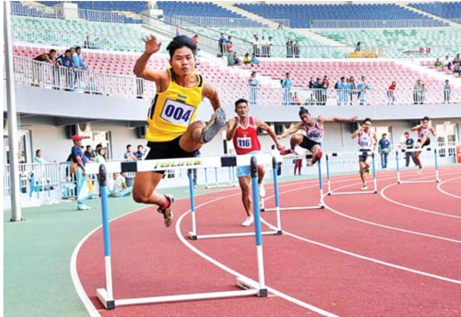
အမျိုးသားမီတာ ၄၀၀ တန်းကျော်ပြေးပွဲ ယှဉ်ပြိုင်စဉ်။

ပြည်ထောင်စုနယ်မြေ နေပြည်တော် နွေရာသီ အခြေခံအားကစား သင်တန်းများ ဖွင့်ပွဲအခမ်းအနားတွင် ကရာတေးဒိုအားကစားနည်း ယှဉ်ပြိုင် သရုပ်ပြစဉ်။