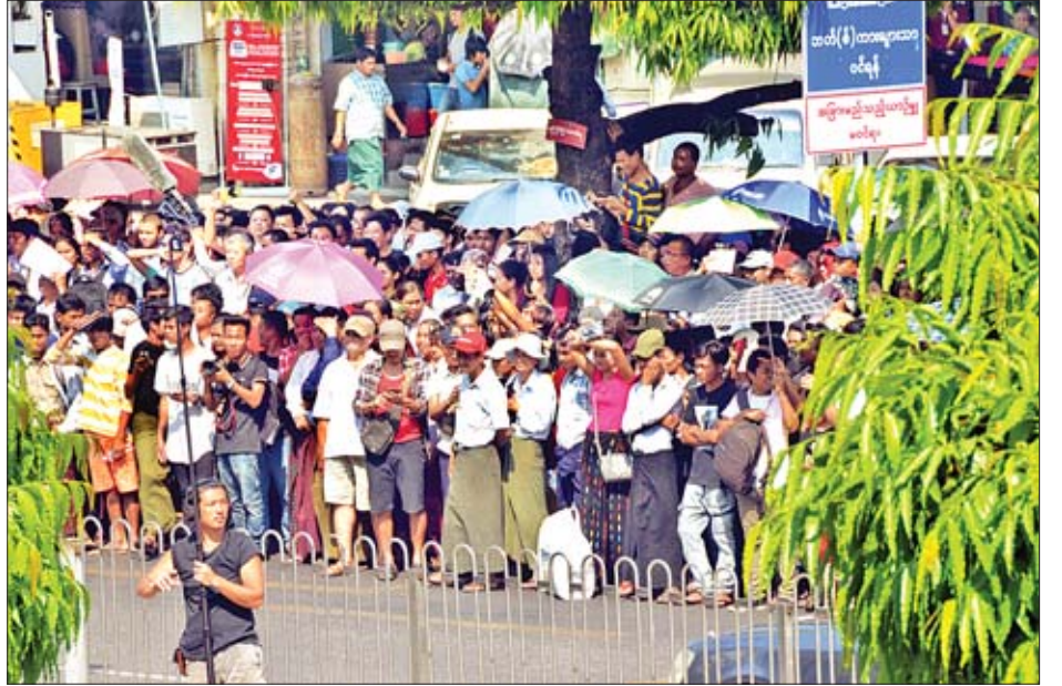
ရန်ကုန်မြို့ ဆူးလေဘုရားလမ်း၌ Line Walker-2 ရုပ်ရှင်ဇာတ်ကား ဇာတ်ဝင်ခန်းရိုက်ကူးနေမှုနှင့် လာရောက်ကြည့်ရှုသည့် ပရိသတ်များကို တွေ့ရစဉ်။