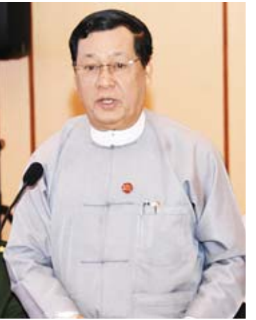
ပြည်ထောင်စုဝန်ကြီး ဦးသန်းဆွေ