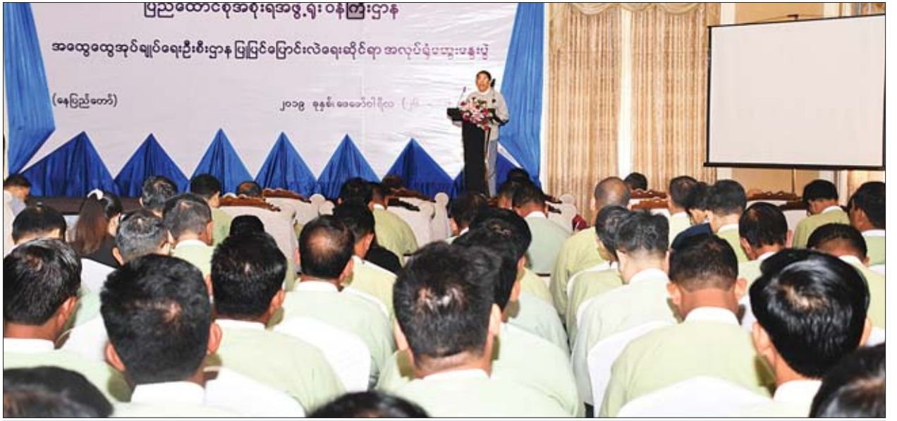
ပြည်ထောင်စုဝန်ကြီး ဦးမင်းသူ ပြည်ထောင်စုအစိုးရအဖွဲ့ရုံးဝန်ကြီးဌာန အထွေထွေအုပ်ချုပ်ရေးဦးစီးဌာန ပြုပြင်ပြောင်းလဲရေးဆိုင်ရာ အလုပ်ရုံဆွေးနွေးပွဲ တွင် အမှာစကားပြောကြားစဉ်။

နယ်တိုးသုံးအချက် ဒေသဖွံ့ဖြိုးရေးသည် Regional Development ကို ရည်ညွှန်းခြင်းဖြစ်ပြီး အုပ်ချုပ်ရေးအနေဖြင့် မလုပ်မဖြစ် လုပ်ဆောင်ရမည့် ဦးစားပေးတာဝန်ကြီးတစ်ရပ် ဖြစ်ပါကြောင်း၊ နယ်တိုးလေးအချက်ဖြစ်သည့် ပြည်သူ့အကျိုးပြု ဆောင်ရွက်ရေးဆိုသည်အချက်နှင့်ပတ်သက်ပြီး မိမိတို့ လက်တွေ့ဆောင်ရွက်ပေးနေရသည့်အတိုင်း လူထုပတ်ဝန်းကျင် ပြည်သူ့ရေးရာ ဝန်ဆောင်မှုများ ထိရောက်အောင်ဆောင်ရွက်ရေး၊ People Centric Effective Public Service ဆိုပြီး ပြင်ဆင်ရန် သင့်၊ မသင့်ကိုလည်း ထည့်သွင်းဆွေးနွေးပြီး အကြံပြုပေးရန် တိုက်တွန်းလိုပါကြောင်း၊ အဖွဲ့ အစည်းများ၏ သဘောတရားအရ အနာဂတ်မျှော်မှန်းချက် (Vision)၊ လုပ်ငန်းတာဝန် (Mission) များကိုချမှတ်ပြီး ဆောင်ရွက်ရာတွင် လိုက်လျော