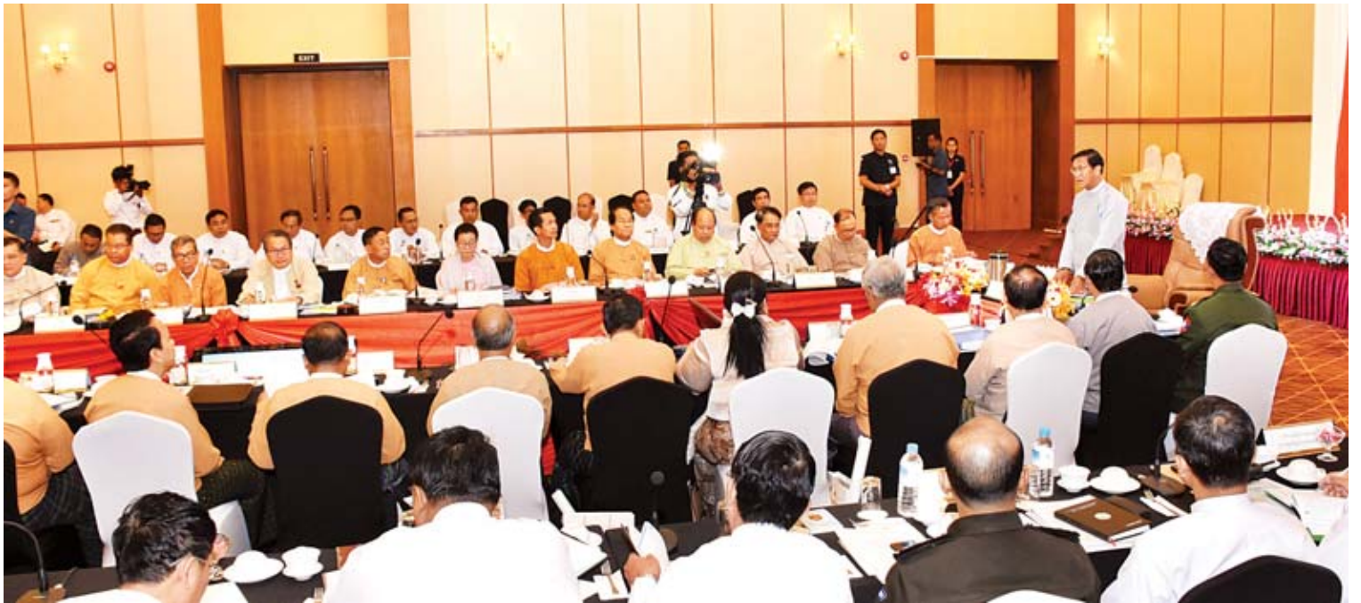
ဒုတိယသမ္မတ ဦးဟင်နရီဗန်ထီးယူ အမျိုးသားခရီးသွားလုပ်ငန်း ဖွံ့ဖြိုးတိုးတက်ရေးဗဟိုကော်မတီ(၁/၂၀၁၉)ကြိမ်မြောက် အစည်းအဝေးတွင် အမှာစကားပြောကြားစဉ်။

နေပြည်တော် ဖေဖော်ဝါရီ ၂၆ အမျိုးသားခရီးသွားလုပ်ငန်း ဖွံ့ဖြိုးတိုးတက်ရေး ဗဟိုကော်မတီ(၁/၂၀၁၉) ကြိမ်မြောက် အစည်းအဝေးကို ယနေ့နံနက် ၈ နာရီတွင် နေပြည်တော်ရှိ Hotel Max ၌ ကျင်းပရာ အမျိုးသားခရီးသွားလုပ်ငန်း ဖွံ့ဖြိုးတိုးတက်ရေး ဗဟိုကော်မတီဥက္ကဋ္ဌ ဒုတိယသမ္မတ ဦးဟင်နရီဗန်ထီးယူ တက်ရောက် အဖွင့်အမှာစကားပြောကြားသည်။