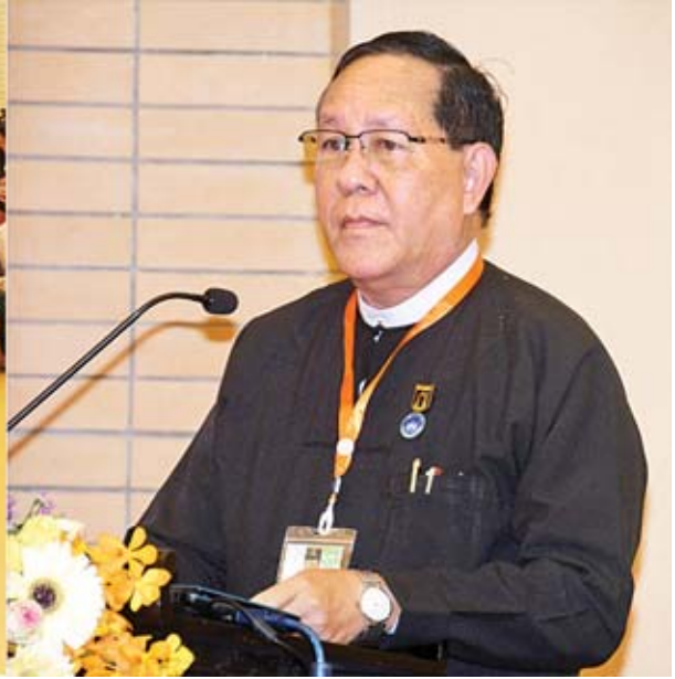
ပြည်ထောင်စုတရားသူကြီးချုပ် ဦးထွန်းထွန်းဦး တရားရုံးကဦးဆောင်သည့် စေ့စပ်ဖြေရှင်းရေးစမ်းသပ်အစီအစဉ် မိတ်ဆက်ရှင်းလင်းခြင်းအခမ်းအနားတွင် အမှာစကားပြောကြားစဉ်။