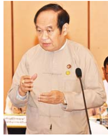
ပြည်ထောင်စုဝန်ကြီး ဒေါက်တာ မြင့်ထွေး