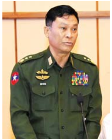
ပြည်ထောင်စုဝန်ကြီး ဒုတိယပိုလ်ချုပ်ကြီး ကျော်ဆွေ

အစည်းအဝေးသို့ ဗဟိုကော်မတီဝင်များ ဖြစ်ကြသည့် ပြည်ထောင်စုဝန်ကြီးများ၊ တိုင်းဒေသကြီးနှင့်ပြည်နယ်ဝန်ကြီးချုပ်များ၊ ဒုတိယဝန်ကြီးများ၊ နေပြည်တော်ကောင်စီဝင်၊ တိုင်းဒေသကြီးနှင့် ပြည်နယ်ဝန်ကြီးများ၊ ဌာနဆိုင်ရာအကြီးအကဲများ၊ မြန်မာနိုင်ငံ ခရီးသွားလုပ်ငန်းအဖွဲ့ချုပ်နှင့် မြန်မာနိုင်ငံတော်တယ်ဆိုင်ရာ လုပ်ငန်းရှင်များအသင်းတို့မှ တာဝန်ရှိသူများနှင့် ဖိတ်ကြားထားသူများ တက်ရောက်ကြသည်။