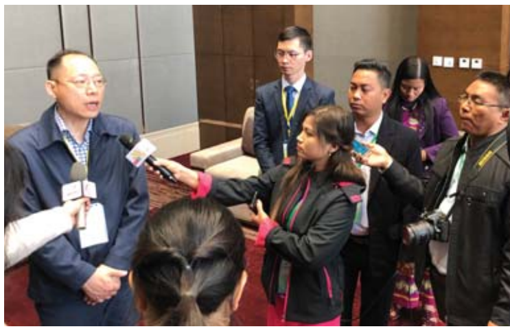
မြန်မာနိုင်ငံဆိုင်ရာ စီးပွားရေးနှင့် ကူးသန်းရောင်းဝယ်ရေးဆိုင်ရာ တရုတ်သံမှူး ရှစ်ကိုရှောင်

မြန်မာနိုင်ငံဆိုင်ရာ စီးပွားရေးနှင့် ကူးသန်းရောင်းဝယ်ရေးဆိုင်ရာ တရုတ်သံမှူး ရှစ်ကိုရှောင် မေး။ ။ တရုတ်-မြန်မာ နယ်စပ်မှာ လက်ရှိ ဆွေးနွေးနေတဲ့ စီးပွားရေးပူးပေါင်း ဆောင်ရွက်မှုနဲ့ပတ်သက်ပြီး သိပါရစေ။