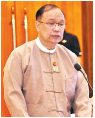
ပြည်ထောင်စုဝန်ကြီး ဦးသန့်စင်မောင်