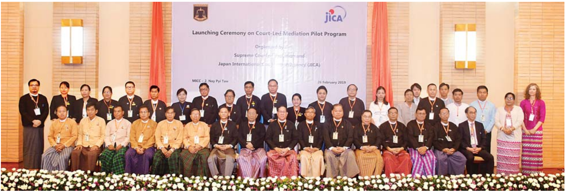
ပြည်ထောင်စုတရားသူကြီးချုပ် ဦးထွန်းထွန်းဦး တရားရုံးကဦးဆောင်သည့် စေ့စပ်ဖြေရှင်းရေးစမ်းသပ်အစီအစဉ် မိတ်ဆက်ရှင်းလင်းခြင်းအခမ်းအနားသို့ တက်ရောက်လာကြသူများနှင့်အတူ စုပေါင်းမှတ်တမ်းတင်ဓာတ်ပုံရိုက်စဉ်။