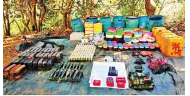
AA သောင်းကျန်းသူများထံမှ သိမ်းဆည်းရမိပစ္စည်းများအား တွေ့ရစဉ်။

ဖြစ်စဉ်များတွင် မိမိဘက်မှ စစ်သည်အချို့ကျဆုံး၊ ဒဏ်ရာရရှိခဲ့ပြီး AA သောင်းကျန်းသူအဖွဲ့ထံမှ အလောင်း လေးလောင်း၊ လက်နက်မျိုးစုံ လေးလက်၊ ခဲယမ်းနှင့် ဆက်စပ်ပစ္စည်းများ၊ လေ့ကျင့်ရေးအသုံးအဆောင်ပစ္စည်းများ၊ အရက်စည် ခုနစ်ပုံ၊ လမ်းလျှောက်စကားပြောစက်အားသွင်းခုံများ၊ မိုင်း ပြုလုပ်ရာတွင် အသုံးပြုသည့် ကွန်ကျူးပိုက်များ၊ ကော်ဘူးများ၊ ဝါးနှင့်ခလုတ် များ၊ ယမ်းစိမ်းပုံးများ၊ ဓာတ်မြေဩဇာများနှင့် တပ်မတော်အရာရှိ စစ်သည် အဆင့်တံဆိပ်များ၊ AA သောင်းကျန်းသူ လက်မောင်းတံဆိပ်များကို သိမ်းဆည်းရရှိခဲ့ကြောင်းနှင့် ရခိုင်ပြည်နယ်အတွင်း တရားဥပဒေစိုးမိုးရေး၊ နယ်မြေတည်ငြိမ်အေးချမ်းရေးအတွက် တပ်မတော်စစ်ကြောင်းများက