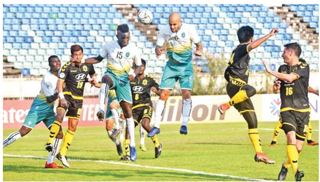
ရန်ကုန်အသင်းနှင့် တမ်ပနီစ်ရီဟအသင်းတို့ ယှဉ်ပြိုင်နေစဉ်။