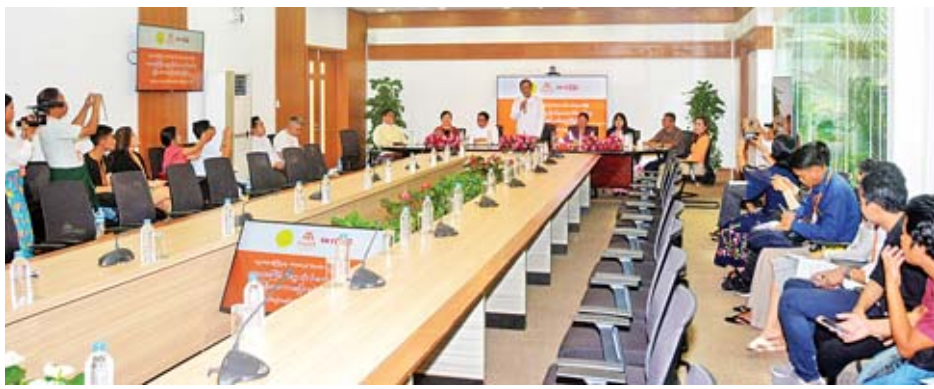
ပထမအကြိမ် တက္ကသိုလ်၊ ကောလိပ်ပေါင်းစုံ မြန်မာစကားပြောစွမ်းရည်ပြိုင်ပွဲနှင့်ပတ်သက်၍ စာနယ်ဇင်း ရှင်းလင်းပွဲ ကျင်းပစဉ်။

ပညာရေးဝန်ကြီးဌာန၊ Telecom International Myanmar Co., Ltd. (Mytel) နှင့် Skynet တို့ ပူးပေါင်းမှုဖြင့် မြန်မာလူငယ်များ မြန်မာစကားပြော စွမ်းရည်များ တိုးတက်လာစေရေး၊ ထိုမှတစ်ဆင့် ပြင်ပစာပေဖတ်ရှုသည့် အလေ့အထများ ထွန်းကားလာစေ ရေးတို့ကိုရည်ရွယ်၍ ပထမအကြိမ် တက္ကသိုလ်၊ ကောလိပ် ပေါင်းစုံ မြန်မာစကားပြော စွမ်းရည်ပြိုင်ပွဲကို ဖေဖော်ဝါရီ ၂၃ ရက်မှ မတ် ၃ ရက်အထိ ရန်ကုန်တက္ကသိုလ် စိန်ရတု ခန်းမ၌ ကျင်းပသွားမည်ဖြစ်ကြောင်း ယမန်နေ့ နံနက် ၁၁ နာရီက ရန်ကုန်မြို့၊ ဒဂုံမြို့နယ် တိရစ္ဆာန်ဥယျာဉ်လမ်းရှိ Mytel ရုံးချုပ်၌ ကျင်းပသည့် စာနယ်ဇင်းရှင်းလင်းပွဲမှ သိရသည်။