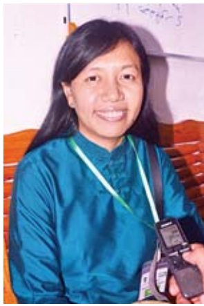
ဒါရိုက်တာ ကြည်ဖြူသျှင်