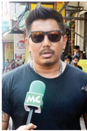
သရုပ်ဆောင် မင်းရာဇာ