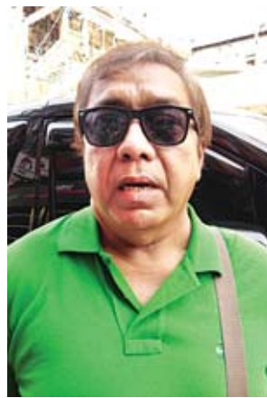
ဦးလှကျော်