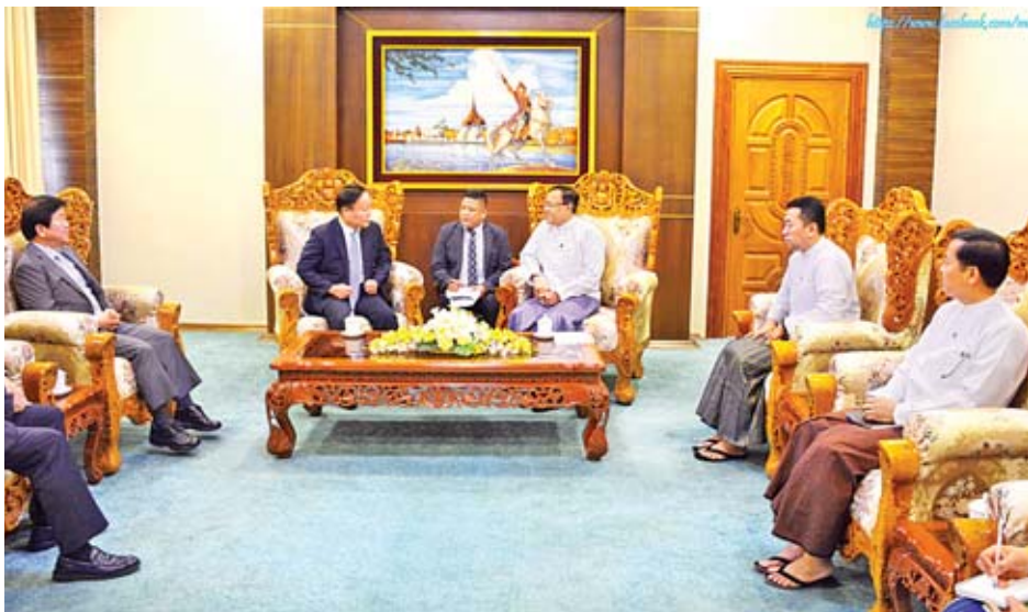
နှစ်နိုင်ငံအကြား ပူးပေါင်းဆောင်ရွက်မှုတိုးမြှင့်နိုင်မည့် အမြင်ချင်းဖလှယ်ဆွေးနွေးခဲ့ကြကြောင်း သိရသည်။ အလားအလာများနှင့်ပတ်သက်၍ ရင်းနှီးပွင့်လင်းစွာ သတင်းစဉ်

ကိုစွရပ်များ၊ နှစ်နိုင်ငံအကြား ပူးပေါင်းဆောင်ရွက်မှုတိုးမြှင့် ရေးဆိုင်ရာ ကိစ္စရပ်များ၊ စံပြုကျေးရွာလှုပ်ရှားမှု (Saemaul Undong) စီမံကိန်းအောက်တွင် ဆောင်ရွက် လျက်ရှိသော စိုက်ပျိုးရေးနှင့်ပတ်သက်သည့် အစီအစဉ် ကိစ္စ၊ မြန်မာ-ကိုရီးယား ချစ်ကြည်ရေး(ရန်ကုန်-ဒလ) တံတားတည်ဆောက်ရေးစီမံကိန်းကိစ္စ၊ အာဆီယံ- ကိုရီးယားဆွေးနွေးဖက်နိုင်ငံများ မိတ်ဖက်ဆက်ဆံရေး ထူထောင်ခြင်းနှစ်(၃၀)ပြည့် ထိပ်သီးအစည်းအဝေး ကျင်းပမည်ကိစ္စ၊ ကိုရီးယားနိုင်ငံမှ တရားဝင် ဖွံ့ဖြိုးတိုးတက်မှု ဆိုင်ရာ အကူအညီများ(ODA)ပေးအပ်ခြင်းကိစ္စနှင့်