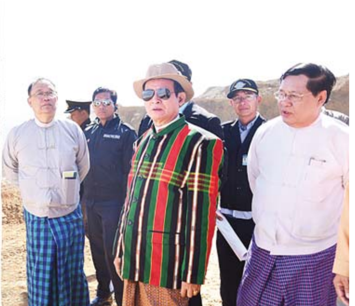
နိုင်ငံတော်သမ္မတ ဦးဝင်းမြင့် ဖလမ်းမြို့နယ် (ဆူရ်ဘုန်း) လေယာဉ်ကွင်း စီမံကိန်းလုပ်ငန်းခွင်အတွင်း လုပ်ငန်းများဆောင်ရွက်နေမှုကို ကြည့်ရှုစဉ်။

»» စာမျက်နှာ ၃ မှ လွှတ်တော်ရေးရာလုပ်ငန်း ဆောင်ရွက်မှုများကို လည်းကောင်း၊ ပြည်နယ်တရားလွှတ်တော် တရားသူကြီးချုပ် ဦးဝင်းမြင့်ကျော်က တရားလွှတ်တော်ရေးရာ လုပ်ငန်းဆောင်ရွက်နေမှု အခြေအနေများကို လည်းကောင်း ရှင်းလင်းတင်ပြကြသည်။ လိုအပ်ချက်များကို ဦးစားပေးဆောင်ရွက် နိုင်ငံတော်သမ္မတ ဦးဝင်းမြင့်က တင်ပြချက်များနှင့် စပ်လျဉ်း၍ ဖြည့်ဆည်းဆောင်ရွက်ပေးရမည့် ကိစ္စရပ်များကို သက်ဆိုင်ရာဝန်ကြီးဌာနများနှင့် ညှိနှိုင်းပေါင်းစပ်ဆောင်ရွက်ပေးသွားမည်ဖြစ်ကြောင်း၊ နိုင်ငံသူ နိုင်ငံသားများ၏ လိုအပ်ချက်များကို အတတ်နိုင်ဆုံး ဖြည့်ဆည်းပေးနိုင်ရန် ကြိုးစားဆောင်ရွက်လျက်ရှိကြောင်း၊ အထူးသဖြင့် နိုင်ငံတော်အစိုးရအနေဖြင့် မဖွံ့ဖြိုးသေးသည့် ဒေသများနှင့် တိုင်းရင်းသားများ၏ လိုအပ်ချက်များကို ဦးစားပေးဆောင်ရွက်ပေးနေပါကြောင်း ပြောကြားသည်။