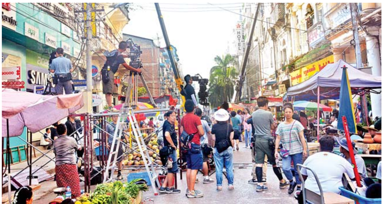
မဟာဗန္ဓုလပန်းခြံလမ်းတွင် Line Walker -2 ရုပ်ရှင်ဇာတ်ကားဇာတ်ဝင်ခန်း ရိုက်ကူးနေသည်ကို တွေ့ရစဉ်။