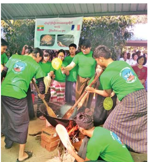
သတင်း-မျိုးမင်းသိန်း(မရမ်းကုန်း)

ရန်ကုန် ဇူလိုင်လ ၂၁ ရန်ကုန်နိုင်ငံခြားဘာသာတက္ကသိုလ် (YUFL) ၏ တတိယအကြိမ်မြောက် မြန်မာ့ရိုးရာထမနဲထိုးပြိုင်ပွဲကို ယနေ့နံနက်ပိုင်းတွင် ရန်ကုန်မြို့ တက္ကသိုလ်ရိပ်သာလမ်းရှိ အဆိုပီတက္ကသိုလ်ဝင်းအတွင်း၌ ကျင်းပခဲ့ကြရာ မြန်မာနိုင်ငံအခြေစိုက်သံရုံးများမှ သံတမန်များ လာရောက်ကြည့်ရှုအားပေးကြသည်။ ယနေ့ကျင်းပသော မြန်မာ့ရိုးရာထမနဲထိုးပြိုင်ပွဲတွင် ရန်ကုန်နိုင်ငံခြားဘာသာတက္ကသိုလ်မှ တရုတ်၊ အင်္ဂလိပ်၊ ပြင်သစ်၊ ဂျပန်၊ ကိုရီးယား၊ ရုရှား၊ ထိုင်း၊ မြန်မာစာမေဂျာတို့မှ ပိဇ္ဇာဘွဲ့ကြို ကျောင်းသားကျောင်းသူများပါဝင်ကာ အသင်းတစ်သင်းလျှင် ပြိုင်ပွဲဝင်ကျောင်းသားရှစ်ဦး၊ ကျောင်းသူနှစ်ဦးနှင့် ကြီးကြပ်သူဆရာမနှစ်ဦး စုစုပေါင်း ၁၂ ဦးစီတို့ အသင်းလိုက် ထမနဲထိုး ပါဝင်ယှဉ်ပြိုင်ကြသည်။ အဆိုပီထမနဲထိုးပြိုင်ပွဲသို့ ရန်ကုန်မြို့ပေါ်ရှိ မြန်မာနိုင်ငံဆိုင်ရာ နိုင်ငံခြားသံရုံးများမှ သံအရာရှိကြီးများ၊ နိုင်ငံတကာအဖွဲ့အစည်းများ၊ ရန်ကုန်နိုင်ငံခြားဘာသာတက္ကသိုလ်မှ ပါမောက္ခချုပ်နှင့် ဒုတိယပါမောက္ခချုပ်များ၊ ဌာနမှူးများ၊ ဆရာ ဆရာမများ၊ ကျောင်းသား ကျောင်းသူများ တက်ရောက်ကြကြောင်း သိရသည်။