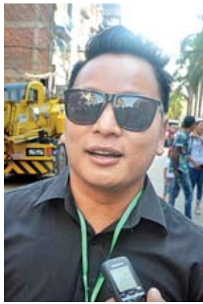
သရုပ်ဆောင် နေထူးနိုင်