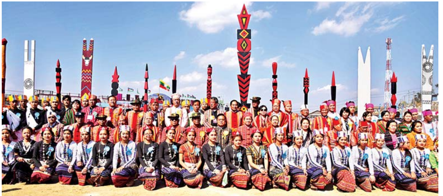
နိုင်ငံတော်သမ္မတ ဦးဝင်းမြင့်နှင့်ဇနီး ဒေါ်ချိုချို၊ ပြည်ထောင်စုဝန်ကြီးများ၊ ချင်းရိုးရာယဉ်ကျေးမှုကပွဲတွင် ဒေသခံတိုင်းရင်းသား တိုင်းရင်းသူများနှင့် စုပေါင်းမှတ်တမ်းတင်ဓာတ်ပုံရိုက်စဉ်။

ပြည်ထောင်စုကြီး၏အလှူတော်ဖန်တီးပုံဖော် ပြည်ထောင်စုအစိုးရအနေဖြင့်လည်း တိုင်းဒေသကြီး/ပြည်နယ် မခွဲခြားဘဲ ဖွံ့ဖြိုး တိုးတက်မှုကို ဟန်ချက်ညီအောင် ကြိုးပမ်း ဆောင်ရွက်နေပါကြောင်း၊ ချင်းပြည်နယ်၏ အလှူတရားသည် ချင်းပြည်နယ်တွင်သာမက ပြည်ထောင်စုကြီး၏ အလှူတရားဖြစ်အောင်၊ ချင်းပြည်နယ်၏ ဒီမိုကရေစီတန်ဖိုးထားမှုသည် ချင်းပြည်နယ်တွင်သာမက ပြည်ထောင်စုကြီး တစ်ခုလုံးတွင်လည်း ဒီမိုကရေစီ စံချိန်စံညွှန်း များအတိုင်း တန်ဖိုးထားရှိနိုင်အောင် ဆောင် ရွက်ရန် လိုအပ်ပါကြောင်း၊ ချင်းပြည်နယ်၏ ဘာသာစကား၊ စာပေ၊ ယဉ်ကျေးမှု၊ ဓလေ့ ထုံးတမ်းအစဉ်အလာများ၊ ဖွံ့ဖြိုးတိုးတက်ပြီး မိမိတို့၏ ရိုးရာယဉ်ကျေးမှု မပျောက်ပျက် အောင် မြှင့်တင်ထိန်းသိမ်းရန် လိုအပ်ပါ ကြောင်း၊ ပြည်ထောင်စုအတွင်းတွင်ရှိသည့် တိုင်းရင်းသားပြည်သူ ညီအစ်ကို မောင်နှမ