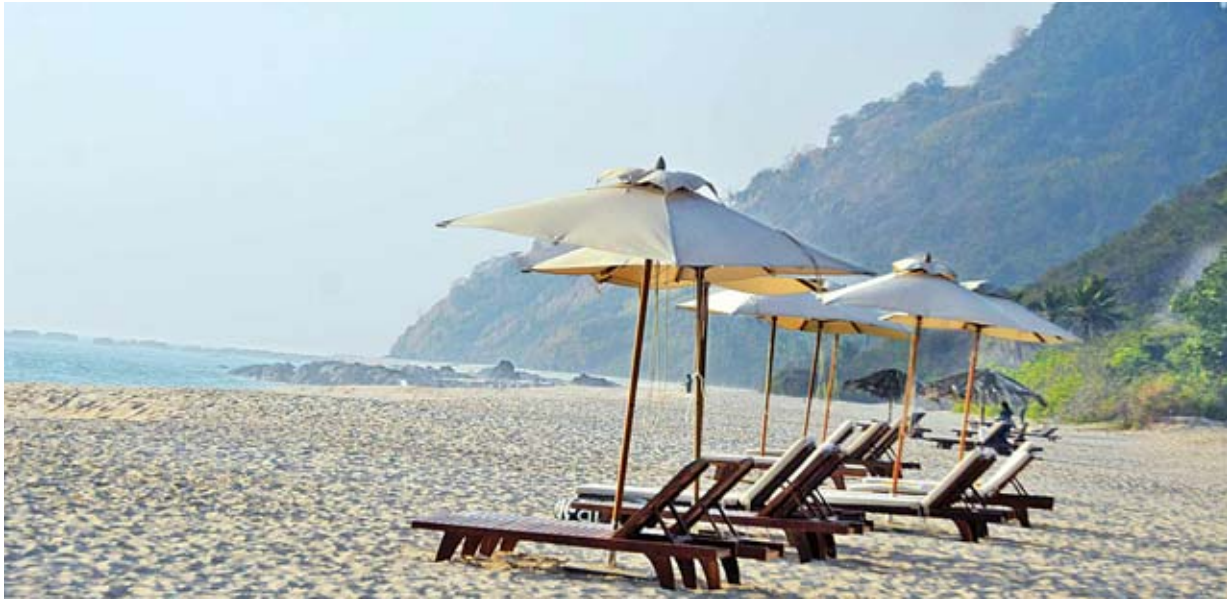
ရခိုင်ပြည်နယ် ရင်းနှီးမြှုပ်နှံမှုပြပွဲ (၂၀၁၉) ဖွင့်ပွဲအခမ်းအနားကျင်းပမည့် သံတွဲမြို့ ငပလီကမ်းခြေ သဘာဝအလှကို တွေ့ရစဉ်။