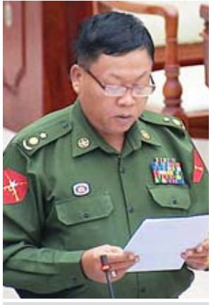
ဒုတိယဗိုလ်မှူးကြီး သောင်းစိန်