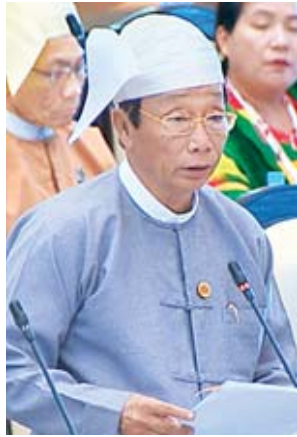
ဒုတိယဝန်ကြီး ဦးလှကျော်

ကယားပြည်နယ် မဲဆန္ဒနယ်အမှတ်(၁)မှ ဦးဖြေရယ် (ခ) ဦးမြင့်သန်းထွန်း ၏ ကယားပြည်နယ် ဒီမော့ဆိုမြို့နယ် ဘုရားဖြူကျေးရွာ ဘုရားဖြူစေတီအနီးရှိ ဘီလူးချောင်းကူးတံတားမှ မိုင်နာ (၁၉)အထိ အရှည်(၁၇၄၅၈) ပေရှိသော တာပေါင်လမ်းအား ကျေးရွာကုန်ထုတ်လမ်းအဖြစ် ကျောက်ချောလမ်း သို့မဟုတ် ကွန်ကရစ်လမ်း ဖောက်လုပ်ပေးရန် အစီအစဉ် ရှိ၊ မရှိ မေးခွန်းနှင့် စပ်လျဉ်း၍ ဒုတိယဝန်ကြီး ဦးလှကျော်က မေးခွန်းတွင် ပါရှိသည့် လယ်ယာ ကုန်ထုတ်လမ်းသည် ကယားပြည်နယ် လျှင်ကော်မြို့နယ်နှင့် ဒီမော့ဆိုမြို့နယ် များအတွင်းရှိ မြို့ပြဆည်ရေသောက်စနစ်အတွင်းမှ ရေပေးမြောင်းပေါင်များနှင့် ဆက်စပ်ဖောက်လုပ်ထားသော လယ်ယာကုန်ထုတ်လမ်းဖြစ်ပါကြောင်း၊ ဒီမော့ဆိုမြို့နယ် ဘုရားဖြူကျေးရွာမှ လျှင်ကော်မြို့နယ် ဒေါပေါ်ကလဲကျေးရွာ အထိ ဆက်သွယ်ထားသည့် လမ်းဖြစ်ပါကြောင်း အဆိုပါ လယ်ယာကုန်ထုတ်