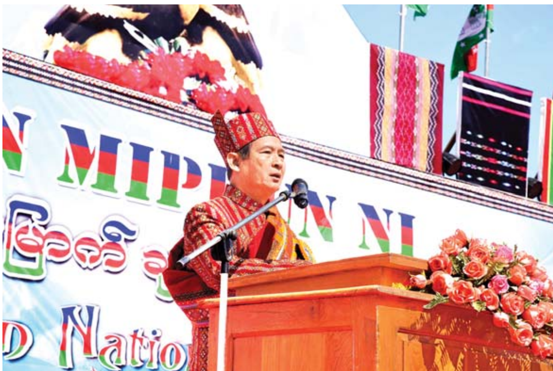
နိုင်ငံတော်သမ္မတ ဦးဝင်းမြင့် ချင်းအမျိုးသားနေ့ အခမ်းအနားတွင် နှုတ်ခွန်းဆက်စကား ပြောကြားစဉ်။