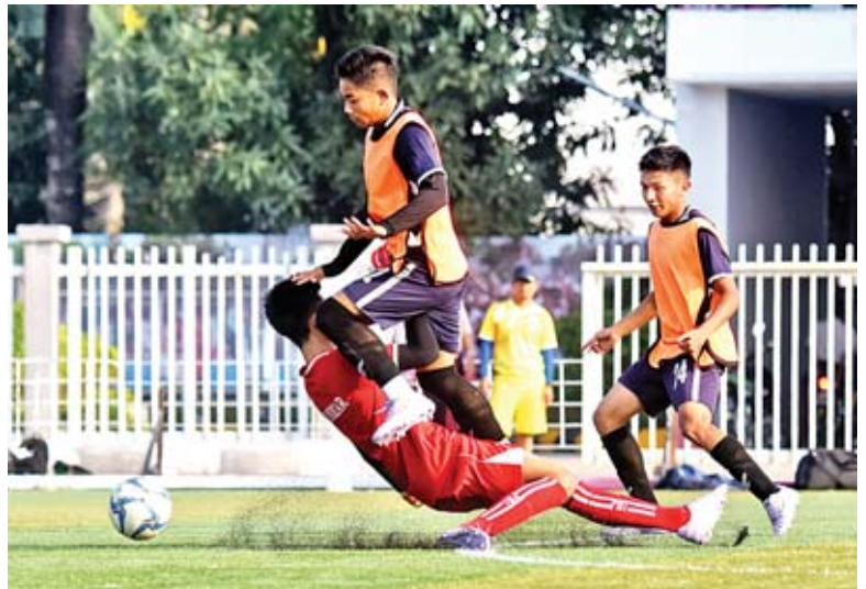
မြန်မာ ယူ-၁၈ အသင်း လေ့ကျင့်နေစဉ်။