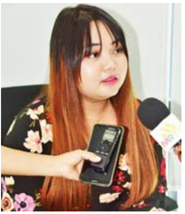
မပန်းအိမ်