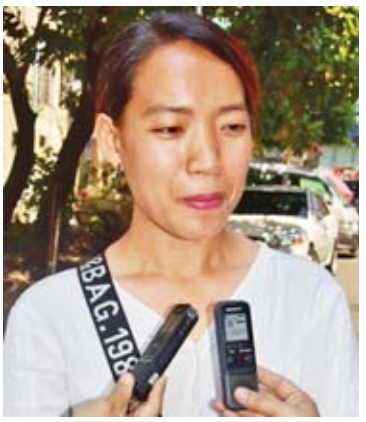
မနန်းခင်စံခန့်