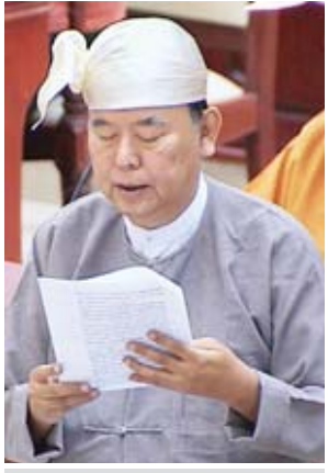
ဒုတိယဝန်ကြီး ဦးဝင်းမော်ထွန်း

အင်္ဂပူမဲဆန္ဒနယ်မှ ဦးအေးဝင်း၏ အင်္ဂပူမြို့နယ်ရှိ အထက(ခွဲ)လူပျို တော်ကွင်း ကျောင်းနှင့် အထက(ခွဲ) ချင်းကုန်းကျောင်းနှစ်ကျောင်းအား အထကအဖြစ် အဆင့်တိုးမြှင့်ပေးရန် အစီအစဉ်ရှိ မရှိ မေးခွန်းနှင့်စပ်လျဉ်း၍ ဒုတိယဝန်ကြီး ဦးဝင်းမော်ထွန်းက အင်္ဂပူမြို့နယ် လူပျိုတော်ကွင်း အခြေခံ