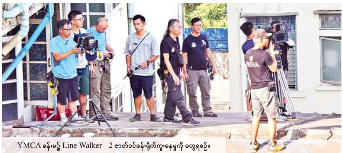
YMCA ခန်းမ၌ Line Walker - 2 ဇာတ်ဝင်ခန်းရိုက်ကူးနေမှုကို တွေ့ရစဉ်။

ရန်ကုန်မြို့တွင်းရှိ မြို့နယ်တချို့၌ Line Walker - 2 (Operation Midnight Shadow) ရုပ်ရှင်၏ ဇာတ်ဝင်ခန်းများ ရိုက်ကူးဆောင်ရွက်လျက်ရှိရာတွင် အချိန်ပိုင်း လမ်းပိတ်ဆိုမှုများကြောင့် အများပြည်သူ သွားလာမှုအဆင်မပြေဖြစ်ခဲ့ပါက သည်းခံ ခွင့်လွှတ်ပေးပါရန် အဆိုပါရုပ်ရှင်အတွက် မြန်မာနိုင်ငံဘက်မှ တာဝန်ယူဆောင်ရွက် သည့် Yangon Synthesis Productions ကုမ္ပဏီက မေတ္တာရပ်ခံထားကြောင်း သိရ သည်။ သတင်း-ဝင်းမိမိ