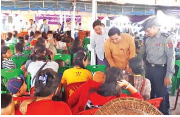
အန္တရာယ်ဆိုင်ရာစီမံခန့်ခွဲမှုဦးစီးဌာန၊ လူမှုဝန်ထမ်းဦးစီးဌာန၊ မြန်မာနိုင်ငံ ကြက်ခြေနီအသင်းနှင့် ရန်ကုန်အခြေစိုက် ဖြူစင်စေတနာ့ပရဟိတအဖွဲ့တို့က လူသုံးကုန်ပစ္စည်းများနှင့် ဆန်၊ ဆီ စားသောက်ကုန်များ ထောက်ပံ့ပေးအပ်သည်။

ယနေ့ပြန်လည်ရောက်ရှိလာသည့် နေရပ်ပြန် မြန်မာနိုင်ငံသားများအား လူမှုဝန်ထမ်း၊ ကယ်ဆယ်ရေးနှင့် ပြန်လည်နေရာချထားရေးဝန်ကြီးဌာန ဘေး