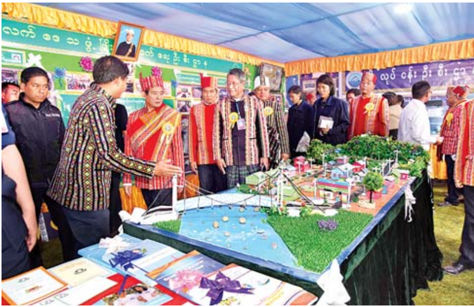
နိုင်ငံတော်သမ္မတ ဦးဝင်းမြင့်နှင့်အဖွဲ့ (၇၁)နှစ်မြောက် ချင်းပြည်နယ်နေအထိမ်းအမှတ် ဌာနဆိုင်ရာပြခန်းများကို ကြည့်ရှုလေ့လာကြစဉ်။