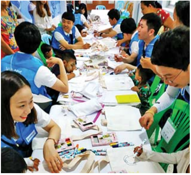
၅၅၀ ဆံ့ ဆေးရုံဖြစ်ပြီး ဆေးတက္ကသိုလ်(၂)၏ သင်ကြားရေးဆေးရုံအဖြစ် တွဲဖက်ထားကြောင်း သိရသည်။ ဆေးရုံတွင် နေ့စဉ်အတွင်းလူနာ ၄၀၀ မှ ၄၅၀ ကြားခန့်ရှိပြီး အသက် ၁၂ အောက် ကလေးငယ်များကို လက်ခံကုသပေးလျက်ရှိကြောင်း သိရသည်။

အဆိုပါ အဖွဲ့သည် ရန်ကင်းကလေးဆေးရုံကြီးတွင် Woori Bank Childfund Korea နှင့် JBJ entertainment တို့က ဆေးရုံနံရံများတွင် ရုပ်ပုံရေးဆွဲခြင်း၊ ဆေးရောင်ခြယ်ခြင်း၊ အားကစားကွင်းပြန်လည်ပြုလုပ်ပေးခြင်း၊ ဆေးရုံမျက်နှာစာများ ပြုပြင်ပေးခြင်းတို့အတွက် ငွေကျပ်သိန်း ၅၀၀ ကျော်နီးပါး အကုန်အကျခံလှူဒါန်းပေးခဲ့ကြောင်း သိရသည်။ ရန်ကင်းကလေးဆေးရုံကြီးသည် ရန်ကုန်မြို့ရှိကလေးအထူးကုဆေးရုံကြီးတစ်ရုံအနက် ခုတင်