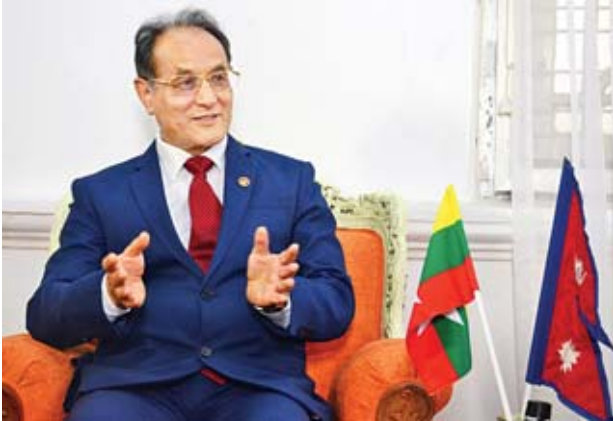
နီပေါသံအမတ်ကြီး Mr. Bhim Udas

ဖြေ။ မှန်ပါတယ်။ ၂၀၁၇ ခုနှစ် ဒီဇင်ဘာလကနေ ၂၀၁၈ ခုနှစ် ဒီဇင်ဘာလထိ အဆင့်မြင့်အရာရှိတွေ အပြန်အလှန်လည်ပတ်မှု လေးကြိမ်ရှိခဲ့ပါတယ်။ မြန်မာနိုင်ငံဘက်ကတော့ နိုင်ငံတော်သမ္မတ ဦးဝင်းမြင့်က ၂၀၁၈ ခုနှစ် ဩဂုတ်လက လာရောက်လည်ပတ်ခဲ့ပါတယ်။ နိုင်ငံတော်အီအေတိုင်ပင်ခံပုဂ္ဂိုလ် ဒေါ်အောင်ဆန်းစုကြည်ကလည်း ၂၀၁၈ ခုနှစ် နိုဝင်ဘာလက လာရောက်လည်ပတ်ခဲ့ပါတယ်။ ထိုနည်းတူ ဗိုလ်ချုပ်မှူးကြီး မင်းအောင်လှိုင်က ၂၀၁၇ ခုနှစ် ဒီဇင်ဘာလက ပထမဆုံးအကြိမ် လာရောက်လည်ပတ်ခဲ့ပါတယ်။ ဒါကြောင့်မို့လည်း နီပေါတပ်မတော်အကြီးအကဲ ဗိုလ်ချုပ်ကြီး ရာဂျင်ဒရာချက်ထီရီက