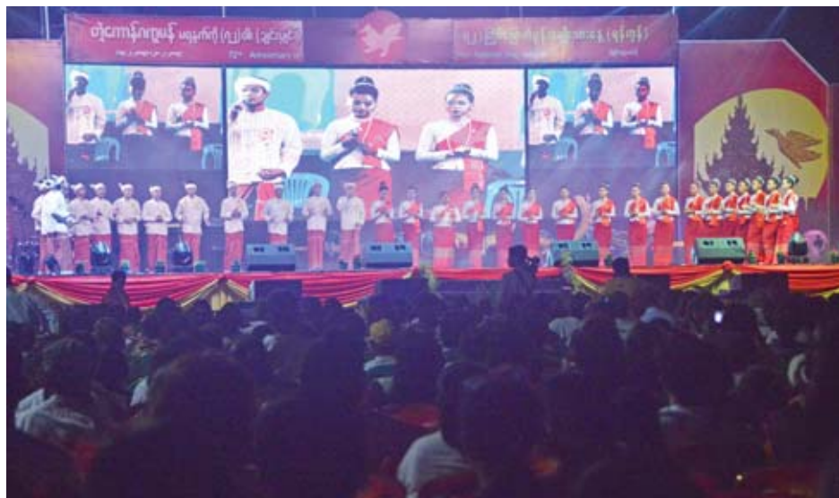
သော သဝဏ်လွှာကို ဒုတိယဥက္ကဋ္ဌ(၂)မိနီလာခင်က ပြည်ထောင်စုဝန်ကြီး နိုင်သက်လွင်ထံမှ ပေးပို့သော သဝဏ်လွှာကို အတွင်းရေးမှူး မင်းရာဇာရဲထွဋ်က ဖတ်ကြားပြီး တိုင်းရင်းသားလူမျိုးများရေးရာဝန်ကြီးဌာန

ယင်းနောက် သဘာပတိ နိုင်တင်လှိုင်က အဖွင့်အမှာစကားပြောကြားပြီး တိုင်းဒေသကြီးဝန်ကြီးချုပ် ဦးမြိုးမင်းသိန်း၊ (၇၂) ကြိမ်မြောက် မွန်အမျိုးသားနေ့(ရန်ကုန်) ကျင်းပရေးကော်မတီဥက္ကဋ္ဌ နိုင်ငံတော်က အမှာစကားပြောကြားကြသည်။ ယင်းနောက်နိုင်ငံတော်၏ အတိုင်ပင်ခံပုဂ္ဂိုလ် ဒေါ်အောင်ဆန်းစုကြည်ထံမှ ပေးပို့