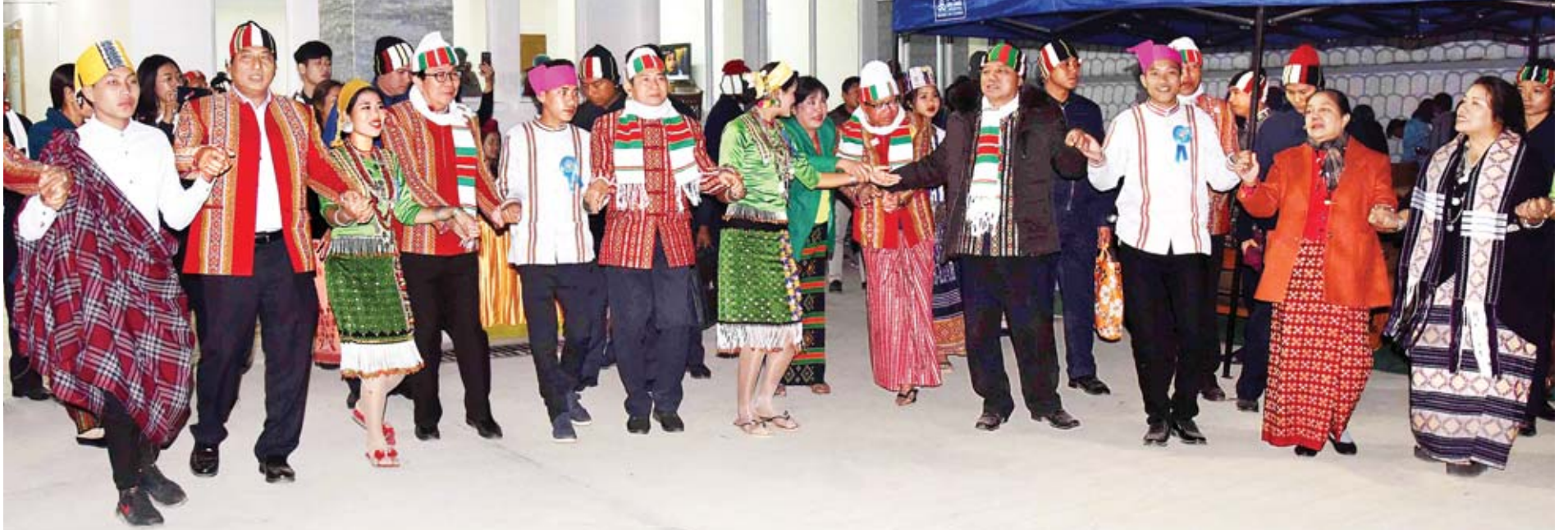
နိုင်ငံတော်သမ္မတ ဦးဝင်းမြင့်နှင့်ဇနီး ဒေါ်ချိုချိုနှင့်အဖွဲ့ ချင်းပြည်နယ်လွှတ်တော်ရုံးဝင်းအတွင်း ကျင်းပသည့် မီးပုံပွဲနှင့် ရိုးရာယဉ်ကျေးမှု ကပြဖျော်ဖြေပွဲတွင် ပါဝင်ဆင်နွှဲစဉ်။

ဝါးညှပ်အကနှင့် ခေါင်ကျွဲပွဲအား ကြည့်ရှု အားပေးကြသည်။ ယင်းနောက် နိုင်ငံတော်သမ္မတနှင့်ဇနီး နှင့်အဖွဲ့သည် ဟားခါးမြို့ရှုခင်းသာသို့ ရောက် ရှိကြပြီး View Point မှနေ၍ ဟားခါးမြို့၏ ရှုခင်းအလှကို ကြည့်ရှုသည်။ ညပိုင်းတွင် နိုင်ငံတော်သမ္မတနှင့်ဇနီး နှင့်အဖွဲ့သည် ချင်းပြည်နယ်လွှတ်တော်ရုံးဝင်း အတွင်းကျင်းပသည့် မီးပုံပွဲနှင့်ရိုးရာယဉ်ကျေး မှု ကပြဖျော်ဖြေပွဲသို့ တက်ရောက်သည်။ သတင်းစဉ်