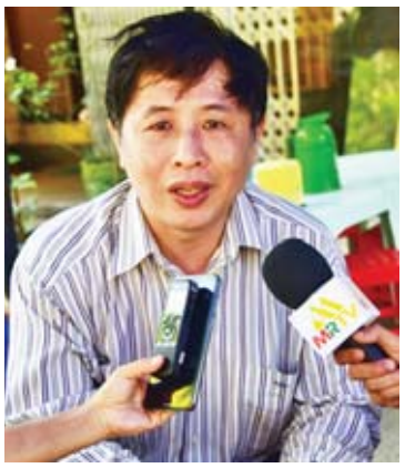
ဦးအောင်သိန်းထွန်း

မနန်းခင်စံခန့် ဒေါ်ပုံမြို့နယ် လမ်းလျှောက်လာရင်း သူများတွေ ကြည့်နေတာတွေလို မမျှော်လင့်ဘဲ လမ်းကူး ရင်း ဝင်ကြည့်မိတာ။ ဒီဇာတ်ကား Line Walker ပထမကားကို ကြည့်ဖူးကတည်းက အတော်ကြိုက်တာ။ မင်းသားကို တွေ့ရမယ် ထင်ပြီး ဝင်ကြည့်တာ။ မင်းသားကိုလည်း ကြိုက်တယ်။ သေနတ်ပစ်ဖောက်တဲ့အသံ တွေ ကြားရတယ်။ ရိုက်ကူးနေတာ သေချာ မမြင်တွေ့ရဘူး။ ဒီဇာတ်ကားကို စိတ်ဝင်စား တာကြောင့် နောက်နေ့တွေဆိုရင်လည်း ရိုက်ကူးရဲတဲ့နေရာတွေ သွားကြည့်မယ်လို့