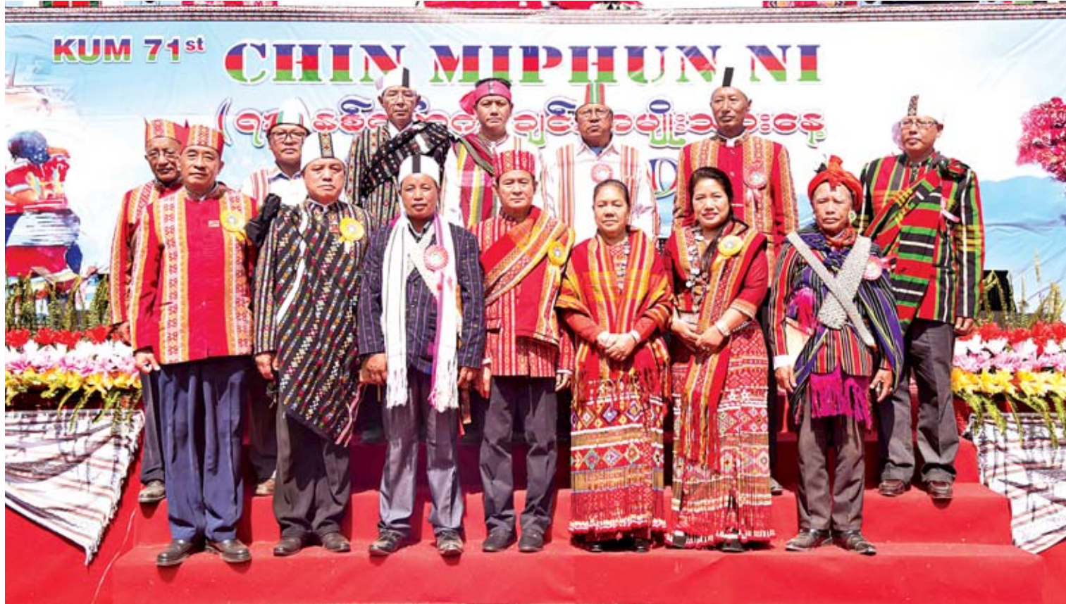
နိုင်ငံတော်သမ္မတ ဦးဝင်းမြင့်နှင့် ဇနီး ဒေါ်ချိုချို၊ ချင်းပြည်နယ်အစိုးရအဖွဲ့ဝင်များ၊ သဘာပတိအဖွဲ့များနှင့်အတူ စုပေါင်းမှတ်တမ်းတင်ဓာတ်ပုံရိုက်စဉ်။

၁၉၄၈ ခုနှစ် ဖေဖော်ဝါရီလ ၂၀ ရက်နေ့ တွင် ဖလမ်းမြို့၌ ကျင်းပသည့် လူထုညီလာခံ တွင် ချင်းအမျိုးသားကိုယ်စားလှယ် ၅၀၀၀ ကျော်တက်ရောက်ခဲ့ပြီး တိုက်သူကြီးအုပ်ချုပ် သည့်စနစ်မှ ဒီမိုကရေစီအုပ်ချုပ်ရေးစနစ်သို့ ပြောင်းလဲရန် ဆုံးဖြတ်ခဲ့ခြင်းသည် ချင်းအမျိုး သားများအနေဖြင့် ဒီမိုကရေစီစနစ်အပေါ် တန်ဖိုးထားမှုနှင့် ဉာဏ်အမြော်အမြင်ရှိမှုကို ပြသခဲ့ခြင်းဖြစ်ပါကြောင်း၊ ယင်းမှာ ကမ္ဘာလုံး ဆိုင်ရာအမြင်ကို စောစီးစွာ သိမြင်ခဲ့ခြင်းဖြစ် ပါကြောင်း၊ ချင်းအမျိုးသားများအနေဖြင့် ဒီမိုကရေစီကို တန်ဖိုးထားပြီး လူ့အခွင့်အရေး ကို လေးစားကြသည်နှင့်အမျှ ဒီမိုကရေစီ အသီးအပွင့်များကို ခံစားလာရပြီးဖြစ်ပါ ကြောင်း။