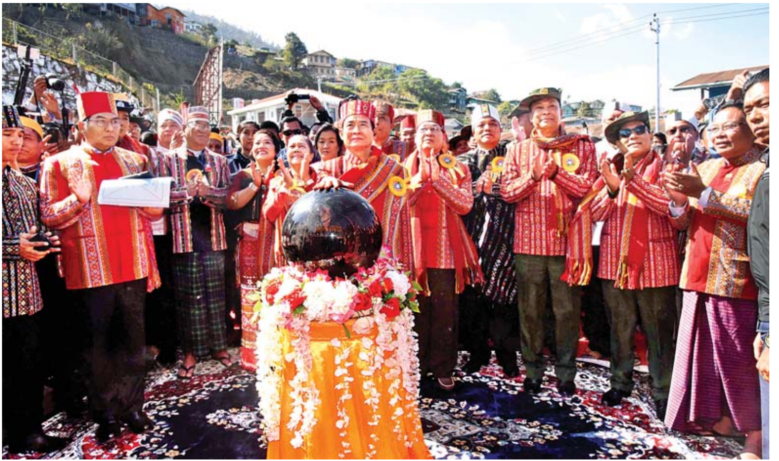
နိုင်ငံတော်သမ္မတ ဦးဝင်းမြင့် (၇၁)နှစ်မြောက် ချင်းအမျိုးသားနေ့ အထိမ်းအမှတ်မှစ်ဦးအား စက်ခလုတ်နှိပ်ဖွင့်လှစ်ပေးစဉ်။

ယင်းနေ့က နိုင်ငံတော်သမ္မတ ဦးဝင်းမြင့်က (၇၁)နှစ်မြောက် ချင်းအမျိုးသား နေ့အထိမ်းအမှတ် နှုတ်ခွန်းဆက်စကား ပြောကြားရာတွင် ချင်းအမျိုးသားနေ့ အခမ်း အနားတွင် နှုတ်ခွန်းဆက်စကား ပြောကြား ခွင့်ရသည့်အတွက် များစွာဂုဏ်ယူဝမ်းမြောက် မိပါကြောင်း၊ ချင်းပြည်နယ်၏ သာယာလှပမှု နှင့် ချင်းအမျိုးသားတို့၏ နွေးထွေးလှိုက်လှဲစွာ ကြိုဆိုမှုများကြောင့် မိမိအနေဖြင့် မိသားစု