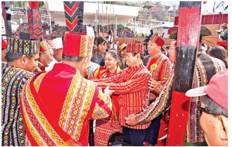
နိုင်ငံတော်သမ္မတ ဦးဝင်းမြင့်နှင့်ဇနီး ဒေါ်ချိုချို ဝဗ္ဗသူးမောင် အားကစားကွင်း၌ ဘွဲ့တိုင်(ခ)အထွတ်အမြတ်တိုင် စိုက်ထူပေးစဉ်။