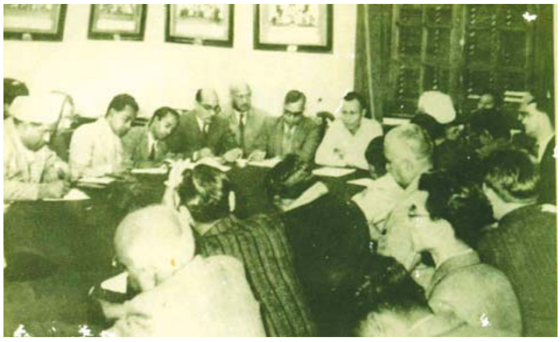
၁၉၄၇ ခုနှစ် ဇန်နဝါရီလက အင်္ဂလန်နိုင်ငံသို့ သွားရောက်ရန် အိန္ဒိယနိုင်ငံသို့ရောက်ရှိလာသော ဗိုလ်ချုပ်အောင်ဆန်းအား နယူးဒေလီမြို့ သတင်းစာရှင်းလင်းပွဲတွင် တွေ့မြင်ရစဉ်။

တိုင်းရင်းသားလူမျိုးအားလုံးအကျိုးအတွက် ချမှတ် ခဲ့တဲ့ အခြေခံမူများအရ တောင်တန်းဒေသမှာရှိကြ တဲ့ ပြည်ထောင်စုတိုင်းရင်းသားတွေနဲ့ ရှမ်းပြည်နယ် ပင်လုံမြို့မှာ တွေ့ဆုံဆွေးနွေးခဲ့ပါတယ်။ ဗိုလ်ချုပ်ဟာ တိုင်းရင်းသားညီအစ်ကိုများနဲ့ ညှိနှိုင်းစည်းရုံးဆွေးနွေး အပြီးမှာ ပင်လုံသဘောတူညီချက်စာချုပ်ကို ချုပ်ဆို နိုင်ခဲ့တယ်။ ဒါကြောင့် ၁၉၄၇ ခုနှစ် ဖေဖော်ဝါရီ ၁၂ ရက် ပင်လုံစာချုပ် အောင်မြင်စွာချုပ်ဆိုနိုင်ခဲ့တဲ့ နေ့ကို “ပြည်ထောင်စုနေ့” လို့ သတ်မှတ်ခေါ်ဝေါ်ခဲ့ တာပါ။