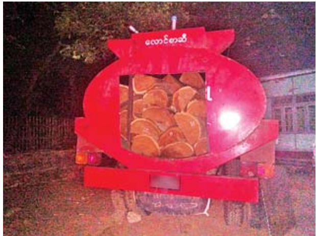
စစ်ဆေးရာ ဆီတိုင်ကီအတွင်းမှ တရားမဝင်သစ်ဆောင်လာသော ပိတောက်ခွဲသားများ သိမ်းဆည်းရမိကြောင်း သစ်တောဦးစီးဌာနမှ သိရ သည်။

အလားတူ ယနေ့နံနက် ၁ နာရီက ရှမ်းပြည်နယ် နောင်ချိုမြို့နယ်တွင် မန္တလေးမှ ဖြိုးသူရ မောင်းနှင်လာသည့် ဆီဘောက်ဆာယာဉ်ကို ရပ်တန့်