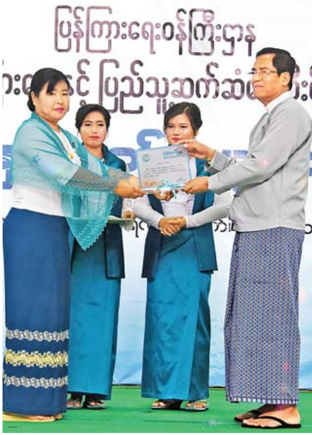
ဒုတိယဝန်ကြီး ဦးအောင်လှထွန်း မြို့နယ်အဆင့် လုပ်ငန်းဆောင်ရွက်မှု ပထမဆုရ ပုသိမ်ကြီးမြို့နယ်မှ ဝန်ထမ်းတစ်ဦးအား ဆုပေးအပ်ချီးမြှင့်စဉ်။

မြောက် နှစ်ပတ်လည်နေ့ အထိမ်းအမှတ် ဗလာမပါ ကံစမ်းမဲ ဖောက်ပေးသည့် အစီအစဉ်ကို ကျင်းပခဲ့ပြီး ကံစမ်းမဲဆုကြီးများ ကံထူးသည့် ဝန်ထမ်းများကို ပြည်ထောင်စုဝန်ကြီး၊ ဒုတိယဝန်ကြီးနှင့် အမြဲတမ်းအတွင်းဝန်တို့က ဆုများ ပေးအပ်သည်။