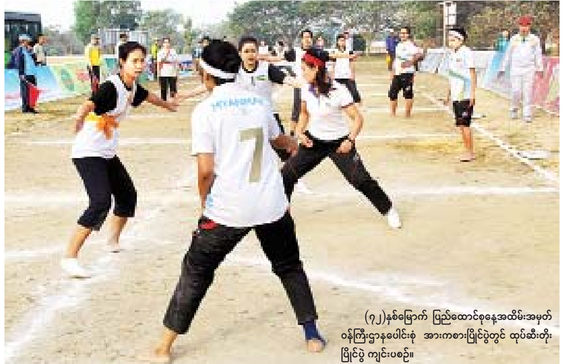
(၇၂)နှစ်မြောက် ပြည်ထောင်စုနေ့အထိမ်းအမှတ် ဝန်ကြီးဌာနပေါင်းစုံ အားကစားပြိုင်ပွဲတွင် ထုပ်ဆီးတိုး ပြိုင်ပွဲ ကျင်းပစဉ်။

(၇၂)နှစ်မြောက် ပြည်ထောင်စုနေ့ အထိမ်းအမှတ်အဖြစ် နေပြည်တော်ရှိ ဝန်ကြီးဌာနပေါင်းစုံ အားကစားပြိုင်ပွဲများဖြစ်ကြသည့် ထုပ်ဆီးတိုး (အမျိုးသမီး)၊ လွန်ဆွဲ(အမျိုးသား/အမျိုးသမီး)ပြိုင်ပွဲများကို ယနေ့နံနက် ၈ နာရီက နေပြည်တော် ဝဏ္ဏသိဒ္ဓိအားကစားလေ့ကျင့်ရေးကွင်း (၁/၂/၃) တို့၌ ကျင်းပရာ အားကစားနှင့်ကာယပညာဦးစီးဌာနမှ တာဝန်ရှိသူများ၊ မြန်မာနိုင်ငံရိုးရာ အားကစားအဖွဲ့ချုပ်မှ တာဝန်ရှိသူများ၊ ဝန်ကြီးဌာနအသီးသီးမှ အားကစားဝါသနာရှင် အရာထမ်း၊ အမှုထမ်းများ လာရောက်ကြည့်ရှု အားပေးသည်။ စာမျက်နှာ ၉ ကော်လံ ၃ သို့ ❖