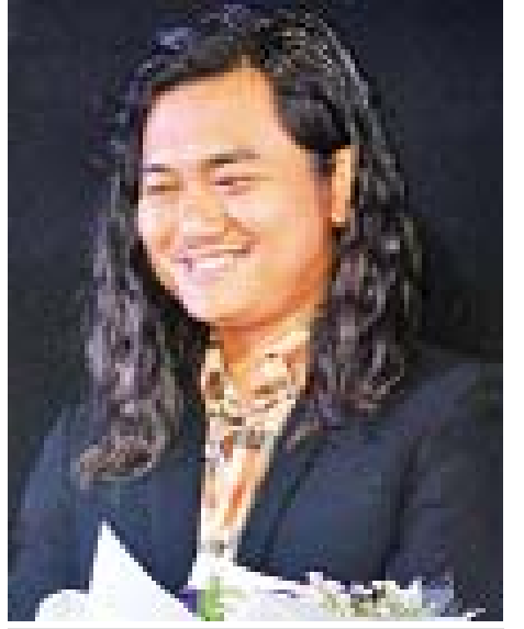
JZ Daung Loon

ဆိုင်မှာ အလုပ်လုပ်တဲ့ နူးနူးဆိုတဲ့ ကောင်မလေး တစ်ယောက်အနေနဲ့ သရုပ်ဆောင်ထားတာပါ။ ရေခဲတောင်မှာရိုက်တာဆိုတော့ တော်တော်အေးတယ်။ အဲဒီလို လမ်းလျှောက်ပြီးသွားရင် ၁၅ ရက် လောက်ကြာတာဆိုတော့ အခြားလမ်းဘက်က ဝင်ခဲ့ရတယ်။ ကားလမ်းတွေကလည်း တော်တော်ဆိုးတယ်။ ပင်ပန်းခဲ့ပါတယ်။