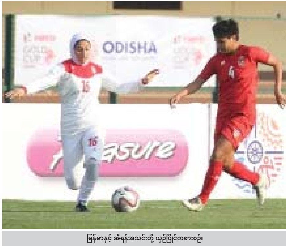
မြန်မာနှင့် အီရန်အသင်းတို့ ယှဉ်ပြိုင်ကစားစဉ်။

မြန်မာအမျိုးသမီးအသင်းသည် နိုင်ပွဲဆက်ရန် အမာခံကစားသမားအစုံအလင်ဖြင့် ပွဲထွက်ခဲ့ပြီး ပွဲစကတည်းက တိုက်စစ်ဖွင့်ကစားခဲ့သည်။ မြန်မာအသင်းသည် အီရန်အသင်းခံစစ်ကို ကျော်ဖြတ်နိုင်ရန် ခက်ခက်ခဲခဲကစားခဲ့ရပြီး ဝိုးသွင်းခွင့်အချို့ကိုလည်း အသုံးမချနိုင်သောကြောင့် အနိုင်ရရန် နောက်ဆုံးအချိန်ထိ ကြိုးပမ်းခဲ့ရသည်။ မြန်မာအမျိုးသမီးအသင်းအတွက် အနိုင်ဝိုးများကို စာမျက်နှာ ၉ ကော်လံ ၁ သို့ ၂