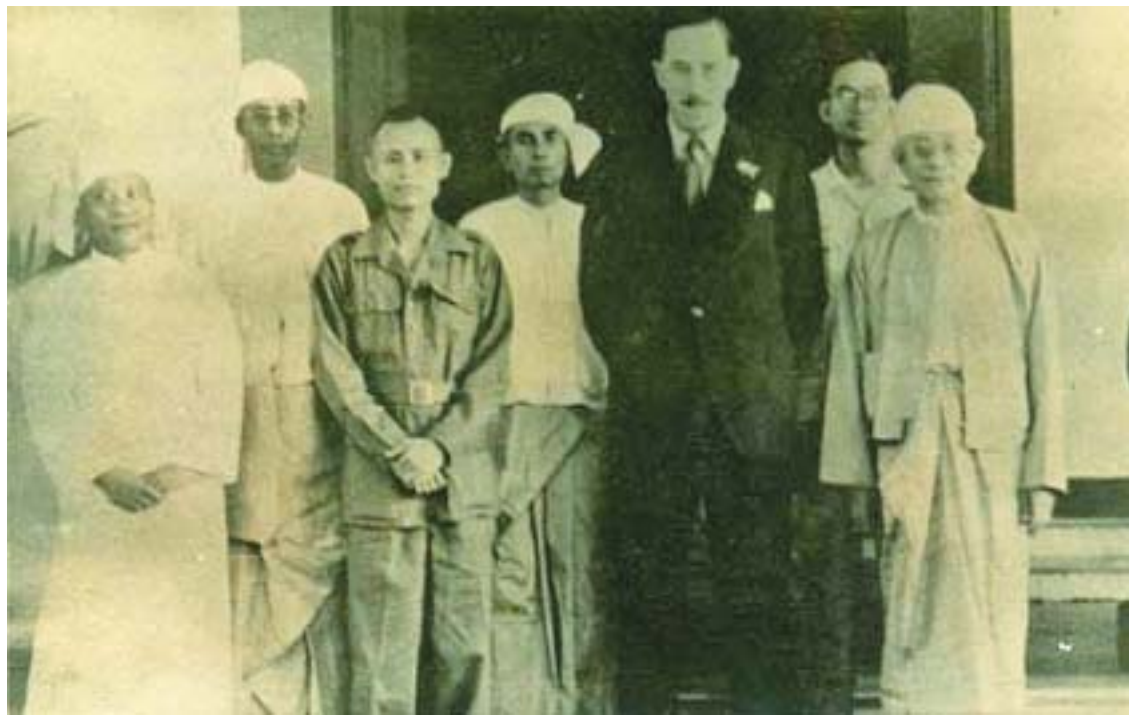
၁၉၄၆ ခုနှစ် စက်တင်ဘာလတွင် မြန်မာပြည်ဘုရင်ခံ ဆာဟူးဘတ်ရန်စစ်ထံမှ ရာထူးလက်ခံရယူပြီးနောက် ဝန်ကြီးအဖွဲ့ခေါင်းဆောင် ဗိုလ်ချုပ် အောင်ဆန်းနှင့် အစိုးရအဖွဲ့ဝင် ဝန်ကြီးများအား တွေ့မြင်ရစဉ်။