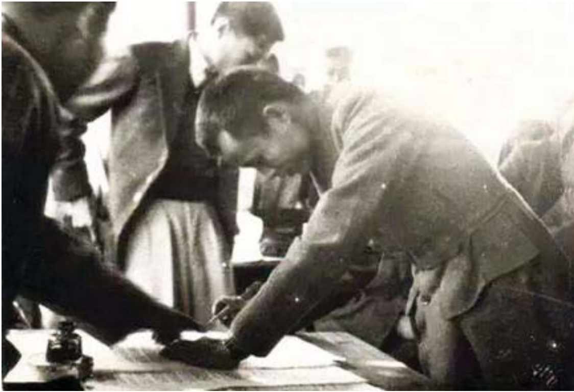
၁၉၄၇ ခုနှစ် ဖေဖော်ဝါရီလ ၁၂ ရက်နေ့က ကျင်းပသည့် ပင်လုံညီလာခံတွင် ဗိုလ်ချုပ်အောင်ဆန်း ပင်လုံစာချုပ်လက်မှတ်ရေးထိုးစဉ်။