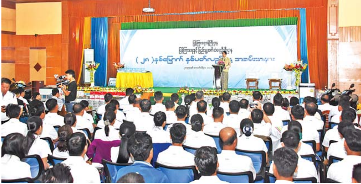
ပြည်ထောင်စုဝန်ကြီး ဒေါက်တာဖေမြင့် ပြန်ကြားရေးဝန်ကြီးဌာန ပြန်ကြားရေးနှင့် ပြည်သူ့ဆက်ဆံရေးဦးစီးဌာန၏ (၂၀)နှစ်မြောက် နှစ်ပတ်လည်နေ့ အခမ်းအနားတွင် အမှာစကားပြောကြားစဉ်။