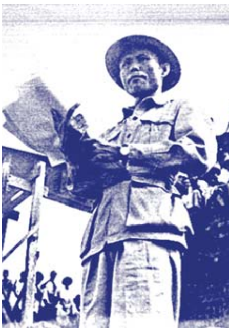
အထိတောင် ထုတ်ချေးနိုင်မှာ မဟုတ်ဘူး။ ဘယ်လိုပဲ ဖြစ်ဖြစ် ဒီဗမာဏအထိတော့ ဒီနှစ်ထုတ်ချေးမှာပါ။

အစိုးရမှာ ဝင်ငွေမရှိလည်း ဘာအရေးလဲ။ တခြားက ချေးနိုင်တာပဲလို့ ခင်ဗျားက ပြောကောင်းပြောမယ်။ တခြားက အကူအညီကို အားကိုးနေရသရွေ့ ဘယ်နိုင်ငံ၊ ဘယ်အစိုးရမှ စစ်မှန်တဲ့ လွတ်လပ်ရေးကို ရလိမ့်မယ် မဟုတ်ဘူးဆိုတာ ပြောချင်တယ်။ ကျွန်တော်တို့ ကိုယ်ပိုင် ငွေနဲ့ ကျွန်တော်တို့ လွတ်လပ်နေရမယ်။ လယ်ခွန်မဆောင် ချင်တဲ့ လူတွေဟာ လွတ်လပ်ရေးကို နှောင့်နှေးအောင် လုပ်တဲ့သူတွေပဲ။ သီးစားခမပေးတာဟာလည်း လယ်ပိုင်ရှင် တွေ လယ်ခွန်မဆောင်နိုင်အောင် လုပ်နေတာနဲ့ အတူတူပဲ။ လယ်သမားတွေ ရင်ဆိုင်နေရတဲ့ အခက်အခဲတွေကို သိပါတယ်။ ကျွန်တော်တို့က သူတို့အခက်အခဲတွေကို ဖြေရှင်းပေးစေချင်တယ် ဆိုတာလည်း သိပါတယ်။ ကျွန်တော်တို့ အစိုးရမှာ ငွေမရှိတော့ ဘာတတ်နိုင်မှာလဲ။ မနှစ်က ကျပ်သုံးကုဋေဖိုး အမတ်တော်ကြေး ထုတ်ချေးခဲ့တယ်။ ကျွန်တော်တို့ထုတ်ပေးတဲ့ ချေးငွေဟာ စစ်မဖြစ်ခင် ချေးငွေ ပမာဏထက် အဆငါးဆယ်၊ ခြောက်ဆယ်မက ပိုပါတယ်။ လယ်ခွန်တော်ရဲ့ ခြောက်ပုံတစ်ပုံမကဘူး။ ဒီထက်မက လိုအပ်တယ်ဆိုတာလည်း သိတယ်။ ချေးငွေ ကိုအကျေအလည်ပြန်မပေးဘူးဆိုရင် နောင်နှစ်မှာ ဒီဗမာဏ