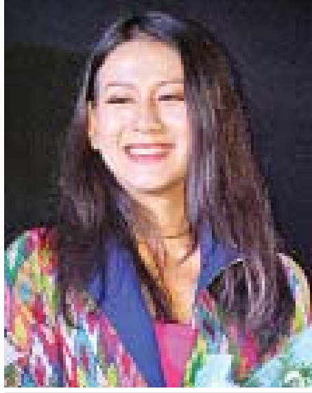
Swan Swan Pan