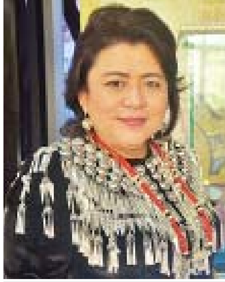
နန်းမောက်လောင်ဆိုင်