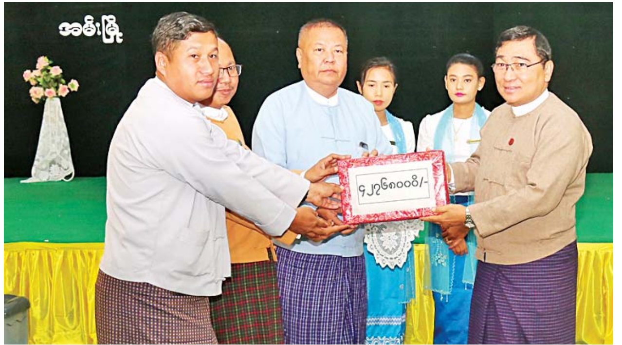
ပြည်ထောင်စုဝန်ကြီး ဒေါက်တာဝင်းမြတ်အေး တိုက်ပွဲရှောင်ရခိုင်တိုင်းရင်းသားများနှင့် ဒေသခံပြည်သူများအတွက် ဆန်ရိက္ခာ တစ်လစာ ထောက်ပံ့ငွေကျပ် ၄၂၇၆၀၀၀ အား ပြည်နယ်လူမှုရေးဝန်ကြီး ဒေါက်တာချမ်းသာနှင့်အဖွဲ့ထံ ပေးအပ်စဉ်။

နေပြည်တော် ဇူလိုင်လ ၁၀ ရခိုင်ပြည်နယ် ဒေသတွင်းပြန်လည်နေရာချထားရေးနှင့် လူမှုစီးပွားဘဝဖွံ့ဖြိုးတိုးတက်ရေးလုပ်ငန်းကော်မတီဥက္ကဋ္ဌ၊ လူမှုဝန်ထမ်း၊ ကယ်ဆယ်ရေးနှင့် ပြန်လည်နေရာချထားရေးဝန်ကြီးဌာန ပြည်ထောင်စုဝန်ကြီး ဒေါက်တာဝင်းမြတ်အေးသည် ရခိုင်ပြည်နယ်အတွင်း လတ်တလောဖြစ်ပွားလျက်ရှိသော တိုက်ပွဲများကြောင့် တိုက်ပွဲရှောင်နေရသော ရခိုင်တိုင်းရင်းသားများနှင့် ဒေသခံပြည်သူများအတွက် ယနေ့နံနက်ပိုင်းက တတိယအကြိမ် ထောက်ပံ့ပေးအပ်သည်။ စာမျက်နှာ ၄ ကော်လံ ၁ သို့ *