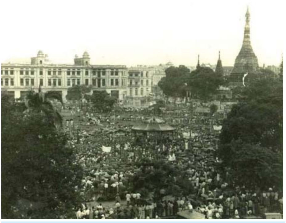
တောင်တန်း၊ ပြည်မ မခွဲခြားဘဲ လွတ်လပ်ရေးအရယူရန် ရန်ကုန်မြို့ မဟာဗန္ဓုလပန်းခြံနေရာတွင် လူထုစုဝေးကြစဉ်။

အမြော်အမြင်ကြီးမားသော ရှမ်းစော်ဘွားများသည် နယ်စပ်တောင်တန်းဒေသမှ ခေါင်းဆောင်များနှင့် ပြည်မမှ ခေါင်းဆောင်များ ရှမ်းပြည်နယ်တစ်နေရာတွင် ဆုံစည်း၍