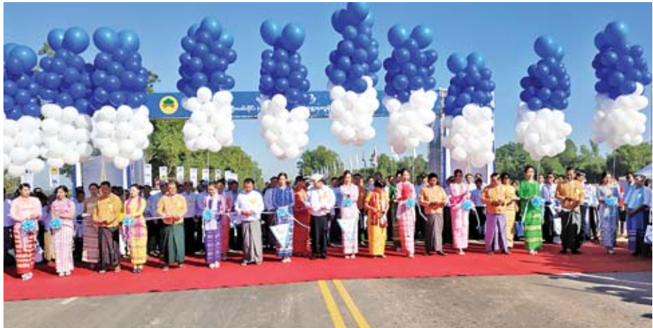
လမ်းအသုံးပြုခွင့်ရရှိပြီးနောက် ရှာဖွေဆန်းစစ် မြန်မာနိုင်ငံ၏ လမ်း၊ တံတားလုပ်ငန်းများကို BOT စနစ်ဖြင့် ၁၉၉၆ ခုနှစ်တွင် လားရှိုး-မူဆယ်လမ်းပိုင်းမှ စတင်ဆောင်ရွက်ခဲ့ရာ ယခုတိုင်းရင်းသား BOT ကုမ္ပဏီပေါင်း ၂၅ ခုမှ လမ်းပိုင်းပေါင်း ၂၂၆၄ မိုင်ကို အဆင့်မြှင့်တင်ဆောင်ရွက်နေပြီဖြစ်ကြောင်း BOT ကုမ္ပဏီ

နေပြည်တော် ဖေဖော်ဝါရီ ၁၀ မက်(စ်)ဟိုက်ဝေးကုမ္ပဏီလီမိတက်မှ BOT စနစ်ဖြင့် တာဝန်ယူဆောင်ရွက်နေသည့် ရန်ကုန်-ပြည်လမ်း (မှော်ဘီ-တိုက်ကြီးလမ်းပိုင်း) ၄၈ ပေ လေးလမ်းသွား ကတ္တရာကွန်ကရစ်လမ်း ဖွင့်ပွဲအခမ်းအနားကို ယနေ့နံနက် ပိုင်းတွင် ရန်ကုန်တိုင်းဒေသကြီး တိုက်ကြီးမြို့နယ် တာခွ ကျေးရွာအနီးရှိ မင်္ဂလာမဏ္ဍပ်၌ ကျင်းပသည်။ (ယာပုံ)