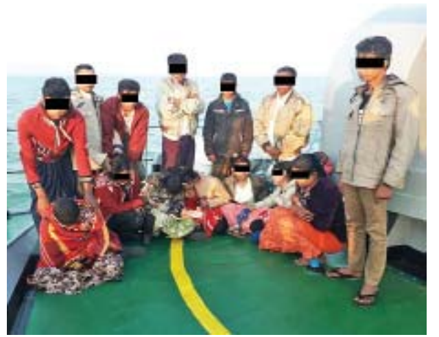
ထွက်ခွာမည့်သူ ၁၄ ဦးကိုလည်း လုပ်ထုံးလုပ်နည်းများနှင့်အညီ ဆက်လက်ဆောင်ရွက်လျက်ရှိကြောင်း မြန်မာနိုင်ငံရဲတပ်ဖွဲ့မှ သတင်းရရှိသည်။