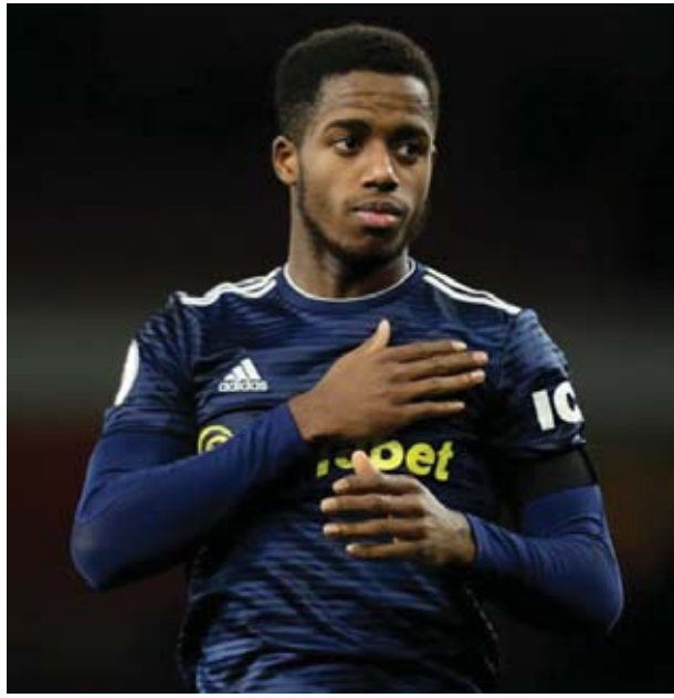
ဧွေကြယ် - ရေးသားသည်

ဆက်ဆက်နှုန်းရဲ့ လက်ရှိစာချုပ် သက်တမ်းဟာ ၁၈ လကျန်ရှိနေတာ ဖြစ်ပြီး အသင်းရဲ့ ဘယ်နေ့ကခံလူ နေရာမှာ အားဖြည့်ဖို့အတွက် မန်ယူ အသင်းက စိတ်ဝင်စားနေတာဖြစ်ပါတယ်။