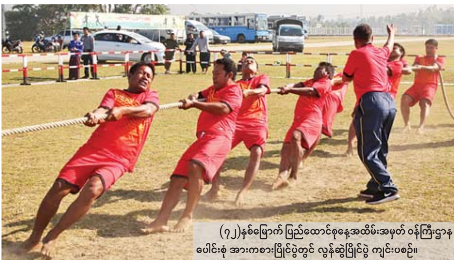
(၇၂)နှစ်မြောက် ပြည်ထောင်စုနေ့အထိမ်းအမှတ် ဝန်ကြီးဌာန ပေါင်းစုံ အားကစားပြိုင်ပွဲတွင် လွန်ဆွဲပြိုင်ပွဲ ကျင်းပစဉ်။

နေပြည်တော် ဇူလိုင်လ ၁၀ ၂၀၁၉ ခုနှစ် ဇူလိုင်လ ၁၂ ရက် တွင် ကျရောက်မည့် (၇၂)နှစ်မြောက် ပြည်ထောင်စုနေ့ အထိမ်းအမှတ် အဖြစ် နေပြည်တော်ရှိ ဝန်ကြီးဌာန ပေါင်းစုံ အားကစားပြိုင်ပွဲများဖြစ်ကြ သော ထုပ်ဆီးတိုး(အမျိုးသမီး)၊ လွန်ဆွဲ(အမျိုးသား)၊ အမျိုးသမီး) ပြိုင်ပွဲများကို ယနေ့ နံနက် ၈ နာရီမှ စ၍ နေပြည်တော် ဝဏ္ဏသိဒ္ဓိအားကစား လေ့ကျင့်ရေးကွင်း (၁၊ ၂၊ ၃) တို့၌ ကျင်းပရာ အားကစားနှင့် ကာယ ပညာဦးစီးဌာနမှ တာဝန်ရှိသူများ၊ စာမျက်နှာ ၁၃ ကော်လံ ၁ သို့ ○