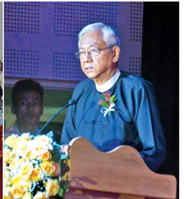
အမျိုးသားစာဆိုတော်ကြီး မင်းသုဝဏ်၏ နှစ် (၁၁၀) ပြည့်မွေးနေ့အထိမ်းအမှတ် စာပေဟောပြောပွဲနှင့် သူတို့မြင်သော မင်းသုဝဏ် စာအုပ်မိတ်ဆက်ပွဲအခမ်းအနားတွင် ဆရာကြီး မင်းသုဝဏ်၏သား နိုင်ငံတော်သမ္မတ(ငြိမ်း) ဦးထင်ကျော် အမှတ်တရဂုဏ်ပြုစကားပြောကြားစဉ်။