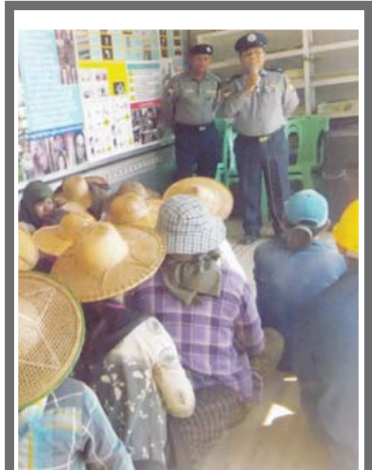
မှော်ဘီမြို့နယ် မြောင်းတကာ စက်မှုဇုန်ရုံ Myanmar Typical Production Co.Ltd တွင် ဖေဖော်ဝါရီ ၈ ရက် နံနက် ၉ နာရီက မှော်ဘီမြို့နယ်ရဲတပ်ဖွဲ့မှူး၊ ရဲမှူးတင်ဆွေနှင့် တာဝန်ရှိသူများ က ကဏ္ဍအလိုက် ပြည်သူများကို မှုခင်းပြခန်းယာဉ်ဖြင့် လာရောက် ပညာပေးဟောပြောစဉ်။