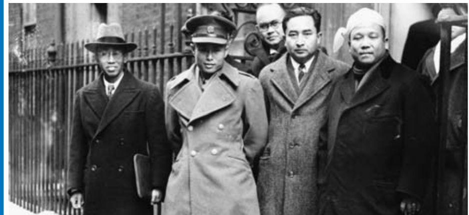
အောင်ဆန်း-အက်တလီစာချုပ်ချုပ်ဆိုရန် လန်ဒန်မြို့ ဒေါင်းနင်းလမ်းတွင် ဝိုင်းရံပစ်ခတ်ခံရခြင်း မြန်မာကိုယ်စား လှယ်အဖွဲ့ကို တွေ့ရစဉ်။

လူထုအစည်းအဝေးကြီး၌ ထောက်ခံခဲ့သည်။ ၁၉၄၆ ခုနှစ် ဇန်နဝါရီလ ၂၀ ရက်တွင် ရွှေတိဂုံစေတီတော် အလယ်ပစ္စယ်တွင်ကျင်းပသော နိုင်ငံလုံးဆိုင်ရာညီလာခံ သဘင်ကြီးတွင် တိုင်းရင်းသားလူနည်းစုတို့ တိုင်းပြည် လွတ်လပ်ရေးအတွက် အားတက်သရောဆောင်ရွက်ရန် တိုက်တွန်းခဲ့သည်။ ၁၉၄၆ ခုနှစ် မေလ ၁၆ ရက်မှ ၂၃ ရက်အထိကျင်းပသော ဖဆပလ ဒုတိယအကြိမ် အစည်း အဝေးတွင် မြန်မာပြည်ကို အပိုင်းပိုင်းအစိတ်စိတ်ပြုလုပ် မည့် စက္ကူဖြူစီမံကိန်းကို ကန့်ကွက်ကြောင်း ဆုံးဖြတ်ခဲ့ သည်။ ၁၉၄၆ ခုနှစ် ဒီဇင်ဘာလ ၃၁ ရက်တွင် တောင်တန်းဒေသများအားလုံး ပြည်ထောင်စုမြန်မာနိုင်ငံ အတွင်း ပါဝင်လာနိုင်ရေး နယ်သူနယ်သားများ၏ဆန္ဒ ဖြင့် ဆုံးဖြတ်ရန် ကြေညာချက်ထုတ်ပြန်ခဲ့သည်။