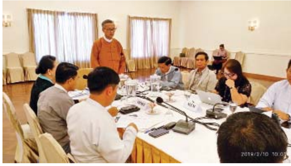
ပေးထားကြောင်း၊ လုပ်ငန်းအဖွဲ့များအနေဖြင့် ခရီးသွား လုပ်ငန်းမြှင့်တင်ရေးအစီအစဉ်များကို စနစ်တကျ အောင်မြင်အောင် အကောင်အထည်ဖော်ဆောင်ရွက်ရန် လိုအပ်သကဲ့သို့ ငွေကြေးသုံးစွဲမှုများတွင် ဘဏ္ဍာရေး စည်းမျဉ်းစည်းကမ်းများအတိုင်း သုံးစွဲဆောင်ရွက်သွားရန် ဖြစ်ပါကြောင်း ပြောကြားသည်။

နေပြည်တော် ဖေဖော်ဝါရီ ၁၀ ခရီးသွားလုပ်ငန်းမြှင့်တင်ရေးကိစ္စရပ်များနှင့် စပ်လျဉ်း သည့် ညှိနှိုင်းအစည်းအဝေးကို ယနေ့နံနက်ပိုင်းတွင် ရန်ကုန်မြို့အင်းလျားလိတ်ဟိုတယ်၌ ကျင်းပသည်။ ဗီဇာဖြေလျှော့ပေး အစည်းအဝေးတွင် ဟိုတယ်နှင့်ခရီးသွားလာရေး ဝန်ကြီးဌာန ပြည်ထောင်စုဝန်ကြီး ဦးအုန်းမောင်က မြန်မာနိုင်ငံ၏ခရီးသွားလုပ်ငန်း တိုးတက်လာရေးအတွက် ကြိုးပမ်းဆောင်ရွက်လျက်ရှိရာ ကမ္ဘာလှည့်ခရီးသွားများ မြန်မာနိုင်ငံအတွင်းသို့ လွယ်ကူအဆင်ပြေစွာ ဝင်ရောက် လည်ပတ်နိုင်ရေးအတွက် ဗီဇာဖြေလျှော့မှုများကို ပြီးခဲ့သည့်နှစ်အတွင်း ဆောင်ရွက်ပေးခဲ့ကြောင်း၊ ယခု ထပ်မံ၍ အနောက်နိုင်ငံများမှ ခရီးသွားများအတွက် သင့်လျော်သည့် နိုင်ငံများကိုရွေးချယ်၍ ဗီဇာဖြေလျှော့ ပေးခြင်းဖြင့် ခရီးသွားလုပ်ငန်း တိုးမြှင့်ဆောင်ရွက်ရန်ဖြစ် ကြောင်း၊ မြန်မာနိုင်ငံ၏ ခရီးသွားလုပ်ငန်းတိုးတက်ရေး အတွက် နိုင်ငံအလိုက်၊ နယ်မြေအလိုက် ခရီးသွားမြှင့် တင်ရေးလုပ်ငန်းအဖွဲ့များ ဖွဲ့စည်းပေးထားပြီး ခရီးသွား လုပ်ငန်းမြှင့်တင်ရေးရန်ပုံငွေများကို နိုင်ငံတော်မှခွင့်ပြု