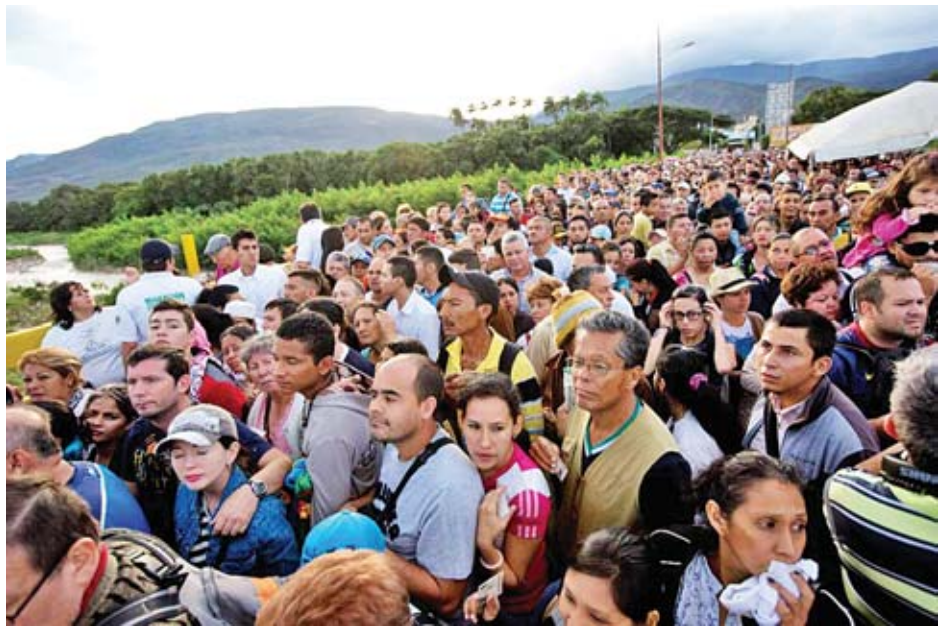
ကုလသမဂ္ဂအဖွဲ့နှင့် အခြားသောလူ့အခွင့်အရေးအဖွဲ့ ပြည်သူ့အရေအတွက် ငါးသန်းခန့် ရောက်ရှိနိုင်သည်ဟု များက ယခုနှစ်ကုန်ပိုင်းမတိုင်မီ ပင်နီဇွဲလားမှ နေရပ်စွန့်ခွာ ခန့်မှန်းထားသည်။ အင်န်အိတ်ချ်ကေ

များကိုလည်း ဖြစ်ပေါ်စေခဲ့သည်။ အမေရိကန်နှင့် ဥရောပ နိုင်ငံ အချို့က အတိုက်အခံခေါင်းဆောင် ဝါအီဒိုအား ထောက်ခံလျက်ရှိပြီး တရုတ်နှင့် ရုရှားနိုင်ငံတို့က သမ္မတ မာဒူရိုအား ထောက်ခံကြသည်။ ဝါရှင်တန်အနေဖြင့် သမ္မတမာဒူရိုအား ဆန့်ကျင်ဆန္ဒ ထုတ်ဖော်ကြသည့် ပြည်သူများအား ထောက်ပံ့ပေးရန် ရည်ရွယ်ချက်ဖြင့် ပင်နီဇွဲလားနိုင်ငံအား စီးပွားရေးပိတ်ဆို့မှု များစတင်ချမှတ်ခဲ့သည်။ သို့သော် စီးပွားရေးပိတ်ဆို့မှု များကြောင့် နိုင်ငံအတွင်း အစားအစာနှင့် ဆေးဝါး ပြတ်လပ်မှု ပြဿနာများကို ပိုမိုကြီးထွားစေပြီး ပြည်သူ အများအပြားကို နေရပ်စွန့်ခွာသွားရန် တွန်းအားပေးမှုဖြစ် စေခဲ့သည်။ လွန်ခဲ့သော လအနည်းငယ်အတွင်း အိမ်နီးချင်းနိုင်ငံ ဖြစ်သည့် ကိုလံဘီယာနိုင်ငံက ပင်နီဇွဲလားပြည်သူ ၁ ဒသမ ၁၇ သန်းကို လက်ခံထားပြီးဖြစ်သည်။ ယင်းအရေ အတွက်သည် ဒေသတွင်း၌ အမြင့်မားဆုံး နေရပ်စွန့်ခွာ ဒုက္ခသည်အရေအတွက်ဖြစ်သည်။ ပီရူးနှင့် အီကွေဒေါနိုင်ငံ များက ၂၅၀၀၀ ခန့် ပြည်သူများကို လက်ခံထားကြောင်း သိရသည်။