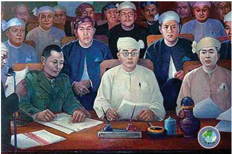
ပြည်ထောင်စု၏ သွေးစည်းညီညွတ်မှုကို ဝိုင်းရံပစ်ခတ်ခံရခြင်းခေါင်းဆောင်ပြီး ပင်လုံမြေတွင် ကြိုးပမ်း ဆောင်ရွက်နေပုံပန်းချီကား။

ပေးပို့အသံလွှင့်ခဲ့သည်။ ပြည်ထောင်စုစိတ်ဓာတ်အမြစ်တွယ် ပင်လုံညီလာခံကို ဖေဖော်ဝါရီလ ၈ ရက်နေ့တွင် ဆက်လက်ကျင်းပသည်။ ဝိုင်းရံပစ်ခတ်ခံရခြင်းနှင့် အဖွဲ့ ဘော်တွမ်လေနှင့်အဖွဲ့ ပင်လုံသို့ရောက်ရှိလာသည်။ ဝိုင်းရံပစ်ခတ်ခံရခြင်းနှင့် ခရီးရောက်မခိုက် ည ၈ နာရီခန့်တွင် တိုင်းရင်းသားကိုယ်စားလှယ်များနှင့် တွေ့ဆုံဆွေးနွေး သည်။ ဖေဖော်ဝါရီလ ၉ ရက်နေ့တွင် တောင်တန်းသား များ ညီညွတ်ရေးကောင်စီအမည်ဖြင့် တောင်းဆိုချက် များပါသည့် စာတမ်းတစ်စောင် တင်သွင်းခဲ့သည်။ တောင်းဆိုချက်များနှင့်ပတ်သက်၍ အပေးအယူလုပ်၍ မရကြောင်း တွေ့ရှိသောအခါ ဝိုင်းရံပစ်ခတ်ခံရခြင်းသည် အတော်ပင်စိတ်ပျက်သွားခဲ့သည်။ ပထမပင်လုံညီလာခံ