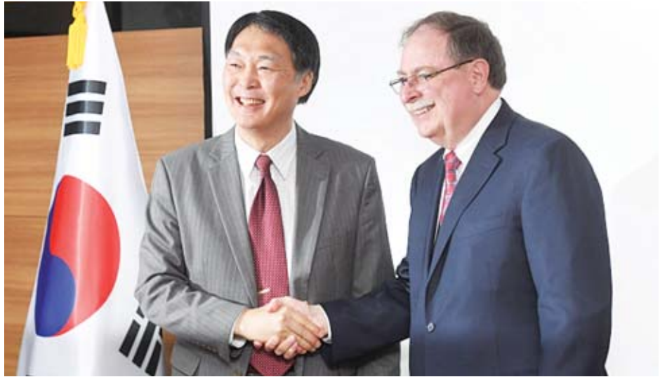
ထည့်ဝင်သော ငွေကြေးကို တောင်ကိုရီးယားအခြေစိုက် အမေရိကန်တပ်စခန်းများတွင် အလုပ်လုပ်နေသည့် တောင်ကိုရီးယားအရပ်ဘက် အလုပ်သမားများအတွက် လုပ်အားခ ရှင်းလင်းပေးရန်၊ အမေရိကန်စစ်အခြေစိုက် စခန်းများအတွက် ဆောက်လုပ်ရေးကုန်ကျစရိတ်နှင့် ကူညီထောက်ပံ့စရိတ်များအတွက် အသုံးပြုလျက်ရှိ ကြောင်း သိရသည်။ ဆင်ဟွာ

တောင်ကိုရီးယားအနေဖြင့် ယခုနှစ်အတွက် ၀.၈ ၁ ဒသမ ၀၄ ထရီလီယံ (အမေရိကန်ဒေါ်လာ ၉၂၅ သန်း) ပေးဆောင်ရမည်ဖြစ်ပြီး ပြီးခဲ့သည့် နှစ်ကထက် ၈ ဒသမ ၂ ရာခိုင်နှုန်း တိုးလာခဲ့သည်။ တောင်ကိုရီးယားတွင် စခန်းချနေသည့် အမေရိကန်တပ်များအတွက် တောင်ကို ရီးယားအနေဖြင့် ပြီးခဲ့သည့် ၂၀၁၈ ခုနှစ်က ၀.၈ ၉၆၀ ဘီလီယံ( အမေရိကန်ဒေါ်လာ ၅၈၄ သန်း)ပေးဆောင် ခဲ့ရသည်။ ယခုနှစ်ဒုတိယနှစ်ဝက်တွင် စာချုပ်အသစ်အတွက် စေ့စပ်ဆွေးနွေးရန် နှစ်နိုင်ငံ မဟာမိတ်ခေါင်းဆောင်များ မျှော်မှန်းထားသည်။ ကိုရီးယားစစ်ပွဲ၁၉၅၀-၁၉၅၃ နှစ်အေးကာလများ အတွင်း အမေရိကန်တပ်သား ၂၈၅၀၀ ခန့်ကို တောင်ကို ရီးယားတွင် စခန်းချထားသည်။ တောင်ကိုရီးယားက