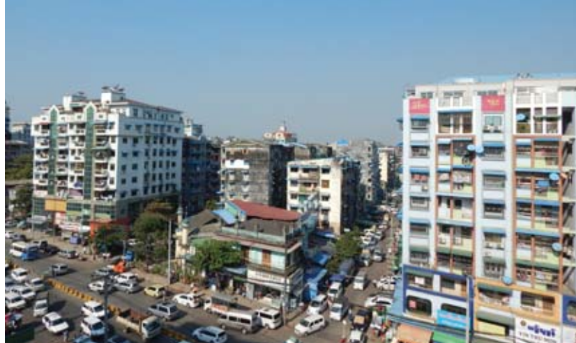
ရန်ကုန်မြို့၊ တာမွေမြို့နယ်ရှိ အထပ်မြင့်အဆောက်အအုံများအား တွေ့ရစဉ်။

၁၉၉၇ ခုနှစ်တွင် ဈေးကွက်တည်ငြိမ်ခဲ့ပြီး ၂၀၀၁ ခုနှစ်တွင် ဈေးကွက်ပြန်လည်ဖြစ်ထွန်းခဲ့ ကြောင်း၊ ထိုအတိုင်းပင် ၂၀၀၃ ခုနှစ်၊ ၂၀၀၈ ခုနှစ်၊ ၂၀၁၂ ခုနှစ်တွင် ဈေးကွက်လည်ပတ်မှု အားကောင်း ခဲ့သောကြောင့် ၂၀၁၉ ခုနှစ်သည် အိမ်ခြံမြေ ဈေးကွက် လည်ပတ်မည့်ကာလဖြစ်ကြောင်း အိမ်ခြံမြေလုပ်ငန်း လုပ်ကိုင်ကြသူများက ဆိုထားကြသည်။