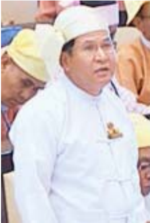
ဒုတိယဝန်ကြီး ဦးတင်မြင့်

မြန်မာနိုင်ငံရင်းနှီးမြှုပ်နှံမှုကော်မရှင်မှ ဖွဲ့စည်းပေးခဲ့သော အထူးကွင်းဆင်းစစ်ဆေးရေးအဖွဲ့၏ အစီရင်ခံစာပါအချက်များအပေါ်အခြေခံ၍ ၂၀၁၇ ခုနှစ် ဒီဇင်ဘာ ၂၂ ရက်တွင် ကျင်းပခဲ့သည့် မြန်မာနိုင်ငံရင်းနှီးမြှုပ်နှံမှု ကော်မရှင်၏ ၁၇/၂၀၁၇ ကြိမ်မြောက် အစည်းအဝေးတွင် “ငှားရမ်းခများ ပြန်လည်ညှိနှိုင်း၍ သီးသန့်စာချုပ် ပြင်ဆင်ချုပ်ဆိုရန်နှင့် အဆိုပါကိစ္စရပ်များ