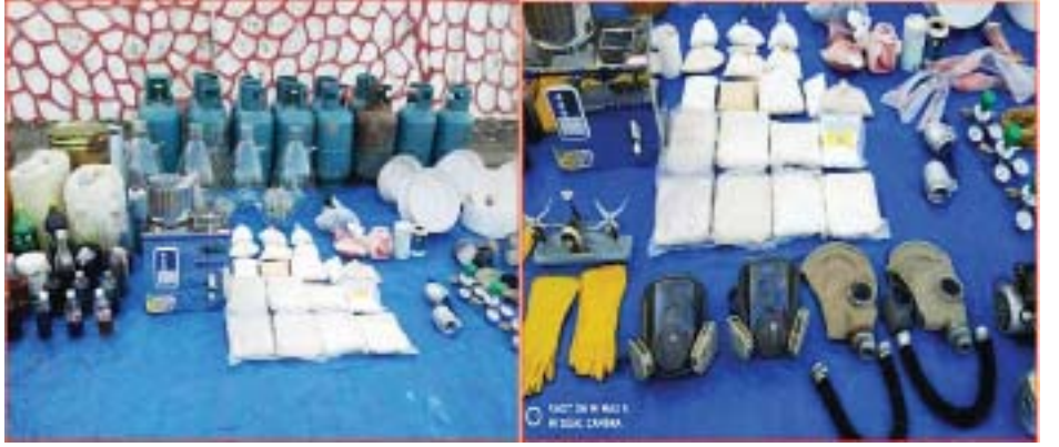
အိုးများ၊ မော်တာများအပါအဝင် စုစုပေါင်း ပစ္စည်း ၃၄ ခွဲသဖြင့် ကုန်းကြမ်းမြို့နယ်အရပ်ရပ်တွင် အမှုဖွင့်စစ်ဆေးလျက် ရှိကြောင်း သိရသည်။ သတင်းစဉ်

ညနေ ၆ နာရီခွဲခန့်တွင် လူနေထိုင်ခြင်းမရှိသည့် တောင်ယာတဲအတွင်းမှ ဘိန်းဖြူမှုနှင့် ၃၂ ဒဿမ ၅ ကီလိုဂရမ် အိုက်စစ် ၁ ဒဿမ ၅ ကီလိုဂရမ်၊ စိတ်ကြွဆေးပြား အမှုနှင့် ၁၁ ဒဿမ ၄ ဂရမ်၊ ဘိန်းကြမ်းမှုနှင့် ၁၄ ကီလိုဂရမ် နှင့် မူးယစ်ဆေးဝါးချက်လုပ်ရာတွင် အသုံးပြုသည့် ဆက်စပ်ပစ္စည်းများဖြစ်သော ဓာတုဆေးရည်၊ ပစ္စည်းများ၊ လက်အိတ်များ၊ ဓာတ်ငွေ့ကာမျက်နှာဖုံးများ၊ ဖန် ပေါင်းချောင်များ၊ ဓာတ်ခွဲခန်းသုံးဖန်ပြွန်များ၊ ဂက်စ်