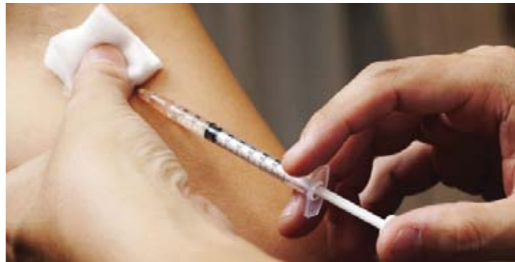
ရှင်မင်း

ထို့ပြင် ကျန်းမာရေးနှင့်အားကစားဝန်ကြီးဌာနသည် ၂၀၃၀ ပြည့်နှစ်တွင် ခွေးရူးပြန် ရောဂါပျောက်နိုင်ရေးအတွက် One Health Approach လုပ်ဆောင်နိုင်ရန်အတွက် စိုက်ပျိုးရေး၊ မွေးမြူရေးနှင့် ဆည်မြောင်းဝန်ကြီးဌာန၊ သယ်ယူပို့ဆောင်ရေးနှင့် အထူးထိန်းသိမ်းရေးဝန်ကြီးဌာနတို့နှင့်ပူးပေါင်းကာ National One Health Strategic Framework (မူကြမ်း)ကို ရေးဆွဲနိုင်ခဲ့ပြီး အပြီးသတ် အတည်ပြုနိုင်ရေးအတွက်လည်း ကြိုးပမ်း ဆောင်ရွက်လျက်ရှိကြောင်း သိရသည်။