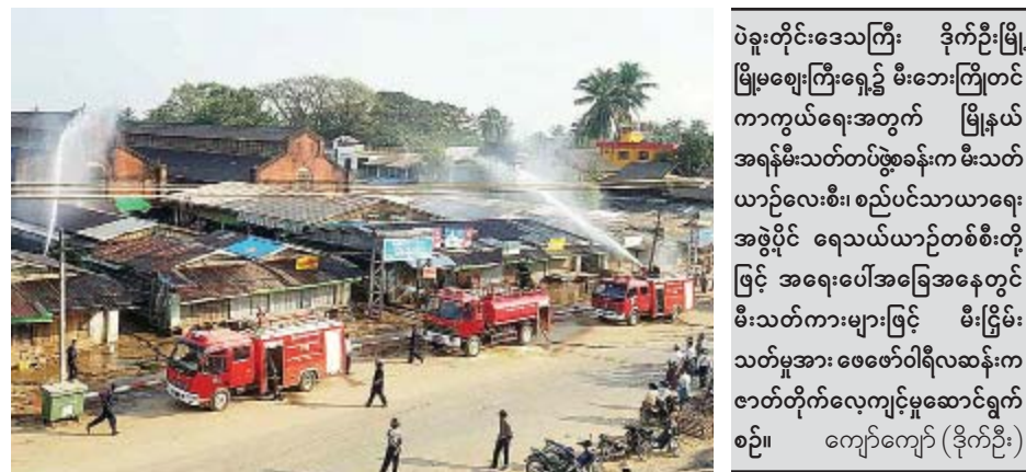
ပဲခူးတိုင်းဒေသကြီး ဒိုက်ဦးမြို့ မြို့မဈေးကြီးရှေ့၌ မီးဘေးကြိုတင်ကာကွယ်ရေးအတွက် မြို့နယ်အရန်မီးသတ်တပ်ဖွဲ့ဝန်က မီးသတ်ယာဉ်လေးစီး၊ စည်ပင်သာယာရေးအဖွဲ့ပိုင် ရေသယ်ယာဉ်တစ်စီးတို့ဖြင့် အရေးပေါ်အခြေအနေတွင် မီးသတ်ကားများဖြင့် မီးငြိမ်းသတ်မှုအား ဖေဖော်ဝါရီလဆန်းက ဇာတ်တိုက်လေ့ကျင့်မှုဆောင်ရွက်စဉ်။