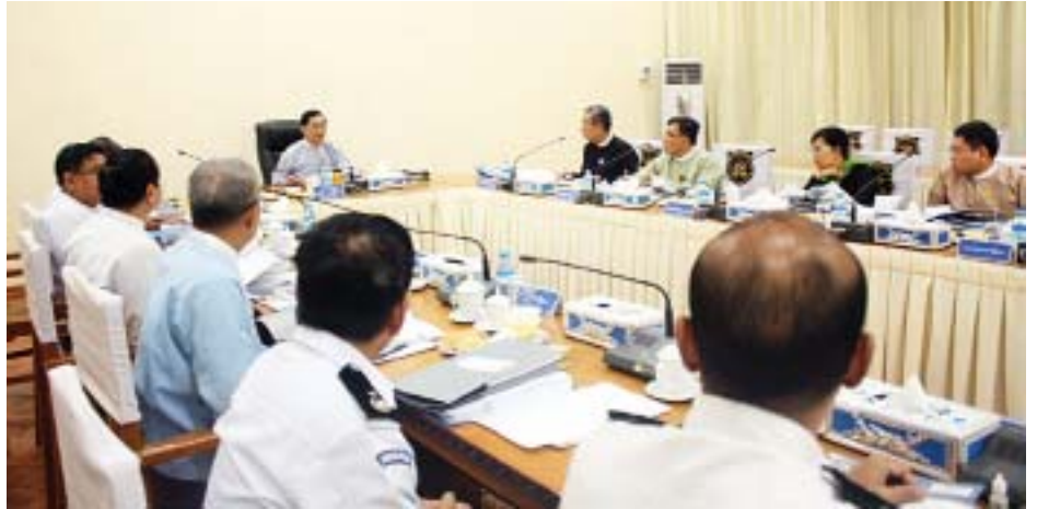
ကို လက်ခံဆောင်ရွက်ခဲ့ရာ ၂၀၁၉ ခုနှစ် ဖေဖော်ဝါရီ ၆ ရက်အထိ လျှောက်ထားသူ ၅၈၂ ဦးရှိပြီး ၄၈၀ ကို ခွင့်ပြုပေးခဲ့ကြောင်း နိုင်ငံခြားသားအမြဲနေထိုင်ခွင့်ပြုခြင်း

မြန်မာနိုင်ငံတွင် နိုင်ငံခြားသားအမြဲနေထိုင်ခွင့်စနစ်ကို ၂၀၁၅ ခုနှစ် ဇန်နဝါရီ ၂၉ ရက်မှ စတင်၍ ကျွမ်းကျင်ပညာရှင်၊ ရင်းနှီးမြှုပ်နှံသူ၊ မြန်မာနိုင်ငံသားဟောင်းနှင့် ယင်းတို့နှင့် သွေးချင်းဆက်စပ်သူ နိုင်ငံခြားသားဟူ၍ အမျိုးအစားလေးမျိုးခွဲခြား သတ်မှတ်ကာလျှောက်လွှာများ