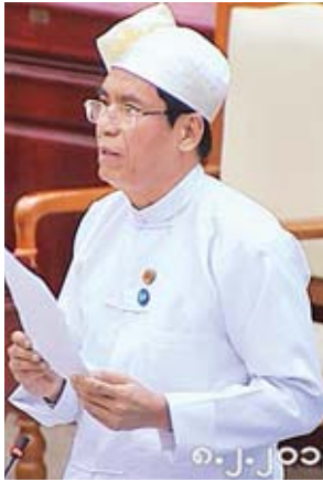
ဒုတိယဝန်ကြီး ဦးအောင်လှထွန်း

ဖောင်းပြင် မဲဆန္ဒနယ်မှ ဦးထွန်းဝေ၏ တမလန်းနှင့် ပီတောက်၊ သစ်မာ များကို Annual Allowable Cut သတ်မှတ်၍ ပုဂ္ဂလိက ထုတ်လုပ်ခွင့်ပေးရန် အစီအစဉ်ရှိ မရှိ မေးခွန်းနှင့်စပ်လျဉ်း၍ သယံဇာတနှင့် သဘာဝပတ်ဝန်းကျင်