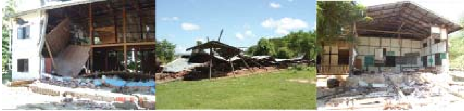
ပုံ (၇) ။ တောင်တွင်းကြီးလျှင် (၂၀၀၃)ကြောင့် ပြိုကျသွားသော ကြမ်းကြားရွာ ဘုန်းတော်ကြီးကျောင်း (ဝဲ)၊ ခြေဆေးအိုင်ရွာ မူလတန်းကျောင်း (လယ်) နှင့် သပိတ်ကျင်းလျှင် (၂၀၁၂) ကြောင့် ပျက်စီးသွားသော ရွှေဘိုမြို့နယ် မလားရွာ အခြေခံပညာမူလတန်းကျောင်း (ယာ)။

ကြီးများလှုပ်သောအခါ ထိုအင်ဂျင်နီယာဒီဇိုင်းအားနည်းသော၊ အရည်အသွေးနိမ့်သော ဆောက်လုပ်ရေးပစ္စည်းများနှင့် တည်ဆောက်ထားသော အဆောက်အအုံများ အပျက်များသည်ကို တွေ့ရသည်။ တောင်တွင်းကြီးလျှင် (၂၀၀၃) သည် ညအချိန်လှုပ်၍သာ တော်တော်သည်။ နေအခါ စာသင်ချိန်လှုပ်ခဲ့ပါက ပုံ (၇)တွင်