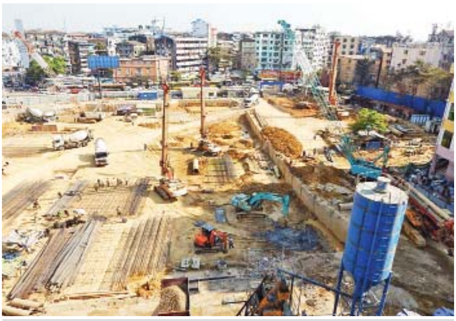
အဆင့်မြင့်မင်္ဂလာဈေးသစ် တည်ဆောက်ရေးစီမံကိန်းလုပ်ငန်းခွင်အား တွေ့ရစဉ်။

အဆင့်မြင့်မင်္ဂလာဈေးသစ် တည်ဆောက်ခြင်း လုပ်ငန်းအတွက် ၂၀၁၈ ခုနှစ် မေလတွင် ပန္နက်ရိုက်ပြီး ဆာပေးလုပ်ငန်းများ လုပ်ဆောင်ခြင်းနှင့် အကြို အင်ဂျင်နီယာလုပ်ငန်းများကို စတင်ဆောင်ရွက်ခဲ့ကာ ဇူလိုင်လတွင် ပိုင်ရိုက်ခြင်းလုပ်ငန်းများ စတင်ခဲ့ကြောင်းနှင့်