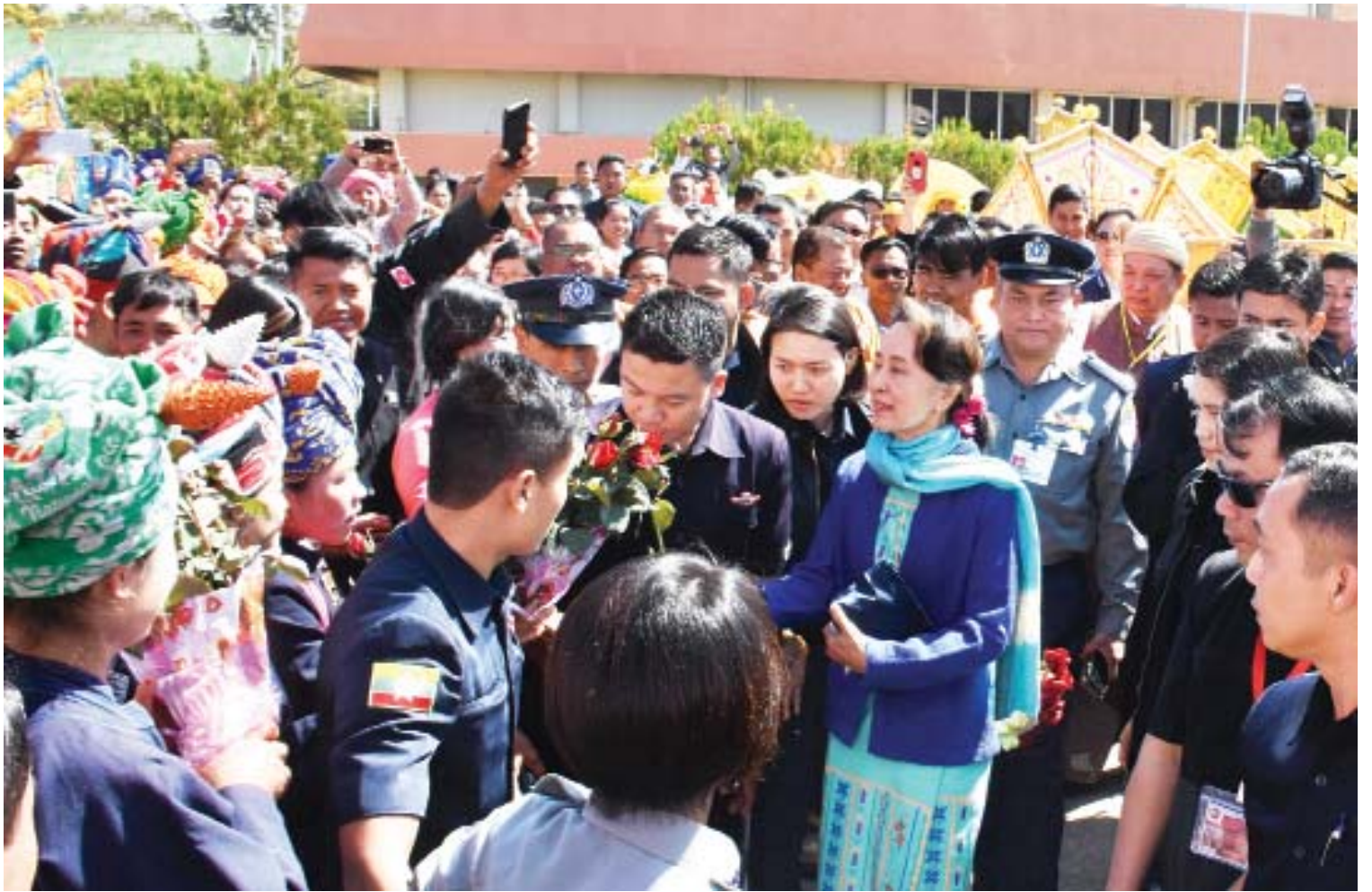
နိုင်ငံတော်၏အတိုင်ပင်ခံပုဂ္ဂိုလ် ဒေါ်အောင်ဆန်းစုကြည်နှင့်အဖွဲ့အား ဟံဟိုးလေဆိပ်တွင် လွှတ်တော်ကိုယ်စားလှယ်များ၊ ဒေသခံတိုင်းရင်းသားများက ကြိုဆိုကြစဉ်။

“ထူးခြားချက်တစ်ခုမှာ ရှမ်းပြည်နယ်တွင် ဘာသာမခြား၊ လူမျိုးမခြားဘဲ ရင်းနှီးချစ်ကြည်စွာ ပူးတွဲနေထိုင်လုပ်ကိုင်နေကြသည်မှာ ကျေနပ်အားရ ဖွယ် ကောင်းပါကြောင်း၊ ယင်း ချစ်ကြည်ရင်းနှီးညီညွတ်မှုကို တောင်ကြီးမြို့မှ ရှမ်းပြည်နယ် တစ်ခုလုံး၊ ရှမ်းပြည်နယ်မှ ပြည်ထောင်စုတစ်ခုလုံးသို့ ပျံ့နှံ့ရောက်ရှိအောင် ကြိုးပမ်းပေးကြစေလို”