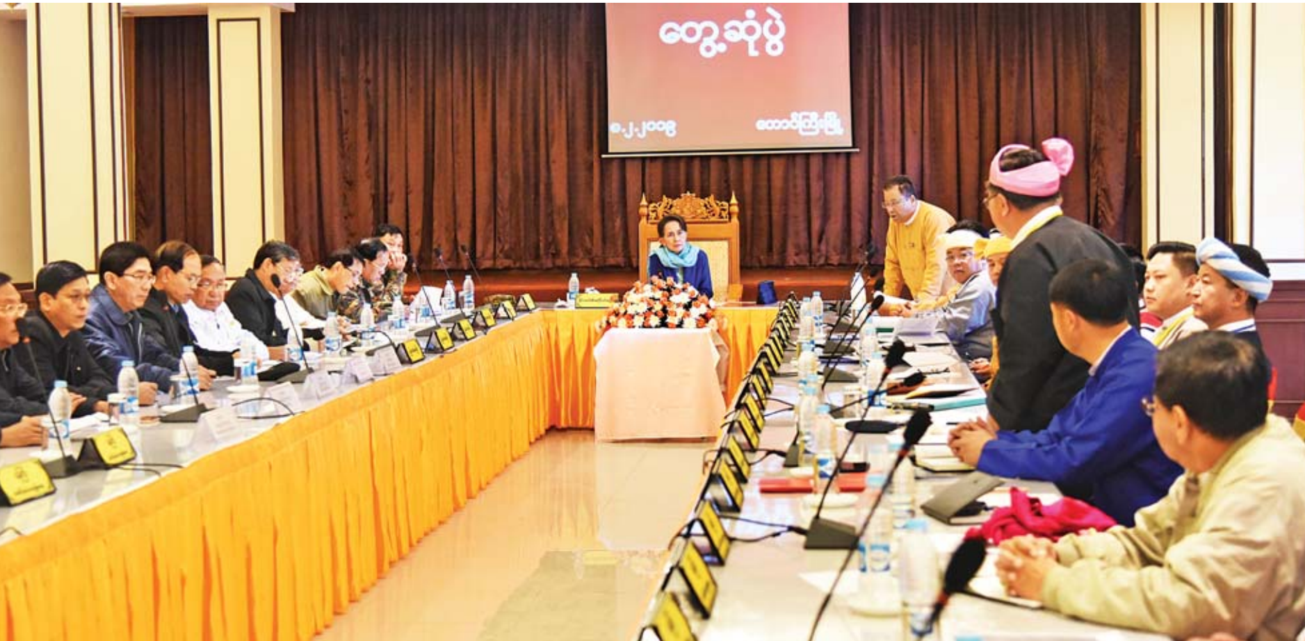
နယ်စပ်ဒေသနှင့် တိုင်းရင်းသားလူမျိုးများ ဖွံ့ဖြိုးတိုးတက်ရေး ပဟိတကော်မတီဥက္ကဋ္ဌ နိုင်ငံတော်၏အတိုင်ပင်ခံပုဂ္ဂိုလ် ဒေါ်အောင်ဆန်းစုကြည် ရှမ်းပြည်နယ်အစိုးရအဖွဲ့ဝင်များနှင့် တွေ့ဆုံဆွေးနွေးစဉ်။

တောင်ကြီး၊ ဖေဖော်ဝါရီ ၈ ရှမ်းပြည်နယ် တောင်ကြီးမြို့၌ ရောက်ရှိနေသည့် နယ်စပ်ဒေသနှင့် တိုင်းရင်းသားလူမျိုးများ ဖွံ့ဖြိုးတိုးတက်ရေးပဟိတကော်မတီဥက္ကဋ္ဌ နိုင်ငံတော်၏အတိုင်ပင်ခံပုဂ္ဂိုလ် ဒေါ်အောင်ဆန်းစုကြည်သည် ရှမ်းပြည်နယ်အစိုးရအဖွဲ့ဝင်များအား ယနေ့ နံနက်ပိုင်းတွင် တောင်ကြီးဟိုတယ်၌တွေ့ဆုံပြီး ပြည်နယ်ဖွံ့ဖြိုးရေး၊ တည်ငြိမ်အေးချမ်းရေးနှင့် သဟဇာတဖြစ်ရေးကိစ္စရပ်များကို မှာကြားသည်။ တွေ့ဆုံပွဲတွင် နိုင်ငံတော်၏အတိုင်ပင်ခံပုဂ္ဂိုလ်က နှုတ်ခွန်းဆက်အမှာစကားပြောကြားသည်။ ယင်းနောက် များနှင့် ဆက်လက်ဆောင်ရွက်သွားမည့်ကိစ္စရပ်များကို ရှင်းလင်းတင်ပြပြီး ပြည်နယ်ဝန်ကြီးများက လုပ်ငန်းများ ရှမ်းပြည်နယ်ဝန်ကြီးချုပ် ဒေါက်တာလင်းထွဋ်က ရှမ်းပြည်နယ်အတွင်း ဆောင်ရွက်နေသည့် ဒေသဖွံ့ဖြိုးရေးလုပ်ငန်း ဆောင်ရွက်နေမှုနှင့် လိုအပ်ချက်များကို တင်ပြကြသည်။ စာမျက်နှာ ၃ ကော်လံ ၁ သို့ ❖