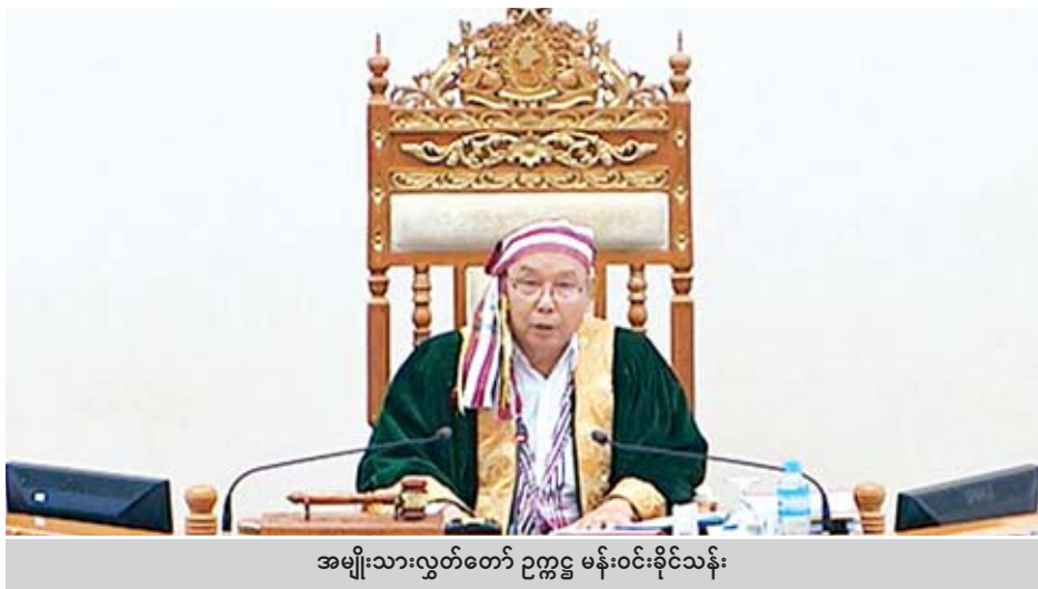
အမျိုးသားလွှတ်တော် ဥက္ကဋ္ဌ မန်းဝင်းခိုင်သန်း

ထို့နောက် အမျိုးသားလွှတ်တော်ဥက္ကဋ္ဌ မန်းဝင်းခိုင်သန်းက အမျိုးသားလွှတ်တော်က အတည်ပြုပြီး ပေးပို့ထားသော တီထွင်မှု မှုပိုင်ခွင့် ဥပဒေကြမ်းကို ပြည်သူ့ လွှတ်တော်က ပြင်ဆင်ချက်ဖြင့် ပြန်လည်ပေးပို့လာခြင်းနှင့် စပ်လျဉ်း၍ ပြည်သူ့လွှတ်တော်၏ ပြင်ဆင်ချက်ကို အတည် ပြုရန် လွှတ်တော်၏ အဆုံးအဖြတ်ရယူရာ လွှတ်တော်က သဘောတူအတည်ပြုကြောင်း ကြေညာသည်။