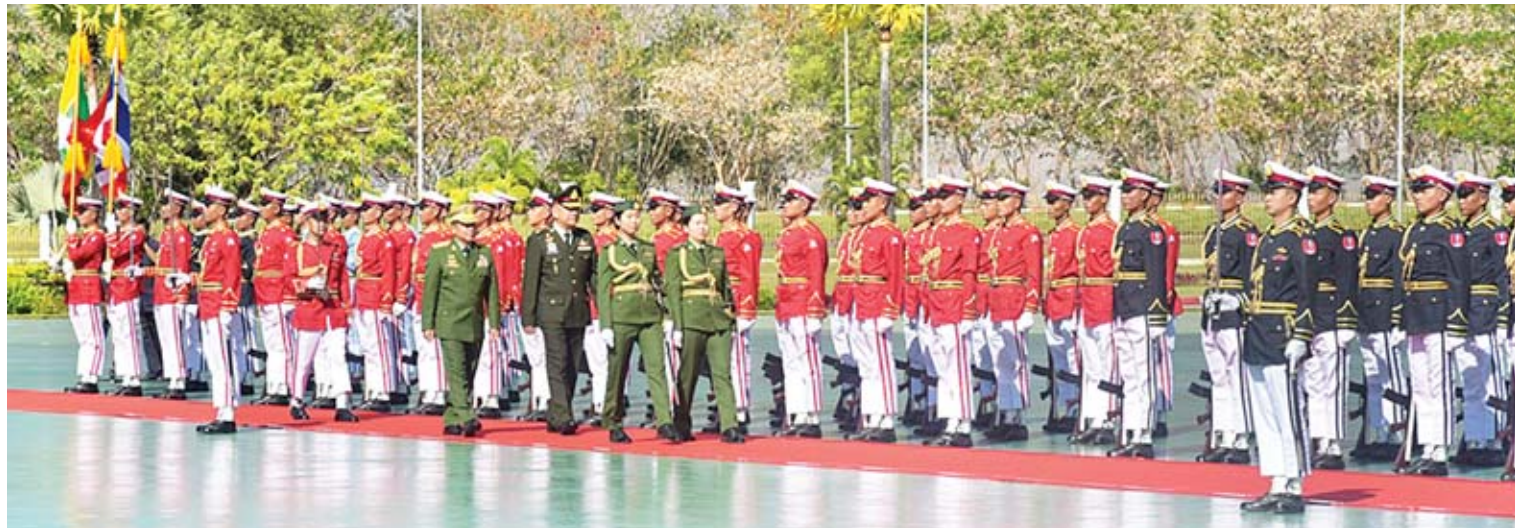
တပ်မတော်ကာကွယ်ရေးဦးစီးချုပ် ဝိုင်းဘုရင့်တပ်မတော်ကာကွယ်ရေးဦးစီးချုပ် General Ponpipat Benyasri တို့ ဂုဏ်ပြုတပ်ဖွဲ့ကို စစ်ဆေးကြစဉ်။

စာချုပ်ကို လက်မှတ်ရေးထိုးနိုင်ခဲ့ခြင်းသည် ထိုင်းနိုင်ငံ၏ အိမ်နီးချင်းကောင်းပီသစွာ ကူညီဆောင်ရွက်ပေးမှုများက အရေးပါသော အချက်တစ်ချက်ဖြစ်သည်။ အခြေအနေများ၊ နှစ်နိုင်ငံတပ်မတော် နှစ်ရပ်အကြား အောက်ခြေအဆင့်အထိ ခင်မင်ရင်းနှီးစွာ ပူးပေါင်းဆောင်ရွက်မှုများကြောင့် နှစ်နိုင်ငံ အကြား ပြဿနာတစ်စုံတစ်ရာ မရှိသည့် အခြေအနေများ၊ ယဉ်ကျေးမှုအဖွဲ့များ၊ အားကစားအဖွဲ့များ၊ အပြန်အလှန်စေလွှတ် ရေး၊ အောက်ခြေအဆင့်အထိ အပြန်အလှန် ချစ်ကြည်ရေးခရီးစဉ်များ တိုးမြှင့်စေလွှတ်ရေး၊ ထိုင်းနိုင်ငံရှိ IDP စခန်းများမှ မြန်မာ နိုင်ငံသားများ မြန်မာနိုင်ငံသို့ ပြန်လာနိုင်ရေး ပူးပေါင်းဆောင်ရွက်လျက်ရှိသည့် အခြေအနေ များ၊ ထိုင်းနိုင်ငံတွင် အလုပ်လုပ်ကိုင်လျက် ရှိသော မြန်မာနိုင်ငံသားများကို ဥပဒေနှင့် အညီ စောင့်ရှောက်ပေးမည့်အခြေအနေများ၊ တပ်မတော်နှစ်ရပ်အကြား အကျိုးတူပူးပေါင်း ဆောင်ရွက်မှုနှင့် ချစ်ကြည်ရင်းနှီးမှုကို လက်ရှိ စာမျက်နှာ ၁၁ ကော်လံ ၁ သို့ *