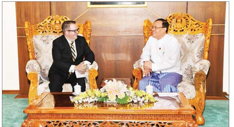
၏ ဒီမိုကရေစီအသွင်ကူးပြောင်းမှုနှင့် ရခိုင်ပြည်နယ်အရေး ဆက်လက်ပေးအပ်သွားရေးတို့ကို ဆွေးနွေးခဲ့ကြကြောင်း ကိစ္စတွင် အပြုသဘောဆောင်သော အထောက်အပံ့များ သိရသည်။ သတင်းစဉ်

တွေ့ဆုံစဉ် နှစ်နိုင်ငံဆက်ဆံမှုနှင့် ပူးပေါင်း ဆောင်ရွက်မှုတိုးမြှင့်ရေး၊ စိုက်ပျိုးရေးနှင့် မွေးမြူရေးကဏ္ဍ၊ ပြန်လည်ပြုပြင်ထိန်းသိမ်းရေးအင်အား၊ လူ့စွမ်းအားအရင်းအမြစ် ဖွံ့ဖြိုးရေးကဏ္ဍနှင့် ဒေသတွင်းဆိုင်ရာကိစ္စရပ်များတွင် နှစ်ဖက်ပူးပေါင်းဆောင်ရွက်မှု တိုးမြှင့်သွားရေး မြန်မာနိုင်ငံ