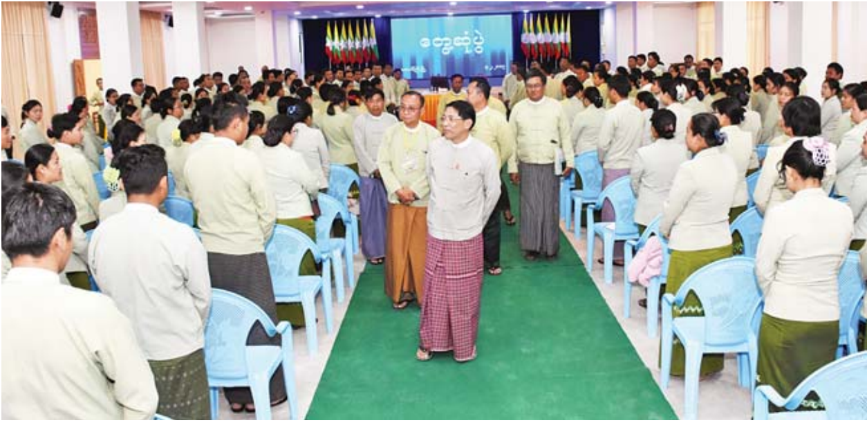
ပြည်ထောင်စုဝန်ကြီး ဦးမင်းသူ ရှမ်းပြည်နယ်(တောင်ပိုင်း/မြောက်ပိုင်း)ရှိ အထွေထွေအုပ်ချုပ်ရေးဦးစီးဌာနမှ ဝန်ထမ်းများနှင့် ရင်းရင်းနှီးနှီးတွေ့ဆုံစဉ်။