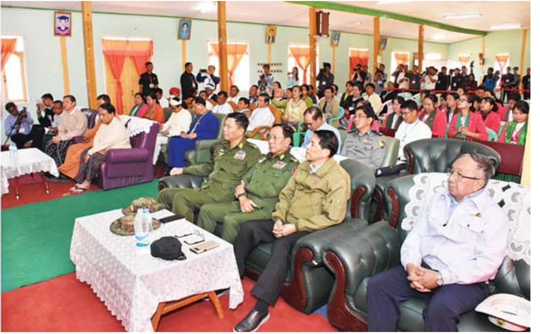
နိုင်ငံတော်၏အတိုင်ပင်ခံပုဂ္ဂိုလ် ဒေါ်အောင်ဆန်းစုကြည် အထက(၂)တောင်ကြီး အစည်းအဝေးခန်းမ၌ ပညာရေးကဏ္ဍဖွံ့ဖြိုးတိုးတက်ရေးကိစ္စရပ်များကို ဆွေးနွေးမှာကြားစဉ်။

စိုးရိမ်မိပါကြောင်း၊ မည်သည့်အတွက်ကြောင့် ယခုလိုနည်းပါးရသည်ကိုလည်း အဖြေမပေး နိုင်ကြပါကြောင်း၊ တစ်ယောက်ကပြောသည် မှာ အချို့က ကျောင်းထွက်အလုပ်လုပ်ပြီး အချို့က ဘာမှမလုပ်ဘဲ နေနေကြကြောင်း၊ ယင်းကိုမိဘများနှင့် ဆရာဆရာမများအနေ ဖြင့် ပြန်လည်ကြည့်ရှုပေးစေချင်ပါကြောင်း၊ ကျောင်းမတက်သည့် ယောက်ျားလေးများ သည် မိဘများကိုကူညီပြီး စီးပွားရေးလုပ်နေ သလား၊ အလုပ်လုပ်နေသလား၊ လမ်းပေါ် ရောက်နေသလား သို့မဟုတ် လက်ဖက်ရည် ဆိုင်မှ အရက်ဆိုင်၊ ထိုမှတစ်ဆင့် မူးယစ် ဆေးဝါးအဆင့်အထိ ရောက်သွားမည်ကို မိမိအနေဖြင့် စိုးရိမ်ပါကြောင်း။