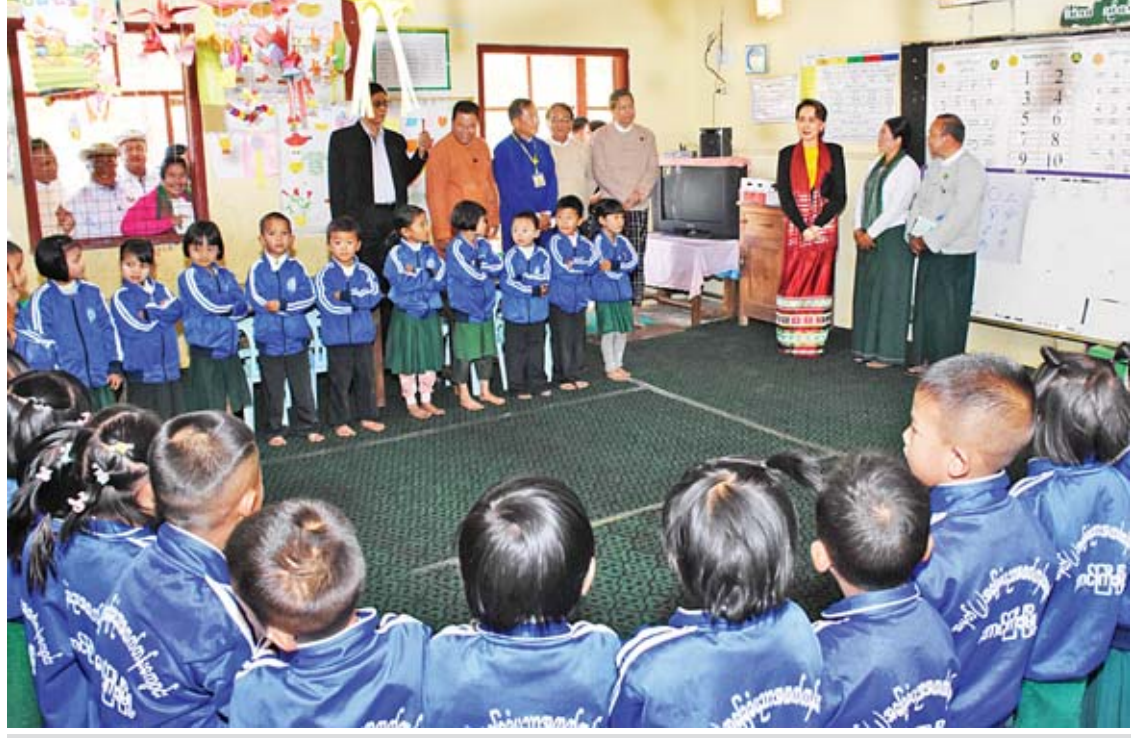
နိုင်ငံတော်၏အတိုင်ပင်ခံပုဂ္ဂိုလ် ဒေါ်အောင်ဆန်းစုကြည် တောင်ကြီးမြို့ အမှတ်(၂) အခြေခံပညာအထက်တန်းကျောင်းမှ ကျောင်းသားကျောင်းသူလေးများကို ပညာသင်ကြားနေမှုအခြေအနေများ မေးမြန်းစဉ်။

KG အတန်းများကို သွားသည့်အခါ ကလေးများမှာ တိုင်းရင်းသားမျိုးစုံက တက်ရောက်သင်ကြားနေသည်ကို တွေ့ရကြောင်း၊ တိုင်းရင်းသားပေါင်းစုံ အေးအေးဆေးဆေး စာမျက်နှာ ၆ သို့ >>