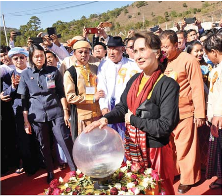
နိုင်ငံတော်၏အတိုင်ပင်ခံပုဂ္ဂိုလ် ဒေါ်အောင်ဆန်းစုကြည် ရှမ်းပြည်နယ်(တောင်ပိုင်း) ကုန်သည်များနှင့် စက်မှုလက်မှုလုပ်ငန်းရှင်များအသင်းရုံး အဆောက်အအုံဆိုင်ဘုတ်ကို စက်ခလုတ်နှိပ်ဖွင့်လှစ်ပေးစဉ်။

၏ အနေအထားကို မမေ့ပါကြောင်း၊ အဘယ်ကြောင့်ဆိုသော် မိမိတို့နိုင်ငံသည် တိုင်းရင်းသားလူမျိုးပေါင်းစုံ၊ ဒေသပေါင်းစုံ ပါဝင်သည့် ပြည်ထောင်စုဖြစ်ပါကြောင်း၊ ပြည်ထောင်စုအတွင်းတိုးတက်သည့် နေရာတွင် ညီညီမျှမျှတိုးတက်စေရန်ဖြစ်ပါကြောင်း၊ အားလုံးသည် အေးအတူပူအမျှ စိတ်ဓာတ်ဖြင့် ပြဿနာများရှိပါကလည်း အတူတူ