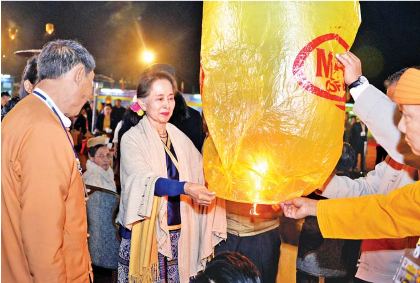
နိုင်ငံတော်၏အတိုင်ပင်ခံပုဂ္ဂိုလ် ဒေါ်အောင်ဆန်းစုကြည် ရှမ်းပြည်နယ်နေ့ အထိမ်းအမှတ် မီးပုံးပျံငယ်ကို လွှတ်တင်ပေးစဉ်။