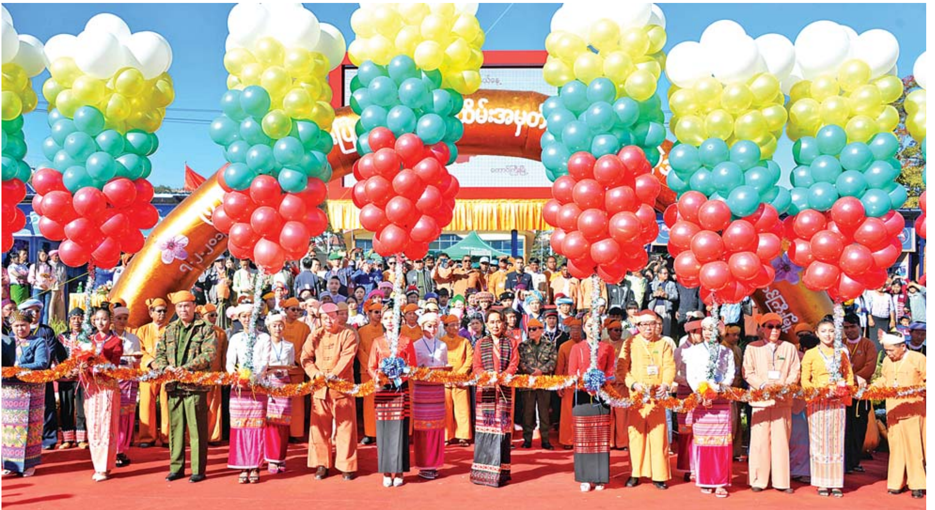
နိုင်ငံတော်၏အတိုင်ပင်ခံပုဂ္ဂိုလ် ဒေါ်အောင်ဆန်းစုကြည်၊ ပြည်ထောင်စုဝန်ကြီး ဒုတိယဗိုလ်ချုပ်ကြီးကျော်ဆွေ၊ ပြည်နယ်ဝန်ကြီးချုပ် ဒေါက်တာလင်းထွဋ်၊ ပြည်နယ်လွှတ်တော်ဥက္ကဋ္ဌ ဦးစိုင်းလုံးဆိုင်၊ ရှမ်းတိုင်းရင်းသားနာယက ဦးစိုင်းခွဲတောင်၊ ပြည်နယ်လွှတ်တော်ကိုယ်စားလှယ် ဦးစိုင်းခင်မောင်ညွန့်နှင့် ဒေါ်နန်းခင်ထားရီတို့ (၇၂)နှစ်မြောက် ရှမ်းပြည်နယ်နေ့အထိမ်းအမှတ် တိုင်းရင်းသားရိုးရာ ယဉ်ကျေးမှုပြခန်းများနှင့် ဌာနဆိုင်ရာပြခန်းများကို ဖဲကြိုးဖြတ် ဖွင့်လှစ်ပေးကြစဉ်။

တောင်ကြီး ဇေဇော်ဝါရီ ၇ ရှမ်းပြည်နယ် တောင်ကြီးမြို့၌ ရောက်ရှိနေသည့် နယ်စပ်ဒေသနှင့် တိုင်းရင်းသား လူမျိုးများ ဖွံ့ဖြိုးတိုးတက်ရေးအတွက်မတီဥက္ကဋ္ဌ နိုင်ငံတော်၏အတိုင်ပင်ခံ ပုဂ္ဂိုလ် ဒေါ်အောင်ဆန်းစုကြည်သည် ယနေ့ နံနက် ၈ နာရီခွဲတွင် တောင်ကြီးမြို့ အဝေရာ (မီးပုံးပျံကွင်း)၌ ကျင်းပသည့် (၇၂)နှစ်မြောက် ရှမ်းပြည်နယ်နေ့ အခမ်းအနားသို့ တက်ရောက်သည်။ အဆိုပါအခမ်းအနားသို့ ပြည်ထောင်စုဝန်ကြီးများ၊ ရှမ်းပြည်နယ်ဝန်ကြီး ချုပ်၊ အရှေ့ပိုင်းတိုင်းစစ်ဌာနချုပ်တိုင်းမှူး၊ တိုင်းရင်းသားလူမျိုးများရေးရာ