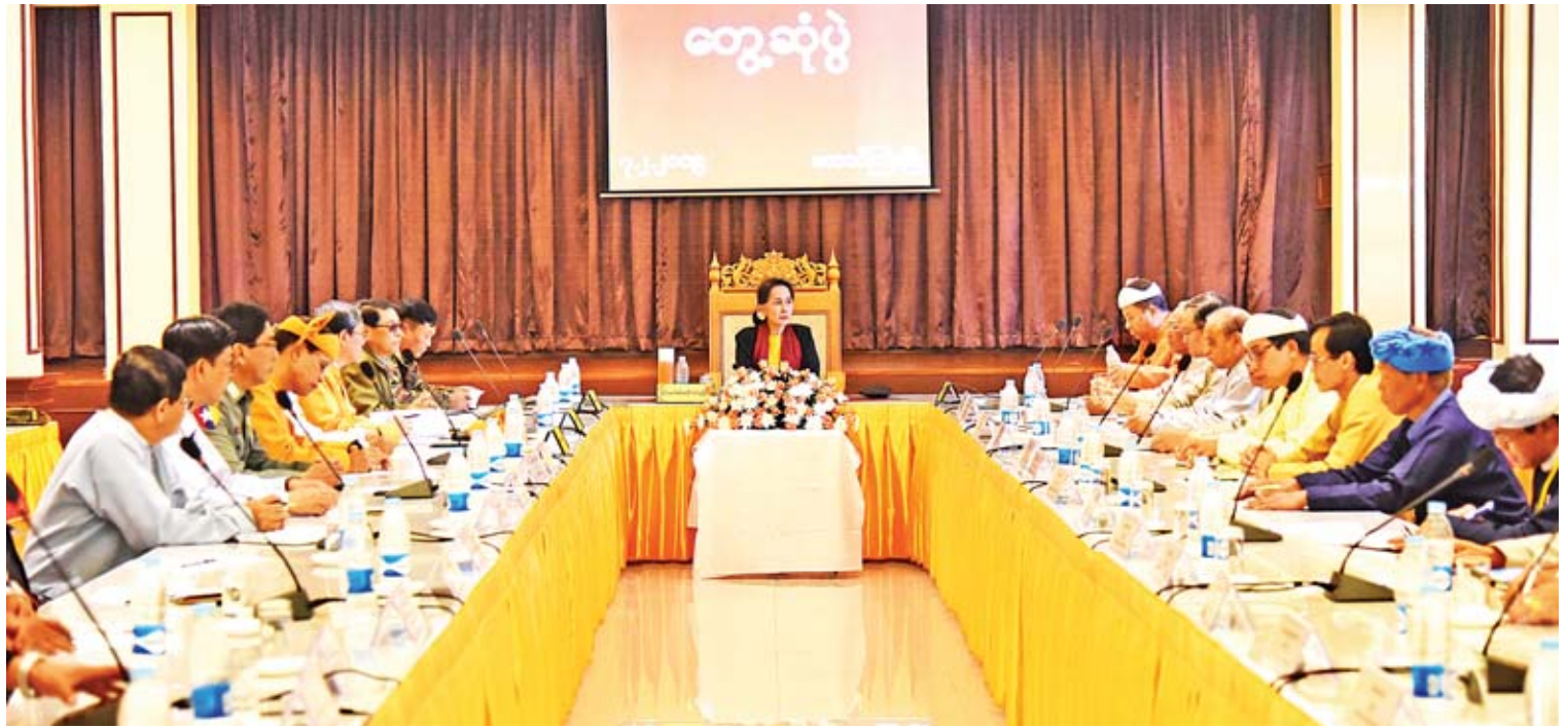
နိုင်ငံတော်၏အတိုင်ပင်ခံပုဂ္ဂိုလ် ဒေါ်အောင်ဆန်းစုကြည် ဘာသာရေးခေါင်းဆောင်များ၊ တိုင်းရင်းသားခေါင်းဆောင်များ၊ တိုင်းရင်းသားလူမျိုးရေးရာဝန်ကြီးများ၊ ကိုယ်ပိုင်အုပ်ချုပ်ခွင့်ရတိုင်း/ဒေသဦးစီးအဖွဲ့ဥက္ကဋ္ဌများနှင့် တောင်ကြီးဟိုတယ်၌ တွေ့ဆုံစဉ်။

တောင်ကြီး ဇေဇော်ဝါရီ ၇ ရှမ်းပြည်နယ် တောင်ကြီးမြို့၌ ရောက်ရှိနေသည့် နယ်စပ်ဒေသနှင့် တိုင်းရင်းသားလူမျိုးများ ဖွံ့ဖြိုးတိုးတက်ရေးဗဟိုကော်မတီဥက္ကဋ္ဌ နိုင်ငံတော်၏အတိုင်ပင်ခံပုဂ္ဂိုလ် ဒေါ်အောင်ဆန်းစုကြည်သည် ဘာသာရေးခေါင်းဆောင်များ၊ တိုင်းရင်းသားခေါင်းဆောင်များ၊ တိုင်းရင်းသားလူမျိုးရေးရာ ဝန်ကြီးများ၊ ကိုယ်ပိုင်အုပ်ချုပ်ခွင့်ရတိုင်း/ဒေသဦးစီးဥက္ကဋ္ဌများနှင့် ယနေ့နံနက်ပိုင်းတွင် တောင်ကြီးဟိုတယ်၌ တွေ့ဆုံသည်။