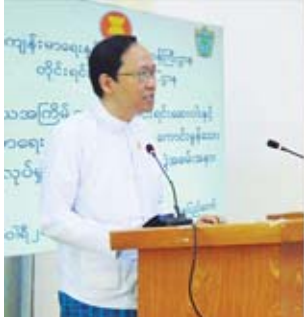
ကျန်းမာရေးနှင့် အားကစားဝန်ကြီးဌာန တိုင်းရင်းဆေးပညာဦးစီးဌာန အမြဲတမ်းအတွင်းဝန် ပါမောက္ခ ဒေါက်တာသက်ခိုင်ဝင်းက အဖွဲ့အမှားစကား ပြောကြားကာ ဖွင့်လှစ်ပေးခဲ့ပြီး တိုင်းဒေသကြီး/ပြည်နယ်

နေပြည်တော် ဇေဇော်ဝါရီ ၇ ကျန်းမာရေးနှင့် အားကစားဝန်ကြီးဌာန တိုင်းရင်းဆေးပညာဦးစီးဌာနက ဦးစီး၍ အစားအသောက်နှင့် ဆေးဝါးကွပ်ကဲရေးဦးစီးဌာန ဆေးဝါးစက်ရုံ(အင်းစိန်)နှင့် တိုင်းရင်းဆေးပညာရပ်ဆိုင်ရာ အကြံပေးအဖွဲ့က သက်ဆိုင်ရာပညာရှင်များ၏ ပံ့ပိုးမှုဖြင့် ဒုတိယအကြိမ်အာဆီယံတိုင်းရင်းဆေးနှင့် ကျန်းမာရေးဖြည့်စုံစာအုပ်အစာအိတ်ကော်မရှင်းမှန်းသောထုတ်လုပ်မှုကျင့်စဉ် သင်တန်းကို ဇေဇော်ဝါရီ ၇ ရက်က တိုင်းရင်းဆေးပညာဦးစီးဌာန အမျိုးသားပရဆေးဥယျာဉ်(နေပြည်တော်)၌ ကျင်းပသည်။