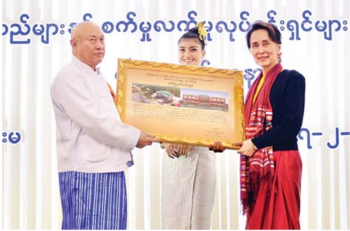
နိုင်ငံတော်၏အတိုင်ပင်ခံပုဂ္ဂိုလ် ဒေါ်အောင်ဆန်းစုကြည် ကုန်သည်များနှင့်စက်မှုလက်မှုလုပ်ငန်းရှင်များအသင်းချုပ် နာယက ဦးအောင်ကိုဝင်းအား ဂုဏ်ပြုမှတ်တမ်းလွှာပေးအပ်စဉ်။

ထိုနောက် နိုင်ငံတော်၏အတိုင်ပင်ခံ ပုဂ္ဂိုလ်၊ ပြည်ထောင်စုဝန်ကြီးများနှင့် ရှမ်း ပြည်နယ်ဝန်ကြီးချုပ်တို့သည် ပြည်ထောင်စု သမ္မတမြန်မာနိုင်ငံ ကုန်သည်များနှင့် စက်မှုလက်မှု လုပ်ငန်းရှင်များအသင်းချုပ်၊ ရှမ်းပြည်နယ်(တောင်ပိုင်း) ကုန်သည်များနှင့် စက်မှုလက်မှု လုပ်ငန်းရှင်များအသင်း၊ ညီနောင်အသင်းများမှ ဥက္ကဋ္ဌများ၊ အတွင်းရေး များများ၊ တိုင်းရင်းသားအဖွဲ့များနှင့်အတူ စုပေါင်းမှတ်တမ်းတင်ဓာတ်ပုံရိုက်သည်။ အခမ်းအနားအပြီးတွင် နိုင်ငံတော်၏ အတိုင်ပင်ခံပုဂ္ဂိုလ်သည် အခမ်းအနားသို့ တက်ရောက်လာကြသူများအား ရင်းရင်းနှီးနှီး နှုတ်ဆက်သည်။ သတင်းစဉ်