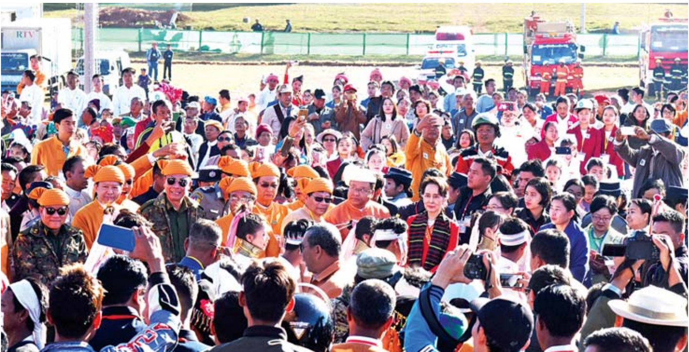
နိုင်ငံတော်၏အတိုင်ပင်ခံပုဂ္ဂိုလ် ဒေါ်အောင်ဆန်းစုကြည် (၇၂)နှစ်မြောက် ရှမ်းပြည်နယ်နေ့ အခမ်းအနားသို့ တက်ရောက်လာသည့် ဒေသခံတိုင်းရင်းသားများအား ရင်းရင်းနှီးနှီး နှုတ်ဆက်စဉ်။

ငြိမ်းချမ်းရေးနဲ့ပတ်သက်ရင် (၂၀)ရာစုပင်လုံ ညီလာခံ ကြီးကို စတင်နိုင်ခဲ့ပါပြီ။ ငြိမ်းချမ်းရေးဆိုတာဟာလည်း အမျိုးသားရင်ကြားစေ့ရေးနဲ့ လက်တွဲပြီးတော့ တစ်ကြိမ် တည်းမှာလုပ်ရမယ့် ကိစ္စဖြစ်ပါတယ်။ တရားဥပဒေစိုးမိုးရေး နဲ့ ပြည်သူလူထုရဲ့ဘဝ စီးပွားတိုးတက်ဖွံ့ဖြိုးရေးဆိုတာဟာ