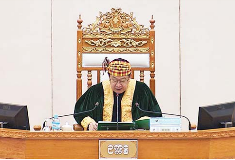
ပြည်သူ့လွှတ်တော်ဥက္ကဋ္ဌ ဦးတီခွန်မြတ်

ကလေးမဲဆန္ဒနယ်မှ ဒေါ်အေးအေးမူ(ခ) ဒေါ်ရှားမီး၏ အောင်ဘာလေသိန်းဆုဌာနမှ သတ်မှတ်ရေးနှုန်းဖြင့် ပြည်သူများလွယ်ကူစွာ ဝယ်ယူကုစားနိုင်ရေးအတွက် မည်သို့ပို့ဆောင်ရွက်ထားသည်နှင့် သတ်မှတ်ရေးနှုန်းထက် ပိုမိုရောင်းချနေသော လုပ်ငန်းရှင်အဆင့်ဆင့်များအား မည်သို့ညှိနှိုင်းစီမံဆောင်ရွက်သွားမည်ကို သိလိုခြင်းနှင့် စပ်လျဉ်း၍ ဒုတိယဝန်ကြီး ဦးမောင်မောင်ဝင်းက ပြည်တွင်းအခွန်များဦးစီးဌာနအနေဖြင့် ထိရောက်စွာကြီးကြပ်ခြင်းဖြင့် ထိရောက်စွာလုပ်ကိုင်မှုများ လိုသလောက်အလွယ်တကူ ဝယ်ယူကုစားနိုင်ရေးနှင့် အောင်ဘာလေ ထိရောင်းချဖြန့်ဖြူးခြင်းလုပ်ငန်းအား စီးပွားရေးလုပ်ငန်းရှင်များက လက်ဝါးကြီးအုပ် ချုပ်ကိုင်မှု မပြုနိုင်စေရေးအတွက် သတ်မှတ်ချက်နှင့်အညီ ကြိုတင်လျှောက်ထား၍ Deposit တင်သွင်းသည့် ထိရောက်စွာလုပ်ကိုင်မှုများအား ဥပဒေနှင့်အညီ စာချုပ်ချုပ်ဆို၍ ရောင်းချခြင်း၊ စာချုပ်ပါ စည်းကမ်းချက်များကို တိကျစွာ လိုက်နာမှုမရှိသော ထိရောက်စွာလျှောက်ထားသူများနှင့် ရေးနှုန်းတိုးမြှင့် ရောင်းချသည့် လက်ကားဆိုင်ကြီးများ၊ လက်ခွဲ၊ လက်လီအရောင်း