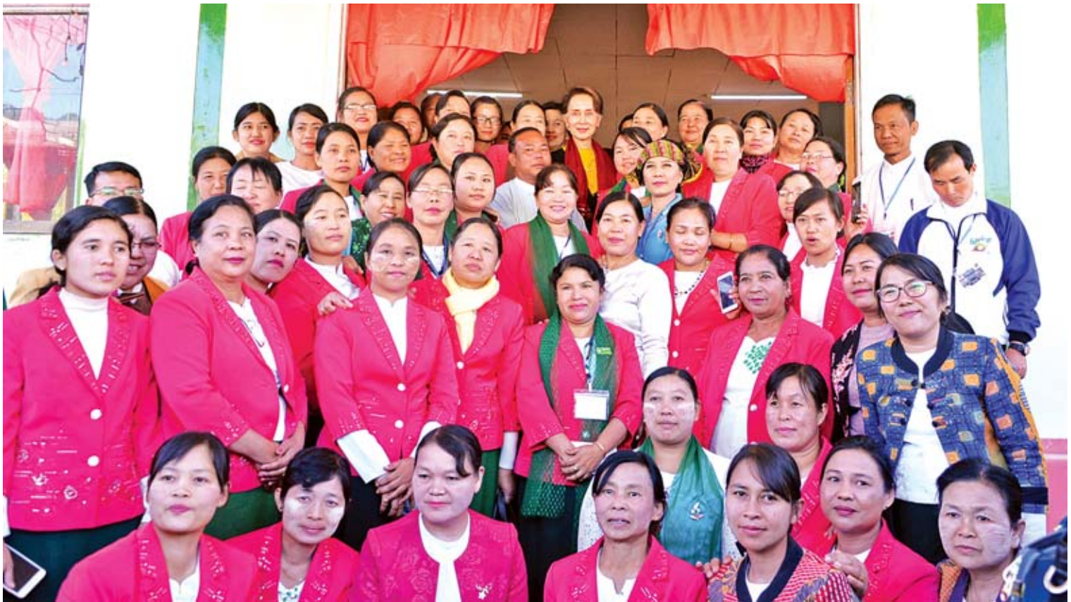
နိုင်ငံတော်၏အတိုင်ပင်ခံပုဂ္ဂိုလ် ဒေါ်အောင်ဆန်းစုကြည် အထက(၂)တောင်ကြီး၌ ဆရာ ဆရာမများ၊ ကျောင်းသားမိဘများနှင့်အတူ စုပေါင်းမှတ်တမ်းတင်ဓာတ်ပုံရိုက်စဉ်။

မိမိရောက်ရှိခဲ့သည့် ၂၀၁၇ ခုနှစ် ဩဂုတ်လ လောက်ကအခြေအနေနှင့် ယခုအခြေအနေ သည် များစွာပြောင်းလဲသွားပါကြောင်း၊ ပြောင်းလဲသွားသည်မှာလည်း အားရစရာ ကောင်းပါကြောင်း၊ ဖွံ့ဖြိုးတိုးတက်ရာတွင် မှန်မှန်ကန်ကန်ပုံစံနှင့် ဖွံ့ဖြိုးတိုးတက်ရန် လိုသည်ဆိုသည်ကို ကုန်သည်များနှင့် စက်မှု လက်မှုလုပ်ငန်းရှင်များကို အထူးပြောရန် လိုအပ်မည်ဟု မထင်ပါကြောင်း၊ အသင်း အတွက် ယခုကဲ့သို့ နေရာတစ်ခုဖွင့်ပေးခြင်း သည် မိမိတို့၏ စီးပွားရေးတိုးတက်ဖွံ့ဖြိုးမှုကို အားပေးသည့်အနေဖြင့် လုပ်ဆောင်ပေးသည် ဆိုသည်ကို မိမိတို့ သဘောပေါက်ပါကြောင်း၊ ထိုကဲ့သို့ အားပေးသည့်အတိုင်းပင်ဖြစ်မြောက် မည်ဟုလည်း ယုံကြည်ပါကြောင်း။