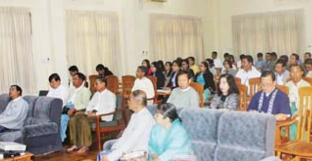
၁၁ ခု၊ ပုဂ္ဂလိက တိုင်းရင်းဆေးဝါးထုတ်လုပ်ရေး ၄၃ ခုမှ လုပ်ငန်းရှင်များနှင့် တိုင်းရင်းဆေးပညာဦးစီးဌာန၏ တိုင်းရင်းဆေးဝါးထုတ်လုပ်ရေးစက်ရုံ (ရန်ကုန်နှင့်မန္တလေး)နှင့် တိုင်းရင်းဆေးတက္ကသိုလ်မှ ဝန်ထမ်းများ စုစုပေါင်းသင်တန်းသား ၅၉ ဦး တက်ရောက်ကြသည်။ သင်တန်းကာလမှာ ဇေဇော်ဝါရီ ၇ ရက်မှ ၁၂ ရက်အထိ ခြောက်ရက်ကြာမြင့်မည်ဖြစ်ကြောင်း သိရသည်။