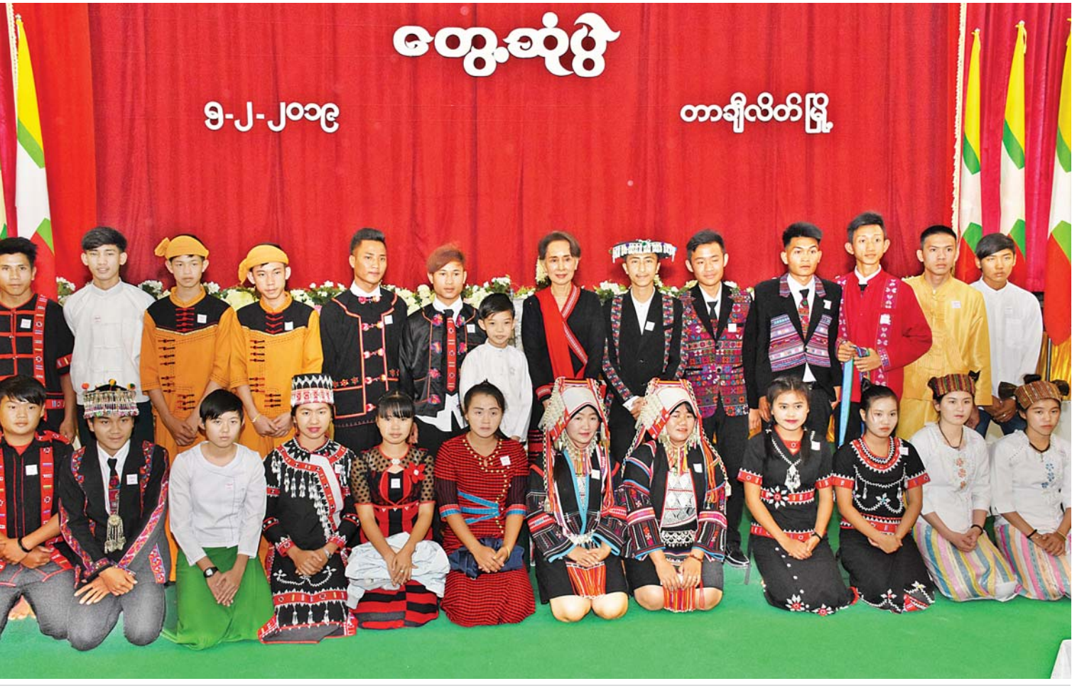
နိုင်ငံတော်၏အတိုင်ပင်ခံပုဂ္ဂိုလ် ဒေါ်အောင်ဆန်းစုကြည် တာချီလိတ်မြို့၊ ဒေသပညာသင်တန်းနှင့် တွေ့ဆုံပွဲတွင် တိုင်းရင်းသားရိုးရာယဉ်ကျေးမှုအစွဲများနှင့် စုပေါင်းမှတ်တမ်းတင်ဓာတ်ပုံရိုက်စဉ်။

အိန္ဒိယနိုင်ငံက လွတ်လပ်ရေးခေါင်းဆောင်ကြီးက ပြောပါတယ်။ ဘဏ်ထဲမှာ ထားတဲ့ပိုက်ဆံက ကိုယ့်ပိုက်ဆံမဟုတ်ဘူး။ သုံးပြီးတဲ့ပိုက်ဆံကသာ ကိုယ့်ပိုက်ဆံလို့ပြောတယ်။ ပြောချင်တာက ဘဏ်ထဲမှာထားတဲ့ ပိုက်ဆံကကိုယ့်သုံးနိုင်တဲ့ အခြေအနေရောက်သလား။ မရောက်ဘူးလားဆိုတာ ဘယ်သူမှ ခန့်မှန်းလို့မရဘူး။ ကိုယ့်သုံး နိုင်တဲ့အခြေအနေရောက်ချင်မှရောက်မယ်။ ဒီခေါင်းဆောင်က သူဌေးကြီးပါ။ သူဌေးကြီးက မျိုးရိုးကြောင့် ချမ်းသာတာမဟုတ်ပါဘူး။ သူ့ရဲ့အစွမ်းအစကြောင့် သူ့ကိုယ့်သူချမ်းသာအောင်လုပ်ခဲ့တဲ့ ရှေ့နေကြီးတစ်ယောက်ပါ။ ဒီလောက်ချမ်းသာအောင်လုပ်ခဲ့ပေမယ့် ဒီပိုက်ဆံတွေကို မသုံးရက်မစွဲရက်နဲ့ ဘဏ်ထဲမှာထည့်ထားရင် သူတမလွန်ဘဝကူးသွားတဲ့ အခါကျတော့ ဘယ်သူလက်ထဲရောက်မယ်ဆိုတာ သေသေချာချာပြောလို့ရ မှာမဟုတ်ဘူး။ သူ့သားသမီးလက်ထဲရောက်ချင်ရောက်မယ်။ သားသမီးလက်ထဲကနေပြီးတော့ တခြားလက်ထဲရောက်ချင်ရောက်သွားမယ်။ အဲဒီတော့ သူကပြောတယ်။ သုံးပြီးသားပိုက်ဆံဟာ ကိုယ်တကယ်ပိုင်တဲ့ပိုက်ဆံပါ။ ကျွန်မပြော