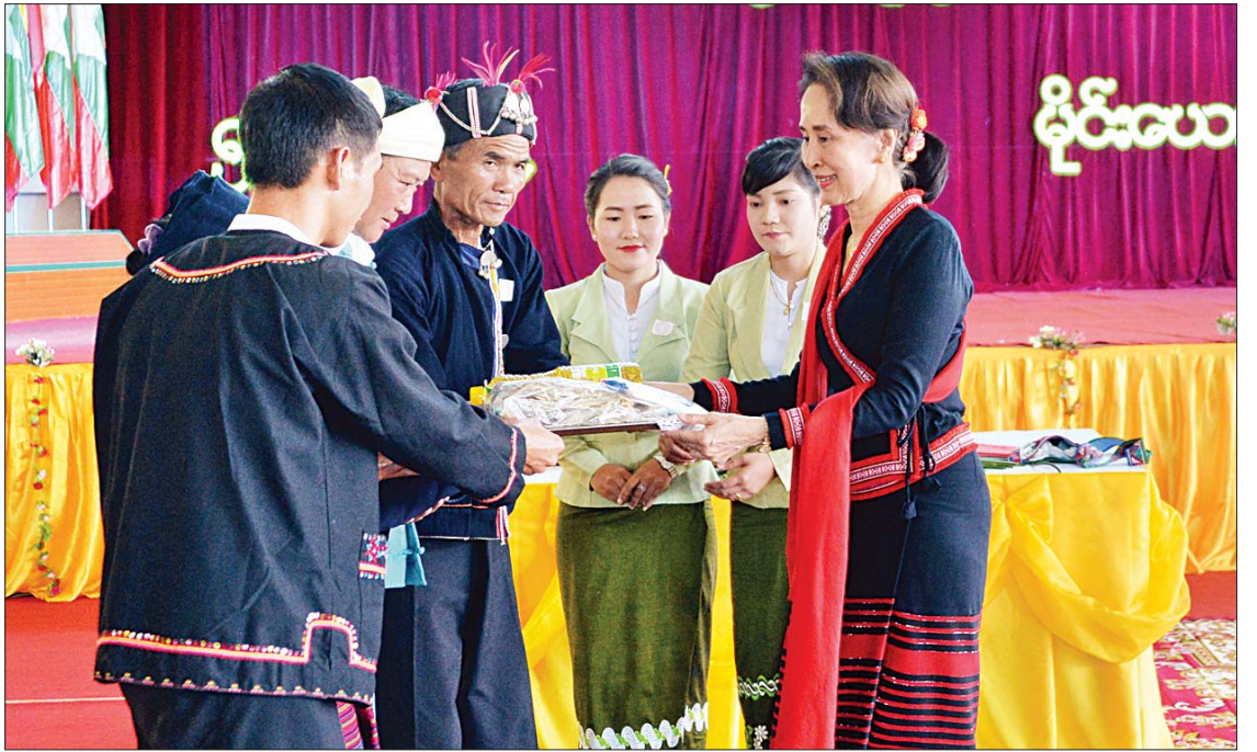
နိုင်ငံတော်၏အတိုင်ပင်ခံပုဂ္ဂိုလ် ဒေါ်အောင်ဆန်းစုကြည် မိုင်းယောင်းမြို့ဒေသခံပြည်သူများအတွက် စားနပ်ရိက္ခာပစ္စည်းများ ထောက်ပံ့ပေးအပ်စဉ်။

အဲဒီဟာတွေအပေါ်မှာ အခြေခံပြီးတော့ ဝန်ထမ်းတွေအနေနဲ့ မေးခွန်းမေးချင်တယ် ဆိုရင်တော့ ဆင်ခြင်စရာတွေရှိတယ်ဆိုတာ သတိပေးပါရစေ။ ဒါကိုလည်း ပြည်သူ့ ပြည်သားတွေက နားလည်မယ်လို့ထင်ပါတယ်။