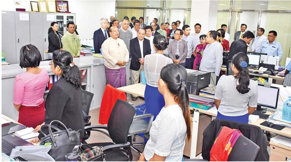
ပြည်ထောင်စုဝန်ကြီး ဦးသောင်းထွန်းနှင့်အဖွဲ့ဝင်များ သီလဝါအထူးစီးပွားရေးဇုန် စီမံခန့်ခွဲမှုကော်မတီရုံးရှိ ဝန်ထမ်းများအား တွေ့ဆုံမှာကြားစဉ်။

ထို့နောက် ပြည်ထောင်စုဝန်ကြီး ဦးသောင်းထွန်းက မြန်မာနိုင်ငံရင်းနှီးမြှုပ်နှံမှုကော်မရှင်သည် ပြည်တွင်း ပြည်ပမှ ရင်းနှီးမြှုပ်နှံမှုပိုမိုရရှိစေရေးအတွက် ကြိုးပမ်း ဆောင်ရွက်လျက်ရှိကြောင်း၊ သီလဝါအထူးစီးပွားရေးဇုန်ရှိ One Stop Service Center (OSSC) သည် အရည်အသွေးပြည့်ဝသည့် ဝန်ဆောင်မှုများပေးနိုင်ပြီး ရင်းနှီးမြှုပ်နှံသူများ၏ ယုံကြည်မှုကိုရရှိအောင် ဆောင်ရွက် နိုင်သည်ကို တွေ့ရှိရပါကြောင်း၊ သီလဝါအထူးစီးပွားရေးဇုန်