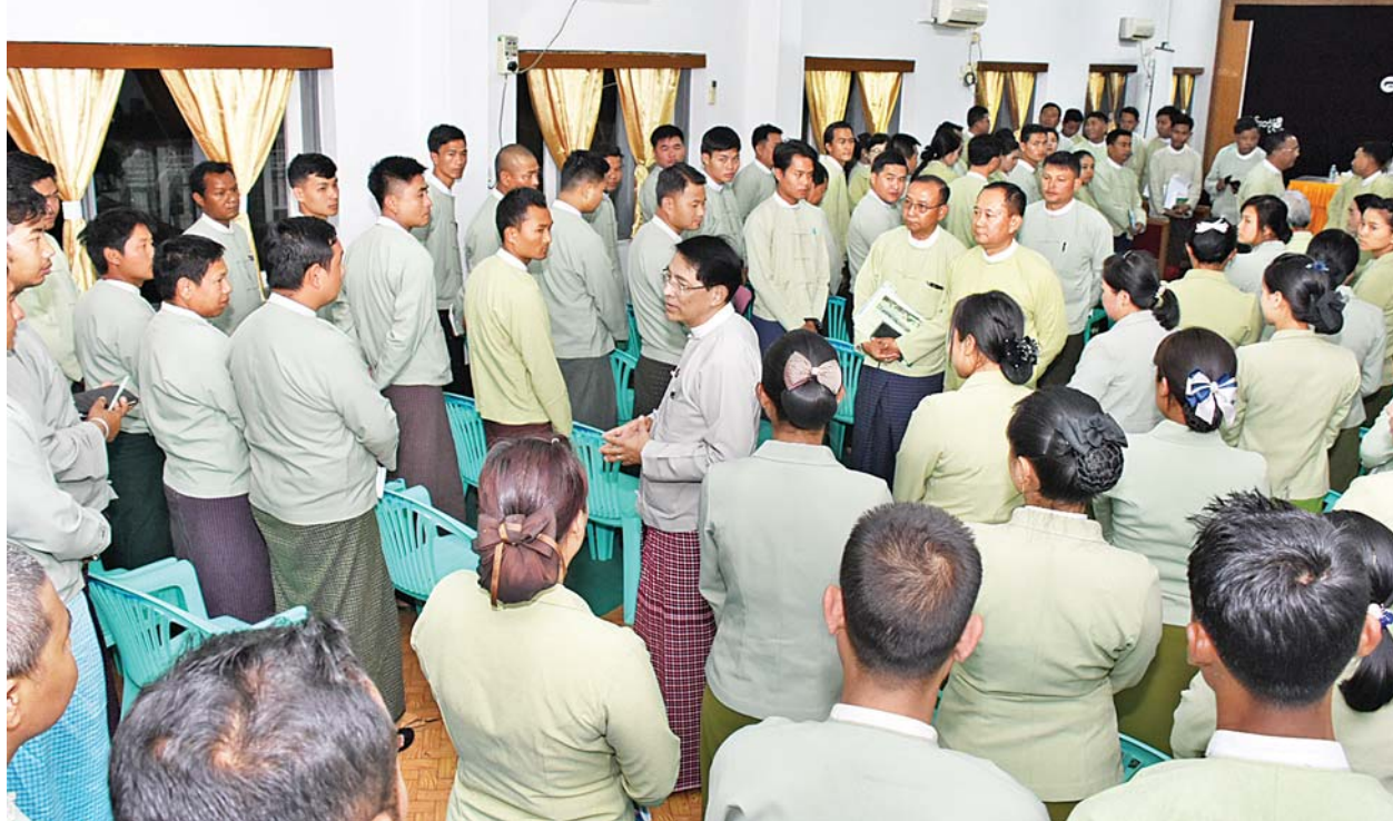
ပြည်ထောင်စုဝန်ကြီး ဦးမင်းသူ ရှမ်းပြည်နယ်(အရှေ့ပိုင်း)ရှိ ခရိုင်၊ မြို့နယ်အထွေထွေအုပ်ချုပ်ရေးဦးစီးဌာန ဝန်ထမ်းများနှင့် တွေ့ဆုံစဉ်။

ကျိုင်းတုံ ဇူလိုင်လ ၅ ရက်နေ့ကျင်းပသည့် ပြည်ထောင်စုအစိုးရအဖွဲ့ရုံးဝန်ကြီးဌာန ပြည်ထောင်စုဝန်ကြီး ဦးမင်းသူသည် ရှမ်းပြည်နယ် (အရှေ့ပိုင်း)ရှိ ခရိုင်၊ မြို့နယ် အထွေထွေအုပ်ချုပ်ရေးဦးစီးဌာန ဝန်ထမ်းများအား ယနေ့ညပိုင်းတွင် ရှမ်းပြည်နယ် ကျိုင်းတုံမြို့ရှိ ပြည်နယ်ဒုတိယအထွေထွေအုပ်ချုပ်ရေးဦးစီးဌာနရုံး အစည်းအဝေးခန်းမ၌ တွေ့ဆုံသည်။ စာမျက်နှာ ၇ ကော်လံ ၁ သို့