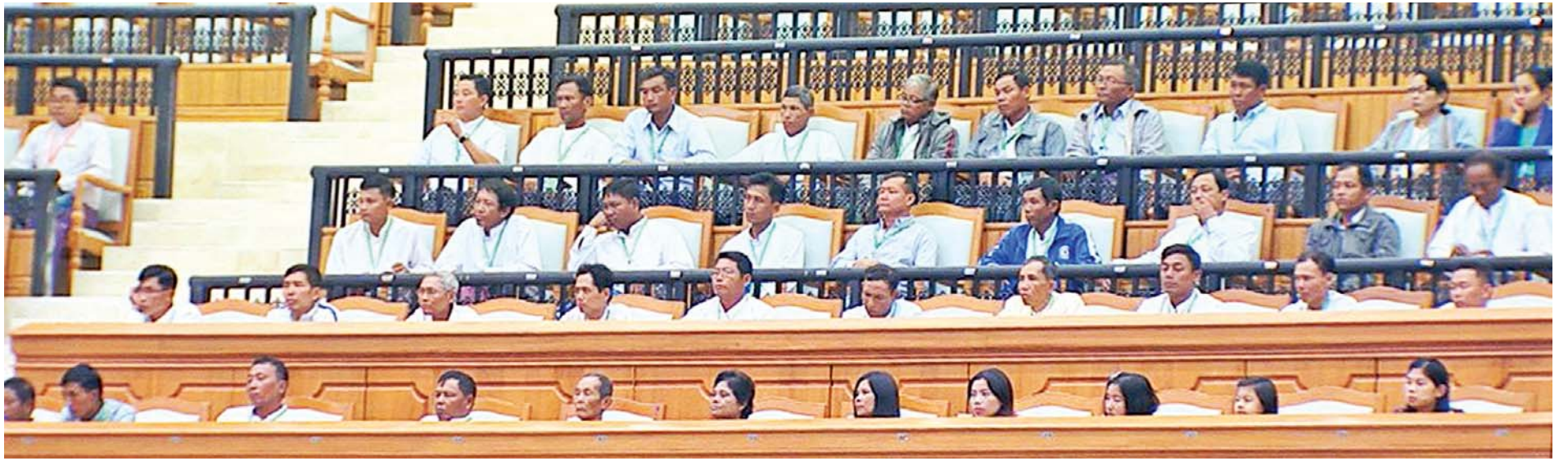
ဒုတိယအကြိမ် ပြည်ထောင်စုလွှတ်တော် (၁၁)ကြိမ်မြောက် ပုံမှန်အစည်းအဝေး ပဋိပဒေသို့ လာရောက်လေ့လာသူများကို တွေ့ရစဉ်။