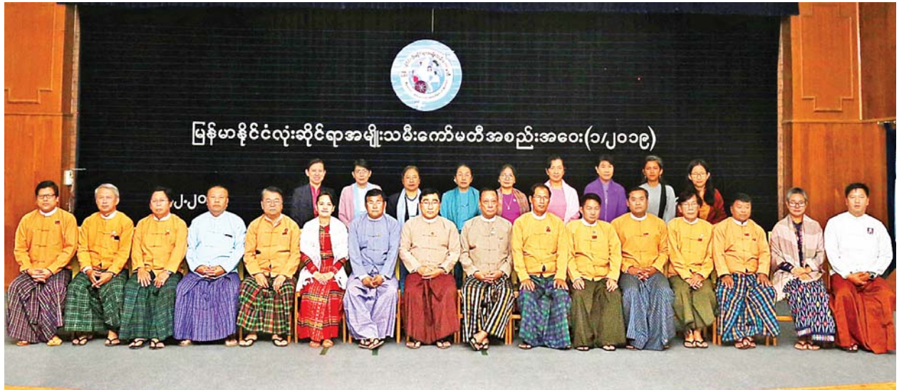
မြန်မာနိုင်ငံလုံးဆိုင်ရာအမျိုးသမီးကော်မတီအစည်းအဝေး(၁/၂၀၁၉)

ထို့အပြင် အမျိုးသမီးများဖွံ့ဖြိုးတိုးတက်ရေးဆိုင်ရာအမျိုးသားအဆင့် မဟာဗျူဟာစီမံကိန်း(National Strategic Plan for Advancement of Women - NSPAW)ကို ရေးဆွဲထားပြီးဖြစ်ရာ စဉ်ဆက်မပြတ်ဖွံ့ဖြိုးမှု