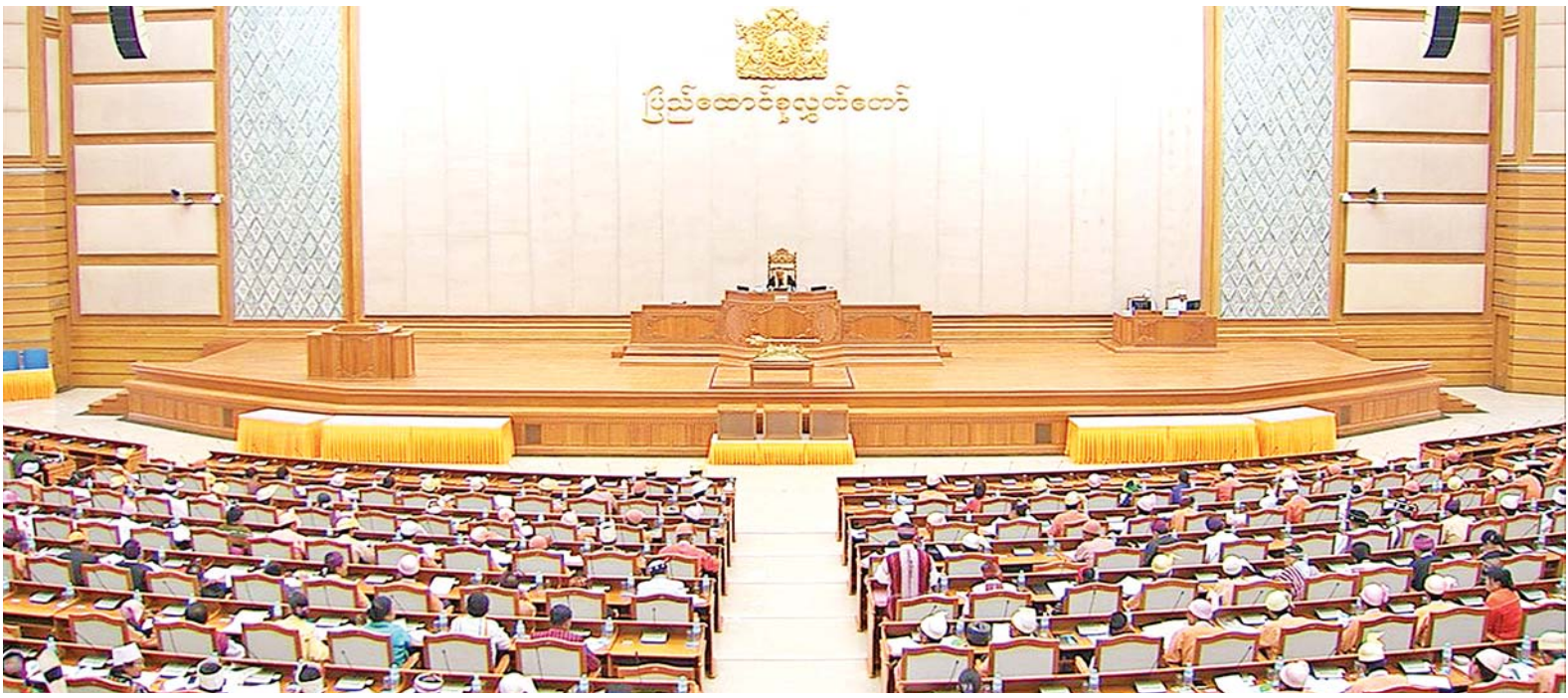
ဒုတိယအကြိမ် ပြည်ထောင်စုလွှတ်တော် (၁၁)ကြိမ်မြောက် ပုံမှန်အစည်းအဝေး ပဋိပက္ခ ကျင်းပစဉ်။

နေပြည်တော် ဇူလိုင်လ ၅ ရက်နေ့ကျင်းပသည့် ဒုတိယအကြိမ် ပြည်ထောင်စုလွှတ်တော် (၁၁) ကြိမ်မြောက် ပုံမှန်အစည်းအဝေး ပဋိပက္ခတွင် ၂၀၀၈ ခုနှစ် ဖွဲ့စည်းပုံ အခြေခံဥပဒေပြင်ဆင်ရေး ပူးပေါင်းကော်မတီတစ်ရပ်ကို ဖွဲ့စည်းရန် အဆိုကို ပြည်ထောင်စုလွှတ်တော် ကိုယ်စားလှယ် (၃၀) ဦးတို့က ဆွေးနွေးခဲ့ကြသည်။ လျော်ကန်သည့် ကိစ္စရပ်ဖြစ် အစည်းအဝေးတွင် မကွေးတိုင်း ဒေသကြီး မဲဆန္ဒနယ် အမှတ်(၄)မှ ဦးအောင်ကြည်ညွန့် တင်သွင်းသည့် “ပြည်ထောင်စုသမ္မတမြန်မာနိုင်ငံတော် ဖွဲ့စည်းပုံအခြေခံဥပဒေ (၂၀၀၈ ခုနှစ်) ပြင်ဆင်ရေးလုပ်ငန်းများကို ဆောလျင်စွာ ဆောင်ရွက်နိုင်ရေးအတွက် ဖွဲ့စည်းပုံ အခြေခံဥပဒေ ပြင်ဆင်ရေးပူးပေါင်းကော်မတီတစ်ရပ်ကို သင့်လျော်သည့် စာမျက်နှာ ၈ ကော်လံ ၁ သို့