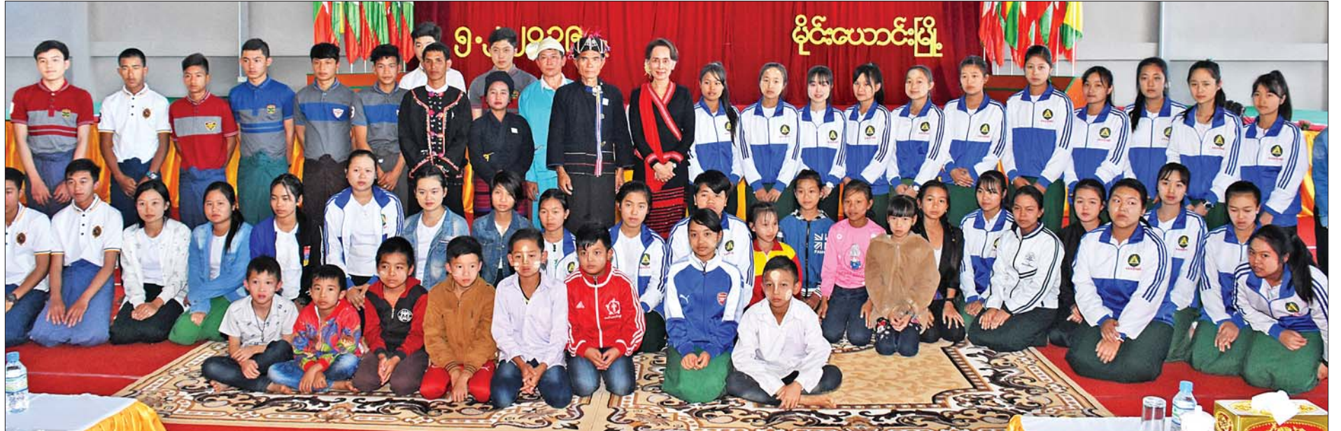
နိုင်ငံတော်၏အတိုင်ပင်ခံပုဂ္ဂိုလ် ဒေါ်အောင်ဆန်းစုကြည် မိုင်းယောင်းမြို့ဒေသခံပြည်သူများနှင့်တွေ့ဆုံပွဲတွင် တိုင်းရင်းသားရိုးရာယဉ်ကျေးမှုအဖွဲ့များ၊ ကျောင်းသား ကျောင်းသူများနှင့် စုပေါင်းမှတ်တမ်းတင်ဓာတ်ပုံရိုက်စဉ်။

ဒုတိယတင်ပြလာတာက တာချီလိတ်မြို့ မြို့ရှောင်လမ်းဖောက်လုပ်ရာတွင် လမ်း နယ်နိမိတ်အတွင်းပါဝင်သွားသည့် နေအိမ် အဆောက်အအုံပိုင်ရှင်များ၊ မြေကွက်အစားထိုး