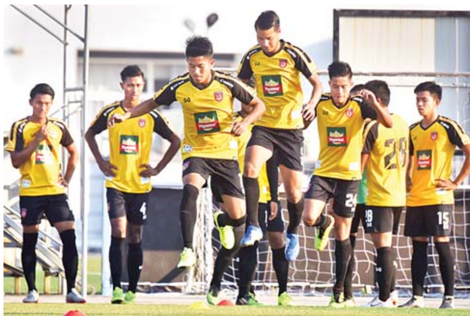
မြန်မာ ယူ-၂၂ အသင်း လေ့ကျင့်နေစဉ်။