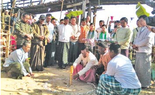
အင်းတော် ဖေဖော်ဝါရီ ၄ စစ်ကိုင်းတိုင်းဒေသကြီး အင်းတော်မြို့နယ် ပင်သချေကျေးရွာအနီး မဲဇာချောင်းကူး ကွန်ကရစ် တံတား ကိုယ့်အားကိုယ်ကို တည်ဆောက်ရေး အတွက် ပန္နက်တင် အခမ်းအနားကို ဇန်နဝါရီ ၃၁ ရက် နံနက် ၈ နာရီခွဲက ပင်သချေကျေးရွာအနီး လူကူးတံတားဟောင်း နေရာ၌ ကျင်းပသည်။ အဆိုပါ ကွန်ကရစ်တံတားသည် အရှည် ပေ ၅၄၀၊ အကျယ် ၁၇ ပေရှိပြီး ကျပ်သိန်း ၁၀၀၀ ကျော်ကုန်ကျမည်ဖြစ်ကြောင်း သိရသည်။ လူအောင်(ကသာ)