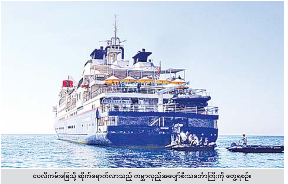
ငပလီကမ်းခြေသို့ ဆိုက်ရောက်လာသည့် ကမ္ဘာလှည့်အပျော်စီးသင်္ဘောကြီးကို တွေ့ရစဉ်။

သံတွဲ ဖေဖော်ဝါရီ ၄ ဟိုတယ်နှင့်ခရီးသွားလာရေးဝန်ကြီးဌာန၏ကြီးကြပ်မှု၊ Destination Asia Co.,Ltd. စီစဉ်မှုဖြင့် ကမ္ဘာလှည့်ခရီးသွားဧည့်သည် ၆၁ ဦး လိုက်ပါလာသည့် MS Silver Discoverer ကမ္ဘာလှည့် အပျော်စီး သင်္ဘောသည် ဖေဖော်ဝါရီ ၁ ရက် နံနက် ၁၁ နာရီတွင် ငပလီကမ်းခြေသို့ ရောက်ရှိခဲ့ပြီး ငပလီကမ်းခြေ သံတွဲမြို့မဈေးကြီး သံတွဲမြို့ပေါ်ရှိ ဘုရားများသို့သွားရောက်လေ့လာလည်ပတ်ခဲ့ကြကာ ငပလီကမ်းခြေမှ ရန်ကုန်မြို့သို့ ဆက်လက်ထွက်ခွာသည်။ ထပ်မံဝင်ရောက်ရန်ရှိ အဆိုပါကမ္ဘာလှည့်အပျော်စီးသင်္ဘောကြီးတွင် ဩစတြေးလျ နိုင်ငံသား နှစ်ဦး၊ ကနေဒါနိုင်ငံသား နှစ်ဦး၊ ပြင်သစ်နိုင်ငံသား တစ်ဦး၊ နယ်သာလန်နိုင်ငံသား တစ်ဦး၊ မြိတ်နိုင်ငံသား နှစ်ဦးနှင့် အမေရိကန် နိုင်ငံသား ၅၃ ဦး စုစုပေါင်းကမ္ဘာလှည့်ခရီးသည် ၆၁ ဦး လိုက်ပါလာကြပြီး ငပလီကမ်းခြေသို့ ကမ္ဘာလှည့်အပျော်စီးသင်္ဘောကြီးများ ထပ်မံ ဝင်ရောက်ရန်ရှိသေးကြောင်း သိရသည်။ စာမျက်နှာ ၅ ကော်လံ ၅ သို့ 🌐