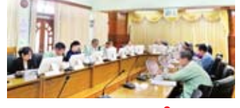
စာမျက်နှာ >> ၅

အလုပ်အကိုင် အခွင့်အလမ်း ပေါင်း ၅၇၀၀ ကျော် ဖန်တီး ပေးနိုင်မည့် လုပ်ငန်းကိုးခုအား မြန်မာနိုင်ငံ ရင်းနှီးမြုပ်နှံမှု ကော်မရှင်မှ ခွင့်ပြု