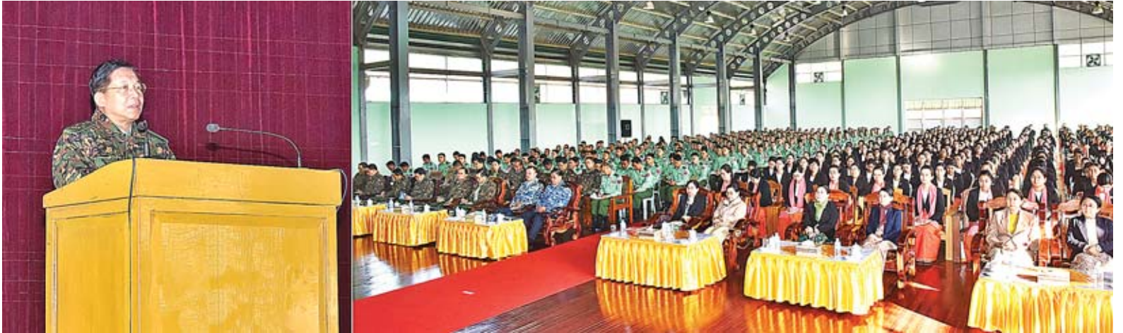
တပ်မတော်ကာကွယ်ရေးဦးစီးချုပ် ဗိုလ်ချုပ်မှူးကြီးမင်းအောင်လှိုင် မိုးကောင်းတပ်နယ်ရှိ အရာရှိ၊ စစ်သည်၊ မိသားစုများအား တွေ့ဆုံအမှာစကားပြောကြားစဉ်။

တပ်မတော်ကာကွယ်ရေးဦးစီးချုပ် ဗိုလ်ချုပ်မှူးကြီးမင်းအောင်လှိုင်သည် ယနေ့နံနက်ပိုင်းနှင့် မွန်းလွဲပိုင်းတို့တွင် မြောက်ပိုင်းတိုင်းစစ်ဌာနချုပ် မိုးကောင်းတပ်နယ်နှင့် မိုးညှင်းတပ်နယ်တို့ရှိ အရာရှိ၊ စစ်သည်၊ မိသားစုများအား သီးခြားစီတွေ့ဆုံအမှာစကားပြောကြားသည်။