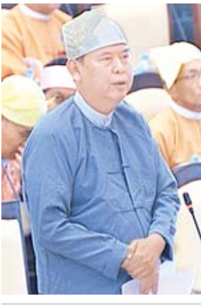
ဒုတိယဝန်ကြီး ဦးဝင်းမော်ထွန်း

မကွေးတိုင်းဒေသကြီး မဲဆန္ဒနယ်အမှတ်(၁)မှ ဦးလှဆန်း၏ မကွေး တိုင်းဒေသကြီး မကွေးမြို့နယ်အတွင်းရှိ အမှတ်(၅)စက်မှုသင်တန်းကျောင်း (မကွေး)တွင် အသက်မွေးဝမ်းကျောင်းအတတ်ပညာ လက်တွေ့သင်ကြား ပြသမှုအတွက် အထောက်အကူပြု မော်တော်ယာဉ်များ အသုံးပြုပြီး စီမံ ဆောင်ရွက်သကဲ့သို့ မြန်မာနိုင်ငံအတွင်းရှိ အစိုးရစက်မှုလက်မှု သိပ္ပံကျောင်း များ၊ အစိုးရနည်းပညာ အထက်တန်းကျောင်းများတွင် အထောက်အကူပြု မော်တော်ယာဉ်များ ဖြည့်ဆည်းဆောင်ရွက်ပေးရန် အစီအစဉ် ရှိ/မရှိ မေးခွန်းနှင့် စပ်လျဉ်း၍ ဒုတိယဝန်ကြီး ဦးဝင်းမော်ထွန်းက လွှတ်တော် ကိုယ်စားလှယ် တင်ပြသကဲ့သို့ သံလျှပ်ကျိုအဆင့် ကားများကို နိုင်ငံတော်သမ္မတ ရုံးသို့ တင်ပြပြီး ရရှိရေးဆောင်ရွက်လျက်ရှိရာ ခွင့်ပြုသည့်အတွက် မကြာမီ တွင် အစိုးရစက်မှုလက်မှုသိပ္ပံ(အင်းစိန်)အတွက် ယာဉ်(၅)စီး၊ အစိုးရစက်မှု လက်မှုသိပ္ပံ(ရွှေပြည်သာ)အတွက် (၅)စီး၊ အစိုးရစက်မှု လက်မှုသိပ္ပံ (မွန်လေး) အတွက် (၅)စီး၊ အစိုးရစက်မှုလက်မှု သိပ္ပံ(ပြင်ဦးလွင်)အတွက် (၅)စီး၊ ဂျပန်- မြန်မာ အောင်ဆန်းသက်မွေးပညာသင်တန်းကျောင်းအတွက် (၅)စီး၊ နည်းပညာမြှင့်တင်ရေးသင်တန်းကျောင်းဌာန ဆရာအတတ်သင်သိပ္ပံအတွက် (၅)စီး စုစုပေါင်းမော်တော်ယာဉ်အစီး (၃၀)ကို ထုတ်ယူပြီး ဖြန့်ဝေပေးရန် စီစဉ်ထားပါကြောင်း၊ ကျန်သော ကျောင်းများအတွက်လည်း ယခုကဲ့သို့