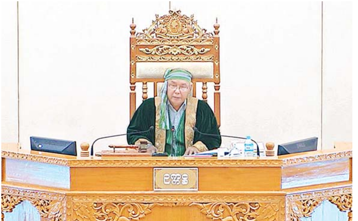
အမျိုးသားလွှတ်တော်ဥက္ကဋ္ဌ မန်းဝင်းခိုင်သန်း။

ရခိုင်ပြည်နယ် မဲဆန္ဒနယ်အမှတ်(၅)မှ ဦးမြင့်နိုင်၏ ရခိုင်ပြည်နယ်၊ ကျောက်တော် မြို့နယ်၊ ဆင်အိုးချိုင်းကျေးရွာ စာမျက်နှာ ၃ ကော်လံ ၁ သို့ *