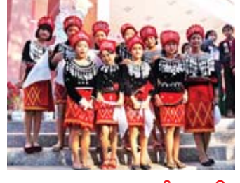
စာမျက်နှာ >> ၆

တိုင်ကြားပေးပို့လာသော မူးယစ်ဆေးဝါးသတင်းများ နှင့်စပ်လျဉ်း၍ ထပ်မံ ဖော်ထုတ်ရရှိမှုများ ထုတ်ပြန်