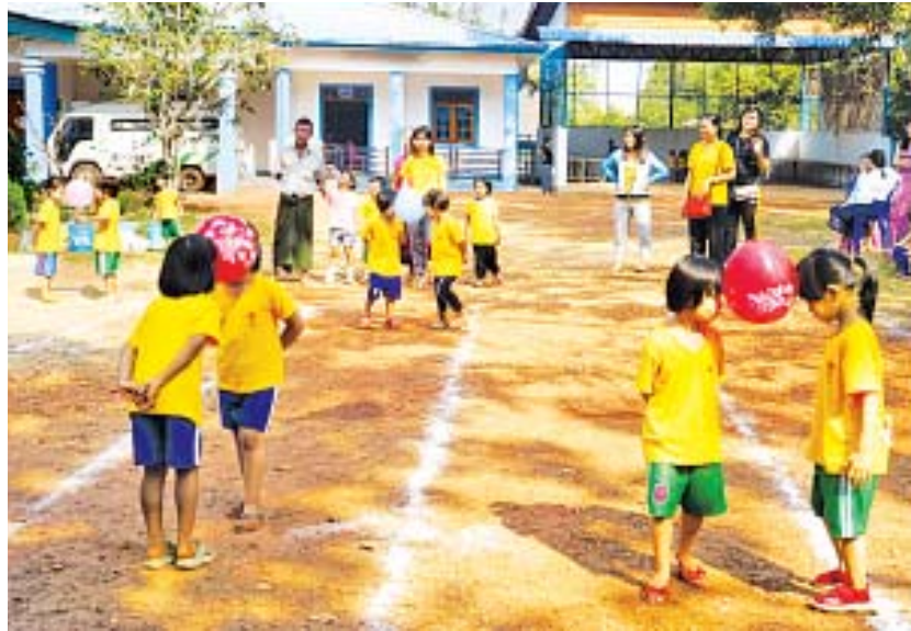
ဘားအံ ဖေဖော်ဝါရီ ၄

ကလေးငယ်များ ကျန်းမာပျော်ရွှင်စွာဖြင့် ကာယ၊ ဉာဏ၊ စာရိတ္တ ဖွံ့ဖြိုးတိုးတက်လာစေရန်နှင့်