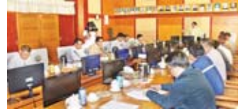
စာမျက်နှာ >> ၄

ဝန်ကြီးဌာနပေါင်းစုံ မြန်မာ့ရိုးရာထမနဲ့ထိုးပြိုင်ပွဲ နှင့် ပျော်ပွဲ ရွှင်ပွဲ စည်ကား သိုက်မြိုက်စွာ ကျင်းပမည်