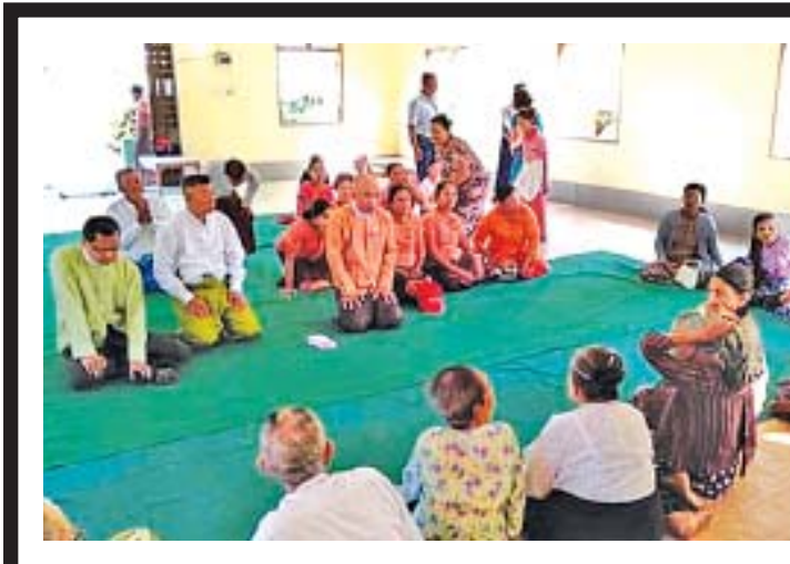
သက်ကြီးဘိုးဘွား ၅၀ အား တစ်ဦးလျှင် ကျပ် ၃၀၀၀၀ စီ ထောက်ပံ့ပေးအပ်ပွဲကို ဖေဖော်ဝါရီ ၃ ရက် နံနက် ၁၀နာရီခွဲက ရွှေပြည်သာမြို့နယ် ထ (၁၆)ရပ်ကွက် သိမ်တော်ကြီး၌ ကျင်းပရာ တိုင်းဒေသကြီးအမှတ်(၁)လွှတ်တော် ကိုယ်စားလှယ် ဦးရန်အောင်မင်း၊ ဒုတိယအုပ်ချုပ်ရေးမှူး၊ ဦးမိုးကျော် အောင်နှင့် တာဝန်ရှိသူများက ထောက်ပံ့ပေးအပ်ခဲ့ကြောင်း သိရ သည်။ သန္တာ(ပြန်/ဆက်)

(ပုံ) ဝင်းမြင့် နိုင်ငံတော်သမ္မတ ပြည်ထောင်စုသမ္မတမြန်မာနိုင်ငံတော်