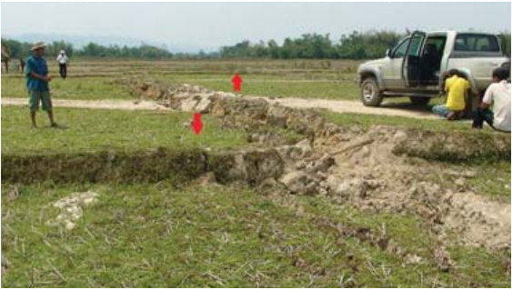
ပုံ (၅) ငလျင်လှုပ်ခြင်းနှင့်အတူဖြစ်သော ပြတ်ရွေ့အံလွှဲမှုများ။ သပိတ်ကျင်းငလျင် (၂၀၁၂) ဖြစ်စဉ်၌ စစ်ကိုင်းပြတ်ရွေ့ အံလွှဲမှု (၁)၊ အိမ်တိုင်းမှာ ပြတ်ရွေ့အပေါ်ခွေဆောက်ထားသောကြောင့် တိုင်းများယိုင်ခွဲသွားကြသည်။ တာလေငလျင်ဖြစ်စဉ်၌ နှမ်းမားပြတ်ရွေ့ အံလွှဲမှု (ယာ)။ နှမ်းမားပြတ်ရွေ့အံလွှဲမှုတွင် ဘေးတိုက်၊ ထက်အောက် နှစ်မျိုးစလုံး တွေ့ရသည်။ တာလေဓာတ်ပုံ (မြန်မာနိုင်ငံငလျင်ကော်မတီ၊ ၂၀၁၁)။