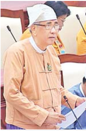
ဒုတိယဝန်ကြီး ဦးကျော်မျိုး

ဥသျှစ်ပင်-သရက်အပိုင်းရှိ ပန်းတောင်းမြို့နယ်အတွင်း ပါဝင်သွားသော ကျေးရွာအုပ်စု ၁၁ အုပ်စုမှ တောင်းသူ ၃၁၆ ဦး၏ သိမ်းဆည်းမြေ ၃၆၁ ဒသမ ၂၃ ဧက အတွက် လျော်ကြေးတန်ဖိုးများကို ပန်းတောင်းမြို့နယ် လယ်ယာမြေ စီမံခန့်ခွဲမှုအဖွဲ့က အဆင့်ဆင့်တင်ပြခဲ့ရာ ပဲခူးတိုင်းဒေသကြီး လယ်ယာမြေစီမံ ခန့်ခွဲမှုအဖွဲ့က ၂၀၁၈ ခုနှစ် ဒီဇင်ဘာ ၂၈ ရက်တွင် ဗဟိုလယ်ယာမြေစီမံခန့်ခွဲ မှုအဖွဲ့သို့ ဆက်လက်တင်ပြထားကြောင်းကို သိရှိရပါကြောင်း၊ ယင်းအဖွဲ့မှ အတည်ပြုပြီးပါက ပဲခူးတိုင်းဒေသကြီး လယ်ယာမြေစီမံခန့်ခွဲမှုအဖွဲ့မှ မြန်မာ့ မီးရထားသို့ ၂၀၁၈ - ၂၀၁၉ ဘဏ္ဍာနှစ်တွင် ဖြည့်စွက်ရန်ပုံငွေတောင်းခံချိန် အထိ အကြောင်းကြားလာပါက ၂၀၁၈-၂၀၁၉ဘဏ္ဍာနှစ် ဖြည့်စွက်ရန်ပုံငွေ တွင် ထည့်သွင်းလျာထားတောင်းခံ၍ ခွင့်ပြုရရှိမှုအပေါ်မူတည်ပြီး လျော်ကြေး ပေးချေခြင်းများ ဆက်လက်ဆောင်ရွက်သွားမည်ဖြစ်ပါကြောင်း ရှင်းလင်း ဖြေကြားသည်။