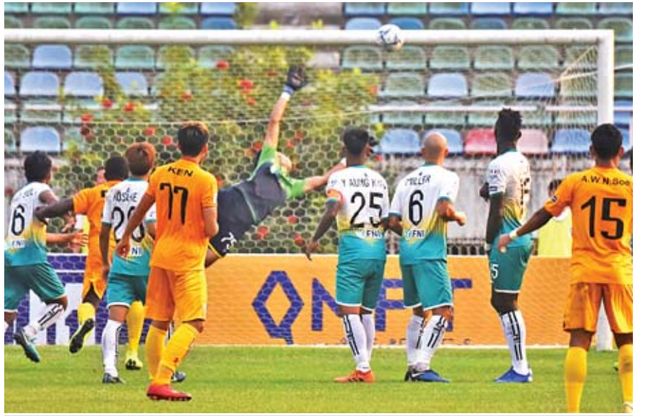
ဇွဲကပင်အသင်းအတွက် ချေပဂိုးကို ပြစ်ဒဏ်ဘောမှတစ်ဆင့် ကင်မ်က သွင်းယူလိုက်စဉ်။