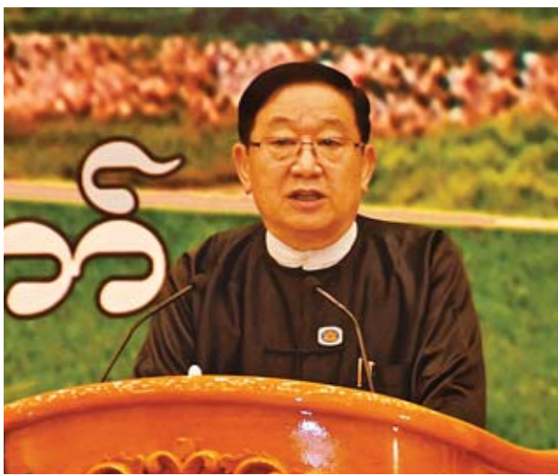
ပြည်သူ့လွှတ်တော်ဥက္ကဋ္ဌ ဦးတီခွန်မြတ် ဒုတိယအကြိမ်လွှတ်တော် များ၏ (၃)နှစ်မြောက် နှစ်ပတ်လည်နေ့အခမ်းအနားတွင် အမှာစကား ပြောကြားစဉ်။

သို့မှသာ နိုင်ငံတော်နှင့် တိုင်းရင်း သား ပြည်သူများ၏ မျှော်လင့်ချက် ဖြစ်သည့် ပြုပြင်ပြောင်းလဲရေး လုပ်ငန်းစဉ်အတွက် ပိုမိုကောင်းမွန် သည့် တာဝန်ကျေပွန်မှုနှင့် ပူးပေါင်း ဆောင်ရွက်မှုတို့ကို ထင်ထင်ရှားရှား ပြသနိုင်သည့် ဥပဒေပြုရေးမဏ္ဍိုင် တစ်ရပ်အဖြစ် ရပ်တည်နိုင်မည်ဖြစ် ပါကြောင်း။