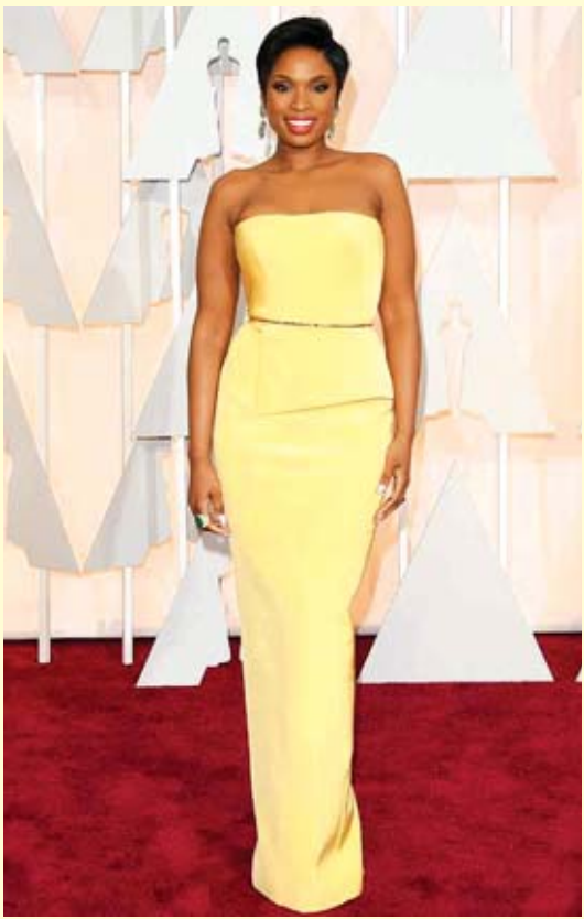
အေးပြည့်-စုစည်းသည်

ဂျနီဇာဟက်ဆန်ကို ပြီးခဲ့တဲ့ ၂၀၀၇ ခုနှစ် အော်စကာဆုပေးပွဲ မှာ နောက်ဆုံးတွေ့ခဲ့ကြတာ ဖြစ်ပါတယ်။ သူဟာ အဲဒီနှစ် ဆုပေးပွဲ မှာ အီဇယ်ပိုက်အဖြစ် ပါဝင်သရုပ်ဆောင်ထားတဲ့ရုပ်ရှင် “Dreamgirls” နဲ့ အကောင်းဆုံးအမျိုးသမီးဇာတ်ပို့ဆုကို သိမ်းပိုက် နိုင်ခဲ့တာ ဖြစ်တယ်လို့လည်း သိရပါတယ်။