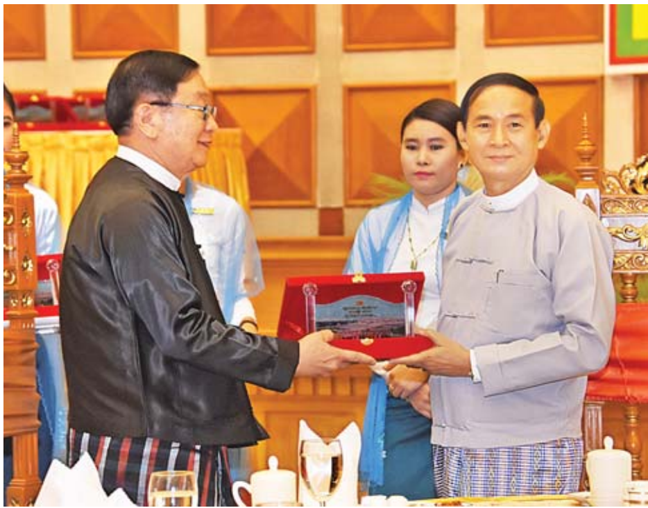
နိုင်ငံတော်သမ္မတ ဦးဝင်းမြင့်ထံ ပြည်သူ့လွှတ်တော်ဥက္ကဋ္ဌ ဦးတီခွန်မြတ်က လွှတ်တော်နှစ်ပတ်လည်နေ့အထိမ်းအမှတ်ပစ္စည်းကို ပေးအပ်စဉ်။