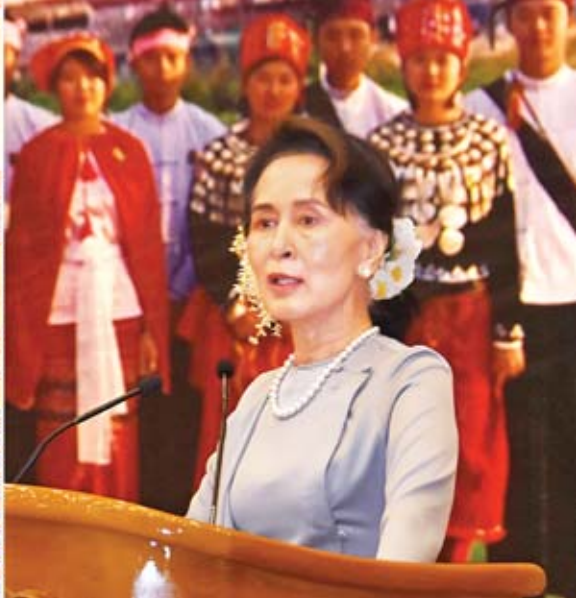
နိုင်ငံတော်၏အတိုင်ပင်ခံပုဂ္ဂိုလ် ဒေါ်အောင်ဆန်းစုကြည် ဒုတိယအကြိမ်လွှတ်တော်များ၏ (၃) နှစ်မြောက် နှစ်ပတ်လည်နေ့အခမ်းအနားတွင် ဂုဏ်ပြုအမှာစကား ပြောကြားစဉ်။

ဒီကနေ့ ဒုတိယအကြိမ်လွှတ်တော် (၃)နှစ်မြောက် နှစ်ပတ်လည်နေ့ အခမ်းအနားမှာ ကျွန်ုပ်တို့ရဲ့ပြည်ထောင်စုလွှတ်တော်ကိုယ်စားလှယ်များ၊ ဝန်ထမ်းများနှင့်အတူ ရှိနေနိုင်တဲ့အတွက် အင်မတန်မှ ဝမ်းသာပါတယ်။ ကျွန်ုပ်တို့မကြာခဏပြောပါတယ်။ “ဒီမိုကရေစီအစ လွှတ်တော်က” လို့။ ဒီနေ့မှာလည်း ကျွန်ုပ်တို့ပြောချင်ပါတယ်။ “လွှတ်တော်အစ ပြည်သူ့က” ပါ။ လွှတ်တော်ဆိုတာ ပြည်သူ့ကြောင့်ပေါ်လာတာပါ။ ဒီမိုကရေစီစနစ် ကြောင့်ပေါ်လာတာပါ။ ဒါကြောင့်မို့ ဒီနေ့မှာ ကျွန်ုပ်တို့ပြောချင်တာက ကျွန်ုပ်တို့ရဲ့လွှတ်တော်ဟာ ဥပဒေပြုမဏ္ဍိုင်တစ်ခုအနေနဲ့သာ မြင်လို့ မလုံလောက်ပါဘူး။ လွှတ်တော်ဟာ ကျွန်ုပ်တို့နိုင်ငံအတွက်၊ ဒီမိုကရေစီ ထွန်းကားဖို့အတွက် ပြုစုပျိုးထောင်ပေးတဲ့ ပျိုးခင်းတစ်ခုလို့ မြင်စေချင်ပါတယ်။