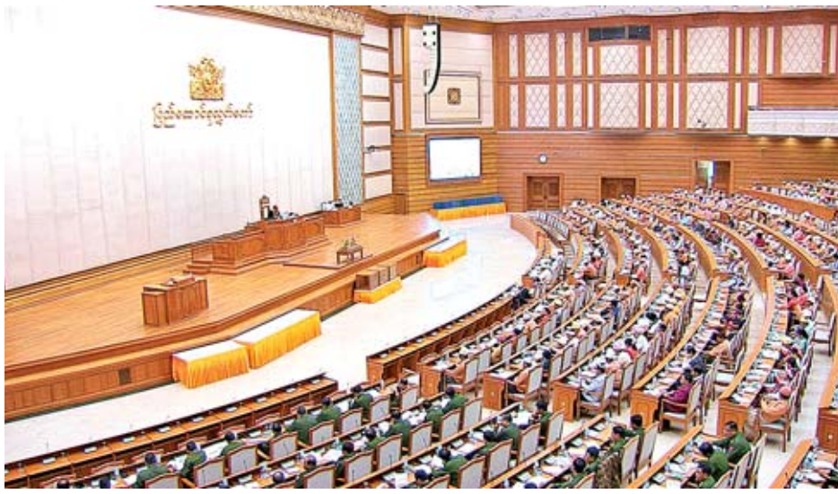
ဒုတိယအကြိမ် ပြည်ထောင်စုလွှတ်တော် (၁၁)ကြိမ်မြောက် ပုံမှန်အစည်းအဝေး စတုတ္ထနေ့ ကျင်းပစဉ်။

အထူးကုန်စည်အဖြစ် သတ်မှတ်ထားသည့် ကုန်စည်များ ထုတ်လုပ်၊ ရောင်းချမှုများအပေါ် အခွန်အမှတ်တံဆိပ် ပြည့်ပြည့်ဝဝတပ်နိုင်စေရန်အတွက် ထုတ်လုပ်ဖြန့်ဖြူး ရောင်းချမှု၊ စားသောက်ဆိုင်နှင့် တည်းခိုခန်းများကို အခါအားလျော်စွာ စစ်ဆေးဖော်ထုတ်မှုများ ထိထိရောက် ရောက်ဆောင်ရွက်သင့်သည်ဟု အကြံပြုလိုပါကြောင်း၊ ဝင်ငွေခွန်ကောက်ခံမှုတွင် အခွန်ထမ်းကြီးများ၊ အလယ် အလတ် အခွန်ထမ်းကြီးများနှင့် ပတ်သက်၍ စာရင်းဇယား အထောက်အထားတင်ပြမှုအပေါ် အခွန်စည်းကြပ်ရာတွင် အခွန်ထမ်းဆောင်မှုမှ လွတ်ကင်းနေမှုရှိ၊ မရှိ MIC မှ မှတ်ပုံတင်ထားသည့် ကုမ္ပဏီလုပ်ငန်းများ စာရင်းနှင့် ချိန်ကိုက်စစ်ဆေးဖော်ထုတ်ရန် လိုအပ်မည်ဖြစ်ပါကြောင်း၊ စာရင်းဇယားမပြုနိုင်သည့် အောက်ခြေမှ အခွန်ထမ်း ဆောင်ရမည့် ပြည်သူအများစုနှင့်ပတ်သက်၍ အခွန် ယဉ်ကျေးမှု တိုးတက်လာရန် အသိပညာပေးခြင်း၊ စည်းရုံး ခြင်းနှင့် အခွန်ကောက်ခံမှုစနစ်ပုံစံ ပြောင်းလဲဆောင်ရွက် သင့်လျှင် ပြောင်းလဲဆောင်ရွက်ရန် အကြံပြုလိုပါကြောင်း ဆွေးနွေးသည်။