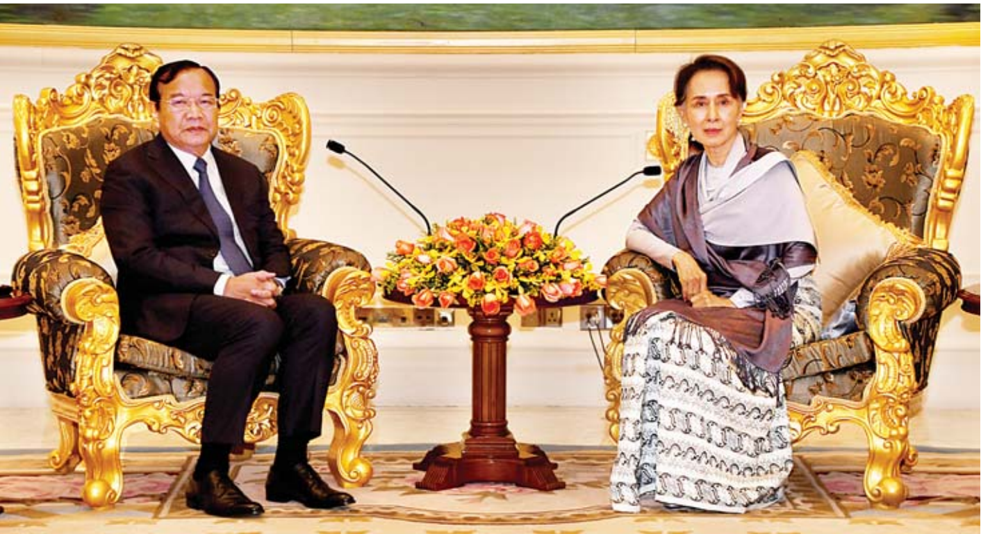
နိုင်ငံတော်၏အတိုင်ပင်ခံပုဂ္ဂိုလ် ဒေါ်အောင်ဆန်းစုကြည် ကမ္ဘောဒီးယားနိုင်ငံ ဒုတိယဝန်ကြီးချုပ်၊ နိုင်ငံခြားရေးနှင့် အပြည်ပြည်ဆိုင်ရာ ပူးပေါင်းဆောင်ရွက်ရေးဝန်ကြီး မစ္စတာပရတ်ဆုတ်ခွန်းအား လက်ခံတွေ့ဆုံစဉ်။

နေပြည်တော် ၁၅ ဇူလိုင် ၂၀၁၉ နိုင်ငံတော်၏အတိုင်ပင်ခံပုဂ္ဂိုလ် ဒေါ်အောင်ဆန်းစုကြည် သည် ဒုတိယအကြိမ်မြောက် မြန်မာ-ကမ္ဘောဒီးယား နှစ်နိုင်ငံ ပူးပေါင်းဆောင်ရွက်ရေးဆိုင်ရာ ပူးတွဲကော်မရှင် အစည်းအဝေးတက်ရောက်ရန် မြန်မာနိုင်ငံသို့ ရောက်ရှိ နေသော ကမ္ဘောဒီးယားနိုင်ငံ ဒုတိယဝန်ကြီးချုပ်၊ နိုင်ငံခြားရေးနှင့် အပြည်ပြည်ဆိုင်ရာ ပူးပေါင်းဆောင်ရွက် ရေး ဝန်ကြီးဌာန ဝန်ကြီး မစ္စတာပရတ်ဆုတ်ခွန်းအား ယနေ့ ညနေ ၃ နာရီတွင် နိုင်ငံတော်သမ္မတအိမ်တော်၌ လက်ခံတွေ့ဆုံသည်။