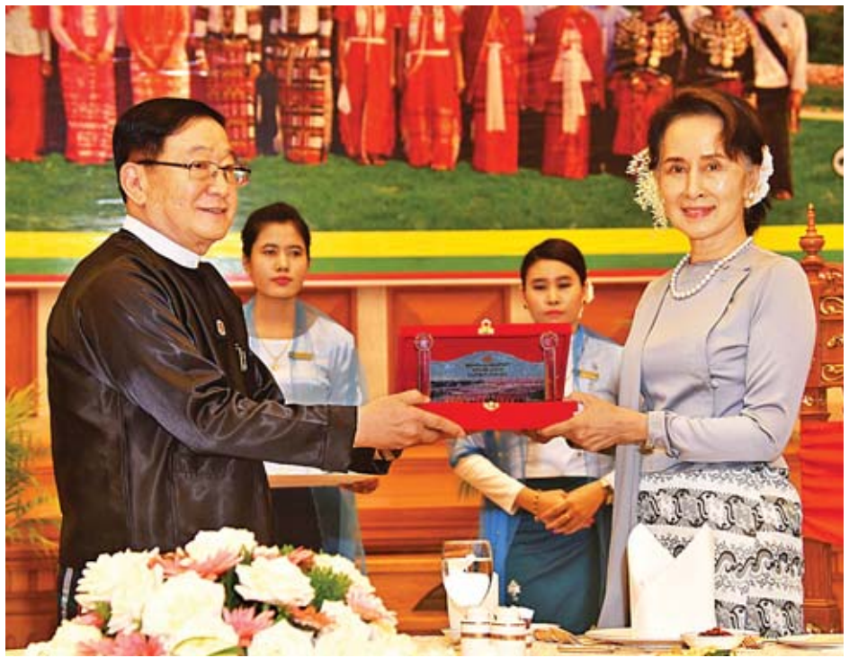
နိုင်ငံတော်၏အတိုင်ပင်ခံပုဂ္ဂိုလ် ဒေါ်အောင်ဆန်းစုကြည်ထံ ပြည်သူ့လွှတ်တော်ဥက္ကဋ္ဌ ဦးတီခွန်မြတ်က လွှတ်တော်နှစ်ပတ်လည်နေ့အထိမ်းအမှတ်ပစ္စည်းကို ပေးအပ်စဉ်။