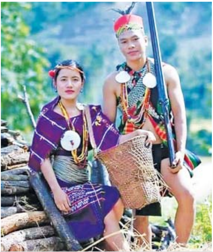
မင်းတပ်ဒေသရှိ (ချိုး(ခ)မွမ်း)လူမျိုး။

၁၈၅၅ ခုနှစ် နိုဝင်ဘာ ၁ ရက်တွင် မန္တလေးသို့ ချီတက်ကာ မန္တလေးရတနာပုံ နေပြည်တော်ကို နိုဝင်ဘာ ၂၉ ရက်တွင် သိမ်းပိုက်လိုက်ကြသည်။ ၁၈၆၆ ခုနှစ် ဧပြီ ၁ ရက်တွင် အင်္ဂလိပ်ဘုရင်မကြီးအတွက် နှစ်သစ်လက်ဆောင်အဖြစ် အင်္ဂလိပ်နယ်ချဲ့ ဘုရင်ခံချုပ် လော့ဒ်ဒါလဟိုဇီအား မြန်မာနိုင်ငံ ကိုဆက်သခဲ့သောကြောင့် မြန်မာ့ လွတ်လပ်ရေးဆုံးရှုံးခဲ့ရလေသည်။ မြန်မာ့လွတ်လပ်ရေး ဆုံးရှုံးစေရသည့် အင်္ဂလိပ်-မြန်မာစစ်ပွဲတိုင်းနှင့် တတိယစစ် ပြီးဆုံးသည့် နောက်ပိုင်းအထိပင် ကချင်၊ ကယား၊ ကရင်၊ ချင်း၊ မွန်၊ ဗမာ၊ ရခိုင်၊ ရှမ်း စသည်တို့ဖြင့်ခွဲစည်းထားသော တိုင်းရင်းသား ပေါင်းစုံတို့၏ မျိုးချစ်သူရဲကောင်းများသည် သမိုင်းပြောင်မြောက်စွာ ရဲစွမ်းပြု၍ နယ်ချဲ့များ ကို ခုခံတိုက်ခိုက်ခဲ့ကြပေသည်။ အထူးကဏ္ဍ [၀] သို့ >>