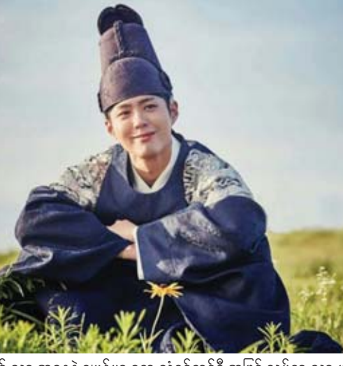
မင်းသားအနေနဲ့ ဂျပန်မှာ တေးသံရှင်တစ်ဦးအဖြစ် လှုပ်ရှားသွားမှာ ဖြစ်ကြောင်းနဲ့ တေးသီချင်းသစ်တွေ ထုတ်လွှင့်သွားမှာဖြစ်ကြောင်း ကို အတည်ပြုပေးခဲ့တယ်လို့လည်း သိရပါတယ်။

ပါးဘိုဂန်းရဲ့ တေးသီချင်းတွေကိုတော့ လာမယ့် မတ် ၂၀ ရက်မှာ ဂျပန်မှာ စတင် ထုတ်လွှင့်ပေးသွားဖို့ရာ စီစဉ်ထားတာဖြစ်တယ်လို့ သိရပါတယ်။ ပါးဘိုဂန်းရဲ့ တေးသီချင်းနှစ်ပုဒ်ကို ထုတ်လွှင့်သွားမှာဖြစ်ပြီး အဲဒီအထဲကမှ “Bloomin” တေးသီချင်းကတော့ ပရိသတ် တွေကို ရည်ရွယ်ရေးသားထားတဲ့ တေးသီချင်း တစ်ပုဒ်ဖြစ်တယ်လို့ သိရပါတယ်။ ပါးဘိုဂန်းရဲ့ ဖျော်ဖြေရေးအေဂျင်စီကလည်း