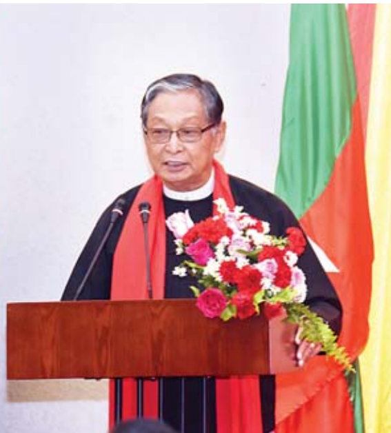
ပြည်ထောင်စုဝန်ကြီး ဦးကျော်တင်ဆွေ တရုတ်ပြည်သူ့သမ္မတနိုင်ငံ၏ တရုတ်နှစ်သစ်ကူးပွဲတော် အခမ်းအနားတွင် အမှာစကားပြောကြားစဉ်။

ရန်ကုန် ဇေဇော်ဝါရီ ၁ တရုတ်ပြည်သူ့သမ္မတနိုင်ငံ၏ တရုတ်နှစ်သစ်ကူးပွဲတော် အခမ်းအနားကို ယနေ့ ညနေ ၄ နာရီက ရန်ကုန်မြို့ ဒဂုံမြို့နယ် ပြည်လမ်းရှိ မြန်မာနိုင်ငံ ဆိုင်ရာ တရုတ်ပြည်သူ့သမ္မတနိုင်ငံ သံအမတ်ကြီး၏ နေအိမ်၌ ကျင်းပရာ နိုင်ငံတော်အတိုင်ပင်ခံရုံးဝန်ကြီးဌာန ပြည်ထောင်စုဝန်ကြီး ဦးကျော်တင်ဆွေ နှင့် ဇနီး ဒေါ်မေယျာထွန်းတို့ တက်ရောက်ချီးမြှင့်သည်။