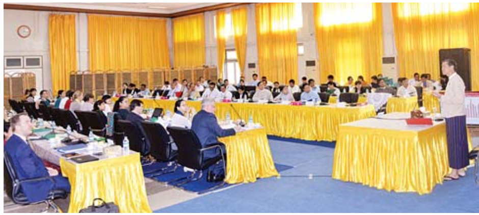
ပညာရေးနှင့် အခြေခံသုတေသန လုပ်ငန်းများတွင်ပါဝင်နိုင် ရေးအတွက် အကောင်အထည်ဖော်ဆောင်ရွက်နေပါ ကြောင်း ပြောကြားသည်။ ထို့နောက် Australian Embassy မှ Counsellor Mr. Tim Vistarini က ပညာရေးဖွံ့ဖြိုး တိုးတက်ရေးအတွက် ပူးပေါင်းပံ့ပိုးပေးသွားမည်ဖြစ်ပါ ကြောင်း၊ ပညာရေးဝန်ကြီးဌာန၏တာဝန်ရှိသူများ၊ ဖွံ့ဖြိုး ရေးမိတ်ဖက်အဖွဲ့များဖြင့် ဆောင်ရွက်နေသည်ကို တွေ့မြင်ရသည့်အတွက် ကျေးဇူးတင်ရှိပါကြောင်း ပြောကြားသည်။ သတင်းစဉ်

ဆောင်ရွက်လျက်ရှိပါကြောင်း၊ အရည်အသွေးပြည့်ဝသော ပညာရေးစနစ်ကို ဖော်ဆောင်ရာတွင် အရည်အသွေးရှိ သော ဆရာဆရာမများ၏ အခန်းကဏ္ဍသည် အဓိက ကျပါကြောင်း။ ထို့ကြောင့် ဆရာဆရာမများအား အရည်အသွေး မြှင့်တင်ပေးနိုင်ရေးအတွက် သင်ကြားပို့ချပေးနေပါကြောင်း၊ ကျောင်းသား ကျောင်းသူများအား လူကောင်းလူမွန်များ ဖြစ်အောင် အသင်းအဖွဲ့နှင့်ပူးပေါင်းဆောင်ရွက်တတ် အောင်၊ တာဝန်ယူတာဝန်ခံ ဆောင်ရွက်တတ်အောင်၊ တီထွင်ပြုစုနိုင်တတ်အောင် ပြုစုပေးထားသည့် သင်ယူလေ့ကျင့်ပေးနေပါကြောင်း၊ မူလတန်းပညာ သင်ယူပြီးမြောက်သူတိုင်း အလယ်တန်း၊ အထက်တန်းနှင့် မိမိပါဝင်နိုင်သည့် အသက်မွေးဝမ်းကျောင်းပညာရပ်များ၊ တက္ကသိုလ်ပညာရပ်များ ဆက်လက်သင်ယူတတ်မြောက် နိုင်ရေး၊ လူ့အဖွဲ့အစည်း၊ နိုင်ငံနှင့် ကမ္ဘာကြီး၏ရေရှည် ဖွံ့ဖြိုးတိုးတက်ရေးအတွက် အကောင်အထည်ဆောင်ရွက် နိုင်စွမ်းရှိသည့် အခွင့်အလမ်းအတွက် တစ်သက်တာသင်