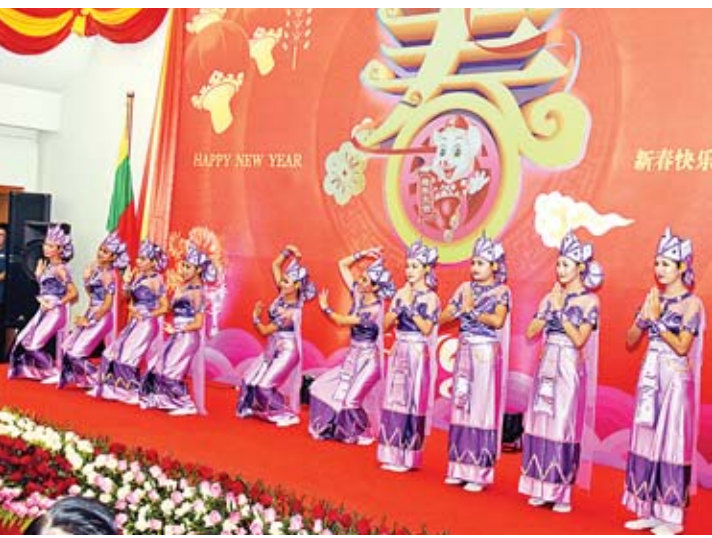
ပြည်ထောင်စုဝန်ကြီး ဦးကျော်တင်ဆွေနှင့် ဇနီး ဒေါ်မေယဉ်ထွန်း၊ ပြည်ထောင်စုဝန်ကြီး သူရဦးအောင်ကိုနှင့်ဇနီး၊ ငြိမ်းချမ်းရေးကော်မရှင်ဥက္ကဋ္ဌ ဒေါက်တာတင်မျိုးဝင်းနှင့်ဇနီး၊ သံအမတ်ကြီး မစ္စတာ ဟုန်လျန်နှင့် အဖွဲ့ဝင်များ တရုတ်နှစ်သစ်ကူးအထိမ်းအမှတ် မြန်မာ-တရုတ် နှစ်နိုင်ငံ ရိုးရာယဉ်ကျေးမှုအကများဖြင့် ဖျော်ဖြေတင်ဆက်မှုကို ကြည့်ရှုအားပေးစဉ်။

ကို တက်ရောက်ဆင်နွှဲခွင့်ရရှိခြင်းသည် မိတ်ဆွေဟောင်းများနှင့် ပျော်ရွှင်စွာ တွေ့ဆုံ ခွင့်ရသည်ဟု ခံစားမိရုံသာမက မြန်မာ- တရုတ်ဆွေမျိုးပေါက်ဖော် ဆက်ဆံရေး အတွက်လည်း အားသစ်လောင်းပေးရာ ရောက်သည်ဟုလည်း ယုံကြည်မိပါကြောင်း။ တိုးတက်ဖွံ့ဖြိုးလျက်ရှိ ပြည်ထောင်စုသမ္မတ မြန်မာနိုင်ငံတော် နှင့် တရုတ်ပြည်သူ့သမ္မတနိုင်ငံတို့သည် ရှည်လျားသော နယ်နိမိတ်ချင်း ထိစပ်လျက်ရှိ သည့် အိမ်နီးချင်းကောင်းနိုင်ငံဖြစ်ပြီး နှစ်နိုင်ငံ အကြားရှိ ဆွေမျိုးပေါက်ဖော်ဆက်ဆံရေးမှ တစ်ဆင့် “ဘက်စုံမဟာဗျူဟာမြောက် ပူးပေါင်းဆောင်ရွက်မှု မိတ်ဖက်ဆက်ဆံရေး” ကို အခြေခံသော ပူးပေါင်းဆောင်ရွက်မှုများ သည် ကျယ်ပြန့်စွာ ဖွံ့ဖြိုးတိုးတက်လျက် ရှိရုံ သာမက ဒေသတွင်းနှင့် နိုင်ငံတကာရေးရာ ပူးပေါင်းဆောင်ရွက်မှုများမှာလည်း နက်ရှိုင်း