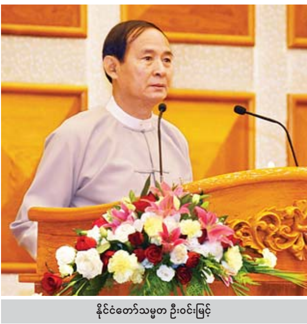
နိုင်ငံတော်သမ္မတ ဦးဝင်းမြင့်

ဒါ့အပြင် တစ်နေရာမှာတွေ့ရှိရတာက လွှတ်တော်ကိုယ်စားလှယ်တွေကို ဒေသဆိုင်ရာအာဏာပိုင်က၊ အာဏာပိုင်အဖွဲ့အစည်းက အလေးထားတိုင်ပင်အပ်သော ပုဂ္ဂိုလ်များလို ပြဋ္ဌာန်းထားတာကိုတွေ့ရှိရပါတယ်။ ဒေသဆိုင်ရာအာဏာပိုင်က၊ အာဏာပိုင်အဖွဲ့အစည်းက အလေးထားတိုင်ပင်အပ်တဲ့ ပုဂ္ဂိုလ်ဖြစ်အောင်လည်း ကိုယ်စားလှယ်များအနေနဲ့ အထွေထွေဗဟုသုတကြွယ်ဝဖို့ လိုအပ်ပါတယ်။ နိုင်ငံရေးအမြင်၊ စီးပွားရေးအမြင်၊ လူမှုရေးအမြင်၊ လုံခြုံရေးအမြင်တွေ ရှိရမယ့်အပြင် ဒေသဆိုင်ရာအမြင်နဲ့ နိုင်ငံတကာအမြင်တွေလည်း ရှိဖို့လိုအပ်ပါတယ်။ ဒါ့ကြောင့်မို့ ကျွန်တော်တို့ လွှတ်တော်ကိုယ်စားလှယ်တွေနဲ့ ပတ်သက်ပြီး မိမိတို့မဲဆန္ဒနယ်မြေရဲ့ စီမံကိန်းတွေမှာဆိုရင်လည်း ဖွဲ့စည်းပုံအခြေခံဥပဒေနဲ့ မဆန့်ကျင်ဘဲ ဒေသဆိုင်ရာအာဏာပိုင်က၊ ဒေသဆိုင်ရာ အာဏာပိုင်