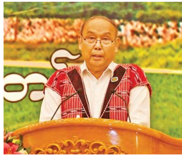
အမျိုးသားလွှတ်တော်ဥက္ကဋ္ဌ မန်းဝင်းခိုင်သန်း ဒုတိယအကြိမ်လွှတ်တော် များ၏ (၃)နှစ်မြောက် နှစ်ပတ်လည်နေ့အခမ်းအနားတွင် အမှာစကား ပြောကြားစဉ်။

ပြည်သူ့အုပ်ချုပ်ရေးဖြစ်သော ဒီမို ကရေစီစနစ်ကို ဖော်ဆောင် လျှောက်လှမ်းသည့် ခရီးလမ်းတွင် လွှတ်တော်ကိုယ်စားလှယ်များသည် ဝါတီစွဲ၊ လူမျိုးစွဲ၊ ဒေသစွဲ၊ ပုဂ္ဂိုလ်စွဲ မထားရှိဘဲ ဥပဒေပြုသူများပီပီ အစွဲ ကင်းစွာ လက်တွေ့ဘဝတွင် ပြည်သူ များ ဥပဒေ၏ အကာအကွယ်ဖြင့် အေးချမ်းလုံခြုံစွာနေနိုင်ရန်၊ ပြည်သူ