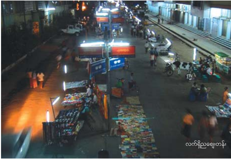
လက်ရှိညဈေးတန်း

ကျွန်တော်တို့ လူငယ်တွေအဖို့ ညဈေးတန်းမှာ စွဲမက်စရာတစ်ခုကထိုးမုန့်ဆိုင်တွေပါ။ ၂၈ လမ်းဘက် အဝင်နဲ့ ၂၆ ဘီလမ်းပေါ် ညဈေးတန်းအဆုံးတွေမှာ ထိုးမုန့်ဆိုင်တွေရှိတယ်။ ရောင်းချကြတာ ဈေးချိုသူ အပျိုဖြန်းလေးတွေ။ လှလှပပ ယဉ်ယဉ်ကျေးကျေး လေးတွေ။ ညဈေးလာသူတွေကို ချိုသာတဲ့အပြုံး၊ ဖွယ်ရာတဲ့ စကားလုံးတွေနှင့် ထိုးမုန့်လေးများ လက် ဆောင်ဝယ်ကြပါဦးရှင့်။ ထိုးမုန့်အမြည်းလေးလည်း သုံးဆောင်ကြပါရှင့်။ မဝယ်ပေးမယ့်လည်းအမြည်းလေး များသုံးဆောင်ကြပါဦးရှင်စတဲ့ စကားလုံးတွေ၊ အပြုံး တွေနှင့် ဖိတ်ခေါ်တယ်။ လူငယ်တွေကလည်းယဉ်ယဉ် ကျေးကျေးနှင့် ထိုးမုန့်အမြည်းစားကြတယ်။ ထိုးမုန့်