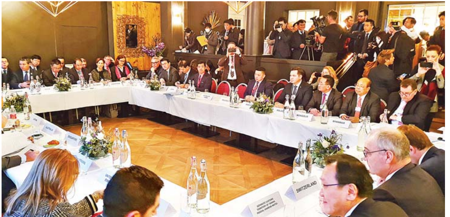
ပြည်ထောင်စုဝန်ကြီး ဦးသောင်းထွန်း ဆွစ်ဇာလန်နိုင်ငံ ဒါပိုစ်မြို့၌ ကျင်းပသည့် (၄၉)ကြိမ်မြောက် ကမ္ဘာ့စီးပွားရေးဖိုရမ် နှစ်ပတ်လည်အစည်းအဝေးသို့ တက်ရောက်စဉ်။

နေပြည်တော် ဇန်နဝါရီ ၂၇ ရင်းနှီးမြှုပ်နှံမှုနှင့် နိုင်ငံခြားစီးပွားဆက်သွယ်ရေးဝန်ကြီးဌာန ပြည်ထောင်စုဝန်ကြီး ဦးသောင်းထွန်းသည် ဆွစ်ဇာလန်နိုင်ငံ ဒါပိုစ်မြို့၌ ဇန်နဝါရီ ၂၂ ရက်မှ ၂၅ ရက်အထိ ကျင်းပခဲ့သည့် (၄၉)ကြိမ်မြောက် ကမ္ဘာ့စီးပွားရေးဖိုရမ် နှစ်ပတ်လည်အစည်းအဝေးသို့ တက်ရောက်ခဲ့ပြီး စတုတ္ထစက်မှုတော်လှန်ရေး Globalization 4.0 သို့ ပြောင်းလဲနေချိန်၌ မြန်မာနိုင်ငံမှ ဆောင်ရွက်နေသည့် ပြုပြင်ပြောင်းလဲမှုများ၊ စီးပွားရေးနှင့် ရင်းနှီးမြှုပ်နှံမှုအခွင့်အလမ်းများကို ကမ္ဘာ့နိုင်ငံအသီးသီးမှ တက်ရောက်လာကြသည့် အစိုးရအကြီးအကဲများ၊ နိုင်ငံတကာအဖွဲ့အစည်းများမှ ပုဂ္ဂိုလ်များ၊ ထိပ်တန်းစီးပွားရေးလုပ်ငန်းရှင်ကြီးများအား တွေ့ဆုံအသိပေးပြောကြားခဲ့ပြီး ရင်းနှီးမြှုပ်နှံမှုနှင့် ပတ်သက်၍ နိုင်ငံတကာလုပ်နည်းလုပ်ဟန်များ၊ best practices များအပေါ် ဆွေးနွေးအမြင်ချင်းဖလှယ်ခဲ့သည်။ ပြည်ထောင်စုဝန်ကြီးသည် ဇန်နဝါရီ ၂၂ ရက်တွင် ကျင်းပခဲ့သည့် ကမ္ဘာ့စီးပွားရေးဖိုရမ် နှစ်ပတ်လည်အစည်းအဝေးဖွင့်ပွဲအခမ်းအနားနှင့် ၂၃ ရက်တွင် ကျင်းပခဲ့သည့် ကမ္ဘာ့စီးပွားရေး စာမျက်နှာ ၇ ကော်လံ ၁ သို့ ❖