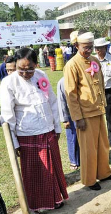
Japan Myanmar Parliamentary Friendship Association ဥက္ကဋ္ဌ Mr. Ichiro Aisawa တတိယအကြိမ် မြန်မာ-ဂျပန် ချစ်ကြည်ရေး ချယ်ရီပန်းပင်စိုက်ပျိုးပွဲတွင် ချယ်ရီပန်းပင်စိုက်ပျိုးပေးစဉ်။

အတွင်း ဝင်ရောက်သော ခရီးသည်အချို့ အပါအဝင် စုစုပေါင်း ၁ ဒသမ ၄ သန်းခန့် ဝင်ရောက်သည့်အတွက် ခရီးသည်အားလုံး၏ ထက်ဝက်နီးပါးသည် ရန်ကုန်မြို့ကို စတင်လာရောက်လည်ပတ်ကြောင်းနှင့် ယခုလို ရန်ကုန်မြို့တွင် ခရီးသွားမြှင့်တင်ရေး အစီ