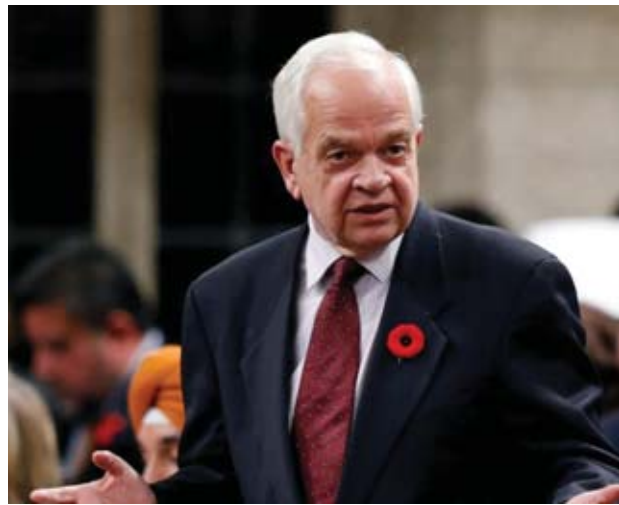
တရုတ်နိုင်ငံဆိုင်ရာ ကနေဒါသံအမတ်ကြီး ဂျွန်မက်စ်ကော်လမ်