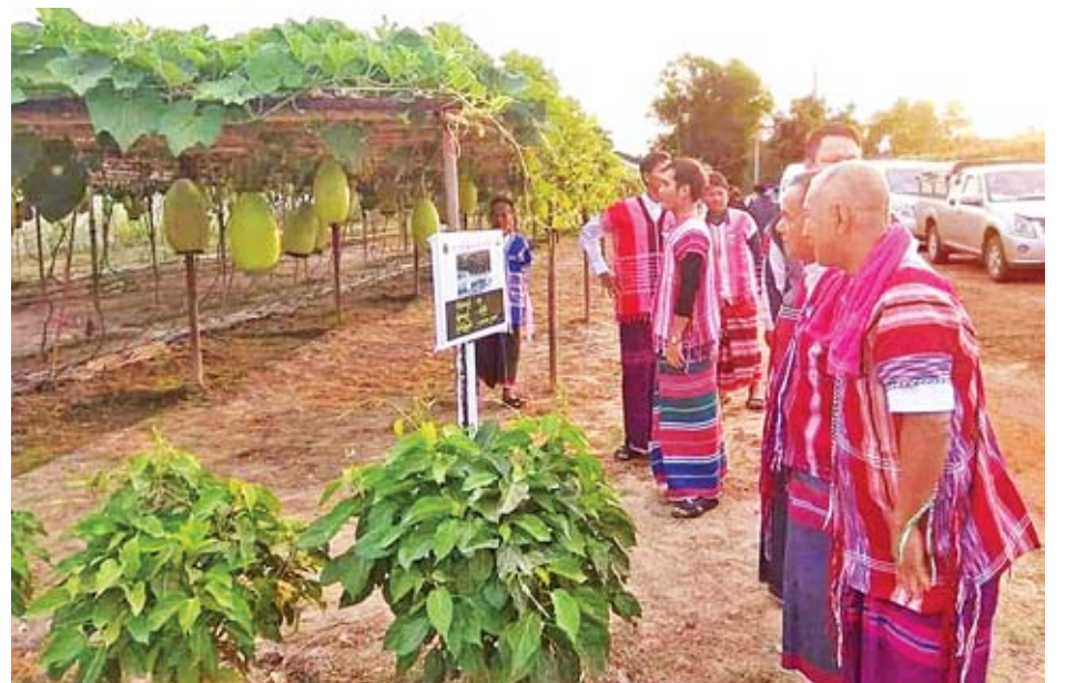
ကမ်းဘေး မြေနုကျွန်းဒေသတောင်သူလယ်သမားများ၊ ငြိမ်းချမ်းရေးတပ်ဖွဲ့ဝင် မိသားစုများ၏ ဟင်းသီးဟင်းရွက် စိုက်ပျိုးထုတ်လုပ်မှု မြှင့်တင်ရေးအတွက် ပြည်နယ်အစိုးရ ပြည်ထောင်စုဝန်ကြီးဌာနတို့က နည်းပညာများ ပို့ချခြင်း၊ မျိုးစေ့များ ထောက်ပံ့ခြင်းအပြင် FAO၊ MEDA နှင့် GMSAEDC အဖွဲ့တို့ကလည်း ပူးပေါင်းဆောင်ရွက် ပေးလျက်ရှိကြောင်း သတင်းရရှိသည်။

လေ့လာရေးအဖွဲ့များသည် ဟင်းသီးဟင်းရွက် သစ်သီးဝလံ သုတေသနနှင့် ဖွံ့ဖြိုးရေးဗဟိုဌာန (VFRDC) ၌ စိုက်ပျိုးပြသထားသော အော်ဂဲနစ်ဟင်းသီး ဟင်းရွက်စိုက်ခင်းများ၊ အိမ်ခြံဝင်းစိုက်ခင်း၊ မျိုးစေ့ထုတ် စိုက်ခင်းနှင့်နည်းပညာပေးစိုက်ခင်းများပုဂ္ဂလိက အရောင်း ဆိုင်ခန်းများကို ကြည့်ရှုလေ့လာကြရာ စိုက်ခင်းပညာရှင် ဝန်ထမ်းများက သိရှိလိုသည်များကို အသေးစိတ် ရှင်းလင်းပြသကြသည်။ ထို့နောက် ကရင်ပြည်နယ်မှ လေ့လာရေးအဖွဲ့ဝင်များသည် လှည်းကူးမြို့နယ် အင်းတကော်မြို့၊ သနပ်ပြင်ကျေးရွာရှိ ငမိုးရိပ်ဆည် ရေသောက်နေစပါး တစ်ဆက်တစ်စပ်တည်းစိုက်ကွင်း များတွင် စိုက်ပျိုးနေသော စမ်းသပ်ကွက်များ၊ စံပြကွက် များ၊ SRI စနစ်ဖြင့် စိုက်ပျိုးသော စပါးစိုက်ခင်းများကို ကြည့်ရှုလေ့လာခဲ့ကြသည်။ ကရင်ပြည်နယ်ရှိ သံလွင်မြစ်