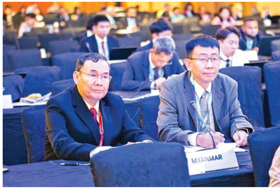
ထိုအပြင် ရာသီဥတုပြောင်းလဲမှု၊ သဘာဝဘေးအန္တရာယ်၊ အစားအစာ၊ စွမ်းအင်နှင့် ရေလုံလောက်စွာ ရရှိနိုင်မှုများတွင် စွမ်းဆောင်ရည်မြှင့်တင်ရေးဆောင်ရွက်ရမည့်ကိစ္စများ၊ ကြုံတွေ့ရသည့် စိန်ခေါ်မှုများ၊ ရေရှည်တည်တံ့သော ထုတ်လုပ်မှုနှင့် စားသုံးမှုစနစ် ဖွံ့ဖြိုးတိုးတက်လာရေးအတွက် ပိုမိုအရှိန်အဟုန်မြှင့် ဆောင်ရွက်သွားရန် လိုအပ်မှုတို့ကို ဆွေးနွေးကြသည်။

နေပြည်တော် ဇန်နဝါရီ ၂၇ သယံဇာတနှင့် သဘာဝပတ်ဝန်းကျင် ထိန်းသိမ်းရေးဝန်ကြီးဌာန ပြည်ထောင်စုဝန်ကြီး ဦးအုန်းဝင်းသည် စင်ကာပူနိုင်ငံတွင် ဇန်နဝါရီ ၂၄ ရက်မှ ၂၅ ရက်အထိ ကျင်းပခဲ့သော အာရှ-ပစိဖိတ်ဒေသ ပတ်ဝန်းကျင်ဆိုင်ရာဝန်ကြီးများ၏ တတိယအကြိမ်မြောက်ညီလာခံသို့ အာရှ-ပစိဖိတ်ဒေသတွင်းနိုင်ငံပေါင်း ၄၁ နိုင်ငံမှ ပတ်ဝန်းကျင်ထိန်းသိမ်းရေးဝန်ကြီးများနှင့်အတူ တက်ရောက်ခဲ့သည်။