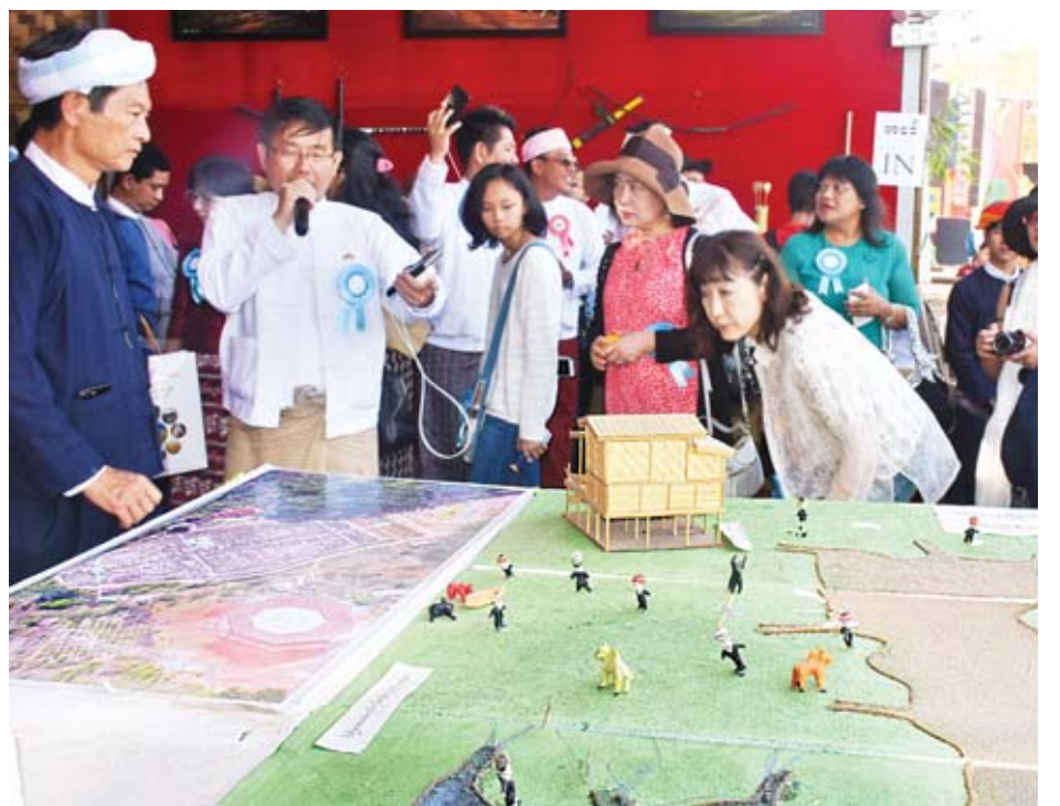
“သွေးချင်းတို့ရဲ့ပွဲတော်ဆီ” ပွဲတော်တွင် ခင်းကျင်းပြသထားသော ပြခန်းများကို ဂျပန်နိုင်ငံ ချယ်ရီပန်းပင်လေ့လာရေး အဖွဲ့က လာရောက်ကြည့်ရှုလေ့လာကြစဉ်။