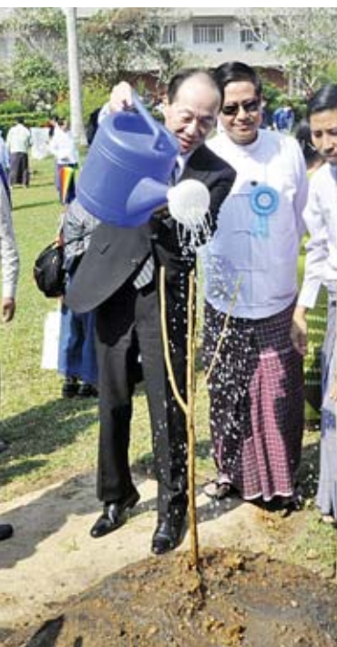
Japan Myanmar Parliamentary Friendship Association ဥက္ကဋ္ဌ Mr. Ichiro Aisawa တတိယအကြိမ် မြန်မာ-ဂျပန် ချစ်ကြည်ရေး ချယ်ရီပန်းပင်စိုက်ပျိုးပွဲတွင် ချယ်ရီပန်းပင်စိုက်ပျိုးပေးစဉ်။

ပြသသော သွေးချင်းတို့ရဲ့ ပွဲတော်နှင့် တိုက်ဆိုင်၍ အင်မတန်မှ ကောင်းမွန်ပြီး တစ်ဆက်တည်းမှာပဲ ဂျပန်နှင့် နိုင်ငံခြားခရီးသွားတို့ကို မြန်မာ၏ ထူးခြားသော တိုင်းရင်းသားရိုးရာယဉ်ကျေးမှုတို့ကို ပြသခွင့်ရရှိမည် ဖြစ်ပါကြောင်း၊ မြန်မာနှင့် ဂျပန်သည် ကာလ