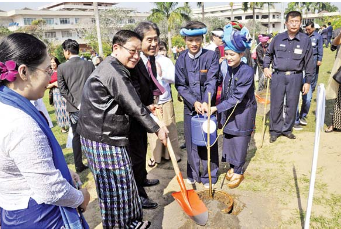
ပြည်သူ့လွှတ်တော်ဥက္ကဋ္ဌ ဦးတီခွန်မြတ် တတိယအကြိမ် မြန်မာ-ဂျပန် ချစ်ကြည်ရေး ချယ်ရီပန်းပင်စိုက်ပျိုးပွဲတွင် ချယ်ရီပင်စိုက်ပျိုးပေးစဉ်။

မြန်မာ့ရာသီဥတုနှင့် ကိုက်ညီသော မျိုးရိုးစီပျော်ပြင်ထားသည့် ဆာကူယာ ချယ်ရီပင်များဖြစ်ပြီး ယနေ့အချိန်အခါတွင် မြန်မာနိုင်ငံသို့ လာရောက်သော ခရီးသွားများအတွက် ဆွဲဆောင်မှုရှိသောဒေသများအဖြစ် ကြိုးပမ်းနေချိန်တွင် တတိယအကြိမ် မြန်မာ-ဂျပန် ချစ်ကြည်ရေး ချယ်ရီပန်းပင် စိုက်ပျိုးပွဲတော်ကို ကျင်းပခြင်းဖြင့် မြန်မာနိုင်ငံသည် ချယ်ရီပန်းပင်များဖြင့် ဆွဲဆောင်မှုရှိသည်ဟူသော သတင်းစကားကို ကမ္ဘာ့အရပ်ရပ်ရှိ ခရီးသွား ဧည့်သည်တို့ထံ ဖြန့်ဝေနိုင်လိမ့်မည်ဟုယုံကြည်ပါကြောင်း၊ မြန်မာနိုင်ငံသို့ ကမ္ဘာလှည့်ခရီးသည် ဝင်၊ ထွက်မှုသည် အတော်အသင့် တိုးတက်မှုရှိလာပြီဖြစ်ပြီး ၂၀၁၇ ခုနှစ်တွင် ကမ္ဘာလှည့်ခရီးသည်ဝင်ရောက်မှုသည် ၃ ဒသမ ၄၄ သန်းရှိခဲ့၍ ၂၀၁၈ ခုနှစ်တွင် ၃