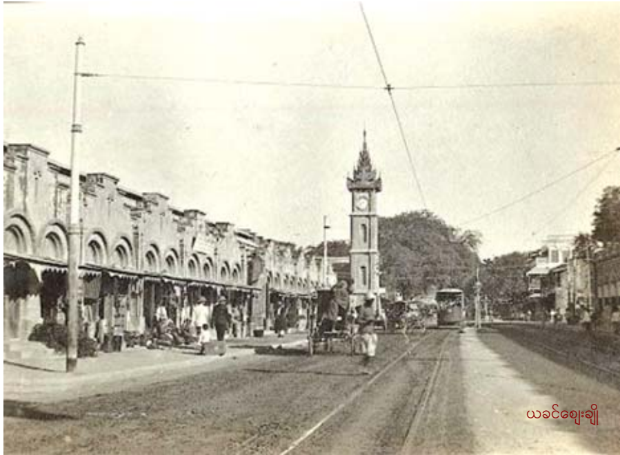
ယခင်ဈေးချို

ဈေးချိုရုံကြီး ၁၂ ရုံနှင့် တိုက်တန်းကြီး တိုက်တန်း လေးပေါက်ဆိုင်ခန်းတွေ၊ ဈေးရုံဈေးတန်းကဆိုင်ခန်း တွေ ပိတ်သိမ်းလိုက်တာနှင့် လမ်းမကြီးပေါ်ကယာဉ် ရထားအသွားအလာတွေရပ်နားသွားပြီး လမ်းမကြီးပေါ် မှာ ဈေးဆိုင်ဈေးတန်းတွေ ချက်ချင်းခင်းကျင်းကြတယ်။ နေအလင်းရောင်ပျောက်တာနှင့် ဆိုင်ပေါက်စေ အောက် လင်းဓာတ်မီးတွေ ထွန်းညှိကြတယ်။ ၁၉၅၉ ခုနှစ် ဖေဖော်ဝါရီ ၁၈ ရက်နေ့မှာ ညဈေးတန်းကို စဖွင့်တော့ အစားအသောက်ဆိုင်အဖြစ် အိန္ဒိယလူမျိုး ၃၁ ဆိုင်၊ တရုတ်ဆိုင် ၃၁ ဆိုင်၊ ဂေါ်ရင်ဂျီဆိုင် နှစ်ဆိုင်၊ မြန်မာဆိုင် ၈၅ ဆိုင်အပါအဝင် အဝတ်အထည်၊ လူသုံးကုန်၊ အလှ ကုန်နှင့် အထွေထွေ ကုန်ပစ္စည်းရောင်းချတဲ့ ဆိုင်ပေါင်း ၅၃၄ဆိုင် ဖွင့်လှစ်ပါသတဲ့။ ဆိုင်ခန်းတစ်ခန်းစီရဲ့အကျယ် အဝန်းက ၆ပေ x ၈ပေရှိတယ်။ ဖွင့်ပွဲမှာ ၂၆ ဘီလမ်း အာဇာနည်လမ်းပေါ်က ဟုတ်စုန်စတိုး ယခု အင်းဝ ဘဏ်နေရာနှင့် တိုက်တန်းကြီးကိုသွယ်တန်းထားတဲ့ ဖဲကြိုးကို မန္တလေးမြို့နီစပယ်ဥက္ကဋ္ဌ မင်းဘူးဦးမောင် မောင်က ဖြတ်ပြီးဖွင့်လှစ်ပေးခဲ့တယ်။ ဒီညဈေးတန်း ဟာ တစ်လျှောက်လုံးစည်ကားခဲ့တယ်။ ပြည်တွင်း သာမက ပြည်ပဧည့်သည်များအထိ ‘ဈေးချိုညဈေး တန်း’ရဲ့ ထူးခြားတဲ့မြင်ကွင်းနှင့် ရောင်းဝယ်မှုပုံစံကို ထူးခြားမှုတစ်ခုအနေနှင့် မှတ်တမ်းတင်ကြတယ်။ ပြည်ပဧည့်သည်များရဲ့ ပြည်တွင်းအလည်အပတ် ခရီး စဉ်မှာ ဈေးချိုညဈေးတန်းဟာမပါမဖြစ် နေရာတစ် နေရာပါ။