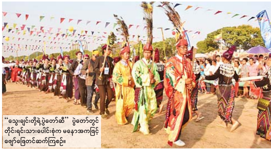
“သွေးချင်းတို့ရဲ့ပွဲတော်ဆီ” ပွဲတော်တွင် တိုင်းရင်းသားပေါင်းစုံက မနောအကဖြင့် ဖျော်ဖြေတင်ဆက်ကြစဉ်။