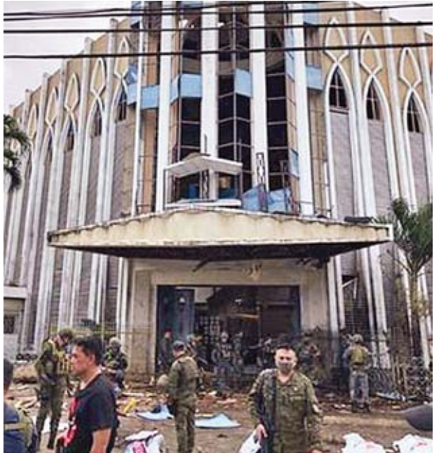
တပ်မတော်နှင့် ရဲအရာရှိများက အဆိုပါပုံးပေါက်ကွဲမှုတွင် မွတ်စလင် စစ်သွေးကြွများ ပါဝင်ပတ်သက်မှုရှိမရှိကို စုံစမ်းစစ်ဆေးလျက်ရှိသည်။ အေအက်ဖီပီ

ယခုပုံးပေါက်ကွဲမှုသည် မွတ်စလင်စစ်သွေးကြွအဖွဲ့က သတိပေး မြှမ်းခြောက်သည့်အနေဖြင့် ကျူးလွန်ခဲ့ခြင်းဖြစ်နိုင်ဖွယ်ရှိသည်ဟု ရဲအရာရှိ များက ထင်မြင်ယူဆကြသည်။