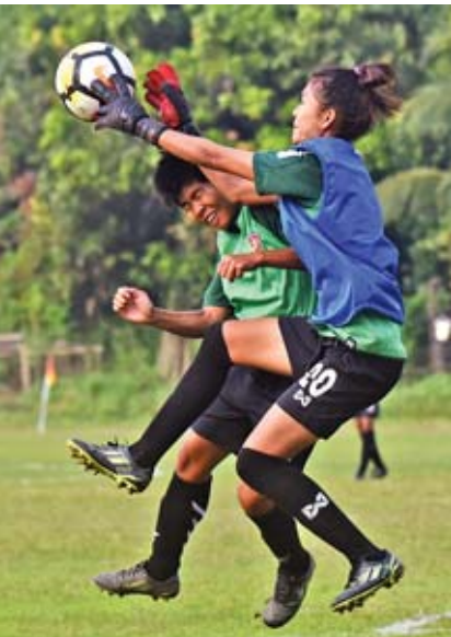
လက်ရွေးစင်အသင်း ရိုးသွင်းရန် ကြိုးပမ်းမှုကို ယူ-၁၉ ရိုးသမား ကာကွယ်နေစဉ်။

ခြေစမ်းအရ ကွာခြားမှုရှိသောကြောင့် လက်ရွေးစင် အသင်းက ခြေအသာဖြင့်ကစားကာ ရိုးပြတ်အနိုင်ရခဲ့ခြင်းဖြစ်သည်။ စာမျက်နှာ ၁၀ ကော်လံ ၁ သို့ ○