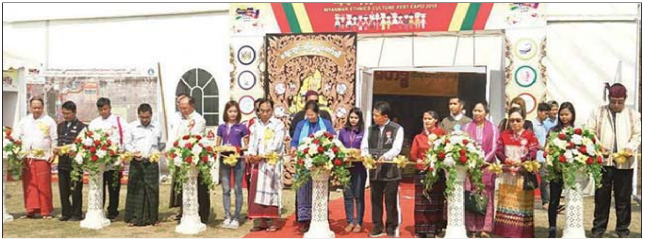
မွန်းလွဲပိုင်းတွင် ပြည်ထောင်စုဝန်ကြီးသည် တိုင်းဒေသကြီးနှင့် ပြည်နယ်များမှ တိုင်းရင်းသားလူမျိုးရေးရာဝန်ကြီးများ၊ မြန်မာနိုင်ငံတိုင်းရင်းသားလုပ်ငန်းရှင်များအသင်းမှ တာဝန်ရှိသူများနှင့် အတူ “သွေးချင်းတို့ရဲ့ ပွဲတော်ဆီ” ပွဲတော်သို့ ဖျော်ဖြေတင်ဆက်ရန်လာရောက်သည့် ကရင်တိုင်းရင်းသားရိုးရာ ယဉ်ကျေးမှုအဖွဲ့ ယာဉ်မတော်တဆဖြစ်ပွားပြီး ဒဏ်ရာရရှိကာ အင်းစိန် အထွေထွေရောဂါကုဆေးရုံတွင် အတွင်းလူနာအဖြစ် ဆေးကုသခံယူနေမှုအား သွားရောက်ကြည့်ရှုအားပေးသည်။ သတင်း- သီသီမင်း၊ ဓာတ်ပုံ- အောင်မြင်(ပြန်/ဆက်)

ယနေ့ “သွေးချင်းတို့ရဲ့ ပွဲတော်ဆီ” ပွဲတော်တွင် ဖွင့်လှစ်လိုက်သည့် ကုန်စည်ပြပွဲတွင် အဝတ်အထည်၊ လူသုံးကုန်ပစ္စည်း၊ ဆေးဝါး၊ အစားအစာ၊ အသီးအနှံ၊ အလှကုန်ပစ္စည်း၊ ကားအရောင်းပြခန်းစသည့် ဆိုင်ခန်းပေါင်း ၂၀၀ ခန့် ခင်းကျင်းပြသထားကြောင်း သိရသည်။