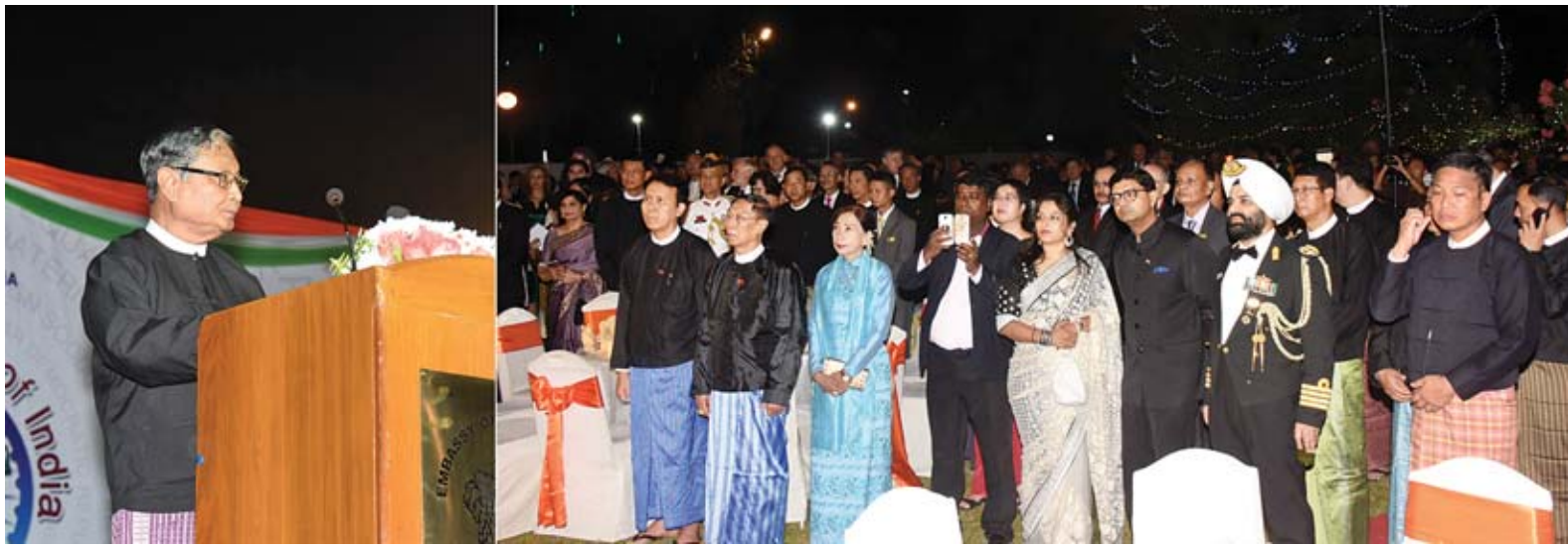
ပြည်ထောင်စုဝန်ကြီး ဦးကျော်တင်ဆွေ အိန္ဒိယသမ္မတနိုင်ငံ၏ နှစ်(၇၀)ပြည့် အမျိုးသားနေ့ အထိမ်းအမှတ် အခမ်းအနားတွင် အမှာစကားပြောကြားစဉ်။

ရန်ကုန် ဇန်နဝါရီ ၂၆ အိန္ဒိယသမ္မတနိုင်ငံ၏ နှစ်(၇၀)ပြည့် အမျိုးသားနေ့ အထိမ်းအမှတ်အခမ်းအနားကို ယနေ့ ည ၇ နာရီတွင် ရန်ကုန်မြို့၊ ဒဂုံမြို့နယ် သံတမန်လမ်း အမှတ်(၃၅)ရှိ သံအမတ်ကြီးနေအိမ် တွင် ကျင်းပရာ နိုင်ငံတော်အတိုင်ပင်ခံ ရုံးဝန်ကြီးဌာန ပြည်ထောင်စုဝန်ကြီး ဦးကျော်တင်ဆွေနှင့် ဇနီး ဒေါ်မေယုဉ် ထွန်းတို့ တက်ရောက်သည်။