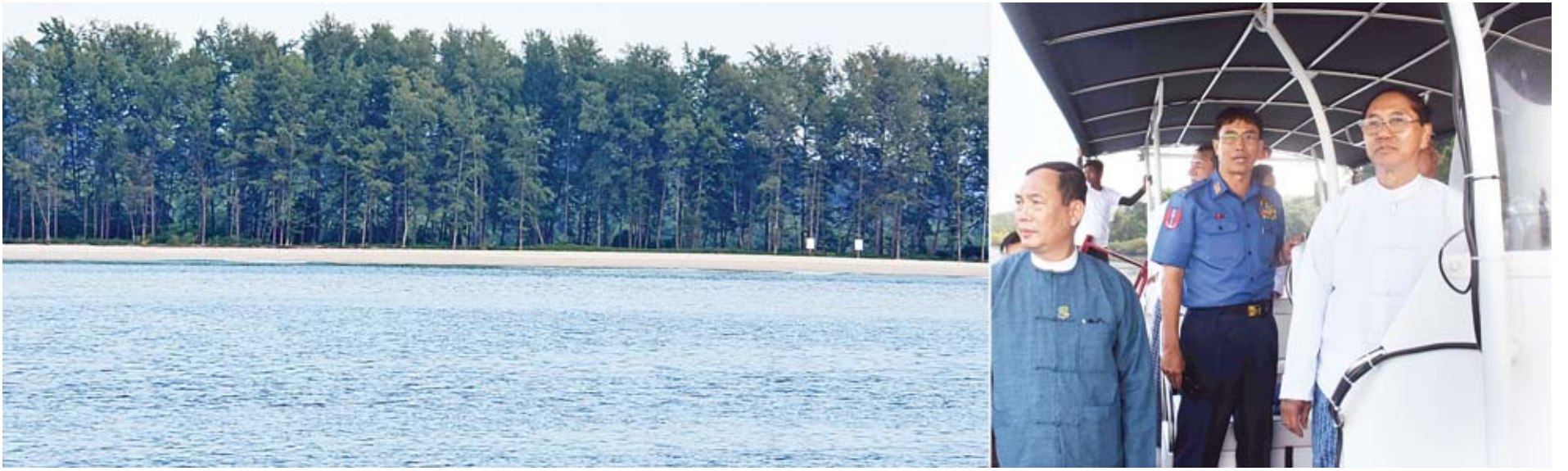
ဒုတိယသမ္မတ ဦးမြင့်ဆွေ လန်ပီအတ္ထဝါအမျိုးသားဥယျာဉ်ဖရိယာအတွင်းရှိ ကမ်းခြေများ၊ သစ်တောများနှင့် ဂေဟစနစ်များ ထိန်းသိမ်းဆောင်ရွက်ထားရှိမှုအခြေအနေများကို ရေယာဉ်ဖြင့် လှည့်လည်ကြည့်ရှုစဉ်။

❖ ရှေ့မှ ယင်းနောက် ဒုတိယသမ္မတနှင့် အဖွဲ့ဝင်များသည် ဇာဒက်ကြီးကျေးရွာသို့ ရောက်ရှိပြီး ကျေးရွာအုပ်ချုပ်ရေး မှူးရုံးခန်း၌ အဆိုပါကျေးရွာရှိ ဆလုံတိုင်းရင်းသားလူမျိုး များနှင့် တွေ့ဆုံသည်။ တွေ့ဆုံစဉ် ဒုတိယသမ္မတက မြန်မာနိုင်ငံ၏ တိုင်းရင်း သားလူမျိုးများစာရင်းတွင် လူဦးရေအနည်းဆုံးစာရင်း၌ ပါဝင်သည့် ဆလုံတိုင်းရင်းသားများနှင့် ယခုလိုတွေ့ဆုံ