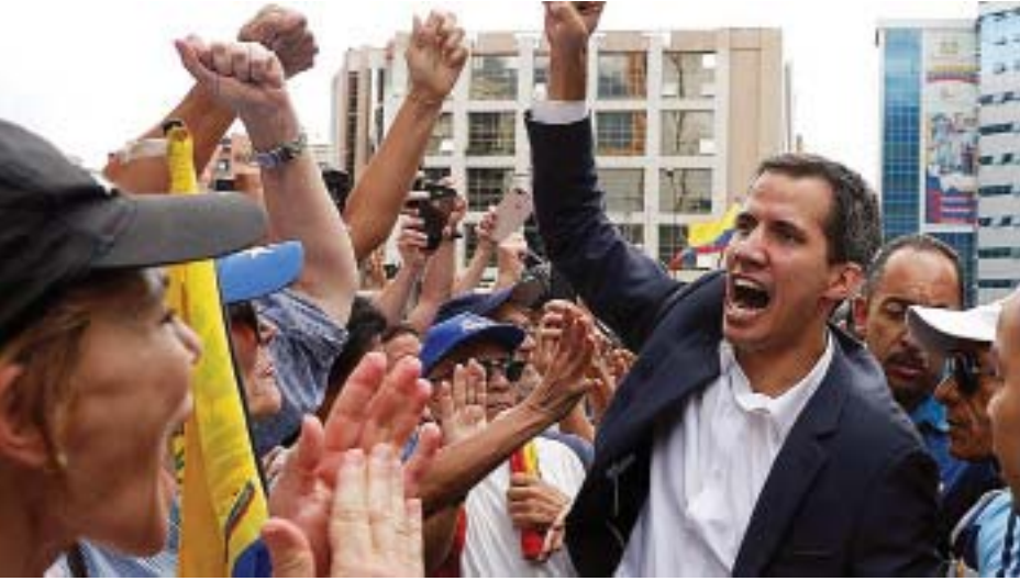
အတိုက်အခံခေါင်းဆောင် ဂျူအန် ဂွိုင် ။

နိုင်ငံသည် စီးပွားရေးပျက်ကပ်နှင့်ရင်ဆိုင်ခဲ့ရပြီး ပြည်သူ များအနေဖြင့် အစားအစာ ရှားပါးမှု၊ ဆေးဝါးထောက်ပံ့ မှုပြတ်လပ်ခြင်းများကို တွေ့ကြုံခံစားခဲ့ရသည်။ ထို့ကြောင့် ပြည်သူ နှစ်သန်းကျော်သည် နေရပ်စွန့်ခွာကာ ရေကြည်ရာ မြက်နုရာဒေသများသို့ ပြောင်းရွှေ့သွားခဲ့ကြသည်။ သမ္မတ မာဒူရိုသည် ရွေးကောက်ပွဲတွင် ထပ်မံအနိုင် ရရှိကာ ဒုတိယသက်တမ်းအတွက် ကျမ်းသစ္စာဆိုပြီးသည့် နောက်ပိုင်း အတိုက်အခံခေါင်းဆောင် ဂျူအန် ဂွိုင်က သမ္မတမာဒူရိုအား ဖြုတ်ချပြီး သမ္မတရာထူးကို ဆက်ခံ ယူရန် ကြိုးပမ်းလျက်ရှိကြောင်း သိရသည်။ ဗင်နီဇွဲလားနိုင်ငံအတွင်း ပွင့်လင်းမြင်သာမှုရှိပြီး လွတ်လပ်၊ တရားမျှတသော ရွေးကောက်ပွဲတစ်ရပ်ကို လာမည့် ရှစ်ရက်အတွင်း ကျင်းပနိုင်ခြင်းမရှိပါက အတိုက်အခံခေါင်းဆောင် ဂျူအန် ဂွိုင်အား သမ္မတအဖြစ် သတ်မှတ်မည်ဖြစ်သည်ဟု စပိန်၊ ဂျာမနီ၊ ဝီအို ဆန်းချက်က ရုပ်သံလိုင်းတစ်ခုတွင် ပြောကြားခဲ့သည်။ ဗင်နီဇွဲလားနိုင်ငံ၏ အနာဂတ်အကျိုးစီးပွားကို ရှေးရှု