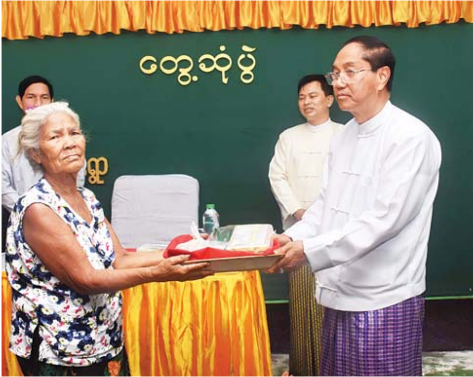
ဒုတိယသမ္မတ ဦးမြင့်ဆွေ ဆလုံတိုင်းရင်းသား အဘွားတစ်ဦးအား စားသောက်ဖွယ်ရာများ ထောက်ပံ့ပေးအပ် စဉ်။

ရန်နှင့် နောက်ထပ်အမျိုးသားဥယျာဉ်များ ပေါ်ထွန်းရေး ကြိုးပမ်းဆောင်ရွက်ရန် လိုအပ်ပါကြောင်း၊ ထိုပြင် ပလတ် စတစ် စသည် အမှိုက်သရိုက်များ စည်းကမ်းမဲ့စွန့်ပစ်မှုများ မရှိစေရေးကိုလည်း စနစ်တကျ ဆောင်ရွက်ကြရန်နှင့် တားမြစ်ငါးဖမ်းနည်းလမ်းများဖြစ်သည့် အဆိပ်ချွန်ခြင်း၊ မိုင်းခြွန်ခြင်း၊ ဘက်ထရီရှော့တိုက်ခြင်း၊ ပိုက်ကွက်စိပ်များ အသုံးပြုခြင်း၊ Baby Trawl ဖြင့် ငါးဖမ်းနည်းများ မရှိ စေရေး ကြပ်မတ်ထိန်းသိမ်းရန်မှာကြားသည်။ ယင်းနောက် ရေယာဉ်များဖြင့် လန်ပီအတ္ထဝါအမျိုးသားဥယျာဉ်ဖရိယာ အတွင်းရှိ ကမ်းခြေများ၊ သစ်တောများနှင့် ဂေဟစနစ်များ ထိန်းသိမ်းဆောင်ရွက်ထားရှိမှု အခြေအနေများကို လှည့်လည်ကြည့်ရှုလေ့လာကြသည်။