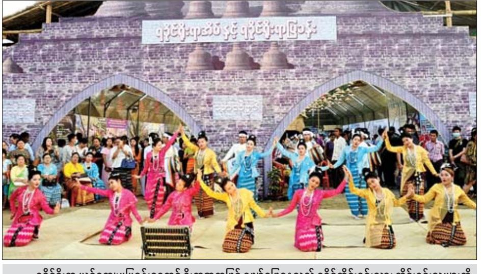
ရခိုင်ရိုးရာ ယဉ်ကျေးမှုပြခန်းရှေ့တွင် ရိုးရာအကဖြင့် ဖျော်ဖြေနေသည့် ရခိုင်တိုင်းရင်းသား တိုင်းရင်းသူများကို တွေ့ရစဉ်။