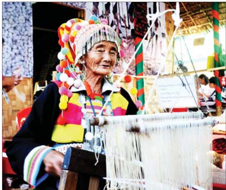
လီဆူးရိုးရာ အဝတ်အထည် ရက်လုပ်နေသည့် လီဆူးတိုင်းရင်းသူ အဘွားတစ်ဦး။

🌟 ကျောမိုးမှ ရိုးရာအစားအသောက်ဆိုင်များ၊ တိုင်းရင်းသားများ၏ ရိုးရာယဉ်ကျေးမှုကိုပြသသည့် ယဉ်ကျေးမှုပြခန်းများနှင့် ရိုးရာယဉ်ကျေးမှုအတွက် ဖျော်ဖြေသည့် စတိတ်စင်အပြင် “Miss Ethnic Myanmar 2019” တိုင်းရင်းသား အလှမယ်ရွေးချယ်ပွဲကိုလည်း ရွေးချယ်ရန် စီစဉ်ထားသည်။ “တိုင်းရင်းသားအလှမယ် ရွေးချယ်တာကတော့ ကျွန်တော်တို့ တိုင်းရင်းသားလုပ်ငန်းရှင်များအသင်းနဲ့ အခြားအသင်းတွေ ချိတ်ဆက်လုပ်ကိုင်တဲ့အခါ brand ambassadors အနေနဲ့ သုံးနိုင်ဖို့အတွက် Miss ရွေးချယ်မှုကို ပြုလုပ်တာပါ။ တိုင်းရင်းသား ၁၃၅ မျိုးလုံး ပါတယ်။ အခြေခံတိုင်းရင်းသား ရှစ်မျိုးတင်မကဘူး။ ကိုယ်ပိုင်အုပ်ချုပ်ခွင့်ရဒေသတွေဖြစ်တဲ့ ‘ဝ’၊ ‘ကိုးကန့်’၊ တအာင်း(ပလောင်)၊ ဓန၊ ပအိုဝ်း စတဲ့ ယဉ်ကျေးမှုပြခန်း