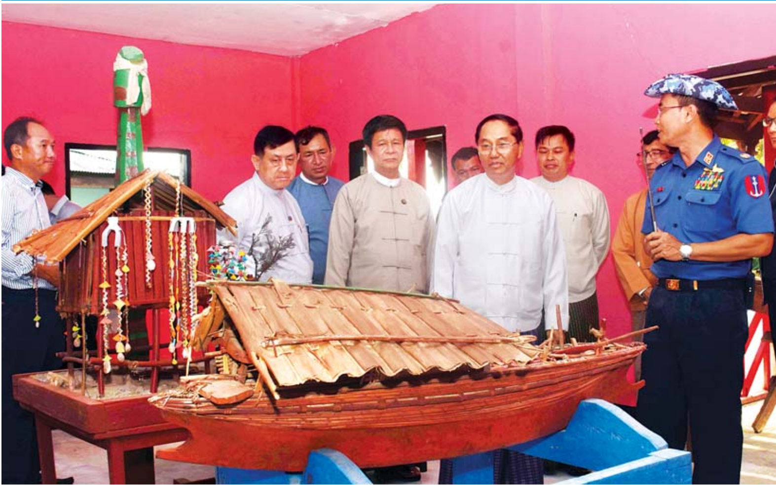
ဒုတိယသမ္မတ ဦးမြင့်ဆွေ ဆလုံတိုင်းရင်းသားများ၏ အက္ကဝါပြခန်းအတွင်း ခင်းကျင်းပြသထားသည့် ဆလုံရိုးရာနေအိမ်နှင့် ရိုးရာလှေကို ကြည့်ရှုလေ့လာစဉ်။