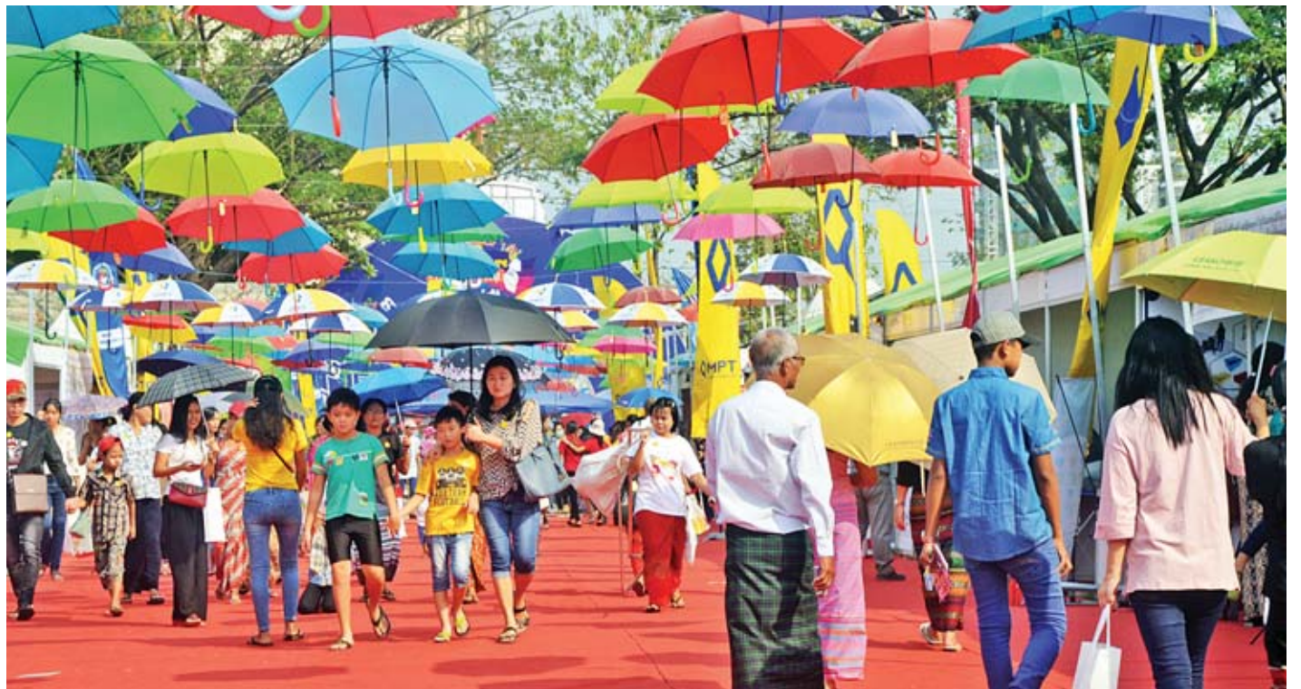
“သွေးချင်းတို့ရဲ့ပွဲတော်ဆီ”ပွဲတော်သို့ လာရောက်သူများဖြင့် စည်ကားလျက်ရှိသည်ကို တွေ့ရစဉ်။