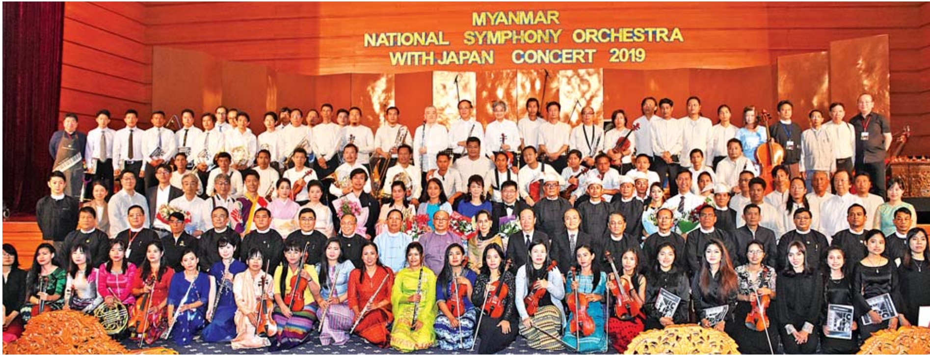
နိုင်ငံတော်၏အတိုင်ပင်ခံပုဂ္ဂိုလ် ဒေါ်အောင်ဆန်းစုကြည်၊ အမျိုးသားလွှတ်တော်ဥက္ကဋ္ဌ မန်းဝင်းခိုင်သန်း၊ ပြည်ထောင်စုဝန်ကြီးများ၊ နေပြည်တော်ကောင်စီဥက္ကဋ္ဌ၊ ဒုတိယဝန်ကြီးများ၊ မြန်မာနိုင်ငံဆိုင်ရာ ဂျပန်သံအမတ်ကြီး၊ နေပြည်တော်ကောင်စီဝင်များ၊ ဂီတပညာရှင်များ စုပေါင်းမှတ်တမ်းတင်ဓာတ်ပုံရိုက်ကြစဉ်။