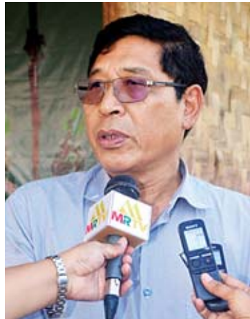
ဦးလှိုင်ခွန်ဆာ