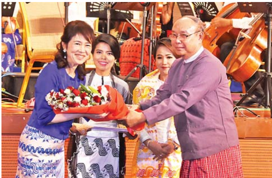
အမျိုးသားလွှတ်တော်ဥက္ကဋ္ဌ မန်းဝင်းခိုင်သန်း စန္ဒရာပညာရှင် မစ္စ ကျိုကို ခိုယာမာအား ဂုဏ်ပြုပန်းစည်း ပေးအပ်စဉ်။