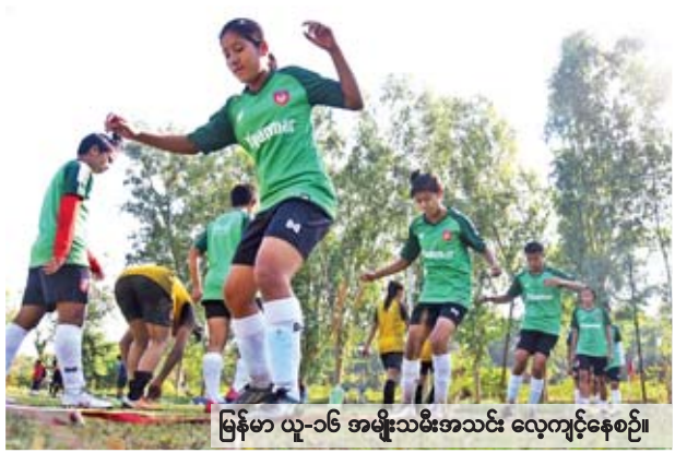
မြန်မာ ယူ-၁၆ အမျိုးသမီးအသင်း လေ့ကျင့်နေစဉ်။

မြန်မာယူ-၁၆ အမျိုးသမီးအသင်း သည် ၂၀၁၉ အာရှယူ-၁၆ အမျိုး သမီးခြေစစ်ပွဲ ဒုတိယအဆင့်အတွက် ကြိုတင်ပြင်ဆင်သည့် အနေဖြင့် ဩစတြေးလျနိုင်ငံ၌ သွားရောက် လေ့ကျင့်ရန်အတွက် အပြီးသတ် ကစားသမား ၂၃ ဦး ရွေးချယ်လိုက်ပြီ ဖြစ်သည်။