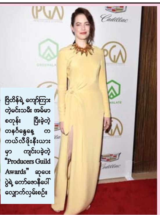
ဗြိတိန်ရဲ့ ကျော်ကြားတဲ့မင်းသမီး အမ်မာစတုန်း ပြီးခဲ့တဲ့ တနင်္ဂနွေနေ့ က ကယ်လီဖိုးနီးယားမှာ ကျင်းပခဲ့တဲ့ "Producers Guild Awards" ဆုပေးပွဲရဲ့ ကော်လောနီပေါ်လျှောက်လှမ်းစဉ်။