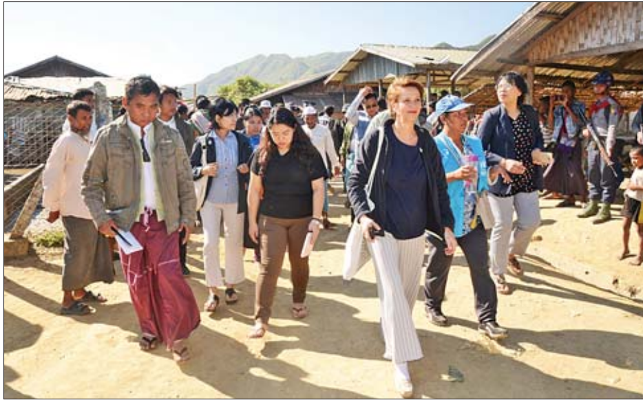
ယင်းနောက် အထူးကိုယ်စားလှယ်နှင့်အဖွဲ့သည် အကောင်အထည်ဖော် လုပ်ဆောင်ပေးလျက်ရှိသော NV ကတ်များ လုပ်ဆောင်ရေးနှင့်စပ်လျဉ်း၍ ရှင်းလင်း

ရှေးဦးစွာ ကုလသမဂ္ဂအတွင်းရေးမှူးချုပ်၏ မြန်မာနိုင်ငံဆိုင်ရာ အထူးကိုယ်စားလှယ်နှင့်အဖွဲ့သည် ပေါက်တောမြို့နယ်ရှိ အစွဲလမ်းဘာသာဝင်များ နေထိုင်သည့် ကြိမ်နီပြင်နှင့် အနောက်ရဲ ကယ်ဆယ်ရေးစခန်းသို့ရောက်ရှိပြီး(ယာပုံ) လတ်တလော စားဝတ်နေရေး၊ အလုပ်အကိုင်၊ ပညာရေး၊ ကျန်းမာရေးတို့နှင့်စပ်လျဉ်း၍ မြေပြင်အခြေအနေများကိုမေးမြန်းကာ စခန်းရှိ အမျိုးသမီးများနှင့် သီးသန့်တွေ့ဆုံခဲ့ပြီး အမျိုးသမီးဆိုင်ရာ အခွင့်အရေးများ၊ ကျန်းမာရေးစောင့်ရှောက်မှုဆိုင်ရာများနှင့် စပ်လျဉ်း၍ တွေ့ဆုံမေးမြန်းသည်။