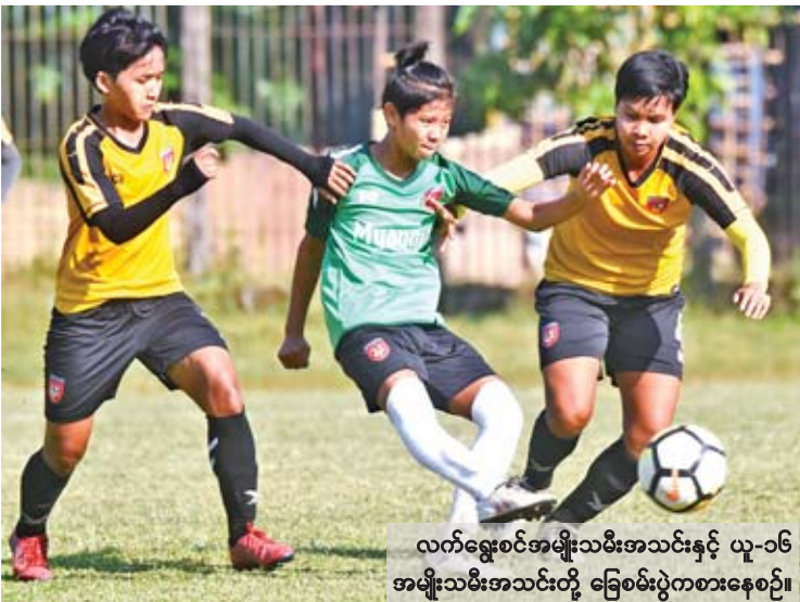
လက်ရွေးစင်အမျိုးသမီးအသင်းနှင့် ယူ-၁၆ အမျိုးသမီးအသင်းတို့ ခြေစမ်းပွဲတစ်ခုခုစဉ်။

ပုဂံသို့ သွားရောက်လည်ပတ်မည့် သင်္ဘောပေါ်တွင် ဂျာမန်ခရီးသည် အများဆုံးပါဝင်ပြီး ကမ္ဘာလှည့်ခရီးသည် စုစုပေါင်း ၄၉၅ ဦးနှင့် သင်္ဘောအရာထမ်း ၃၁၅ ဦး ပါဝင်သည်။ သင်္ဘောဆိုက်ကပ်စဉ် အတွင်း ရန်ကုန်မြို့ပတ်ဝန်းကျင်နှင့် ပုဂံသို့ သွားရောက်လည်ပတ်မည်ဖြစ်ကြောင်းနှင့် ယခု ဆိုက်ကပ်မည့် သင်္ဘောသည် Myanmar Voyages International Tourism Company အနေဖြင့် ၁၂၆ စင်းမြောက် တာဝန်ယူ ဆောင်ရွက်သည့် သင်္ဘောဖြစ်ကြောင်း သိရ သည်။ စာမျက်နှာ ၁၃ ကော်လံ ၁ သို့