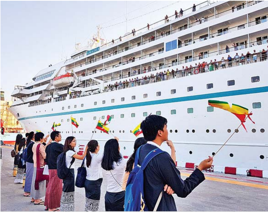
ဂျာမန်ကမ္ဘာလှည့်ခရီးသည်တင် အပျော်စီးသင်္ဘောကြီး ရန်ကုန်မြို့ သီလဝါဆိပ်ကမ်းသို့ ဆိုက်ရောက်လာစဉ်။

ရန်ကုန် ဇန်နဝါရီ ၂၃ ၂၀၁၈ ခုနှစ်အတွင်း မြန်မာနိုင်ငံသို့ ဂျပန်နိုင်ငံ နှင့် အနောက်နိုင်ငံများမှ ကမ္ဘာလှည့် ခရီးသည်တင်သင်္ဘောကြီး ၁၇ စင်း ဝင်ရောက် ခဲ့သည်။