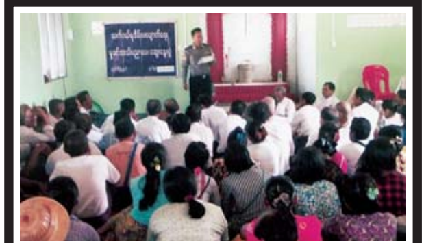
ရန်ကင်းမြောက်ပိုင်းခရိုင် မော်ဘီမြို့နယ် နှော့ကုန်းကျေးရွာ သုခရိပ်ငြိမ်ဓမ္မာရုံတွင် ဇန်နဝါရီ ၂၀ ရက် မွန်းလွဲ ၁ နာရီခွဲ က သက်ငယ်မုဒိမ်းမှုနှင့် မူးယစ်ဆေးဝါး အန္တရာယ်မှကင်းဝေးစေရေး အသိပညာပေးမှုကို ခေတ္တမြို့နယ် ရဲတပ်ဖွဲ့မှူးဒု-ရဲမှူးကျော်စွာ ဟောပြောစဉ်။