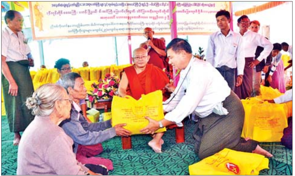
များက စုစုပေါင်းလှူဒါန်းငွေကျပ် သိန်း ၅၃၀ ကျော် လှူဒါန်းခဲ့ကြောင်း သိရသည်။ ဇန်နဝါရီ ၁၉ ရက်နှင့် ၂၀ ရက်ကလည်း ရန်ကုန်မြို့ မှ အထူးကုဆရာဝန်ကြီးများက ဒေးဒရဲမြို့နယ် ထိုင်ကု

လှူဒါန်းမှုတွင် ပန်းလှိုင်စီလုံဆေးရုံကြီး၊ မလိခ ရောဂါရှာဖွေရေးနှင့် အထူးကုဆေးခန်း၊ T.K.W (သုခဝတီ) Trading Co.,Ltd.၊ Shan Cherry Co.,Ltd.၊ Heart သူနာပြုသင်တန်းကျောင်းမှ တာဝန်ရှိသူများနှင့် အလှူရှင်