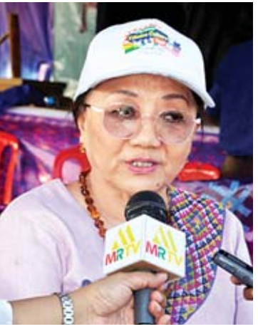
ဒေါ်ကေဂျာနူး