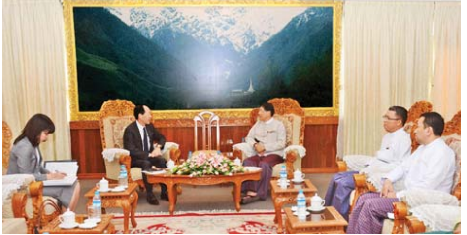
ခြားရေးဝန်ကြီးဌာန သံတမန်ရေးရာ ဦးသန်းစင်နှင့် အထွေထွေအုပ်ချုပ်ရေး ဦးမြင့်သန်းတို့ တက်ရောက်ကြသည်။ ဦးစီးဌာန ညွှန်ကြားရေးမှူးချုပ် ဦးစီးဌာန ခေတ္တညွှန်ကြားရေးမှူးချုပ် သတင်းစဉ်

နေပြည်တော် ဇန်နဝါရီ ၂၃ ပြည်ထောင်စုအစိုးရ အဖွဲ့ဝန်ကြီး ဌာန ပြည်ထောင်စုဝန်ကြီး ဦးမင်းသူ သည် မြန်မာနိုင်ငံဆိုင်ရာ ဂျပန်နိုင်ငံ သံအမတ်ကြီး H.E. Mr. Ichiro Maruyama နှင့်အဖွဲ့အား ယနေ့ ညနေ ၃ နာရီတွင် နေပြည်တော်ရှိ ပြည်ထောင်စုအစိုးရအဖွဲ့ရုံး ဧည့်ခန်းမ၌ လက်ခံတွေ့ဆုံသည်။ တွေ့ဆုံစဉ် ဝန်ကြီးဌာန၏ အုပ်ချုပ်မှု ပြုပြင်ပြောင်းလဲရေးဆိုင်ရာ လုပ်ငန်းများနှင့်စပ်လျဉ်း၍ ခင်မင်ရင်းနှီးစွာ ဆွေးနွေးကြသည်။ အဆိုပါ တွေ့ဆုံပွဲသို့ ပြည်ထောင်စု အစိုးရအဖွဲ့ရုံးဝန်ကြီးဌာန အမြဲတမ်း အတွင်းဝန် ဦးဇော်သန်းသင်း၊ နိုင်ငံ