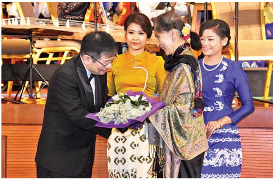
နိုင်ငံတော်၏အတိုင်ပင်ခံပုဂ္ဂိုလ် ဒေါ်အောင်ဆန်းစုကြည် ဂီတမှူး မစ္စတာ ယူနိုဆုက ယာမာမိုတိုအား ဂုဏ်ပြုပန်းစည်း ပေးအပ်စဉ်။