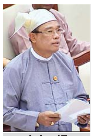
ဆောက်လုပ်ရေးဝန်ကြီးဌာန ဒုတိယဝန်ကြီး ဦးကျော်လင်း

ဒဂုံမြို့သစ်(တောင်ပိုင်း) မဲဆန္ဒနယ်မှ ဦးအေးနိုင်၏ ဒဂုံမြို့သစ်(တောင်ပိုင်း) မြို့နယ်၊ စက်မှုဇုန်(၁)၊ စက်မှုဇုန်(၂)နှင့် စက်မှုဇုန်(၃)နယ်မြေအတွင်းရှိ စက်မှုလက်မှုလုပ်ငန်းရှင်များအတွက် လိုအပ်လျက်ရှိသော စက်ရုံ၊ အလုပ်ရုံ မြေနေရာရရှိရေး မည်ကဲ့သို့ စီစဉ်ဆောင်ရွက်ပေးမည်ကို သိလိုခြင်းနှင့်စပ်လျဉ်း၍ ဆောက်လုပ်ရေးဝန်ကြီးဌာန ဒုတိယဝန်ကြီး ဦးကျော်လင်းက ဒဂုံမြို့သစ်