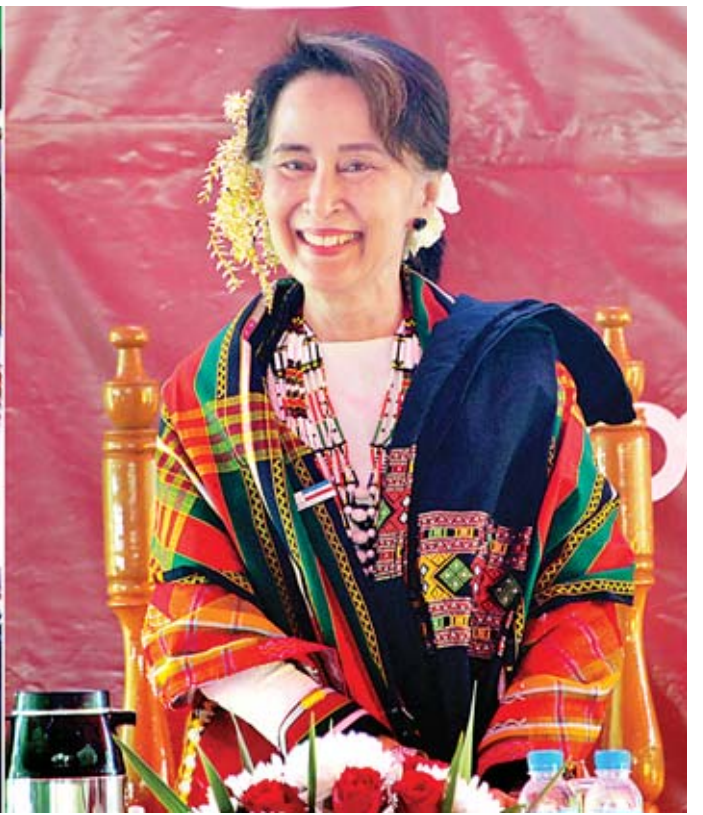
နိုင်ငံတော်၏အတိုင်ပင်ခံပုဂ္ဂိုလ် ဒေါ်အောင်ဆန်းစုကြည် တွန်းပို့ဖြန့်ဖြူး ဟားခါးလေးမြောက်ကျေးရွာတွင် ဒေသခံပြည်သူများနှင့် တွေ့ဆုံစဉ်။