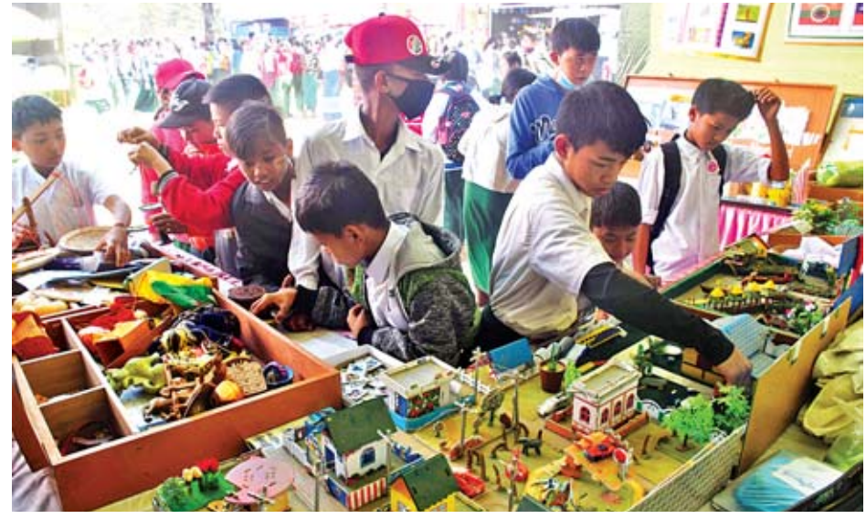
အိမ်တည်ဆောက်မှုပြိုင်ပွဲတွင် ပါဝင်ဆင်နွှဲနေကြသည့် ကျောင်းသားများကို တွေ့ရစဉ်။