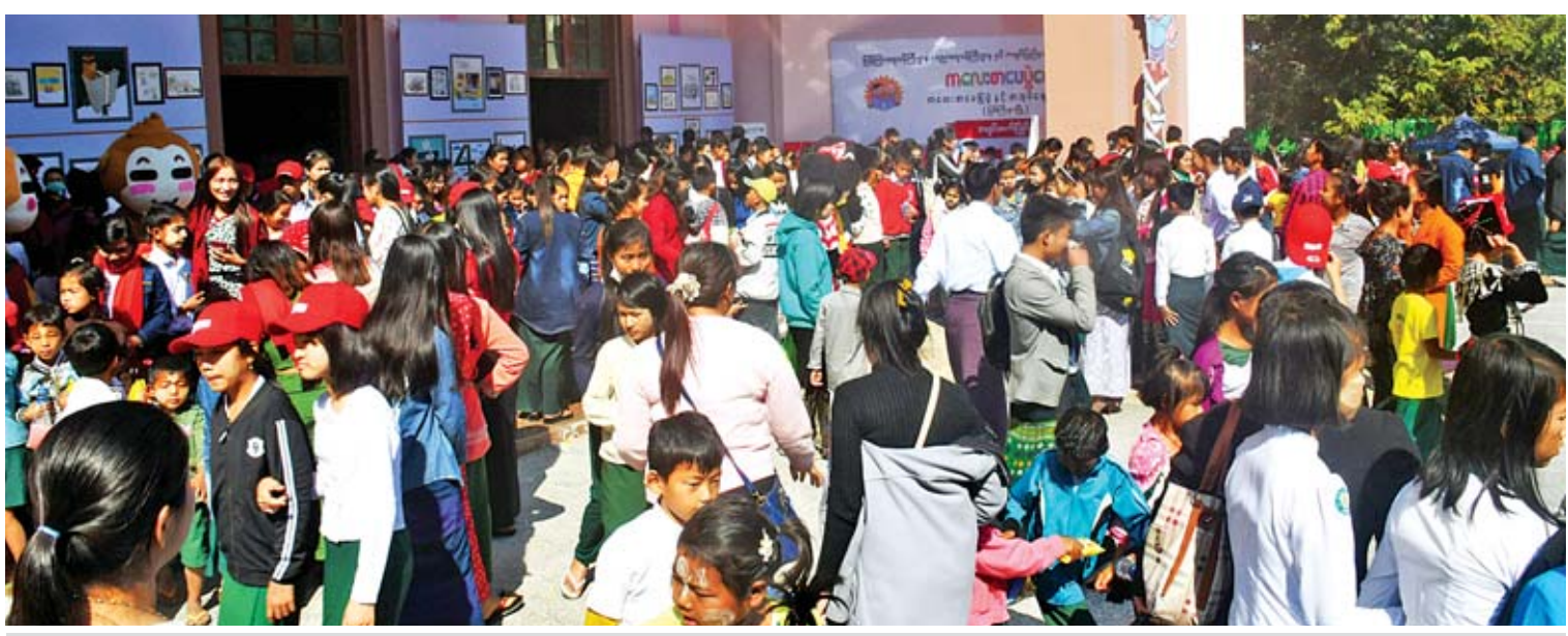
ကလေးစာပေပွဲတော် (မြစ်ကြီးနား)သို့ လာရောက်ကြသည့် ကျောင်းသား ကျောင်းသူများဖြင့် စည်ကားလျက်ရှိသည်ကို တွေ့ရစဉ်။

မြစ်ကြီးနား ဇန်နဝါရီ ၂၂ ကလေးစာပေပွဲတော် ကလေးစာပေပြပွဲနှင့် စာအုပ်ဈေးရောင်းပွဲ နောက်ဆုံးနေ့ကို မြစ်ကြီးနားတက္ကသိုလ် ဘွဲ့နှင်းသဘင်ခန်းမ၌ ယနေ့ဆက်လက်ကျင်းပရာ နံနက်ပိုင်းမှ ပွဲတော်ပိတ်သိမ်းချိန် ညနေ ၅ နာရီအထိ ပွဲတော်လာရောက်သူများဖြင့် စည်ကားလျက် ရှိပြီး ယနေ့ပွဲတော် နောက်ဆုံးနေ့သို့ လာရောက်သူ ခြောက်သောင်းကျော်ရှိခဲ့ကြောင်း သိရသည်။