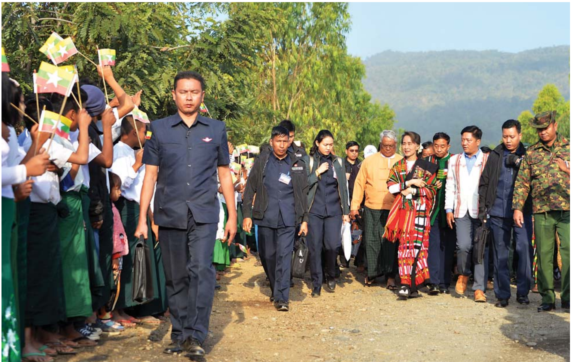
နိုင်ငံတော်၏အတိုင်ပင်ခံပုဂ္ဂိုလ် ဒေါ်အောင်ဆန်းစုကြည် တွန်းငံမြို့နယ် ဆဲဘောက်ကျေးရွာအုပ်စု ဟားခါးလေးမြောက်ကျေးရွာသို့ ရောက်ရှိရာ ဒေသခံပြည်သူများက ကြိုဆိုနှုတ်ဆက်ကြစဉ်။

နေပြည်တော် ဇန်နဝါရီ ၂၂ နိုင်ငံတော်၏အတိုင်ပင်ခံပုဂ္ဂိုလ် ဒေါ်အောင်ဆန်းစုကြည်သည် ပြည်ထောင်စု ဝန်ကြီး ဒုတိယဗိုလ်ချုပ်ကြီးကျော်ဆွေ၊ ဒုတိယဗိုလ်ချုပ်ကြီးရဲအောင်၊ ဦးမင်းသူ နှင့် ဒေါက်တာအောင်သူ၊ စစ်ကိုင်းတိုင်းဒေသကြီးဝန်ကြီးချုပ် ဒေါက်တာမြင့်နိုင်၊ ချင်းပြည်နယ်ဝန်ကြီးချုပ် ဆလိုင်းလျန်လွယ်၊ တာဝန်ရှိသူများနှင့်အတူ ယနေ့ နံနက်ပိုင်းတွင် ကလေးမြို့နယ်ရှိ ရာဇဂြိုဟ်ရေလှောင်တံမံ ဘက်စုံစီမံကိန်းသို့ သွားရောက်ကြည့်ရှုစစ်ဆေးသည်။ ရှေးဦးစွာ နိုင်ငံတော်၏အတိုင်ပင်ခံပုဂ္ဂိုလ် ဒေါ်အောင်ဆန်းစုကြည်သည်