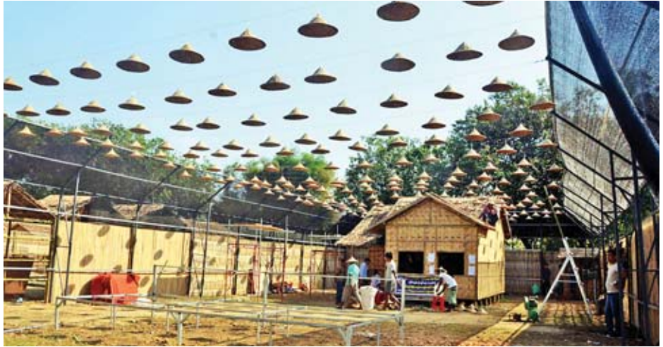
“သွေးချင်းတို့ရဲ့ ပွဲတော်ဆီ” တိုင်းရင်းသားများ၏ ရိုးရာယဉ်ကျေးမှုပြပွဲနှင့် ခရီးသွားလုပ်ငန်းမြှင့်တင်ရေးပွဲတော် ကျင်းပရန် ပြင်ဆင်ဆောင်ရွက်ထားမှုကို တွေ့ရစဉ်။

ဒီပွဲတွေ လုပ်ထားတာကြည့်ပြီး ကျွန်တော်မျှော်လင့်တာ ကတော့ ယုံကြည်မှုတည်ဆောက်တာ၊ တိုင်းရင်းသားတွေ အားလုံး တစ်ယောက်နဲ့တစ်ယောက်က ဥမုတ် သိုက်မပျက် အပေးအယူရှိဖို့လိုတယ်။ တစ်ယောက်နဲ့ တစ်ယောက် ချစ်ခင်ဖို့လိုတယ်။ ဒီပွဲကနေတစ်ဆင့် ကျွန်တော်တို့ရလာ လိမ့်မယ်လို့ မျှော်လင့်ပါတယ်။ (ဆက်လက်ဖော်ပြပါမည်)