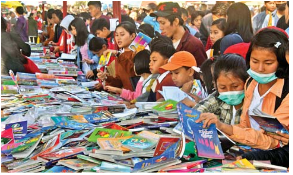
စာအုပ်အရောင်းဆိုင်များမှ စာအုပ်များ ဝယ်ယူဖတ်ရှုနေကြသည့် ကျောင်းသား ကျောင်းသူများကို တွေ့ရစဉ်။