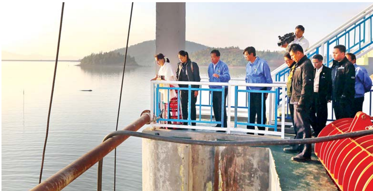
နိုင်ငံတော်၏အတိုင်ပင်ခံပုဂ္ဂိုလ် ဒေါ်အောင်ဆန်းစုကြည် ရာဇဂြိုဟ်ရေလှောင်တံခံ ဘက်စုံစီမံကိန်းကို ကြည့်ရှုစစ်ဆေးစဉ်။

“ကျွန်မတို့ရဲ့ ပြည်သူ ပြည်သားများအားလုံး လုံခြုံခြုံနေနိုင်ဖို့ပါပဲ။ လုံခြုံတယ်ဆိုတာ ကိုယ်ရော၊ စိတ်ရော လုံခြုံရမယ်။ ကျွန်မ ချင်းပြည်နယ်လာတဲ့အခါမှာ အင်မတန်