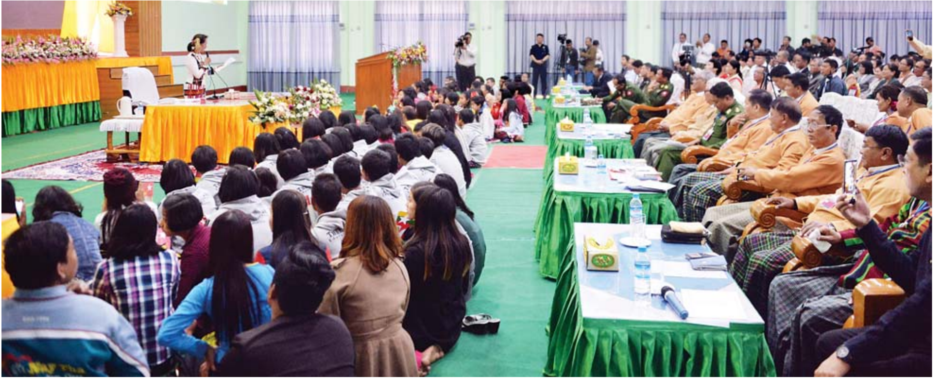
နိုင်ငံတော်၏အတိုင်ပင်ခံပုဂ္ဂိုလ် ဒေါ်အောင်ဆန်းစုကြည် ကလေးမြို့နယ်ခန်းမ၌ ကျင်းပသည့် ဒေသခံပြည်သူများနှင့် တွေ့ဆုံပွဲတွင် အမှာစကားပြောကြားစဉ်။

“တွေ့ဆုံပွဲတွေ လုပ်တဲ့အခါမှာ ကလေးတွေ လူငယ်တွေကို ဖိတ်ရတဲ့ အကြောင်းရင်းက ငယ်ငယ်ကတည်းက ကိုယ့်နိုင်ငံရဲ့ အရေးက ကိုယ်နဲ့ဆိုင်တယ်ဆိုတဲ့စိတ်ဓာတ် မွေးပေးချင်လို့ပါ။ ဒီနိုင်ငံရဲ့ ရှေ့ရေးက အထူးသဖြင့် လူငယ်တွေနဲ့ ဆိုင်တယ်”