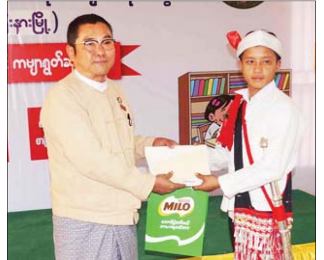
ဗမာတိုင်းရင်းသားရေရာဝန်ကြီး ဦးခင်မောင်မြင့်က ဇိုင်းဝါးတိုင်းရင်းသား မောင်ဇော်မြတ်အောင်အား ဆုလက်ဆောင်ပေးအပ်ချီးမြှင့်စဉ်။