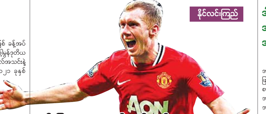
နိုင်ငံခြားကြည့်