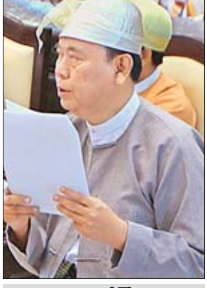
ပညာရေးဝန်ကြီးဌာန ဒုတိယဝန်ကြီး ဦးဝင်းမော်ထွန်း

ချင်းပြည်နယ် မဲဆန္ဒနယ်အမှတ်(၃)မှ ဦးဘွဲ့ခိန်း၏ ချင်းပြည်နယ် ထန်တလန်မြို့နယ် မှောင်တလန်ကျေးရွာ အခြေခံပညာအထက်တန်းကျောင်း(ခွဲ)ကို အခြေခံပညာ အထက်တန်းကျောင်းအဖြစ် အဆင့်တိုးမြှင့်ဖွင့်လှစ်ပေးရန် အစီအစဉ် ရှိ မရှိ မေးခွန်းနှင့်စပ်လျဉ်း၍ ဒုတိယဝန်ကြီး ဦးဝင်းမော်ထွန်းက ချင်းပြည်နယ် ထန်တလန်မြို့နယ် မှောင်တလန်- အခြေခံပညာအထက်တန်းကျောင်း(ခွဲ) တွင် အထက်တန်းဆင့်သင် ကျောင်းသား ကျောင်းသူ (၁၄)ဦးသာရှိပါကြောင်း၊ သို့သော် အနီးဆုံး အထက်တန်းဆင့်သင်ကျောင်းဖြစ်သော ဟရီဖီး- အခြေခံပညာအထက်တန်းကျောင်းနှင့် (၂၅)မိုင်ခန့်ကွာဝေးနေပါကြောင်း။ သို့ဖြစ်ပါ၍ ဒေသခံလူငယ်များ ပညာသင်ယူမှု အခွင့်အလမ်းတိုးမြှင့်ရရှိစေရန်အတွက် ထန်တလန်မြို့နယ် မှောင်တလန်- အခြေခံပညာအထက်တန်းကျောင်း(ခွဲ)ကို ၂၀၁၉-၂၀၂၀ ပညာသင်နှစ်တွင် ကျောင်းအဆင့်တိုးမြှင့်ခြင်းအတွက် စိစစ်ဆောင်ရွက်ပေးမည် ဖြစ်ပါကြောင်း ဖြေကြားသည်။