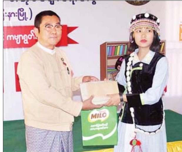
ဗမာတိုင်းရင်းသားရေရာဝန်ကြီး ဦးခင်မောင်မြင့်က လီဆူတိုင်းရင်းသား ခေါင်နောအား ဆုလက်ဆောင်ပေးအပ်ချီးမြှင့်စဉ်။