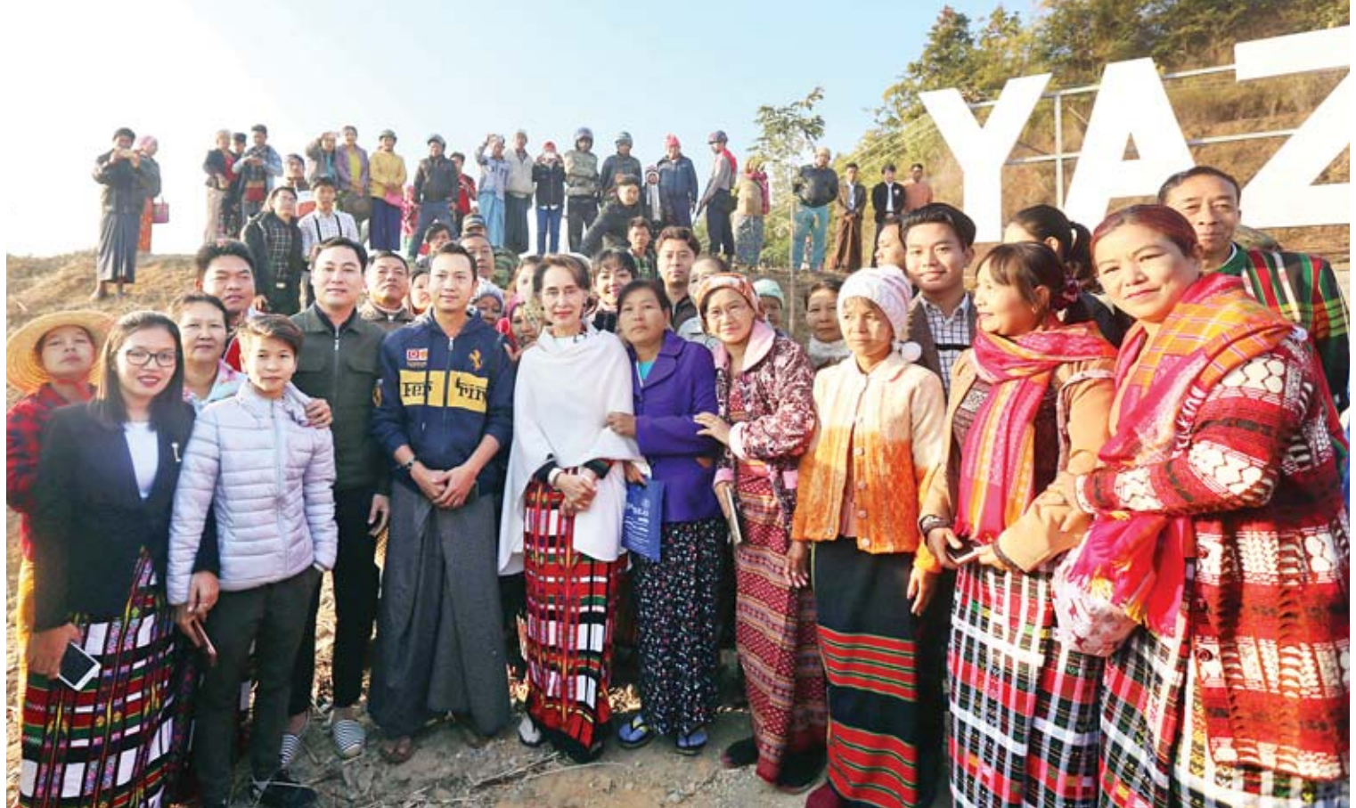
နိုင်ငံတော်၏အတိုင်ပင်ခံပုဂ္ဂိုလ် ဒေါ်အောင်ဆန်းစုကြည် ရာဇဂြိုဟ်ရေလှောင်တံခံအနီးတွင် ဒေသခံပြည်သူများနှင့် အမှတ်တရ စုပေါင်းမှတ်တမ်းတင်ဓာတ်ပုံရိုက်စဉ်။

“ကျွန်မ ပြည်သူတွေနဲ့တွေ့ဆုံတဲ့အခါမှာ အောင်မြင်ခြင်းတရားလေးပါးကို ပြန်ပြီး သတိပေးရပါတယ်။ ဆန္ဒရှိရမယ်၊ ဝီရိယရှိရမယ်၊ မှန်ကန်တဲ့ စိတ်ဓာတ် ရှိရမယ်၊ ပညာရှိရမယ်။ ဒါဟာ ကျွန်မတို့အားလုံး မှတ်သားစရာ ကိစ္စဖြစ်တာကြောင့် ထပ်တလဲလဲ ပြောရတာပါ။ ဆန္ဒရှိမှ ကိစ္စတစ်ခုကို ကျွန်မတို့ စပြီး ဆောင်ရွက်နိုင်မှာပါ”