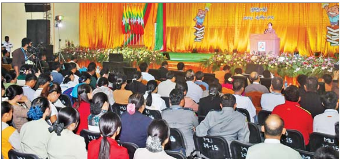
ကချင်ပြည်နယ်ဝန်ကြီးချုပ် ဒေါက်တာခက်အောင် ကလေးစာပေပွဲတော်(မြစ်ကြီးနား)ပိတ်ပွဲအခမ်းအနားတွင် အမှာစကားပြောကြားစဉ်။

ကလေးများ၊ လူငယ်များ စာဖတ်ရန် အရေးကိစ္စသည် နိုင်ငံနှင့်ချီပြီး အရေးပါသည့် ကိစ္စတစ်ခုဖြစ်ပါကြောင်း၊ စာပေဖွံ့ဖြိုးတိုးတက်မှုနှင့်အတူ နိုင်ငံတစ်ခုလုံးလူမျိုးတစ်ခု၏ တိုးတက်မှုသည် ဒွန်တွဲနေပါကြောင်း၊ ကမ္ဘာ့နိုင်ငံများကို လေ့လာကြည့်လျှင် စာပေယဉ်ကျေးမှု ဖွံ့ဖြိုးတိုးတက်ရေးကို မဏ္ဍိုင်တစ်ရပ်အနေဖြင့် အထူးတလည်ဆောင်ရွက်နေကြသည်ကို တွေ့ရမည်ဖြစ်ပါကြောင်း၊ မိမိတို့နိုင်ငံ ဖွံ့ဖြိုးတိုးတက်ရေးသည် စာပေယဉ်ကျေးမှုဖွံ့ဖြိုး တိုးတက်ရေးနှင့် ဆက်စပ်နေပါကြောင်း၊ စာဖတ်မှသာ ဉာဏ်ရည်ဖွံ့ဖြိုးတိုးတက်ပြီး စဉ်းစားတွေးခေါ်မှုနှင့် စိတ်ဓာတ်ခွန်အား ရင်သန်မည်ဖြစ်ပါကြောင်း။