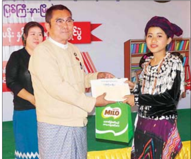
ဗမာတိုင်းရင်းသားရေရာဝန်ကြီး ဦးခင်မောင်မြင့်က ဂျိမ်းဖောတိုင်းရင်းသား ဂျာဒိမ်အား ဆုလက်ဆောင်ပေးအပ်ချီးမြှင့်စဉ်။