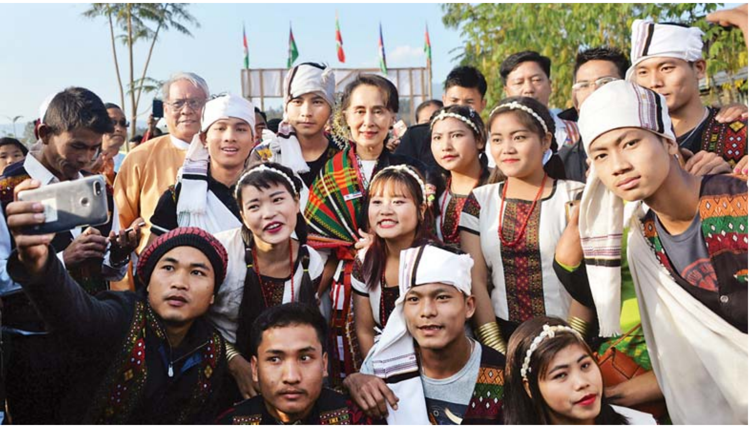
နိုင်ငံတော်၏အတိုင်ပင်ခံပုဂ္ဂိုလ် ဒေါ်အောင်ဆန်းစုကြည် ဟားခါးလေးမြောက်ကျေးရွာတွင် ချင်းတိုင်းရင်းသား တိုင်းရင်းသူများနှင့်အတူ စုပေါင်းမှတ်တမ်းတင်ဓာတ်ပုံရိုက်စဉ်။

“ကျွန်မတို့ဟာ ပြည်ထောင်စုရဲ့ မိသားစုဝင်တွေပဲ။ ပြည်ထောင်စုရဲ့မိသားစုဝင်တွေဟာ ကျွန်မတို့နိုင်ကြီး၊ ကျွန်မတို့ ပြည်ထောင်စုကြီး ငြိမ်းချမ်းသာယာပြောဖို့