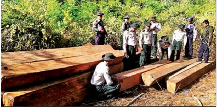
မြန်မာနိုင်ငံအတွင်း တရားမဝင်သစ်များ ဖမ်းဆီး ဆောင်ရွက်ရာတွင် ဒေသခံပြည်သူများ ပူးပေါင်းပါဝင် သော သတင်းပေးစနစ်ဖြင့်လည်းကောင်း၊ သဘာဝ သစ်တောများ ကာကွယ်နိုင်ရေးအတွက် အသိပညာ ပေးဆောင်ရွက်မှုများကြောင့် ဇန်နဝါရီလ တတိယ ပတ်အတွင်း မကွေးတိုင်းဒေသကြီး ကံမမြို့နယ် အတွင်း၌ တရားမဝင်သစ်တန် ၁၀၀ ကျော် ဖော်ထုတ် ဖမ်းဆီးနိုင်ခဲ့ကြောင်း သိရသည်။