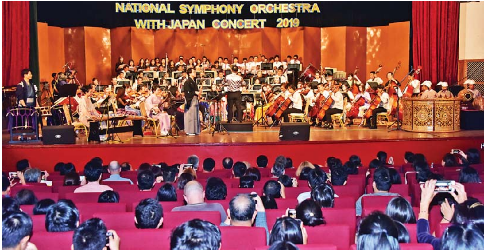
ရန်ကုန်မြို့ အမျိုးသားဇာတ်ရုံ၌ မြန်မာ-ဂျပန် ဂီတပွဲတော် (၂၀၁၉) ကျင်းပစဉ်။

ရန်ကုန် ဇန်နဝါရီ ၁၈ နိုင်ငံတော်သံစုံတီးဝိုင်းနှင့် ဂျပန်နိုင်ငံမှ Mr. Yunosoke Yamamoto (Conductor & Composer) ဦးဆောင်သော ဂီတအနုပညာရှင်အဖွဲ့တို့ ပူးပေါင်းတင်ဆက်သည့် မြန်မာ-ဂျပန် ဂီတပွဲတော်(၂၀၁၉)ကို ယနေ့ညပိုင်းက ရန်ကုန်မြို့ ဒဂုံမြို့နယ်ရှိ အမျိုးသားဇာတ်ရုံ၌ စည်ကားသိုက်မြိုက်စွာ ကျင်းပသည်။ အဆိုပါဂီတပွဲတော်သို့ ရန်ကုန်တိုင်းဒေသကြီးဝန်ကြီးချုပ် ဦးပြုံးမင်းသိန်း၊ တိုင်းဒေသကြီး ဥပဒေချုပ် ဒေါ်ခင်မျိုးကြည်၊ ရန်ကုန်မြို့တော်ဝန် ဦးမောင်မောင်စိုး၊ ရန်ကုန်တိုင်းဒေသကြီး ရခိုင်တိုင်းရင်းသား လူမျိုးရေးရာဝန်ကြီး ဦးဇော်အေးမောင်၊ မြန်မာ့အသံနှင့် ရုပ်မြင်သံကြား ညွှန်ကြားရေးမှူးချုပ် ဦးမြင့်ထွေး၊ နိုင်ငံခြားရေးဝန်ကြီးဌာန မဟာပူဇော်လောလောရေးနှင့် လေ့ကျင့်ရေးဦးစီးဌာန ညွှန်ကြားရေးမှူးချုပ် ဒေါ်ကေသီစိုး၊ မြန်မာနိုင်ငံဆိုင်ရာ ဂျပန်သံအမတ်ကြီး H.E. Mr. Ichiro Maruyama နှင့် သံရုံးတာဝန်ရှိသူများ၊ နိုင်ငံခြားသံရုံးများမှ စာမျက်နှာ ၁၃ ကော်လံ ၁ သို့ ❖