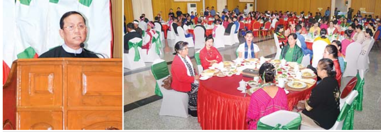
ပြည်ထောင်စုဝန်ကြီး ဒုတိယဗိုလ်ချုပ်ကြီးရဲအောင် နယ်စပ်ဒေသလေ့လာရေးအဖွဲ့ဝင်များအား ဂုဏ်ပြုနှုတ်ဆက်စကားပြောကြားစဉ်။