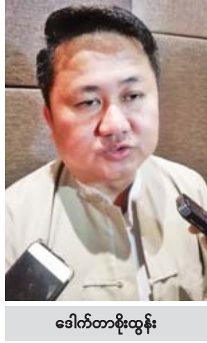
ဒေါက်တာစိုးထွန်း

ပြီးခဲ့တဲ့ရက်ပိုင်းက မြန်မာနိုင်ငံနဲ့ ကမ္ဘောဒီးယား နိုင်ငံတို့ကို အီးယူကပေးထားတဲ့ GSP ကို ပြန်လည်ရုပ်သိမ်း လိုက်ပါတယ်။ ဒါကတော့အီးယူမှာ ဆန်စပါးစိုက်ပျိုးထုတ် လုပ်တဲ့နိုင်ငံတစ်နိုင်ငံက သူတို့လယ်သမားတွေ ထိခိုက် တယ်လို့ အီးယူကိုတင်ပြခဲ့ပါတယ်။ ဒါနဲ့ပတ်သက်လို့အီးယူ က မြန်မာနိုင်ငံကိုလာရောက်ဆွေးနွေးမှုတွေပြုလုပ်ခဲ့တာ လည်းရှိပါတယ်။ ကျွန်တော်တို့အနေနဲ့ ပြန်ကြည့်မယ်ဆိုရင် ဆန်တင်ပို့မှုက အီးယူနိုင်ငံတွေကို ဆန်တန်ချိန် သုံးသိန်းခွဲ လောက်တင်ပို့တယ်။ စုစုပေါင်း မြန်မာနိုင်ငံကပြီးခဲ့တဲ့နှစ်မှာ ဆန်တန်ချိန် သုံးသိန်းခွဲ တင်ပို့တာဖြစ်လို့ အီးယူကိုတို့တာ စုစုပေါင်းတင်ပို့မှုရဲ့ ၁၀ ရာခိုင်နှုန်းပဲရှိပါတယ်။ တင်ပို့တဲ့ ဆန်က ဆန်ကွဲများပါတယ်။ ဆန်ရှည်ဆန်ကောင်းက တန်ချိန် ငါးသောင်းလောက်ပဲရှိပါတယ်။ ဒီပမာဏကများ တယ်လို့မဆိုနိုင်ပါဘူး။ များတာက ကမ္ဘောဒီးယားနိုင်ငံ ကပိုများတယ်။ ဆန်ရှည်ပိုတာများပါတယ်။ ဒါကြောင့်မို့လို့ ဈေးကွက် ဘယ်လိုဖြစ်သွားမလဲဆိုတာ မေးစရာရှိပါတယ်။ ဒါကတော့အပိုင်းနှစ်ပိုင်းရှိပါတယ်။ အီးယူကိုတင်ပို့နေတဲ့ ကုမ္ပဏီကိုမေးရင်တော့ ထိခိုက်တယ်လို့ပြောမှာပေါ့။ သို့သော်လည်း ဆန်ကွဲတင်ပို့နေတဲ့သူကို မေးရင်တော့ မထိခိုက်ဘူးလို့ပြောပါလိမ့်မယ်။ တန်ချိန် သုံးသိန်းခွဲမှာ တန်ချိန် ငါးသောင်းလောက်ပဲ ဆန်ချောဆိုတော့ GSP ဖြုတ်လိုက်လည်းအများကြီး ထိခိုက်သွားတာမဟုတ်ဘူးလို့ ထင်ပါတယ်။ ကျွန်တော်တို့ရဲ့ အဓိကတင်ပို့နေတဲ့နိုင်ငံ ကတော့ နယ်စပ်ကနေတစ်နိုင်ငံကို တင်ပို့နေတာပါ။ စုစုပေါင်းတင်ပို့မှုရဲ့ ၆၀ ရာခိုင်နှုန်းရှိပါတယ်။ ဒါပေမယ့်