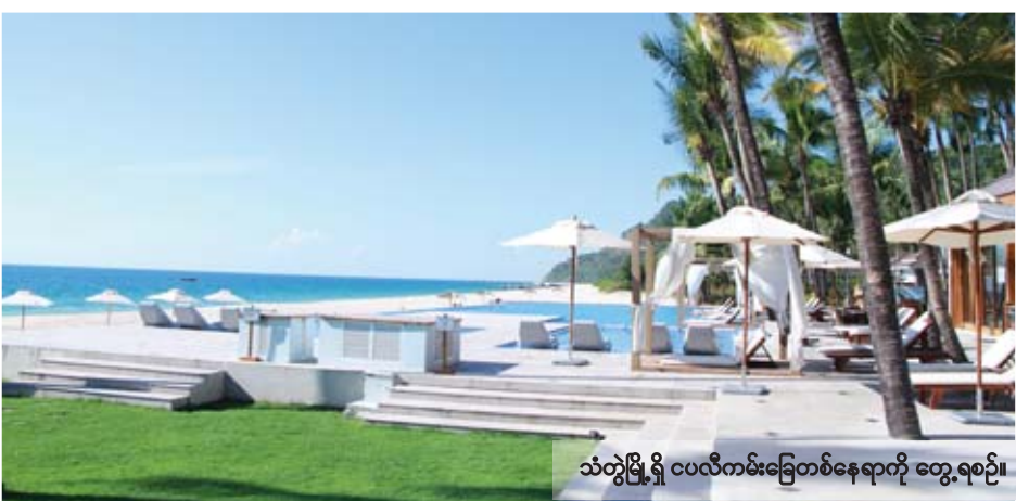
သံတွဲမြို့ရှိ ငပလီကမ်းခြေတစ်နေရာကို တွေ့ရစဉ်။