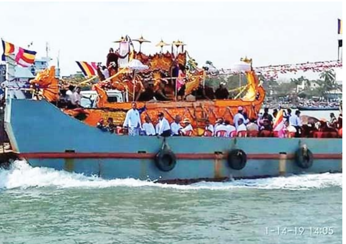
ဆရာတော်ဘဒ္ဒန္တအရှင်ဉာဏစက္ကမ၏ ရုပ်ကလာပ်တော်ကို ဇန်နဝါရီ ၁၃ ရက်က စစ်တွေမြို့၊ အောင်သန်းကျောင်း(ယာယိစ်ကျောင်း) မှ ပေါက်တောမြို့သို့ ဇက်သင်္ဘောဖြင့် ပင့်ဆောင်လာစဉ်။

ရခိုင်ကျောင်းဆရာတော်ဟု လူသိများသော ဆရာတော်ကြီး ဘဒ္ဒန္တအရှင်ဉာဏစက္ကမထေရ်မြတ်သည် ရခိုင်ပြည်နယ် ပေါက်တောမြို့၊ တောင်ချောင်းကျေးရွာဇာတိဖြစ်သည်။ အကျင့်သီလ၊ သိက္ခာ၊ သမာဓိနှင့် ပြည့်စုံသောကြောင့် ကြည်ညိုလှပေပေးခဲ့ပြီး မြန်မာပြည်အနှံ့ ဆရာတော်ကြီး၏ သာသနာပြုလုပ်ငန်းများ အထူးအောင်မြင်ခဲ့သည်။ ဆရာတော်ကြီးသည် ၂၀၁၄ ခုနှစ် သက်တော် ၉၂ နှစ်မှာပင် မန္တလေးတိုင်းဒေသကြီး ပြင်ဦးလွင်မြို့ မြို့မပဒေသာရပ်ကွက် ရေချမ်းစင်ခရီးတောင်၌ အေးရိပ်သာကျောင်းတိုက်တစ်ခုကို သာသနာ့မျိုးစေ့ချပေးခဲ့နိုင်သလို ရခိုင်ပြည်နယ်၊ ရန်ကုန်တိုင်းဒေသကြီး၊ မန္တလေးတိုင်းဒေသကြီး၊ ရှမ်းပြည်နယ် စသည်တို့တွင်လည်း ကျောင်းတိုက်ပေါင်း ၅၂ ကျောင်း ထူထောင်ပြီး သာသနာ့မျိုးစေ့ချပေးခဲ့သည်။ ဆရာတော်ကြီး အရှင်ဉာဏစက္ကမသည် ရန်ကုန်မြို့၊ ပုလဲမြို့သစ် ဉာဏရွာရှိ မင်္ဂလာသီရိကျောင်းမှ မန္တလေးတိုင်းဒေသကြီး တံတားဦးလေဆိပ်အနီး စကားကင်းကျေးရွာရှိ မင်္ဂလာဇေယျကျောင်းတိုက်သို့ ပြောင်းရွှေ့သီတင်းသုံးတော်မူခဲ့သည်။ ဆရာတော်ကြီးသည် နေရာသီသုံးလခန့်တွင် တံတားဦးရှိ မင်္ဂလာဇေယျကျောင်းတိုက်မှ ပြင်ဦးလွင်မြို့ ပဒေသာမြို့သစ် အေးရိပ်သာကျောင်းတိုက်၌ ကြွရောက်သီတင်းသုံးကာ ဒါယကာ၊ ဒါယိကာမများအား တရားဟော၊ တရားပြကာ ကုသိုလ်ပွားစေခဲ့သည်။ ကျေးဇူးတော်ရှင်ကမ္မဋ္ဌာနာစရိယ ဆရာတော်ကြီး ဘဒ္ဒန္တဉာဏစက္ကမသည် မန္တလေးတိုင်းဒေသကြီး တံတားဦးလေဆိပ်အနီး စကားကင်းကျေးရွာရှိ မင်္ဂလာဇေယျကျောင်းတိုက်တွင်