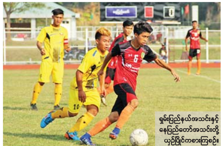
ရှမ်းပြည်နယ်အသင်းနှင့် နေပြည်တော်အသင်းတို့ ယှဉ်ပြိုင်ကစားကြစဉ်။

နေပြည်တော် ဇန်နဝါရီ ၁၈ ကျန်းမာရေးနှင့်အားကစားဝန်ကြီးဌာန အားကစားနှင့် ကာယပညာဦးစီးဌာနနှင့် မြန်မာနိုင်ငံဘောလုံးအဖွဲ့ချုပ်တို့ပူးပေါင်း၍ ၂၀၁၉ ခုနှစ် တိုင်းဒေသကြီးနှင့် ပြည်နယ် အသက်(၂၁)နှစ်အောက် ဘောလုံးပြိုင်ပွဲကို ယနေ့ညနေ ၃ နာရီတွင် ဝဏ္ဏသိဒ္ဓိလေ့ကျင့်ရေးကွင်း(၁)၌ ရှမ်းပြည်နယ်အသင်းနှင့် နေပြည်တော်အသင်းတို့ ယှဉ်ပြိုင်ကြရာ အချိန်ပိုအထိ ဝိုင်းမရှိသရေကျသဖြင့် ပင်နယ်တီအဆုံးအဖြတ်ခံယူရာ နေပြည်တော်အသင်းက ရှမ်းပြည်နယ်အသင်းကို ခြောက်ဂိုး-ငါးဂိုးဖြင့် လည်းကောင်း၊ ဝဏ္ဏသိဒ္ဓိလေ့ကျင့်ရေးကွင်း(၃)၌ တနင်္သာရီတိုင်းဒေသကြီးအသင်းနှင့် ချင်းပြည်နယ်အသင်းတို့ ယှဉ်ပြိုင်ကြရာ စာမျက်နှာ ၁၃ ကော်လံ ၁ သို့ ❖