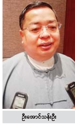
ဦးအောင်သန်းဦး