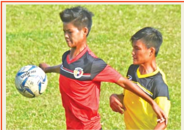
မြဝတီနှင့် သစ္စာအားမာန်အသင်း ယှဉ်ပြိုင်နေစဉ်။