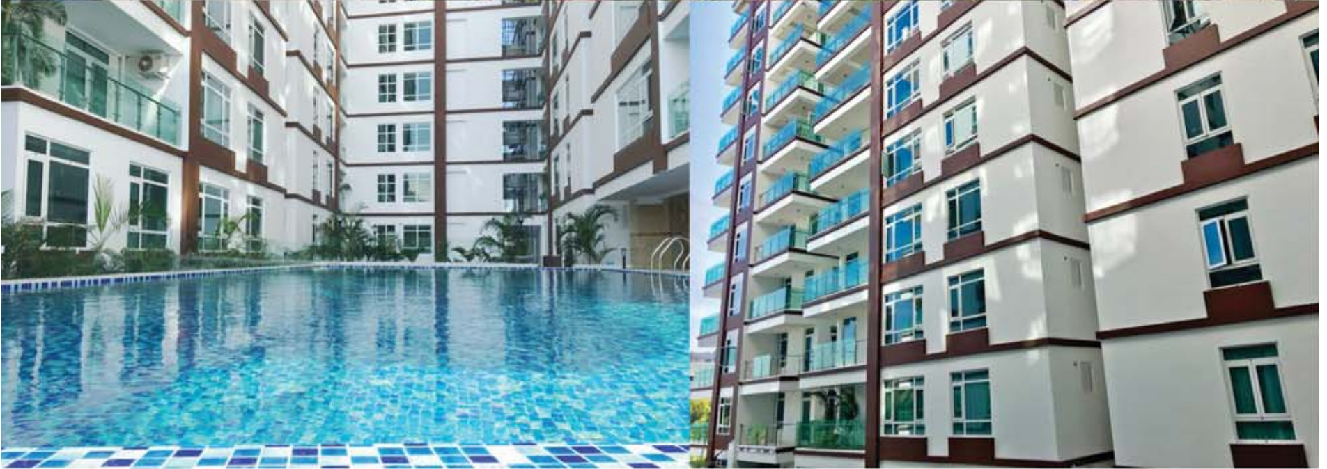
အမှတ်(၁၅)၁၅-က) မွှာရုံလမ်း လှိုင်မြို့နယ်တွင် တည်ရှိသော ROYAL MAUNG BAMAR RESIDENCE ရှိ အခန်းများကို ရောင်းချပေးနေပြီဖြစ်ပါသဖြင့် လာရောက်လေ့လာဝယ်ယူနိုင်ပါကြောင်း အားပေးသူမိတ်ဟောင်းမိတ်သစ်များအား အသိပေးအကြောင်းကြားအပ်ပါသည်။