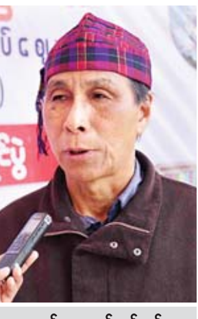
အင်ဘောဘွမ်ဇော်လွမ်း

ယဉ်ကျေးမှုအသင်းအနေနဲ့ ကလေး စာပေပွဲတော်မှာ ရဝမ်လူမျိုးတွေ အားလုံးရဲ့ကိုယ်စား ရဝမ်စာပေ ပေါ်ပေါက်လာပုံ၊ ဘိုးဘေးဘီဘင် လူကြီးတွေရဲ့ စာတတ်ပုံတွေ၊ ရိုးရာ ယဉ်ကျေးမှုဆိုင်ရာ လှုပ်ရှားမှုစာတတ်ပုံ တွေ၊ ရိုးရာဝတ်စုံတွေနဲ့ ရိုးရာအသုံး အဆောင်ပစ္စည်းတွေ ပြသသွားမှာ ဖြစ်ပါတယ်။ ကျွန်တော်တို့မှာ စာပေပေး၊ ဘာသာ စကားရေး၊ နေထိုင်ရာဒေသရော သုံးမျိုးစလုံး ပြည့်စုံစွာ တည်ရှိနေပါ တယ်။ ဒါကြောင့်မို့ ကျွန်တော်တို့ ရဝမ်လူမျိုးမပျောက်အောင် စာပေကို ထိန်းသိမ်းဖို့ တာဝန်ရှိပါတယ်။ ဒီလို ထိန်းသိမ်းတဲ့နေရာမှာ ကျွန်တော်တို့ အခုလိုပြပွဲတွေ လုပ်ပေးတဲ့အတွက် ဝမ်းသာတယ်။ ဆက်လက်ပြီး ထိန်းသိမ်းဖို့လည်း ခွန်အားရပါတယ်။ ဒီလိုမျိုးခွန်အားတွေကြောင့် ကျွန်တော် တို့ စာပေ၊ ယဉ်ကျေးမှုတွေကို ဆက်ပြီး ထိန်းသိမ်းသွားမှာပါ။ ဒီလိုထိန်းသိမ်းနိုင်ဖို့အတွက် ရဝမ် စာပေကို နေရာသီကျောင်းပိတ်ရက် တွေမှာ ကလေးတွေကို သင်ကြားပေး ပါတယ်။ ရဝမ်လူမျိုးတွေ ၉၉ ရာခိုင် ရှုန်းဟာ ခရစ်ယာန်တွေဖြစ်တဲ့အတွက် ကြောင့် ဘုရားကျောင်းတွေမှာ နှစ်စဉ် နှစ်တိုင်း ရဝမ်စာပေတွေကို သင်ကြားပေးလျက်ရှိပါတယ်။ အခု အခြေခံပညာကျောင်းတွေမှာ သင်ကြား ပေးဖို့အတွက် ကြိုးစားဆောင်ရွက်တဲ့ နေရာမှာ ဒေသသင်ရိုးနဲ့အတူ တိုင်းရင်းသားစာပေ သင်ကြားဖို့ ဆောင်ရွက်နေတယ်။ နောင်ကျရင်