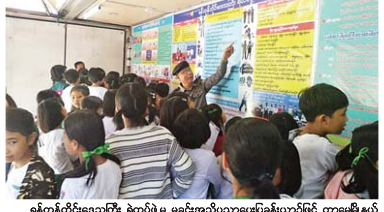
ရန်ကုန်တိုင်းဒေသကြီး ရဲတပ်ဖွဲ့မှ မှုခင်းအသိပညာပေးပြခန်းယာဉ်ဖြင့် တာမွေမြို့နယ် မြို့နယ်မှ ရဲတပ်ဖွဲ့မှ လူတန်းကျော်နှင့်အဖွဲ့၊ ယာဉ်ထိန်းတပ်ဖွဲ့နှင့် လူကုန်ကူးမှု တားဆီးကာကွယ်ရေး တပ်ဖွဲ့တို့မှ တာဝန်ရှိသူများက ဇန်နဝါရီ ၁၇ ရက် နံနက်ပိုင်းတွင် တာမွေမြို့နယ် အထက ၄ ကျောင်းမှ ကျောင်းအုပ်ဆရာမကြီးနှင့် ဆရာမ၊ ကျောင်းသူပေါင်း ၄၀၀ ကျော်တို့အား လက်ကမ်း စာစောင်များ ဖြန့်ဝေခဲ့ပြီး မှုခင်းအသိပညာပေး လောပြောစဉ်။ (ငွေ့နိုင်)