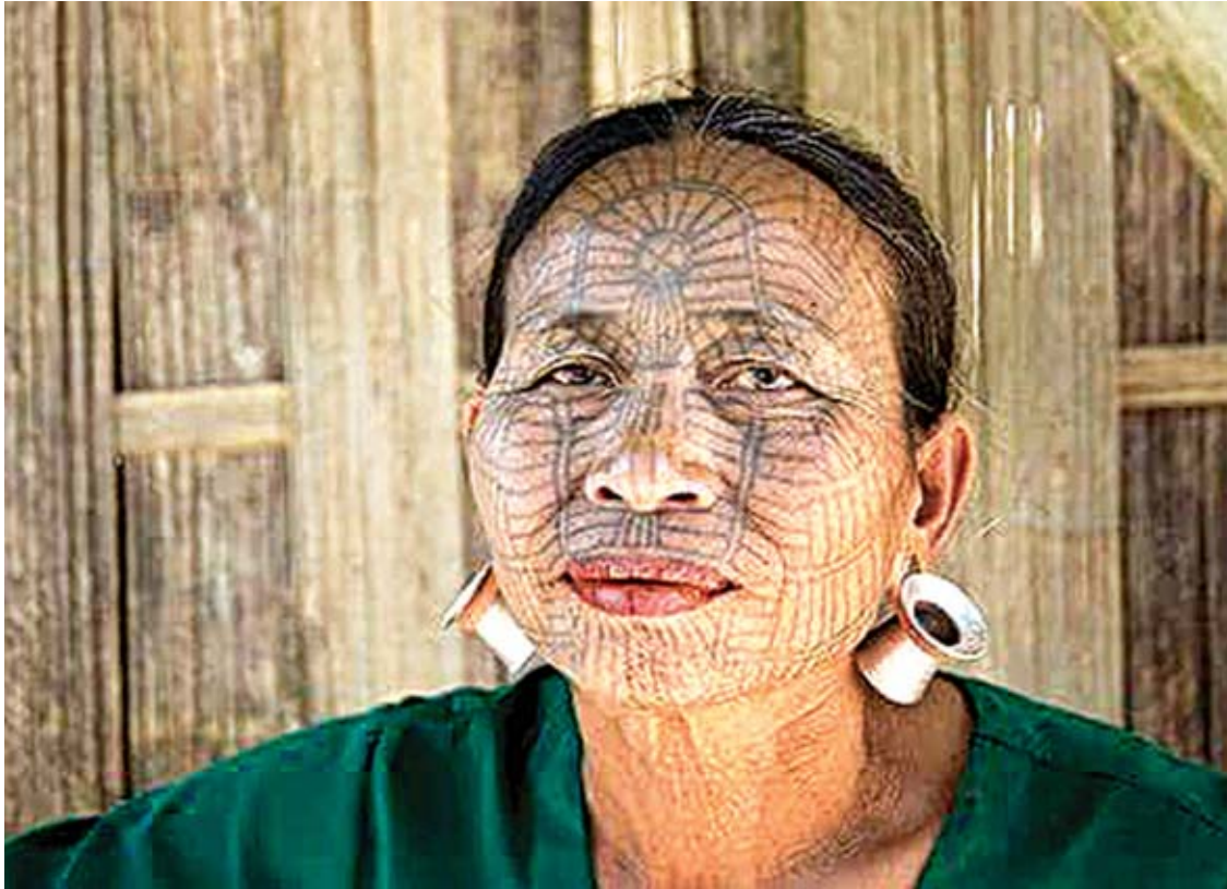
Daar)၊ ချင်းပုံ(Chinpung) တို့တွင် မျက်နှာ ဒိုင်ရ်မျိုးနွယ်စုဘာသာစကားတွင် ပါးရဲကို ရိုးရာခလေ့ဖြစ်သည်။ ခြေသလုံးနှစ်ဖက်၊ မာန်(Ng'mang)ဟုခေါ်ပြီး ထင်ရှားသည့် နဖူးနှင့် လက်ခလယ် သို့မဟုတ် လက်သူ

ကမ္ဘာပေါ်ရှိလူမျိုး(သို့မဟုတ်)လူမျိုးနွယ်စုများ၌ စိတ်ဝင်စားဖွယ်ကောင်းသော ရိုးရာခလေ့များရှိကြပါသည်။ ၎င်းတို့အနက် ဒိုင်ရ်ချင်းတို့၏ မျက်နှာပါးရဲထိုးခြင်း ခလေ့သည်လည်း စိတ်ဝင်စားဖွယ် ခလေ့တစ်ခုဖြစ်ပါသည်။ ပါးရဲထိုးသည်ပုံစံများမှာ မတူညီကြသော်လည်း အာဖရိက၊ တရုတ်နှင့် အိန္ဒိယစသည့် နိုင်ငံများရှိ တချို့လူမျိုးနွယ်စုများတွင် ပါးရဲထိုးခလေ့များရှိခဲ့ကြောင်း သိရှိရသည်။ မြန်မာနိုင်ငံရှိ နာဂ၊ ချင်း၊ ဗမာနှင့် ရှမ်းတို့တွင်လည်း ပါးရဲထိုးခြင်းခလေ့ရှိခဲ့သည်။ ရှမ်းနှင့် ဗမာတို့တွင် ကိုယ်ခန္ဓာအစိတ်အပိုင်းများတွင် ထိုးထားကြသည်ကိုတွေ့ရှိရပြီး နာဂလူမျိုးတချို့တွင်မူ အမျိုးသား အမျိုးသမီးမခွဲခြားသည့်အပြင် မျက်နှာတွင်သာမက ခန္ဓာကိုယ်တွင်လည်း ထိုးလေ့ရှိကြောင်း လေ့လာသိရှိနိုင်သည်။ ချင်းလူမျိုးတွင် အမျိုးသမီးများကသာ မျက်နှာမှာ ပါးရဲထိုးလေ့ရှိကြသည်။ ချင်းပြည်နယ်တောင်ပိုင်းနှင့် အရှိုချင်းမျိုးနွယ်စုတချို့တွင်တွေ့ရှိနိုင်သည်။ ချင်းမျိုးနွယ်စုများမှ စုမ်းတူ(Sum-tu)၊ လိုင်းတူ(Laitu)၊ ဒိုင်ရ်(Daai)၊ မွင်း(Muun)၊ ကာန်း(Kaang)၊ အုတ်ပူ(Utpu)၊ ငါရာ(Ng'yah)၊ ယင်ဒူး(Yindu)သို့မဟုတ် ယင်ဒူးဒါလ် (Yindu