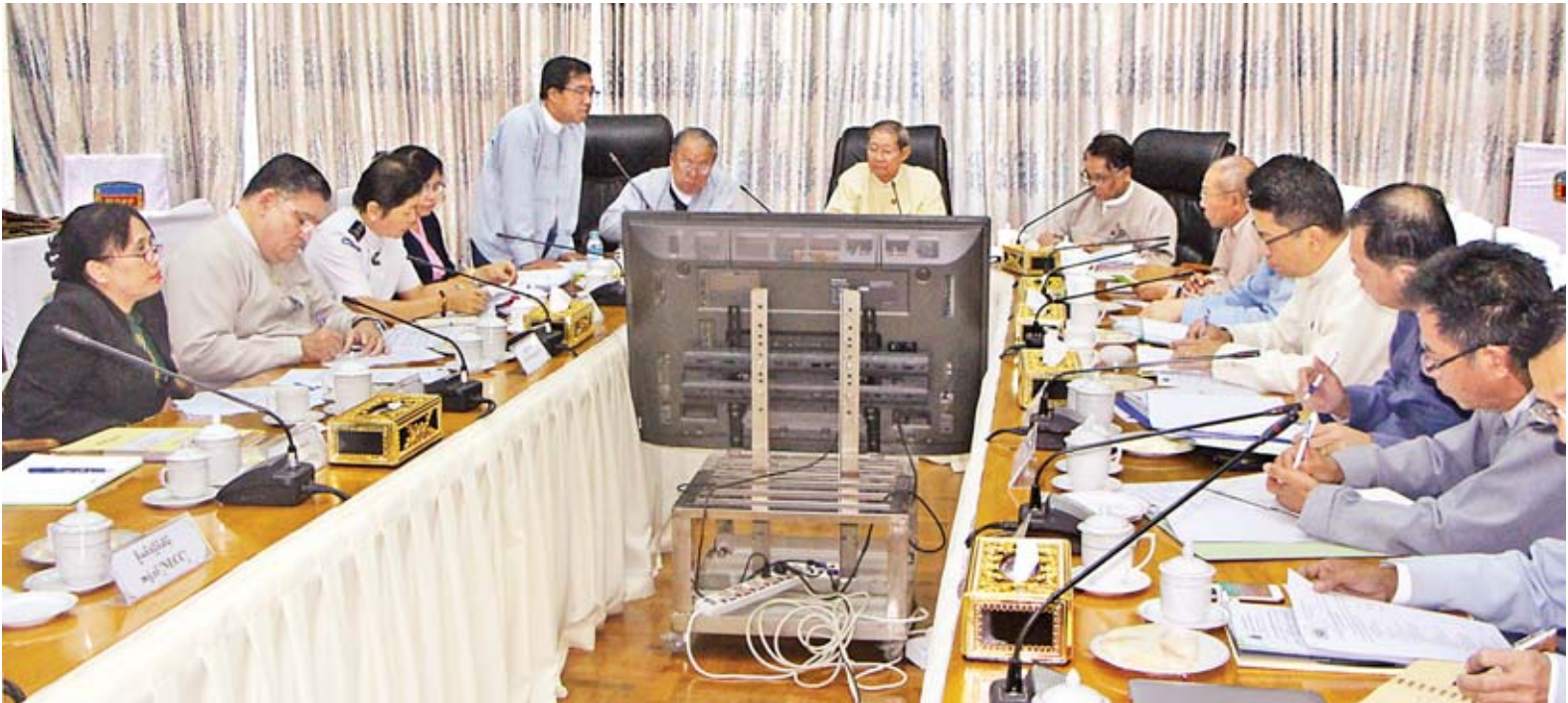
နိုင်ငံတော်ငွေပေးချေမှုကြီးကြပ်မှုကော်မတီ ပထမအကြိမ် အစည်းအဝေးကျင်းပစဉ်။

နေပြည်တော် ဇန်နဝါရီ ၁၈ မြန်မာနိုင်ငံ၏ ငွေပေးချေမှုလုပ်ငန်းများကို မဟာဗျူဟာအဆင့်တွင် ကြီးကြပ်ရန်အတွက် “နိုင်ငံတော်ငွေပေးချေမှုစနစ်ကြီးကြပ်မှုကော်မတီ (National Payment System Governing Committee)” ၏ ပထမအကြိမ်အစည်းအဝေးကို စီမံကိန်းနှင့်ဘဏ္ဍာရေးဝန်ကြီးဌာန အစည်းအဝေးခန်းမ၌ ယမန်နေ့ မွန်းလွဲ ၃ နာရီခွဲတွင် ကျင်းပသည်။ အစည်းအဝေးတွင် ကော်မတီဥက္ကဋ္ဌ စီမံကိန်းနှင့်ဘဏ္ဍာရေးဝန်ကြီးဌာန ပြည်ထောင်စုဝန်ကြီး ဦးစိုးဝင်းက မြန်မာနိုင်ငံငွေပေးချေမှုစနစ်အကောင်အထည် ပေါ်လာရေးနှင့်အမျိုးမျိုးပြည့်စုံစေရန် နေ့စဉ်ငွေပေးချေမှုများတွင် ထိထိရောက်ရောက် လက်တွေ့အသုံးချသည့် ငွေပေးချေမှုစနစ်ဖြစ်ရေးအတွက် နိုင်ငံတော်အဆင့်မှ ကြီးကြပ်ဖော်ဆောင်ရေး၊ ငွေပေးချေမှုစာမျက်နှာ ၁၁ ကော်လံ ၁ သို့ *