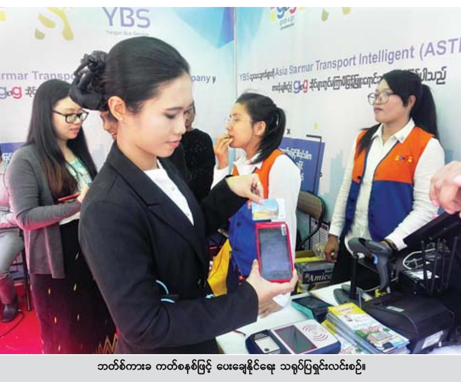
ဘတ်စ်ကားခ ကတ်စနစ်ဖြင့် ပေးချေနိုင်ရေး သရုပ်ပြရှင်းလင်းစဉ်။ သွားရန်စီစဉ်ဆောင်ရွက်လျက်ရှိကြောင်း၊ YPS (Yangon Payment Service) ကတ်စနစ်ကို Asia Starmar Transport ကုမ္ပဏီက တာဝန်ယူဆောင်ရွက်သွားမည် ဖြစ်ကြောင်း သိရသည်။ စတင်အသုံးပြု “ကျွန်မတို့ ကုမ္ပဏီအနေနဲ့ ပထမသုံးလမှာတော့

ရန်ကုန် ဇန်နဝါရီ ၁၆ ရန်ကုန်မြို့ပြ ခရီးသွားပြည်သူများအနေဖြင့် ဘတ်စ်ကား စီးခပေးပေးဆောင်ရာတွင် ငွေသားကျပ်ငွေကို ပုံးထဲသို့ ထည့်ရသည့်စနစ်မှ ကတ်စနစ်အသုံးပြုပေးချေမှုစနစ် တစ်ရပ် မကြာမီ စတင်နိုင်တော့မည်ဖြစ်ကြောင်း ရန်ကုန် တိုင်းဒေသကြီးဝန်ကြီးချုပ် ဦးမြိုးမင်းသိန်းက ပြောကြား သည်။ ပြောကြား ရန်ကုန်တိုင်းဒေသကြီး သယ်ယူပို့ဆောင်ရေး ကြီးကြပ်ကွပ်ကဲမှုအာဏာပိုင်အဖွဲ့ YRTA နှစ်နှစ်ပြည့် နှစ်ပတ်လည် အခမ်းအနားကို ယနေ့နံနက်ပိုင်းက စတင် စတားတိုတယ်၌ ကျင်းပစဉ် ဝန်ကြီးချုပ်ကအထက်ပါ အတိုင်း ထည့်သွင်းပြောကြားခြင်း ဖြစ်သည်။ “မကြာခင်မှာ Payment စနစ်တစ်ခုကို ငွေသား ပိုက်ဆံကိုပုံးထဲထည့်တဲ့စနစ်ကနေ ကတ်စနစ်နဲ့ပြောင်းလဲဖို့ ကျွန်တော်တို့ပြင်ဆင်နေပါတယ်။ ဒီကဏ္ဍနဲ့ပတ်သက်ရင် မေးခွန်းထုတ်နေတာတွေရှိပါတယ်။ အခု ဘတ်စ်ကား တွေမှာ သုံးနေတဲ့ OK Dollar တို့၊ anypay တို့လည်း ရှိပါတယ်။ ကျွန်တော်တို့ပြောင်းလဲမယ့်ကတ် အဆင့်ဟာ ဒီအဆင့်မဟုတ်ပါဘူး။ တကယ်ကို ပွင့်လင်းမြင်သာမှု ရှိပြီး ရေရှည်မှာ ကတ်တိုင်း ကတ်တိုင်း ဘယ်ဘတ်စ်ကားကို မဆို စီးနိုင်တဲ့ အဆင့်အထိ အချိန်မီသုံးစွဲသွားနိုင်ဖို့ ပြင်ဆင်ဆောင်ရွက်နေပြီဖြစ်ပါတယ်” ဟု ဝန်ကြီးချုပ်က ပြောသည်။ လာမည့် ကိုးလတာကာလအတွင်း အဆိုပါ ကတ်စနစ် ပြုပြင်ပြောင်းလဲရေးကို အဆင့်လိုက်ပြောင်းလဲဆောင်ရွက်