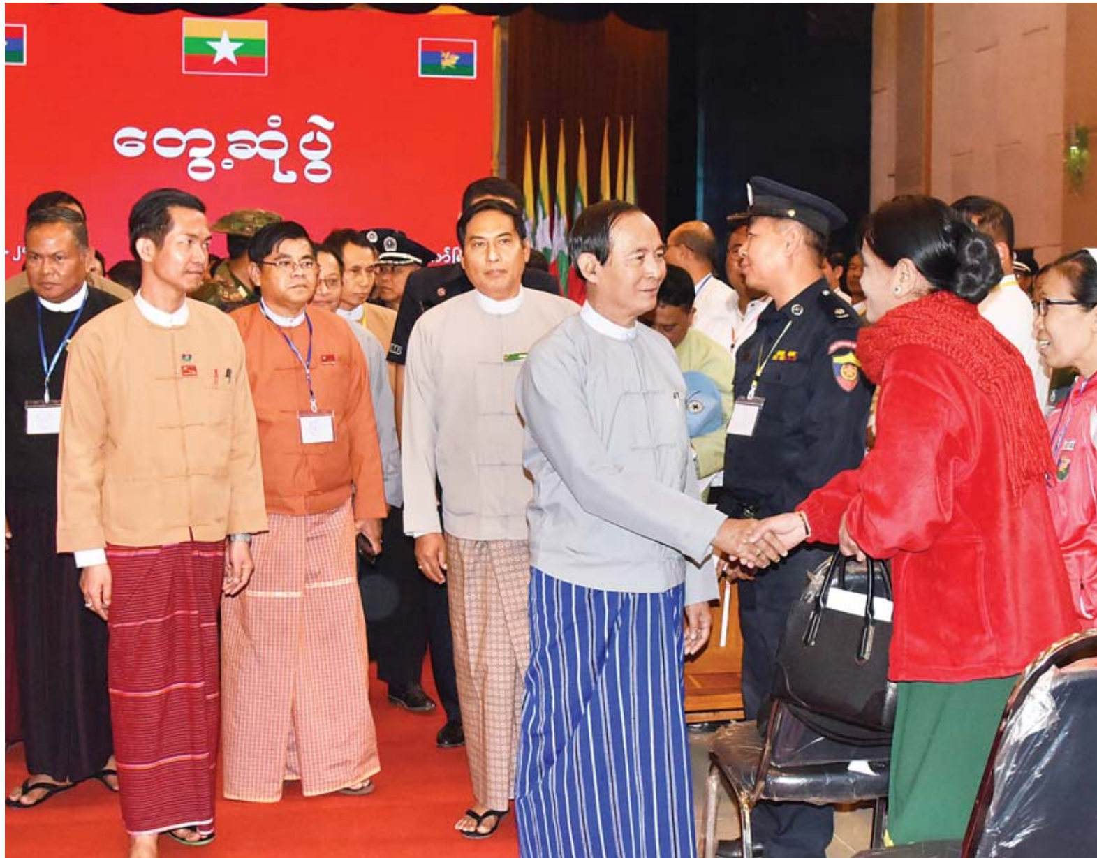
နိုင်ငံတော်သမ္မတ ဦးဝင်းမြင့် တွေ့ဆုံပွဲသို့ တက်ရောက်လာကြသူများအား ရင်းရင်းနှီးနှီး လိုက်လံနှုတ်ဆက်စဉ်။

လွိုင်ကော် ဇန်နဝါရီ ၁၆ နိုင်ငံတော်သမ္မတ ဦးဝင်းမြင့်သည် ပြည်ထောင်စုဝန်ကြီးများ ဖြစ်ကြသည့် ဒုတိယဗိုလ်ချုပ်ကြီးကျော်ဆွေ၊ ဦးမင်းသူ၊ ဒေါက်တာအောင်သူ၊ ဦးအုန်းဝင်း၊ ဦးဝင်းခိုင်၊ နိုင်သက်လွင်၊ တာဝန်ရှိသူများနှင့်အတူ ယနေ့နံနက် ၉ နာရီတွင် ကယားပြည်နယ် လွိုင်ကော်မြို့၊ ပြည်နယ်ခန်းမ၌ ကျင်းပသည့် ပြည်နယ်အစိုးရအဖွဲ့၊ ပြည်နယ်လွှတ်တော်၊ ပြည်နယ်တရားလွှတ်တော်၊ လွှတ်တော်ကိုယ်စားလှယ်များ (ပြည်သူ့ အမျိုးသား၊ ပြည်နယ်) နှင့် ပြည်နယ်၊ ခရိုင်၊ မြို့နယ်များမှ ဌာနဆိုင်ရာ တာဝန်ရှိသူများနှင့် တွေ့ဆုံအခမ်းအနားသို့ တက်ရောက် လမ်းညွှန်အမှာစကား ပြောကြားသည်။