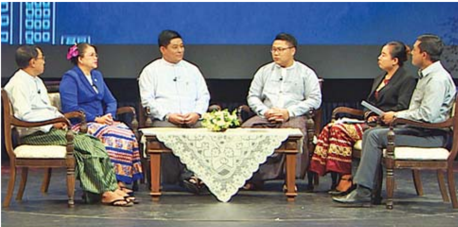
Reform ထဲမှာ အကျိုးဝင်ပါတယ်။

ညွှန်ကြားရေးမှူးချုပ်။ ကျွန်တော်တို့ လူမှုဖူလုံရေးအဖွဲ့က စီမံကိန်းကို အကောင်အထည်ဖော်ဖို့အတွက် အစောပိုင်းဆွေးနွေးခဲ့သလိုပဲ စိန်ခေါ်မှုတွေ ရှိပါတယ်။ စိန်ခေါ်မှုတွေကို ဆောင်ရွက်ဖို့၊ ကျွန်တော်တို့ သွားချင်တဲ့ မျှော်မှန်းချက်ကို အကောင်အထည်ဖော်နိုင်ဖို့ ပြုပြင်ပြောင်းလဲရေးလုပ်ငန်းကို လုပ်မှရမယ်ဆိုပြီး ပြုပြင်ပြောင်းလဲခြင်း လေးမျိုးကို ဆောင်ရွက်ပါတယ်။