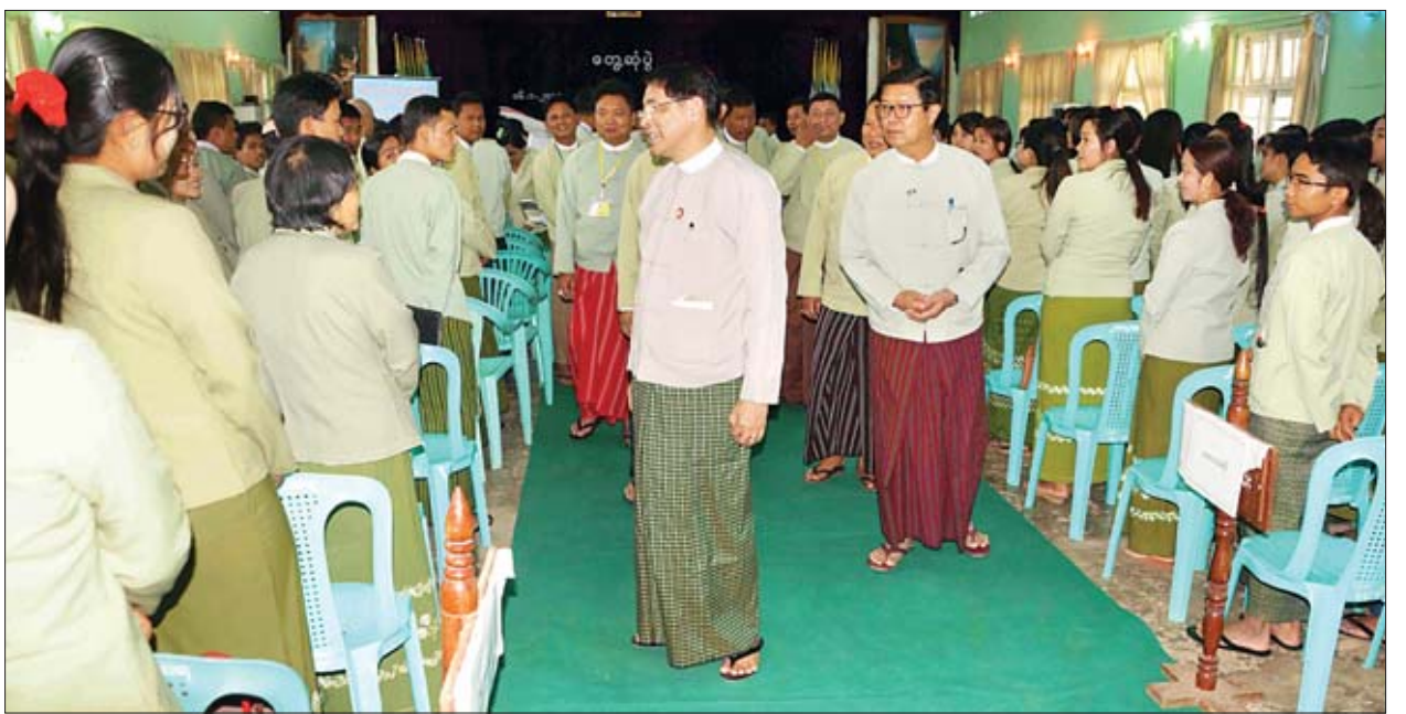
ပြည်ထောင်စုဝန်ကြီး ဦးမင်းသူ လွိုင်ကော်မြို့ မြို့နယ်ခန်းမ၌ ပြည်နယ်၊ ခရိုင်၊ မြို့နယ်အဆင့် အထွေထွေအုပ်ချုပ်ရေးဦးစီးဌာန ဝန်ထမ်းများအား ရင်းရင်းနှီးနှီး နှုတ်ဆက်စဉ်။

မိမိအနေဖြင့် အထွေထွေအုပ်ချုပ်ရေးဝန်ထမ်းများနှင့် မကြာခဏ တွေ့ဆုံရသည့်အချိန်တွင် မေးကြည့်ပါကြောင်း၊ တစ်ဦးချင်း တစ်ဦးချင်းကလည်း