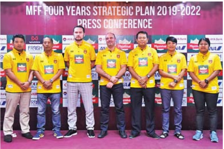
လက်ရွေးစင်အသင်းနည်းပြချုပ်များအား တွေ့ရစဉ်။