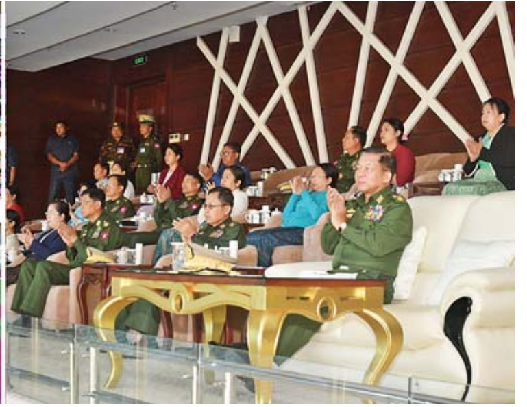
တပ်မတော်ကာကွယ်ရေးဦးစီးချုပ် ဗိုလ်ချုပ်မှူးကြီးမင်းအောင်လှိုင် နေပြည်တော်တိုင်းစစ်ဌာနချုပ် ကိုယ်စားပြုအသင်းနှင့် ကာကွယ်ရေးဦးစီးချုပ်ရုံး(ကြည်း)ကိုယ်စားပြုအသင်းတို့ ယှဉ်ပြိုင်ကစားမှုကို ကြည့်ရှုအားပေးစဉ်။