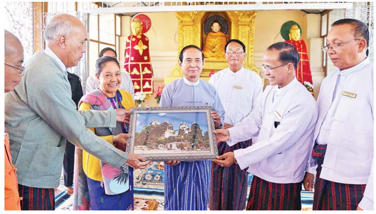
နိုင်ငံတော်သမ္မတ ဦးဝင်းမြင့်နှင့် ဇနီး ဒေါ်ချိုချို တို့အား ဂေါပကအဖွဲ့က တောင်ကွဲစေတီတော်ပန်းချီကားချပ်ကို လက်ဆောင်ပေးအပ်စဉ်။

ထို့နောက် နိုင်ငံတော်သမ္မတနှင့်အဖွဲ့သည် ကယားပြည်နယ် လှိုင်ကော်မြို့ မှ တပ်မတော်အထူးလေယာဉ်ဖြင့် ပြန်လည်ထွက်ခွာကြရာ နေပြည်တော်သို့ မွန်းလွဲပိုင်းတွင် ပြန်လည်ရောက်ရှိကြသည်။ သတင်းစဉ်