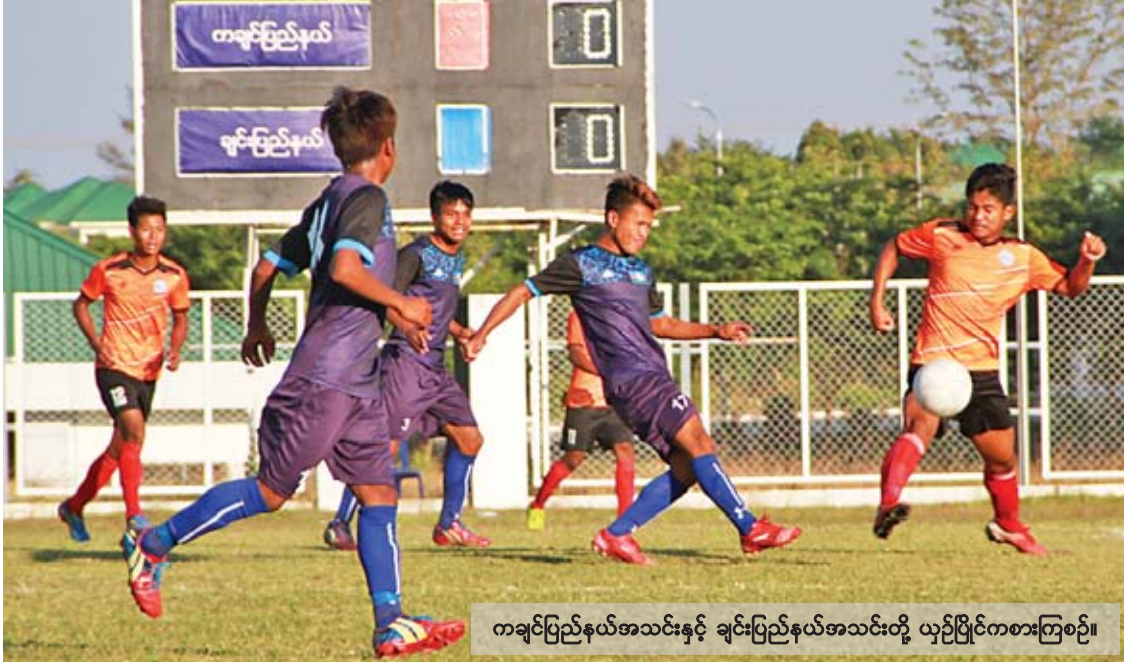
ကချင်ပြည်နယ်အသင်းနှင့် ချင်းပြည်နယ်အသင်းတို့ ယှဉ်ပြိုင်ကစားကြစဉ်။