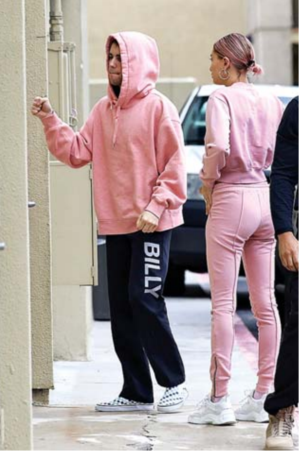
ဘယ်လိုမျိုးဝတ်စုံကို ဝတ်ဆင်မလဲ၊ ဘယ်လိုအပြင်အဆင်မျိုးတွေ ရှိနေမလဲ၊ ဘယ်သူတွေ တက်ရောက်ကြမလဲဆိုတာ စိတ်ဝင်စားစရာဖြစ်လို့နေပါတယ်။

ပေါ့ပြန်ပွင့်ပွင့် ဂျက်စတင်ဘီဘာနဲ့ သူ့နဲ့ စေ့စပ်ထားတဲ့ မော်ဒယ်လ် ဟေးလေးဘော်ဝင်နတို့ဟာ လာမယ့် ဖေဖော်ဝါရီလအတွင်း မင်္ဂလာအခမ်းအနား ပြုလုပ် သွားမှာဖြစ်ကြောင်း တရားဝင်အသိပေးခဲ့ပြီး ဖြစ်ပါတယ်။ လတ်တလောမှာတော့ သူတို့နှစ်ဦးဟာ ပန်းရောင်ဝတ်စုံတွေနဲ့ လော့ဘီအန်ဂျလီစ်လမ်းတွေပေါ် ပေါ်ထွက်လာခဲ့တာဖြစ်ကြောင်း ဟောလိဝုဒ်လိုက်ဖ်ဒေါ့ကွန်းရဲ့ ရေးသားဖော်ပြ ချက်တွေအရ သိရပါတယ်။ လတ်တလောမှာ အသက် ၂၄ နှစ်အရွယ်ရှိပြီဖြစ်တဲ့ ဂျက်စတင်ဘီဘာနဲ့ ၂၂ နှစ်အရွယ် ဟေးလေးဘော်ဝင်နတို့ဟာ ပြီးခဲ့တဲ့ ဇန်နဝါရီ ၁၅ ရက်မှာ လော့ဘီအန်ဂျလီစ်လမ်းတွေပေါ်မှာ အတူပေါ်ထွက်လာခဲ့တာ ဖြစ်ပါတယ်။ ဟေးလေးဘော်ဝင်နဟာ ပန်းရောင်ဝတ်စုံကို အပေါ်အောက်ဆင်တူ ဝတ်ဆင် ထားတာပါ။ ဂျက်စတင်ဘီဘာကတော့ သူဝတ်ဆင်နေကျ ခေါင်းစွပ်အင်္ကျီပွပွကို ဟေးလေးဘော်ဝင်နနဲ့ဆင်တူ ပန်းရောင်ဝတ်ဆင်ထားပြီး အောက်မှာတော့ အနက်ရောင်ဘောင်းဘီရှည်ဝတ်ဆင်ထားတာ တွေ့ရပါတယ်။ သူတို့နှစ်ဦးရဲ့မင်္ဂလာပွဲကိုတော့ သူငယ်ချင်းတွေ၊ မိသားစုတွေနဲ့ သာမန် မင်္ဂလာပွဲမျိုးသာပြုလုပ်သွားဖို့ ရည်ရွယ်ထားတာဖြစ်ပါတယ်။ လာမယ့် ဖေဖော် ဝါရီ ၂၈ ရက်မှာတော့ သူတို့နှစ်ဦးရဲ့ မင်္ဂလာအခမ်းအနားပြုလုပ်သွားမှာ ဖြစ်ပြီး ဖိတ်စာတွေလည်း ဝေခွဲကြပြီးဖြစ်တယ်လို့ သိရပါတယ်။ ဂျက်စတင် ဘီဘာနဲ့ ဟေးလေးဘော်ဝင်နတို့ဟာ ပြီးခဲ့တဲ့ စက်တင်ဘာ ၁၃ ရက်မှာ တရားဝင်လက်ထပ်မှတ်ပုံတင်ခဲ့ကြတာဖြစ်ပြီး မင်္ဂလာပွဲကိုတော့ သာမန်မင်္ဂလာ ပွဲမျိုးသာ ပြုလုပ်သွားမှာဖြစ်ကြောင်း ပြောကြားခဲ့ပြီးဖြစ်ပါတယ်။ ကြယ်ပွင့်စုံတွဲဟာ လတ်တလောမှာ နေအိမ်ရှာဖွေနေကြောင်းလည်း သိရပါတယ်။ လာမယ့် မင်္ဂလာအခမ်းအနားမှာတော့ သတိုးသမီးအနေနဲ့