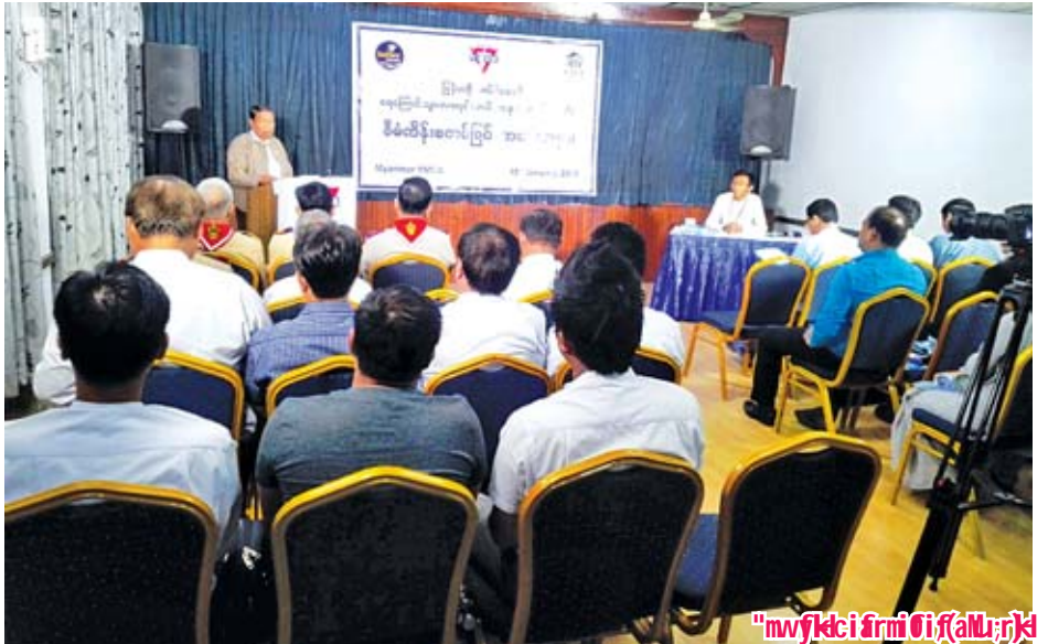
"mvfkc i firmi (alun)k"

အဖွဲ့အစည်းဖြစ်ပြီး မြန်မာနိုင်ငံအနှံ့ အသင်းခွဲပေါင်း ၃၀ သင်းရှိကာ လူမှု အကျိုးပြု ပရဟိတစီမံကိန်းလုပ်ငန်း များစွာ အကောင်အထည်ဖော် လုပ်ကိုင်ဆောင်ရွက်လျက်ရှိကြောင်း၊ ပိုင်အိမ်စီမံအဖွဲ့အစု လန်ဒန်ကဆီသည့် အတိုင်း ပိုင်အိမ်စီမံအဖွဲ့ကို ယခုအခါ ထူထောင်မှု နှစ်ပေါင်း ၁၇၅ နှစ်ပြည့် မြောက်တော့မည်ဖြစ်ကြောင်း သိရ သည်။ မြင့်မောင်စိုး