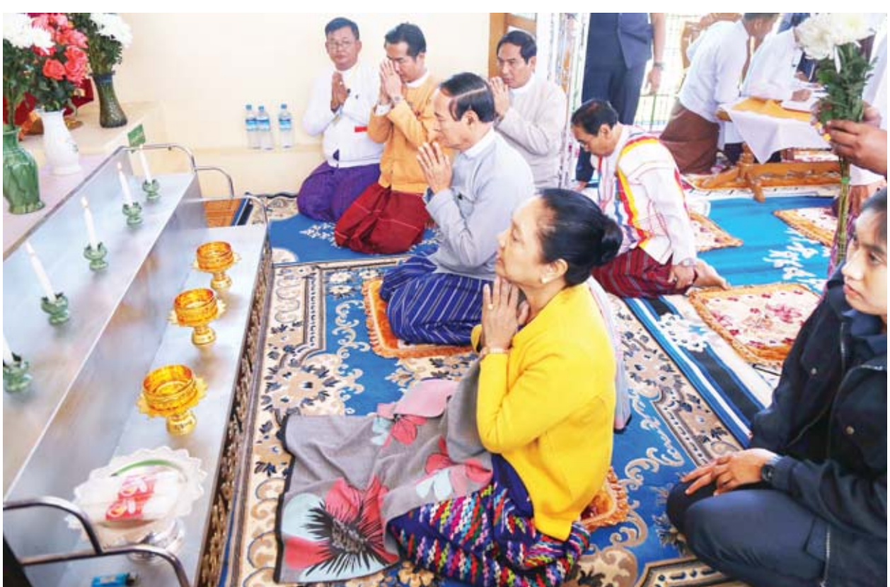
နိုင်ငံတော်သမ္မတ ဦးဝင်းမြင့်နှင့် ဇနီး ဒေါ်ချိုချို လှိုင်ကော်မြို့ သီရိမင်္ဂလာတောင်တော်ရှိ တောင်ကွဲစေတီတော်မြတ်ကြီးအား ဖူးမြော်ကြည့်ည့်စဉ်။

ဥပဒေပြုရေးအပိုင်းတွင် မေးခွန်း၊ အဆိုများနှင့်စပ်လျဉ်း၍ သတ်မှတ်ထားသည့် စည်းကမ်းချက်များ၊ ကန့်သတ်ချက်များနှင့်အညီ တင်သွင်းကြရမည်ဖြစ်ပါကြောင်း၊ ဒေသနှင့်ကိုက်ညီပြီး အကျိုးရှိသည့် ဥပဒေများကိုသာ ပြဋ္ဌာန်းရန် လိုအပ်ပါကြောင်း၊ လွှတ်တော်ကိုယ်စားလှယ်များ၊ ဝန်ထမ်းများ အရည်အချင်းမြင့်မားမှ လွှတ်တော်ဖွံ့ဖြိုးတိုးတက်မည်ဖြစ်ပါကြောင်း။