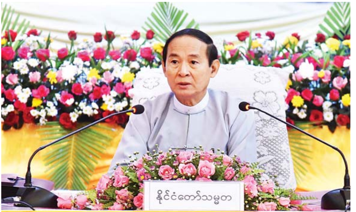
နိုင်ငံတော်သမ္မတ ဦးဝင်းမြင့် ကယားပြည်နယ်အတွင်းရှိ အုပ်ချုပ်ရေး၊ ဥပဒေပြုရေးနှင့် တရားစီရင်ရေးမဏ္ဍိုင်တို့မှ တာဝန်ရှိသူများနှင့် တွေ့ဆုံပွဲအခမ်းအနားတွင် လမ်းညွှန် အမှာစကားပြောကြားစဉ်။

အပြောင်းအလဲတစ်ခုကို အောင်မြင်စွာ ဆောင်ရွက်နိုင်ရန် ဌာနဆိုင်ရာ တာဝန်ရှိသူ များ အားလုံးက တက်ညီလက်ညီ အကောင် အထည်ဖော်ရန် လိုအပ်ပါကြောင်း၊ မိမိတို့၏ ပုံစံကျနေသည့် အလေ့အထများကို ပြုပြင်