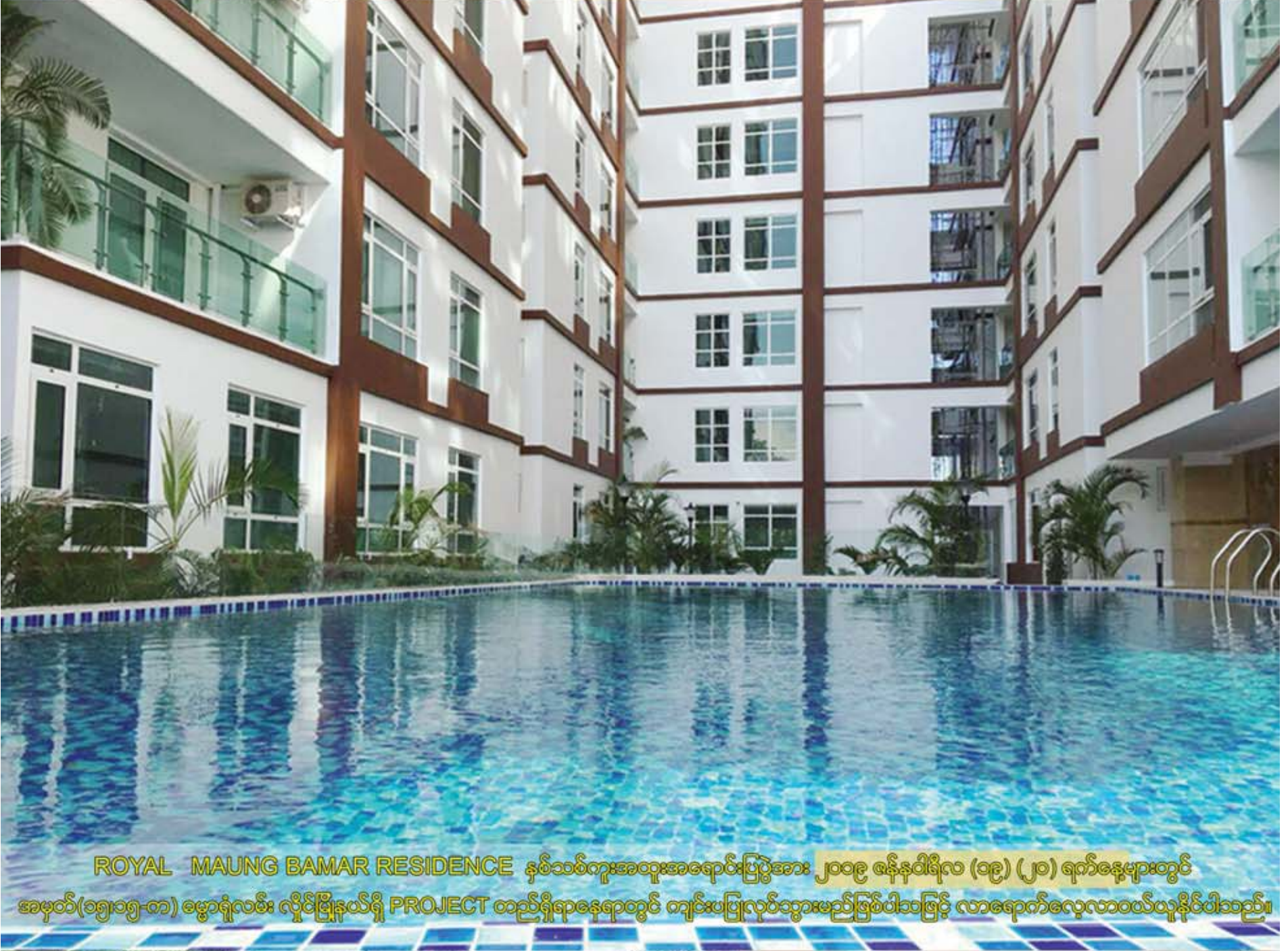
ROYAL MAUNG BAMAR RESIDENCE နှစ်သစ်ကူးအထူးအရောင်းပြပွဲအား ၂၀၁၉ ဇန်နဝါရီလ (၁၉) (၂၀) ရက်နေ့များတွင် အမှတ်(၁၅)၁၅-က) ဓမ္မာရုံလမ်း လှိုင်မြို့နယ်ရှိ PROJECT တည်ရှိရာနေရာတွင် ကျင်းပပြုလုပ်သွားမည်ဖြစ်ပါသဖြင့် လာရောက်လေ့လာဝယ်ယူနိုင်ပါသည်။