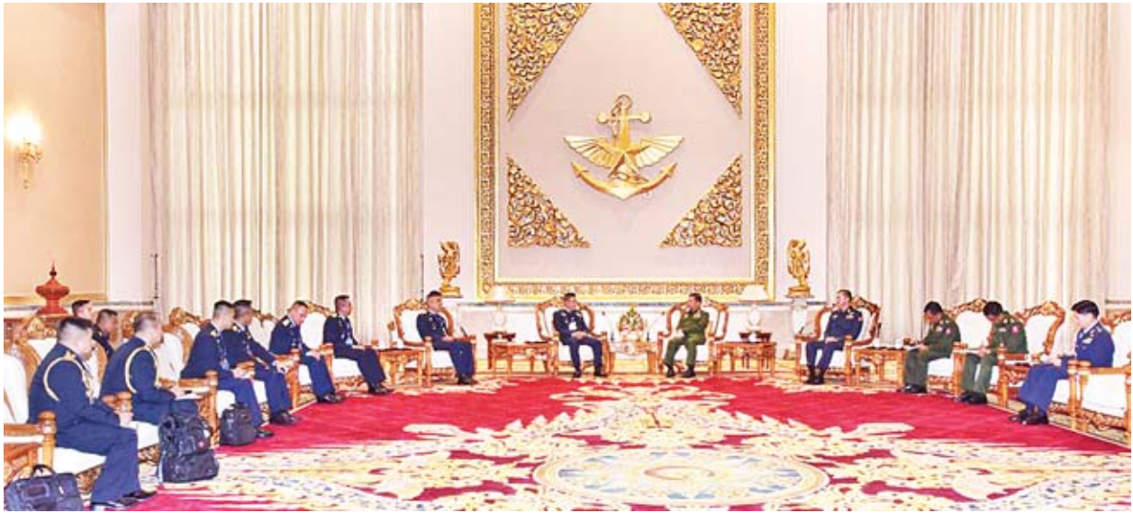
တပ်မတော်ကာကွယ်ရေးဦးစီးချုပ် ပိုလ်ချုပ်မှူးကြီးမင်းအောင်လှိုင် ထိုင်းဘုရင့်လေတပ်ဦးစီးချုပ် Air Chief Marshal Chaiyapruk Didyasarin အား လက်ခံတွေ့ဆုံစဉ်။

ယင်းနောက် နှစ်နိုင်ငံတပ်မတော်နှစ်ရပ်အကြား ချစ်ကြည်ရင်းနှီးမှုနှင့် ပူးပေါင်းဆောင်ရွက်မှုများ ပိုမိုတိုးတက်ကောင်းမွန်စေရေးအတွက် အဆင့်