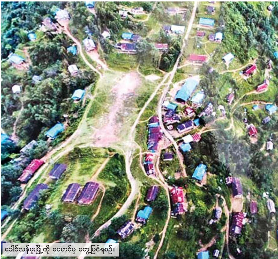
ခေါင်လန်ဖူးမြို့ကို ဝေဟင်မှ တွေ့မြင်ရစဉ်။

မြန်မာနှင့် တရုတ်နယ်စပ်က BP 43၊ 44၊ 45 လို နေရာများ၊ မြန်မာနှင့်အိန္ဒိယနယ်စပ်က BP 46၊ 47၊ 48 လို နေရာများကိုပါ ရည်ညွှန်းရေးဆွဲခဲ့သည်ဆိုလျှင် မမှားတန်ရာ။ မိမိတို့နိုင်ငံပိုင်နယ်မြေ၏ အကျယ်အဝန်း၊ အချိုးအစား၊ ထိုဒေသတွင် နေထိုင်သော မိမိတို့ တိုင်းရင်းသားများ၏ လူဦးရေသိပ်သည်းဆ၊ ပထဝီ နိုင်ငံရေးအနေအထားတို့အရ ထိန်းသိမ်းစောင့်ရှောက် ရမည့်တာဝန်မှာ ကြီးမားကြောင်း၊ နိုင်ငံသားအားလုံးက သတိမူရမည့်အခြေအနေ ဖြစ်ပါသည်။ ထိုကဲ့သို့ ထိန်းသိမ်းစောင့်ရှောက်နိုင်ဖို့ရာလည်း ထိုဒေသအတွင်း၌ လမ်းပန်းဆက်သွယ်ရေး ကောင်းမွန်ရန် လိုအပ်ပါ သည်။ ပန်နန်းဒင်မှစပြီး နာလလူဦးရေဌာနက လမ်းဖောက်လုပ်နေပြီ ဖြစ်ပါသည်။