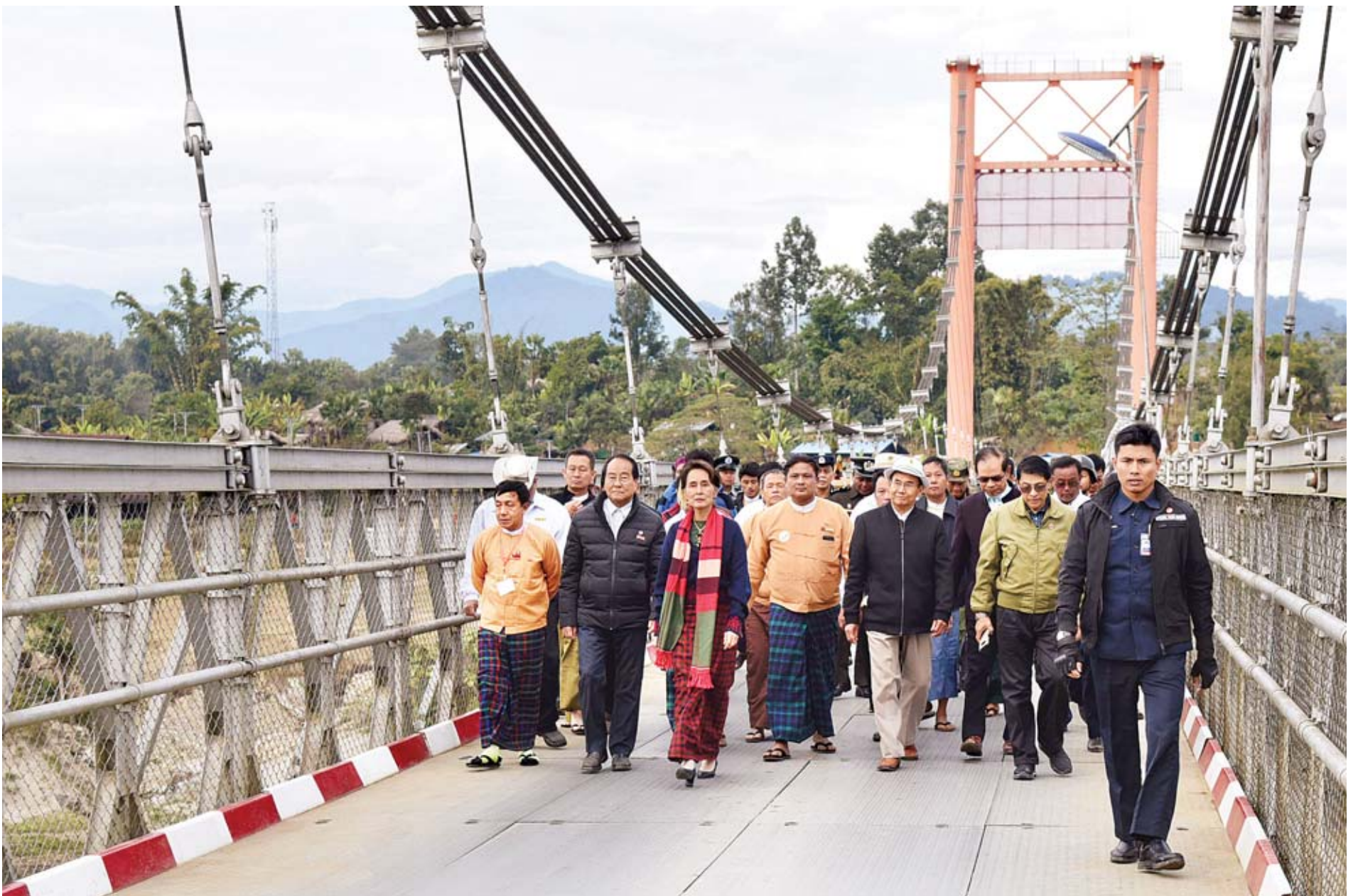
နိုင်ငံတော်၏အတိုင်ပင်ခံပုဂ္ဂိုလ် ဒေါ်အောင်ဆန်းစုကြည်နှင့် အဖွဲ့ဝင်များ မလိခကြီးတံတား(မချမ်းဘော)ပေါ်မှ ဖြတ်သန်းကြည့်ရှုလေ့လာကြစဉ်။