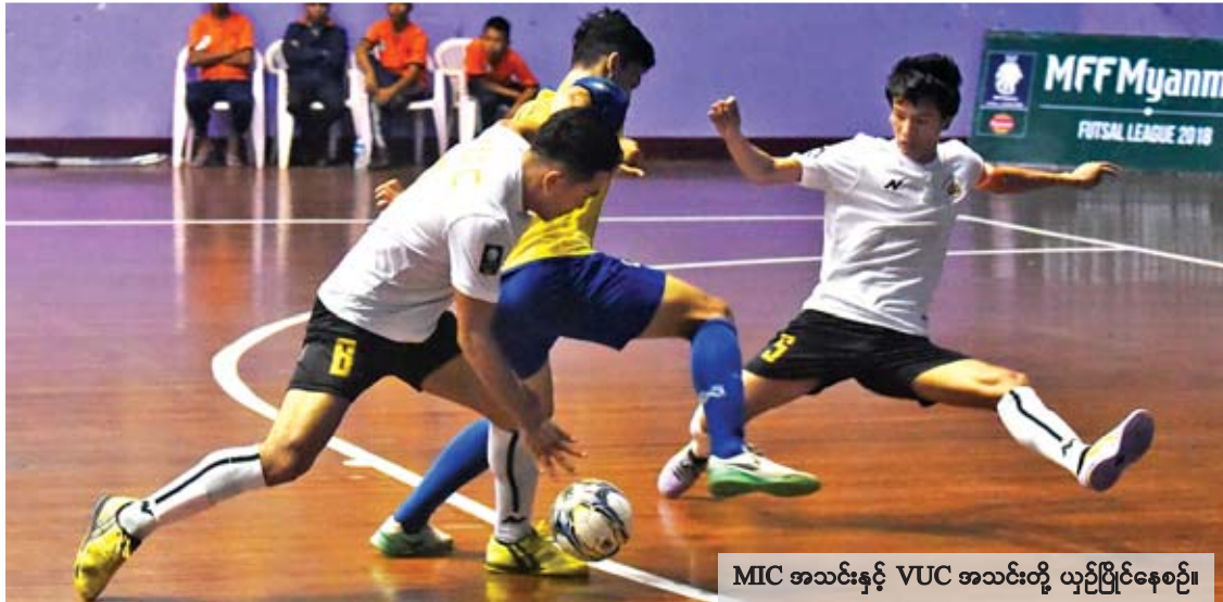
MIC အသင်းနှင့် VUC အသင်းတို့ ယှဉ်ပြိုင်နေစဉ်။