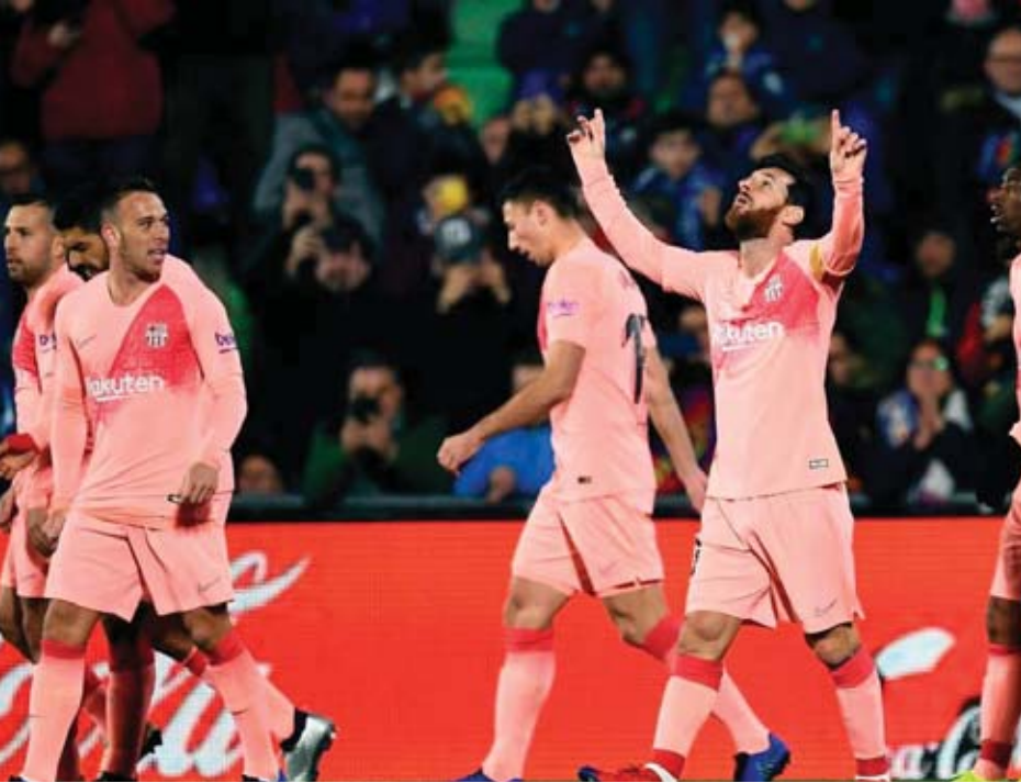
ငွေကြယ် - ရေးသားသည်

သွင်းဂိုးတို့နဲ့ နှစ်ဂိုးပြတ်ဦးဆောင်နိုင်ခဲ့တာဖြစ်ပြီး ပွဲကစားချိန် ၄၃ မိနစ်မှာ ဂီတာဖေးအသင်းက ချေပဂိုးတစ်ဂိုးရရှိခဲ့ပါတယ်။ နှစ်သင်းစလုံးဟာ နောက်ထပ်သွင်းဂိုးတွေ ထပ်မံရရှိဖို့ အကြိတ်အနယ်ကြိုးပမ်းခဲ့ပေမယ့် ဂိုးထပ်မံသွင်းယူနိုင်ခဲ့ခြင်းမရှိခဲ့တာမို့ ဘာစီလိုနာက ဂီတာဖေးကို နှစ်ဂိုး-တစ်ဂိုးနဲ့ အနိုင်ရရှိခဲ့တာ ဖြစ်ပါတယ်။ အခုပွဲစဉ်မှာ ဘာစီလိုနာအသင်းက နိုင်ပွဲရယူနိုင်ခဲ့တာမို့ ၁၈ ပွဲကစားအပြီးမှာ ရမှတ် ၄၀ အထိစုဆောင်းနိုင်ခဲ့ပါတယ်။ အမှတ်ပေးဇယားရဲ့ ဒုတိယနေရာမှာ ရပ်တည်နေတဲ့ အက်သလက်တီကိုမက်ဒရစ်အသင်းကတော့ အမှတ်ပေးဇယားရဲ့ တတိယနေရာက ဆီဗီလာနဲ့ တစ်ဖက်တစ်ပိုစီ သရေရလဒ်ထွက်ပေါ်ခဲ့တာကြောင့် ရမှတ် ၃၅ မှတ်သာ ရရှိထားပြီး ဘာစီလိုနာအသင်းက အက်သလက်တီကိုမက်ဒရစ်အသင်းကို ငါးမှတ်ဖြတ်ထားနိုင်ခဲ့တာဖြစ်ပါတယ်။