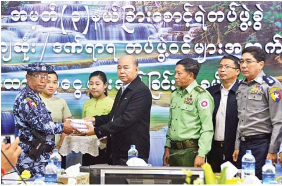
ဒုတိယဝန်ကြီး ဦးခင်မောင်တင် အမှတ်(၁) နယ်ခြားစောင့်ရဲတပ်ဖွဲ့မှ အမှတ်(၃)နယ်ခြားစောင့်ရဲတပ်ဖွဲ့မှ ကျဆုံး/ဒဏ်ရာရ ရဲတပ်ဖွဲ့ဝင်များအတွက် ထောက်ပံ့ငွေများပေးအပ်စဉ်။