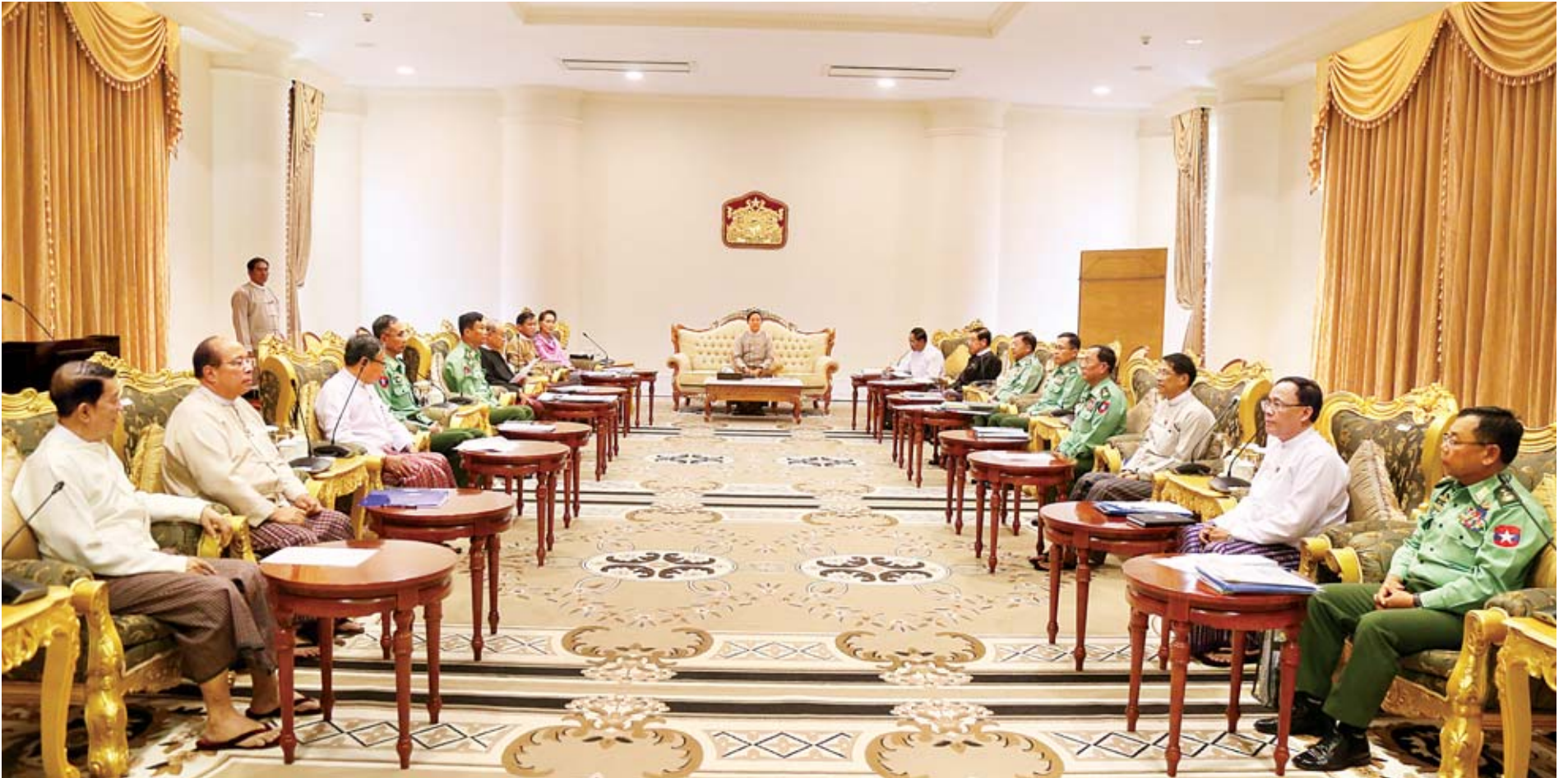
နိုင်ငံတော်သမ္မတ ဦးဝင်းမြင့် ဦးဆောင်၍ နိုင်ငံတကာဆက်ဆံရေး၊ ပြည်တွင်းလုံခြုံရေးဆိုင်ရာကိစ္စရပ်များနှင့်စပ်လျဉ်းသည့် ညှိနှိုင်းအစည်းအဝေး ကျင်းပစဉ်။