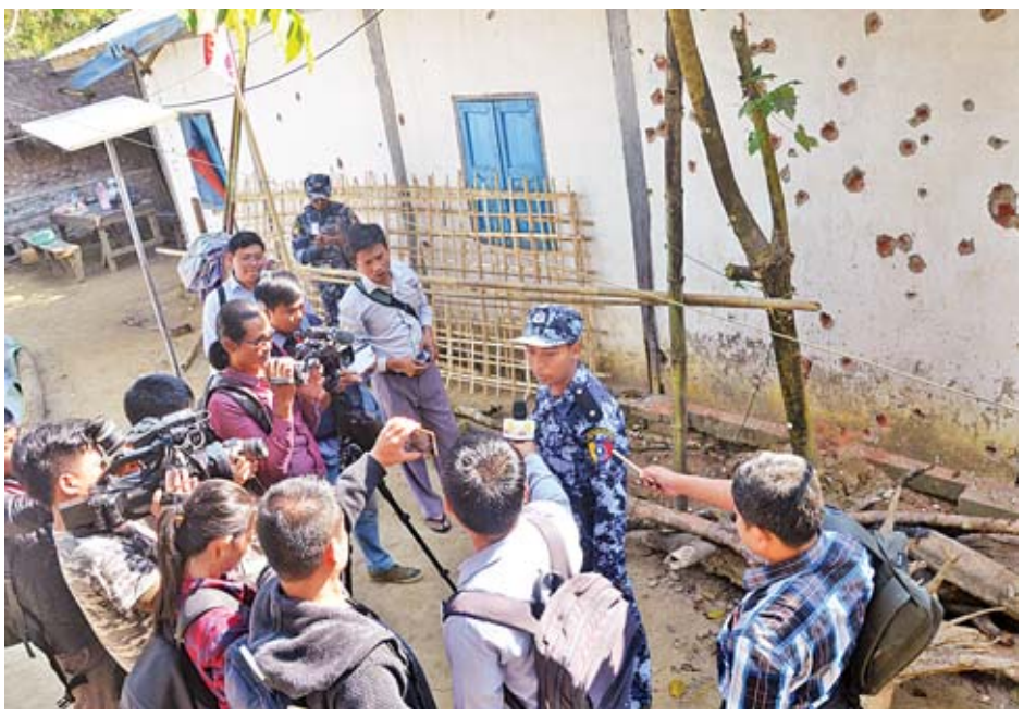
ခထီးလှရဲကင်းစခန်း၌ သတင်းမီဒီယာများ သတင်းရယူနေစဉ်။

ခရီးစဉ်တွင် ဒုတိယဝန်ကြီးနှင့်အတူ အဖွဲ့ဝင်များ အဖြစ် ရခိုင်ပြည်နယ် လုံခြုံရေးနှင့်နယ်စပ်ရေးရာဝန်ကြီး ဗိုလ်မှူးကြီးဖုန်းတင်၊ ပြည်ထောင်စုအစိုးရအဖွဲ့မှူးဝန်ကြီး ဌာန အမြဲတမ်းအတွင်းဝန် ဦးဇော်သန်းသင်း၊ မြန်မာနိုင်ငံရဲတပ်ဖွဲ့ ရဲချုပ် ဒုတိယဗိုလ်ချုပ်ကြီးအောင်ဝင်းဦး၊ ပြန်ကြားရေးဝန်ကြီးဌာန အမြဲတမ်းအတွင်းဝန် ဦးမျိုးမြင့်မောင်၊ လူမှုဝန်ထမ်း၊ ကယ်ဆယ်ရေးနှင့် ပြန်လည်နေရာချထားရေးဝန်ကြီးဌာန ညွှန်ကြားရေးမှူးချုပ် ဦးကိုကိုနိုင်၊