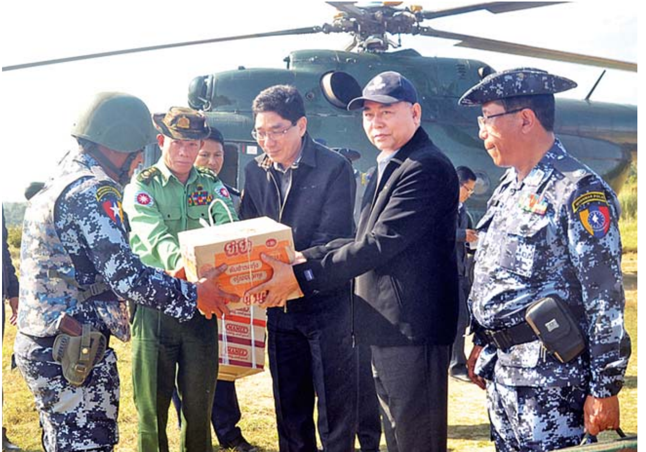
ဒုတိယဝန်ကြီး ဦးခင်မောင်တင် ဦးစီးသည့်အဖွဲ့ ဝင်ရောက်စစ်ဆေးမှု ရဲတပ်ဖွဲ့ဝင်များအား ထောက်ပံ့ပစ္စည်းများ ပေးအပ်စဉ်။