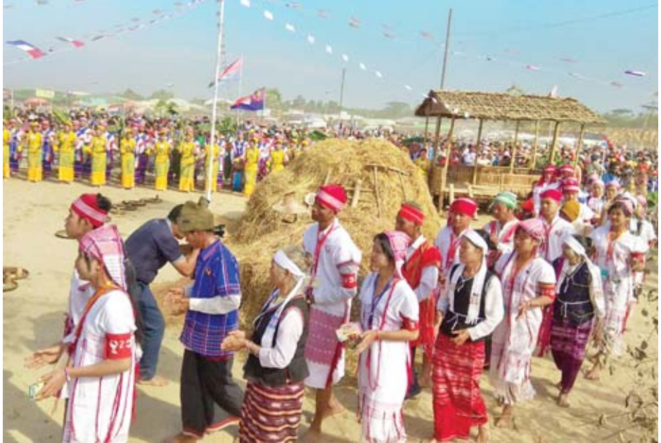
ဧရာဝတီတိုင်းဒေသကြီး မြောင်းမြခရိုင် အိမ်မဲမြို့နယ် ရွာသစ်ကျေးရွာအုပ်စု တောင်စုကျေးရွာ၌ ကရင်အမျိုးသားနှစ်သစ်ကူးနှင့် ကောက်သစ်စားပွဲတော် ကျင်းပစဉ်။