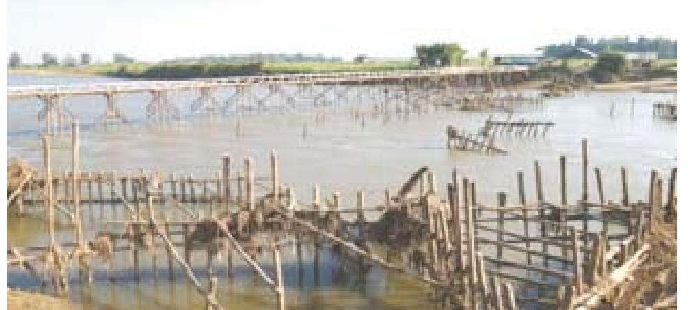
သာဂရ-ငှက်ပျောတော စစ်တောင်းမြစ်ကူး ယာယီတံတားနှင့် တည်ဆောက်ဆဲ မြစ်ကူးတံတား အကြား တွေ့ရှိရသည့် ငုတ်တိုင်များကို တွေ့ရစဉ်။