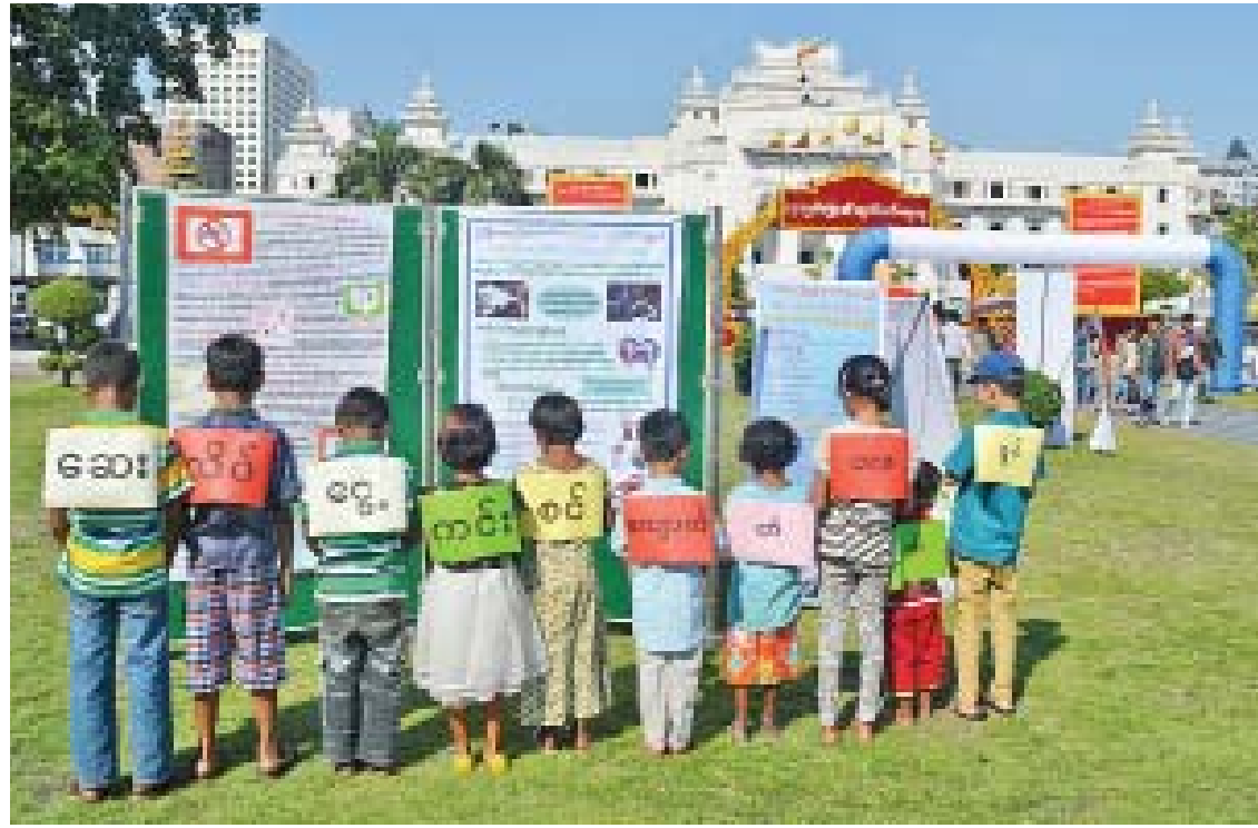
ကျောက်တံတားမြို့နယ် မဟာပန္နလပန်းခြံ၌ ဆေးလိပ်ငွေကင်းစင်နယ်မြေအဖြစ် လူထုလှုံ့ဆော်လှုပ်ရှားပွဲအခမ်းအနား ကျင်းပစဉ်။