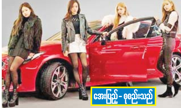
အေးပြည့် - စုစည်းသည့်

ယခုနှစ်ရဲ့ဖျော်ဖြေပွဲမှာ ကိုရီးယား-အိန္ဒိယ အမျိုးသားတေးဂီတအဖွဲ့ “Hyukoh” လည်း ပါဝင်ဖျော်ဖြေပေးသွားမှာဖြစ်တယ်လို့ သိရပါတယ်။ ဒီနှစ်ဖျော်ဖြေပွဲကိုတော့ သီတင်းပတ်တန် နှစ်ပတ်မှာ နှစ်ပိုင်းခွဲကာ ပြုလုပ်သွားဖို့ရာ စီစဉ်ထားတာဖြစ်ပါတယ်။ လာမယ့် ဧပြီ ၁၂ ရက်မှ ၁၄ ရက်အထိ တစ်ကြိမ်နဲ့ ဧပြီ ၁၉ ရက်မှ ၂၁ ရက်အထိတစ်ကြိမ် နှစ်ပိုင်းခွဲကာ ပြုလုပ်သွား မှာပါ။ “Black Pink” ကတော့ ဧပြီ ၁၂ ရက်နဲ့ ၁၃ ရက်တွေမှာ ဖျော်ဖြေပေးသွားမှာဖြစ်ပြီး “Hyukoh” ကတော့ ဧပြီ ၁၄ ရက်နဲ့ ၂၁ ရက်တွေမှာ ပါဝင်တင်ဆက် သွားမှာဖြစ်တယ်လို့ သိရပါတယ်။ “Coachella” မှာ ပထမဆုံးအကြိမ် ပါဝင်ဖျော်ဖြေခွင့်ရခဲ့တဲ့ ကေပေါ့ပ်တေးဂီတအဖွဲ့ကတော့ “Epik High” ဖြစ်ပြီး အဆိုပါတေးဂီတအဖွဲ့ဟာ ပြီးခဲ့တဲ့ ၂၀၁၆ ခုနှစ်အတွင်း ပြုလုပ်ခဲ့တဲ့ ဖျော်ဖြေပွဲမှာ ပါဝင်တင်ဆက်ခဲ့တာ