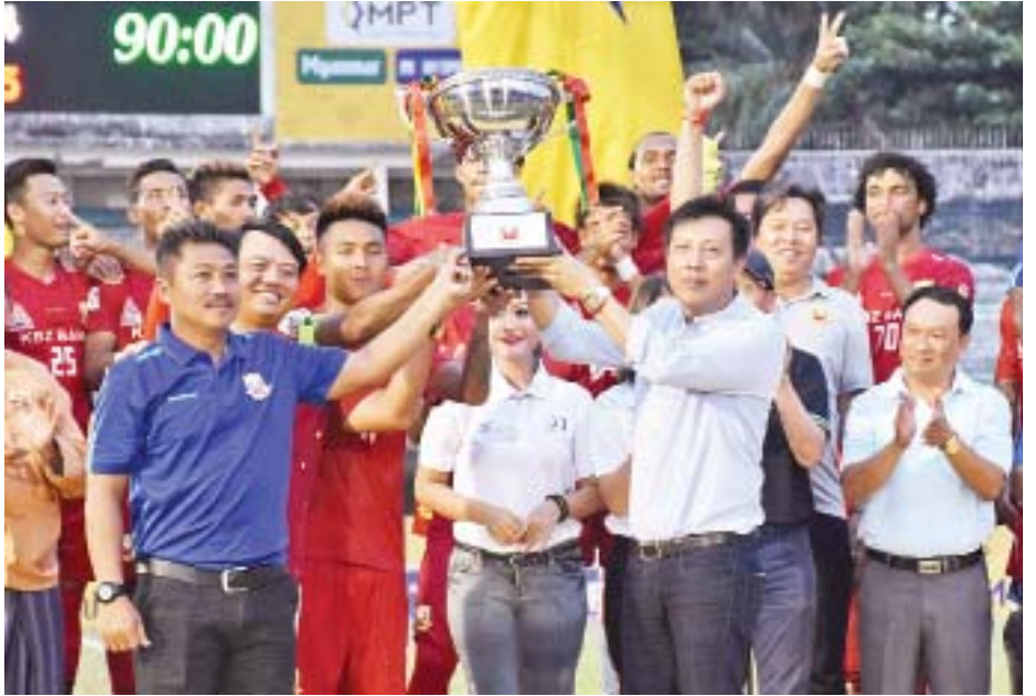
မြန်မာနိုင်ငံဘောလုံးအဖွဲ့ချုပ်ဥက္ကဋ္ဌ ဦးဇော်ဇော် ရှမ်းယူနိုက်တက်အသင်းအား ဆုဖလားချီးမြှင့်စဉ်။

ဒုတိယပိုင်းတွင် နှစ်သင်းစလုံး ကစားသမားများ အပြောင်းအလဲပြုလုပ်ခဲ့ပြီး ငါးဦးစလုံး လူစားလဲခဲ့သည်။ ဒုတိယပိုင်းအစတွင် ရန်ကုန်အသင်း ပိုမိုကစားနိုင်ခဲ့ပြီး ၅၂ မိနစ်တွင် စာမျက်နှာ ၄ ကော်လံ ၄ သို့