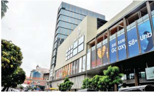
အထပ်မြင့်တိုက်တာများ ပေါ်ထွက်လာနေသော ရန်ကုန်မြို့၏ မြင်ကွင်းတစ်ခုခု။