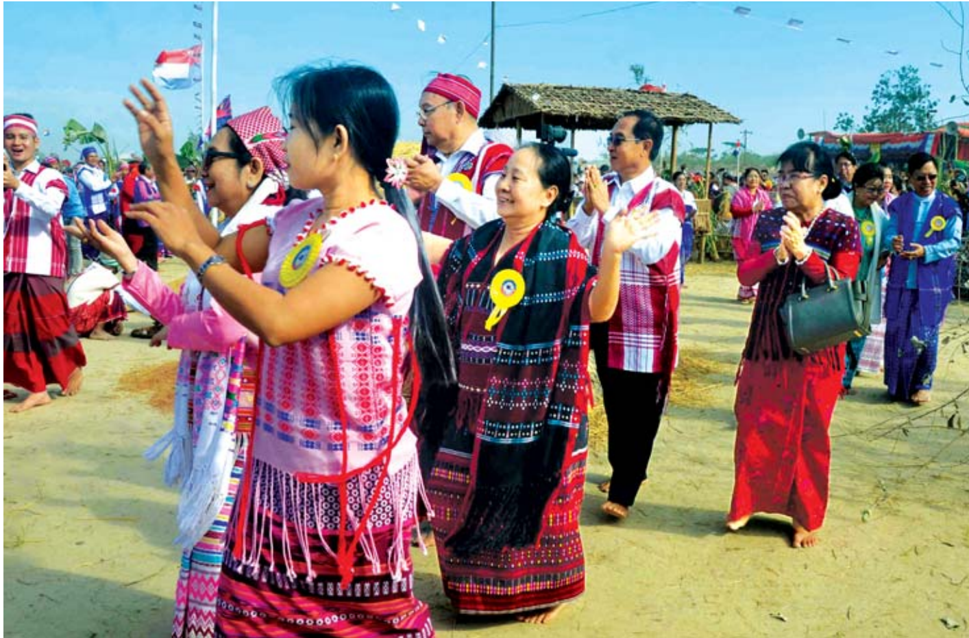
အမျိုးသားလွှတ်တော်ဥက္ကဋ္ဌ မန်းဝင်းခိုင်သန်းနှင့်ဇနီး ဒေါ်နန့်ကြင်ကြည်တို့ ကရင်အမျိုးသားနှစ်သစ်ကူးနှင့် ကောက်သစ်စားပွဲတော်တွင် ပါဝင်ဆင်နွှဲကြစဉ်။