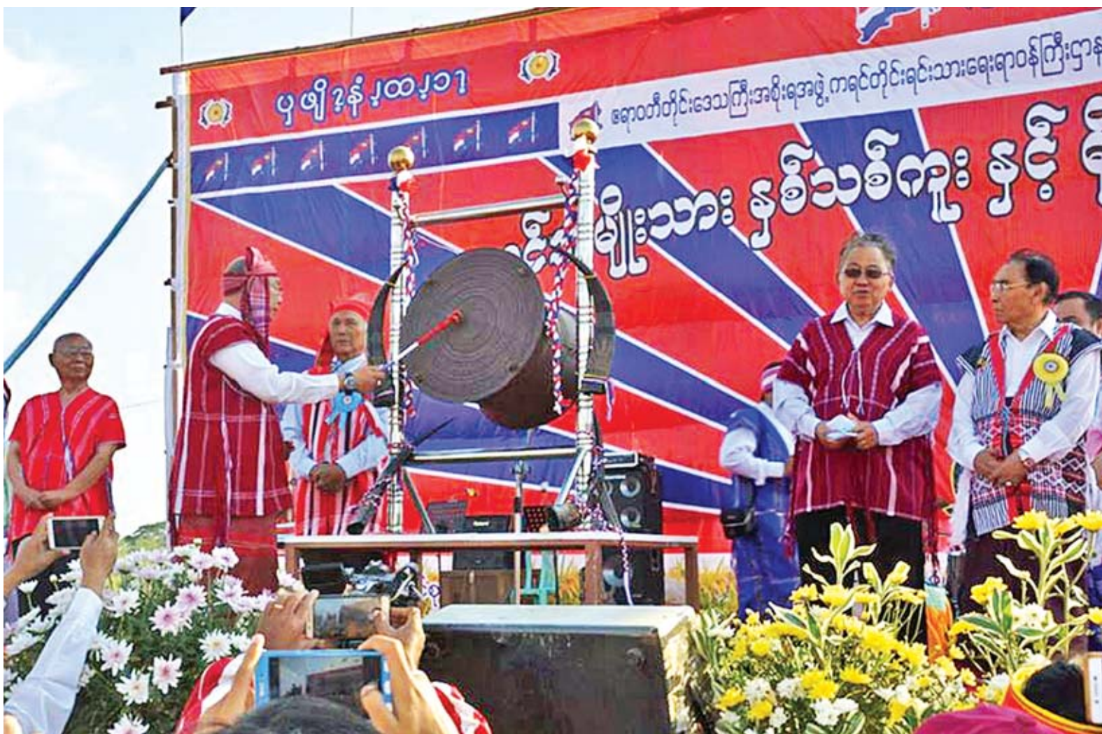
အမျိုးသားလွှတ်တော်ဥက္ကဋ္ဌ မန်းဝင်းခိုင်သန်း ကရင်အမျိုးသားနှစ်သစ်ကူးနှင့် ကောက်သစ်စားပွဲတော်ကို ဟားစည်တိုး၍ ဖွင့်လှစ်ပေးစဉ်။