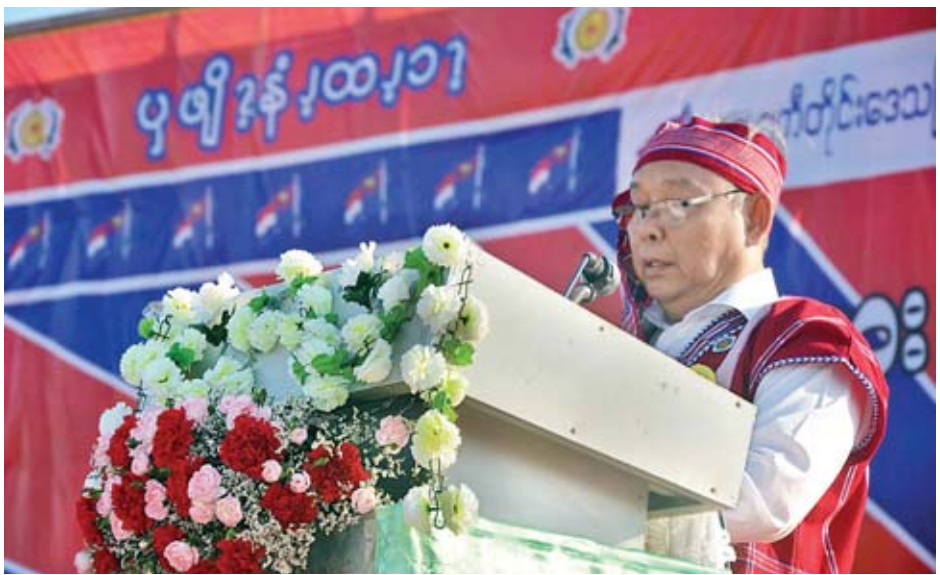
အမျိုးသားလွှတ်တော်ဥက္ကဋ္ဌ မန်းဝင်းခိုင်သန်း ကရင်အမျိုးသားနှစ်သစ်ကူးနှင့် ကောက်သစ်စားပွဲတော်တွင် ကြိုဆိုနှုတ်ခွန်းဆက်စကား ပြောကြားစဉ်။

ယနေ့ကျင်းပသည့် ကရင်အမျိုးသားနှစ်သစ်ကူးနေ့ သတ်မှတ်နိုင်ရေးအတွက် ကြိုးစားဆောင်ရွက်ကြသော ကရင်အမျိုးသားခေါင်းဆောင်ကြီးများ၏ အမြော်အမြင် ကြီးမားမှု၊ ကိုယ်ကျိုးမဖက်သည့်စိတ်ထား၊ လူမျိုးဘာသာ မခွဲခြားဘဲ အာယာတကင်းစင်သည့် စိတ်ဓာတ်များနှင့်