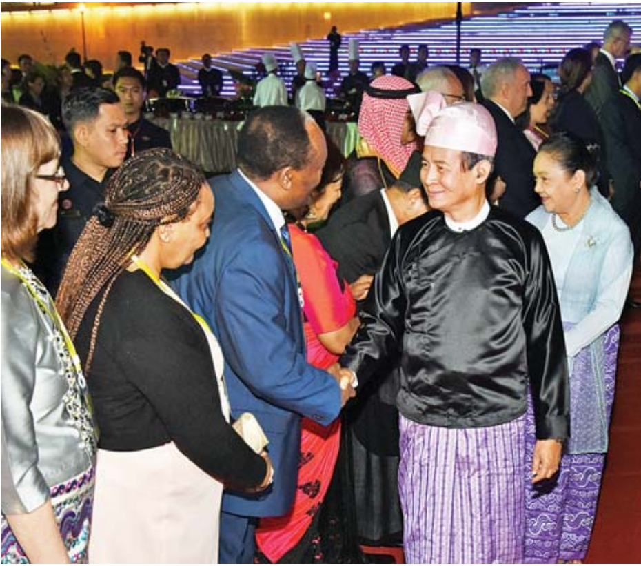
နိုင်ငံတော်သမ္မတ ဦးဝင်းမြင့်နှင့်ဇနီး ဒေါ်ချိုချို ညစာစားပွဲသို့တက်ရောက်လာကြသည့် သံအမတ်ကြီးများ၊ ကုလသမဂ္ဂအဖွဲ့အစည်းများမှ ဌာနေကိုယ်စားလှယ်များနှင့် ၎င်းတို့၏ဇနီးများအား ရင်းရင်းနှီးနှီးနှုတ်ဆက်စဉ်။