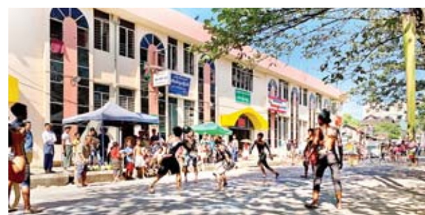
(၇၁) နှစ်မြောက်လွတ်လပ်ရေးနေ့အထိမ်းအမှတ် ပျော်ပွဲရွှင်ပွဲများကို ရန်ကုန်မြို့ ဗဟန်းမြို့နယ် ရွှေနံသာရပ်ကွက် ရေတာရှည်လမ်းဟောင်းတွင် ကျင်းပစဉ်။ မောင်ယဉ်ကျေး