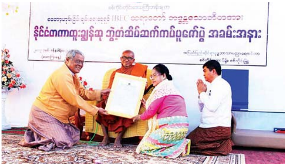
ဆရာတော်က သီလဝေတရားများအဖြစ်ဖြင့် ကျောင်းသား ကျောင်းသူများက IBEC သီချင်းဖြင့် သီဆိုဖျော်ဖြေကြ သည်။ ၎င်းနောက်ဝန်ကြီးချုပ်က သာသနာရေးဆိုင်ရာများ လျှောက်ထားရာမှာ “ယနေ့မျက်မှောက်ကာလတွင်