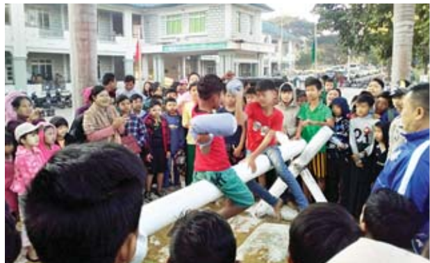
(၇၁)နှစ်မြောက် လွတ်လပ်ရေးနေ့ အထိမ်းအမှတ်အဖြစ် ဇန်နဝါရီ ၄ ရက် နံနက်က နေပြည်တော် အထက(၁၁)တွင် ခေါင်းအုံးရိုက် ပြိုင်ပွဲ ကျင်းပစဉ်။ တိုပေါက်(ဥက္ကဋ္ဌမြေ)