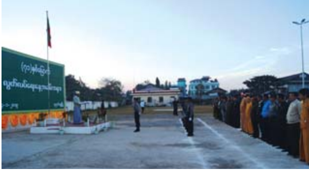
ညောင်ရွှေ

(၇၁) နှစ်မြောက်လွတ်လပ်ရေးနေ့ နိုင်ငံတော် အလံတင်အခမ်းအနားကို ဇန်နဝါရီ ၄ ရက် နံနက်ပိုင်းက ညောင်ရွှေမြို့ လွတ်လပ်ရေးကျောက်တိုင် ကွင်း၌ ကျင်းပခဲ့သည်။