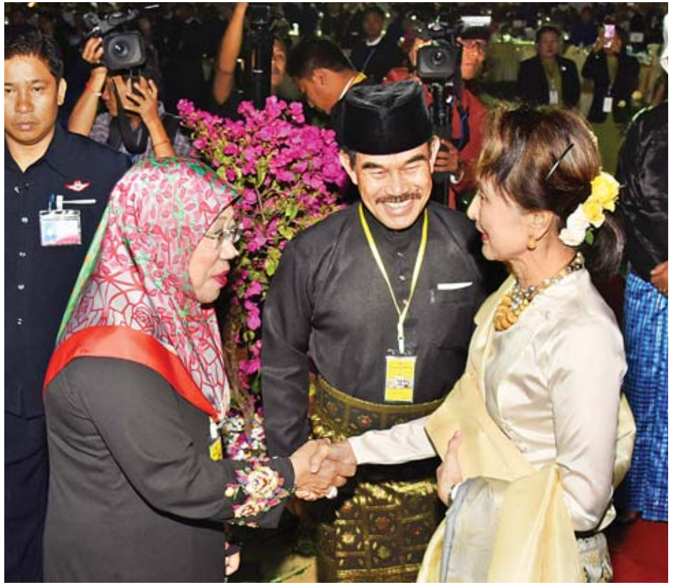
နိုင်ငံတော်၏အတိုင်ပင်ခံပုဂ္ဂိုလ် ဒေါ်အောင်ဆန်းစုကြည် ညစာစားပွဲသို့တက်ရောက်လာကြသည့် သံအမတ်ကြီးများ၊ ကုလသမဂ္ဂအဖွဲ့အစည်းများမှ ဌာနေကိုယ်စားလှယ်များနှင့် ၎င်းတို့၏ဇနီးများအား ရင်းရင်းနှီးနှီးနှုတ်ဆက်စဉ်။