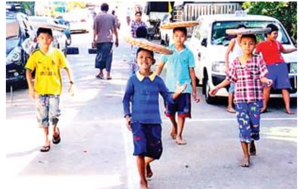
ဇန်နဝါရီ ၄ ရက် (လွတ်လပ်ရေးနေ့)က ရန်ကုန်မြို့ ကြည့်မြင်တိုင်မြို့နယ် ထီးတန်းစက်မြေရပ်ကွက်၌ ကလေးငယ်များ ဆန်ကောရွက်ပြိုင်ပွဲ ဝင်နေကြစဉ်။ ရွှေတိုင်ဘိုတောက်