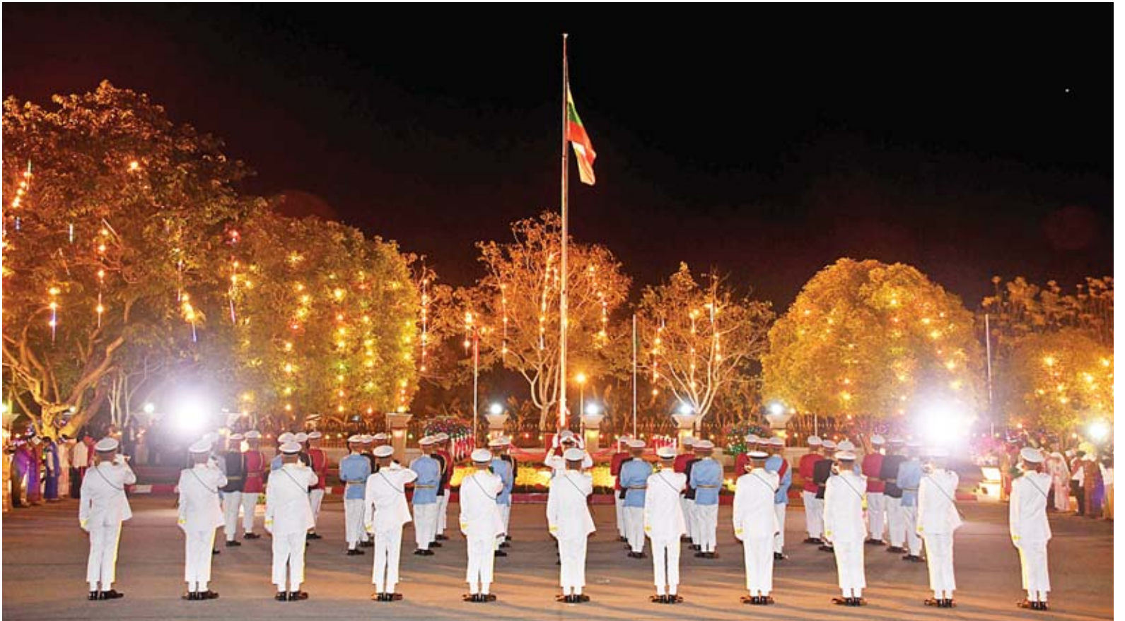
နေပြည်တော် မြို့တော်ခန်းမရွှေ၌ (၇၁)နှစ်မြောက်လွတ်လပ်ရေးနေ့ နိုင်ငံတော်အလံတင်အခမ်းအနား ကျင်းပစဉ်။

အခမ်းအနားကို ပြည်ထောင်စု မပြိုကွဲရေး၊ တိုင်းရင်းသားစည်းလုံး ညီညွတ်မှုမပြိုကွဲရေးနှင့် အချုပ်အခြာ အာဏာတည်တံ့ခိုင်မြဲရေးတို့အတွက် တိုင်းရင်းသားအားလုံး “စုပေါင်း အင်အား” ဖြင့် ကာကွယ်စောင့်ရှောက် ရေး၊ ဒီမိုကရေစီဖက်ဒရယ်ပြည်ထောင်စု ဖြစ်ပေါ်ရေးအတွက် ဒီမိုကရေစီ စံချိန်စံညွှန်းများနှင့်အညီ နိုင်ငံတော် နှင့်သင့်လျော်သည့် ဖွဲ့စည်းပုံအခြေခံ ဥပဒေတစ်ရပ်ပေါ်ပေါက်ရန် ကြိုးပမ်း ဆောင်ရွက်ရေး၊ နိုင်ငံသူ နိုင်ငံသား များ၏ ကျန်းမာရေးနှင့် အကျင့်စာရိတ္တ ကို ထိခိုက်ပျက်ပြားစေသည့် မူးယစ် ဆေးဝါးသုံးစွဲမှုများကို ထိရောက်စွာ တားဆီးကာကွယ်ရေး၊ တိုင်းဒေသကြီး နှင့် ပြည်နယ်များအလိုက် ဘက်ညီ မျှတစွာ ဖွံ့ဖြိုးတိုးတက်လာစေရေး အတွက် စဉ်ဆက်မပြတ် အလေးထား စာမျက်နှာ ၅ ကော်လံ ၁ သို့ *