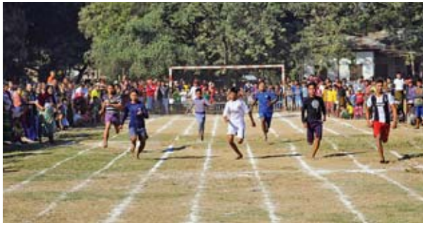
နေပြည်တော် တပ်ကုန်းမြို့ပေါ် (၆)ရပ်ကွက်တွင် (၇၁)နှစ်မြောက် လွတ်လပ်ရေးနေ့အထိမ်းအမှတ် အားကစားပြိုင်ပွဲနှင့် ပျော်ပွဲရွှင်ပွဲများ ကျင်းပစဉ်။ တင်ထွန်းတာ(တပ်ကုန်း)