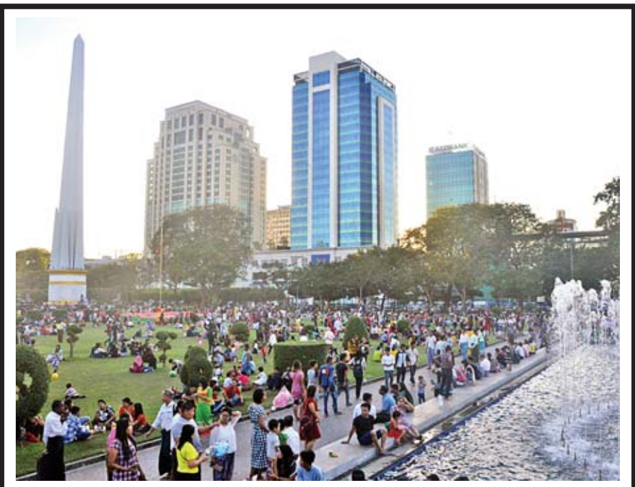
ဇန်နဝါရီ ၄ ရက် (လွတ်လပ်ရေးနေ့)တွင် ရန်ကုန်မြို့ မဟာဗန္ဓုလပန်းခြံ၌ လာရောက် အပန်းဖြေသူများဖြင့် စည်ကားလျက်ရှိသည်ကို တွေ့ရစဉ်။

ဂျပန်-အာဆီယံ ယူ-၁၉ အမျိုးသမီးဖိတ်ခေါ်ပြိုင်ပွဲကို မတ် ၂ ရက်မှ ၆ ရက်အထိ ကျင်းပမည်ဖြစ်ပြီး အိမ်ရှင် ဂျပန်အသင်းနှင့်အတူ မြန်မာ၊ ထိုင်း၊ ဗီယက်နမ်၊ လာအို၊ ကမ္ဘောဒီးယား၊ စာမျက်နှာ ၅ ကော်လံ ၅ သို့ ■