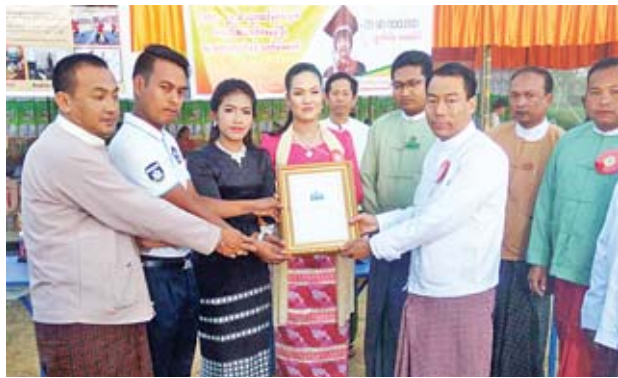
နေပြည်တော် မွေ့သီရိမြို့နယ် တွင် ဇန်နဝါရီ ၄ ရက် နံနက်က လွတ်လပ်ရေးနေ့ အထိမ်းအမှတ် အားကစားပြိုင်ပွဲ ဆုရရှိသူများအား ပြည်သူ့လွှတ်တော်ကိုယ်စားလှယ် ဦးဖြိုးဇေယျာသော်က ဆုချီးမြှင့်စဉ်။ တိုကိုရူပ(မန်းတက္ကသိုလ်)