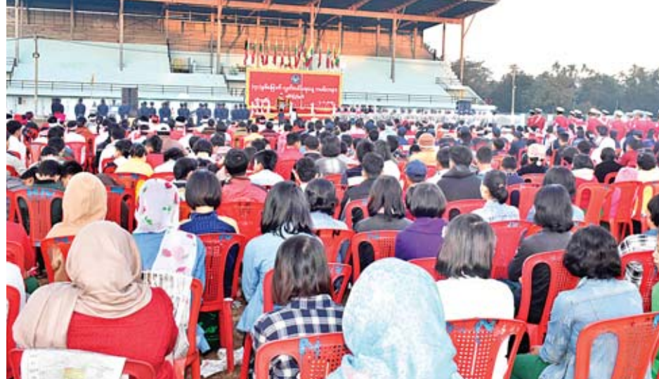
အဆင့်ဌာနဆိုင်ရာများ၊ တိုင်းရင်းသားကိုယ်စားလှယ်များ၊ ဖိတ်ကြားထားသူများက နိုင်ငံတော်အလံအားအလေးပြု ကြသည်။

ထို့နောက် ပြည်နယ်ဝန်ကြီးချုပ်၊ ပြည်နယ်လွှတ်တော် ဥက္ကဋ္ဌ ဦးစံကျော်လှ၊ ပြည်နယ်တရားလွှတ်တော်တရား သူကြီးချုပ် ဦးကျောက်နှင့် ပြည်နယ်အစိုးရအဖွဲ့ဝင်ဝန်ကြီး များ၊ ပြည်နယ်လွှတ်တော်ကိုယ်စားလှယ်များ၊ ခရိုင်၊ မြို့နယ်