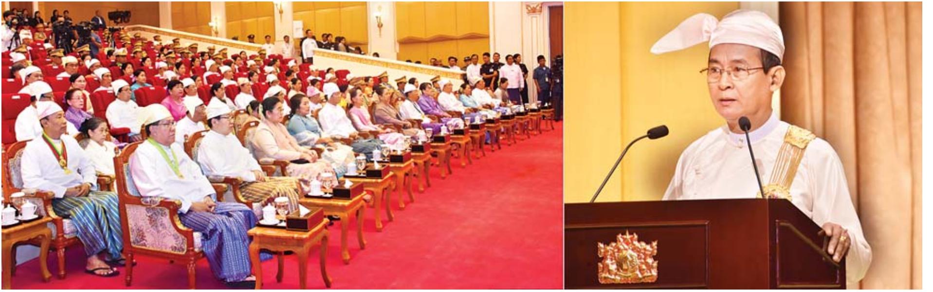
နိုင်ငံတော်သမ္မတ ဦးဝင်းမြင့် ဂုဏ်ထူးဆောင်ဘွဲ့များ ချီးမြှင့်အပ်နှင်းခြင်း အခမ်းအနားတွင် အမှာစကားပြောကြားစဉ်။

ရှေးမှ တပ်မတော်အရာရှိကြီးများနှင့် ၎င်းတို့၏ဇနီးများ၊ လွှတ်တော်ရေးရာကော်မတီဥက္ကဋ္ဌများ၊ ဒုတိယဝန်ကြီးများ၊ လွှတ်တော်ကိုယ်စားလှယ်များနှင့် ဘွဲ့တံဆိပ်ရရှိကြသူများ၏ မိသားစုဝင်များ တက်ရောက်ကြသည်။ အခမ်းအနားတွင် နိုင်ငံတော်သမ္မတက မိန့်ခွန်းပြောကြားရာ၌ ယနေ့အခမ်းအနားသို့ ကြွရောက်လာကြသည့် ဂုဏ်သရေရှိသူကြီးမင်းများနှင့် ဖိတ်ကြားထားသည့် ဧည့်သည်တော်များအားလုံး မင်္ဂလာအပေါင်းနှင့် ပြည့်စုံကြပါစေဟု ဦးစွာနှုတ်ခွန်းဆက်သအပ်ပါကြောင်း။