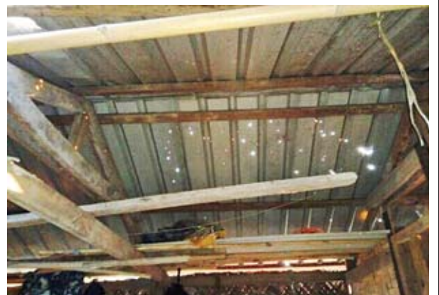
ဇန်နဝါရီ ၄ ရက်တွင် AA သောင်းကျန်းသူအဖွဲ့က ရဲကင်းစခန်း လေးခုအား အကြမ်းဖက်ဝင်ရောက်တိုက်ခိုက်ခဲ့သည့် မှတ်တမ်းဓာတ်ပုံများကို တွေ့ရစဉ်။