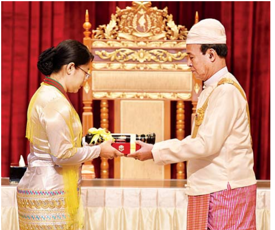
နိုင်ငံတော်သမ္မတ ဦးဝင်းမြင့် သူရဘွဲ့ရရှိသူ ဒုတိယဗိုလ်မှူးကြီးသန်းဇင်ဦး(ကျဆုံး) ကိုယ်စား ဇနီးဖြစ်သူ ဒေါ်ချိုချိုအောင်အား ဂုဏ်ထူးဆောင်ဘွဲ့ ချီးမြှင့်စဉ်။