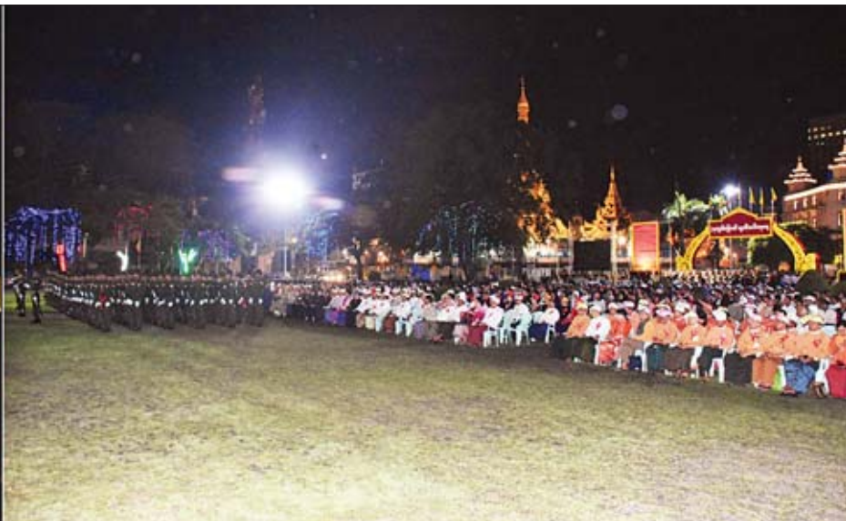
(၇၁)နှစ်မြောက် လွတ်လပ်ရေးနေ့အခမ်းအနားသို့ နိုင်ငံတော်သမ္မတ ဦးဝင်းမြင့်ထံမှ ပေးပို့သည့်သဝဏ်လွှာကို ရန်ကုန်တိုင်းဒေသကြီးဝန်ကြီးချုပ် ဦးမြိုးမင်းသိန်း ဖတ်ကြားစဉ်။