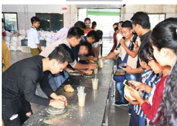
ရန်ကုန်တိုင်းဒေသကြီး ဒဂုံမြို့သစ် (အရှေ့ပိုင်း)မြို့နယ် အရှေ့ဒဂုံစက်မှု ဇုန်ရှိ ထွန်းရွှေဝါတိုင်းရင်းဆေးမိသားစုက ဇန်နဝါရီ ၄ ရက်တွင် အားကစား ပြိုင်ပွဲများ၊ ဝမ်းကစားနည်းများ၊ အဆို၊ အက၊ တေးသရုပ်ဖော်များဖြင့် ပျော်ရွှင် စွာ ကျင်းပစဉ်။ အောင်ထွန်း