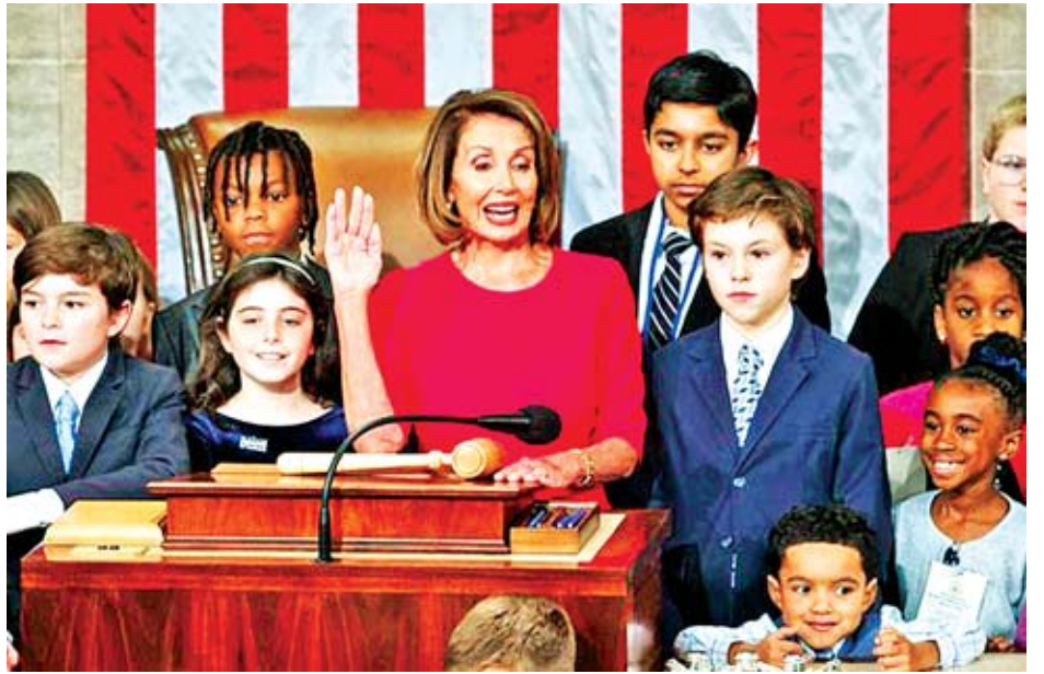
လွှတ်တော်ဥက္ကဋ္ဌ နန်စီပီလိုစီ ကျမ်းသစ္စာပြုစဉ်။