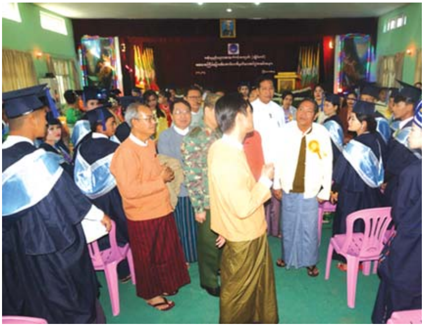
တက်ရောက်ကြသည်။ နည်းပညာအထက်တန်းကျောင်း(လွိုင်ကော်) စတင်ဖွင့်လှစ်သည့်အချိန်မှ ယနေ့အထိသင်တန်း အမှတ်စဉ် (၁) မှ (၈) ထိတွင် သင်တန်းသား သင်တန်းသူ ၆၀၀ ကျော် မွေးထုတ်ပေးနိုင်ခဲ့ပြီ သင်တန်းသားများထဲမှ နည်းပညာတက္ကသိုလ်

လွိုင်ကော် ဇန်နဝါရီ ၃ ပထမအကြိမ် Government Technical High School (GTHS) အောင်လက်မှတ်ပေးအပ်ခြင်း အခမ်းအနားကို ဇန်နဝါရီ ၃ ရက် နံနက် ၉ နာရီက လွိုင်ကော်မြို့ မြို့နယ်ခန်းမ၌ကျင်းပသည်။