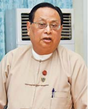
ပြည်ထောင်စုဝန်ကြီး ဦးဝင်းခိုင်