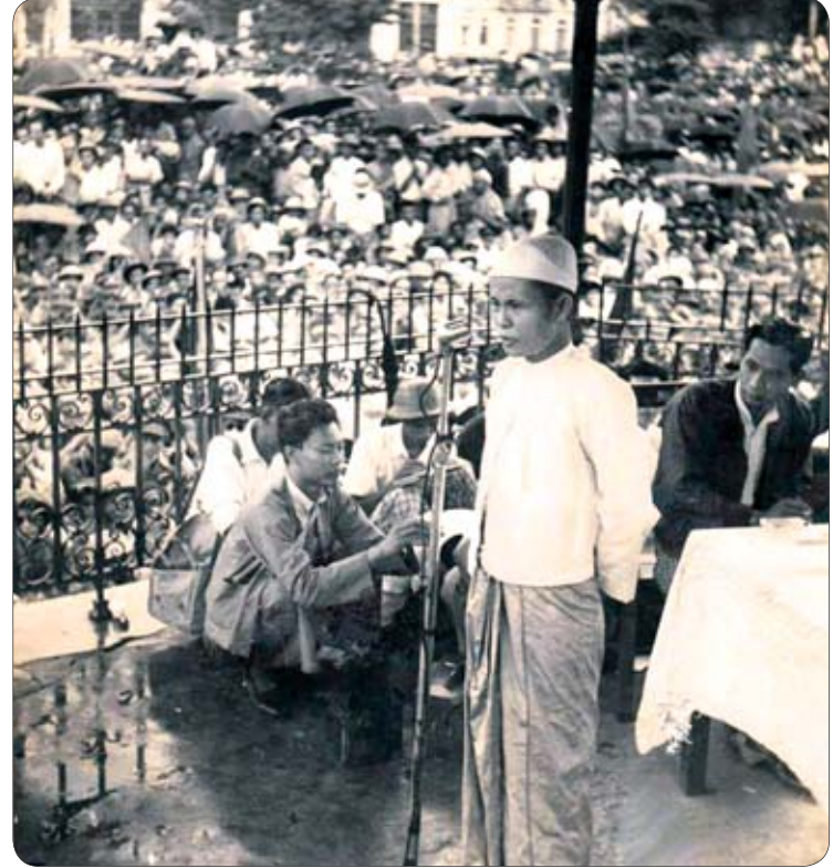
အမျိုးသားခေါင်းဆောင်ကြီး ဗိုလ်ချုပ်အောင်ဆန်း ရန်ကုန်မြို့၊ မဟာဗန္ဓုလပန်းခြံ၌ လွတ်လပ်ရေးအတွက် လူထုကိုစည်းရုံးဟောပြောခဲ့စဉ်။