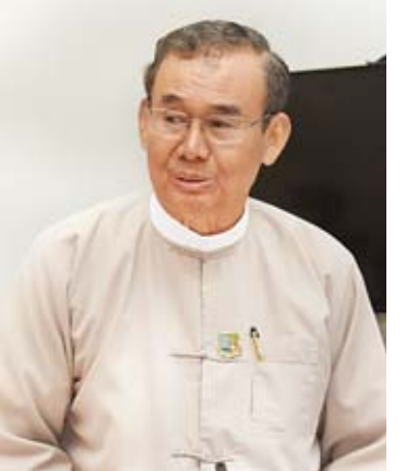
ပြည်ထောင်စုဝန်ကြီး ဦးအုန်းဝင်း