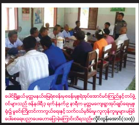
ပေါင်မြို့နယ်မှတ္တမနယ်မြေရေခန်းမှစခန်းမှူးရီအုပ်အောင်မင်းကြည်နှင့်တပ်ဖွဲ့ ဝင်များသည် ဇန်နဝါရီ ၃ ရက် နံနက် ၉ နာရီက မုတ္တမကျေးရွာအုပ်ချုပ်ရေးမှူး ရုံး၌ မှုခင်းကြိုတင်ကာကွယ်ရေးနှင့် သက်ငယ်မှီခိုမှု လူကုန်ကူးမှုများမဖြစ် ပေါ်ပေါက်ပညာပေးဟောပြောခဲ့ကြောင်းသိရသည်။

ကျောက်တန်း ကျေးရွာအဆင့်စီမံခန့်ခွဲမှုသင်တန်းကို ဇန်နဝါရီ ၂ ရက်က ရန်ကုန်တောင်ပိုင်း ခရိုင် ကျောက်တန်းမြို့နယ် ကျိုက္ကမော့ကျေးရွာ အနုပညာပန်းချီသင်တန်း ခန်းမ၌ ဖွင့်လှစ်သည်။