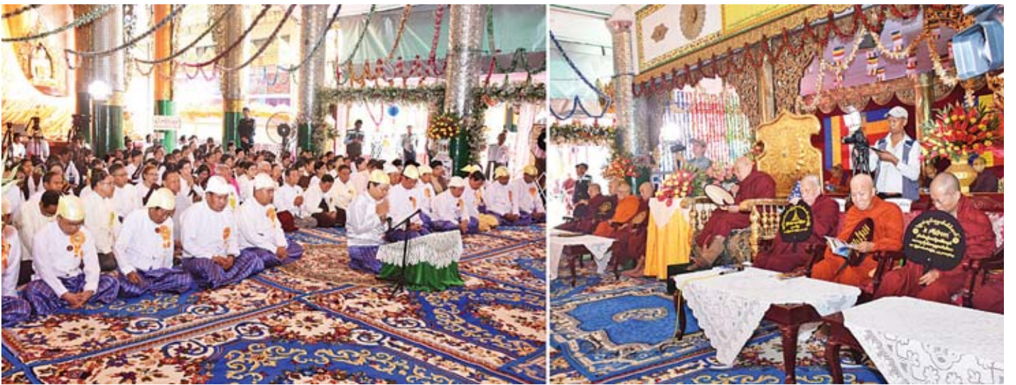
ပြည်ထောင်စုဝန်ကြီး သူရဦးအောင်ကို သာသနာရေးဆိုင်ရာများ လျှောက်ထားစဉ်။

ယင်းနောက် ပြည်ထောင်စုဝန်ကြီး သူရဦးအောင်ကို က သာသနာရေးဆိုင်ရာများ လျှောက်ထားရာတွင် မြန်မာ နိုင်ငံတွင် တိပိဋကဓရ တိပိဋကကောဝိဒ ရှေးချယ်ရေး စာမေးပွဲကြီး နှစ်စဉ် အလေးထားကျင်းပလျက်ရှိရာ (၇၁) ကြိမ်တိုင်ရှိခဲ့ပြီဖြစ်ပါကြောင်း၊ တိပိဋကဓရ တိပိဋကကောဝိဒ ရှေးချယ်ရေးစာမေးပွဲကြီးအပါအဝင် နိုင်ငံတော်အစိုးရက ကျင်းပသည့် ဓမ္မာစရိယစာမေးပွဲ၊ ပါဠိပထမပြန်စာမေးပွဲ၊ နိကာယ်စာမေးပွဲနှင့် စေတီယင်္ဂဏ၊ သက္ကသီလ စာမေးပွဲ တို့ကဲ့သို့သော ပရိယတ္တိစာမေးပွဲများ တည်ရှိနေသမျှကာလ ပတ်လုံး ပရိယတ္တိသာသနာတော် ထွန်းလင်းနေမည်ဖြစ် ကြောင်းကိုလည်း အလေးအနက်ခံယူပါကြောင်း၊ ပရိယတ္တိ သာသနာတော်ထွန်းလင်းနေသမျှ ပဋိပတ္တိသာသနာတော်