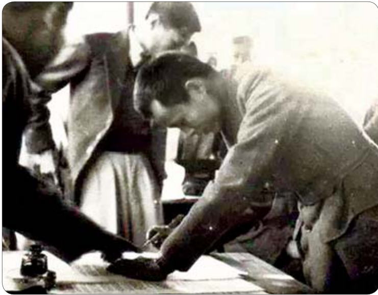
၁၉၄၇ ခုနှစ် ဖေဖော်ဝါရီလ ၁၂ ရက်နေ့က ပင်လုံမြို့တွင် ဗိုလ်ချုပ်အောင်ဆန်း ခေါင်းဆောင်ပြီး တိုင်းရင်းသားခေါင်းဆောင်များပါဝင်သော ပင်လုံစာချုပ်လက်မှတ်ရေးထိုးစဉ်။

သို့နှင့် တိုင်းပြည်၏ အာဏာမတည်တော့ သော ဘုရင်ခံ ဆာဒေါ်မန်စမစ်သည် ဝမ်းနာ ရောဂါစွဲကပ်ပြီးလျှင် ဘိလပ်သို့ပြန်လေသည်။ ဗိုလ်ချုပ်အောင်ဆန်းနှင့် ဖဆပလအဖွဲ့ချုပ်ကြီး နှင့် သဘောချင်းမျှနိုင်သော ဗြိတိသျှဗိုလ်ချုပ် ဖြစ်ခဲ့သည့်ဘုရင်ခံ ဆာဟူးဘတ်ရန်(စ) သည် ရန်ကုန်မြို့သို့ နောက်ဆုံး