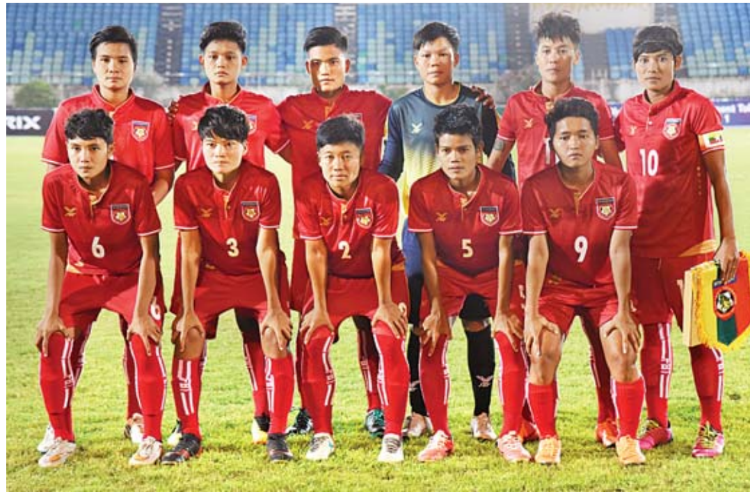
အိတ်ပစ် ပထမအဆင့်ခြေစမ်းပွဲယှဉ်ပြိုင်ခဲ့သည့် မြန်မာအမျိုးသမီးအသင်း။

ရန်ကုန် ဇန်နဝါရီ ၃ ၂၀၂၀ တိုက်အိတ်ပစ်ခြေစမ်းပွဲ ဒုတိယအဆင့်အတွက် လေ့ကျင့်နေသည့် မြန်မာလက်ရွေးစင်အမျိုးသမီးအသင်းသည် ထိုင်းလက်ရွေးစင်အမျိုးသမီးအသင်းနှင့် ခြေစမ်းပွဲယှဉ်ပြိုင်ကစားမည်ဖြစ်သည်။ စာမျက်နှာ ၁၃ ကော်လံ ၄ သို့ ○