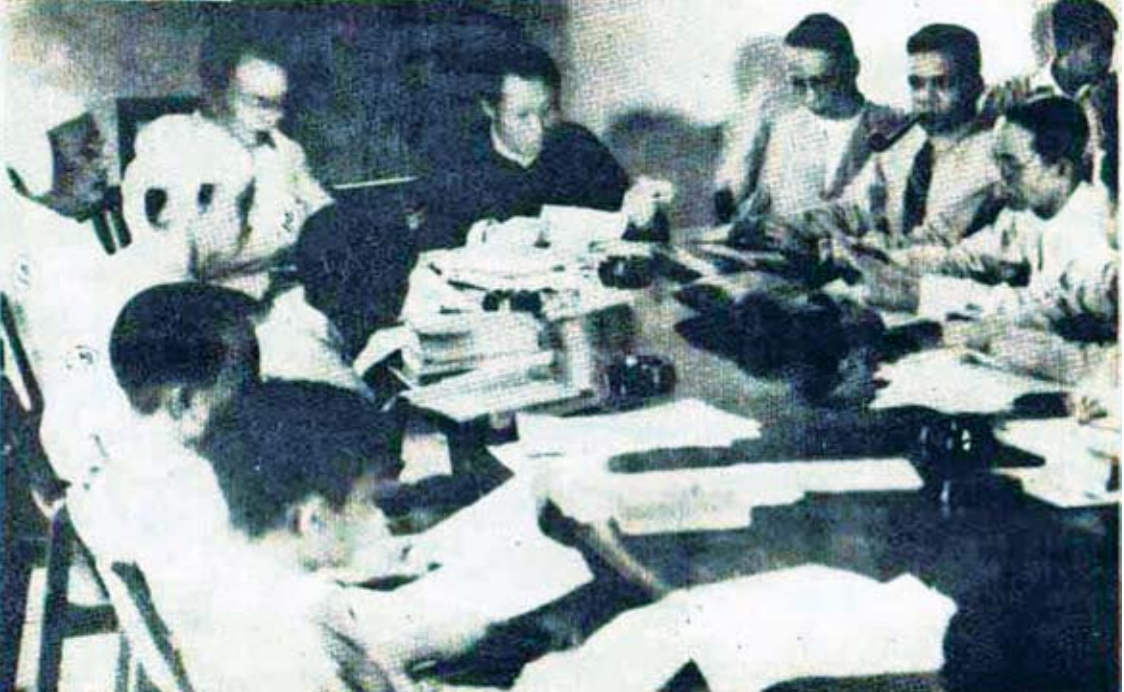
ဖွဲ့စည်းပုံအခြေခံဥပဒေရေးဆွဲရေးကော်မတီ အစည်းအဝေးပြုလုပ်စဉ်။ [၁] ဦးစိုးဦးဘချို၊ [၂] ဆာမောင်ကြီး၊ [၃] ဦးချန်ထွန်း၊ [၄] ဗိုလ်ချုပ်အောင်ဆန်း၊ [၅] ဦးစိန် (လွှတ်တော်အတွင်းဝန်)၊ [၆] ဦးဖေခင်(ဆေးတံဖြင့်)၊ ဓာတ်ပုံ - မဟာသရေစည်သူ ဦးဖေခင်(နိုင်ငံ့ဂုဏ်ရည်ပထမဆင့်)၏ ကိုယ်တွေ့ပင်လုံစာအုပ်

၁၉၄၈ ခုနှစ် ဇန်နဝါရီလ ၄ ရက်နေ့ နံနက် ၄ နာရီ မိနစ် ၂၀ အချိန်တွင် ရန်ကုန်မြို့နှင့် လန်ဒန်မြို့ တစ်ပြိုင်နက် လွတ်လပ်ရေး ကြေညာသည်။ ပြည်ထောင်စု မြန်မာနိုင်ငံအလံတော်လွှင့်ထူပြီး ဗြိတိသျှအစိုးရ၏ ယူနီယံဂျက် အလံကို ချသည်။ မြန်မာရာဇဝင် သမိုင်းမော်ကွန်းတင်ခဲ့သည်။ နှစ်တစ်ရာကျော် ဗြိတိသျှ ယူနီယံဂျက်အလံအောက်မှ ပြည်ထောင်စုမြန်မာနိုင်ငံ အလံတော်အောက်သို့ ရောက်သည်။ လုံးဝလွတ်လပ် သော မြန်မာနိုင်ငံတော် ဖြစ်လာခဲ့သည်။