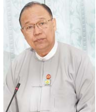
ပြည်ထောင်စုဝန်ကြီး ဦးသန့်စင်မောင်

ပေးဝေမှု၊ ရေကြောင်းသွားလာရေး လုံခြုံချောမွေ့စေမှု၊ ကမ်းပြိုကမ်းစား ကာကွယ်မှု၊ ရေထုညစ်ညမ်းမှု ထိန်းချုပ်မှုတို့အပြင် ရေကာဏ္ဍဖွံ့ဖြိုးတိုးတက်ရေး၊ ရေအရင်းအမြစ်ဘက်စုံစီမံခန့်ခွဲရေးအတွက် သက်ဆိုင်ရာဝန်ကြီးဌာန အဖွဲ့အစည်းများ၊ ပြည်နယ်နှင့် တိုင်းဒေသကြီးအစိုးရအဖွဲ့များအကြား ဆက်လက်ပေါင်းစပ်ညှိနှိုင်းဆောင်ရွက်သွားကြရမည်ဖြစ်ပါကြောင်း။ အမျိုးသားအဆင့် ရေအရင်းအမြစ်ကော်မတီကို ဖွဲ့စည်းပြီးနောက် နှစ်စဉ် မတ်လ ၂၂ ရက်တွင် ကျရောက်သည့် ကမ္ဘာ့ရေနေ့ (World Water Day) အထိမ်းအမှတ် အခမ်းအနားများကို ကော်မတီကကြီးမှူးပြီး ရေနှင့်သက်ဆိုင်သည့် ဝန်ကြီးဌာနအဖွဲ့အစည်းများ၊ အစိုးရမဟုတ်သည့် ပြည်တွင်း၊ ပြည်ပ အဖွဲ့အစည်းများ၏ ပူးပေါင်းပါဝင်မှုနှင့် ကျင်းပလျက်ရှိပါကြောင်း၊ ကမ္ဘာ့ရေနေ့ ၂၀၁၉