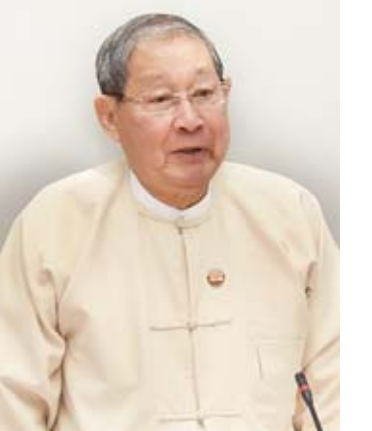
ပြည်ထောင်စုဝန်ကြီး ဦးစိုးဝင်း

အစည်းအဝေး (၃/၂၀၁၈)တွင် မြို့များ၌ ရေကြီးရေလျှံမှုများ မဖြစ်စေရေးအတွက် ရေမြောင်းများ ပိတ်ဆို့မှုမရှိစေရန်နှင့် ပြည်သူများ စနစ်တကျ အမှိုက်စွန့်ပစ်စေရေးအတွက် စည်းကမ်းချမှတ်ဆောင်ရွက်ရန်၊ စစ်တောင်းမြစ်၊ သံလွင်မြစ်၊ ပဲခူးမြစ်၊ ရွှေကျင်မြစ်၊ ဘီးလင်းမြစ်၊ တနင်္သာရီမြစ်နှင့် ဒေါင်းမြို့ချောင်းတို့တွင် ရေကြီးရေလျှံမှုလျော့ပါးရေးအစီအမံများ အကောင်အထည်ဖော်ဆောင်ရွက်ရန်၊ ဆည်များ၏ ကြံ့ခိုင်မှုနှင့် ပတ်သက်ပြီး စစ်ဆေးရန်၊ ဆည်များ၏ အောက်ဘက်တွင်နေထိုင်သည့် ပြည်သူများကို အသိပညာပေးရန်နှင့် လိုအပ်သည့် သတိပေးချက်များ ထုတ်ပြန်ရန်၊ တနင်္သာရီမြို့နှင့် ဘားအံမြို့တွင်ရှိသည့် တာပေါင်များကို စစ်ဆေးဆောင်ရွက်ရန်၊ ကားလမ်း၊ ရထားလမ်းများနှင့် ဆက်စပ်နေရာများတွင် ရေထွက်ပေါက်များနှင့် ရေတံခါးများ တပ်ဆင်ရန် ဆုံးဖြတ်ချက်များ ချမှတ်ခဲ့ပါကြောင်း၊ ဆုံးဖြတ်ချက်များနှင့်ပတ်သက်ပြီး အများစုကို ကြိုးစားအကောင်အထည်ဖော် ဆောင်ရွက်ခဲ့ပြီးဖြစ်ပါကြောင်း။