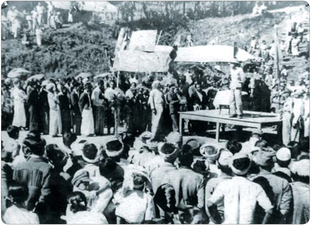
ဗိုလ်ချုပ်အောင်ဆန်းသည် လွတ်လပ်ရေးအတွက် တောင်တန်းဒေသများသို့ သွားရောက်၍ လှည့်လည်ဟောပြောခဲ့စဉ်။