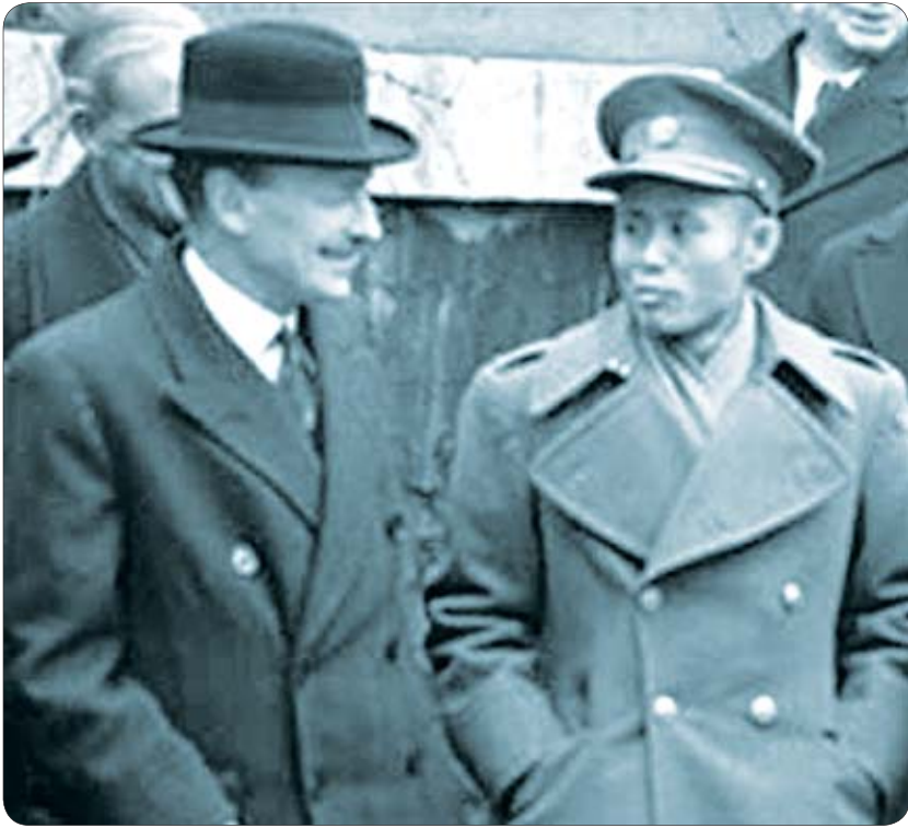
ဗိုလ်ချုပ်အောင်ဆန်းနှင့် ဗြိတိသျှဝန်ကြီးချုပ် မစ္စတာ အက်တလီတို့ ၁၉၄၇ ခုနှစ် ဇန်နဝါရီလက လန်ဒန်မြို့၌ တွေ့ဆုံစဉ်။