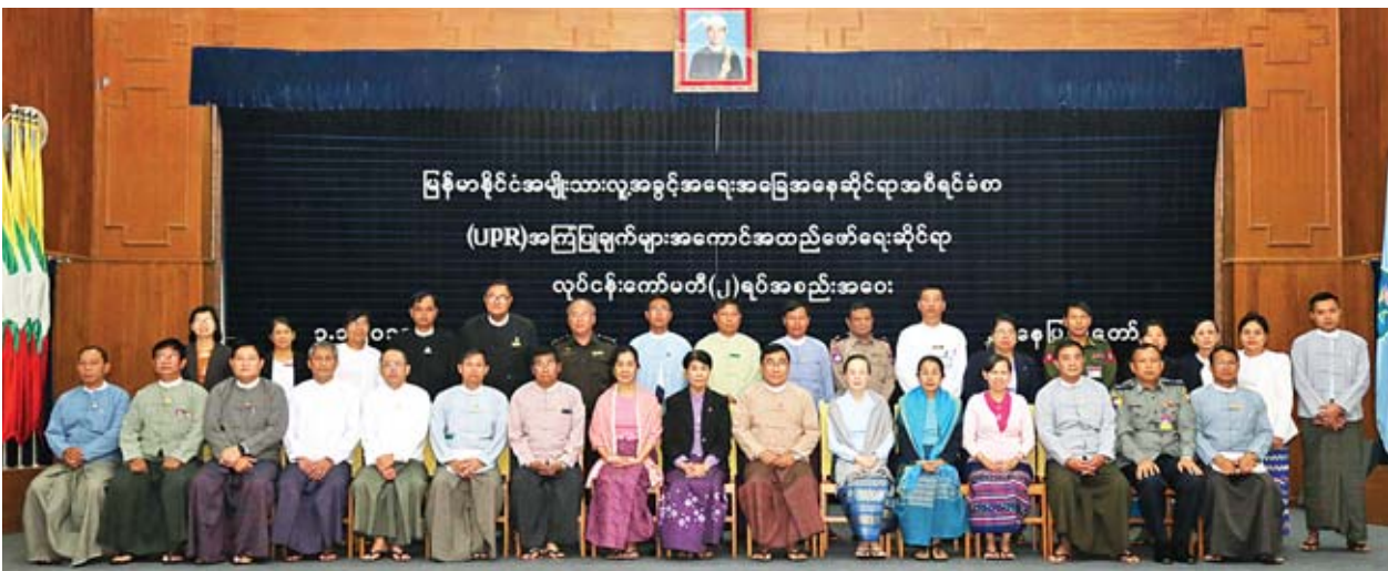
ပြည်ထောင်စုဝန်ကြီး ဒေါက်တာဝင်းမြတ်အေး၊ မြန်မာနိုင်ငံလူ့အခွင့်အရေးဆိုင်ရာ အစီရင်ခံစာ အကြံပြုချက်များ အကောင်အထည်ဖော်ရေးလုပ်ငန်း ကော်မတီနှစ်ရပ် အစည်းအဝေးသို့ တက်ရောက်လာကြသူများနှင့်အတူ မှတ်တမ်းတင်ဓာတ်ပုံရိုက်စဉ်။

ကုလသမဂ္ဂအဖွဲ့ဝင်နိုင်ငံပေါင်း ၉၃ နိုင်ငံမှ အကြံပြုချက်တိုက်တွန်းချက်များ အနက် မိမိတို့နိုင်ငံက အကြံပြုချက် ၁၆၆ ချက်ကို လက်ခံခဲ့ပြီး ကမ္ဘာ ၁၂ ရပ်ခွဲ၌ လုပ်ငန်းကော်မတီ ၁၂ ခု ဖွဲ့စည်းထားရှိပါကြောင်း၊ မိမိတို့ဝန်ကြီးဌာန အနေဖြင့် ကျား/မ တန်းတူရည်တူရှိမှုမြှင့်တင်ရေးနှင့် ထိခိုက်ခံစားလွယ်သော အုပ်စုများ ကာကွယ်ရေးဆိုင်ရာ လုပ်ငန်းကော်မတီနှင့် ခွဲခြားမှုမပြုရေးဆိုင်ရာ လုပ်ငန်းကော်မတီနှစ်ရပ်ကို ဦးဆောင်ကာ အကောင်အထည်ဖော်ဆောင်ရွက် ရမည်ဖြစ်ပါကြောင်း၊ ကော်မတီနှစ်ရပ်စလုံးတွင် အကြံပြုချက် ၁၅ ချက်စီ