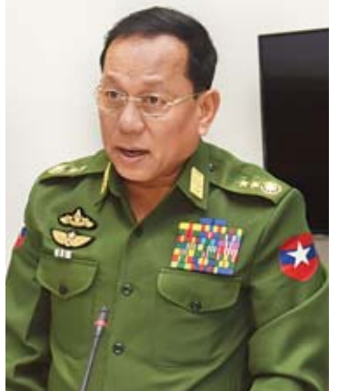
ပြည်ထောင်စုဝန်ကြီး ဒုတိယဗိုလ်ချုပ်ကြီးရဲအောင်