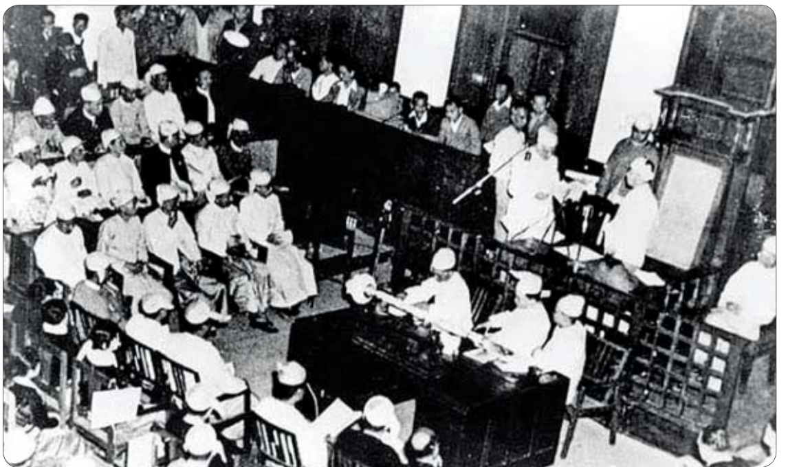
ပထမအကြိမ် လွတ်လပ်ရေးနေ့ အခမ်းအနားအပြီးတွင် မြန်မာအစိုးရအဖွဲ့သစ် ကတိသစ္စာခံယူပွဲပြုလုပ်စဉ်။

ဗိုလ်ချုပ်အောင်ဆန်းသည် မြန်မာအမျိုးသားတို့၏ ဇွဲ၊ သတ္တိ၊ ဆန္ဒတို့ကိုပေါင်းစပ်၍ အသက်သွင်းထားသော ပုဂ္ဂိုလ်ကဲ့သို့ ဖြစ်သည်။ ဖဆပလသည်လည်း ထိုနည်းတူစွာပင်ဖြစ်သည်။ မြန်မာတို့သည် ဘာသာလူမျိုးမခွဲခြားဘဲ ညီညွတ်ခဲ့သည်။