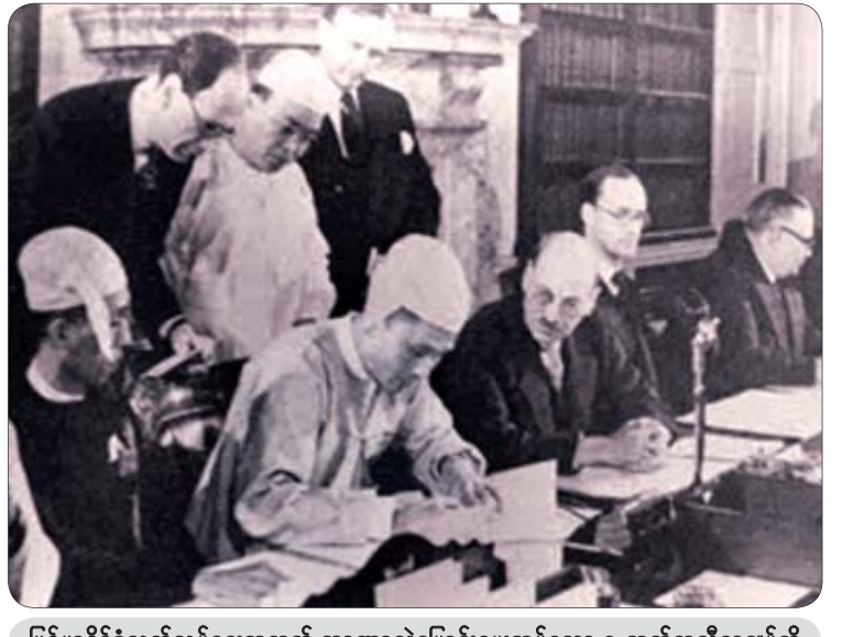
မြန်မာနိုင်ငံလွတ်လပ်ရေးအတွက် အာဏာလွှဲပြောင်းပေးအပ်သော နု-အက်တလီစာချုပ်ကို မြန်မာနိုင်ငံ ယာယီအစိုးရဝန်ကြီးချုပ် သခင်နုနှင့် ဗြိတိသျှဝန်ကြီးချုပ် မစ္စတာ အက်တလီတို့ ၁၉၄၇ ခုနှစ် အောက်တိုဘာလ ၁၇ ရက်တွင် လန်ဒန်မြို့၌ လက်မှတ်ရေးထိုးကြစဉ်။

နန်းသိမ်းဘုရင်ကဲ့သို့ ရောက်လာသည်။ ဗိုလ်ချုပ်အောင်ဆန်းနှင့် ဖဆပလအဖွဲ့ချုပ်ကြီး က တစ်နှစ်အတွင်း လွတ်လပ်ရေးရအောင် ကြိုးပမ်းကြသည်။ ထိုကာလတွင် ကွန်မြူနစ်၊ ဆိုရှယ်လစ်၊ ကြားနေသူများဖြင့် ကွဲနေကြသည် မှာ မှန်သည်။ သို့ရာတွင် အမျိုးသားရေးတွင် မကွဲ။ ဗိုလ်ချုပ်အောင်ဆန်းအပေါ်ထားသည့် သစ္စာမှာ မကွဲ။