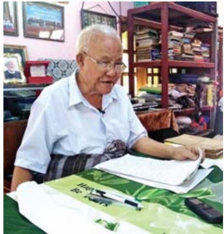
ဟံသာဝတီ ဦးအုန်းကြိုင်

အချုပ်အခြာအာဏာပိုင် လုံးဝလွတ်လပ်တဲ့နိုင်ငံလို့ ပြောခြင်းဟာ ဗြိတိသျှကိုလိုနီဘဝကနေ လွတ်လပ်ရေး တောင်းဆိုကြတဲ့အခါ ကျွန်တော်တို့ရဲ့ အိမ်နီးချင်းဖြစ်တဲ့ အိန္ဒိယနိုင်ငံက ဒီမိုကရေစီ စတေးတာပဲ တစ်နှစ်ယူပါတယ်။ ဗြိတိသျှရဲ့ ဩဇာခံအဖြစ်နဲ့ပါ။ ဝိုင်းရံပေးဆွဲဆန်းတဲ့ လုံးဝ လွတ်လပ်တဲ့၊ လွတ်လပ်မှုအပြည့်ရဲ့ နိုင်ငံပဲယူမယ်။ ဘာမှမယူဘူးဆိုပြီး လုပ်ခဲ့တာပါ။