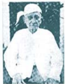
ဒေါက်တာဘရင်

ထင်ရှားသောခေါင်းဆောင်များ ဖြစ်လာကြသည်။ ထိုခေတ်ကာလက ဒို့ဗမာအစည်းအရုံးသည် လွတ်လပ်ရေးကြိုးပမ်းမှုတွင် အရေးပါသော အဖွဲ့အစည်းဖြစ်သည်။