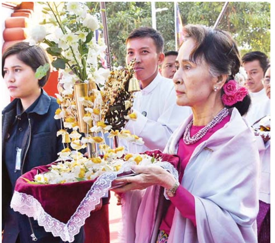
နိုင်ငံတော်သမ္မတ ဦးဝင်းမြင့်နှင့် ဇနီး ဒေါ်ချိုချိုတို့ ရတနာစိန်ဖူးတော်ကို ပင့်ဆောင်၍ တောင်းဆုရ “ဝ” စေတီ နောင်တော်ဘုရားအား လက်ယာရစ် လှည့်လည်ကာ မင်္ဂလာရထားပျံမဏ္ဍပ်သို့ ပို့ဆောင်ပူဇော်ကြစဉ်။