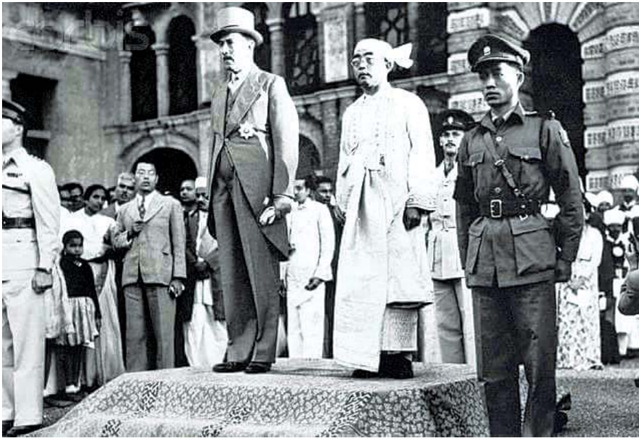
၁၉၄၈ ခုနှစ် ဇန်နဝါရီလ ၄ ရက်နေ့ လွတ်လပ်ရေးနေ့အခမ်းအနားတွင်တွေ့ရသည့် ဘုရင်ခံစာပေးဆွဲရန်နှင့် မြန်မာနိုင်ငံ၏ ပထမဆုံး ယာယီသမ္မတစစ်ရွှေထိုက်တို့ မြန်မာနိုင်ငံအလံအား အလေးပြုစဉ်။

ကျွန်တော်တို့လွတ်လပ်ရေးရတာ အချုပ်အခြာ အာဏာပိုင် လုံးဝလွတ်လပ်တဲ့ နိုင်ငံတော်အဖြစ်ရပါတယ်။