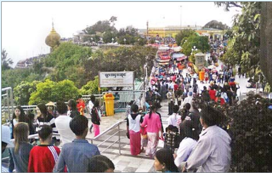
ကျိုက်ထီးရိုးဆံတော်ရှင်စေတီတော်တွင် ဘုရားဖူးပြည်သူများဖြင့် စည်ကားနေသည်ကို တွေ့ရစဉ်။