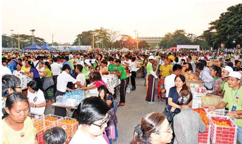
တရားတော်နာလာရောက်ကြသည့် ဓမ္မပိတ်ဆွဲများအား အလှူရှင်များက အာဟာရဒါနများ လှူဒါန်းနေကြစဉ်။