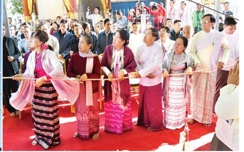
နိုင်ငံတော်သမ္မတ ဦးဝင်းမြင့်၏ဇနီး ဒေါ်ချိုချို၊ နိုင်ငံတော်၏အတိုင်ပင်ခံပုဂ္ဂိုလ် ဒေါ်အောင်ဆန်းစုကြည်၊ ဒုတိယသမ္မတ ဦးမြင့်ဆွေနှင့် ဇနီး ဒေါ်ခင်သက်ဌေးနှင့် အခမ်းအနားသို့ တက်ရောက်လာကြသူများက ရွှေထီးတော်ဘုံဆင့်များ၊ ငှက်မြတ်နားတော်နှင့် ရတနာစိန်ပူးတော်တို့ကို မင်္ဂလာရထားယုံဖြင့် ပင့်ဆောင်ပူဇော်ကြစဉ်။

»» စာမျက်နှာ ၃ မှ တစ်ပိုင်းပိုင်းရသည်။ ရေစင်ရေသန့်များဖြင့် ပတ်ဖျန်းသန့်စင်သွန်းလောင်းပူဇော်ကြသည်။ နိုင်ငံတော်သမ္မတ ဦးဝင်းမြင့်နှင့်ဇနီးဒေါ်ချိုချို၊ နိုင်ငံတော်၏အတိုင်ပင်ခံပုဂ္ဂိုလ် ဒေါ်အောင်ဆန်းစုကြည်တို့သည် သာသနာ့တံခွန်တိုင်ရှိ ပုဗ္ဗရုပ်ပွားတော်မြတ်အား အမွှေးနံ့သာရည်များ ပတ်ဖျန်းပူဇော်ကြပြီး ရတနာရွှေမောင်းတော်နှင့် ရတနာခေါင်းလောင်းတော်တို့ကို တီးခတ်ပြီး အမွှေးနံ့သာ