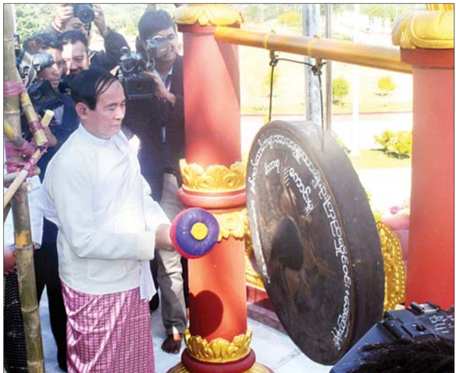
နိုင်ငံတော်သမ္မတ ဦးဝင်းမြင့် ရတနာရွှေမောင်းတော်ကို တီးခတ်စဉ်။