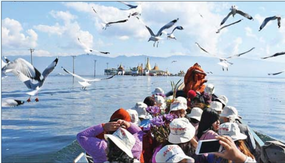
အင်းတော်ကြီးကန်အတွင်းရှိ ရွှေမညူရေလယ်ဘုရားသို့ လာရောက်ဖူးမြော်ကြသူများကို တွေ့ရစဉ်။