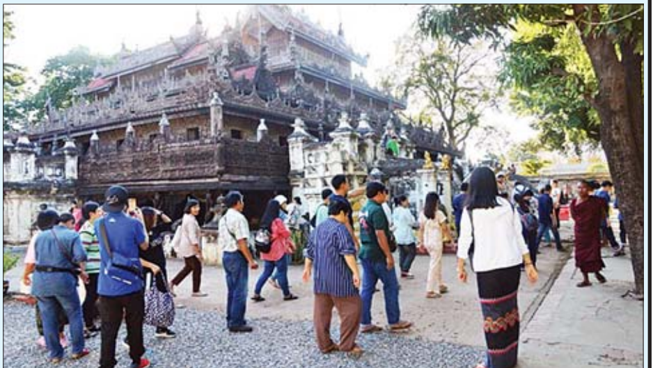
မန္တလေးမြို့ရှိ ရွှေနန်းတော်ကျောင်း(ရွှေကျောင်း)သို့ လာရောက်လေ့လာကြသူများကို တွေ့ရစဉ်။