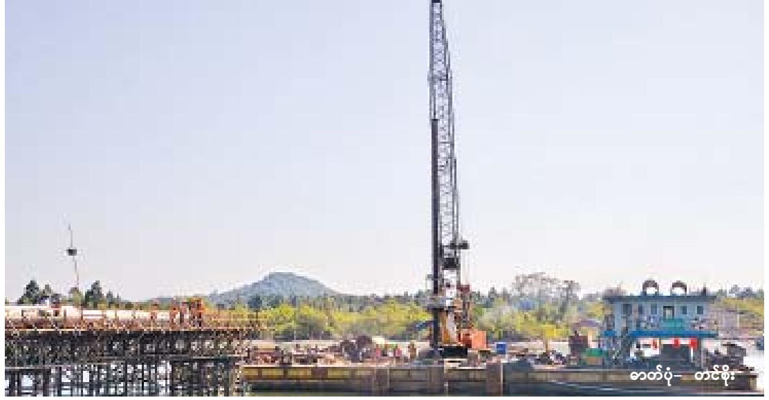
ဝတ်ပုံ တင်ပို့