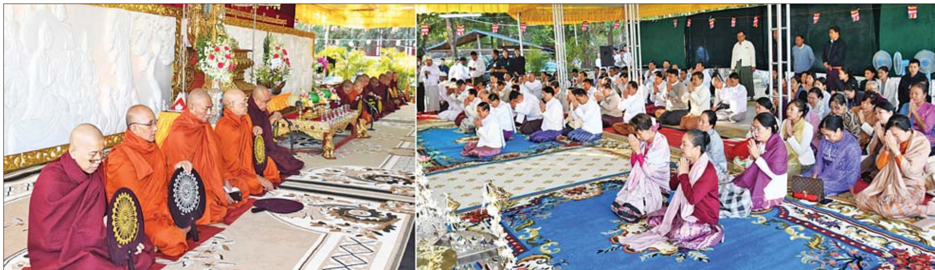
နိုင်ငံတော်သမ္မတ ဦးဝင်းမြင့်နှင့် ဇနီး ဒေါ်ချိုချို၊ နိုင်ငံတော်၏အတိုင်ပင်ခံပုဂ္ဂိုလ် ဒေါ်အောင်ဆန်းစုကြည်နှင့် ဧည့်ပရိသတ်များက ဆရာတော်ထံမှ ကိုးပါးသီလ ခံယူဆောက်တည်ကြစဉ်။

★ ရှေ့ဖုံးမှ ကိုးပါးသီလတော်မူသည့် ဗုဒ္ဓရုပ်ပွားတော်မြတ်အား ဆွမ်း၊ ရေချမ်း၊ ပန်းနှင့် ဆီမီးများ ကပ်လှူပူဇော်ကြပြီး အခမ်းအနားသို့ တက်ရောက်လာကြသူများက နမောတဿ သုံးကြိမ်ရွတ်ဆို၍ တောင်းဆုရ “ဝ”စေတီ နောင်တော်ဘုရား ရွှေထီးတော်တင်နှင့် ဗုဒ္ဓါဘိသေက အနောကဇာတင် မဟာမင်္ဂလာအခမ်းအနားကို ဖွင့်လှစ်ကြပြီး နေပြည်တော်တိုင်း သံဃနာယကအဖွဲ့ဥက္ကဋ္ဌ တပ်ကုန်းမြို့ ရွှေအင်းရိပ်သာ ပရိယတ္တိစာသင်တိုက် တိုက်အုပ်ဆရာတော် အဂ္ဂမဟာဂန္ထဝါစကပဏ္ဍိတ ဘဒ္ဒန္တပညာသာမိထံမှ ကိုးပါးသီလခံယူဆောက်တည်ကြကာ ဥပါသကာများက ပရိတ်ပန်း၊ ပရိတ်ရေ၊ ပရိတ်ချည်နှင့် ပရိတ်သံများကို ဆရာတော်၊ သံဃာတော်များထံ ဆက်ကပ်လှူဒါန်းကြသည်။