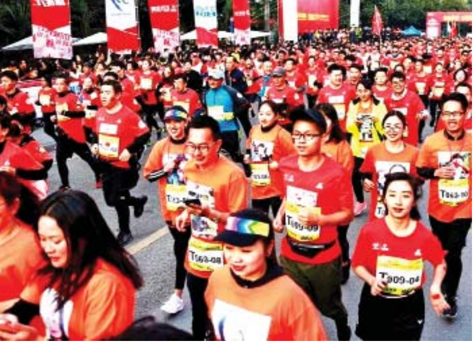
မြန်မာ-တရုတ် ချစ်ကြည်ရေး နယ်စပ်ဖြတ်ကျော်မာရသွန်ပြိုင်ပွဲ ကျင်းပစဉ်။

အဆိုပါ နယ်စပ်ဖြတ်ကျော်မာရသွန်ပြိုင်ပွဲကို ရွှေလီမြို့မှစတင်ကာ ရွှေနန်းတော်ဂိတ် မူဆယ်ပြေးလမ်းကြောင်း အတိုင်း ဒီဇင်ဘာ ၃၁ ရက် နံနက်ပိုင်းက စတင်တာလွှတ်ရာ မြန်မာဘက်မှ မာရသွန်ပြိုင်ပွဲတွင် ၄၇ ဦး၊ တာလတ် မာရသွန်ပြိုင်ပွဲတွင် ၅၉ ဦး၊ တာတိုမာရသွန်ပြိုင်ပွဲတွင် ၄၉၀ စာရင်းပေးထားပြီး ပြိုင်ပွဲတစ်ခုလုံးတွင် တရုတ်-မြန်မာ နှစ်နိုင်ငံမှ ပြိုင်ပွဲဝင်ဦးရေ စုစုပေါင်း ၆၉၀၅ ဦး ပါဝင်ယှဉ်ပြိုင်ကြသည်။ စာမျက်နှာ ၁၃ ကော်လံ ၄ သို့ ✧