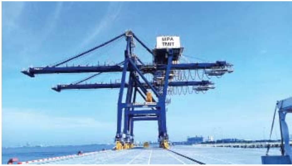
ရာနုန်းပြည်ဆောင်ရွက်ပြီးစီးသွားသော နိုင်ငံတကာအဆင့်မီ အထွေထွေကုန်စည်နှင့် ကုန်သေတ္တာ တင်/ချ ဆိပ်ခံတံတားကြီးကို တွေ့ရစဉ်။