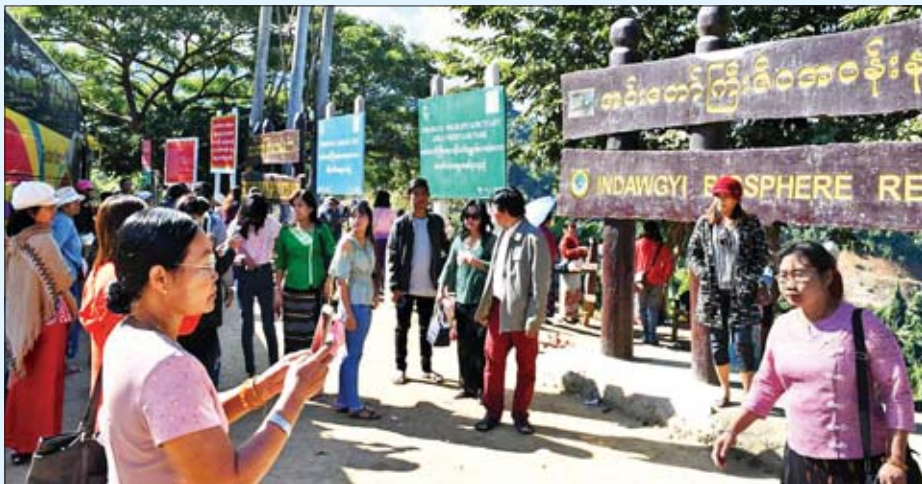
ကရင်ပြည်နယ် မိုးညှင်းမြို့နယ် အင်းတော်ကြီး ဇီဝအဝန်းနယ်မြေသို့ လာရောက်ကြသူများဖြင့် စည်ကားနေသည်ကို ဇန်နဝါရီ ၁ ရက်က တွေ့ရစဉ်။