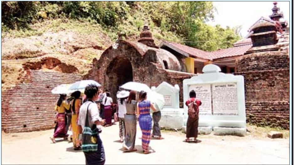
မြောက်ဦးမြို့ သျှစ်သောင်းပုထိုးတော်ကြီးသို့ လာရောက်လေ့လာကြသူများကို တွေ့ရစဉ်။