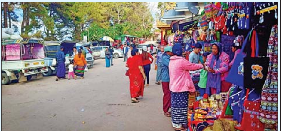
နှစ်သစ်ကူးရိုးပိတ်ရက်တွင် ကလေးမြို့သို့ လာရောက်လည်ပတ်ကြသူများကို တွေ့ရစဉ်။