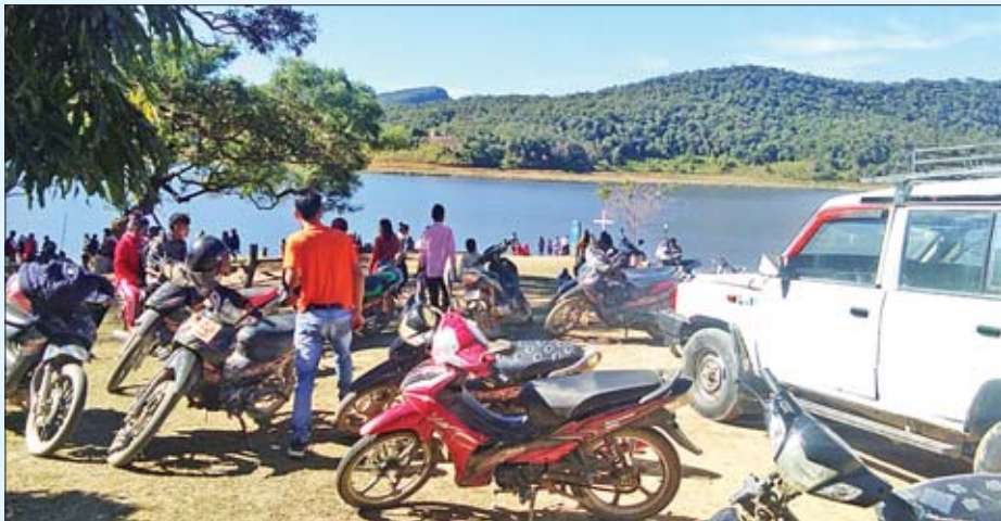
ချင်းပြည်နယ်ရှိ အသည်းနှလုံးပုံသဏ္ဍာန် ရိပ်ရေကန်သို့ လာရောက်လည်ပတ်ကြသူများကို တွေ့ရစဉ်။