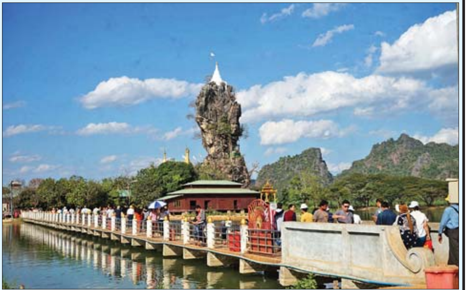
ကရင်ပြည်နယ် ဘားအံမြို့နယ်ရှိ ကြောင့်ကပ်လာဘ်(ကျောက်ကလပ်)စေတီတော်သို့ လာရောက်ဖူးမြော်ကြသူများကို တွေ့ရစဉ်။