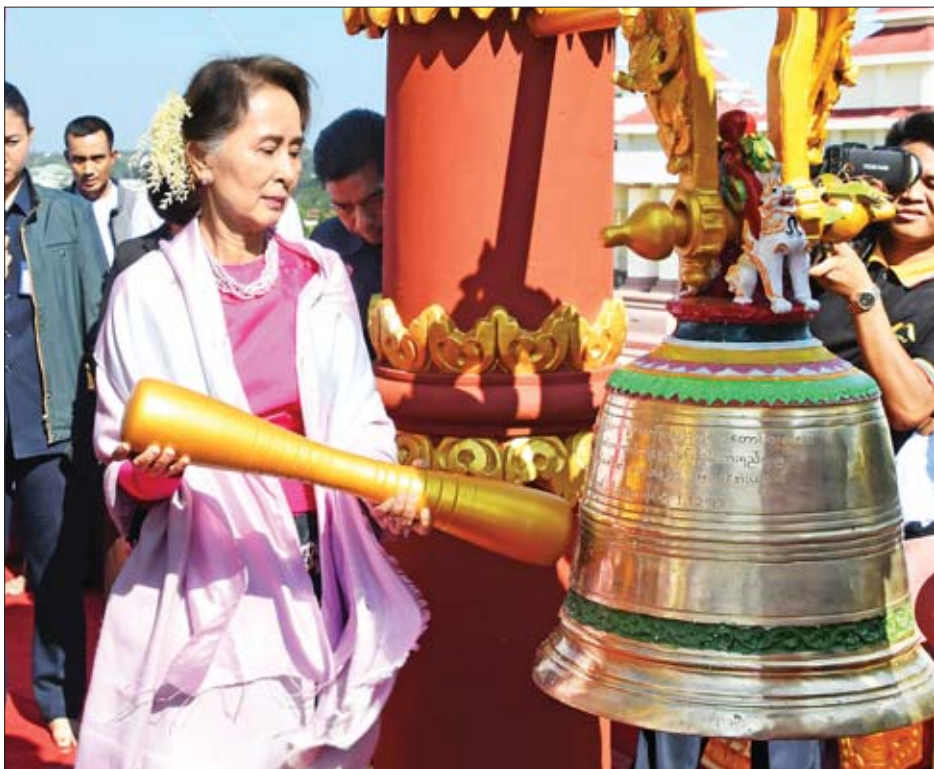
နိုင်ငံတော်၏အတိုင်ပင်ခံပုဂ္ဂိုလ် ဒေါ်အောင်ဆန်းစုကြည် ရတနာခေါင်းလောင်းတော်ကို တီးခတ်စဉ်။