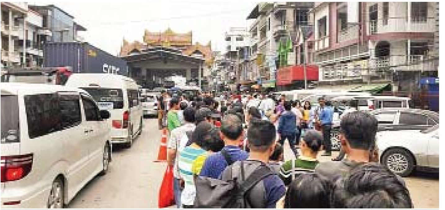
နှစ်သစ်ကူးရုံးပိတ်ရက်တွင် မြန်မာ-ထိုင်းနယ်စပ် မြဝတီမြို့သို့ လာရောက်လည်ပတ်သူများဖြင့် စည်ကားနေစဉ်။

မြန်မာနိုင်ငံအနှံ့အပြားက လာရောက်လည်ပတ် ကြသူများတွင် မိသားစုအလိုက် လာရောက်လည်ပတ်သူများ ရှိသလို စာမျက်နှာ ၁၃ ကော်လံ ၄ သို့ ○