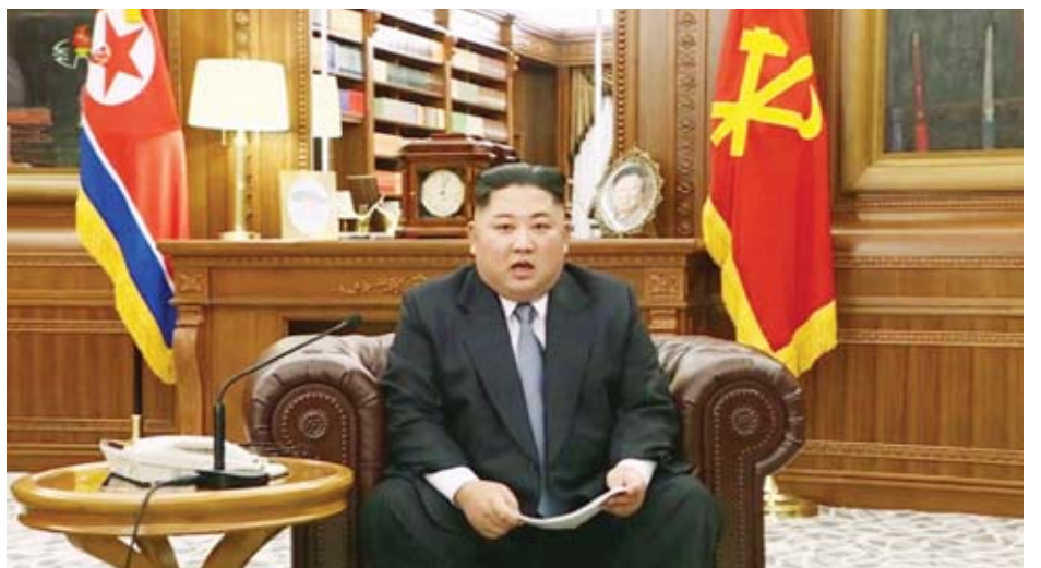
ဖွဲ့စည်းပေးရန် ဆန္ဒရှိပါသည်ဟု ခေါင်းဆောင်ကင်ဂျုံအန်က တောင်ကိုရီးယားနှစ်နိုင်ငံ ပူးတွဲစစ်ရေးလေ့ကျင့်မှုကို ရပ်တန့်ရန် တိုက်တွန်းပြောကြားခဲ့ကြောင်း သိရသည်။

ကိုရီးယားကျွန်းဆွယ်ဒေသတွင်း တည်ငြိမ်အေးချမ်း မှုရရှိရန် သက်ဆိုင်သည့်နိုင်ငံများနှင့် ဆွေးနွေးပွဲ