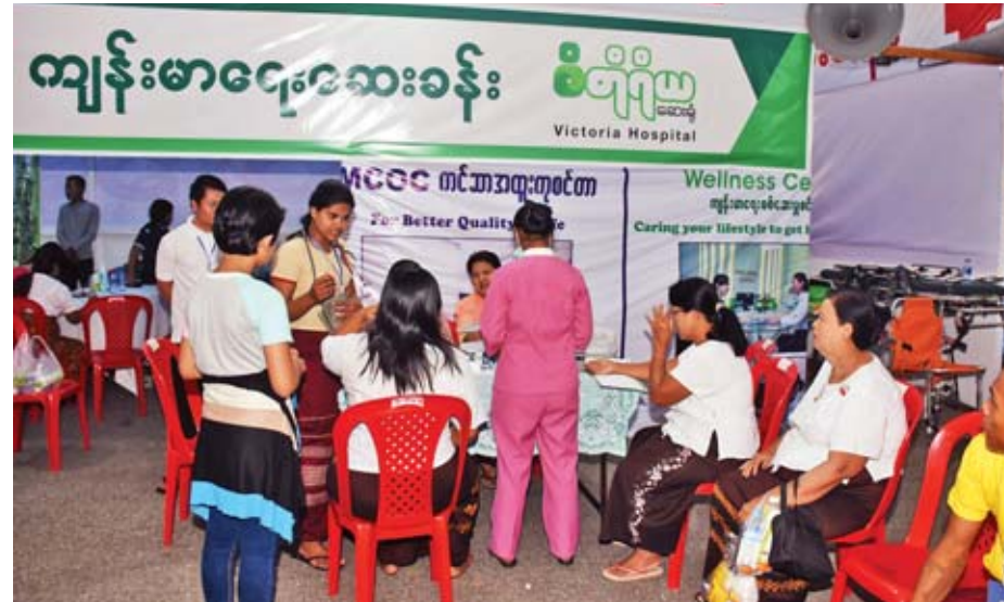
ဆေးခန်းများတွင် တရားပွဲလာပြည်သူများအား စမ်းသပ်ကုသပေးစဉ်။