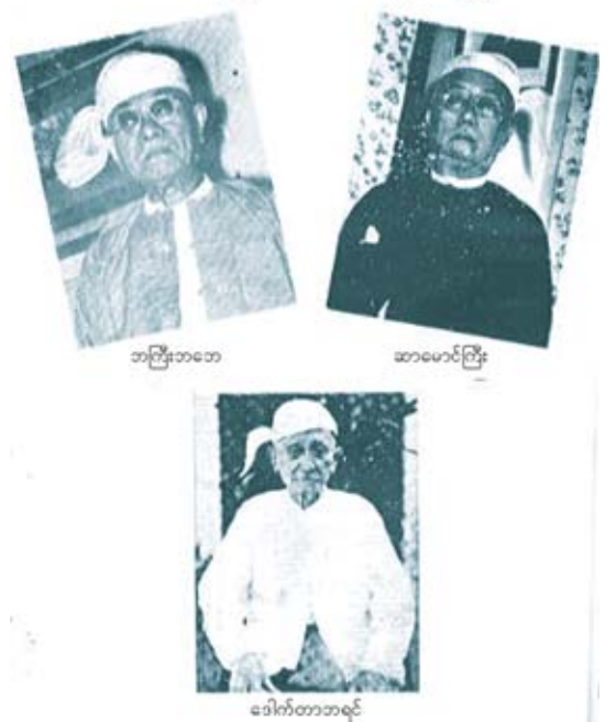
ဘဠိဒိဏ္ဍိဘိဝံသ