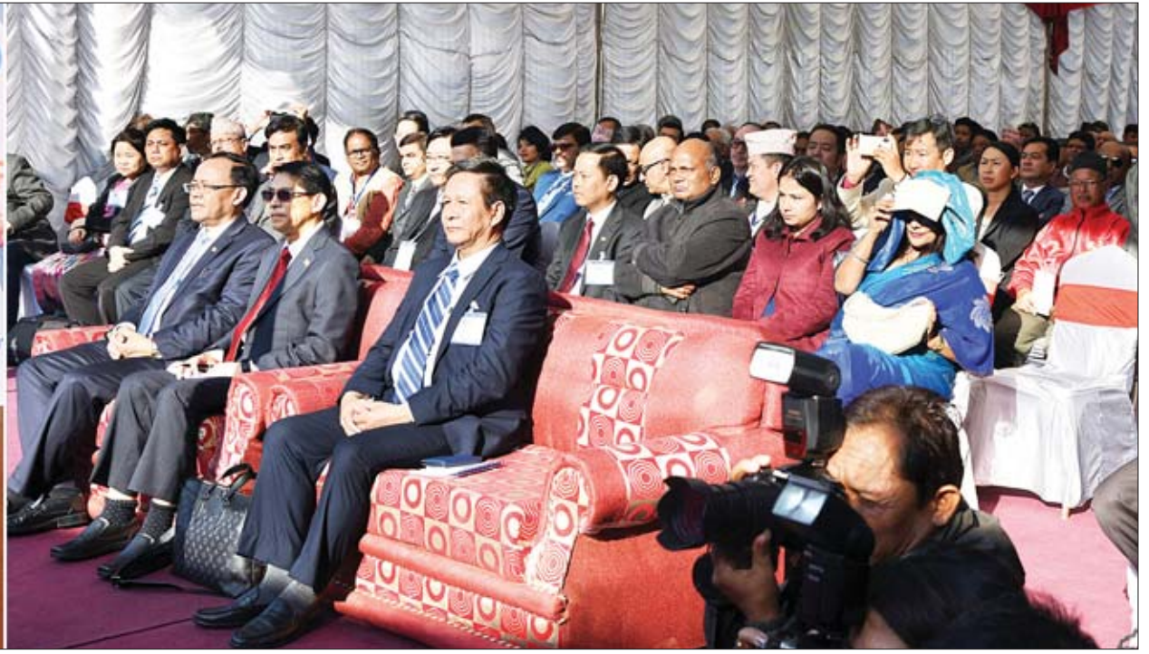
နိုင်ငံတော်၏အတိုင်ပင်ခံပုဂ္ဂိုလ် ဒေါ်အောင်ဆန်းစုကြည် နီပေါကုန်စည်ပြပွဲ-၂၀၁၈ ဖွင့်ပွဲအခမ်းအနားတွင် အမှာစကားပြောကြားစဉ်။

»» စာမျက်နှာ ၃ မှ အဆိုပါအခမ်းအနားတွင် နီပေါဖက်ဒရယ်ဒီမိုကရက်တစ်သမ္မတနိုင်ငံ ဝန်ကြီးချုပ်ဟောင်းနှင့် ကွန်မြူနစ်ပါတီဥက္ကဋ္ဌ Mr. Pushpa Kamal Dahal နှင့် နီပေါဖက်ဒရယ်ဒီမိုကရက်တစ်သမ္မတနိုင်ငံ ကုန်သည်ကြီးများအသင်းဥက္ကဋ္ဌ မစ္စတာ ရာဂျက်ကာရီ ရှုရက်စ်သာတို့က နှုတ်ခွန်းဆက် အမှာစကားပြောကြား ကြသည်။