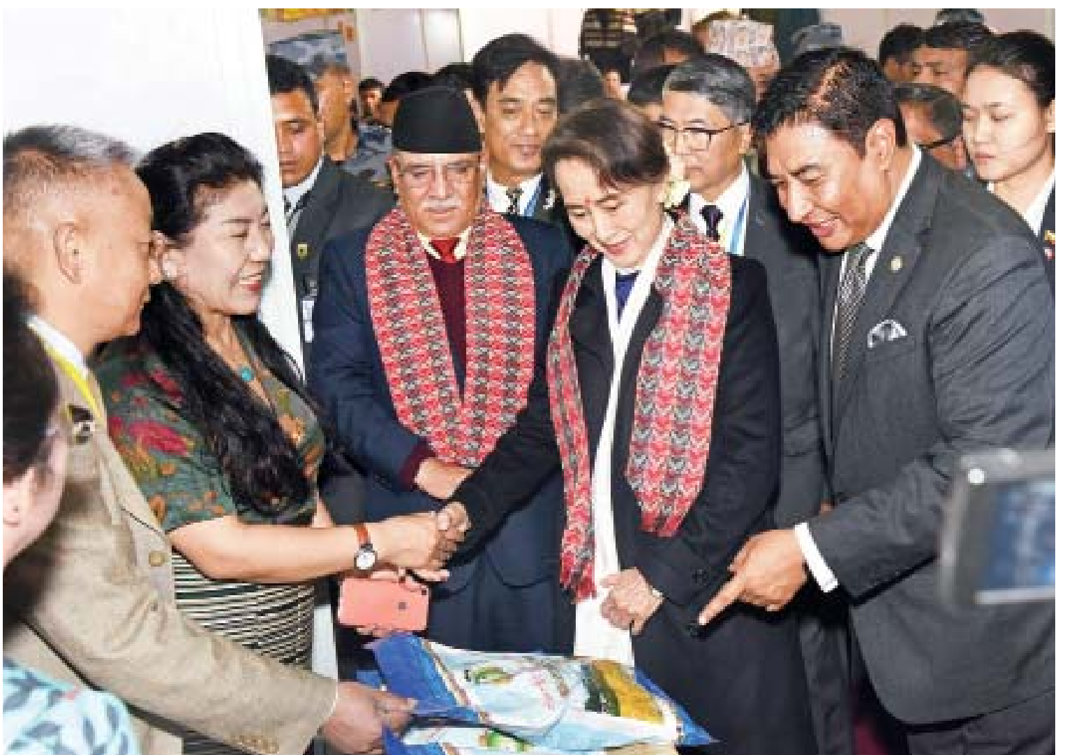
နိုင်ငံတော်၏အတိုင်ပင်ခံပုဂ္ဂိုလ် ဒေါ်အောင်ဆန်းစုကြည် နီပေါကုန်စည်ပြပွဲ- ၂၀၁၈ တွင် ခင်းကျင်းပြသထားသည့် မြန်မာနိုင်ငံမှ ပြခန်းများနှင့် တခြားနိုင်ငံမှ ပြခန်းများကို လှည့်လည်ကြည့်ရှုအားပေးစဉ်။