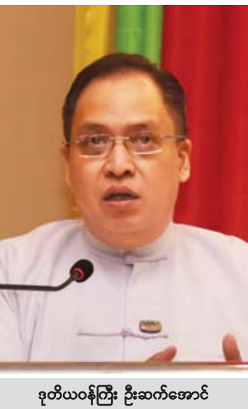
ဒုတိယဝန်ကြီး ဦးဆက်အောင်

မြန်မာနိုင်ငံ၏ ရေရှည်တည်တံ့ခိုင်မြဲပြီး ဟန်ချက်ညီသော ဖွံ့ဖြိုးတိုးတက်မှုစီမံကိန်း အား တိုင်းတာမည့် အမျိုးသားညွှန်ကိန်း မူဘောင်ဖော်ဆောင်ရေးဆွေးနွေးပွဲကို နိုဝင်ဘာ ၂၉ ရက် နံနက်ပိုင်းက နေပြည်တော်ရှိ Park Royal ဟိုတယ်၌ ကျင်းပရာ ဆွေးနွေးပွဲတွင် စီမံကိန်းနှင့်ဘဏ္ဍရေးဝန်ကြီးဌာန ဒုတိယဝန်ကြီး ဦးဆက်အောင်က “ကျွန်တော်တို့နိုင်ငံမှာ အဓိက စီမံကိန်းရေးဆွဲခြင်းက အရေးကြီးပါတယ်။ ဆိုရှယ်လစ်နိုင်ငံတွေမှာ သာ စီမံကိန်းရေးဆွဲခြင်းလုပ်တယ်။ တကယ်တမ်း ဒီမိုကရက်တစ်နိုင်ငံဖြစ်သွားတယ်ဆိုရင် Democratization process သွားနေတာဖြစ်တဲ့အတွက် ဒီမိုကရေစီနိုင်ငံတိုင်းမှာ စီမံကိန်းရေးဆွဲခြင်းဆိုတာ အရေးကြီးတော့ဘူးဆိုတဲ့ ထင်မြင်ယူဆချက်လေးတွေ ရှိပါတယ်။ အမှန်ကတော့ နိုင်ငံတိုင်းမှာ planning နဲ့ policy direction အရေးကြီးပါတယ်။ Central Control ဖြစ်တဲ့ Central Planning Control ကနေပြီး decentralize စနစ်ကို ဦးတည်သွားနေတာဖြစ်တဲ့အတွက် ဘယ်အရာတွေကို Control လုပ်သင့်တယ်၊ ဘယ်အရာတွေကို Control မလုပ်သင့်ဘူးဆိုတာ နားလည်ထားဖို့လည်း အရေးကြီးပါတယ်။”