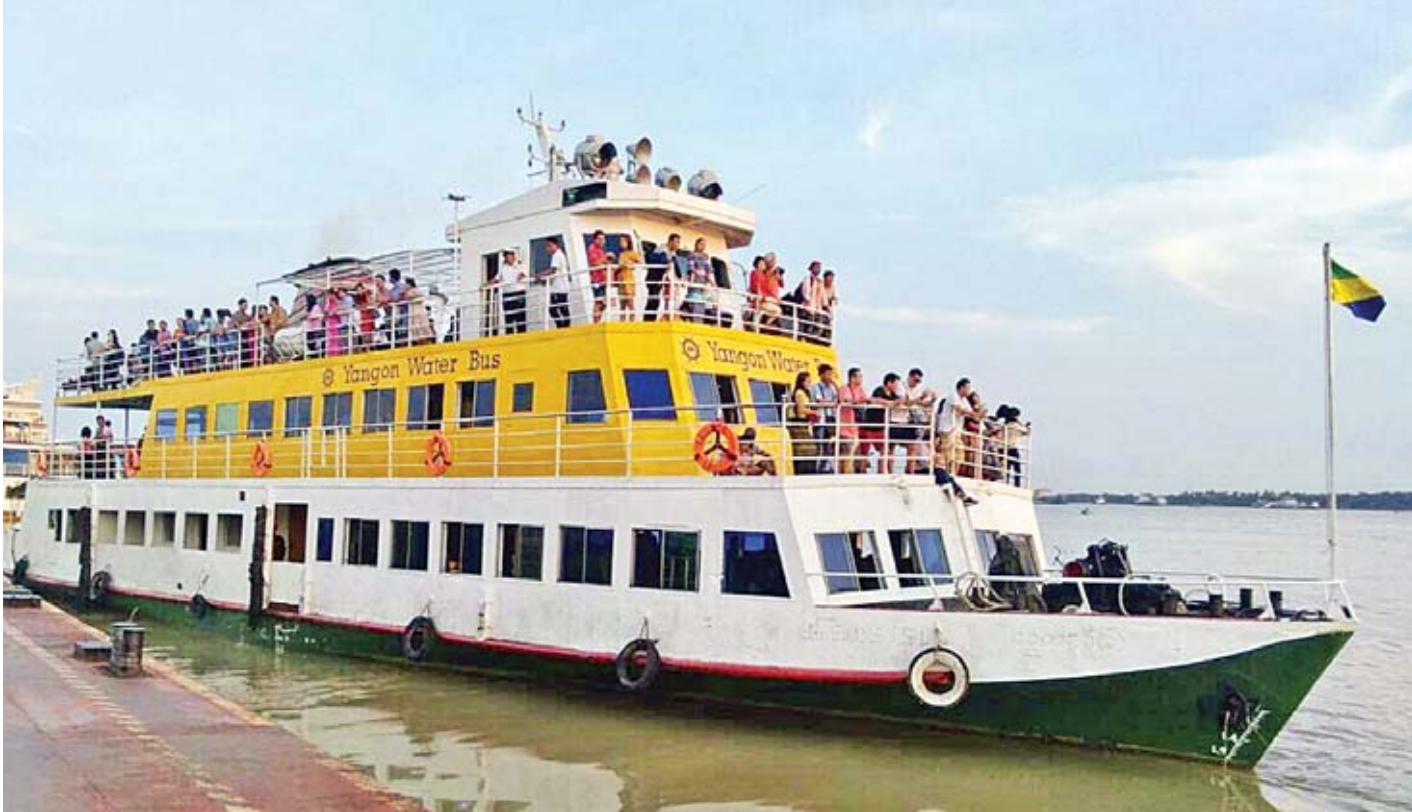
ရန်ကုန်မြို့၊ ဗိုလ်တထောင်ဆိပ်ကမ်းတွင် Yangon Water Bus တစ်စင်းကို တွေ့ရစဉ်။

ရန်ကုန် နိုဝင်ဘာ ၂၉ ရန်ကုန်မြို့၏ မြစ်ကြောင်းတစ်လျှောက်တွင် နေဝင်ချိန် ဆည်းဆာအလှကို လိုက်ပါခံစားနိုင်ရန် ရည်ရွယ်၍ လာမည့် စနေနှင့် တနင်္ဂနွေ အားလပ်ရက်များအတွင်း အပတ်စဉ် ပြေးဆွဲပေးသွားမည်ဖြစ်ကြောင်း Yangon Water Bus မှ သိရသည်။