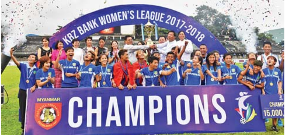
ပြီးခဲ့သည့်ရာသီ အမျိုးသမီးလိဂ်ပြိုင်ပွဲချန်ပီယံ မြဝတီအသင်း။

ရန်ကုန် နိုဝင်ဘာ ၂၉ မြန်မာနိုင်ငံဘောလုံးအဖွဲ့ချုပ်က သုံးကြိမ်မြောက်အဖြစ် ကျင်းပမည့် ၂၀၁၈-၂၀၁၉ ရာသီ အမျိုးသမီးလိဂ်ပြိုင်ပွဲကို ဒီဇင်ဘာလ ပထမပတ်တွင် စတင်ကျင်းပမည်ဖြစ်ပြီး အသင်းရှစ်သင်း ဝင်ရောက်ယှဉ်ပြိုင်မည် ဖြစ်သည်။ လာမည့်ရာသီ အမျိုးသမီးလိဂ်ပြိုင်ပွဲတွင် လက်ရှိချန်ပီယံ မြဝတီအသင်းအပါအဝင် သစ္စာအားမာန်၊ ဇွဲကပင်၊ အားကစားနှင့် ကာယပညာဦးစီးဌာန၊ အား/ကာသိပ္ပံ YREO၊ တက္ကသိုလ်နှင့် ဂန္ဓမာအသင်းတို့ ယှဉ်ပြိုင်မည်ဖြစ်ပြီး ပွဲစဉ်များကို လာမည့်ရက်ပိုင်းအတွင်း အတည်ပြုထုတ်ပြန်မည်ဖြစ်သည်။ ပြိုင်ပွဲဝင်အသင်းများ အပြောင်းအလဲမရှိဘဲ ၂၀၁၇-၂၀၁၈ ရာသီတွင် ယှဉ်ပြိုင်ခဲ့သည့် ရှစ်သင်းစလုံး ပြန်လည်ယှဉ်ပြိုင်မည်ဖြစ်သည်။ အမျိုးသမီးလိဂ်ပြိုင်ပွဲကို စာမျက်နှာ ၁၁ ကော်လံ ၁ သို့ ❀