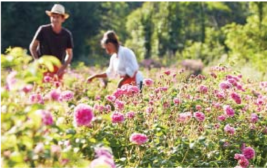
ပေးစီဂရာစီမြို့ရှိ ရေမွှေးပြုလုပ်ရာတွင် အသုံးပြုသော ရန်မွှေးကြိုင် ပန်းစိုက်ခင်းတစ်ခင်းအား တွေ့ရစဉ်။

ကုလသမဂ္ဂ နိုဝင်ဘာ ၂၉ ကုလသမဂ္ဂပညာ သိပ္ပံနှင့် ယဉ်ကျေးမှုအဖွဲ့(ယူနက်စကို) က ပြင်သစ်နိုင်ငံအရှေ့တောင်ပိုင်းရှိ ရေမွှေးပြုလုပ်ခြင်း အတတ်ပညာကျွမ်းကျင်မှုကို ယူနက်စကို၏ ယဉ်ကျေးမှုအမွေအနှစ်စာရင်းထဲသို့ ထည့်သွင်းရန် သဘောတူညီခဲ့ကြောင်း ယနေ့သတင်းများအရ သိရသည်။ ကုလသမဂ္ဂအဖွဲ့ ယဉ်ကျေးမှုအေဂျင်စီက မော်ရိုတေးရပ်စ်နိုင်ငံတွင် နိုဝင်ဘာ ၂၈ ရက်က ကျင်းပခဲ့သော အစည်းအဝေးတစ်ရပ်၌ အထက်ပါကိစ္စရပ်နှင့် ပတ်သက်ပြီး သဘောတူညီခဲ့ခြင်းဖြစ်သည်။ ပြင်သစ်နိုင်ငံ၏ မြေထဲပင်လယ်ကမ်းခြေဒေသရှိ ပေးစီဂရာစီမြို့၌ ရေမွှေးထုတ်လုပ်ရာတွင် အသုံးပြုသည့် သစ်ပင်ပန်းမန်များ၊ သဘာဝအလျောက်ရရှိသော ပစ္စည်းများအပါအဝင် ရေမွှေးထုတ်လုပ်မှု အတတ်ပညာများ ရောပြန်ထားသည့်အတွက် အဆိုပါမြို့ကို ယူနက်စကို၏ ယဉ်ကျေးမှုအေဂျင်စီက ထိတွေ့ကိုင်တွယ်၍ မရသော ယဉ်ကျေးမှုအမွေအနှစ်အဖြစ် စာရင်းသွင်း အသိအမှတ်ပြုခဲ့သည်။ ပေးစီဂရာစီမြို့ရှိ ဒေသခံပြည်သူများသည် ရေမွှေးထုတ်လုပ်မှုအတတ်ပညာကို ကိုယ်တိုင်ထုတ်ကြံကာ လုပ်ကိုင်လျက်ရှိပြီး အဆိုပါပညာရပ်ဖွံ့ဖြိုးတိုးတက်စေရေးအတွက် ဒေသခံများက အစဉ်အမြဲ ကြိုးပမ်းလျက် ရှိသည်ဟု ယူနက်စကိုတာဝန်ရှိသူတစ်ဦးက ဆိုသည်။ ပေးစီဂရာစီမြို့သည် ကမ္ဘာ့ရေမွှေးထုတ်လုပ်သော နေရာများအနက် လူသိများသော ဒေသတစ်ခုဖြစ်သည်။