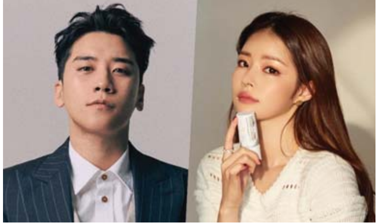
အေးပြည့် - စုစည်းသည်

တောင်ကိုရီးယားရဲ့ ကျော်ကြားတဲ့ အမျိုးသား တေးဂီတအဖွဲ့တစ်ဖွဲ့ဖြစ်တဲ့ “BIG BANG” ရဲ့ အဖွဲ့ဝင်တစ်ဦးဖြစ်သူ ဆန်းရီဟာ သရုပ်ဆောင်တစ်ဦးဖြစ်သူ ယူဟေဝန်နဲ့ ချစ်သူတွေဖြစ်နေကြောင်း သတင်းတွေ ထွက်လာခဲ့တာ ဖြစ်ပါတယ်။ ဒီအကြောင်းအရာတွေကိုတော့ တောင်ကိုရီးယားမီဒီယာတစ်ခုဖြစ်တဲ့ စွန့်ပစ်ခွင့်ကွန်းက ရေးသားဖော်ပြခဲ့တာဖြစ်ပါတယ်။ ပြီးခဲ့တဲ့ အောက်တိုဘာ ၁၉ ရက်မှာ တရုတ်မီဒီယာတစ်ခုက ဒီသတင်းတွေကို စတင် ရေးသားဖော်ပြခဲ့တာဖြစ်ပြီး လက်ရှိမှာတော့ ကြယ်ပွင့်တွေရဲ့ အေဂျင်စီတွေက သူတို့နှစ်ဦး ချစ်သူတွေအဖြစ် လက်တွဲနေခြင်း ရှိ၊ မရှိ စုံစမ်းနေဆဲဖြစ်ကြောင်း ပြောကြားခဲ့ပါတယ်။ ဒီသတင်းတွေကို စတင်ဖော်ပြခဲ့တဲ့ တရုတ်မီဒီယာကတော့ သူတို့ နှစ်ဦး ချစ်သူတွေအဖြစ် တွဲနေတာ တစ်လခန့်ကြာခဲ့ပြီဖြစ်ကြောင်း ရေးသားဖော်ပြခဲ့တယ်လို့လည်း သိရပါတယ်။