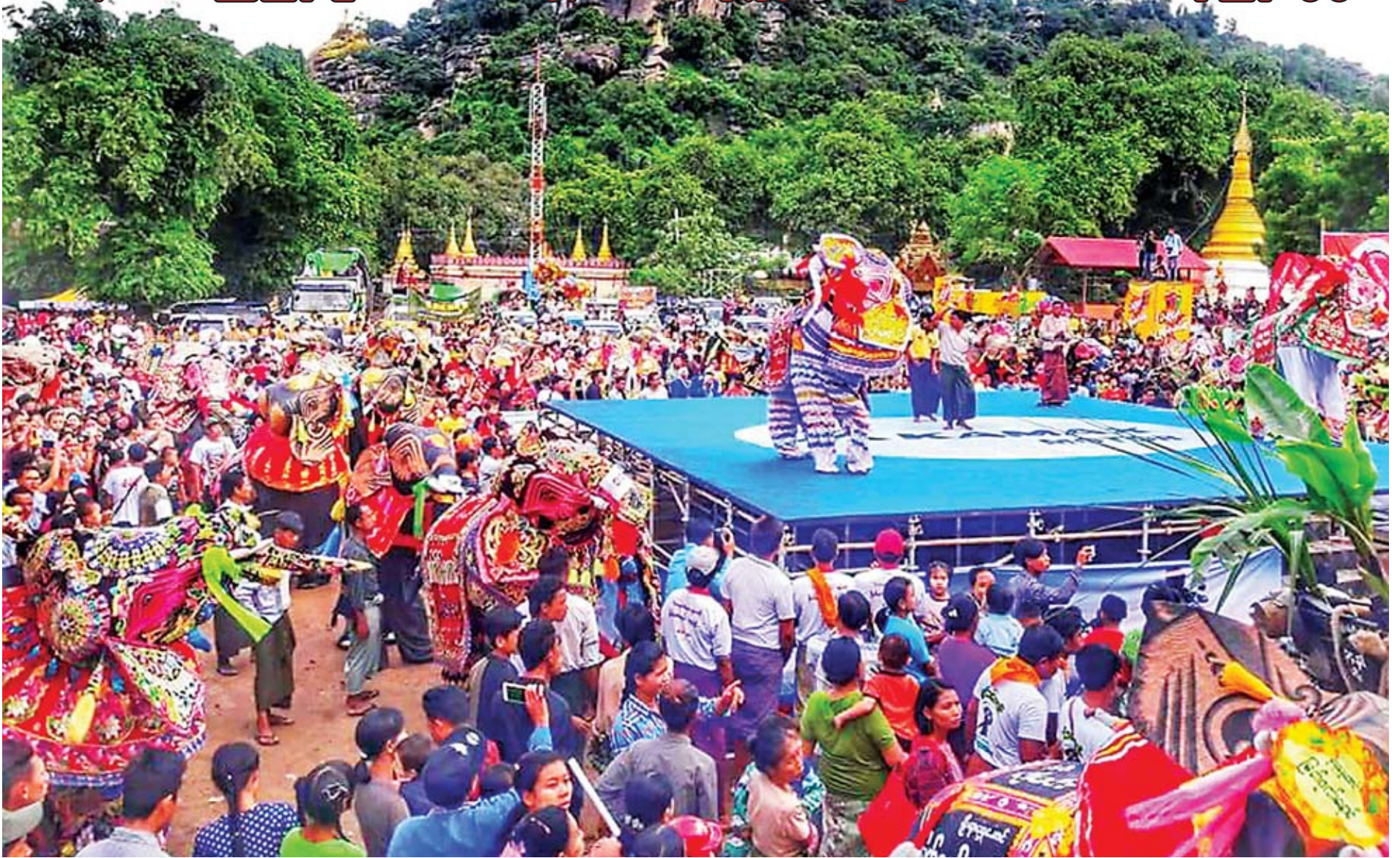
ကျောက်ဆည်မြို့ ရွှေသာလျောင်းတောင်ခြေရှိ ဆင်ပြိုင်ကွင်း၌ ဆင်အကအလှပြိုင်ပွဲ ကျင်းပစဉ်။