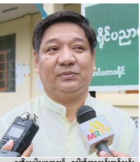
ဒုတိယပါမောက္ခချုပ် ဒေါက်တာသန်းထွဋ်လွင်။

မောင်တော အောက်တိုဘာ ၂၃ ရခိုင်ပြည်နယ် မောင်တောဒေသတွင် အကြောင်းအမျိုးမျိုး ကြောင့် တက္ကသိုလ်ပညာသင်ကြားခွင့် အခက်အခဲရှိနေ သည့် ကျောင်းသား ကျောင်းသူများအား ပညာရေးဝန်ကြီး ဌာနမှ အဝေးသင်တက္ကသိုလ် မောင်တောဌာနခွဲဖွင့်လှစ်၍ ယခုနှစ် ပညာသင်နှစ်မှစတင်ပြီး သင်ကြားလျက်ရှိကြောင်း အဆင့်မြင့်ပညာဦးစီးဌာန(မောင်တောဌာနခွဲ)မှ သိရ သည်။ “အခုနှစ်မှာ စစ်တွေတက္ကသိုလ်ကနေ ဘူးသီးတောင် နဲ့ မောင်တောဌာနခွဲတွေ ဖွင့်လှစ်သွားမှာ ဖြစ်ပါတယ်။ ရုံးဝန်ထမ်းတွေက ရခိုင်၊ ကမန် တိုင်းရင်းသားတွေနဲ့ အစွလားဘာသာဝင်တွေ၊ ဟိန္ဒူဘာသာဝင်တွေ တက္ကသိုလ်ပညာသင်ကြားနိုင်ရေးအတွက် စာရင်းကောက် ယူမှုတွေ ပြုလုပ်နေပါတယ်။ နိုဝင်ဘာ ၅ ရက်ကနေ ၁၄ ရက်အထိ အနီးကပ်သင်တန်းတွေကို သင်ကြားပေးမှာ ဖြစ်ပါတယ်။ မောင်တောမှာ အခုနှစ်က စတင်ဖွင့်လှစ် သင်ကြားပေးတာဖြစ်ပါတယ်။ ဘူးသီးတောင်မှာ ၂၀၁၂ ခုနှစ်ကတည်းက သင်ကြားပေးခဲ့တာဖြစ်ပါတယ်။ အခု ဖွင့်လှစ်မယ့် အနီးကပ်သင်တန်းကို ဘူးသီးတောင်က ကျောင်းသား ၂၃၆ ဦးနဲ့ မောင်တောက ၇၂ ဦး တက်ရောက်ကြမှာဖြစ်ပြီး မြန်မာစာနဲ့ သမိုင်းအထူးပြုတွေ ဖြစ်ပါတယ်။ ဆရာ ဆရာမက ဘူးသီးတောင်မှာ ၁၃ ဦး၊ မောင်တောမှာ ရှစ်ဦးနဲ့ လာရောက်သင်ကြားပေးမှာ ဖြစ်ပါတယ်။ စစ်တွေတက္ကသိုလ်မှာ ကျောင်းသား ကျောင်းသူ တစ်သောင်းခန့်ရှိတဲ့အတွက် စစ်တွေ တက္ကသိုလ်က ဆရာ ဆရာမတွေ သင်ကြားရေး မလုံ လောက်တာကြောင့် အဆင့်မြင့်ပညာဦးစီးဌာနမှ ရန်ကုန် အနီးဝန်းကျင်တက္ကသိုလ်တွေက ဆရာ ဆရာမတွေကို ခေါ်ယူပြီး ဘူးသီးတောင်နဲ့မောင်တောကို စေလွှတ်