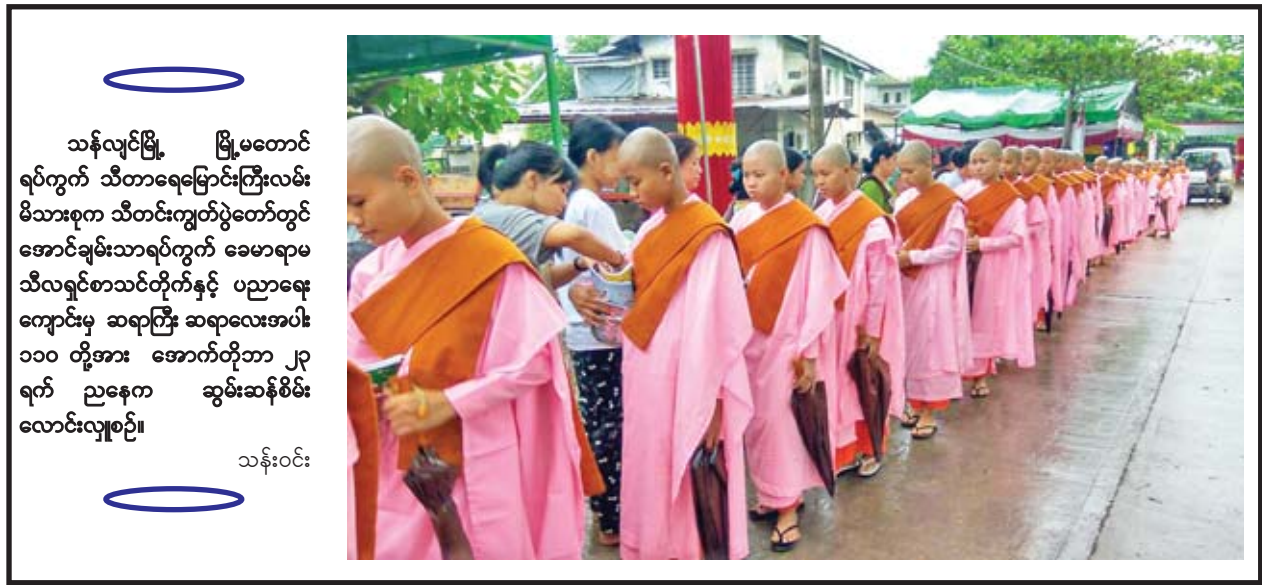
သန်လျင်မြို့ မြို့မတောင် ရပ်ကွက် သီတာရေမြောင်းကြီးလမ်း မိသားစုက သီတင်းကျွတ်ပွဲတော်တွင် အောင်ချမ်းသာရပ်ကွက် ခေမာရာမ သီလရှင်စာသင်တိုက်နှင့် ပညာရေး ကျောင်းမှ ဆရာကြီး ဆရာလေးအပါး ၁၁၀ တို့အား အောက်တိုဘာ ၂၃ ရက် ညနေက ဆွမ်းဆန်စိမ်း လောင်းလှူစဉ်။