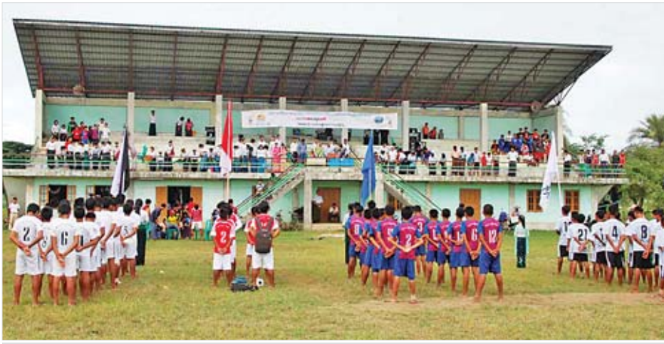
ကလေးစာပေပွဲတော်အထိမ်းအမှတ် ကျောင်းပေါင်းစုံအားကစားပြိုင်ပွဲ ဖွင့်ပွဲအခမ်းအနားကျင်းပစဉ်။