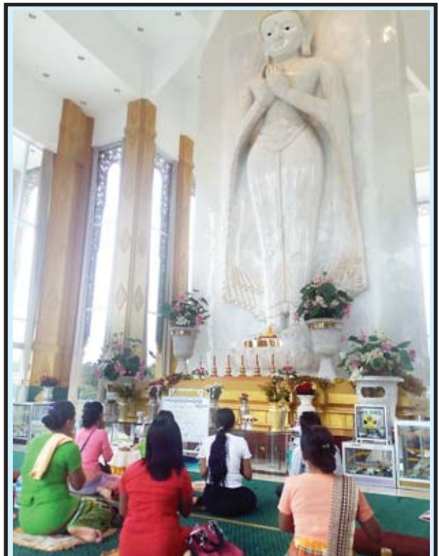
အောက်တိုဘာ ၂၃ ရက် (သီတင်းကျွတ်လဆန်း ၁၄ ရက်၊ အဖိတ်နေ့) တွင် နေပြည်တော် ဥက္ကဋ္ဌရသီရိမြို့နယ် ဖွဲ့စည်းတောင်ပေါ်၌ တည်ထားကိုးကွယ်လျက်ရှိသော မဟာသကျရသီ ရုပ်ရှင်တော်မြတ်ကြီးသို့ အနယ်နယ်အရပ်ရပ်မှ ဘုရားဖူးညွှန့်သည့်အား ဆီမီး၊ ပန်း၊ အမွှေးတိုင်နှင့် ဆွမ်းများ ဆက်ကပ်လှူဒါန်းကြပြီး ဖူးမြော်ပူဇော်နေကြစဉ်။