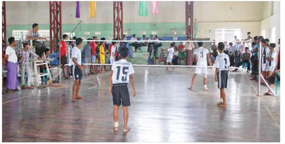
ကလေးစာပေပွဲတော်အထိမ်းအမှတ် ကျောင်းပေါင်းစုံ ပိုက်ကျော်ခြင်းပြိုင်ပွဲကို ခရိုင်အားကစားခန်းမ၌ ကျင်းပစဉ်။