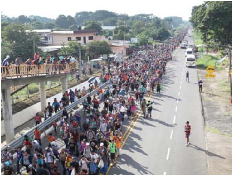
လူအုပ်ကြီးများအနက် ပါဝင်သူများမှာ ဟွန်ဒူ ရပ်စ်နိုင်ငံမှ ဖြစ်ကြသည်။ စုဝေးချီတက်လာ ကြသော လူအုပ်ကြီးများမှာ လူပေါင်း ၇၀၀၀ ကျော် ပါဝင်သည်ဟု ခန့်မှန်းရပြီး မကြာသေးမီ ရက်များအတွင်း ယင်းလူအုပ်ကြီးများအနက်မှ လူအုပ်ကြီးများ ဆူချီယက်မြစ်ကို ရေကူး၍တစ်မျိုး၊ ဖောင်စီး၍တစ်နည်း ဖြတ်ကျော်ခဲ့ကြသည်။ ဆူချီယက်မြစ်သည် ဂွာတီမာလာနိုင်ငံကို မက္ကဆီကို နိုင်ငံနှင့် ခြားထားသော မြစ် တစ်စင်းဖြစ်သည်။ အေအက်စ်ပီ

သွားရောက်ကြရန် သန့်ရှင်းချထားပုံရကြောင်း၊ မက္ကဆီကို တောင်ပိုင်းတွင် အောက်တိုဘာ ၂၁ ရက်က ခရီးရှည်ချီတက်မှုကို ပြန်လည် စတင်ခဲ့ကြောင်း သတင်းတွင် ဖော်ပြထား သည်။ ရွှေ့ပြောင်းအခြေစိုက်ရန် ရည်ရွယ်ချက် ဖြင့် စုဝေးချီတက်နေကြသော လူအုပ်ကြီး များကို မက္ကဆီကို အစိုးရအဖွဲ့က တားဆီး နိုင်ခြင်းမရှိဟုဆိုကာ သမ္မတထရန်က ဖိအား ပေးလျက်ရှိသည်။ ရွှေ့ပြောင်းအခြေစိုက်လို သူများသည် နယ်ခြားဖြတ်ကျော်ရေး စခန်း တွင် လုပ်ထုံးလုပ်နည်းများနှင့်အညီ ဆောင် ရွက်ရန် မက္ကဆီကို အစိုးရအဖွဲ့က ညွှန်ကြားခဲ့ သော်လည်း လူအုပ်ကြီးများက လိုက်နာခြင်း မရှိဘဲ ရွှေ့တိုးချီတက်ရန် လုပ်ဆောင်ခဲ့ကြ သည်ဆို၏။ မက္ကဆီကို နယ်စပ်ဒေသ၌ တားဆီးခံရသူ လူအုပ်ကြီးများအနက် ပါဝင်သူများမှာ ဟွန်ဒူ ရပ်စ်နိုင်ငံမှ ဖြစ်ကြသည်။ စုဝေးချီတက်လာ ကြသော လူအုပ်ကြီးများမှာ လူပေါင်း ၇၀၀၀ ကျော် ပါဝင်သည်ဟု ခန့်မှန်းရပြီး မကြာသေးမီ ရက်များအတွင်း ယင်းလူအုပ်ကြီးများအနက်မှ