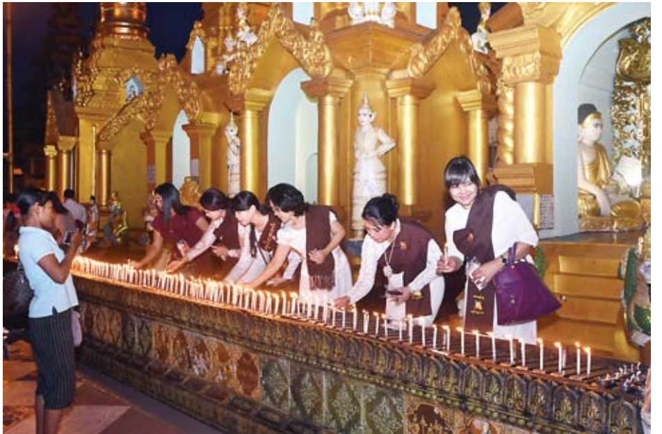
ဘာသာရေးအသင်းအဖွဲ့များနှင့် ဘုရားဖူးလာပြည်သူများ ဆီမီးများ ထွန်းညှိပူဇော်ကြစဉ်။