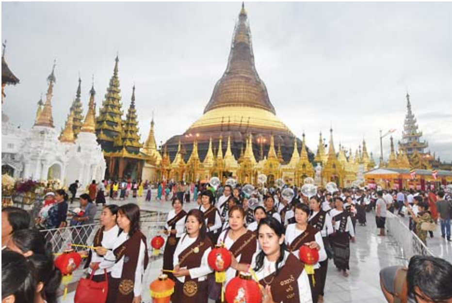
ဘာသာရေးအသင်းအဖွဲ့များ ရောင်စုံမီးပုံးများကိုကိုင်ဆောင်ကာ ရွှေတိဂုံစေတီတော်အား လက်ယာရစ်လှည့်လည်ပူဇော်ကြစဉ်။