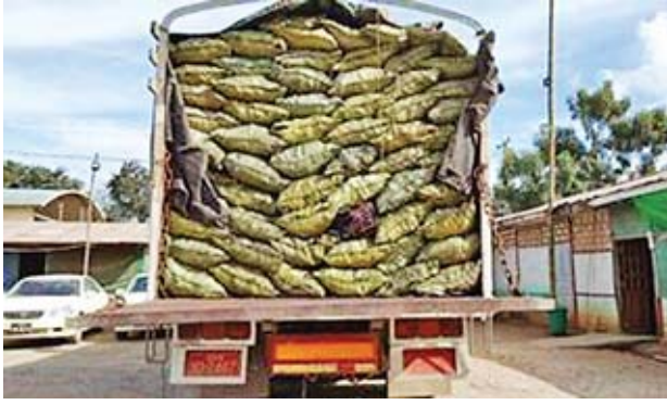
(ခန့်မှန်းတန်ဖိုးငွေကျပ် ၅၂ ဒသမ ၈၄၅ သန်း)ကို သိမ်းဆည်းရမိခဲ့ကြောင်း သိရသည်။

နေပြည်တော် အောက်တိုဘာ ၂၃ တရားမဝင်ကုန်စည်များ တားဆီးထိန်း ချုပ်ရေးအတွက် ရေပူနှင့်ပရမ်းချောင့် အမြဲတမ်း စစ်ဆေးရေးစခန်းများက တင်သွင်း၊ တင်ပို့သော ကုန်ပစ္စည်း များကို စစ်ဆေးမှုပြုလုပ်ဆောင်ရွက် လျက်ရှိရာ အောက်တိုဘာ ၂၂ ရက်တွင် ရေပူအမြဲတမ်းစစ်ဆေးရေး စခန်းက တားဆီးမှု သုံးခု (ခန့်မှန်း တန်ဖိုးငွေကျပ် ၅၂ ဒသမ ၈၄၅ သန်း)၊ မရမ်းချောင့် အမြဲတမ်းစစ်ဆေး ရေးစခန်းက တားဆီးမှု နှစ်ခု (ခန့်မှန်း တန်ဖိုးငွေကျပ် သုည ဒသမ ၃၇၀ သန်း) စုစုပေါင်းတားဆီးမှုငါးခု