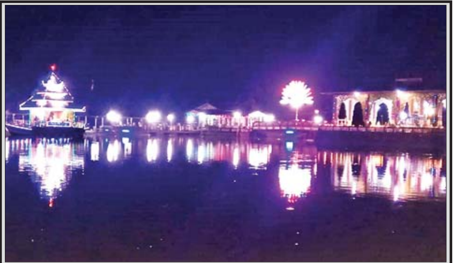
မွန်ပြည်နယ် သထုံမြို့နယ် သုဝဏ္ဏဝတီမြို့ ကျိုက္ကော်ရပ်ကွက် ကန်တော်မင်္ဂလာအတွင်း မီးရောင်စုံထွန်းညှိထား သည့်ကို အောက်တိုဘာ ၂၃ ရက် ညပိုင်းက တွေ့ရစဉ်။