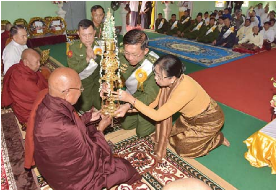
တပ်မတော်ကာကွယ်ရေးဦးစီးချုပ် ဦးလှိုင်အောင်နှင့် ဇနီး ဒေါ်ကြူကြူလှ ရတနာစိန်ဖူးတော်ကို ဆရာတော်ထံ ဆက်ကပ်လှူဒါန်းစဉ်။