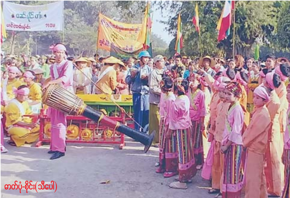
တတ်ပုံ-စိုင်း(သီပေါ)

စင်ပေါ်ရှိ ဘုရားကျောင်းဆောင်ရှေ့တွင် အုန်းသီး၊ ငှက်ပျောသီး၊ ကွမ်း၊ ဆေး၊ လက်ဖက်များပါသော ဘုရားပွဲတစ်ခုလည်း ပြင်ဆင်၍ တင်ထားသည်။ သီတင်းကျွတ်