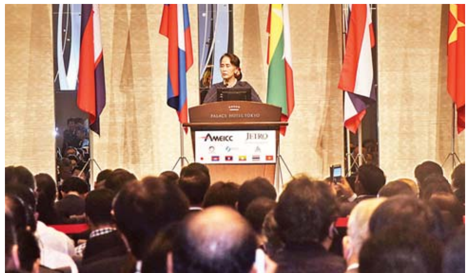
နိုင်ငံတော်၏အတိုင်ပင်ခံပုဂ္ဂိုလ် ဒေါ်အောင်ဆန်းစုကြည် ဂျပန်-မဲခေါင် စီးပွားရေးဖိုရမ်တွင် မိန့်ခွန်းပြောကြားစဉ်။