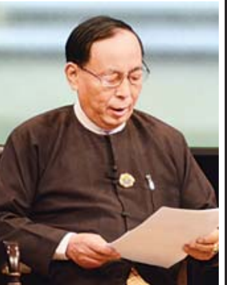
ဦးဟန်ညွန့်

ဒါကတော့ ပြည်သူတွေက ရာဇဝတ်မှုတွေများလာတဲ့ အချိန်မှာ ထိတ်လန့်တုန်လှုပ်လာကြတယ်။ မန္တလေးလို မြို့ကြီးမှာကအစ ကားငှားစီးတယ်၊ ကားငှားစီးရင်လည်း အငှားယာဉ်သမားကို စိတ်မချရဘူး။ ဆိုင်ကယ်ငှားစီးရင်လည်း ဆိုင်ကယ်သမားကို စိတ်မချရဘူး။ သက်ငယ်မုဒိမ်း မှုတွေ၊ အချင်းချင်းမကျေနပ်လို့ အုပ်စုဖွဲ့ပြီးတော့ စားနဲ့ ခုတ်ကြတာ၊ သတ်ကြတာတွေ အခုခေတ်ကတော့ ထူးဆန်းတဲ့ပုံစံအမျိုးမျိုးနဲ့ ကျူးလွန်ကြတယ်။