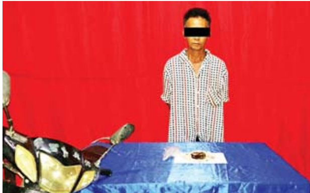
ဆိကြားရွှေ့အား သိမ်းဆည်းရမိ ဘိန်းစိမ်းများနှင့်အတူတွေ့ရစဉ်။

အလားတူ ယင်းနေ့ညနေ ၆ နာရီက မူးယစ်တပ်ဖွဲ့(၂)မူဆယ်မှ တပ်ဖွဲ့ဝင်များ ပါဝင်သော ပူးပေါင်းအဖွဲ့သည် နမ့်ခမ်းမြို့နယ် နမ့်ခမ်း-မန်ဟောင်းကူးတို့ဆိပ်သွားလမ်း မန်ဟောင်းကျေးရွာအထွက်လမ်းတွင် ဆိကြားရွှေ့ မောင်းနှင်လာသော မော်တော်ဆိုင်ကယ်ကို ရှာဖွေရာ ဘိန်းစိမ်း သူညု ၃သမ ၁၅ ကီလို သိမ်းဆည်းရမိခဲ့သဖြင့် ၎င်းတို့အား မူးယစ်ဆေးဝါးနှင့်