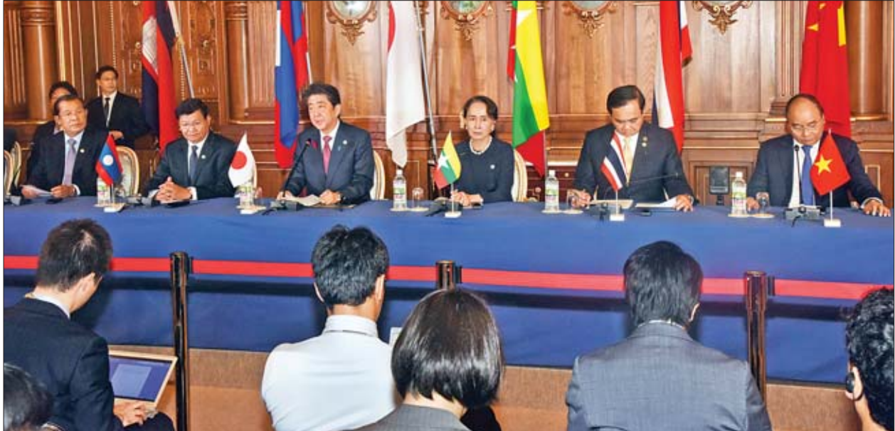
နိုင်ငံတော်၏အတိုင်ပင်ခံပုဂ္ဂိုလ် ဒေါ်အောင်ဆန်းစုကြည် (၁၀)ကြိမ်မြောက် မဲခေါင်-ဂျပန် ထိပ်သီးအစည်းအဝေးနှင့် စပ်လျဉ်း၍ ပူးတွဲသတင်းစာရှင်းလင်းပွဲသို့ တက်ရောက်စဉ်။