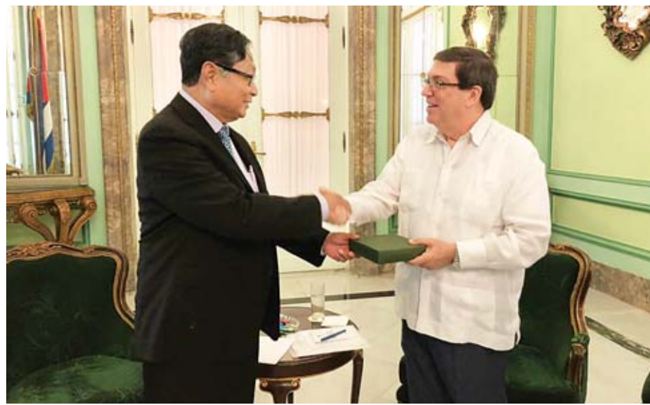
ပြည်ထောင်စုဝန်ကြီး ဦးကျော်တင်ဆွေ ကျူးဘားနိုင်ငံခြားရေးဝန်ကြီး H.E. Mr. Bruno Rodriguez Parrilla နှင့် တွေ့ဆုံနှုတ်ဆက်စဉ်။

ပြည်ထောင်စုဝန်ကြီးသည် ကျူးဘားနိုင်ငံခြားရေး ဝန်ကြီး H.E. Mr. Bruno Rodriguez Parrilla အား အောက်တိုဘာ ၃ ရက် ဒေသစံတော်ချိန် နံနက် ၁၀ နာရီတွင် နိုင်ငံခြားရေးဝန်ကြီးဌာန၌ သွားရောက်တွေ့ဆုံ သည်။ ဝန်ကြီးများသည် မြန်မာ-ကျူးဘား နှစ်နိုင်ငံဆက်ဆံ