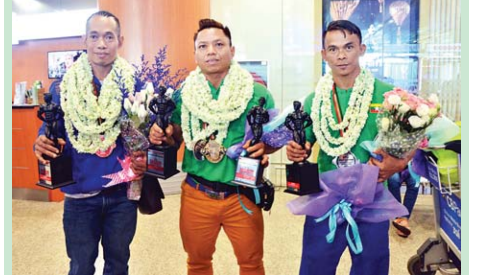
ဆုတံဆိပ်များ ဆွတ်ခူးရရှိခဲ့သည့် မြန်မာအားကစားသမားများကို ရန်ကုန်အပြည်ပြည်ဆိုင်ရာ လေဆိပ်တွင် တွေ့ရစဉ်။

ရန်ကုန် အောက်တိုဘာ ၉ အိန္ဒိယနိုင်ငံ ပူနဲမြို့တွင် ကျင်းပခဲ့သည့် (၅၂)ကြိမ်မြောက် အာရှကာယဗလနှင့် ကာယကြံ့ခိုင်မှုပြိုင်ပွဲတွင် မြန်မာနိုင်ငံ ကာယဗလနှင့်ကာယကြံ့ခိုင်မှုအဖွဲ့ချုပ်မှ ကစားသမားများက ရွှေတံဆိပ်တစ်ခု၊ ငွေတံဆိပ်နှစ်ခု၊ ကြေးတံဆိပ် တစ်ခု ဆွတ်ခူးရရှိခဲ့ပြီး ယနေ့နံနက် ၉ နာရီက ရန်ကုန်မြို့သို့ ပြန်လည်ရောက်ရှိလာရာ မြန်မာနိုင်ငံကာယဗလနှင့် ကာယကြံ့ခိုင်မှုအဖွဲ့ချုပ်မှ တာဝန်ရှိသူများနှင့် အားကစားသမားများ၏ မိသားစုဝင်များက ကြိုဆိုခဲ့ကြသည်။ စာမျက်နှာ ၈ ကော်လံ ၁ သို့ ✨