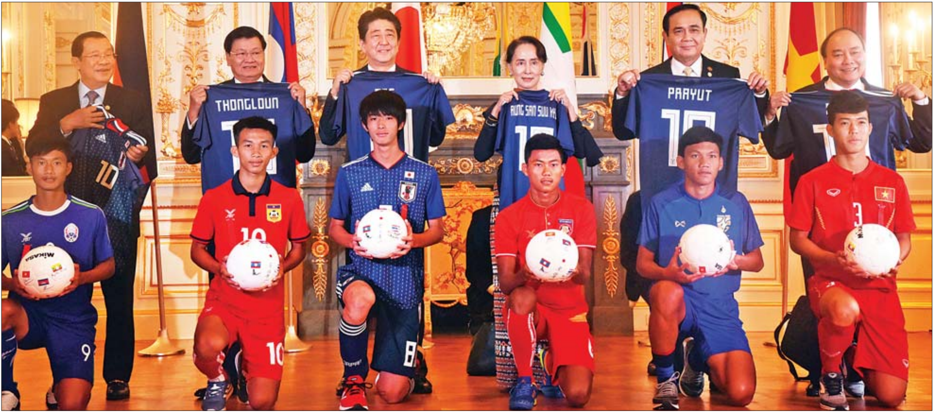
Soccer Event အခမ်းအနားတွင် နိုင်ငံတော်၏အတိုင်ပင်ခံပုဂ္ဂိုလ် ဒေါ်အောင်ဆန်းစုကြည်နှင့် မဲခေါင်အဖွဲ့ဝင်နိုင်ငံများမှ ခေါင်းဆောင်များ၊ U-17 ဘောလုံးအသင်း ခေါင်းဆောင်များနှင့်အတူ စုပေါင်းမှတ်တမ်းတင်ဓာတ်ပုံရိုက်ကြစဉ်။