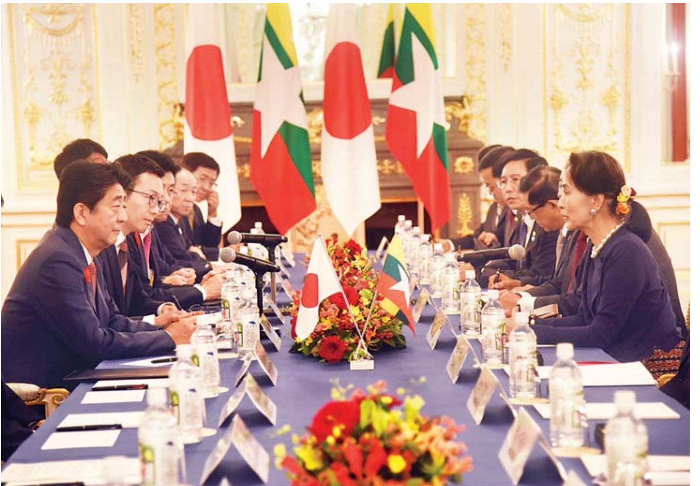
မြန်မာ-ဂျပန် နှစ်နိုင်ငံ တွေ့ဆုံဆွေးနွေးပွဲတွင် နိုင်ငံတော်၏အတိုင်ပင်ခံပုဂ္ဂိုလ် ဒေါ်အောင်ဆန်းစုကြည်နှင့် ဂျပန်ဝန်ကြီးချုပ် မစ္စတာ ရှင်ဇီအာဘေးတို့ ဆွေးနွေးကြစဉ်။

အလုပ်သဘော နေ့လယ်စာစားပွဲတွင် ကမ္ဘောဒီးယားနိုင်ငံ ဝန်ကြီးချုပ်၊ လာအိုနိုင်ငံ ဝန်ကြီးချုပ်၊ နိုင်ငံတော်၏အတိုင်ပင်ခံပုဂ္ဂိုလ်၊ ထိုင်းနိုင်ငံဝန်ကြီးချုပ်၊ ဗီယက်နမ်နိုင်ငံဝန်ကြီးချုပ်တို့သည် နှုတ်ခွန်းဆက်စကား ပြောကြားကြပြီး စီးပွားရေးအဖွဲ့အစည်းများမှ ကိုယ်စားလှယ်များနှင့်အတူ နေ့လယ်စာကို အတူတကွ သုံးဆောင်ကြသည်။