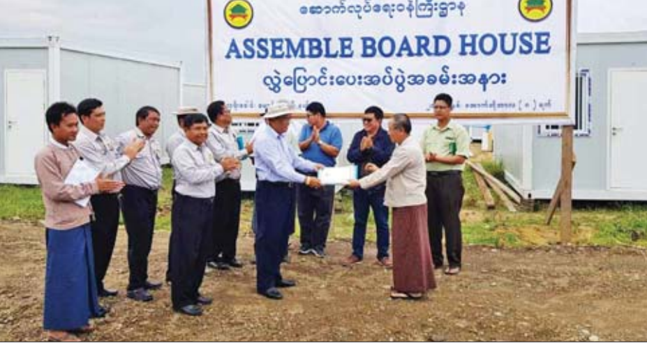
ကျောက်လမ်းခင်းခြင်းလုပ်ငန်းကို လည်းကောင်း၊ CITF ၏ ကြီးကြပ်မှုဖြင့် ကုမ္ပဏီနှစ်ခုမှ ဆောက်လုပ်နေသော အိမ်ရာများကိုလည်းကောင်း လိုက်လံကြည့်ရှုစစ်ဆေးရာ ဌာနနှင့် CITF မှ တာဝန်ရှိသူများက ရှင်းလင်းတင်ပြ သည်။ ထို့နောက် ယင်းစခန်းတွင် ဂျပန်အစိုးရမှ ဆောက်လုပ်လှူဒါန်းမည့် အိမ်ရာ ၆၅ လုံးနှင့် လူထု အခြေပြုပဟိုဌာနတစ်ခု ဆောက်လုပ်ရန်အတွက် မြေနေရာများ သတ်မှတ်ပေးခဲ့ကြသည်။ ယင်းနောက် ဒုတိယဝန်ကြီးနှင့် အဖွဲ့သည် မောင်တော-ကြိမ်ချောင်း-ဗန္ဓုလလမ်းတစ်လျှောက် တိုးတက်ပြုပြင်ထိန်းသိမ်းခြင်းလုပ်ငန်းများကို ကြည့်ရှု စစ်ဆေးခဲ့ကြပြီး ညနေပိုင်းတွင် အိုးထိန်းရွာစခန်းသို့ ရောက်ရှိခဲ့ကြသည်။ ထိုစခန်းတွင် ဆောက်လုပ်ရေးဝန်ကြီး ဌာနမှ တာဝန်ယူတည်ဆောက်နေသော အိမ်ရာစခန်း

နေပြည်တော် အောက်တိုဘာ ၉ ဆောက်လုပ်ရေးဝန်ကြီးဌာန ဒုတိယဝန်ကြီး ဦးကျော်လင်း နှင့် ရခိုင်ပြည်နယ် လမ်းပန်းဆက်သွယ်ရေးဝန်ကြီး ဦးအောင်ကျော်စံတို့သည် အောက်တိုဘာ ၈ ရက်တွင် မောင်တောမြို့နယ် လှိုင်ခေါင်ကြားစခန်းတွင် ဆောက်လုပ် ရေးဝန်ကြီးဌာန မောင်တောခရိုင် လမ်းပန်းဆက်သွယ်ရေး တာဝန်ယူတည်ဆောက်သော ပြန်လည်ဝင်ရောက်လာမည့် သူများအတွက် Assemble Board House အလုံး ၉၀၊ အစီအစဉ်များ၊ အုတ်ရေကန်များ၊ သန့်စင်ခန်းများနှင့် ပတ်လမ်းကျောက်ခင်းခြင်းလုပ်ငန်းများကို ကြည့်ရှု စစ်ဆေးခဲ့ပြီး အဆိုပါ လုပ်ငန်းများကို ဆောက်လုပ်ရေး ဝန်ကြီးဌာန ဒုတိယဝန်ကြီးက ရခိုင်ပြည်နယ် အစိုးရအဖွဲ့ ကိုယ်စား ပြည်နယ်လမ်းပန်းဆက်သွယ်ရေးဝန်ကြီး ဦးအောင်ကျော်စံထံ လွှဲပြောင်းပေးအပ်သည်။ ထို့နောက် ဒုတိယဝန်ကြီးနှင့်အဖွဲ့သည် စခန်းအတွင်း CITF ၏ ကြီးကြပ်မှုဖြင့် ဆောက်လုပ်ပြီးစီးနေသော အဆောက် အအုံများ၏ ကြံ့ခိုင်မှုအခြေအနေများကို ကြည့်ရှုစစ်ဆေး ခဲ့ကြသည်။ မွန်းလွဲပိုင်းတွင် ဒုတိယဝန်ကြီးနှင့် အဖွဲ့သည် ကြိမ်ချောင်းတောင် အိမ်ရာစခန်းသို့ ရောက်ရှိကြရာ ဆောက်လုပ်ရေးဝန်ကြီးဌာနမှ တာဝန်ယူဆောက်လုပ် နေသော အိမ်ရာအဝင်လမ်းနှင့် မျက်နှာစာလမ်း