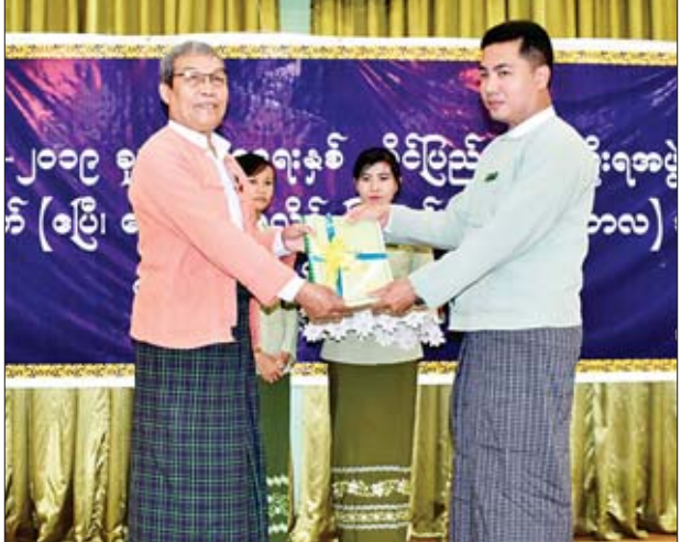
ဌာနဆိုင်ရာများနှင့် ခရိုင်အုပ်ချုပ်ရေးမှူးများကို တာဝန်ပေးအပ်သည်။ ဆက်လက်၍ ရခိုင်ပြည်နယ်အစိုးရအဖွဲ့၏ ခြောက်လပတ် လုပ်ငန်းညှိနှိုင်း အစည်းအဝေး ဒုတိယနေ့ကိုပြုလုပ်ရာ ခရိုင်နှင့် မြို့နယ်စီမံခန့်ခွဲမှု ကော်မတီ ဥက္ကဋ္ဌများက ဘဏ္ဍာနှစ်အလိုက် လုပ်ငန်းအကောင်အထည်ဖော် ဆောင်ရွက် ရာတွင် အားသာချက်၊ အားနည်းချက်များကို ရှင်းလင်းတင်ပြကြပြီး တင်ပြချက် များအပေါ် ပြည်နယ်ဝန်ကြီးချုပ်နှင့် ပြည်နယ်ဝန်ကြီးများက လိုအပ်သည်များကို ဝိုင်းဝန်းအကြံပြု ဆွေးနွေးကြသည်။

စစ်တွေ အောက်တိုဘာ ၉ ရခိုင်ပြည်နယ်၏ ၂၀၁၈-၂၀၁၉ ဘဏ္ဍာနှစ် ဒေသန္တရစီမံကိန်းရည်မှန်းချက်များ တာဝန်ပေးအပ်ပွဲနှင့် ၂၀၁၈-၂၀၁၉ ဘဏ္ဍာနှစ် ရခိုင်ပြည်နယ်အစိုးရအဖွဲ့၏ ခြောက်လပတ် လုပ်ငန်းညှိနှိုင်းအစည်းအဝေး ဒုတိယနေ့ကို ယနေ့နံနက် ၉ နာရီ တွင် စစ်တွေမြို့၊ ပြည်နယ်အစိုးရအဖွဲ့ရုံး အစည်းအဝေးခန်းမ၌ ကျင်းပသည်။ စီမံကိန်းရည်မှန်းချက် တာဝန်ပေးအပ်ပွဲတွင် ပြည်နယ်ဝန်ကြီးချုပ် ဦးညီပုက ပြည်နယ်အစိုးရအဖွဲ့မှ မိမိဒေသနှင့်ကိုက်ညီမည့် စီးပွားရေးမူဝါဒများ ချမှတ်ပြီး ဆောင်ရွက်လျက်ရှိကြောင်း၊ မူဝါဒဆိုင်ရာတွင်လည်း ဖွံ့ဖြိုးတိုးတက်မှု ကဏ္ဍတွင် ခရိုင်နှင့် မြို့နယ်အသီးသီး၌ အချိုးညီညီ ဖွံ့ဖြိုးတိုးတက်မှု တိုးတက်ရန်အတွက် ဆောင်ရွက်ရာတွင် လယ်ယာ၊ သားငါး ကဏ္ဍသည် အဓိကအခြေခံကျပါကြောင်း၊ ၎င်းကဏ္ဍကို ပိုမိုတိုးတက်အောင် ဆောင်ရွက် ရမည်ဖြစ်ကြောင်း၊ ၂၀၁၈ ခုနှစ် ခြောက်လစီမံကိန်းတွင် ပြည်နယ်၏ စုစုပေါင်း ထုတ်လုပ်မှုနှင့် ဝန်ဆောင်မှုတန်ဖိုးကို နှစ်အလိုက် ဈေးနှုန်းများအရ စီမံကိန်း ရည်မှန်းချက်အပေါ် ၈.၂ ဒသမ ၈ ရာခိုင်နှုန်း အကောင်အထည်ဖော်နိုင်ခဲ့ပြီး ပုံမှန်ဈေးနှုန်းများအရ ၃ ဒသမ ၅ ရာခိုင်နှုန်းတိုးတက်ခဲ့သည်ကို တွေ့ရှိရ ပါကြောင်း၊ ထို့ကြောင့် ယခင်စီမံကိန်းရည်မှန်းချက်လုပ်ငန်းများ အကောင် အထည်ဖော်မှုတွင် တွေ့ကြုံခဲ့သည့် အားသာချက်၊ အားနည်းချက်များကို ပြန်လည်သုံးသပ်၍ လာမည့် ၂၀၁၈-၂၀၁၉ ဘဏ္ဍာနှစ် ဒေသန္တရစီမံကိန်း များကို အကောင်အထည်ဖော်ရာတွင် လက်တွေ့အသုံးဆောင်ဆောင်ရွက်သွားကြရန် တိုက်တွန်းလိုကြောင်း ပြောကြားသည်။ ထို့နောက် ရခိုင်ပြည်နယ်ဝန်ကြီးချုပ်က ရခိုင်ပြည်နယ်၏ ၂၀၁၈-၂၀၁၉ ဘဏ္ဍာနှစ် ဒေသန္တရစီမံကိန်းရည်မှန်းချက်များအား ပြည်နယ်အဆင့်