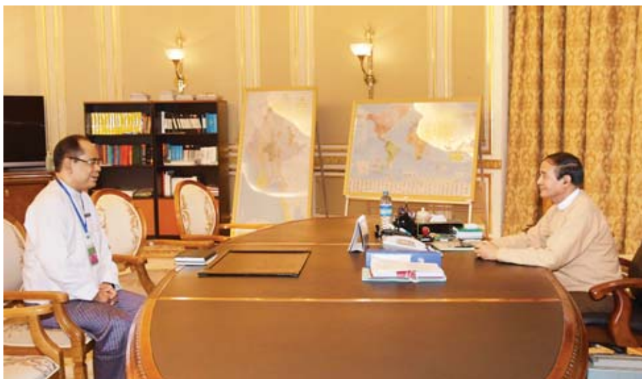
နိုင်ငံတော်သမ္မတ ဦးဝင်းမြင့် ဘယ်လိုရှိယံနိုင်ငံဆိုင်ရာ သံအမတ်ကြီးအဖြစ် တာဝန်ထမ်းဆောင်မည့် ဦးစိုးလင်းဟန်အား လမ်းညွှန်မှာကြားစဉ်။