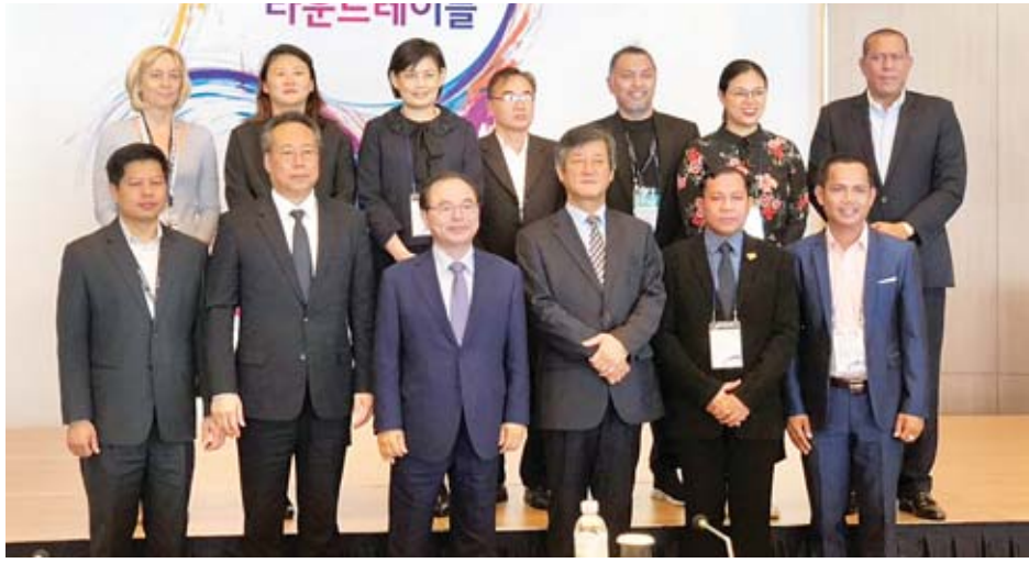
Asia Film Center Roundtable 2018 ကို အာရှနိုင်ငံများ၏ ရုပ်ရှင်လုပ်ငန်းများ ဖွံ့ဖြိုးတိုးတက်ရေးအတွက် နည်းလမ်းများ ရှာဖွေနိုင်ရန်၊ အာရှနိုင်ငံအချင်းချင်း ယဉ်ကျေးမှု ဆိုင်ရာ ဖလှယ်မှုများ တိုးမြှင့်ဆောင်ရွက်နိုင်ရန် အာရှရုပ်ရှင်ဗဟိုဌာန (Asia Film Center) တည်ထောင်လုပ်ငန်းများ ဖွံ့ဖြိုးတိုးတက်ရေးအတွက် နည်းလမ်းများ ရှာဖွေနိုင်ရန်၊ အာရှရုပ်ရှင်ဗဟိုဌာန တည်ထောင်ရန် လိုအပ်ခြင်းအကြောင်းရင်း၊ ၂၀၁၉ ခုနှစ်တွင် ဆောင်ရွက်ရန်လျာထားမှု မျှော်မှန်းထားသည့် အကျိုးရလဒ်များ၊ ဖွဲ့စည်းပုံဆိုင်ရာများ စသည်ဖြင့် ရင်းနှီးပွင့်လင်းစွာ ဆွေးနွေးကြသည်။ မြန်မာကိုယ်စားလှယ် အဖွဲ့အနေဖြင့် အာရှရုပ်ရှင်ဗဟိုဌာန

အဆိုပါ ဆွေးနွေးပွဲသို့ ဘူဆန်မြို့တော် စည်ပင်သာယာရေး ကော်မတီ ဥက္ကဋ္ဌနှင့် ဘူဆန်မြို့တော်ဝန် Mr. Oh Keo - don, Korea Film Council (KOFIC) ဥက္ကဋ္ဌ Mr. Olf Seok Geun နှင့် ဘူဆန်နိုင်ငံတကာ ရုပ်ရှင်ပွဲတော် ကျင်းပရေးဥက္ကဋ္ဌ Mr. Lee Young Kwan တို့နှင့်အတူ အာရှနိုင်ငံများမှ ရုပ်ရှင်ဆိုင်ရာ အဖွဲ့အစည်းများမှ တာဝန်ရှိသူများနှင့် မြန်မာကိုယ်စားလှယ်အဖွဲ့မှ ပြန်ကြားရေးဝန်ကြီးဌာန ပြန်ကြားရေးနှင့် ပြည်သူ့ဆက်ဆံရေး ဦးစီးဌာန ညွှန်ကြားရေးမှူးချုပ် ဦးရဲနိုင် ဦးဆောင်သော အဖွဲ့ဝင်သုံးဦး တက်ရောက်ကြသည်။