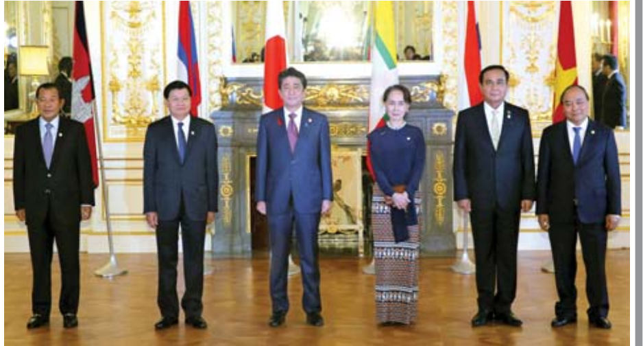
ကမ္ဘောဒီးယား၊ လာအို၊ မြန်မာ၊ ထိုင်းနှင့် ဗီယက်နမ် ခေါင်းဆောင်တို့က ကြိုဆိုကြသည်။ မဲခေါင်ဒေသသည် အလားအလာကောင်းသော ဈေးကွက်တစ်ခုအဖြစ် ရှုမြင်ရပြီး ဂျပန်ကုမ္ပဏီများအတွက် အရေးကြီးသော ဈေးကွက်ဖြစ်သည်။ မဲခေါင်ဒေသတွင် လူဦးရေမှာ ၂၃၈ သန်းရှိပြီး မဲခေါင်ဒေသနိုင်ငံများ၏ စုစုပေါင်း ပြည်တွင်းအသားတင် ထုတ်လုပ်မှု တန်ဖိုး(ဂျီဒီပီ)မှာ ၂၀၁၇ ခုနှစ်တွင် ဒေါ်လာ ၇၈၁ ဘီလီယံအထိ ရှိကြောင်း သတင်းတွင်ဖော်ပြသည်။

ဒေသတွင်း၌ ကုန်းလမ်းအရ ပင်လယ်ရေကြောင်းလမ်းအရ လေကြောင်းလမ်းအရ တစ်နိုင်ငံနှင့်တစ်နိုင်ငံ ချိတ်ဆက်မှုကို မြှင့်တင်ပေးသော အခြေခံအဆောက်အအုံ ဖွံ့ဖြိုးရေးလုပ်ငန်းများ တိုးတက်လာမှုအတွက် ဂျပန်၊