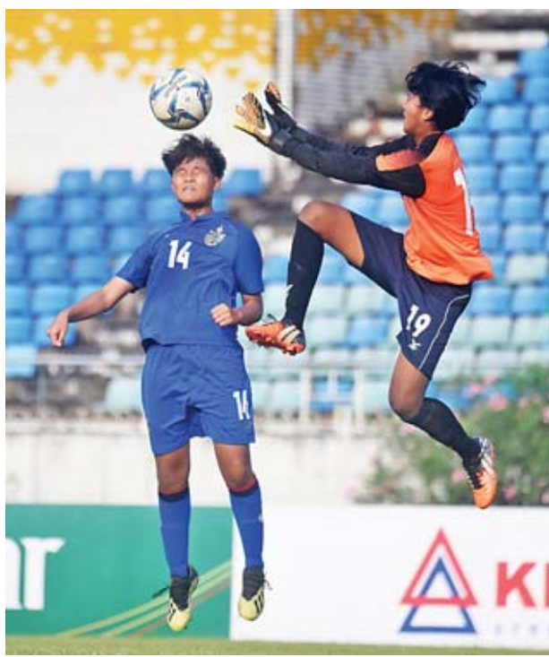
ထိုင်းအသင်း၏ ဂိုးသွင်းရန်ကြိုးပမ်းမှုကို မြန်မာအသင်း တက်အိန္ဒြာလင်းကာကွယ်နေစဉ်။

မြန်မာ ယူ-၁၉ အမျိုးသမီးအသင်းသည် ခြေစစ်ပွဲအကြိုပြင်ဆင်မှုအဖြစ် ယှဉ်ပြိုင်ကစားခြင်းဖြစ်သောကြောင့် ကစားသမားများကို အပြောင်းအလဲ ပြုလုပ်ကာ ကစားခဲ့ပြီး ပုံစံကောင်းရနေသည့် ကစားသမားများကို ပွဲထွက် လူစာရင်းတွင် အသုံးပြုကာ ယူ-၁၆ အသင်းမှ အားဖြည့်ရွေးချယ်ထားသည့် ကစားသမားများကိုမူ စာမျက်နှာ ၅ ကော်လံ ၁ သို့