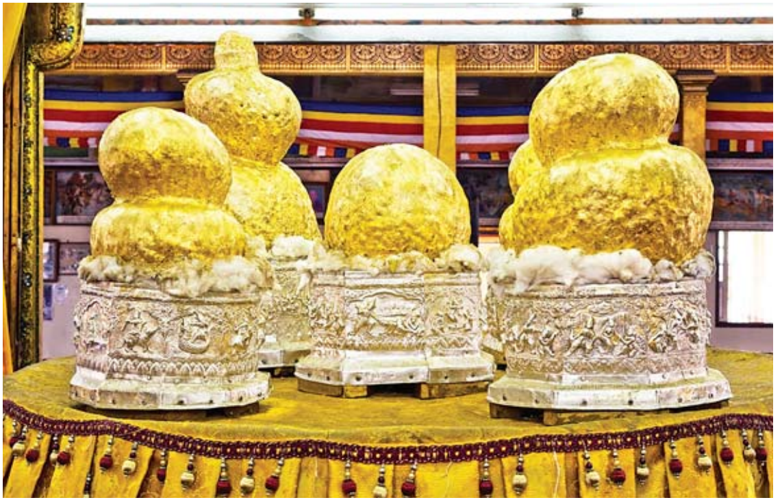
လက်ရှိဖောင်တော်ဦးဘုရားများကို ဖူးတွေ့ရစဉ်။

သီတင်းကျွတ်လဆန်း ၁ ရက်တွင် ဖောင်တော်ဦးဘုရားကျောင်းမှ ဆင်းတော်မူပြီး အင်းလေးအနောက်ဘက်ကမ်းရှိ အင်းတိမ်သို့ လည်းကောင်း၊ သီတင်းကျွတ်လဆန်း ၂ ရက်တွင် ကြေးပေါခံကျောင်းသို့လည်းကောင်း၊ သီတင်းကျွတ်လဆန်း ၃ ရက်တွင် အင်းတိမ်စံကျောင်းသို့လည်းကောင်း၊ သီတင်းကျွတ်လဆန်း ၄ ရက်တွင် ဟဲယားရွာမကျောင်းသို့လည်းကောင်း၊ သီတင်းကျွတ်လဆန်း ၅ ရက်တွင် ငါးဖယ်ချောင်းကျောင်းသို့လည်းကောင်း၊ သီတင်းကျွတ်လဆန်း ၆ ရက်တွင် ကြေးစားကျောင်းနှင့် ပွဲစားကုန်းကျောင်းသို့လည်းကောင်း၊ သီတင်းကျွတ်လဆန်း ၇ ရက်တွင် လင်းကင်းကျောင်းနှင့် ညောင်ရွှေမြို့ကျောင်းတော်သို့လည်းကောင်း၊ သီတင်းကျွတ်လဆန်း ၈ ရက်တွင် ညောင်ရွှေမြို့ကျောင်းသို့ လည်းကောင်း၊ သီတင်းကျွတ်လဆန်း ၉ ရက်တွင် ညောင်ရွှေမြို့ကျောင်းတော်၊ သီတင်းကျွတ်လဆန်း ၁၀ ရက်တွင် ညောင်ရွှေမြို့ကျောင်းတော်နှင့် နန်းသဲကျောင်းသို့ လည်းကောင်း၊