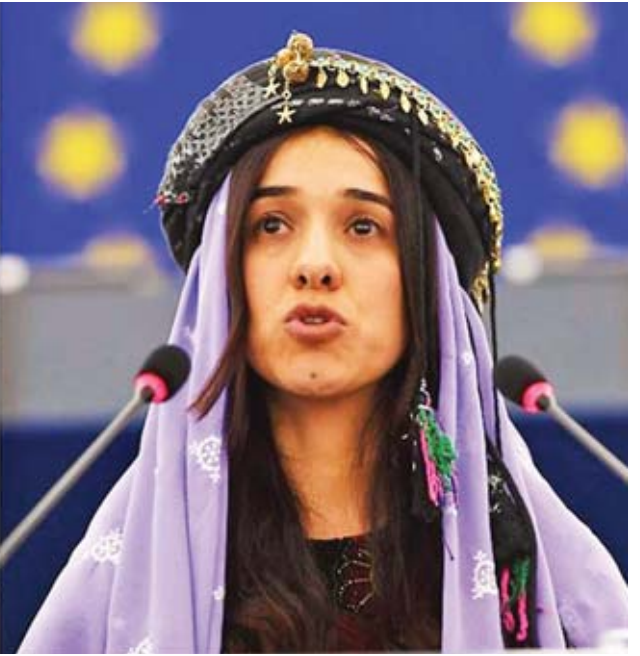
အောက်တိုဘာ ၅ ရက်တွင် ထုတ်ပြန်ကြေညာခဲ့ကြောင်း ယနေ့သတင်းများအရ သိရသည်။