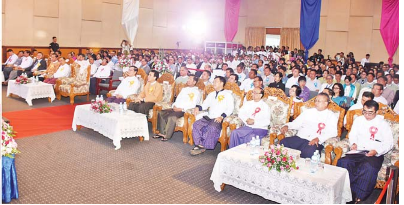
ဒုတိယသမ္မတ ဦးမြင့်ဆွေ မြန်မာနိုင်ငံကွန်ပျူတာအသင်းချုပ်က ကြီးမှူးကျင်းပသည့် e-Government Forum 2018 ဖွင့်ပွဲအခမ်းအနားတွင် အမှာစကားပြောကြားစဉ်။