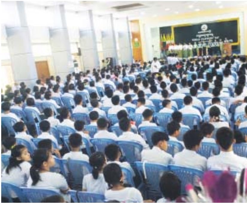
ဆရာများနေ့အထိမ်းအမှတ်ပြခန်းငယ်အား တိုင်း ကြည့်ရှုခဲ့ကြကြောင်း သိရသည်။ ပုသိမ်ခရိုင်(မြန်/ဆက်)

ပုသိမ် အောက်တိုဘာ ၅ ဧရာဝတီတိုင်းဒေသကြီး ပုသိမ်မြို့ အမှတ်(၁)အခြေခံ ပညာအထက်တန်းကျောင်း ရတနာတန်ဆောင် ခန်းမ၌ အောက်တိုဘာ ၅ ရက် နံနက် ၉ နာရီက ကမ္ဘာ့ ဆရာများနေ့အခမ်းအနား ကျင်းပသည်။ ဧရာဝတီတိုင်းဒေသကြီး ဝန်ကြီးချုပ် ဦးလှမိုး အောင်နှင့် ဝန်ကြီးများ၊ လွှတ်တော်ကိုယ်စား လှယ်များ၊ တိုင်းဒေသကြီး၊ ခရိုင်၊ မြို့နယ်အဆင့် ဌာန ဆိုင်ရာတာဝန်ရှိသူများ တက်ရောက်ကြသည်။ တိုင်းဒေသကြီးဝန်ကြီးချုပ် ဦးလှမိုးအောင်က ကျောင်းသား ကျောင်းသူများအားသင်ကြားရာတွင် ဘက်စုံထူးချွန်သော ကျောင်းသားများဖြစ်အောင် သင်ကြားပေးကြစေလိုကြောင်း အတတ်လည်းသင် ပဲ့ပြင်ဆုံးမဆိုင်ရာစကားအတိုင်း ကျင့်ကြံဆောင် ရွက်ကြရန်နှင့် မိဘ၊ ဆရာ၊ ကျောင်းသား သုံးဦး ညီညွတ်မှသာလျှင် ကျောင်းသား ကျောင်းသူများ ဘက်စုံထူးချွန်လာကြမည်ဖြစ်ကြောင်း ပြောကြား သည်။ ဧရာဝတီတိုင်းဒေသကြီး ပညာရေးမှူးရုံး ညွှန်ကြား ရေးမှူး (စီမံ) UNESCO, UNICEF, UNDP, ILO နှင့် Education International တို့မှပေးပို့သည့် သဝဏ်လွှာကို ဖတ်ကြားသည်။ ၂၀၁၈ ခုနှစ် ကမ္ဘာ့ဆရာများနေ့အထိမ်းအမှတ်တွင် ဆရာရရှိကြသူများအား ဆုများချီးမြှင့်ခဲ့ကြပြီး ကမ္ဘာ့