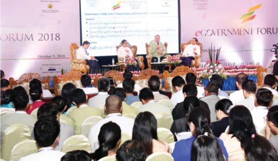
National Strategy and Framework for Digital Government ခေါင်းစဉ်ဖြင့် စကားပိုင်းဆွေးနွေးပွဲ ကျင်းပစဉ်။

e-Government ကို အကောင်အထည်ဖော်ရာတွင် အစိုးရနှင့် ပုဂ္ဂလိက ပူးပေါင်းဆောင်ရွက်ခြင်း (Public Private Partnership-PPP) စနစ်ကို အသုံးပြုသွားမှ ပိုမိုထိရောက်လျင်မြန်စွာ အကောင်အထည်ဖော် ဆောင်ရွက်နိုင်မည်ဖြစ်ကြောင်း၊ ယခု အကောင်အထည်ဖော်ဆောင်ရွက်နိုင်မည့် ဝန်ဆောင်မှုများကို မြန်မြန်အကောင်အထည်ဖော်ဆောင်ရွက်နိုင်ရန်အတွက် နိုင်ငံတော်၏ ရန်ပုံငွေဖြင့် ဦးစားပေး ဆောင်ရွက်သင့်သည့်လုပ်ငန်းများ၊ ပြည်တွင်းကုမ္ပဏီများနှင့် ပူးပေါင်းဆောင်ရွက်သွားရမည့် လုပ်ငန်းများကို ခွဲခြမ်းစိတ်ဖြာတွက်ချက်ထားရန်လည်း လိုအပ်မည်ဖြစ်ကြောင်း၊ e-Government စနစ်ကို စဉ်ဆက်မပြတ် ဆောင်ရွက်သွားနိုင်ရန်နှင့် ဥပဒေနှင့်အညီ လိုက်လျောညီထွေလုပ်ဆောင်နိုင်ရန်အတွက် ပြည်တွင်းကုမ္ပဏီများကသာ စဉ်ဆက်မပြတ်လုပ်ကိုင်ပေးသွားနိုင်မည်ဟု ယုံကြည်ပါကြောင်း။