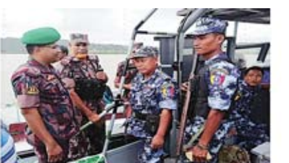
ရေကြောင်းကင်းလှည့်ခြင်း(၁၄)ကြိမ်