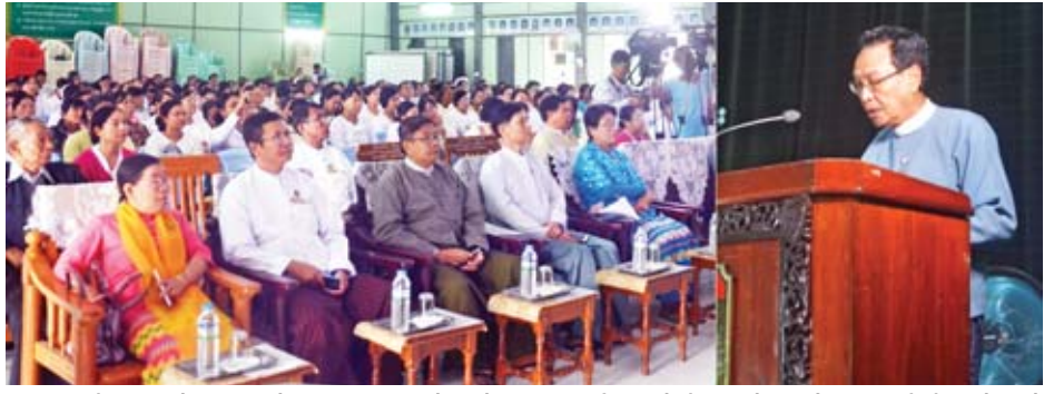
လောကတိုပညာဖြင့် အလှဆင်ပေးနေသူများဖြစ်သည့် ဆရာများ၏ ဂုဏ်သိက္ခာနှင့် ဂုဏ်ကျေးဇူးတို့ကို ဖော်ထုတ် ဂုဏ်ပြုရန် ရည်ရွယ်ချက်ဖြင့် ကမ္ဘာ့ဆရာများနေ့ အထိမ်းအမှတ် အခမ်းအနားကို မန္တလေးမြို့ ချမ်းအေးသာစံမြို့နယ် အမှတ်(၁၄) အခြေခံပညာအထက်တန်းကျောင်း ပန်းချီတစ်ရာခန်းမ၌ အောက်တိုဘာ ၅ ရက် နံနက် ၉ နာရီက ကျင်းပစဉ်။