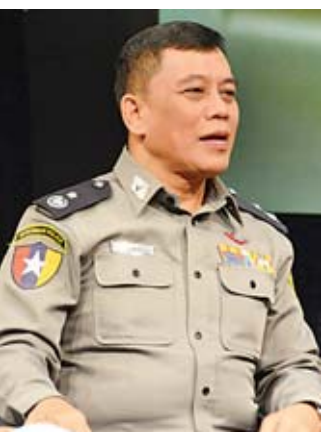
ရဲဗိုလ်ချုပ် အောင်နိုင်သူ

ပြောင်းလဲနေတဲ့စနစ်နဲ့ ပြောင်းလဲနေတဲ့ လူမှုပတ်ဝန်း ကျင်နဲ့ ကိုက်ညီဖို့လိုပါတယ်။ ဒီနေရာမှာ ကျွန်တော်တို့ ပြောပြချင်တာက တချို့ကိစ္စရပ်တွေက နိုင်ငံတစ်နိုင်ငံနဲ့ တစ်နိုင်ငံမဟုတ်ဘူး။ ဥပမာအားဖြင့် မူးယစ်ဆေးဝါးနဲ့ ပတ်သက်လာရင် ဆေးခြောက်ကို အချို့နိုင်ငံများက တားမြစ် ပေးမယ့် အချို့နိုင်ငံက မတားမြစ်ပါဘူး။ ထိုနည်းတူစွာပဲ သေဒဏ်ပတ်သက်လို့လည်း တချို့နိုင်ငံတွေက ခွင့်ပြုပါ တယ်။ တချို့နိုင်ငံတွေကခွင့်မပြုပါဘူး။ ထို့အတူပဲ သေဒဏ်နဲ့ပတ်သက်လို့လည်း တချို့နိုင်ငံတွေကခွင့်ပြုပါ တယ်။ တချို့နိုင်ငံတွေက ခွင့်မပြုပါဘူးစသည်ဖြင့်မတူတဲ့ အခြေအနေတွေဖြစ်ပါတယ်။ ဒါကြောင့် နိုင်ငံတစ်နိုင်ငံမှာ လက်ခံကျင့်သုံးမှုဟာ အခြားနိုင်ငံတွေအတွက် လက်ခံ ကျင့်သုံးနိုင်တဲ့ အခြေအနေနဲ့ ကိုက်ညီချင်မှ ကိုက်ညီမှာ ဖြစ်ပါတယ်။ ဒီတော့ နိုင်ငံတစ်ခုမှာ ပြဌာန်းတဲ့ ဥပဒေဟာ အခြားနိုင်ငံမှာ မိမိအခြေအနေနဲ့ ကိုက်ညီလျော်ညီမှသာ ကျင့်သုံးပြဌာန်းလေ့ရှိပါတယ်။ ဒါက ကျွန်တော်တို့ ဥပဒေ ပြဌာန်းတဲ့အပိုင်းပါ။