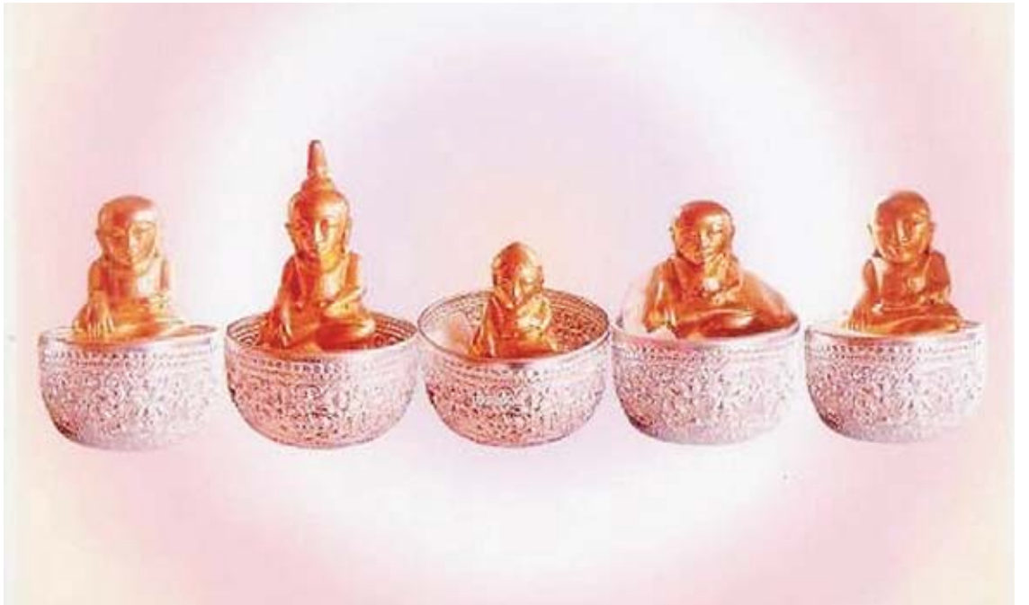
ဖောင်တော်ဦးဘုရား မူလပုံတော်များကို တွေ့ရစဉ်။

ကြသည်။ မြန်မာသက္ကရာဇ် ၇၂၁၊ ခရစ်နှစ် ၁၃၅၉ခုနှစ်တွင် ညောင်ရွှေမြို့၌ စိုးစံအုပ်ချုပ်သော ဖောင်တော်ဦး သန်းတောင်ရွာသားတစ်စုသည် ဖောင်တော်ဦးဘုရားတည်နေရာ၌ ရောင်ခြည်တော်များ ကွန်မြူးနေသည်ကို တွေ့ရသဖြင့် ဖောင်တော်ဦးထံသွားရောက် လှောက်ထားကြသည်။ ဖောင်တော်ဦး သိဆိုင်ဖသည် အားရဝမ်းသာဖြစ်၍ ဆွေတော်မျိုးတော်များမတ်တော်နှင့် ပရိသတ်လေးပါး မြောက်မြားစွာခြံရံ၍ သန်းတောင်အရပ်သို့ ထွက်လာကာ တောချုံပိတ်ပေါင်းတို့ကို ရှင်းလင်းခုတ်ထွင်ပြီး စေတီလိုက်ပျက်ထဲမှ ဘုရားငါးဆူကို ပင့်ဆောင်ကာ ဖောင်တော်ဦးမှ ဟော်နန်း၌ ထားရှိကိုးကွယ်ခဲ့ပြီးနောက် နှစ်စဉ်နှစ်တိုင်း ဟော်နန်းပေါ်မှ ဟော်နန်းအောက်၌ ဆောက်ထားသော စံမဏ္ဍပ်သို့ သီတင်းကျွတ် လဆန်း ၇ ရက်တွင် ပင့်ဆောင်ပူဇော်ခံမြဲဖြစ်သည်။ ထို့ကြောင့် ဖောင်တော်ဦးဘုရားဟုမခေါ်ဘဲ စဝ်ပရားလုံးမိန်း ဟူ၍ ရှမ်းဘာသာ ဝေါဟာရဖြင့် ခေါ်ဆိုအမည်တွင်ခဲ့သည်။ အဓိပ္ပာယ်မှာ လူပြည်သို့ ဆင်းလာသော မြတ်စွာဘုရားဟု ဖြစ်ပေသည်။ ၎င်းရုပ်ပွားတော် ငါးဆူအနက် နှစ်ဆူမှာ ရဟန္တာပုံတော်ဟု သိရှိရသည်။ ၎င်းရုပ်ပွားတော် ငါးဆူတို့ကို ဖောင်တော်ဦးရုပ်ပွားတော်ဟု ခေါ်ဝေါ်သည်။ ဤသို့ ဖောင်တော်ရှေ့ဦး၌ တင်ယူကိုးကွယ်ခဲ့သော ဘုရားဖြစ်ခြင်းကြောင့် ဖောင်တော်ဦးဘုရားဟု ခေါ်ခြင်းဖြစ်သည်။ မြန်မာသက္ကရာဇ် ၉၇၇၊ ခရစ်နှစ် ၁၆၁၅ခုနှစ်၌ အမျိုးသမီးဖောင်တော်ဦး စဝ်နန်းဖဲ