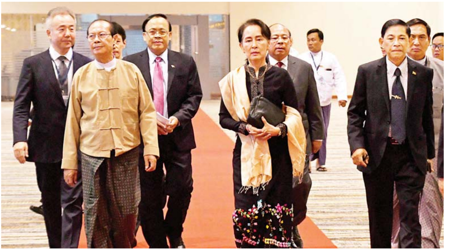
နိုင်ငံတော်၏အတိုင်ပင်ခံပုဂ္ဂိုလ် ဒေါ်အောင်ဆန်းစုကြည်အား တာဝန်ရှိသူများက နေပြည်တော်အပြည်ပြည်ဆိုင်ရာလေဆိပ်တွင် ပို့ဆောင်နှုတ်ဆက်ကြစဉ်။

ထိုမှတစ်ဆင့် နိုင်ငံတော်၏အတိုင်ပင်ခံ ပုဂ္ဂိုလ် ဒေါ်အောင်ဆန်းစုကြည်နှင့်အဖွဲ့သည်