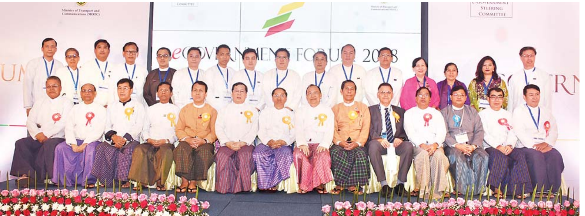
ဒုတိယသမ္မတ ဦးမြင့်ဆွေ e-Government Forum 2018 ဖွင့်ပွဲအခမ်းအနားသို့ တက်ရောက်လာကြသူများနှင့်အတူ စုပေါင်းမှတ်တမ်းတင်ဓာတ်ပုံရိုက်စဉ်။

* ကျောပိုးမှ နာယကများ၊ ဥက္ကဋ္ဌများ၊ ဒုတိယဥက္ကဋ္ဌများနှင့်အဖွဲ့ဝင်များ၊ ကွန်ပျူတာတက္ကသိုလ်အသီးသီးမှ ပါမောက္ခချုပ်များနှင့် ပါမောက္ခများ၊ ဌာနဆိုင်ရာအသီးသီးမှ တာဝန်ရှိပုဂ္ဂိုလ်များ၊ ကျွမ်းကျင်ပညာရှင်များနှင့် ဖိတ်ကြားထားသူများ တက်ရောက်ကြသည်။