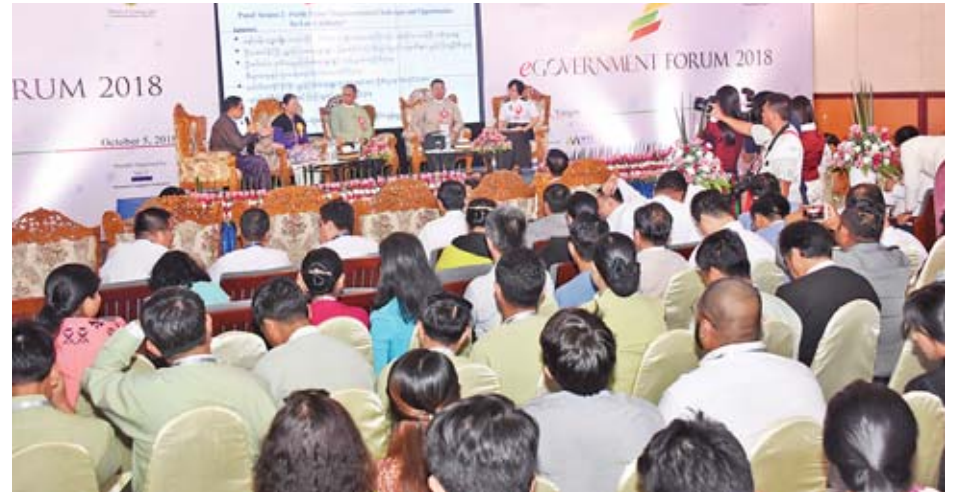
Implementation Challenges and Opportunities for Local Industry ခေါင်းစဉ်ဖြင့် စကားပိုင်းဆွေးနွေးပွဲ ကျင်းပစဉ်။