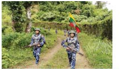
ကုန်းကြောင်းကင်းလှည့်ခြင်း(၇၄)ကြိမ်

လုံခြုံရေးတပ်ဖွဲ့ဝင်များ၏ လုပ်ငန်းစွမ်းဆောင်ရည် မြှင့်တင်ရေးနှင့် ပြည်သူ့လူထု ပူးပေါင်းပါဝင်သော ရဲလုပ်ငန်းစနစ်ပီပြင်စွာဖော်ဆောင်နိုင် ရေးအတွက် လေ့ကျင့်သင်တန်းပေးမှုများ ဆောင်ရွက်လျက်ရှိရာ ၂၀၁၈ ခုနှစ် မေလမှ ဩဂုတ်လအထိ ရဲလုပ်ငန်းဆိုင်ရာ ကျွမ်းကျင်မှုသင်တန်း ၁၉ ကြိမ် ဖွင့်လှစ်ပို့ချနိုင်ခဲ့ပြီး ရဲတပ်ဖွဲ့ဝင်အရာထမ်း၊ အမှုထမ်း ၁၄၃၈ ဦးကို လေ့ကျင့် ပေးနိုင်ခဲ့ပါသည်။