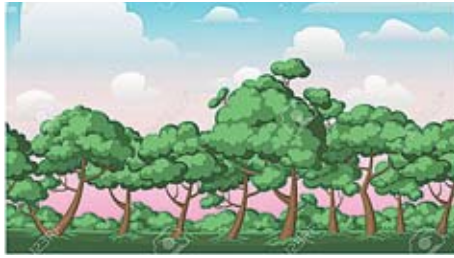
သစ်တောစိုက်ပျိုးထိန်းသိမ်းခြင်း

သဘာဝပတ်ဝန်းကျင်ထိန်းသိမ်းမှုဖြင့်တင်ခြင်းနှင့် ရာသီဥတုပြောင်းလဲခြင်း၏ ဆိုးကျိုးသက်ရောက်မှုများကို လျော့ချနိုင်ရန် ရခိုင်ပြည်နယ် မြို့နယ် ခုနစ်မြို့နယ်တွင်စိုက်ပျိုးထားသော သစ်တောများအနက် ၅၂၅ ဧကတွင် ဓမ္မတာမျိုးဆက်ခြင်းအထောက်အကူလုပ်ငန်းဆောင်ရွက်ခြင်း၊ စီးပွားရေး(ပျဉ်းကတိုး) သစ်တောစိုက်ခင်း၊ ဒီဂရေတောစိုက်ခင်း စုစုပေါင်း ၆၉၀