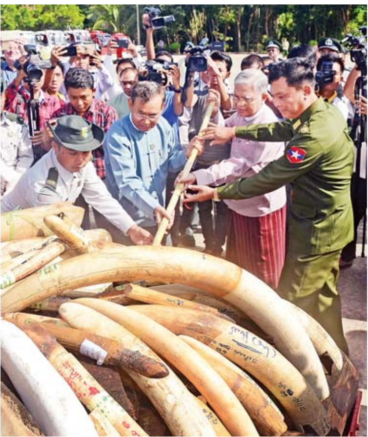
ပြည်ထောင်စုဝန်ကြီး ဒုတိယဗိုလ်ချုပ်ကြီးကျော်ဆွေ၊ ဦးအုန်းဝင်း၊ မြန်မာနိုင်ငံ အဂတိ လိုက်စားမှုတိုက်ဖျက်ရေးကော်မရှင်ဥက္ကဋ္ဌ ဦးအောင်ကြည်နှင့် တာဝန်ရှိသူတို့က ဖမ်းဆီးရမိ ဆင်စွယ်၊ ဆင်အစိတ်အပိုင်းနှင့် တောရိုင်းတိရစ္ဆာန်အစိတ်အပိုင်းများအား မိုးရွာဖျက်ဆီးကြစဉ်။

“၂၀၁၀ ပြည့်နှစ်မှာ ဆင်သတ်ခံရမှုက တစ်ခုသာရှိခဲ့ပါတယ်။ ၂၀၁၃ ခုနှစ်မှ စတင် ပြီးတော့ ဆင်သတ်ဖြတ်မှုတွေ ပိုမိုများပြား လာပြီးတော့ ၁၄ မှုအထိ တိုးလာပါတယ်။