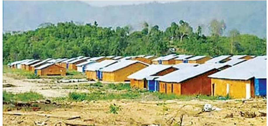
နိုင်ငံ IDP စခန်းပိတ်သိမ်းပြီး ပြန်လည်နေရာချထားမှု

နိုင်ငံသားစိစစ်ရေးကော်မရှင်၊ နိုင်ငံသားပြုခွင့်ရသူလက်မှတ် ရရှိကိုင်ဆောင်သောသူများသည် မည်သည့်ဒေသမဆို လွတ်လပ်စွာသွားလာခွင့်ရှိသဖြင့် မြန်မာနိုင်ငံအတွင်း နေထိုင်သူဖြစ်ကြောင်း အထောက်အထား လက်မှတ်ဖြစ်သည့် NV Card ကိုင်ဆောင်သူများကို မောင်တောခရိုင်အတွင်း လွတ်လပ်စွာ သွားလာခွင့်ပြုထားပြီး ပြည်နယ်ပြင်ပသို့ ခရီးသွားလာခြင်းအတွက် ၎င်းတို့သွားရောက်လိုသည့် ပြည်နယ်/ တိုင်းဒေသကြီးရှိ တည်းခိုနေထိုင်မည့် လိပ်စာမှန်ကန်ခြင်း ရှိ၊ မရှိ၊ အိမ်ရှင်မှ တာဝန်ယူခြင်း ရှိ၊ မရှိ စိစစ်ပြီး ပြည်နယ်အစိုးရအဖွဲ့ လုံခြုံရေးနှင့် နယ်စပ်ရေးရာဝန်ကြီးဌာန၊ ယာယီခရီးသွားလာခွင့် စိစစ်ရေးကော်မတီ၏ ခွင့်ပြုချက်ဖြင့် သွားလာခွင့်ပြုပေးခဲ့ရာ ၂၀၁၈ ခုနှစ် မေလမှ ဩဂုတ်လအတွင်း စုစုပေါင်း ကျား ၈၀၊ မ ၄၆ ဦး ပေါင်း ၁၂၆ ဦးတို့ ခရီးသွားလာနိုင်ခဲ့ပါသည်။