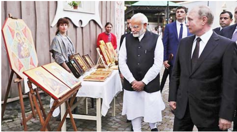
အမေရိကန်အစိုးရအဖွဲ့က ခြိမ်းခြောက်ထားလင့်ကစား ရေး ခိုးကျည်စနစ် ရောင်းချပေးရန် သဘောတူညီချက်ကို လက်မှတ်ရေးထိုးမည်ဟု မျှော်လင့်ရသည်။

သမ္မတပူတင်၏ ခရီးစဉ်အတွင်း အရေးအကြီးဆုံး သဘောတူညီချက်မှာ အက်စ်-၄၀၀ လေကြောင်းရန်ကာကွယ်ရေးစနစ် ရောင်းချပေးရေးဆိုင်ရာ သဘောတူညီချက်ဖြစ်သည်။ ရုရှားလုပ်ကားကုန်ပစ္စည်းများ ဝယ်ယူသောနိုင်ငံများအား စီးပွားရေးပိတ်ဆို့မှုပြုလုပ်မည်ဟု