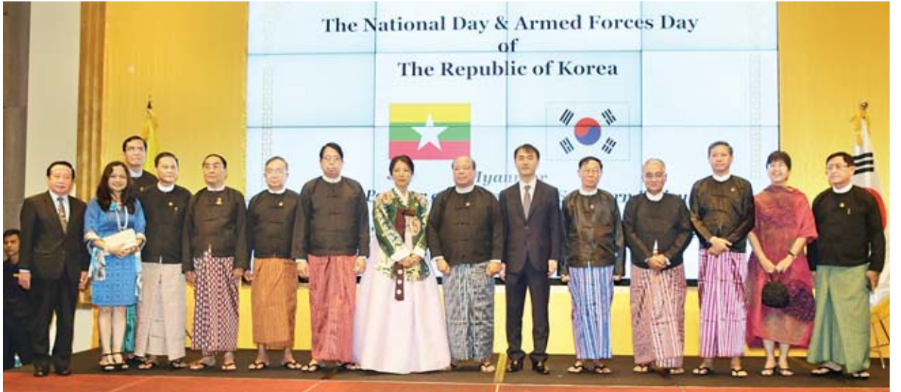
ပြည်ထောင်စုရွေးကောက်ပွဲကော်မရှင်ဥက္ကဋ္ဌ ဦးလှသိန်း၊ ပြည်ထောင်စုဝန်ကြီးများ၊ ပြည်ထောင်စုရှေ့နေချုပ်၊ ဒုတိယဝန်ကြီးများ၊ သံအမတ်ကြီးများ၊ ကိုရီးယားသမ္မတနိုင်ငံ သံအမတ်ကြီးနှင့်ဇနီးတို့နှင့်အတူ ဖျော်ဖြေမှုတမ်းတင်ဓာတ်ပုံရိုက်ကြစဉ်။

အဆိုပါဧည့်ခံပွဲသို့ ပြည်ထောင်စုဝန်ကြီး ဒေါက်တာဖေမြင့်၊ ဦးအုန်းဝင်း၊ ဒေါက်တာသန်းမြင့်၊ ဒေါက်တာမျိုးသိမ်းကြီး၊ ဦးဟန်ဇော်၊ နိုင်သက်လွင်၊