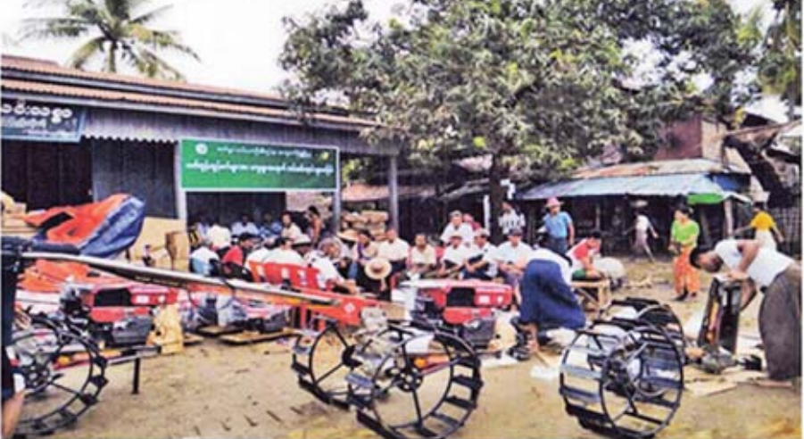
အရပ်ကျစနစ်ဖြင့် လက်တွန်းထွန်စက် ၃၉၂ စီး ရောင်းချပေးခဲ့သည်

ဆက်သွယ်ရေးကဏ္ဍတွင် အစီရင်ခံသည့်ကာလအတွင်း Mobile Telephone စခန်းတည်ဆောက်မှု ၆၇ ခုနှင့် Fiber Optic Cable ၁၂၃ ကီလိုမီတာ တိုးချဲ့နိုင်ခဲ့ပါသည်။