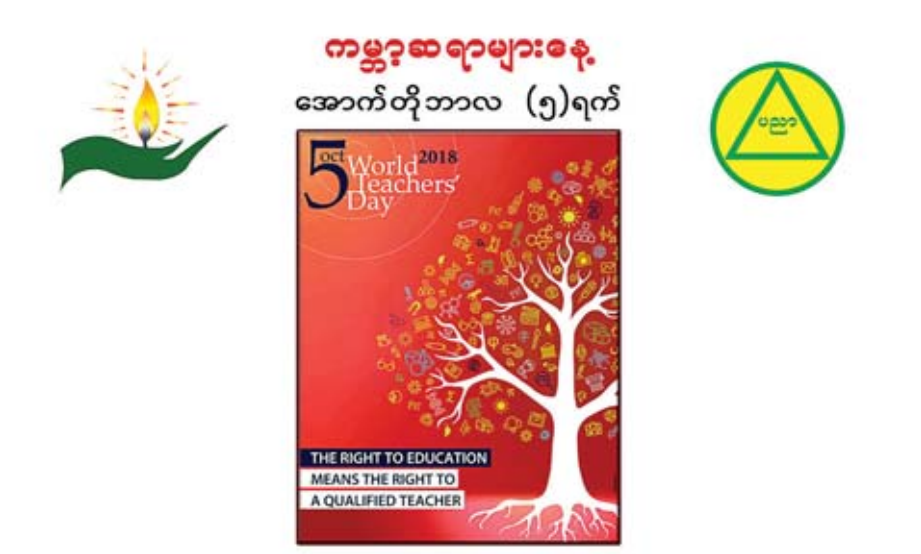
“ပညာအခွင့်အလမ်းရရှိဖို့ အရည်အသွေးပြည့်ဆရာ ဖြည့်ဆည်းဖို့”

ဆရာ ဆရာမများအနေဖြင့် ကျွန်ုပ်တို့နိုင်ငံအတွက် တန်ဖိုးရှိသော လူသားကောင်းများ မွေးထုတ်ပေးနိုင်ရေး အတွက် ကျောင်းသား ကျောင်းသူများအား ကိုယ်တိုင်ပါဝင် လုပ်ဆောင် သင်ယူစေခြင်း၊ သင်ယူသူကိုယ်တိုင်လေ့လာ သင်ယူနိုင်မည့် နည်းလမ်းများကို ညွှန်ပြခြင်းနှင့် စာသင်ခန်းမှ လူမှုဘဝစီးပွားအထိ လက်တွေ့အသုံးချနိုင်ရန် လေ့ကျင့်သင်ကြားပေးနေကြသည်။ သင်ကြားသင်ယူမှု လုပ်ငန်းများ ပိုမိုထိရောက်အောင်မြင်စေရေးအတွက်