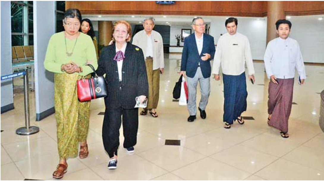
သံအမတ်ကြီး ရီဆာရီယိုမယ်နာလိုနှင့် သံအမတ်ကြီး ကင်ဒီအိုရီးမားတို့ ရန်ကုန်အပြည်ပြည်ဆိုင်ရာလေဆိပ်သို့ ရောက်ရှိလာစဉ်။