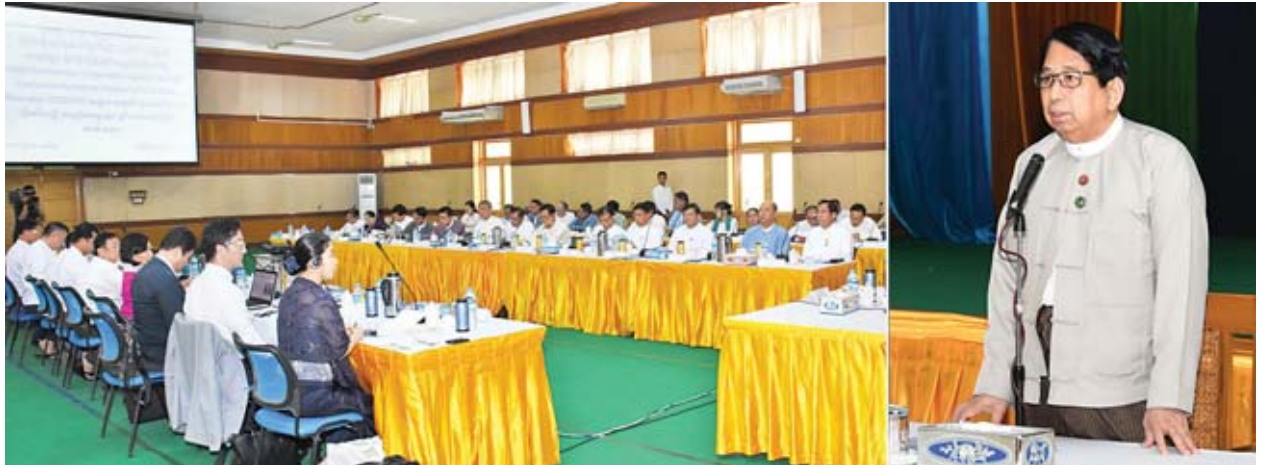
ပြည်ထောင်စုဝန်ကြီး ဒေါက်တာဖေမြင့် ကျောင်းသုံးပြဋ္ဌာန်းစာအုပ်များဆိုင်ရာ အရည်အသွေးရှင်းလင်းတင်ပြခြင်းအခမ်းအနားတွင် အမှာစကားပြောကြားစဉ်။

ယင်းနောက် ပညာရေးဝန်ကြီးဌာန ဒုတိယဝန်ကြီး ဦးဝင်းမော်ထွန်းက ကျောင်းသုံးစာအုပ်ဆိုင်ရာ အရည်အသွေးတွင် ပုံနှိပ်စက်များ၏ အရည်အသွေးမှာ အဓိကကျသဖြင့် ၎င်းအခြေအနေကိုလည်း ဆွေးနွေးပေးရန်