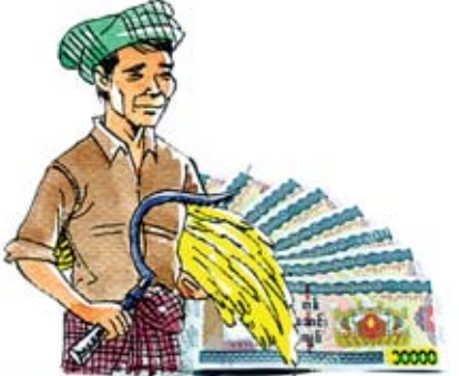
မြန်မာ့လယ်ယာဖွံ့ဖြိုးရေးဘဏ်မှ ထုတ်ချေးငွေပေါင်း ကျပ်(၈၅.၈၃၃)ဘီလီယံ

ရာသီဥတုပြောင်းလဲခြင်း၏ အကျိုးသက်ရောက်မှုများကို တုံ့ပြန်ဖြေရှင်းနိုင်ရန်အတွက် ရေသိုလှောင်ခြင်းကို ပုံစံအမျိုးမျိုးဖြင့် တိုးမြှင့်ဆောင်ရွက်သည့်အနေဖြင့် ရေခဲကန်တားတာ၊ တာ/တမ်၊ တာပုံစံကျ၊ ကွန်ကရစ် ရေတံခါးပြုပြင်၊ မွမ်းမံ၊ တည်ဆောက်ခြင်းလုပ်ငန်း ၇၅ ခု ဆောင်ရွက်လျက်ရှိရာ ၆၂ ခုမှာ ရာနှုန်းပြည့် ဆောင်ရွက်ပြီးဖြစ်ပါသည်။ မြို့နယ် ငါးမြို့နယ်တွင် ကမ်းပြိုကမ်းထိန်းလုပ်ငန်းများနှင့် ကျောက်စီမြေထိန်းနံရံ ပြုပြင်ခြင်းလုပ်ငန်း ခုနစ်ခုကို ဆောင်ရွက်ခဲ့ရာ လုပ်ငန်းအားလုံး ရာနှုန်းပြည့် ပြီးစီးနေပြီဖြစ်ပါသည်။