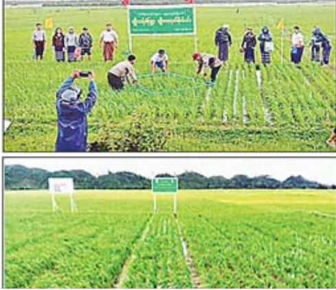
နည်းပညာပေးစံပြစိုက်ကေပေါင်း ၄၄၂၀ ဧက

ရာသီဥတုပြောင်းလဲမှုဒဏ်ကို ခံနိုင်သော စိုက်ပျိုးရေးဆိုင်ရာမျိုးစေ့များ ထုတ်လုပ်ဖြန့်ဖြူးနိုင်ရန် မြို့နယ်အားလုံးတွင် စပါးမျိုးသန့်မျိုးစေ့စုစုပေါင်း တင်း ၁၆၈၀၀ ဖြန့်ဖြူးခြင်း၊ မိုးစပါးမျိုးစေ့ထုတ်စိုက်ခင်း ၆၈၅ ဧကနှင့် မိုးစပါးမျိုးသန့်ဇုန် ၈၀၀၀၊ မိုးစပါးစံပြကွက် ၃၃၅ ဧက၊ SRI နည်းပညာပေးစံပြကွက် ၃၁ ဧက၊ Seeder နည်းပညာပေးစံပြကွက် ၂၂၃ ဧကနှင့် GAP နည်းပညာပေးစံပြကွက် ၁၁၅ ဧက၊ ဘူးသီးတောင်နှင့် အမ်းမြို့နယ်တို့တွင် မိုးစပါး DAR စမ်းသပ်ကွက် ၁၂ ကွက်၊ မိုးစပါးစိုက်နည်းစနစ် စမ်းသပ်ကွက် ၂၂ ကွက်၊ သီးနှံပုံစံ စမ်းသပ်ကွက် ၂၄ ကွက် စိုက်ပျိုးနိုင်ခဲ့ပါသည်။