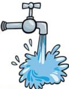
ကျေးရွာပေါင်း(၉၀)တွင် ကျေးလက်ရေရရှိရေးလုပ်ငန်း(၉၇)ခု ဆောင်ရွက်ပေးခဲ့သည်

ခေတ်မီစိုက်ပျိုးရေးနည်းစနစ်များ အသုံးပြုခြင်းဆိုင်ရာလုပ်ငန်းများအနေဖြင့် ပညာပေးစာစောင် ၉၇၈၆ စောင် ဖြန့်ဝေခြင်း၊ တောင်သူပညာပေးသင်တန်း ၆၂ ကြိမ်၊ တောင်သူပညာပေးဆွေးနွေးပွဲ ၁၃၃ ကြိမ်၊ စိုက်ပျိုးနည်းပညာပေးသင်တန်း သုံးကြိမ်၊ ဝန်ထမ်းစွမ်းဆောင်ရည်မြှင့်တင်ရေးသင်တန်း ၁၂ ကြိမ်၊ လယ်ယာသုံးစက်ကိရိယာ မောင်းနှင်ထိန်းသိမ်းမှုသင်တန်း တစ်ကြိမ် စုစုပေါင်းသင်တန်း ၇၈ ကြိမ်၊ ဆွေးနွေးပွဲ ၁၃၃ ကြိမ်ဖြင့် လူဦးရေ ၄၀၇၅ ဦးကို နည်းပညာဖြန့်ဝေနိုင်ခဲ့ပါသည်။