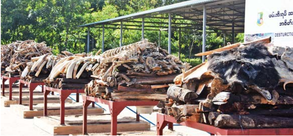
ဖမ်းဆီးရမိခဲ့သည့် ဆင်စွယ်၊ ဆင်အစိတ်အပိုင်းနှင့် တောရိုင်းတိရစ္ဆာန်အစိတ်အပိုင်းများအား မိုးရွာဖျက်ဆီးမိ တွေ့ရစဉ်။

၂၀၁၇ ခုနှစ်မှာတော့ ၅၉ ကောင်အထိ အသတ်ခံရပြီး အများဆုံးနှစ်တစ်ခု ဖြစ်ပါ တယ်။ ၂၀၁၈ ခုနှစ် စက်တင်ဘာလအထိ ၁၅ ကောင် အသတ်ခံရပြီး ပြန်လည်လျော့ နည်းကျဆင်းလာပါတယ်” ဟု တောဆင်ရိုင်း သတ်ဖြတ်ခံရမှု အခြေအနေအပေါ် ညွှန်ကြား ရေးမှူးချုပ် ဒေါက်တာညီညီကျော်က ပြောကြားသည်။