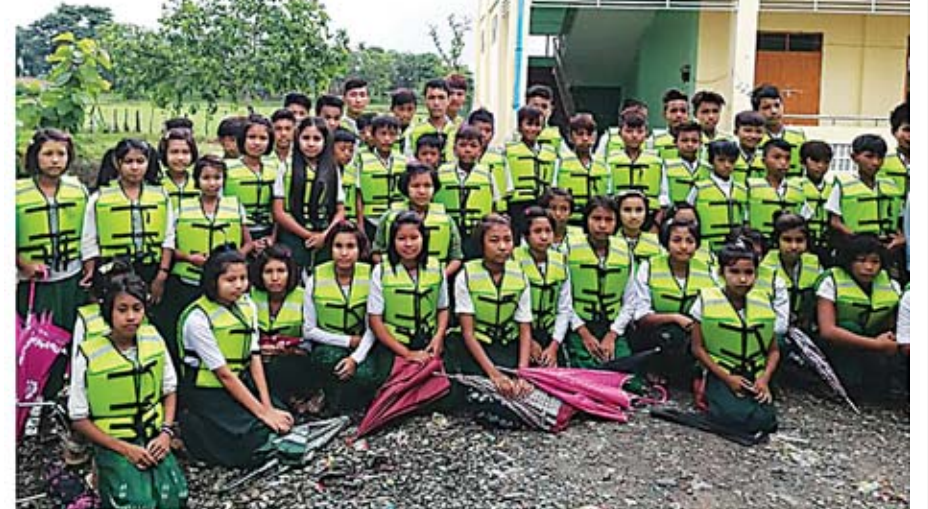
ရခိုင်ပြည်နယ်အတွင်း ရေလမ်းအသုံးပြု ကျောင်းတက်ရသော ကျောင်းသား ကျောင်းသူ ၄၂၇၂ ဦးအတွက် အသက်ကယ်အင်္ကျီများ ထောက်ပံ့ခဲ့သည်

ဆောင်းပါး ၃၈၆ ကြိမ်၊ တွေ့ဆုံမေးမြန်းမှု ငါးကြိမ်၊ မိန့်ခွန်းဖော်ပြမှု တစ်ကြိမ်၊ သတင်းစာရှင်းလင်းပွဲ တစ်ကြိမ်၊ ဓာတ်ပုံဖော်ပြမှု ၁၄၅ ကြိမ်၊ နေ့စဉ်ထုတ်သတင်းစာများတွင် ညှိနှိုင်းအစည်းအဝေးဖော်ပြမှု ၂၁ ကြိမ်၊ ဓာတ်ပုံ ၃၁ ကြိမ်၊ သတင်းထုတ်ပြန်မှု ၁၇ ကြိမ်၊ ဓာတ်ပုံ ၁၅ ကြိမ်၊ လက်ခံတွေ့ဆုံမှု ၁၂ ကြိမ်၊ ဓာတ်ပုံဖော်ပြမှု ၁၂ ကြိမ် ဆောင်ရွက်နိုင်ခဲ့ပါသည်။