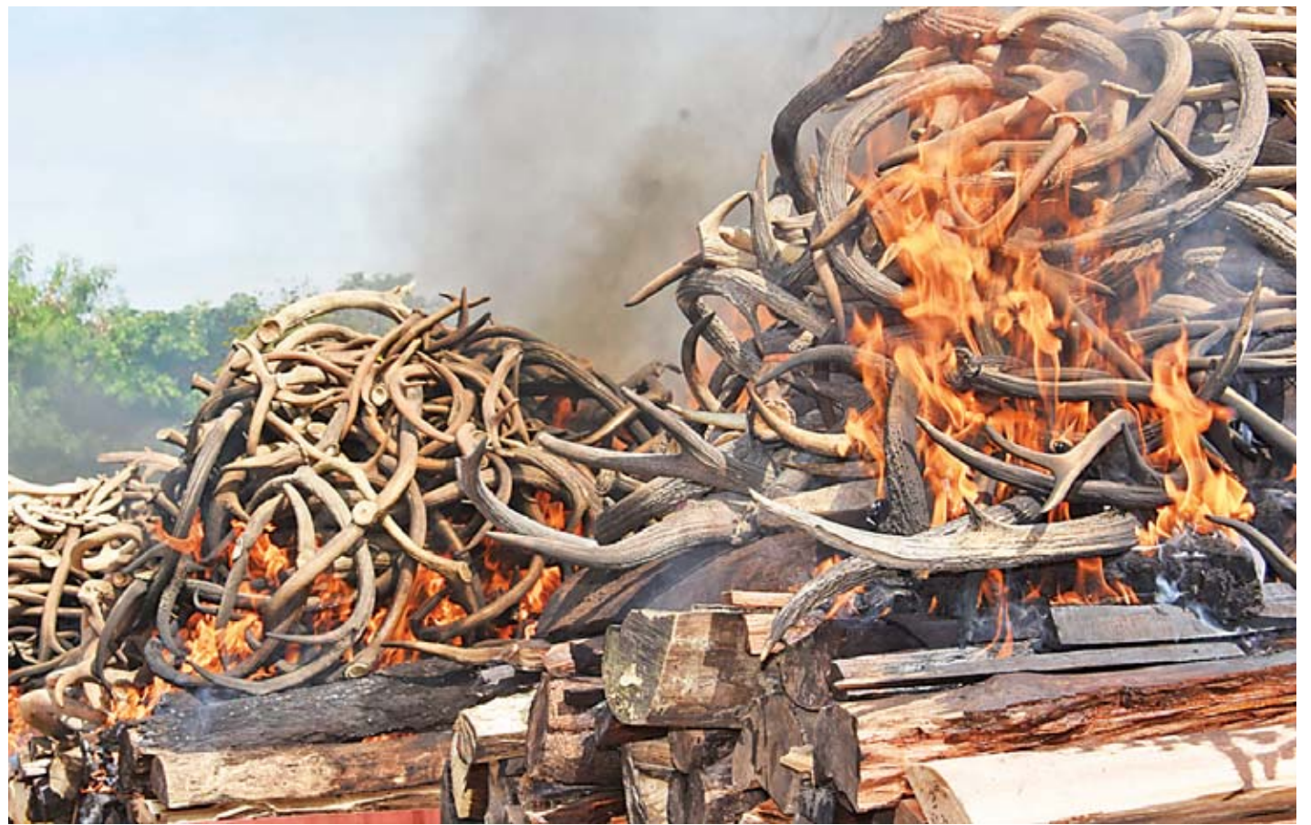
ဖမ်းဆီးရမိ ဆင်စွယ်၊ ဆင်အစိတ်အပိုင်းနှင့် တောရိုင်းတိရစ္ဆာန် အစိတ်အပိုင်းများကို မီးရှို့ဖျက်ဆီးစဉ်။

အရိုးမျိုးစုံ ၂၂၇ ချောင်း၊ တိရစ္ဆာန်သားရေမျိုးစုံ ၄၅ ချပ်၊ တိရစ္ဆာန်ဦးချိုမျိုးစုံ ၁၅၄၄ ချောင်း၊ သင်းခွေချပ်အကြေးခွံ ၄၅ ဒသမ ၅ ကီလိုဂရမ်နှင့် အခြားတောရိုင်းတိရစ္ဆာန် အစိတ်အပိုင်းမျိုးစုံ ၁၂၈ ခုတို့ကို ယနေ့နံနက်ပိုင်းတွင် မီးရှို့ဖျက်ဆီးခဲ့သည်။ ဖမ်းဆီးရမိ ဆင်စွယ်၊ ဆင်အစိတ်အပိုင်းနှင့် တောရိုင်းတိရစ္ဆာန် အစိတ်အပိုင်းများ အား မီးရှို့ဖျက်ဆီးခြင်းအခမ်းအနားကို စာမျက်နှာ ၄ ကော်လံ ၁ သို့ ၁၆