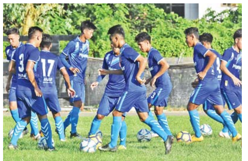
မြန်မာ ယူ-၂၁ အသင်း လေ့ကျင့်မှု ပြုလုပ်နေစဉ်။