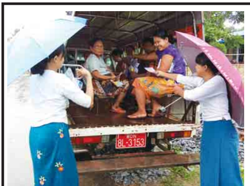
ကိုစိုင်း(လွိုင်ကော်)

အပြည်ပြည်ဆိုင်ရာ မူးယစ်ဆေးဝါးအလွဲသုံးမှုနှင့် တရားမဝင် ရောင်းဝယ်မှုတိုက်ဖျက်ရေးနေ့ အထိမ်းအမှတ်အဖြစ် ကျောင်းသား ကျောင်းသူများအား မူးယစ်ဆေးဝါးအန္တရာယ်ကို သိရှိရန်နှင့် မူးယစ်ဆေးဝါးနှင့်ပတ်သက်သည့် ဆိုးကျိုးများ မဖြစ်ပေါ်စေရန်အတွက် ပြန်ကြားရေးနှင့် ပြည်သူ့ဆက်ဆံရေး ဦးစီးဌာနမှ မူးယစ်ဆေးဝါးအန္တရာယ်ကို ကျယ်ပြန့်စွာသိရှိနိုင်ရေး အသိပညာပေးခြင်းကို ဇွန် ၂၅ ရက်က ချောင်းဆုံအထက်၌ ပြုလုပ်ခဲ့ပြီး မြို့နယ်ပြန်ကြားရေးနှင့် ပြည်သူ့ဆက်ဆံရေးဦးစီးဌာနမှ တာဝန်ရှိသူများက ကျောင်းသား ကျောင်းသူများအား လက်ကမ်းစာစောင်များ ပြန့်ဝေပေးစဉ်၊ မြို့နယ်(ပြန်/ဆက်)