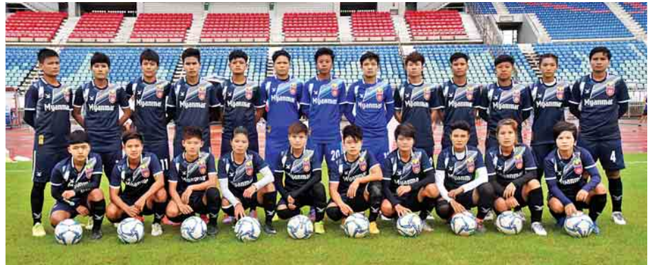
၂၀၁၈ အာဆီယံအမျိုးသမီးပြိုင်ပွဲယှဉ်ပြိုင်မည့် မြန်မာ့လက်ရွေးစင်အမျိုးသမီးအသင်းကို တွေ့ရစဉ်။