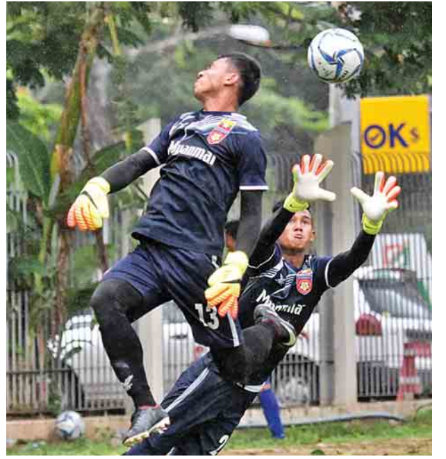
မြန်မာ ယူ-၁၉ အသင်း လေ့ကျင့်မှုပြုလုပ်နေစဉ်။

၂၀၁၈ အာဆီယံ ယူ-၁၉ ပြိုင်ပွဲ အတွက် လေ့ကျင့်ပြင်ဆင်မှုများ ပြုလုပ်နေသည့် မြန်မာ ယူ-၁၉ အသင်းသည် ပြိုင်ပွဲအကြို ငါးပွဲ မြောက် ပြည်တွင်းခြေစမ်းပွဲအဖြစ် MNL ကလပ် ရော့တီအသင်းနှင့် ဇွန် ၂၆ ရက် ညနေ ၅ နာရီတွင် သုဝဏ္ဏတွင်း၌ ယှဉ်ပြိုင်ကစား မည်ဖြစ်သည်။ မြန်မာ ယူ-၁၉ အသင်းသည် အပြီးသတ်ကစား သမားများ ရွေးချယ်ရန် ယခုခြေစမ်းပွဲ ယှဉ်ပြိုင်ကစားခြင်းဖြစ်ပြီး ရော့တီ အသင်းနှင့် ခြေစမ်းပွဲပြီးပါက အပြီး သတ်ကစားသမား ၂၃ ဦး ထုတ်ပြန် ကြေညာမည်ဖြစ်သည်။