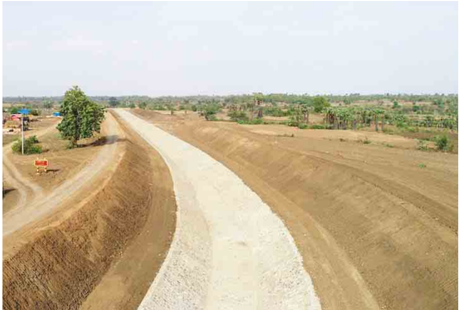
ရေဆိုးထုတ်ရန် လိုအပ်နေသေးသော အခြားနေရာ ၁၀ ခု ၁၀ခု အား တိုးချဲ့ဖောက်လုပ်ပေးသွားမည်ဖြစ်ကြောင်း တွင်လည်း ခြောက်ပေခွဲအကျယ် ရေဆိုးထုတ်အပေါက် သိရသည်။ ဝင်းဦး(ဓမ္မဇာတိ)

မြောက်ယမားဆည် မြောင်းမကြီး တစ်လျှောက်တွင် ရေဆိုးထုတ်အဆောက်အအုံများအဖြစ် လက်ရှိ သုံးပေပတ်လည် ရေဆိုးထုတ်ပေါက် ၁၃ ခုကို ခြောက်ပေခွဲအကျယ် ရေဆိုးထုတ်အပေါက်များအဖြစ် ချဲ့ထွင်ခြင်း၊