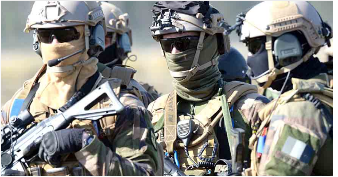
စစ်ရေးပဋိပက္ခ ကူးစက်ပျံ့နှံ့မှု မရှိလာစေရေးအတွက် ကြားဝင်ဆောင်ရွက်ခြင်း စသည့် လုပ်ငန်းများတွင် အဆိုပါတပ်ဖွဲ့က ပါဝင် လှုပ်ရှားသွားမည်ဖြစ်ကြောင်း ဝန်ကြီးပါလေက ပြောကြားသည်။

ဥရောပလုံခြုံရေးကို ခြိမ်းခြောက်လာဖွယ်ရှိသည့် စစ်ရေးပဋိပက္ခများနှင့် ပတ်သက်၍ အီးယူနိုင်ငံများအတွင်း ပူးတွဲအစီအစဉ်ဆွဲ၍ ဆောင်ရွက်ရန် ရည်ရွယ်ကြောင်း၊ သဘာဝ ဘေးအန္တရာယ် ကျရောက်ခြင်း၊ ဒေသခံများအား ဘေးကင်းလုံခြုံရာသို့ ရွှေ့ပြောင်းပေးခြင်း၊