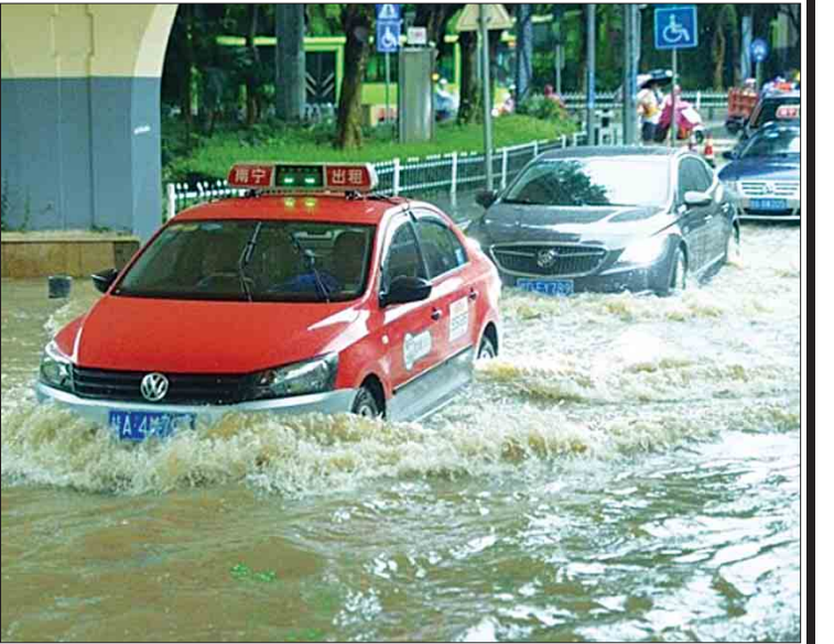
အင်ဂျီနီယာထိ မိုးသည်းထန်စွာ ရွာသွန်း ဌာနက ထုတ်ပြန်ကြေညာထားသည်။ နိုင်ငံပွယ်ရှိသည်ဟု ဒေသဆိုင်ရာ မိုးလေဝသ ဆင်ဟွာ

ကွမ်ရှီးကျွန်း ကိုယ်ပိုင်အုပ်ချုပ်ခွင့်ရ ဒေသတွင်လည်း လွန်ခဲ့သည့် ဗုဒ္ဓဟူးနေ့ ကတည်းက မိုးအဆက်မပြတ် သည်းထန်စွာ ရွာသွန်းခဲ့ကာ တနင်္လာနေ့ညနေပိုင်းတွင် လူပေါင်း ၁၂၄၀၀၀ ကျော် ဘေးဒုက္ခ ရောက်ခဲ့ပြီး လူပေါင်း ၂၀၀၀ ဘေးလွတ်ရာ သို့ ရွှေ့ပြောင်းပေးခဲ့ရသည်။ ကောက်ပဲသီးနှံ စိုက်ခင်း ဟက်တာ ၅၆၃၀ ခန့်နှင့် လူနေအိမ် ၁၀၀၀ ခန့် ပျက်စီးခဲ့ရသည်။