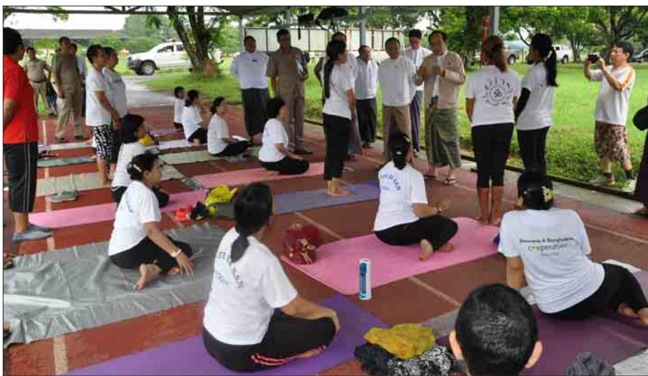
အောင် ကြိုးပမ်းဆောင်ရွက်ရမည် ဖြစ်ကြောင်း၊ အားကစားသမားများ အား ကျန်းမာရေးစစ်ဆေးပေးခြင်း လုပ်ငန်းများကိုလည်း ပြုလုပ်ပေး လျက်ရှိကြောင်း၊ ဝန်ကြီးဌာနအနေဖြင့် အားကစား အထောက်အကူပြုပစ္စည်း များအဖြစ် လည်းကောင်း၊ အရာရှိများ များအဖြစ် လည်းကောင်း ခန့်ထားချီးမြှင့် မည်ဖြစ်ကြောင်း ပြောကြားခဲ့ကြောင်း သိရသည်။ သတင်းစဉ်