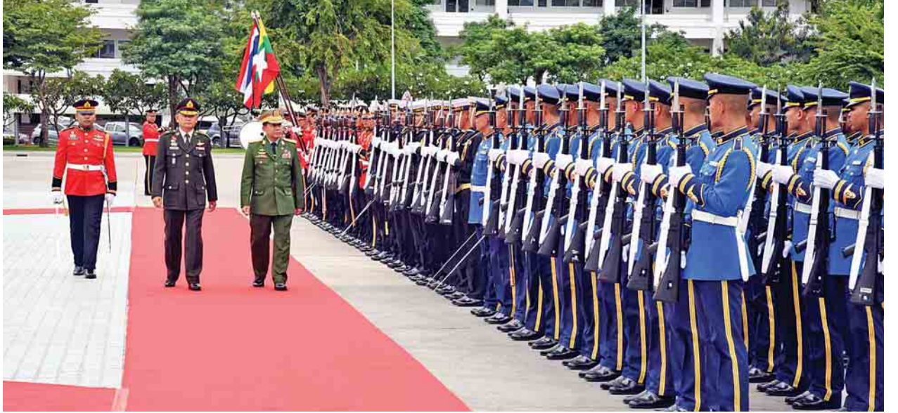
အား လှူဖွယ်ပစ္စည်းများနှင့် နဝကမ္မအလှူငွေများ ဆက်ကပ်လှူဒါန်းသည်။ ကျောင်းအတွင်းရှိ စေတီတော်မြတ်ကြီးအား လှည့်လည်ဖူးမြော်ကြည့်ညှိခဲ့ကြသည့်အခါ အားလုံးတို့က အလေးပြုခြင်းကိုခံယူပြီး ဂုဏ်ပြုတပ်ဖွဲ့အား စစ်ဆေးသည်။ (ယာဝု)

ထိုင်းနိုင်ငံ၌ ချစ်ကြည်ရေးခရီးရောက်ရှိနေသည့် တပ်မတော်ကာကွယ်ရေးဦးစီးချုပ် ဗိုလ်ချုပ်မှူးကြီးမင်းအောင်လှိုင်အား ယနေ့ နံနက်ပိုင်းတွင် ထိုင်းဘုရင့်တပ်မတော်ကာကွယ်ရေးဦးစီးချုပ် Gen. Tarnchaiyan Srisuwan က ထိုင်းဘုရင့်တပ်မတော်ကာကွယ်ရေးဦးစီးချုပ်ရုံးရှေ့တွင် ဂုဏ်ပြုတပ်ဖွဲ့ဖြင့် ကြိုဆိုသည်။ ရှေးဦးစွာ တပ်မတော်ကာကွယ်ရေးဦးစီးချုပ်နှင့် ထိုင်းဘုရင့်တပ်မတော်ကာကွယ်ရေးဦးစီးချုပ်တို့သည် ဂုဏ်ပြုတပ်ဖွဲ့၏အလေးပြုခြင်းကိုခံယူပြီး ဂုဏ်ပြုတပ်ဖွဲ့အား စစ်ဆေးသည်။ (ယာဝု)