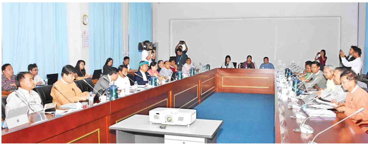
UPDJC အတွင်းရေးမှူးအဖွဲ့ အစည်းအဝေးကျင်းပစဉ်။