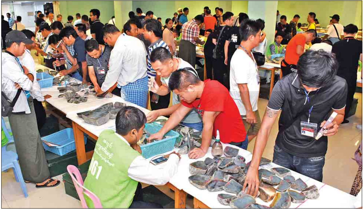
မြန်မာ့ကျောက်မျက်ရတနာပြပွဲတွင် ပြည်တွင်းပြည်ပ ရတနာကုန်သည်များ ကျောက်မျက်အတွဲများကို လေ့လာကြည့်ရှုနေကြစဉ်။