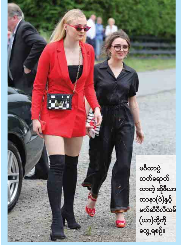
မင်္ဂလာပွဲတက်ရောက်လာတဲ့ ဆိုဖီယာတာနာ(ဝဲ)နှင့် မက်စီဗီလီယမ်(ယာ)တို့ကို တွေ့ရစဉ်။

ဇွန် ၂၅ ရက်မှာ ဖော်ပြခဲ့တဲ့သတင်းအရ “Game of Thrones” စုံတွဲဟာ ဇွန် ၂၃ ရက်က စတင်တက်လာမှာ မင်္ဂလာပွဲကျင်းပခဲ့တာဖြစ်တယ်လို့ သိရပါတယ်။ အဆိုပါအခမ်းအနားမှာ ကင်ထရီယာရင်တန်ဟာ အနက်ရောင်ကုတ်နဲ့ အညိုရောင်အစင်းတွေပါတဲ့ စတိုင်ဘောင်းဘီရှည်ကို တွဲဖက်ဝတ်ဆင်ခဲ့ပြီး သတို့သမီးကတော့ သတို့သမီးဝတ်စုံဝန်ရည်ကြီးနဲ့ ပန်းသရဖူကို တွဲဖက်ဝတ်ဆင်ခဲ့တာကိုလည်း တွေ့ရပါတယ်။ ဒီမင်္ဂလာပွဲကို “Game of Thrones” မှာ အတူတွဲဖက်ပါဝင်ခဲ့ကြတဲ့ သရုပ်ဆောင်တွေများစွာ တက်ရောက်ခဲ့ကြပါတယ်။ ဒီထဲမှာ အဓိကဇာတ်ဆောင်မင်းသမီးတွေဖြစ်ကြတဲ့ မက်စီဗီလီယမ်၊ ဆိုဖီယာတာနာတို့လည်း အတူတက်ရောက်လာတာကို တွေ့ရပါတယ်။ ဒါ့အပြင် အိမ်လောကလှူဒါန်းကို ပီတာဒင်ဒဲလက်ဂျီတို့လည်း တက်ရောက်ခဲ့တယ်လို့ သိရပါတယ်။ မင်္ဂလာအခမ်းအနားပြီးနောက် ဘုရားကျောင်းထဲက ထွက်လာတဲ့ မင်္ဂလာမောင်နှံကို မိတ်ဆွေသူငယ်ချင်းတွေက အပြင်မှာ တန်းစီစောင့်ဆိုင်းနေကြပြီး ရောင်စုံစက္ကူလေးတွေကို အပေါ်မှ ကြဲပတ်ပေးခဲ့တာကိုလည်း တွေ့ရပါတယ်။ ကင်ထရီယာရင်တန်နဲ့ ရိုဗ်လက်စလီတို့ဟာ ပြီးခဲ့တဲ့ ၂၀၁၂ ခုနှစ်အတွင်း စတင်တွေ့ဆုံခဲ့ကြသူတွေပါ။ ပြီးခဲ့တဲ့ နှစ်အတွင်းမှာတော့ စေ့စပ်လိုက်ပြီဖြစ်ကြောင်း တရားဝင်ထုတ်ဖော်ပြောကြားခဲ့တာ ဖြစ်ပါတယ်။ ယခင်က ကင်ထရီယာရင်တန်က သူ့ရဲ့ “Game of Thrones” နဲ့ ပတ်သက်ပြီး အကောင်းဆုံးအမှတ်တရမှာ အိုက်စလန်က ရိုက်ကွင်းတစ်ခုမှာ ရိုဗ်လက်စလီနဲ့ တွေ့ဆုံခဲ့ရခြင်းဖြစ်တယ်လို့ ပြောကြားခဲ့ဖူးပါတယ်။