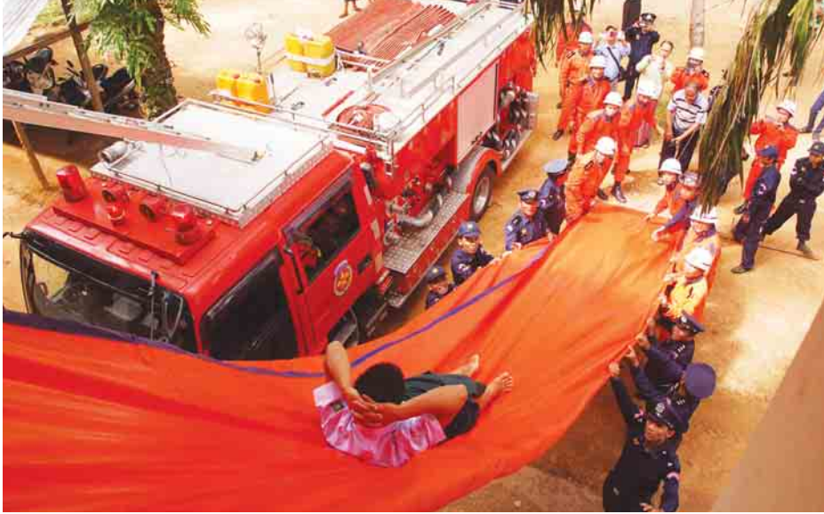
ကျေးဇူး ၂၅

တနင်္သာရီတိုင်းဒေသကြီး ကျေးဇူးခရိုင်အတွင်း သဘာဝဘေးအန္တရာယ်များ ဖြစ်ပွားလာပါက ရှာဖွေ ကယ်ဆယ်ရေးလုပ်ငန်းများကို ထိရောက်လျင်မြန်စွာ ဆောင်ရွက်နိုင်ရေးအတွက် ဇွန် ၂၅ ရက် နံနက် ၈ နာရီက ကျေးဇူးမြို့ အမှတ်(၂)အခြေခံပညာအထက်တန်း ကျောင်းတွင် သဘာဝဘေးအန္တရာယ် မြေပြင်ရှာဖွေ ကယ်ဆယ်ရေး သရုပ်ပြလေ့ကျင့်မှုများကို ဆောင်ရွက်ခဲ့ ကြကြောင်း သိရသည်။