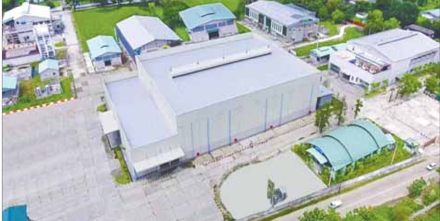
ဆေးဝါးစက်ရုံ (အင်းစိန်) (တိုးချဲ့စက်ရုံ)

မြေဆီပ်ဖြေဆေးထုတ်လုပ်ရေးလှိုင်း ( Snake Anti-Venom Production Plant) သစ်ကို ၂၀၁၆ ခုနှစ် မေလ ၂၀ ရက်နေ့တွင် ဖွင့်လှစ်ခဲ့ပြီး ယခင်ကရှိနှင့်ပြီး နည်းပညာသာမက ဩစတြေးလျနိုင်ငံနှင့် ဘရာဇီးနိုင်ငံတို့မှ နည်းပညာသစ်များပါ ဖြည့်ဆည်းနိုင်ခဲ့သဖြင့် အရည်အသွေးကောင်းမွန်သည့် မြေဆီပ်ဖြေဆေးများကို ပြည်တွင်းလိုအပ်ချက်ဖူလုံအောင် ဖြည့်တင်းပေးနိုင်ရုံသာမက အာဆီယံဒေသတွင်းနိုင်ငံများဖြစ်သည့် ကမ္ဘောဒီးယားနှင့် လာအိုနိုင်ငံတို့သို့ တင်ပို့ခဲ့သည်။ ။