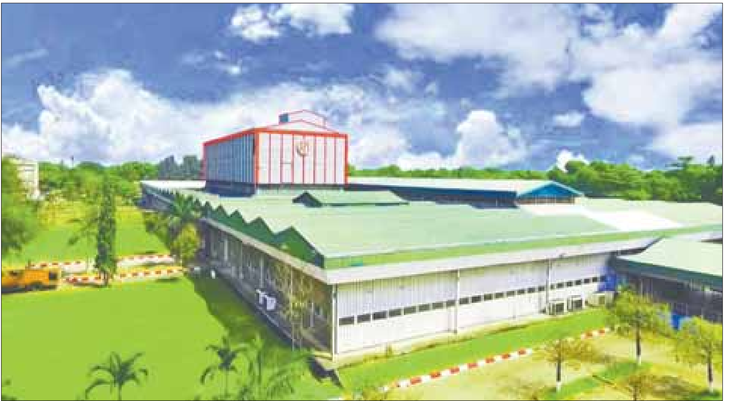
ဆေးဝါးစက်ရုံ (အင်းစိန်) (မူလစက်ရုံ)

အထက်ပါစာချုပ်အရ ၁၉၅၄ ခုနှစ် ဧပြီလ ၂၃ ရက်နေ့တွင် ထိုစဉ်က နိုင်ငံတော်ဝန်ကြီးချုပ်က ပန္နက်ရိုက်အုတ်မြစ်ချ၍ စက်ရုံစတင်တည်ဆောက်ခဲ့သည်။ ၁၉၅၇ ခုနှစ် နှစ်ကုန်ပိုင်းတွင် စက်ရုံ၏ အဆောက်အအုံများ ဆောက်လုပ်ခြင်းနှင့် စက်ပစ္စည်းများတပ်ဆင်ခြင်းတို့ ရှာနှုန်းပြည့်နီးပါးပြီးစီးခဲ့ပြီး ဆေးဝါးအမည်ပေါင်း ၄၇ မျိုးကိုထုတ်လုပ်ခဲ့သည်။ ၁၉၅၈ ခုနှစ် ဧပြီလ ၂၃ ရက်နေ့တွင် ထိုစဉ်က နိုင်ငံတော်သမ္မတ ဦးဝင်းမောင်က BPI (Burma Pharmaceutical Industries) အမည်ဖြင့် စက်ရုံအား ဖွင့်လှစ်ပေးခဲ့သည်။