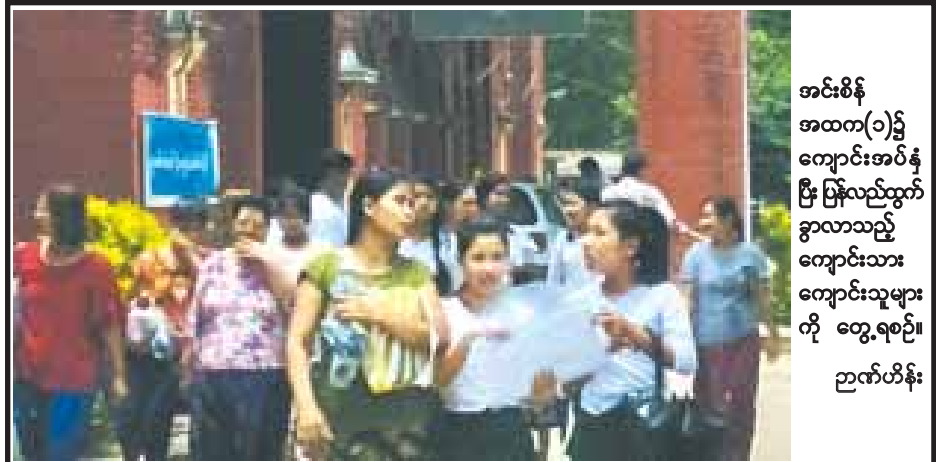
အင်းစိန် အထက(၁)၌ ကျောင်းအပ်နံ ငြီး ပြန်လည်ထွက် ခွာလာသည့် ကျောင်းသား ကျောင်းသူများ ကို တွေ့ရစဉ်။ ညွှန်ကြားရေးမှူးချုပ်