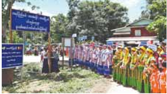
မူးယစ်ကင်းစင်နယ်မြေ ဆိုင်းဘုတ်စိုက်ထူ ဘားအံ၌ ရုတ်ချ