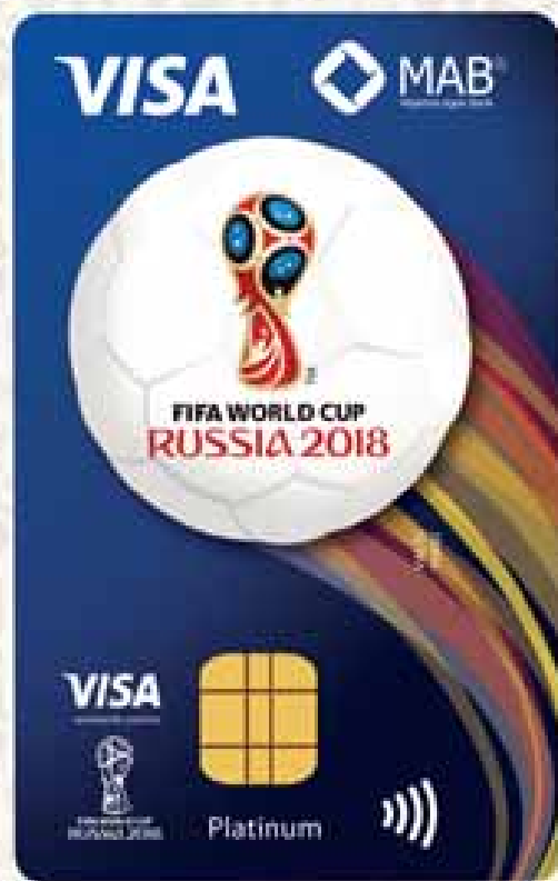
VISA PLATINUM CREDIT CARD