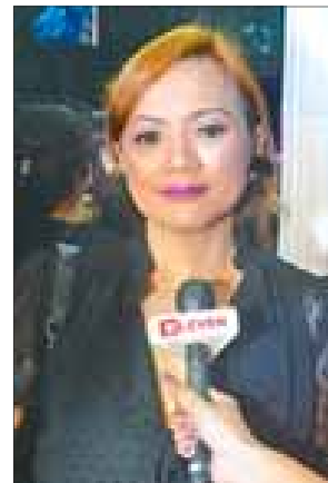
အကယ်ဒမီ မြတ်ကေသီအောင်