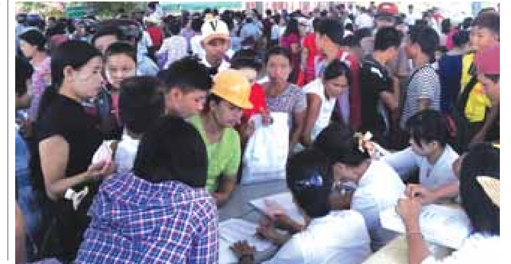
သန့်မောင်