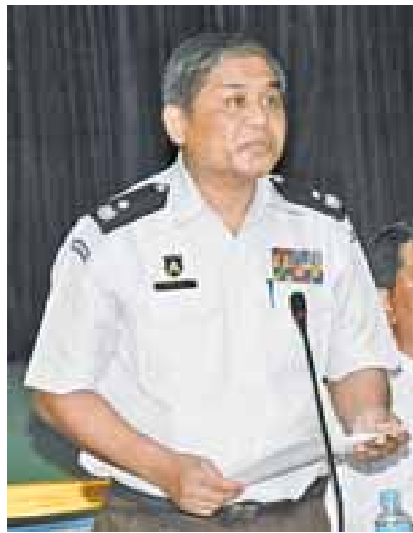
ဓမ္မတာအမြဲတမ်းအတွင်းဝန် ဦးအေးလွင်

နိုင်ငံခြားအကူအညီ အထောက်အပံ့စီမံကိန်းများ အနေဖြင့် ဂျာမနီနိုင်ငံ Hanns Seidel Foundation ၏ နည်းပညာအကူအညီဖြင့် တာဝန်သိခရီးသွားလုပ်ငန်းမူဝါဒ၊ နိုင်ငံခြားသားများ ဆောင်ရွက်၊ ရှောင်ရန်နှင့် ခရီးသွား လုပ်ငန်းတွင် လူမှုအဖွဲ့အစည်း ပါဝင်လာစေရေး မူဝါဒများ ရေးဆွဲခြင်း တစ်နှစ်စီမံကိန်း၊ နော်ဝေနိုင်ငံနှင့် အာရှဖွံ့ဖြိုး ရေးဘဏ်တို့၏ နည်းပညာအကူအညီဖြင့် ခရီးသွားလုပ်ငန်း