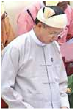
ပြည်ထောင်စုဝန်ကြီး ဦးအုန်းမောင်