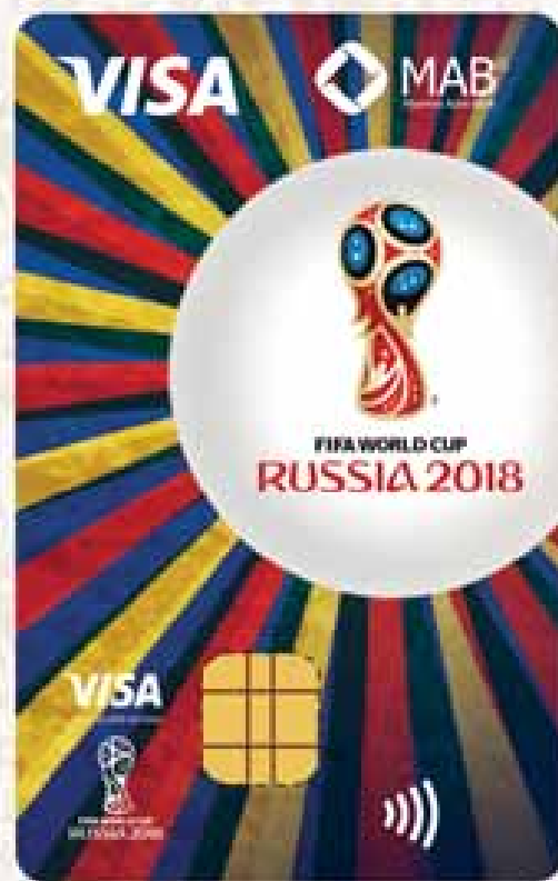
VISA CLASSIC CREDIT CARD