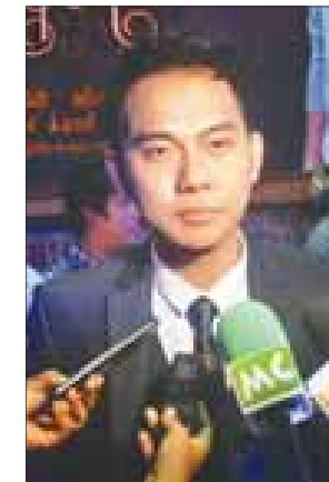
လွှမ်းပိုင်

ငါ့ကိုနမ်းတဲ့ မုန်တိုင်း ဇာတ်ကား တွင် သရုပ်ဆောင်ခဲ့သည့် ရဲရင့်အောင် က “စိတ်တွေလှုပ်ရှားပြီး စိတ်နဲ့ လူနဲ့ တောင်မကပ်ဘူး၊ ဒီကားမှာ ကျွန်တော် ပုံစံက ဆိုးတယ်၊ ပိုက်ဆံရှိတယ်၊ လုပ်ချင်တာလုပ်တယ်၊ တရုတ်ထိုး ဆန်တယ်ပေါ့။ ကျွန်တော်ကိုယ် ကျွန်တော် ကျေနပ်တယ်၊ နောက် လုပ်မယ့်အရာတွေအတွက် အားရ တယ်၊ ဒီထက်ပိုပြီး ကျွန်တော်လုပ်ချင် သေးတယ်။ ကျွန်တော်ကြိုးစားထား တာလေး ရင်ထဲရောက်သွားစေချင် ပါတယ်” ဟု ပြောသည်။