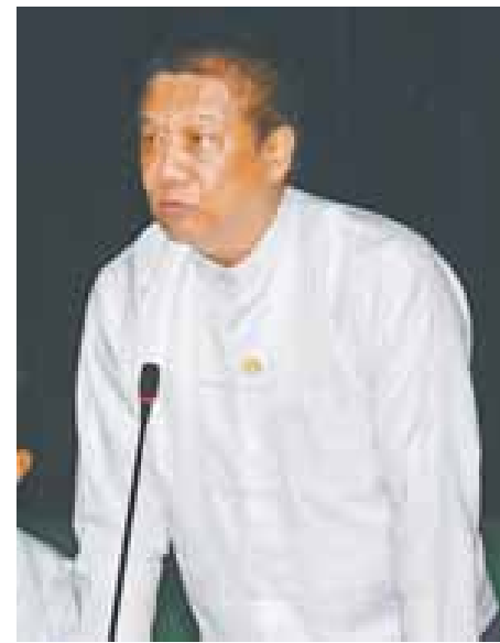
ညွှန်ကြားရေးမှူးချုပ် ဦးတင်သွင်

ခရီးသွားလုပ်ငန်းဥပဒေ ထုတ်ပြန်ပြဋ္ဌာန်းရန်၊ ဦးစား ပေး ခရီးစဉ်ဒေသများ ဖော်ထုတ်ရန်၊ မြန်မာနိုင်ငံကို ထင်ရှားသော ခရီးစဉ်ဒေသဖြစ်လာစေရန်၊ ခရီးသွားဆိုင်ရာ တရားမဝင်လုပ်ငန်းများ ထိန်းကျောင်းရန်နှင့် ယှဉ်ပြိုင်နိုင် သော ဈေးကွက်ခရီးသွားဒေသဖြစ်စေရန်တို့ကို ဆက်လက် ဆောင်ရွက်မည့် လုပ်ငန်းစဉ်များအဖြစ် သတ်မှတ်ထားပါ