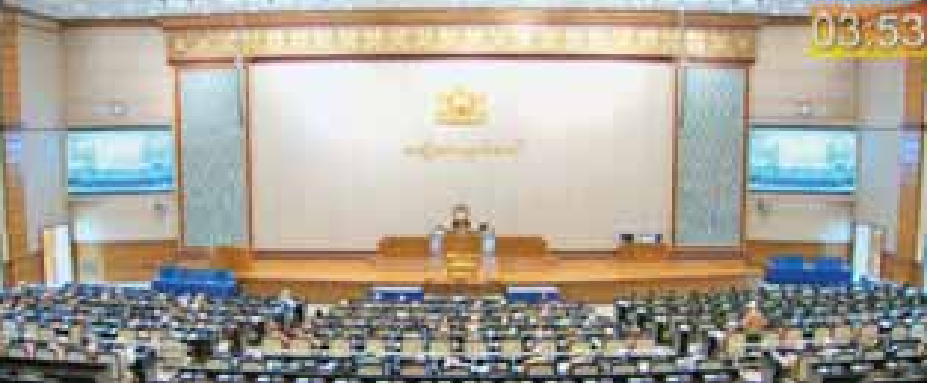
ဒုတိယအကြိမ် အမျိုးသားလွှတ်တော် အငြင်းပွားမှုအစည်းအဝေး သတ္တမနေ့ ကျင်းပစဉ်။

သို့သော်လည်း လွှတ်တော်ကိုယ်စားလှယ်တော်ကြီး တင်ပြချက်နှင့် ဒေသခံပြည်သူများ၏ ဆန္ဒပြည့်ဝစေရေး အတွက် ၂၀၁၈-၂၀၁၉ ပညာသင်နှစ်တွင် အဆိုပါကျောင်း နှစ်ကျောင်းအား ကျောင်းအဆင့်တိုးရေး တင်ပြဆောင်ရွက် ခဲ့ပါကြောင်း၊ အစိုးရအဖွဲ့အစည်းအဝေးမှ ခွင့်ပြုပြီးဖြစ်ပါ သဖြင့် ယခုနှစ်ကျောင်းဖွင့်အမိ ကျောင်းအဆင့် တိုးမြှင့် ခြင်းလုပ်ငန်းများ ဆောင်ရွက်ပေးမည်ဖြစ်ပါကြောင်း ဖြေကြားသည်။