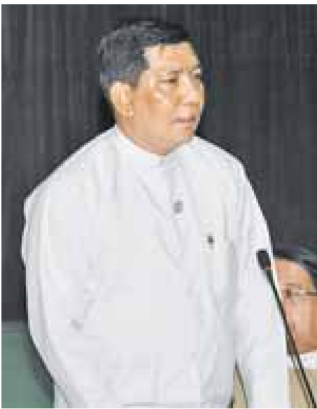
အမြဲတမ်းအတွင်းဝန် ဦးမျိုးအောင်

ဆက်လက်၍ ဟိုတယ်နှင့် ခရီးသွားလာရေးဝန်ကြီး ဌာန ညွှန်ကြားရေးမှူးချုပ် ဦးတင်သွင်က မြန်မာခရီးသွား လုပ်ငန်း၏ မျှော်မှန်းချက်များသည် ပိုမိုကောင်းမွန်သော နေထိုင်ရန်နေရာဖြစ်စေရန်၊ အလုပ်အကိုင်များပိုမိုရရှိရန်၊ စီးပွားရေးအခွင့်အလမ်းများ ပိုပံ့ပိုးပေးရန်၊ သဘာဝနှင့်