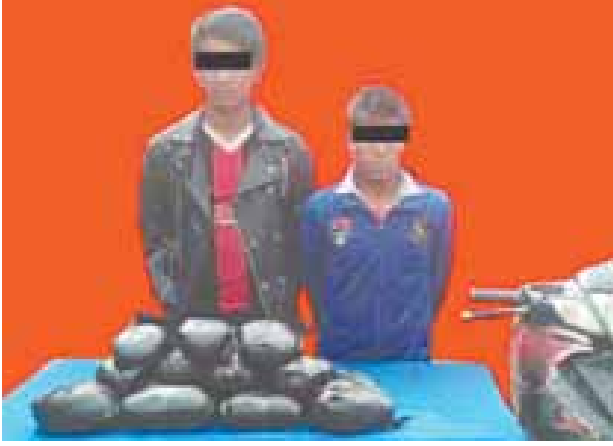
ဘိန်းဖော်နှင့် မောင်ကြားတို့အား သိမ်းဆည်းရမိသည့် ဘိန်းစိမ်းများနှင့် အတူ တွေ့ရစဉ်။

နေပြည်တော် မေ ၂၅ ဗန်းမော်ခရိုင်ရဲတပ်ဖွဲ့မှ တပ်ဖွဲ့ဝင်များပါဝင်သော ပူးပေါင်းအဖွဲ့သည် မေ ၂၄ ရက် မွန်းလွဲ ၁ နာရီက ဗန်းမော်မြို့နယ် ကုန်းမဟတ်ကျေးရွာနှင့် ညောင်ပင်သာကျေးရွာသွားလမ်းမရှိ ကုန်းမဟတ်တံတားအနီး၌ မကိုင်(ခ) မအေးပွင့် မောင်းနှင်လာသည့် ဆိုင်ကယ်အား ရပ်တန့်ရှာဖွေရာ စိတ်ကြွ ရူးသွပ်ဆေးပြား ၄၀၀၀ ကိုလည်းကောင်း၊ အလားတူ မေ ၂၃ ရက် ညနေ ၅ နာရီခွဲတွင် ဘားအံခရိုင်ရဲတပ်ဖွဲ့မှ တပ်ဖွဲ့ဝင်များပါဝင်သော ပူးပေါင်းအဖွဲ့သည် ဘားအံမြို့နယ် လှိုင်နားကျေးရွာနေ ခင်ဆက်ငွေ(ခ)အကိုး၏ နေအိမ်အား ဝင်ရောက်ရှာဖွေရာ စိတ်ကြွရူးသွပ်ဆေးပြား ၂၀၊ တူးမီးသေနတ်တစ်လက်နှင့် လက်ကိုင်ဖုန်းတစ်လုံးတို့ကို လည်းကောင်း၊ မေ ၂၄ ရက် မွန်းလွဲ ၂ နာရီခွဲက မြို့သစ်နယ်မြေရဲစခန်းမှ တပ်ဖွဲ့ဝင်များပါဝင်သော ပူးပေါင်းအဖွဲ့သည် တမူး မြို့နယ် မြို့သစ်မြို့ အမှတ်(၂)ရပ်ကွက် တမူး-စေတီသွားကားလမ်း၌ Mr. ASO မောင်းနှင်ပြီး Mr. PHNIAGI လိုက်ပါလာသည့် ဆိုင်ကယ်အား ရပ်တန့်ရှာဖွေရာ စိတ်ကြွရူးသွပ်ဆေးပြား ၄၀၀၀ ကိုလည်းကောင်း၊ ကျိုင်းတုံ ခရိုင်ရဲတပ်ဖွဲ့မှ တပ်ဖွဲ့ဝင်များပါဝင်သော ပူးပေါင်းအဖွဲ့သည် ကျိုင်းတုံမြို့နယ် မိုင်းခွန်ကျေးရွာအုပ်စု ဝိန်းကျောက်ကျေးရွာနေ ရှေ့ကိုက်ရင်၏နေအိမ်အား ဝင်ရောက်ရှာဖွေရာ စိတ်ကြွရူးသွပ်ဆေးပြား ၂၀၇၃ ပြား၊ ငွေကျပ် ၉၅၀၀ နှင့် တူးမီးသေနတ်တစ်လက်တို့ကို လည်းကောင်း၊ အလားတူ ယင်းနေ့ ညနေ ၄ နာရီက မူဆယ်မြို့မရဲစခန်းမှ တပ်ဖွဲ့ဝင်များပါဝင်သော ပူးပေါင်းအဖွဲ့သည် မူဆယ်မြို့ ကောင်းမှုတုံရပ်ကွက် ငွေဆင်အိမ်ရာ Ve Ve ကုမ္ပဏီအနောက်လမ်းရှိ အောင်ကျော်ဝင်း၏ နေအိမ်အားဝင်ရောက်ရှာဖွေရာ စိတ်ကြွရူးသွပ်ဆေးပြား ၁၉၁၀ နှင့် ဘိန်းဖြူ သူညီ ဒသမ ၀၀၁၅ ကိုလည်းကောင်း၊