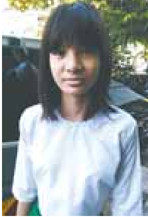
မဖူးပြည့်ကို