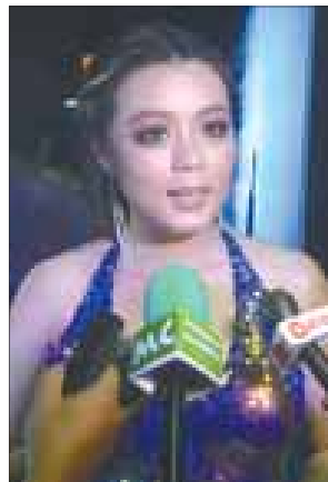
အကယ်ဒမီ ဖွေးဖွေး