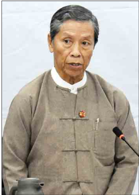
ပြည်ထောင်စုဝန်ကြီး ဦးကျော်ဝင်း

ဆက်လက်၍ ပုဂ္ဂလိကကဏ္ဍ ဖွံ့ဖြိုးတိုးတက်ရေးကော်မတီ ဒုတိယဥက္ကဋ္ဌ စီးပွားရေးနှင့် ကူးသန်းရောင်းဝယ်ရေးဝန်ကြီးဌာန ပြည်ထောင်စုဝန်ကြီး ဒေါက်တာသန်းမြင့်က စီးပွားရေးနှင့် ကူးသန်းရောင်းဝယ်ရေးဝန်ကြီးဌာန အနေဖြင့် ပို့ကုန်သွင်းကုန်လုပ်ငန်းများနှင့် ရင်းနှီးမြှုပ်နှံမှုကဏ္ဍများတွင် အကောင်အထည်ဖော်ဆောင်ရွက်နေမှု