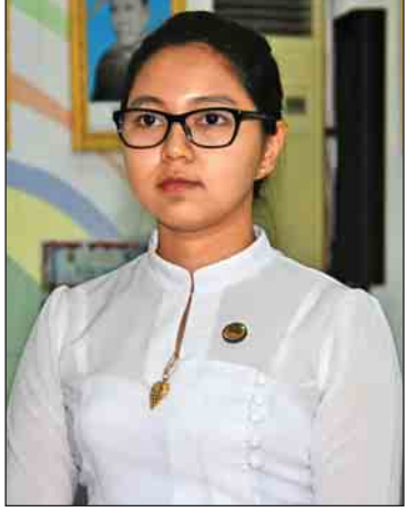
ဒေါ်ဇင်သူသူထွန်း (ဦးစီးအရာရှိ၊ ဆောက်လုပ်ရေးဝန်ကြီး ဌာန၊ မြို့ပြနှင့် အိမ်ရာဖွံ့ဖြိုးရေးဦးစီးဌာန)