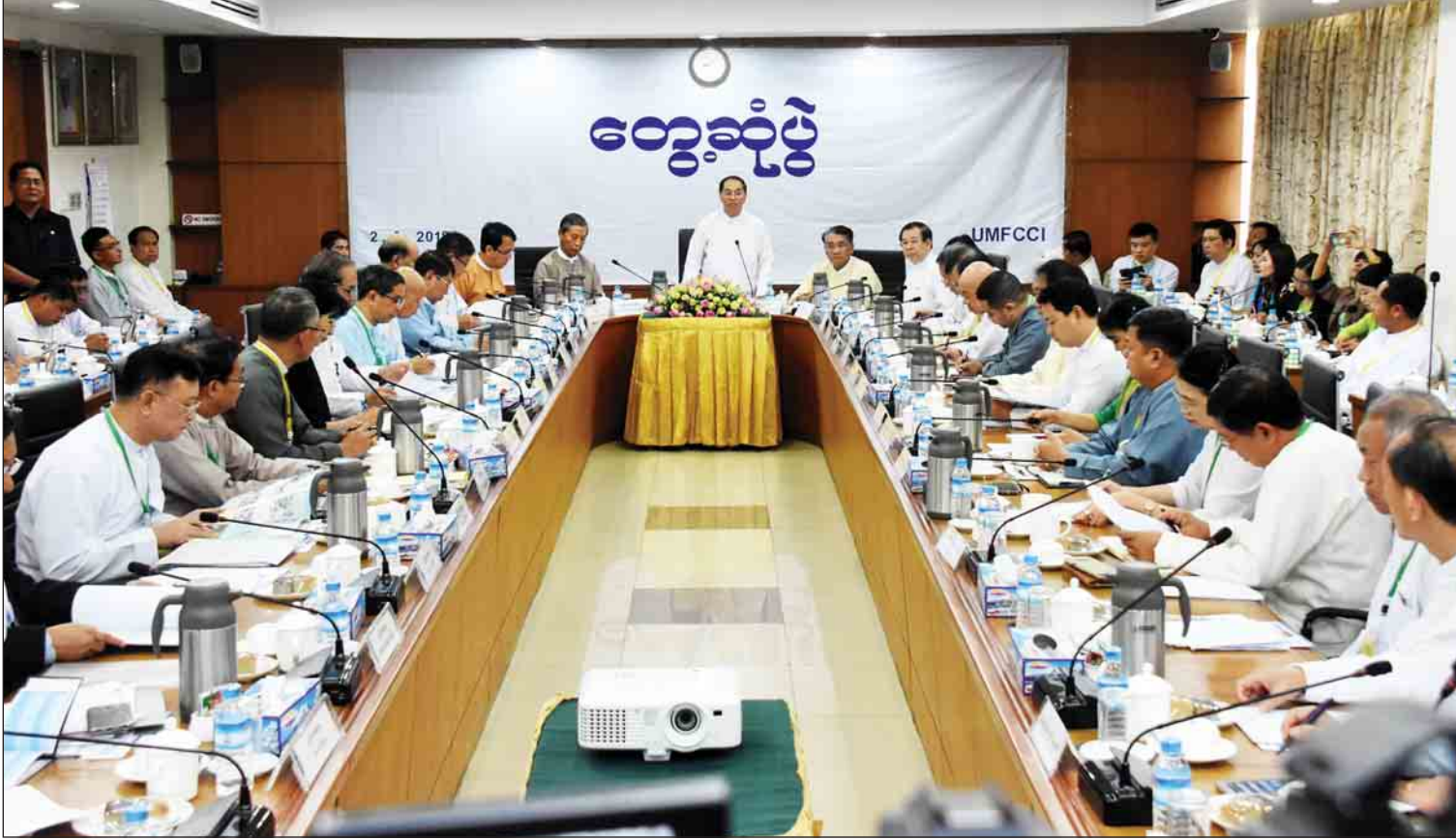
ဒုတိယသမ္မတ ဦးမြင့်ဆွေ မြန်မာ့စီးပွားရေးလုပ်ငန်းရှင်များနှင့် (၁၆) ကြိမ်မြောက် ပုံမှန်တွေ့ဆုံဆွေးနွေးပွဲတွင် အမှာစကားပြောကြားစဉ်။