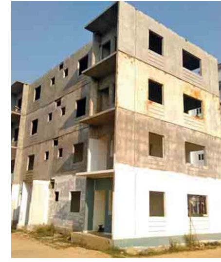
ဖြစ်ပြီး ကလေးများဆော့ကစားရန် ကစားကွင်းများနှင့် အပန်းဖြေဥယျာဉ်များ ထည့်သွင်းဆောက်လုပ်ထားကြောင်း သိရသည်။

စည်ပင်သာယာရေးကော်မတီ အင်ဂျင်နီယာဌာန (အဆောက်အအုံ)မှ အသိပေးကြေညာထားကြောင်းသိရသည်။ အဆိုပါ နေအိမ်တိုက်ခန်းများ၏ ရောင်းချရေးအနေဖြင့် စတုရန်းပေ ၆၁၄ ပေ အကျယ်အဝန်းရှိ အခန်းကို ငွေကျပ် ၂၈၅ သိန်းဖြင့်လည်းကောင်း၊ စတုရန်းပေ ၉၂၇ ပေ အကျယ်အဝန်းရှိ အခန်းကို ငွေကျပ် ၃၇၇ သိန်းဖြင့်လည်းကောင်း စီစဉ်ရောင်းချပေးထားပြီး အခန်းဝယ်ယူမည့်သူများသည် အခန်းတန်ဖိုး၏ ၃၀ ရာခိုင်နှုန်းကိုငွေပေးသွင်းကာ ကျန်ငွေကိုအရစ်ကျစနစ်ဖြင့် ပေးသွင်းနိုင်ရန်စီစဉ်သတ်မှတ်ထားကြောင်း၊ ဧရာဝတီဘက်နှင့် ချိတ်ဆက်၍ အခန်းတန်ဖိုးအတွက် ၁၀ နှစ်အရစ်ကျ ဝယ်ယူနိုင်ကြောင်းသိရသည်။ ပိုလ်ပထူးတန်ဖိုးမျှတအိမ်ရာစီမံကိန်း (ဒုတိယအဆင့်)မှ နေအိမ်တိုက်ခန်းများကို ဝယ်ယူနေထိုင်ကြသော ပြည်သူများအနေဖြင့် ခေတ်မီစွာ နေထိုင်နိုင်ကြတော့မည်