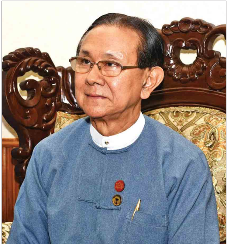
ဒေါက်တာဝင်းသိမ်း (ဥက္ကဋ္ဌ၊ ပြည်ထောင်စုရာထူးဝန်အဖွဲ့)

ဗဟိုဝန်ထမ်းတက္ကသိုလ်တွေရဲ့ အောက်မှာ Education and Competency Training Approach ကိုအခြေခံတဲ့ ပြည်သူ့ဝန်ထမ်းအကယ်ဒမီ(Civil Services Academy-CSA) တစ်ခုစီကို တည်ထောင်ပြီး ပြည်သူ့ဝန်ထမ်းစီမံခန့်ခွဲမှု ဘွဲ့လွန် ဒီပလိုမာသင်တန်းနဲ့ ပြည်သူ့ဝန်ထမ်းစီမံခန့်ခွဲမှု အဆင့်မြင့် ဒီပလိုမာသင်တန်းတွေ ဖွင့်လှစ်လျက်ရှိပါတယ်။ သင်တန်းအလိုက် အရည်အချင်း