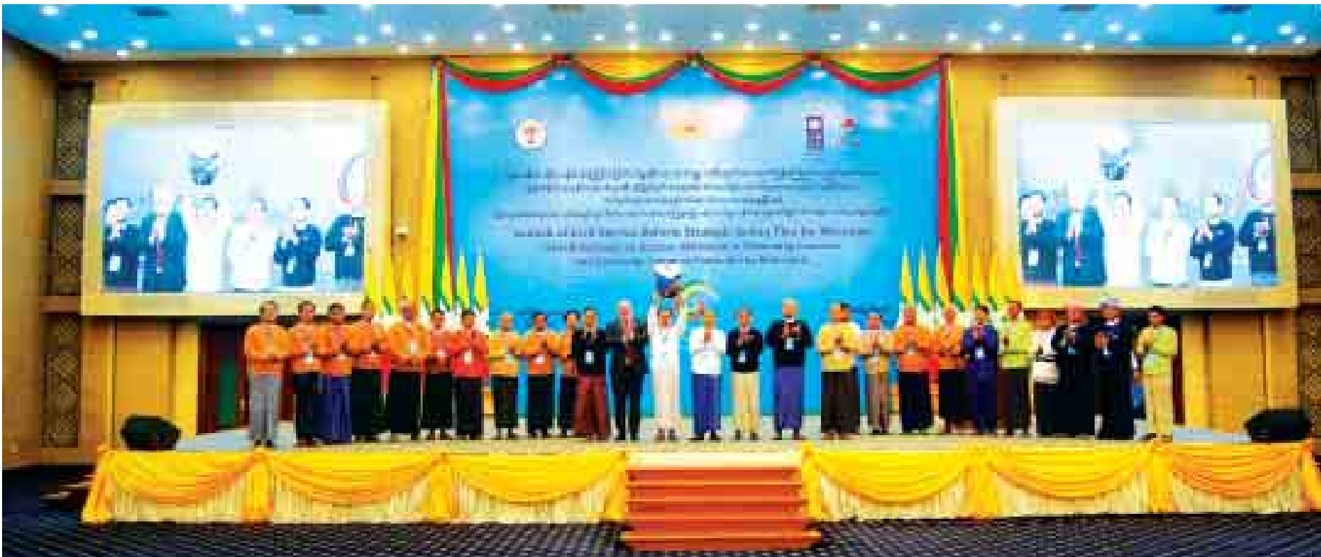
မြန်မာနိုင်ငံ နိုင်ငံ့ဝန်ထမ်းပြုပြင်ပြောင်းလဲမှုဆိုင်ရာ မဟာဗျူဟာစီမံချက်အား ထုတ်ပြန်ကြေညာသည့်အခမ်းအနားတွင် မှတ်တမ်းတင်ဓာတ်ပုံရိုက်စဉ်။