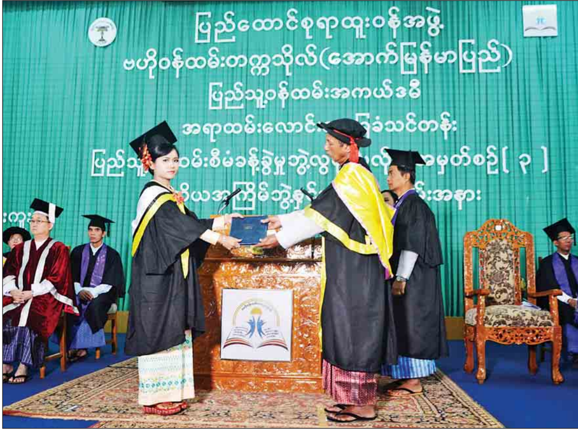
ဖေဖော်ဝါရီ ၂၃ ရက်က ဗဟိုဝန်ထမ်းတက္ကသိုလ်(အောက်မြန်မာပြည်) အရာထမ်းလောင်း အခြေခံသင်တန်း၊ ပြည်သူ့ဝန်ထမ်းစီမံခန့်ခွဲမှုဘွဲ့လွန်ဒီပလိုမာသင်တန်း အမှတ်စဉ်(၃) တတိယအကြိမ် ဘွဲ့နှင်းသဘင်အခမ်းအနား ကျင်းပစဉ်။

နိုင်ငံ့ဝန်ထမ်းဆိုင်ရာ လေ့ကျင့်ရေးနဲ့ သုတေသနလုပ်ငန်း၊ ပြည်သူ့ရေးရာ အုပ်ချုပ်ရေး၊ စီမံခန့်ခွဲရေးနဲ့ ပြည်သူ့ရေးရာမူဝါဒများစတဲ့ နယ်ပယ်တွေ အဆင့်မြှင့်တင် ဆောင်ရွက်နိုင်ဖို့ အမေရိကန်နိုင်ငံ Akamai University