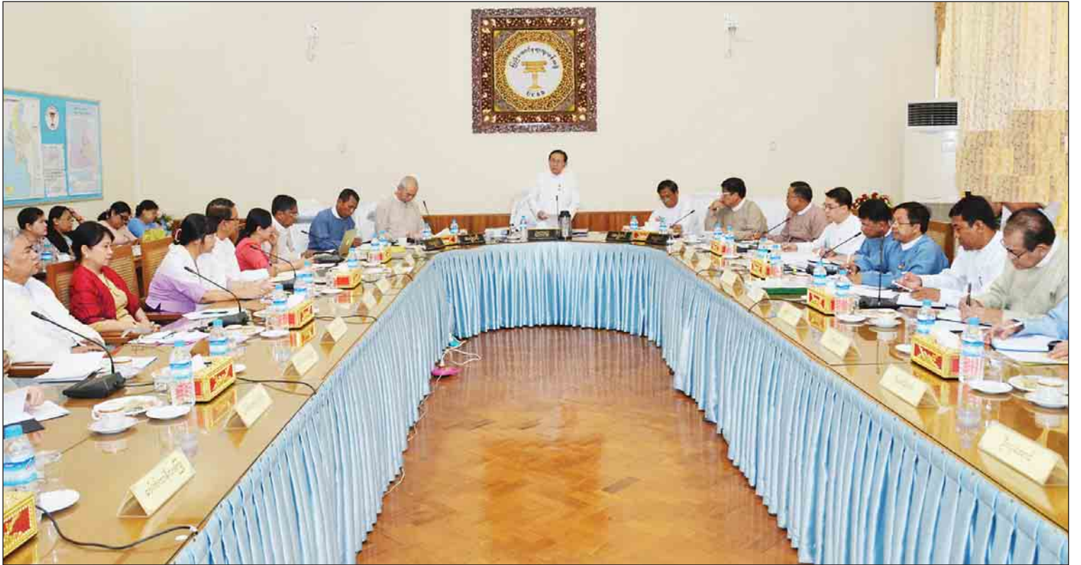
ဖေဖော်ဝါရီ ၆ ရက်က တက္ကသိုလ်အကြံပေးအဖွဲ့များ၊ တက္ကသိုလ်ပညာရပ်အဖွဲ့များ ပညာရပ်ဆိုင်ရာ လုပ်ငန်းညှိနှိုင်းအစည်းအဝေးတွင် ပြည်ထောင်စုရာထူးဝန်အဖွဲ့ ဥက္ကဋ္ဌ ဒေါက်တာဝင်းသိမ်း အမှာစကားပြောကြားစဉ်။

နိုင်ငံ့ဝန်ထမ်းဥပဒေ၊ နိုင်ငံ့ဝန်ထမ်းနည်းဥပဒေတွေနဲ့ ပတ်သက်ပြီး ဆောင်ရွက်ချက်တွေအနေနဲ့ ပြည်ထောင်စုရာထူးဝန်