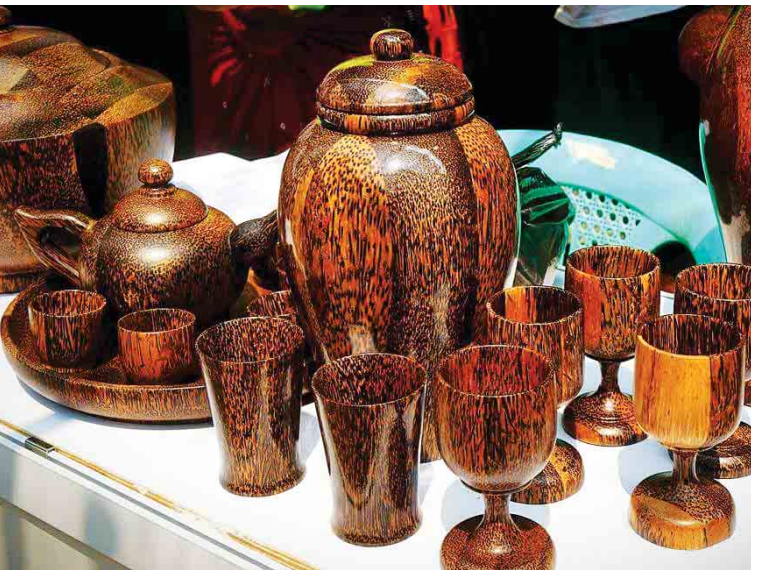
မေသူလွင်(မကွေး-ကိုယ်ပွား)

ဖြင့် ထုတ်လုပ်သော နဂါးဆက်တီ၊ ပန်းဆက်တီ၊ ကျောကျောဆက်တီ၊ ပုတ်လုံးဆက်တီ၊ ပုတ်လုံး ကုလားထိုင်၊ သပိတ်၊ ကလပ်၊ ရေခွေးအိုး၊ ပန်းအိုး အစရှိသည့် လူအသုံးအဆောင် ပစ္စည်းများအပြင် ကျွန်းနှင့်ထန်း ရောထား သည့် တံခါးရွက်များကိုလည်း စက်ရုံမှ ထုတ်လုပ်လျက်ရှိကြောင်း သိရသည်။ အဆိုပါ ထန်းပရိဘောဂနှင့် သစ်အချော ထည် စက်ရုံမှာ အသေးစားနှင့် အလတ်စား စီးပွားရေးလုပ်ငန်းများ ဖွံ့ဖြိုးတိုးတက်ရေး ကော်မတီ(MSMEs)မှ သတ်မှတ်သည့် အလတ်စားရင်းနှီးမြှုပ်နှံမှုအဆင့်ထက် ကျော် လွန်သော အဆင့်မြင့်ပြီး ဝန်ထမ်း ၁၃၅ ဦး ခန့်ဖြင့် လုပ်ငန်းဆောင်ရွက်လုပ်ကိုင်နေ သည့်အတွက် ဒေသခံများမှာလည်း အလုပ် အကိုင် အခွင့်အလမ်းများရရှိကြောင်း သိရ သည်။