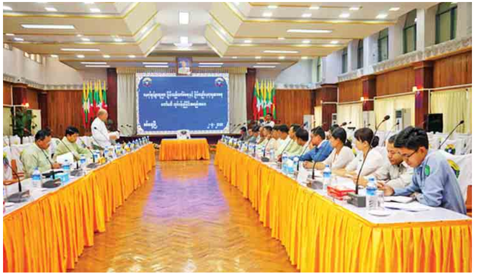
ဆက်လက်၍ အထောက်အကူပြုကော်မတီဝင်၊ အနေများကို ရှင်းလင်းတင်ပြကြရာ ဒုတိယဝန်ကြီးက ပြည်နယ်အဆင့်ဌာနဆိုင်ရာများက မိမိတို့ဌာနအလိုက် တင်ပြချက်များအပေါ် ပြန်လည်ဆွေးနွေးပြီး နိဂုံးချုပ်ဆောင်ရွက်ထားရှိမှုနှင့် ဆက်လက်ဆောင်ရွက်မည့် အခြေစကား ပြောကြားသည်။ တင်ထွန်း(ပြန်/ဆက်)

နှင့် ပြန်လည်နေရာချထားရေးကော်မတီအဖွဲ့ဝင် ပြည်နယ်လျှပ်စစ်၊ စက်မှုနှင့် လမ်းပန်းဆက်သွယ်ရေးဝန်ကြီးဦးအောင်ကျော်ဇံက ပြည်နယ်အစိုးရအဖွဲ့မှ မောင်တောဒေသ မြေရှင်းလင်းရေးနှင့် ပြန်လည်နေရာချထားရေးလုပ်ငန်းကော်မတီကိုဖွဲ့စည်းပြီး ဆောင်ရွက်နေမှုကိုလည်းကောင်း၊ ပြည်နယ်စိုက်ပျိုးရေး၊ မွေးမြူရေး၊ သစ်တောနှင့် သတ္တုတွင်းဝန်ကြီး ဦးကျော်လွင်က ပြန်လည်နေရာချထားရေး ဆောင်ရွက်မည့် အခြေအနေများကိုလည်းကောင်း ရှင်းလင်းဆွေးနွေးကြသည်။ ယင်းနောက် နေရပ်စွန့်ခွာသူများ ပြန်လည်လက်ခံရေးနှင့် ပြန်လည်နေရာချထားရေးကော်မတီ၊ တွဲဖက်အတွင်းရေးမှူး၊ ရခိုင်ပြည်နယ်အစိုးရအဖွဲ့ အတွင်းရေးမှူး ဦးတင်မောင်ဆွေက အထောက်အကူပြု ကော်မတီဝင်များအနေဖြင့် မိမိတို့ဌာနမှ လုပ်ဆောင်ရမည့်လုပ်ငန်းများကို သိရှိပြီး လုပ်ငန်းလိုအပ်ချက်များ၊ အခက်အခဲများကို တင်ပြနိုင်အောင် ဆောင်ရွက်ပေးကြစေလိုကြောင်း၊ သို့မှသာ မိမိတို့အနေဖြင့် သက်ဆိုင်ရာ အဆုံးအဖြတ်ပေးနိုင်မည့်ဌာနများသို့ ဆက်လက်တင်ပြပြီး ဆောင်ရွက်ရမည်ဖြစ်ကြောင်း ဆွေးနွေးပြောကြားသည်။