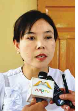
ဒေါ်မြသလင်နွယ်