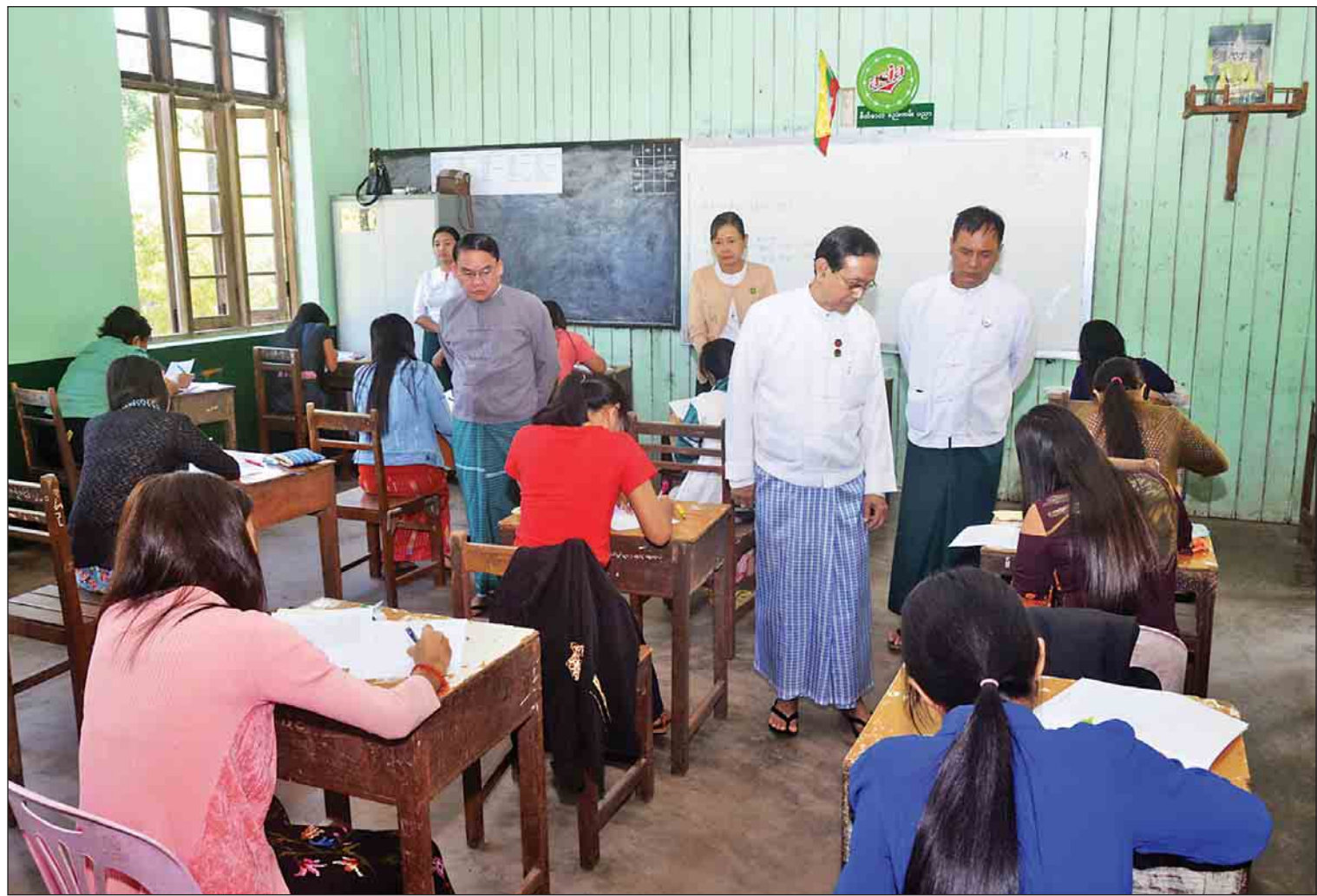
ဇန်နဝါရီ ၂၀ ရက်က နိုင်ငံ့ဝန်ထမ်း ပြန်တမ်းဝင်အရာရှိအဆင့် ဝင်ပေါက်ရာထူးများအတွက် ဒုတိယအဆင့် ရေးဖြေ စာမေးပွဲဖြေဆိုမှုကို ပြည်ထောင်စုရာထူးဝန်အဖွဲ့ဥက္ကဋ္ဌ ဒေါက်တာဝင်းသိမ်း လှည့်လည်ကြည့်ရှုစဉ်။

“အရည်အချင်းပြည့်ဝပြီး စွမ်းဆောင်ရည်ပြည့်ဝတဲ့ နိုင်ငံ့ဝန်ထမ်းများ ရွေးချယ်ရေး၊ လေ့ကျင့်ရေး၊ နိုင်ငံ့ဝန်ထမ်း စည်းမျဉ်း၊ စည်းကမ်း သတ်မှတ်ရေး စတာတွေကို ပြည်ထောင်စု ရာထူးဝန်အဖွဲ့အနေနဲ့ တာဝန်ယူ ဆောင်ရွက်လျက်ရှိ”