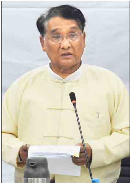
ပြည်ထောင်စုဝန်ကြီး ဒေါက်တာသန်းမြင့်