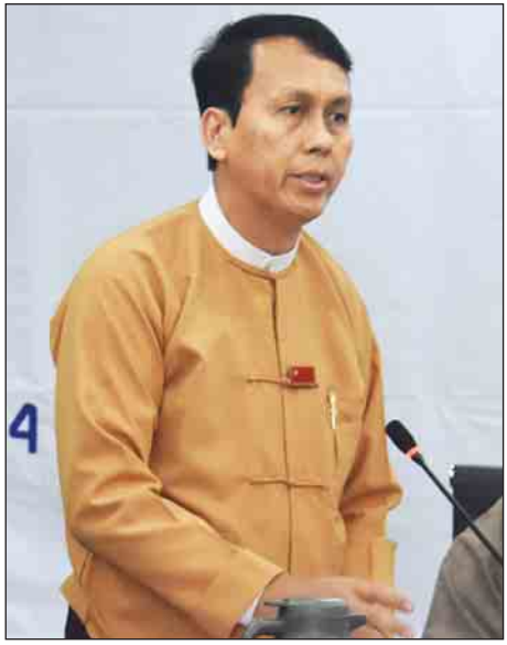
ရန်ကုန်တိုင်းဒေသကြီးဝန်ကြီးချုပ် ဦးဖိုးမင်းသိန်း