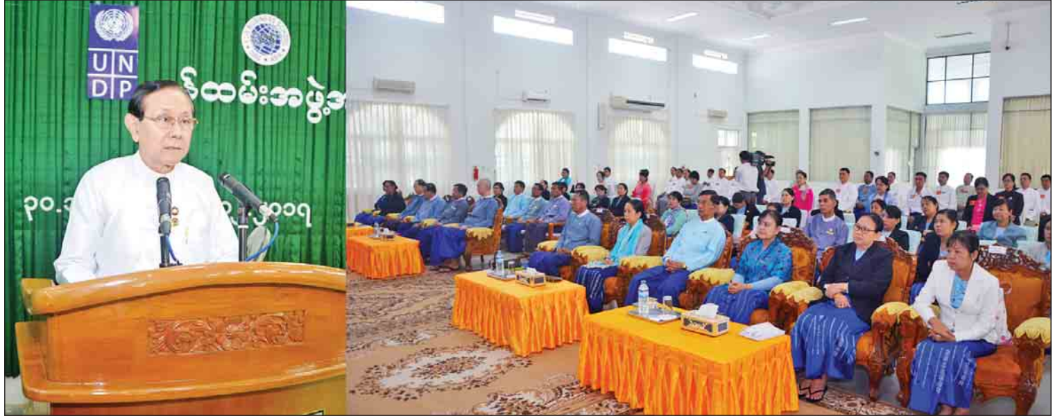
၂၀၁၇ ခုနှစ် ဒီဇင်ဘာ ၂၂ ရက်က ဗဟိုဝန်ထမ်းတက္ကသိုလ်(အောက်မြန်မာပြည်) ဝန်ထမ်းအဖွဲ့အစည်း အကြီးအမှူး စီမံခန့်ခွဲမှုသင်တန်း အမှတ်စဉ်(၁) သင်တန်းဆင်းပွဲတွင် ပြည်ထောင်စုရာထူးဝန်အဖွဲ့ ဥက္ကဋ္ဌ ဒေါက်တာဝင်းသိမ်း အမှာစကား ပြောကြားစဉ်။

ဘာသာရပ်ကိုတော့ စိတ်ဝင်စားပါတယ်။ ကျွန်တော်က လမ်းထိန်းသိမ်းရေးဌာနခွဲမှာ တာဝန်ထမ်းဆောင်နေပါတယ်။ သင်တန်းဆင်းတော့ လမ်းတွေကို ပြုပြင်မယ်ဆိုရင် အရင်ခေတ်က ကျွန်တော်တို့ မျက်စိအမြင်နဲ့ ကောင်းတယ်၊ သင့်တယ်၊ ညံ့တယ် ခွဲခြားတယ်။ အခုတော့ ROMDAS Software နဲ့ နည်းပညာသုံးပြီး ဆောင်ရွက်တဲ့အတွက် အရင်နဲ့မတူတော့ဘဲ ကွဲပြားခြားနားမှုတွေရှိပါတယ်။ ကျွန်တော် တတ်ထားတဲ့ ပညာနဲ့ တိုင်းပြည်ဖွံ့ဖြိုးတိုးတက်ဖို့အတွက် တစ်ဖက်တစ်လမ်းကနေ ပါဝင်ကူညီချင်ပါတယ်။ အဲဒီအတွက် ပြည်ထောင်စုရာထူးဝန်အဖွဲ့မှာ ဝင်ခွင့်စာမေးပွဲကို ဝင်ရောက်ဖြေဆိုခဲ့ရတယ်။ သင်တန်းနဲ့ ပတ်သက်ပြီး စာကျက်ရတာတွေများတဲ့အတွက် ကျက်စာတွေကို လျှော့စေချင်တယ်။ သင်တန်းမှာက တချို့