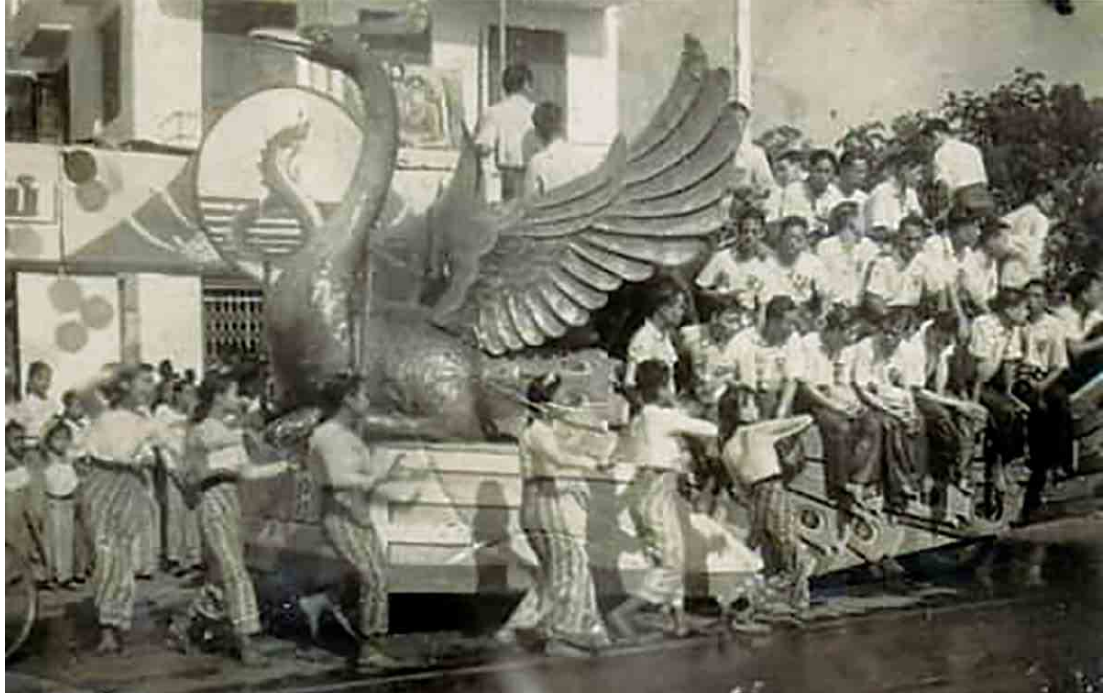
နဂါးမယ်နှင့်တက္ကသိုလ်မောင် (၂)။

66 ထိုစဉ်က နာမည်ကျော်ရုပ်ရှင် မင်းသားဝင်းဦးသည် တစ်ပြားတစ်ချပ်မှ ကိုယ်ကျိုး စီးပွားမပါရှိဘဲ မန္တလေးသင်္ကြန်ကို အနုပညာဖြင့် အားဖြည့်ခဲ့... ယနေ့ မန္တလေးသင်္ကြန်များ၌ သူ့ရေကစားမဏ္ဍပ် ကိုယ့်ရေကစားမဏ္ဍပ် အပြိုင်အဆိုင် မင်းသား၊ မင်းသမီးတွေ အဆိုတော်တွေ၊ မော်ဒယ်တွေ၊ ငွေကျပ်သိန်းဆယ်ချီ၊ ရာချီ ပေးကာ ငှားရမ်းကြ... 99