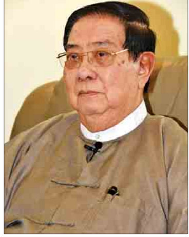
ဦးမြသိန်း [နိုင်ငံတော်ဖွဲ့စည်းပုံအခြေခံ ဥပဒေဆိုင်ရာခုံရုံး၊ အဖွဲ့ဝင် (ငြိမ်း)]