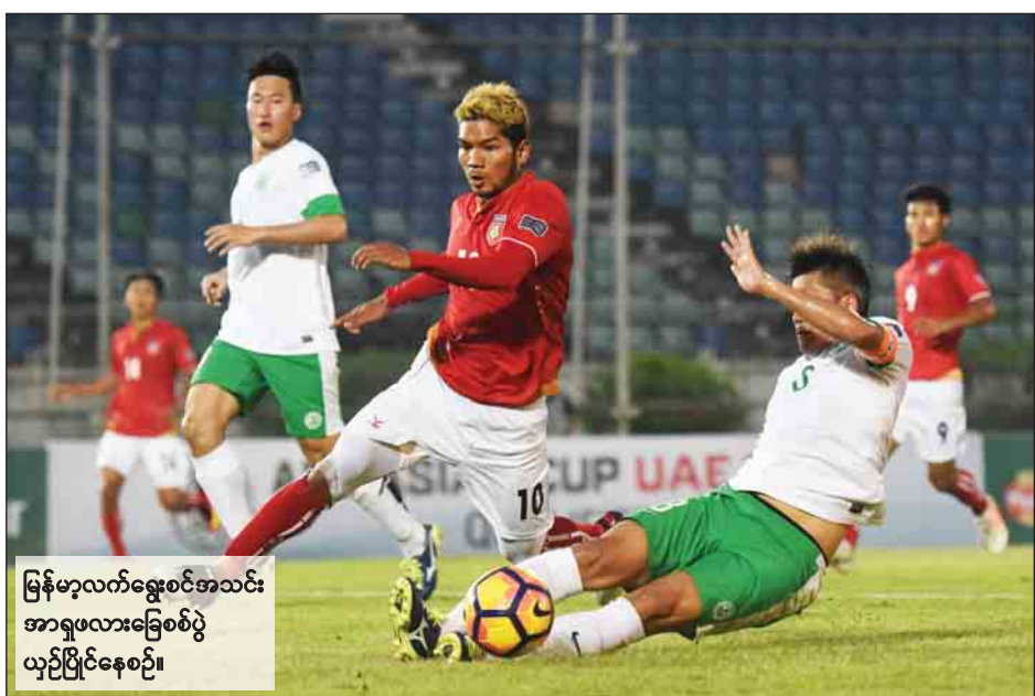
မြန်မာ့လက်ရွေးစင်အသင်း အာရှဖလားခြေစစ်ပွဲ ယှဉ်ပြိုင်နေစဉ်။