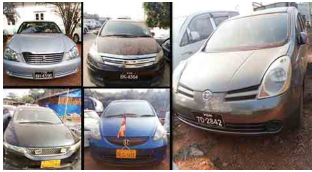
လိုက်လံစစ်ဆေးစဉ် တရားဝင်စာရွက်စာတမ်း အထောက်အထားတစ်စုံတစ်ရာ တင်ပြနိုင်ခြင်းမရှိသည့် လိုင်စင်မဲ့ TOYOTA CROWN၊ HONDA AIRWAVE၊ HONDA ODYSSEY၊ HONDA FIT နှင့် NISSAN NOTE စုစုပေါင်း မော်တော်ယာဉ်ငါးစီး (ခန့်မှန်းတန်ဖိုးငွေကျပ် ၁၆ ဒသမ ၅ သန်းခန့်)ကို စစ်ဆေးတွေ့ရှိ၍ သိမ်းဆည်းခဲ့ကြောင်း သိရသည်။ သတင်းစဉ်

သော ကုန်ပစ္စည်းများကို စစ်ဆေးမှုပြုလုပ်ဆောင်ရွက် လျက်ရှိရာ မတ် ၂၆ ရက်တွင် ရေပူအမြဲတမ်းစစ်ဆေးရေး စခန်းက တားဆီးမှု နှစ်မှု (ခန့်မှန်းတန်ဖိုးငွေကျပ် ၃ ဒသမ ၀၇၅ သန်းခန့်)၊ မရမ်းချောင့်အမြဲတမ်းစစ်ဆေးရေး စခန်းက တားဆီးမှု ၁၀ မှု (ခန့်မှန်းတန်ဖိုးငွေကျပ် ၃၈ ဒသမ ၅၅၇ သန်းခန့်) စုစုပေါင်းတားဆီးမှု ၁၃ မှု (ခန့်မှန်း တန်ဖိုးငွေကျပ် ၄၁ ဒသမ ၅၉၂ သန်းခန့်)ကို သိမ်းဆည်း ရမိခဲ့ကြောင်း သိရသည်။ ထူးခြားသိမ်းဆည်းမှုအနေဖြင့် မတ် ၂၆ ရက်တွင် မရမ်းချောင့်အမြဲတမ်းစစ်ဆေးရေးစခန်း ပူးပေါင်း စစ်ဆေးရေးအဖွဲ့က ရှောင်ကွင်းလမ်းများသို့ လှည့်ကင်း