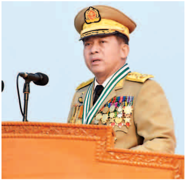
(၇၃)နှစ်မြောက် တပ်မတော်နေ့ စစ်ရေးပြအခမ်းအနားတွင် တပ်မတော်ကာကွယ်ရေးဦးစီးချုပ် ဗိုလ်ချုပ်မှူးကြီး မဟာသရေစည်သူ မင်းအောင်လှိုင် မိန့်ခွန်းပြောကြားစဉ်။

ယင်းနောက် တပ်မတော်ကာကွယ်ရေးဦးစီးချုပ် ဗိုလ်ချုပ်မှူးကြီး မဟာသရေစည်သူမင်းအောင်လှိုင်သည် စစ်ရေးပြစစ်ကြောင်းကြီးများအား လိုက်လံစစ်ဆေးသည်။ ဆက်လက်၍ ပြည်ထောင်စုသမ္မတမြန်မာနိုင်ငံတော်အလံအား အလေးပြုကြရာ ဗဟိုစစ်တီးဝိုင်းအဖွဲ့က နိုင်ငံတော်သီချင်းကို တီးမှုတ်သည်။ ယင်းနောက် ကျဆုံးလေပြီးသော တပ်မတော်သားများအား အလေးပြုကြပြီး စစ်ကြောင်းကြီးများမှ (ကြည်း၊ ရေ၊ လေ) တပ်မတော်သားများနှင့် မြန်မာနိုင်ငံရဲတပ်ဖွဲ့ဝင်များက သစ္စာလေးချက်ကို သံပြိုင်ညီညွတ်ဆိုကြသည်။ ထို့နောက် တပ်မတော်ကာကွယ်ရေးဦးစီးချုပ်က မိန့်ခွန်းပြောကြားရာတွင် ယနေ့သည် တပ်မတော်နှင့် တိုင်းရင်းသားပြည်သူများ လက်တွဲပြီး ဖက်ဆစ်တော်လှန်ရေးဆင်နွှဲ သမိုင်းမော်ကွန်းရေးထိုးနိုင်ခဲ့သည့် (၇၃)နှစ်မြောက် တပ်မတော်နေ့ဖြစ်ကြောင်း။ တပ်မတော်အနေဖြင့် ၁၉၄၅ ခုနှစ် မတ် ၂၇ ရက်တွင် ဖက်ဆစ်တော်လှန်ရေးတစ်ရပ်ကို ကိုယ်ပိုင်ဆုံးဖြတ်ချက်ဖြင့် စတင်ဆင်နွှဲနိုင်ခဲ့၍ နိုင်ငံတပ်မတော်တစ်ရပ်၏ ဂုဏ်ထူးဝိသေသနှင့် ပီပြင်ပြည့်စုံခဲ့သည့် နေ့ထူးနေ့မြတ်လည်းဖြစ်ကြောင်း။ မြန်မာ့သမိုင်းကြောင်းကို ပြန်ပြောင်းလေ့လာကြည့်မည်ဆိုလျှင် အစဉ်အလာကောင်းများနှင့် ယနေ့တိုင်ရှင်သန်နေသည့် တပ်မတော်၏ သမိုင်းကြောင်းကို ယှဉ်တွဲတွေ့မြင်ရမည်ဖြစ်ကြောင်း၊ တပ်မတော်အနေဖြင့် ပြည်သူလူထုနှင့်အတူ နယ်ချဲ့ဆန့်ကျင်ရေးနှင့် ဖက်ဆစ်တော်လှန်ရေးစစ်ပွဲများ ဆင်နွှဲပြီး နိုင်ငံ၏လွတ်လပ်ရေးကို အရယူပေးခဲ့ကြောင်း၊ လွတ်လပ်ရေးရပြီးနောက်