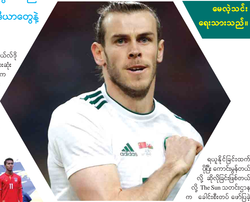
မေလဲ့သင်း ရေးသားသည်။

ရိုးယဲလ်တိုက်စစ်မှူးတွေဖြစ်တဲ့ စီရိုနယ်လ်ဒိုနဲ့ ဂါရတ်ဘေးလ်တို့ဟာ နိုင်ငံအသင်းတွေအတွက် ဝင်ရောက်ကစားခဲ့ကြချိန်မှာ မှတ်တမ်းကောင်းတွေ