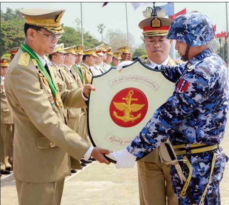
ညှိနှိုင်းကွပ်ကဲရေးမှူး (ကြည်း/ရေလေ) ဗိုလ်ချုပ်ကြီး မြထွန်းဦး စံပြတပ်ခွဲ ပထမဆုရရှိ သော ကာကွယ်ရေးဦးစီးချုပ်ရုံး(ရေ) ကိုယ်စားပြုစစ်ရေးပြဂုဏ်ပြုတပ်ခွဲအား ဆုပေးအပ် ချီးမြှင့်စဉ်။

ဆုချီးမြှင့်ပွဲအခမ်းအနားတွင် (၇၃)နှစ် မြောက်တပ်မတော်နေ့ ကျင်းပရေးဦးစီး ကော်မတီဥက္ကဋ္ဌ တပ်မတော်လေ့ကျင့်ရေး အရာရှိချုပ် ဒုတိယဗိုလ်ချုပ်ကြီး မောင်မောင်အေးက စစ်ရေးပြဂုဏ်ပြုဆုများ ရရှိကြသော ကာကွယ်ရေးဦးစီးချုပ်ရုံး(ရေ) ကိုယ်စားပြုအထူးတပ်ဖွဲ့နှင့် ကာကွယ်ရေး ဦးစီးချုပ်ရုံး(လေ) ကိုယ်စားပြုတပ်ဖွဲ့တို့အား လည်းကောင်း၊ အထူးတာဝန်တပ်ဖွဲ့ (အမျိုး သမီး)တပ်ခွဲဂုဏ်ပြုဆုကို အထူးတာဝန်တပ်ဖွဲ့ (အမျိုးသမီး)တပ်ခွဲ အားလည်းကောင်း၊ ဗဟို စစ်တီးဝိုင်းအဖွဲ့ဂုဏ်ပြုဆုကို ဗဟိုစစ်တီးဝိုင်း အဖွဲ့အားလည်းကောင်း၊ အလံကိုင်အဖွဲ့ ဂုဏ်ပြုဆုကို တပ်မတော်(ကြည်း)အမျိုးသမီး အလံကိုင်အဖွဲ့အားလည်းကောင်း၊ မြင်းစီး စစ်ရေးပြတပ်ဖွဲ့ ဂုဏ်ပြုဆုကို မြင်းစီးစစ်ရေးပြ တပ်ဖွဲ့အားလည်းကောင်း၊ မြန်မာနိုင်ငံရဲ တပ်ဖွဲ့ ရဲတီးဝိုင်းဂုဏ်ပြုဆုကို မြန်မာနိုင်ငံ ရဲတပ်ဖွဲ့ ရဲတီးဝိုင်းအဖွဲ့အားလည်းကောင်း၊ အလံကိုင်အဖွဲ့ အကောင်းဆုံးဆုကို ဘုရင့်နောင်စစ်ကြောင်း ကိုယ်စားပြု အလံကိုင်အဖွဲ့အားလည်းကောင်း၊ စစ်တီးဝိုင်း အဖွဲ့ အကောင်းဆုံးဆုကို အနော်ရထာ