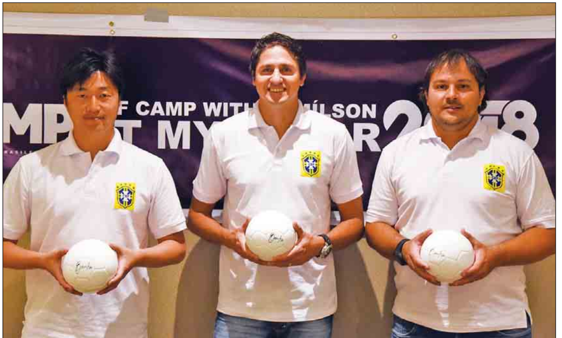
ဘရာဇီးလက်ရွေးစင်ကစားသမားဟောင်း အက်ဒီမီဆင်(လယ်)နှင့် နည်းပြအဖွဲ့ဝင်များအား တွေ့ရစဉ်