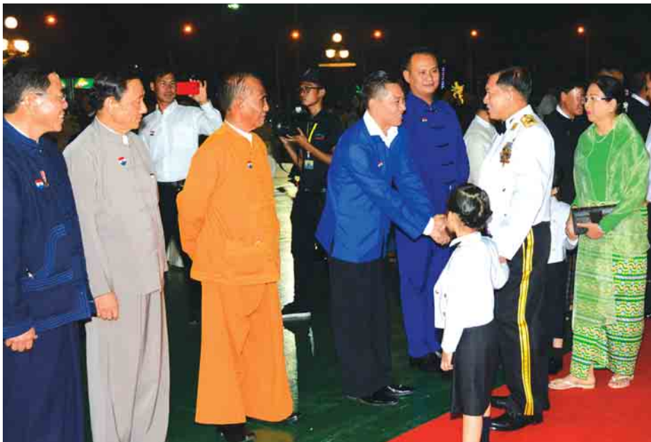
တပ်မတော်ကာကွယ်ရေးဦးစီးချုပ် ဗိုလ်ချုပ်မှူးကြီး မဟာသရေစည်သူ မင်းအောင်လှိုင်နှင့် ဇနီးဒေါ်ကြူကြူလှ (၇၃)နှစ်မြောက် တပ်မတော်နေ့အထိမ်းအမှတ်ဧည့်ခံပွဲနှင့် ဂုဏ်ပြုညစာစားပွဲ အခမ်းအနားသို့ တက်ရောက်လာကြသူများအား ရင်းရင်းနှီးနှီး နှုတ်ဆက်စဉ်။

နေပြည်တော် မတ် ၂၇ တပ်မတော်ကာကွယ်ရေးဦးစီးချုပ် ဗိုလ်ချုပ်မှူးကြီး မဟာသရေစည်သူ မင်းအောင်လှိုင်နှင့် ဇနီးဒေါ်ကြူကြူလှတို့က တည်ခင်းဧည့်ခံသည့် ၂၀၁၈ ခုနှစ် (၇၃)နှစ်မြောက် တပ်မတော်နေ့အထိမ်းအမှတ်ဧည့်ခံပွဲနှင့် ဂုဏ်ပြုညစာစားပွဲ အခမ်းအနားကို ယနေ့ညပိုင်းတွင် နေပြည်တော်ရှိ ဇေယျာသီရိဗိမာန် ဥပစာရင်ပြင်၌ ကျင်းပသည်။ အခမ်းအနားသို့ နိုင်ငံတော်သမ္မတ(ငြိမ်း) ဦးသိန်းစိန်နှင့်ဇနီး၊ ဒုတိယတပ်မတော် ကာကွယ်ရေးဦးစီးချုပ် ကာကွယ်ရေးဦးစီးချုပ်(ကြည်း) ဒုတိယဗိုလ်ချုပ်မှူးကြီး စိုးဝင်းနှင့်ဇနီး၊ ပြည်ထောင်စုရွေးကောက်ပွဲကော်မရှင် ဥက္ကဋ္ဌ ဦးလှသိန်းနှင့်ဇနီး၊ အမျိုးသားလွှတ်တော် ဒုတိယဥက္ကဋ္ဌ ဦးအေးသာအောင်၊ ပြည်ထောင်စုဝန်ကြီးများနှင့်ဇနီးများ၊ ညှိနှိုင်းကွပ်ကဲရေးမှူး (ကြည်း၊ ရေ၊ လေ) ဗိုလ်ချုပ်ကြီး မြထွန်းဦးနှင့်ဇနီး၊ ကာကွယ်ရေး ဦးစီးချုပ်(ရေ) ဗိုလ်ချုပ်ကြီး တင်အောင်စန်းနှင့်ဇနီး၊ ကာကွယ်ရေးဦးစီးချုပ်(လေ) ဗိုလ်ချုပ်ကြီး မောင်မောင်ကျော်နှင့် ဇနီး၊ တပ်မတော်ကာကွယ်ရေးဦးစီးချုပ်ရုံး(ကြည်း)မှ တပ်မတော်အရာရှိကြီးများနှင့် ဇနီးများ၊ တပ်မတော်အငြိမ်းစားအရာရှိကြီးများနှင့် ဇနီးများ၊ လွှတ်တော်ကော်မတီများမှ ဥက္ကဋ္ဌများ၊ ဒုတိယဝန်ကြီးများ၊ တပ်မတော်သားလွှတ်တော်ကိုယ်စားလှယ်များ၊ စစ်ရေးပြမှူးကြီးနှင့် စစ်ကြောင်းမှူးများ၊ စွမ်းရည်ဘွဲ့ ရရှိသူများနှင့် အမွေခံများ၊ NCA လက်မှတ် ရေးထိုးထားသည့် တိုင်းရင်းသားလက်နက်ကိုင်အဖွဲ့အစည်းများမှ ကိုယ်စားလှယ်များ၊ နိုင်ငံခြားစစ်သံရုံးများမှ စစ်သံမှူးများနှင့် တာဝန်ရှိသူများ၊ မြန်မာနိုင်ငံရဲတပ်ဖွဲ့၊ မီးသတ်တပ်ဖွဲ့နှင့် မြန်မာနိုင်ငံ