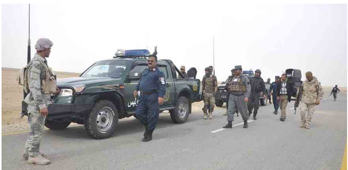
စစ်ဆင်ရေးဆင်နွှဲနေသော အာဖဂန် လုံခြုံရေးတပ်ဖွဲ့ဝင်များကို တွေ့ရစဉ်။