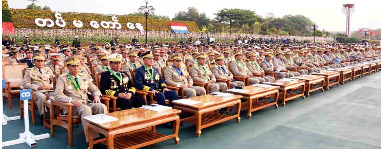
(၇၃)နှစ်မြောက် တပ်မတော်နေ့ စစ်ရေးပြအခမ်းအနားသို့ တပ်မတော်အရာရှိကြီးများ တက်ရောက်ကြစဉ်။

မြန်မာနိုင်ငံအတွင်း လူမျိုးစုပေါင်း ၁၃၀ ကျော်သည် ရှေးနှစ်ပေါင်းများစွာ ကတည်းက အတူတကွ အေးချမ်းစွာယှဉ်တွဲနေထိုင်ခဲ့ကြကြောင်း၊ လူမျိုးစုများထဲတွင် လူဦးရေသိန်းနှင့်ချီပြီးရှိသည့် တိုင်းရင်းသားလူမျိုးစုများရှိသကဲ့သို့ လူဦးရေအနည်းငယ်သာရှိသည့် တိုင်းရင်းသားလူမျိုးစုများလည်း ပါဝင်ကြောင်း၊ အင်အားနည်းခြင်း၊ များခြင်းသည် အဓိကမဟုတ်ဘဲ တိုင်းရင်းသားလူမျိုးစုအားလုံးအတွက် အခွင့်အရေးသည် ဖွဲ့စည်းပုံအခြေခံဥပဒေအရ တစ်ပြေးညီ အတူတူပင်ဖြစ်ကြောင်း၊ ဗုဒ္ဓဘာသာသာသနာသည် မြန်မာနိုင်ငံတွင် အများစုကိုးကွယ်ကြပြီး အခြားဘာသာသာသနာကိုလည်း ကိုးကွယ်ယုံကြည်ခွင့်ရှိကြောင်း၊ ထို့ကြောင့် ဘာသာရေးနှင့် ပတ်သက်လာပါက အထင်အမြင်လွဲမှားအောင် ပြောဆိုပြုမူနေခြင်းကို ထိန်းသိမ်းရမည်ဖြစ်ကြောင်း။