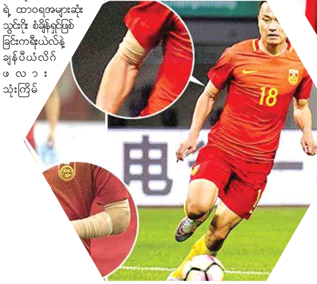
ရဲ့ ထာဝရအများဆုံး သွင်းဂိုး စံချိန်ရှင်ဖြစ်ခြင်းကရိုးယဲလ်နဲ့ ချန်ပီယံလိဂ်ဖလား သုံးကြိမ်

အသုံးပြုခဲ့တာကြောင့် ဒါဟာ နိုင်ငံလက်ရွေးစင်ကစားသမားတွေသာ မဖြစ်မနေ လိုက်နာရမယ့် စည်းမျဉ်းလားဆိုတာ ခုထိတော့ အတည်ပြုဖို့ခက်ပါတယ်။ တရုတ်အသင်းဟာ ၂၀၂၂ ကမ္ဘာ့ဖလားအတွက် ရည်မှန်းချက် မြင့်မြင့်မားမားထားရှိထားပြီး အိတလီလူမျိုးလစ်စီကို တစ်ပတ်လုပ်ခပေါင် ၃၅၀၀၀နဲ့ လက်ရွေးစင်အသင်းနည်းပြအဖြစ် ခန့်အပ်ခဲ့တာကြောင့် လစ်စီဟာ ကမ္ဘာ့ကြေးအကြီးဆုံး နည်းပြဖြစ်လာပါတယ်။