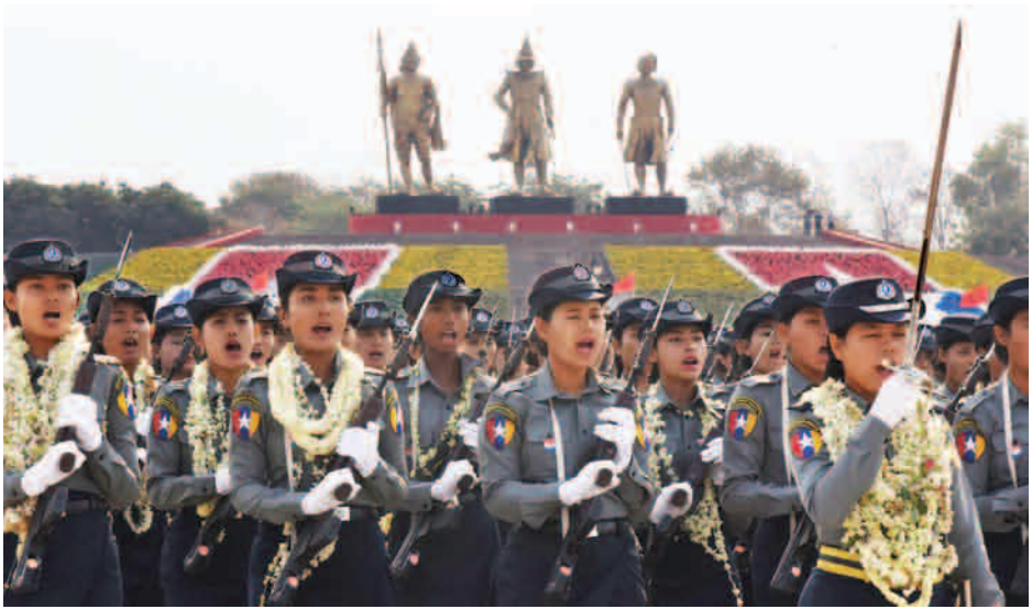
တပ်မတော်ကာကွယ်ရေးဦးစီးချုပ် ဗိုလ်ချုပ်မှူးကြီးမင်းအောင်လှိုင်အား စစ်ကြောင်းကြီးများ ချီတက်အလေးပြုစဉ်။