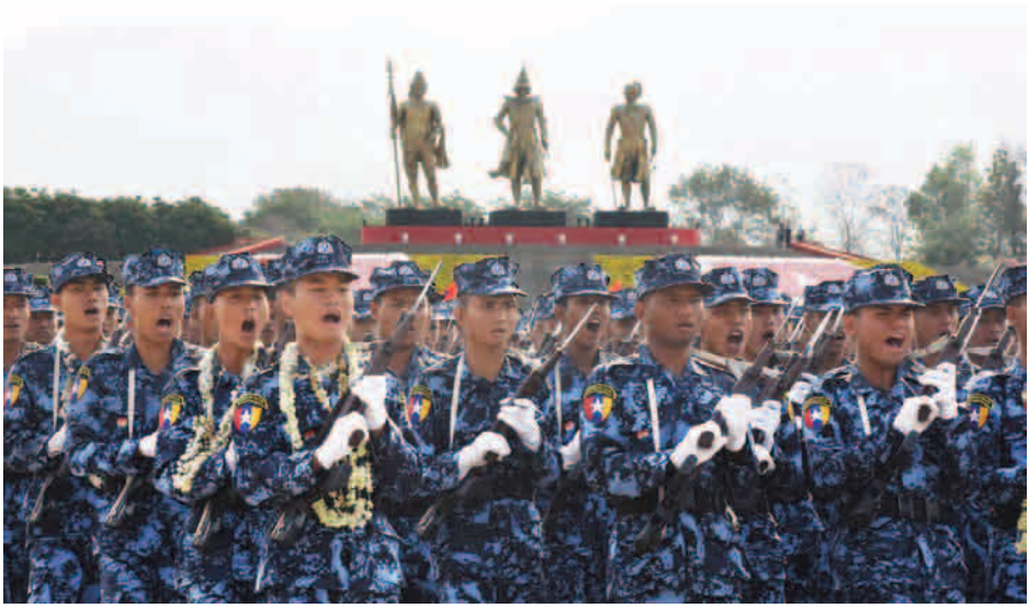
တပ်မတော်ကာကွယ်ရေးဦးစီးချုပ် ဗိုလ်ချုပ်မှူးကြီးမင်းအောင်လှိုင်အား စစ်ကြောင်းကြီးများ ချီတက်အလေးပြုစဉ်။