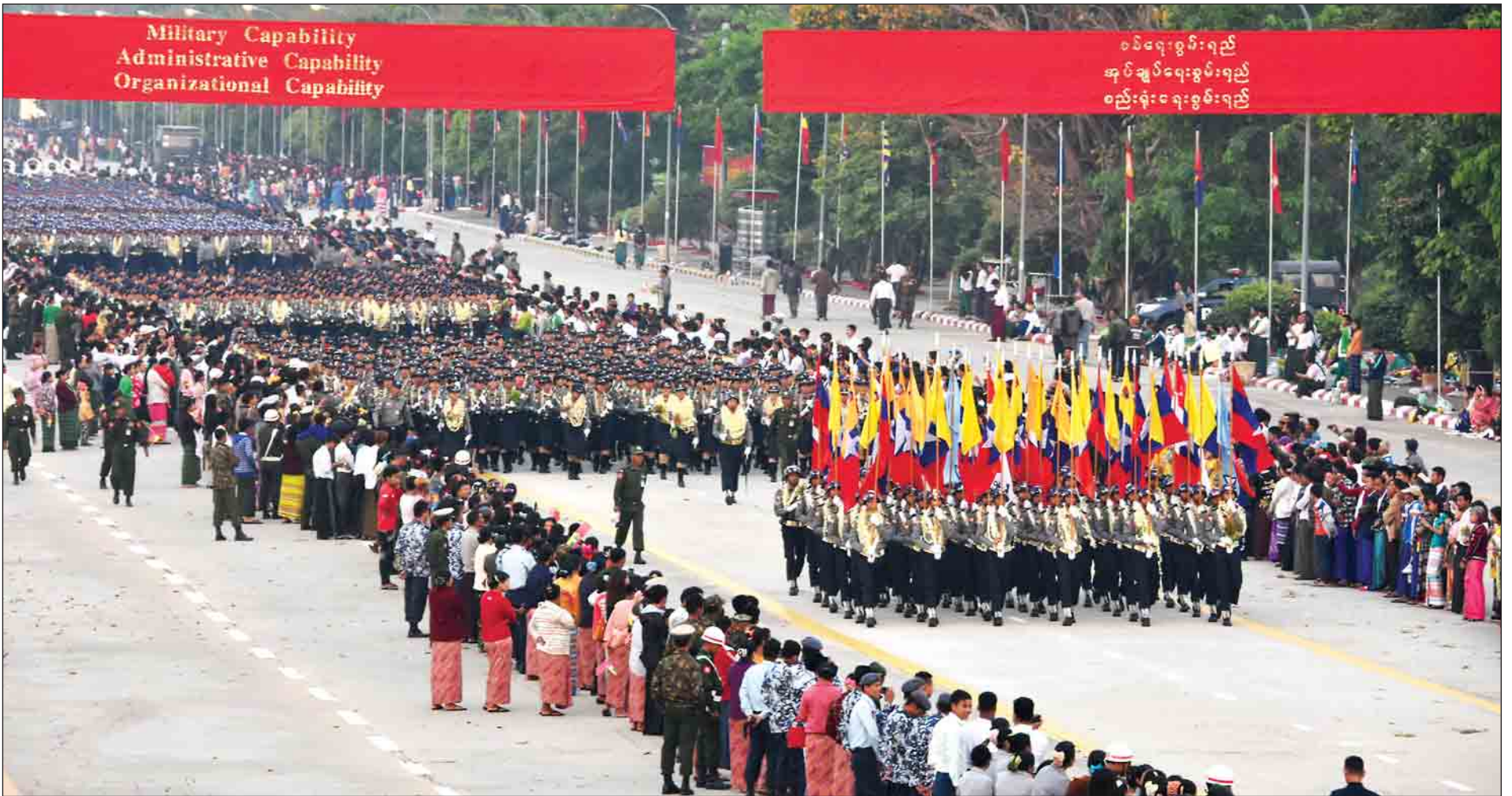
(၇၃)နှစ်မြောက် တပ်မတော်နေ့ စစ်ရေးပြအခမ်းအနားတွင် စစ်ရေးပြစစ်ကြောင်းကြီးများ ချီတက်လာစဉ်။