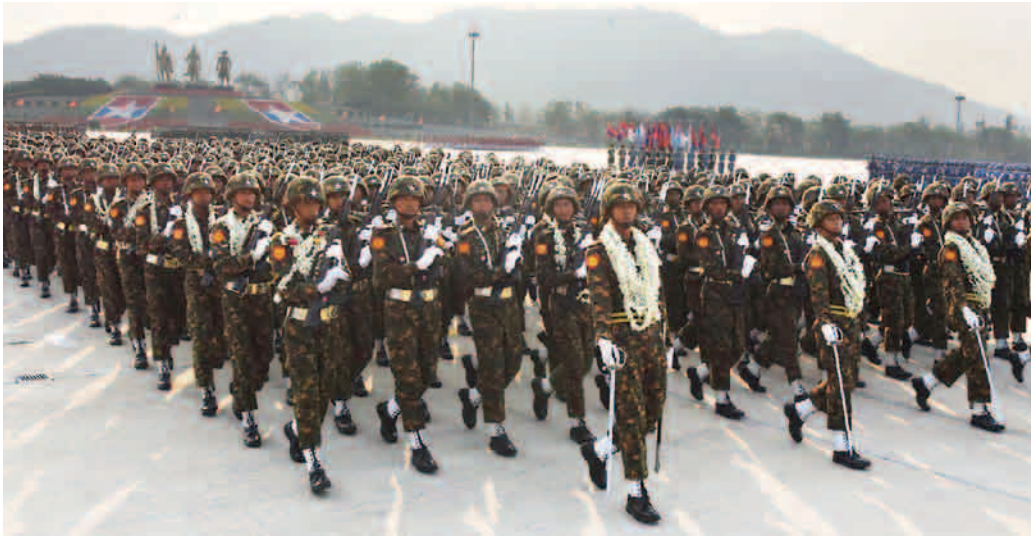
တပ်မတော်ကာကွယ်ရေးဦးစီးချုပ် ဗိုလ်ချုပ်မှူးကြီးမင်းအောင်လှိုင်အား စစ်ကြောင်းကြီးများ ချီတက်အလေးပြုစဉ်။

ထို့ပြင် ဒီမိုကရေစီအုပ်ချုပ်ရေးစနစ် ကျင့်သုံးနိုင်ရေး လိုအပ်သည့်အခြေခံကောင်းများ တည်ဆောက်ပေးခဲ့ပြီး နိုင်ငံရေး၏အုပ်ချုပ်ရေးစနစ် အသွင်ကူးပြောင်းမှု ညင်သာချောမွေ့စေရေးအတွက်လည်း ကမကထပြ ဆောင်ရွက်ပေးခဲ့ကြောင်း၊ မိမိတို့နိုင်ငံ၏ သမိုင်းကြောင်းတစ်လျှောက်တွင် တပ်မတော်၏ အခန်းကဏ္ဍနှင့် ရပ်တည်ဆောင်ရွက်ချက်များသည် အလွန်အရေးပါခဲ့ပြီး ဂုဏ်ယူဖွယ်ရာလည်း ဖြစ်ခဲ့ကြောင်း။ စာမျက်နှာ ၉ သို့ ◆