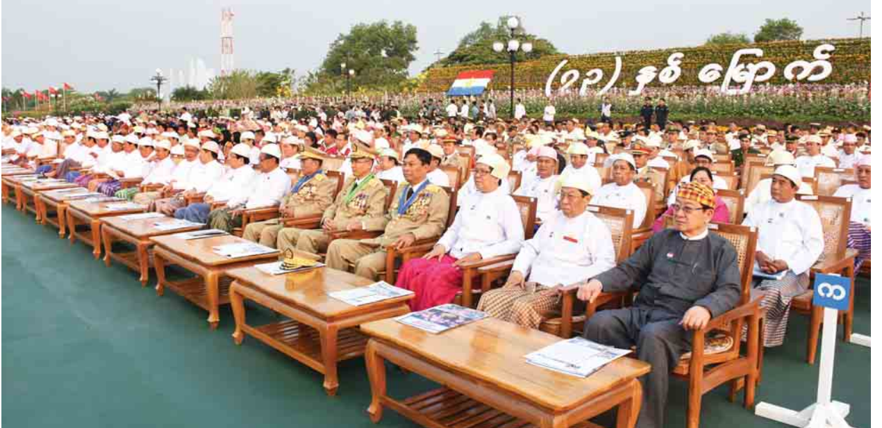
(၇၃)နှစ်မြောက် တပ်မတော်နေ့ စစ်ရေးပြအခမ်းအနားသို့ ပြည်သူ့လွှတ်တော်ဥက္ကဋ္ဌ ဦးတီခွန်မြတ်၊ ပြည်ထောင်စုရွေးကောက်ပွဲကော်မရှင်ဥက္ကဋ္ဌ ဦးလှသိန်း၊ အမျိုးသားလွှတ်တော် ဒုတိယဥက္ကဋ္ဌ ဦးအေးသာအောင်၊ ပြည်ထောင်စုဝန်ကြီးများ တက်ရောက်ကြစဉ်။

ယနေ့ နိုင်ငံတော်သည်ခေတ်မီဖွံ့ဖြိုးတိုးတက်သည့် ဒီမိုကရေစီနိုင်ငံအဖြစ် လျှောက်လှမ်းလျက်ရှိကြောင်း၊ ဒီမိုကရေစီစနစ်ဆိုသည်မှာ ရှုထောင့်မျိုးစုံမှ ကြည့်ပြီး အမြင်မတူသည်များကို ပေါင်းစပ်ညှိနှိုင်းကာ တူညီသည့် သဘောထားများနှင့် စုစည်းနေထိုင်ခြင်းပင်ဖြစ်ကြောင်း၊ နိုင်ငံတော်တွင် မည်သည့်စနစ်ကိုပင် ကျင့်သုံးသည်ဖြစ်စေ ပြဋ္ဌာန်းထားသည့် ဥပဒေ၊ စည်းမျဉ်း၊ စည်းကမ်းများ ရှိစမြဲပင်ဖြစ်ကြောင်း၊ ဒီမိုကရေစီစနစ်တွင်လည်း ဒီမိုကရေစီစနစ်နှင့်အညီ လွတ်လပ်စွာ ပြောဆိုခွင့်၊ ရေးသားခွင့်ရှိသည်ဆိုသော်လည်း ပြဋ္ဌာန်းထားသည့် စည်းမျဉ်း၊ စည်းကမ်းနှင့်အညီ ပြောဆိုရေးသားရန် လိုအပ်ပြီး တာဝန်ယူမှု၊ တာဝန်ခံမှုရှိရမည်ဖြစ်ကြောင်း၊ စည်းကမ်းဆိုသည်မှာ ဖွံ့ဖြိုးတိုးတက်စေရေးအတွက် လမ်းညွှန်မြေပုံပင်ဖြစ်ကြောင်း၊ အခြေအမြစ်မရှိသည့် စည်းကမ်းမဲ့ ပြောဆိုရေးသားမှုများသည် အမုန်းတရားကိုဖြစ်စေပြီး နိုင်ငံတော်၏ ဂုဏ်သိက္ခာကိုလည်း ကျဆင်းစေသည့်အပြင် နိုင်ငံတော်တည်ဆောက်ရေးတွင်လည်း အဟန့်အတားဖြစ်စေကြောင်း။