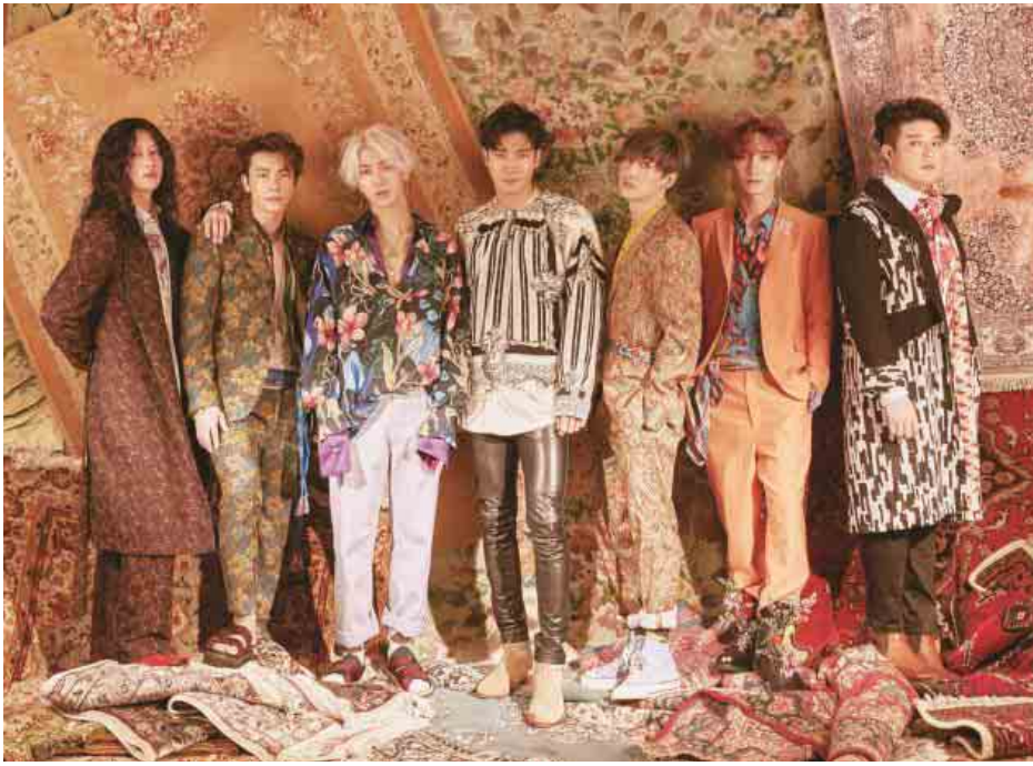
လတ်တလောမှာ ယင်းတေးအယ်လ်ဘမ်သစ်အတွက် "Super Junior"ရဲ့ အဖွဲ့လိုက်ဓာတ်ပုံတွေကို ထုတ်ဖော်ပြသခဲ့ရာမှာတော့ အဖွဲ့ဝင်တွေဟာ လက်တင်တို့ရဲ့ ဝတ်စားဆင်ယင်မှုပုံစံမျိုးနဲ့ ပြင်ဆင်ထားတာကို တွေ့ရပါတယ်။ ဒီလိုဝတ်စားဆင်ယင်ခဲ့တာဟာ တေးအယ်လ်ဘမ်သစ်မှာ လက်တင်တေးသီချင်းတစ်ပုဒ်ပါဝင်ပြီး အမည်ကတော့ "Lo Siento" ဖြစ်ပါတယ်။ ဒါ့အပြင် အခြားတေးသီချင်းသစ် သုံးပုဒ်က "Me & U"၊ "Super Duper" နဲ့ "Hug"တို့ ဖြစ်ကြောင်းလည်း သိရပါတယ်။

တောင်ကိုရီးယားရဲ့ ကျော်ကြားတဲ့ အမျိုးသားတေးဂီတအဖွဲ့တစ်ဖွဲ့ဖြစ်တဲ့ "Super Junior"ဟာ တေးအယ်လ်ဘမ်သစ်နဲ့အတူ ပရိသတ်ရှေ့အရောက်ပြန်လာဖို့ စီစဉ်ထားရာ လတ်တလောမှာတော့ ယင်းတေးအယ်လ်ဘမ်သစ်အတွက် ရည်ရွယ်ရိုက်ကူးထားတဲ့ အဖွဲ့လိုက်ဓာတ်ပုံတွေကို ထုတ်ဖော်ပြသလိုက်ကြောင်း အောကေပေါင်ဒေါ့ကွန်းရဲ့ ရေးသားဖော်ပြချက်တွေအရ သိရပါတယ်။ အဖွဲ့ဟာ လာမယ့် ဧပြီ ၁၂ ရက်မှာ တေးအယ်လ်ဘမ်သစ်ကို စတင်ထုတ်လွှင့်သွားမှာ ဖြစ်ပါတယ်။ ယင်းတေးအယ်လ်ဘမ်ဟာ ထုတ်လွှင့်ခဲ့ပြီးဖြစ်တဲ့ တေးအယ်လ်ဘမ် "Play"မှာပါဝင်တဲ့ တေးသီချင်းတွေနဲ့ တေးသီချင်းသစ်တွေကို ရောနှောကာ ပြန်လည်ဆန်းသစ်ထုတ်လွှင့်သွားမှာ ဖြစ်ပြီး အမည်ကိုတော့ "Replay" လို့သာ ပေးထားတာဖြစ်ပါတယ်။ ယင်းတေးအယ်လ်ဘမ်မှာတော့ တေးသီချင်းဟောင်း ၁၀ ပုဒ်နဲ့ တေးသီချင်းသစ် လေးပုဒ် ပါဝင်မှာဖြစ်တယ်လို့လည်း သိရပါတယ်။