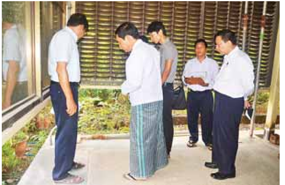
တိုးတက်ရေးဌာန အဆောက်အအုံပြီးစီးပါက အရည် အသွေးပြည့်မီသော အထည်အလိပ်ကုန်ချောများ ထုတ်လုပ် နိုင်ရေးအတွက် နိုင်ငံတကာအဆင့်မီ စမ်းသပ်စစ်ဆေးနိုင်

ချည်မျှင်နှင့် အထည်ထုတ်လုပ်မှု နည်းပညာ ပံ့ပိုး