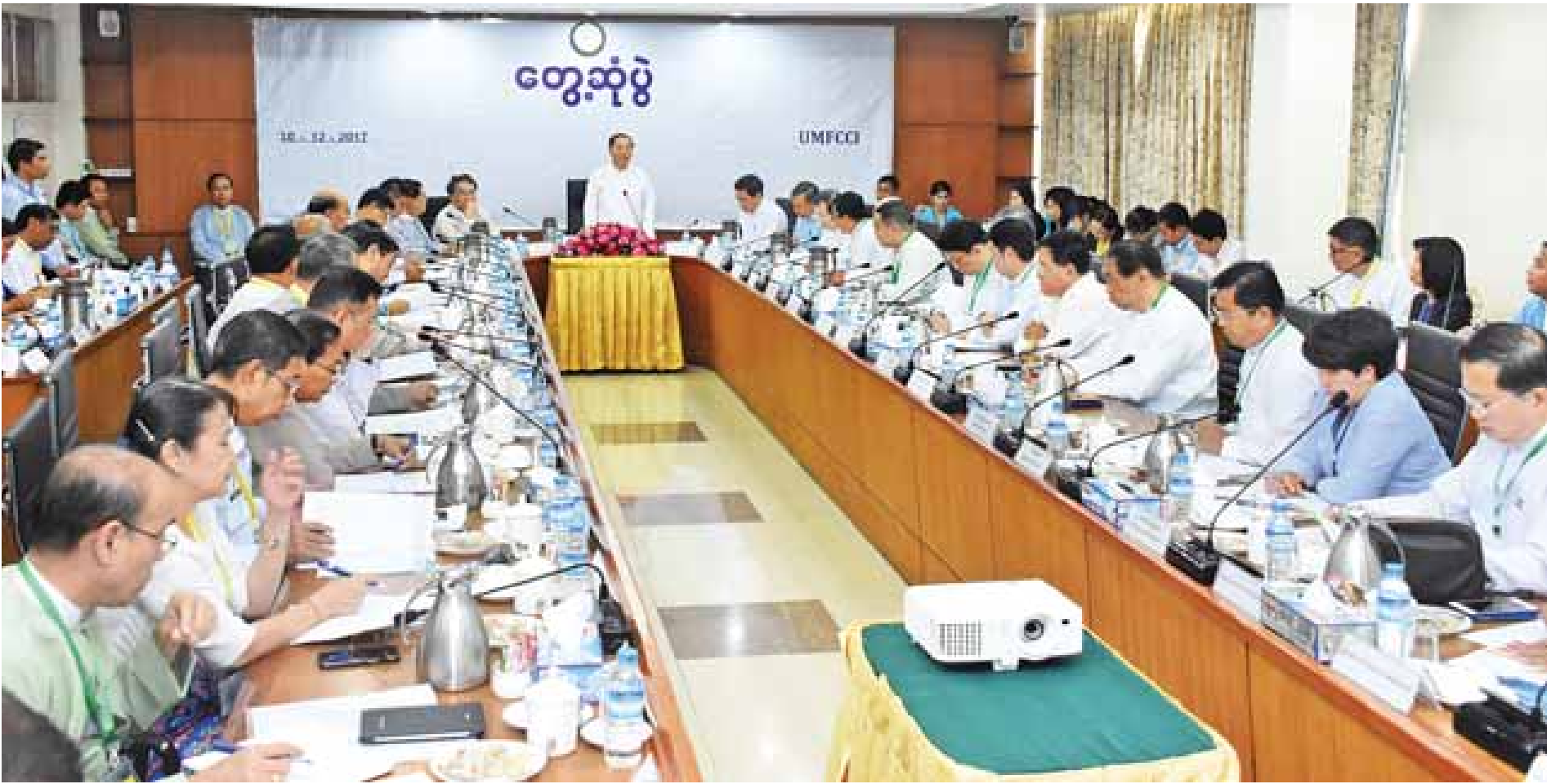
ပုဂ္ဂလိကကဏ္ဍ ဖွံ့ဖြိုးတိုးတက်ရေးကော်မတီနှင့် မြန်မာ့စီးပွားရေးလုပ်ငန်းရှင်များ (၁၃)ကြိမ်မြောက် ပုံမှန်တွေ့ဆုံပွဲ အခမ်းအနားတွင် ဒုတိယသမ္မတ ဦးမြင့်ဆွေ အမှာစကားပြောကြားစဉ်။