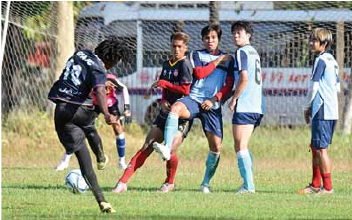
ရှမ်းယူနိုက်တက်အသင်းနှင့် GFA အသင်း ယှဉ်ပြိုင်နေစဉ်။