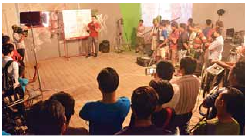
အား စာတွေ့လက်တွေ့ အသိပညာပွဲဝေခြင်းသည် ထိုသို့ အသိပညာပွဲဝေရာတွင် ကင်မရာ အမျိုးအစား စုံလင်စွာ အသုံးပြုကာ ကင်မရာနှင့် မှန်ဘီလူးအမျိုးအစား

အဆိုပါအစီအစဉ်ကို မြန်မာနိုင်ငံ ရုပ်ရှင်အစည်းအရုံး က ဦးဆောင်၍ မြန်မာ့ရုပ်ရှင်လုပ်ငန်း၏ ကူညီမှုတို့ဖြင့် စက်မှုအခြေခံ သာရေး၊ နာရေးအသင်းက စီစဉ်ပြုလုပ် ခြင်းဖြစ်ပြီး ရုပ်ရှင်ရိုက်ကူးခြင်းနှင့်ပတ်သက်၍ ကင်မရာ အပိုင်း၊ မီးအလင်းအမှောင်အပိုင်းနှင့် မီးပိုင်းဆိုင်ရာ အပိုင်းများတွင်ပါဝင်သော ကင်မရာနှင့် ပတ်သက်သည့် အကြောင်းအရာများဖြစ်သည့် နည်းပညာအပိုင်း၊ ကင်မရာ တည်ဆောက်ပုံနှင့် မှန်ဘီလူးတည်ဆောက်ပုံများကို ကင်မရာရိုက်ကူးသူများနှင့် အထောက်အကူပြုသူများကို သက်ဆိုင်ရာ ကဏ္ဍအလိုက် တာဝန်ယူရိုက်ကူးမှုပုံစံများ