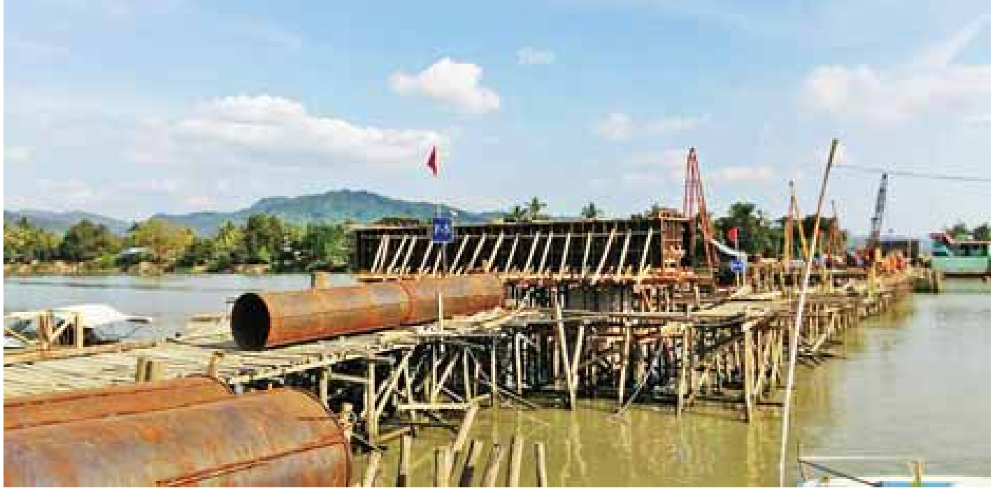
ရသေ့တောင်-ဘူးသီးတောင်လမ်းပေါ်ရှိ ပေ ၆၀၀ ရှည် စိုင်းတင်တံတား တည်ဆောက်နေမှုကို တွေ့ရစဉ်။

အဆိုပါ လမ်းပေါ်တွင် ဆောက်လုပ်ရေးဝန်ကြီးဌာန တံတားဦးစီးဌာနက တံတားကြီးများ တည်ဆောက်လျက် ရှိရာ အဓိကကျန်ရှိနေသော တံတားကြီးနှစ်စင်းမှာ စာမျက်နှာ ၁၁ ကော်လံ ၁ သို့ □