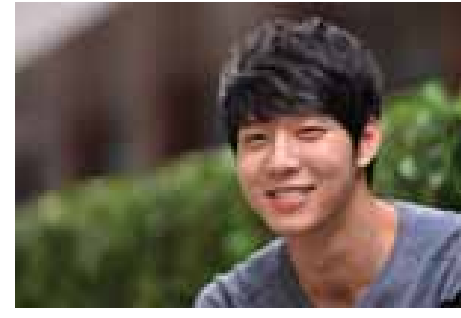
ကတော့ ၂၂ ပေါင်ခန့် လျော့ကျသွားခဲ့ပါတယ်။