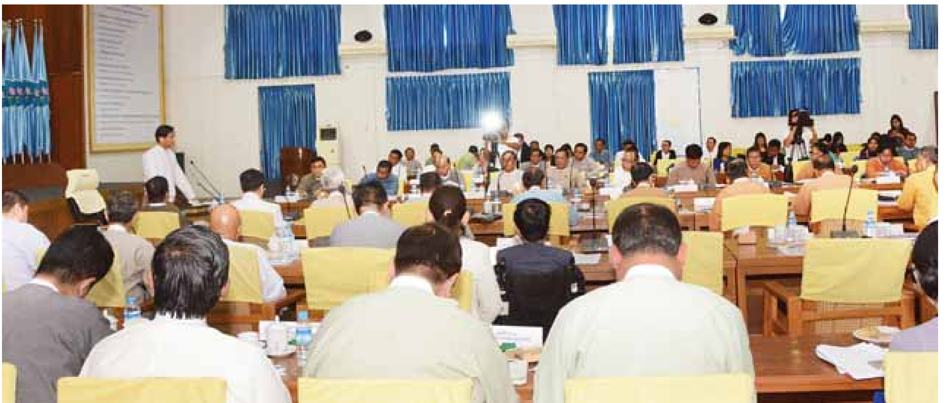
ဒုတိယသမ္မတ ဦးဟင်နရီဗန်ထီးယူ မသန်စွမ်းသူများ၏ အခွင့်အရေးများဆိုင်ရာ အမျိုးသားကော်မတီ၏ ပထမအကြိမ် အစည်းအဝေးတွင် အမှာစကားပြောကြားစဉ်။