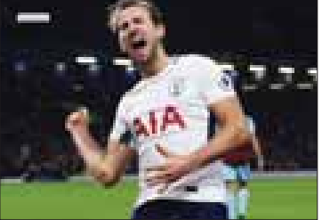
ချန်ပီယံလိဂ်မှာ အကောင်းဆုံးဆိုတဲ့ အသင်းကို အနိုင်ရခဲ့တယ်။ ပရီမီယာလိဂ်မှာ

စပါးတိုက်စစ်မှူး ဟယ်ရီဂိုနီးဟာ ၂၀၁၇ ခုနှစ်အတွင်း ပရီမီယာလိဂ်ရဲ့ သွင်းရိုး အများဆုံးကစားသမားအဖြစ် သာမက ပြက္ခဒိန်နှစ်တစ်နှစ်အတွင်း ဥရောပရဲ့ သွင်းရိုးအများဆုံး တိုက်စစ်မှူးဆိုတဲ့ မှတ်တမ်းကိုပါ တစ်ပြိုင်နက်တည်း ပိုင်ဆိုင်ခွင့်ရခဲ့ပါတယ်။ ဒါပေမယ့် ကိန်းက “ဆုပေးလားတွေကိုသာ ရလိုတယ်လို့ ကျွန်တော်အမြဲ ပြောခဲ့ပါတယ်။ ကျွန်တော် တို့ အက်စ်အေဖလား ရနိုင်ခြေရှိတယ်။