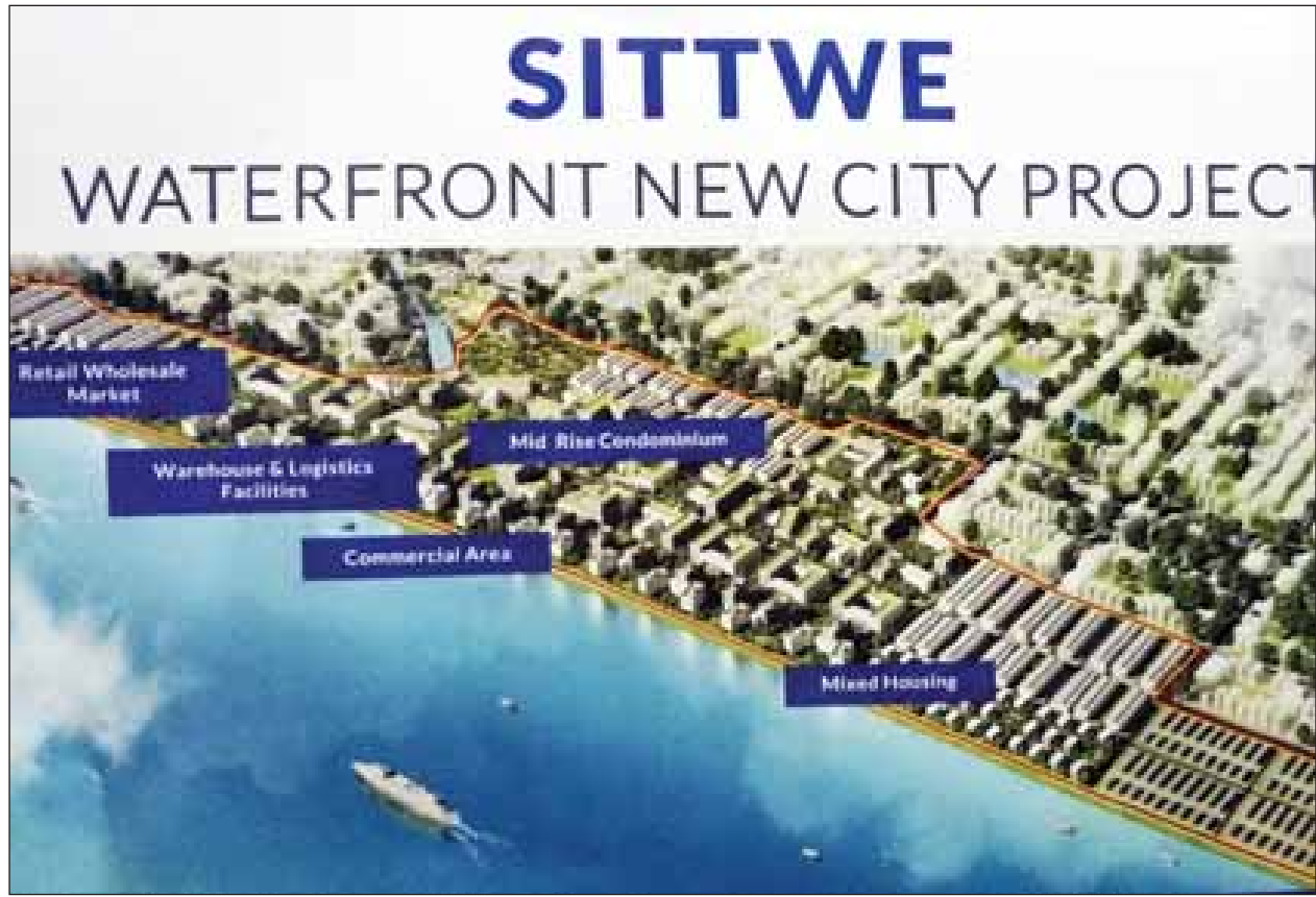
စစ်တွေမြစ်ကမ်း မြို့သစ်စီမံကိန်းပုံစံထုတ်ပြန်ပေးခဲ့ခြင်း