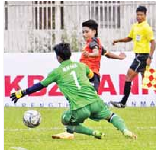
အားကစားနှင့် ကာယပညာဦးစီးဌာနအသင်းနှင့် တက္ကသိုလ်အသင်းတို့ ယှဉ်ပြိုင်နေစဉ်။