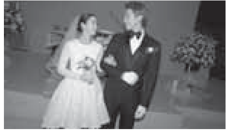
ပွဲတွေအနက် ဒရုန်းနဲ့သာရိုက်ကူးခွင့်ရခဲ့တဲ့ ပထမဆုံး သောပွဲလည်း ဖြစ်လာခဲ့ပါတယ်။