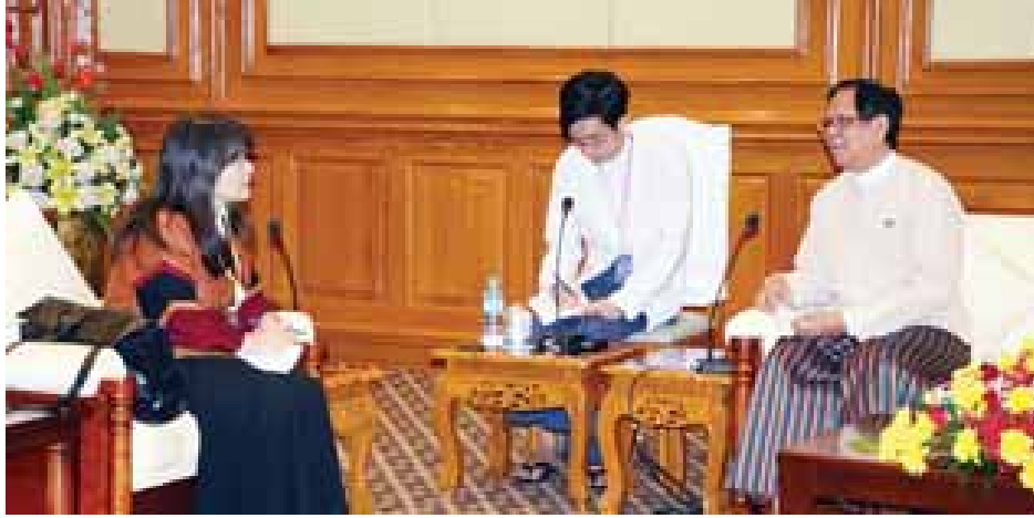
နေပြည်တော် ဒီဇင်ဘာ ၂၈