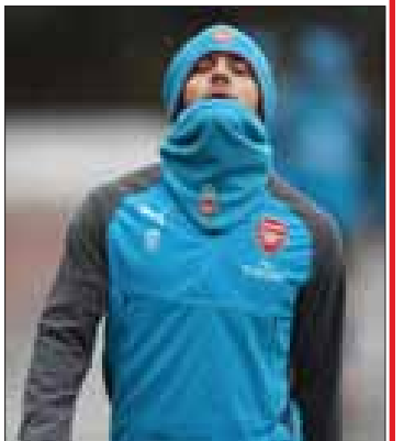
လိုက်တာလို့ ကောက်ချက်ဆွဲမှုတွေလည်း ရှိနေပါတယ်။

ပဲ အသုံးပြုခဲ့ပေမယ့် လိဂ်နောက်ဆုံးပွဲမှာ တော့ ပြန်လည်ကစားခွင့်ပေးခဲ့သလို ဝီရှိုင်းယားကို စာချုပ်သက်တမ်းတိုးမယ်လို့ လည်း ထုတ်ဖော်ပြောကြားထားပြီး ဖြစ်ပါ တယ်။ ဝီရှိုင်းယားက “ ကျွန်တော်က ခုချိန်မှာ အကောင်းဆုံးဆိုတဲ့အချိန်တွေကို ပြန်ရောက် လုနီးပါးဖြစ်နေပါပြီ။ တစ်ပွဲထက်တစ်ပွဲ ပိုကောင်းလာတယ်လို့ ခံစားရပါတယ်”လို့ ဆိုခဲ့တာကြောင့် ဒါဟာ အာဆင်နယ်နဲ့ စာချုပ်သက်တမ်းတိုးမယ်ဆိုတာ အချက်ပြ