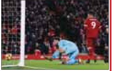
ပေါင် ရှစ်သောင်းခွဲ ဆုကြေးရမှာဖြစ်တာ ကြောင့် ဟမီနိုရဲ့ ဒုတိယရိုးဟာ သူ့ကို ပေါင် နှစ်သောင်း ဆုကြေးရရှိစေခဲ့ပါတယ်။

ရိုးနဲ့ ၁၆ ရိုးအဖြစ် သွင်းယူနိုင်ခဲ့တာပါ။ ဟမီနိုနဲ့ လီဗာပူးတို့ ချုပ်ဆိုထားတဲ့ စာချုပ်ထဲမှာ တစ်ရိုးကနေ ငါးရိုးအထိ သွင်းယူနိုင်ရင် ဆုကြေးပေါင် နှစ်သောင်းခွဲ၊ ခြောက်ရိုးကနေ ၁၀ ရိုးအတွက် ပေါင် လေးသောင်းခွဲ၊ ၁၁ ရိုးကနေ ၁၅ ရိုးအတွက် ပေါင် ခြောက်သောင်းခွဲ၊ ၁၆ ရိုးသွင်းကနေစပြီး