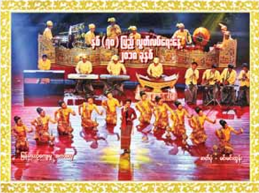
“မြန်မာနိုင်ငံဟာ တိုင်းရင်းသားလူမျိုးစု အများအပြား နေထိုင်တဲ့ နိုင်ငံတစ်နိုင်ငံဖြစ်ပြီး မတူကွဲပြားတဲ့ ယဉ်ကျေးမှုစလေ့ထုံးတမ်းတွေ၊ ယုံကြည်ကိုးကွယ်မှုအမျိုးမျိုးတို့လည်း နှစ်ကွဲတည်ရှိနေပါတယ်။ မတူကွဲပြားမှုတွေအကြားမှာ လိုက်လျောညီထွေ သဟဇာတဖြစ်ရေးနဲ့ ညီညွတ်စွာ ပေါင်းစည်းနိုင်ရေးဟာ အလွန်အရေးကြီးပါတယ်။ ဒီလိုပေါင်းစည်းရာမှာ အားလုံးသဘောတူ လက်ခံနိုင်တဲ့ ဖက်ဒရယ်ပြည်ထောင်စုစနစ်တစ်ရပ် ပေါ်ထွန်းလာဖို့ လိုအပ်နေပါတယ်” (နိုင်ငံတော်သမ္မတ ဦးထင်ကျော်၏ ၁၅-၉-၂၀၁၇ ရက်နေ့ (၇)နှစ်မြောက် အပြည်ပြည်ဆိုင်ရာ ဒီမိုကရေစီနေ့ အခမ်းအနားသို့ ပေးပို့သည့် သဝဏ်လွှာမှ ကောက်နုတ်ချက်)

❖ စာမျက်နှာ ၆ မှ ဗိုလ်ချုပ်၏မိန့်ခွန်းသည် နားထောင်ရာတွင် နားဝင်မချီသော်လည်း ထိထိမိမိရှိလှသည်။ နိုင်ငံသားအားလုံး သတိထားရမည့် အချက်ကို ထိထိမိမိ ပြောခဲ့ခြင်းဖြစ်သည်။ လက်ရှိအချိန်အထိလည်း ထင်ဟပ်မှန်ကန်နေဆဲပင်ဖြစ်သည်။ ထိုမိန့်ခွန်း၏ အနှစ်သာရသည် ကမ္ဘာတည်သရွေ့ ဆက်လက်မှန်ကန်နေမည်ဖြစ်သည်။ တိုင်းပြည်တစ်ခု တည်ဆောက်ရာတွင် တိုင်းရင်းသားစည်းလုံးညီညွတ်မှုသည် မည်မျှအရေးပါနေကြောင်းကို အနာဂတ်ကို မြော်တွေးကာ သတိပေးသွားခြင်းဖြစ်သည်။ ထာဝရငြိမ်းချမ်းရေးတည်ဆောက် လွတ်လပ်ရေးရရှိခဲ့သည့်အချိန်ကာလသည် အနှစ်(၇၀)ပြည့်တော်မူမည်ဖြစ်သည်။ တစ်မြေတည်းနေ၊ တစ်ရေတည်းသောက်၊ မရှိအတူ၊ ရှိအတူနေထိုင်ခဲ့ကြသည့် တိုင်းရင်းသား ညီအစ်ကိုများအကြား စားပွဲပိုင်းတွင် ဆွေးနွေး တိုင်ပင်ညှိနှိုင်းသွားမည်ဆိုလျှင် (Win-Win)ရလဒ်ရရှိနိုင်ပေသည်။ မတူညီမှုများကို ဖယ်ရှားကာ တူညီသောအချက်များဖြင့် စတင် ဆွေးနွေးသင့်နေပြီ ဖြစ်သည်။ တိုင်းရင်းသား စည်းလုံးညီညွတ်မှုသည် နိုင်ငံတစ်နိုင်ငံ၏ လွတ်လပ်ရေးအခွန်ရှည် တည်တံ့ခိုင်မြဲနေစေရန်အတွက် အသက်တမျှ အရေးပါလျက်ရှိသည်။ စည်းလုံးညီညွတ်မှုအင်အားချည့်နဲ့ယိုယွင်းလာသော နိုင်ငံသည် အဘက်ဘက်မှ အနှုတ်လက္ခဏာ ဆောင်လာမည်ဖြစ်သည်။ သာဓကအနေဖြင့် တချို့သော အရှေ့အလယ်ပိုင်းနိုင်ငံများကို သင်ခန်းစာယူသင့်သည်။ ထိုနိုင်ငံများရှိ ပြည်သူများသည် ဒုက္ခပင်လယ်ဝေနေကြသည်။ ကလေးငယ်များသည် အနာဂတ်ပျောက်ဆုံးနေကြသည်။ ထို့အပြင် စည်းလုံးညီညွတ်မှုပြိုကွဲလျှင် နိုင်ငံလည်း အစိတ်စိတ်အမြွှာမြွှာပြိုကွဲသွားနိုင်ပေသည်။ ဆိုလိုသည်မှာ တိုင်းရင်းသား