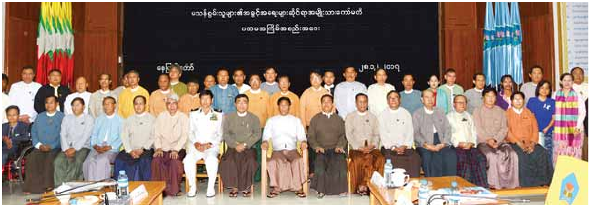
ဒုတိယသမ္မတ ဦးဟင်နရီဗန်ထီးယူ မသန်စွမ်းသူများ၏ အခွင့်အရေးများဆိုင်ရာ အမျိုးသားကော်မတီ၏ ပထမအကြိမ် အစည်းအဝေးသို့ တက်ရောက်လာကြသူများနှင့်အတူ မှတ်တမ်းတင်ဓာတ်ပုံရိုက်စဉ်။

* ရှေ့ဖူးမှု အမျိုးအစားအလိုက် လိုအပ်သော သင်ထောက်ကူ ပစ္စည်းများထောက်ပံ့ပေးခြင်း စသည့် ရုပ်ဝတ္ထုဆိုင်ရာများ ဖြည့်ဆည်းပေးမှု အားနည်းခြင်း၊ မျက်မမြင် လက်စမ်းစာနှင့် လက်သင်္ကေတပြဘာသာစကားတို့ တတ်မြောက်သည့် ဆရာ ဆရာမများနှင့် မသန်စွမ်းသူ ဆရာဆရာမများ စသည့် လူစွမ်းအားအရင်း အမြစ်ဆိုင်ရာများ ဖြည့်ဆည်းပေးမှုများ မရှိခြင်းနှင့် မသန်စွမ်းသူအပေါ် နားလည် သဘောပေါက်မှု အမြင်သဘောထားဆိုင်ရာ အတားအဆီးများကို ယနေ့တိုင် မြင်တွေ့ကြားသိနေရဆဲဖြစ်ပါကြောင်း။