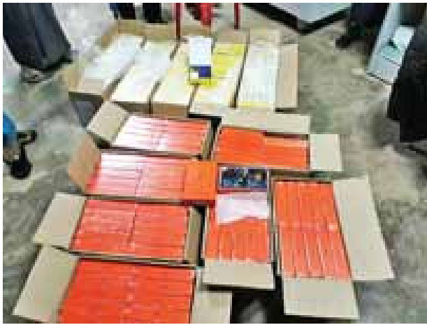
ကျပ် ၂ ဒသမ ၅၅၅ သန်းခန့် စုစုပေါင်း တားဆီးနိုင်ခဲ့မှု ငါးမူ (ခန့်မှန်းတန်ဖိုး ကျပ် ၁၁ ဒသမ ၄၃၅ သန်းခန့်) သိမ်းဆည်းရမိခဲ့ကြောင်း အကောက်ခွန်ဦးစီး ဌာနမှ သိရသည်။

မြန်မာနိုင်ငံအထက်ပိုင်းတွင် ရေပူအမြဲတမ်း စစ်ဆေးရေးစခန်းနှင့် မြန်မာနိုင်ငံ အောက်ပိုင်းတွင် မရမ်းချောင်းအမြဲတမ်း စစ်ဆေးရေးစခန်းတို့ကို ဖွင့်လှစ်၍ တရားမဝင်ကုန်စည်များ တားဆီးစစ်ဆေးဆောင်ရွက်လျက်ရှိရာ ဒီဇင်ဘာ ၂၇ ရက်က ရေပူအမြဲတမ်းစစ်ဆေးရေးစခန်းတွင် တရားမဝင် ကုန်စည် တားဆီးနိုင်ခဲ့မှု နှစ်မူ (ခန့်မှန်းတန်ဖိုး ကျပ် ၈ ဒသမ ၈၈၀ သန်းခန့်)၊ မရမ်းချောင်းအမြဲတမ်း စစ်ဆေးရေးစခန်းတွင် တားဆီးမှု သုံးမူ (ခန့်မှန်းတန်ဖိုး