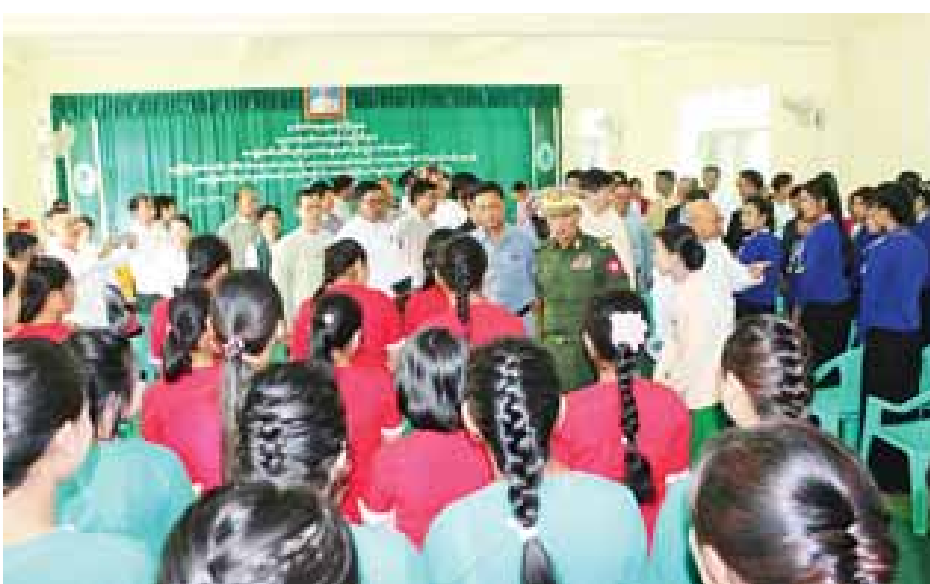
နေပြည်တော် ဒီဇင်ဘာ ၂၈