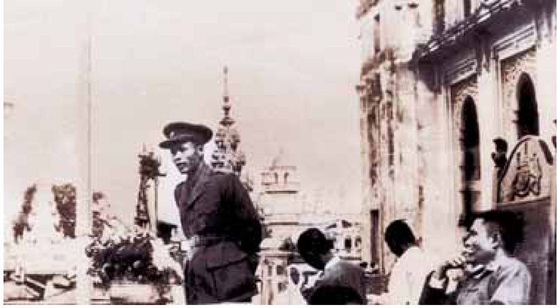
လွတ်လပ်ရေးဗိသုကာ အမျိုးသားခေါင်းဆောင်ကြီး ဗိုလ်ချုပ်အောင်ဆန်း ၁၉၄၇ ခုနှစ် ဇူလိုင် ၁၃ ရက်က ရန်ကုန်မြို့တော်ခန်းမကြီး၌ ပြုလုပ်သည့် ပြည်သူ့အစည်းအဝေးကြီး၌ မိန့်ခွန်းပြောကြားနေစဉ်။

တပ်မတော်ဖွဲ့စည်း ထိုစဉ်က မြန်မာ့လွတ်လပ်ရေး၏ ဗိသုကာဖြစ်သည့် ဗိုလ်ချုပ်အောင်ဆန်းသည် ရန်ကုန်တက္ကသိုလ်တွင် ပညာဆည်းပူးလျက် အမျိုးသားရေးလှုပ်ရှားမှုများကို စွမ်းစွမ်းတမ်းဆောင်ရွက်လျက်ရှိသည်။ လွတ်လပ်ရေးအတွက် တိတ်တဆိတ် ကြိုးပမ်းလှုပ်ရှားနေရသော သခင်အောင်ဆန်းဦးဆောင်သည့် အဖွဲ့ဝင်များကို ကိုလိုနီနယ်ချဲ့များက ဖမ်းဆီးထောင်သွင်း အကျဉ်းချမှုများ အရှိန်မြှင့်ဆောင်ရွက်လာခဲ့သည်။ သခင်အောင်ဆန်းသည် နယ်ချဲ့တို့၏ ဖမ်းဆီးမှုမှ လွတ်မြောက်အောင် လိမ္မာပါးနပ်စွာရှောင်ရှားလျက် လွတ်လပ်ရေးအတွက် ဆက်လက်ကြိုးပမ်းခဲ့ရသည်။ ထို့အပြင် လွတ်လပ်ရေးအတွက် နယ်ချဲ့