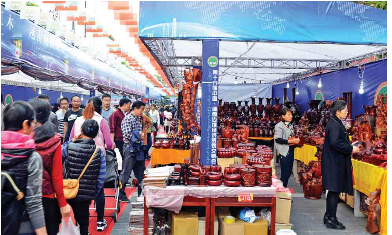
ရွှေလီမြို့ ကျင့်ချိန်ကျောက်မျက်ရတနာပြတိုက်၌ ကျင်းပသည့် တရုတ်-မြန်မာ နယ်စပ်ကုန်သွယ်ရေးနှင့် ကုန်သွယ်မှုပြပွဲတွင် လေ့လာဝယ်ယူသူများဖြင့် စည်ကားလျက်ရှိသည်ကို တွေ့ရစဉ်။

“ဒီပြပွဲမှာ လျှော်ဖြူနဲ့ ငှက်သိုက်ထုတ်ကုန်တွေကို လေ့လာဝယ်ယူကြ သူတွေ တော်တော်လေးများကြတာကို စာမျက်နှာ ၉ ကော်လံ ၁ သို့