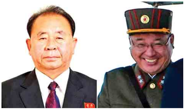
မြောက်ကိုရီးယားနိုင်ငံအပေါ် အမေရိကန်ဘဏ္ဍာရေးဌာန၏ စီးပွားရေး ပိတ်ဆို့မှုဆိုင်ရာ ထုတ်ပြန်ကြေညာချက်သည် သမ္မတ ဒေါ်နယ်ထရန် ရာထူးတာဝန်များ စတင်ထမ်းရွက်သည့်အချိန်မှစပြီး ခုနစ်ကြိမ်မြောက် ဖြစ်သည်။

နိုဝင်ဘာလအတွင်း ပြုယမ်း၏ ခုံးကျည်ပစ်လွှတ်စမ်းသပ်မှုကို တုံ့ပြန် သည့်အနေဖြင့် ကုလသမဂ္ဂလုံခြုံရေးကောင်စီက ဒီဇင်ဘာ ၂၂ ရက်တွင် ချမှတ်ခဲ့သည့် ဖြေရှင်းချက်တွင်လည်း ကင်ဂျီဆက်ခံနှင့် ရီပြောင်ချိုတို့ ပါဝင် ခဲ့ကြသည်။