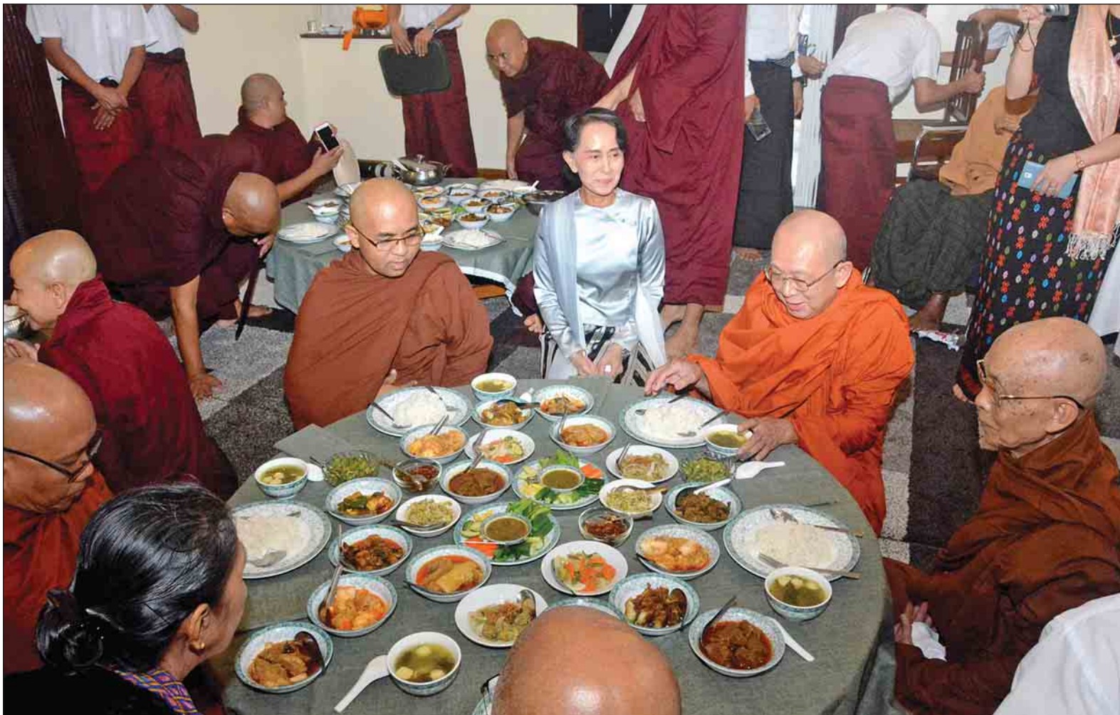
အမျိုးသားခေါင်းဆောင်ကြီး ပိုလန်ချုပ်အောင်ဆန်း၏ ဇနီး ဒေါ်ခင်ကြည် ကွယ်လွန်ခြင်း (၂၉) နှစ်ပြည့် နှစ်ပတ်လည် ဆွမ်းကျွေးအလှူတွင် ချမ်းမြေ့ရိပ်သာဆရာတော် အရှင်ဇနကာဘိဝံသ အမှူးပြုသော သံဃာတော်များအား နိုင်ငံတော်၏အတိုင်ပင်ခံပုဂ္ဂိုလ် ဒေါ်အောင်ဆန်းစုကြည် ဆွမ်းဆက်ကပ်စဉ်။