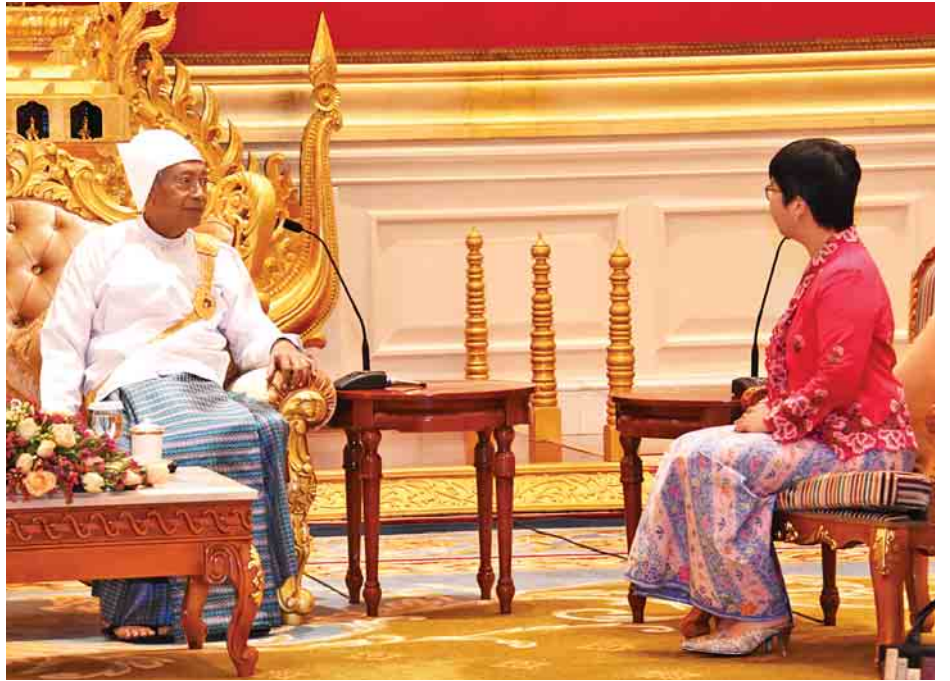
နိုင်ငံတော်သမ္မတ ဦးထင်ကျော် စင်ကာပူသမ္မတနိုင်ငံ သံအမတ်ကြီး မစ္စ ဗန်နက်ဆာ ချန်ယွမ်ရင် အား လက်ခံတွေ့ဆုံစဉ်။