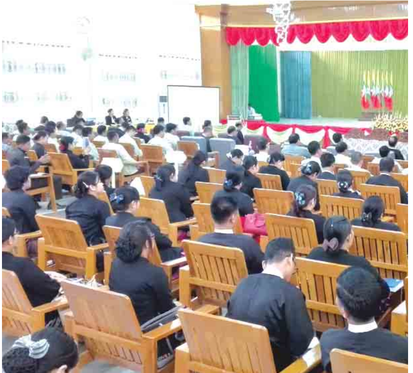
ဆက်လက်၍ တက်ရောက်ကြသော ရဲတပ်ဖွဲ့၊ ဥပဒေ၊ တရားရေး၊ အထွေထွေအုပ်ချုပ်ရေးဌာန တို့အား အုပ်စုလေးစုခွဲပြီး မိမိတို့မြို့နယ်အတွင်းရှိ တရားဥပဒေစိုးမိုးရေး အခက်အခဲများ ဖော်ထုတ် ခြင်း၊ မိမိမြို့နယ်အတွက် တရားဥပဒေစိုးမိုးရေး ပိုမိုကောင်းမွန်လာအောင် မည်သို့သောလုပ်ငန်း ကဏ္ဍမျိုးလုပ်ဆောင်သင့်သည်နှင့် တိုင်းဒေသကြီး တရားဥပဒေစိုးမိုးရေးဌာနနှင့် တရားမှုတစ်ဆိုင်ရာလုပ်ငန်းများ ပေါင်းစပ်ညှိနှိုင်းရေးအဖွဲ့ခွဲ အနေဖြင့်ရှေ့ဆောင်ရွက်မည့် လုပ်ငန်းဆိုင်ရာ မဟာဗျူဟာ စီမံချက်ရေးဆွဲသည့်အခါ စဉ်းစား သင့်သည့် အကြောင်းအရာများ၊ အကြံပြုချက်များ စသည့် ခေါင်းစဉ်များအောက်တွင် ဆွေးနွေးကြသည်။ အဆိုပါဆွေးနွေးပွဲသို့ ဝန်ကြီးချုပ်၊ လွှတ်တော် ဥက္ကဋ္ဌ၊ ဝန်ကြီးများ၊ လွှတ်တော်ဒုတိယဥက္ကဋ္ဌ၊ ဥပဒေ ချုပ်၊ အစိုးရအဖွဲ့ အတွင်းရေးမှူးနှင့်ဌာနဆိုင်ရာ များ၊ တိုင်းဒေသကြီး တရားဥပဒေစိုးမိုးရေးနှင့် တရားမှုတစ်ဆိုင်ရာလုပ်ငန်းများ ပေါင်းစပ် ညှိနှိုင်းရေးအဖွဲ့ တာဝန်ခံ၊ အဖွဲ့ဝင်များ၊ တရား သူကြီးများ၊ မြို့နယ်အုပ်ချုပ်ရေးမှူးများ၊ မြို့နယ် ရဲတပ်ဖွဲ့မှူးများနှင့် မြို့နယ် ဥပဒေအရာရှိများ တက်ရောက်ကြကြောင်း သိရသည်။ တင်စိုး(ပဲခူး)

ပဲခူး ဒီဇင်ဘာ ၂၇ ပဲခူးမြို့ မြို့တော်ခန်းမ၌ ဒီဇင်ဘာ ၂၇ ရက် နံနက် ၉ နာရီက ပဲခူးတိုင်းဒေသကြီး တရားဥပဒေစိုးမိုးရေး ဌာနနှင့် တရားမှုတစ်ဆိုင်ရာလုပ်ငန်းများ ပေါင်းစပ် ညှိနှိုင်းရေးအဖွဲ့ခွဲ၏ တရားဥပဒေစိုးမိုးရေးဆိုင်ရာ အလုပ်ရုံဆွေးနွေးပွဲ ကျင်းပခဲ့ကြောင်း သိရသည်။ ပဲခူးတိုင်းဒေသကြီး ဝန်ကြီးချုပ် ဦးဝင်းသိန်းက တရားဥပဒေစိုးမိုးမှုမရှိပါက မတည်ငြိမ်နိုင်သလို ပြည်သူ့ဘဝများလည်း မလုံခြုံတော့ကြောင်း၊ တည် ငြိမ်အေးချမ်းမှုမရှိသည့်အတွက် စီးပွားရေးလည်း လုပ်လို့ရမည်မဟုတ်ကြောင်း၊ ပြည်သူများမိမိတို့၏ အိုးအိမ်များတွင် လုံလုံခြုံခြုံချမ်းသာသောအဖွင့် နေထိုင်နိုင်ရန်အရေးကြီးကြောင်း၊ တရားဥပဒေစိုးမိုး ရေးအတွက် ဌာနဆိုင်ရာလုပ်ငန်းများကို ဥပဒေနှင့် အညီ တာဝန်ထမ်းခြင်းသည် တရားဥပဒေစိုးမိုးရေး လုပ်ငန်းစဉ်များကို ဆောင်ရွက်နေခြင်းဖြစ်သည်ဟု မှတ်ယူစေချင်ကြောင်း၊ ပြည်သူများ ဥပဒေ အသိ ပညာတိုးပွားလာအောင် ပညာပေးဟောပြောပွဲများ လုပ်ပေးခြင်းဖြင့် တရားဥပဒေစိုးမိုးရေးအတွက် အထောက်အကူရရှိမှာဖြစ်ကြောင်း ပြောကြား သည်။