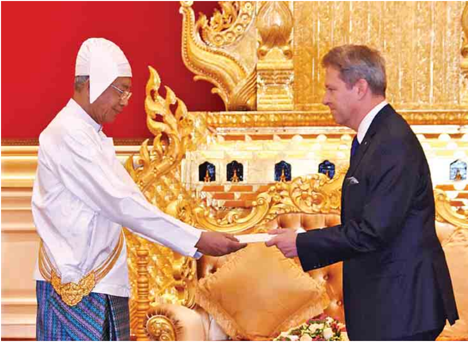
နိုင်ငံတော်သမ္မတ ဦးထင်ကျော်ထံ ပိုလန်နိုင်ငံသံအမတ်ကြီး မစ္စတာ ဗယ်လဒယ်မာရ် ဒုဘန်နရောစကီး က ၎င်း၏သံအမတ်ခန့်အပ်လွှာကို ပေးအပ်စဉ်။