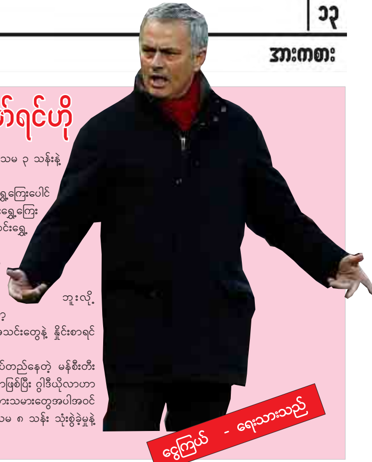
ကြေးမုံ - ရေးသားသည်

အဲဒီလိုပြောခဲ့တာဟာ ပရီမီယာလိဂ်မှာ ထိပ်ဆုံးမှာရပ်တည်နေတဲ့ မန်စီးစီး အသင်းရဲ့ နည်းပြ ဂျီဒီယိုလာရဲ့ သုံးစွဲမှုကို နှိုင်းယှဉ်ပြောခဲ့တာဖြစ်ပြီး ဂျီဒီယိုလာဟာ နီလီတိုး၊ ဂျွန်စတူး၊ ကီလီဂေါ်ကာ၊ ဆာဇေး စတဲ့ကစားသမားတွေအပါအဝင် ကစားသမား ၁၇ ဦးကို ပြောင်းရွှေ့ကြေးပေါင် ၄၀၃ ဒသမ ၈ သန်း သုံးစွဲခဲ့မှုနဲ့ နမူနာထား ပြောကြားခဲ့တာဖြစ်ပါတယ်။