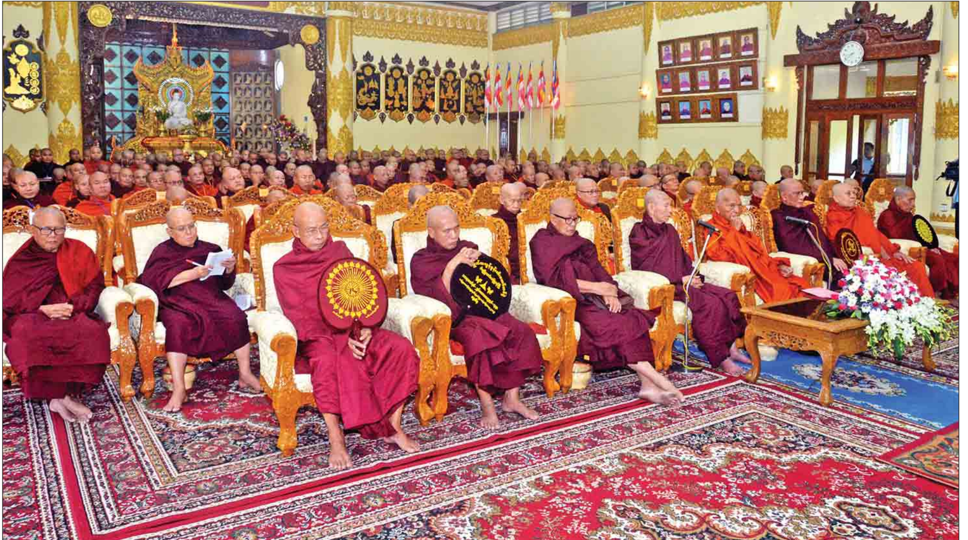
အကြိမ်(၇၀)မြောက် တိပိဋကဓရ တိပိဋကကောဝိဒ ရွေးချယ်ရေး စာမေးပွဲ ဖွင့်ပွဲအခမ်းအနားကို ရန်ကုန်မြို့၊ ကမ္ဘာအေးကုန်းမြေရှိ ဝိယမင်္ဂလာဓမ္မသဘင်၌ ကျင်းပစဉ်။