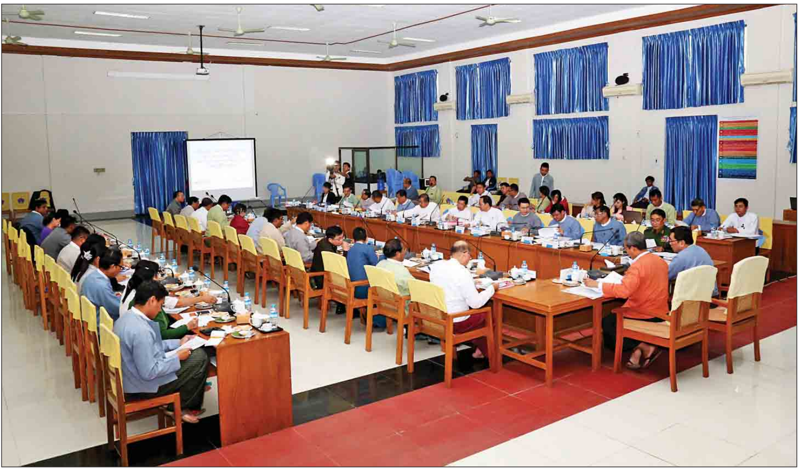
ရခိုင်ပြည်နယ်ဆိုင်ရာ အကြံပြုချက်များအပေါ် အကောင်အထည်ဖော် ဆောင်ရွက်ရေးကော်မတီ၏ (၆/၂၀၁၇)လုပ်ငန်းညှိနှိုင်းအစည်းအဝေး ကျင်းပစဉ်။

နေပြည်တော် ဒီဇင်ဘာ ၂၆ ရခိုင်ပြည်နယ်ဆိုင်ရာ အကြံပြုချက်များအပေါ် အကောင်အထည်ဖော် ဆောင်ရွက်ရေးကော်မတီ၏ (၆/၂၀၁၇) လုပ်ငန်းညှိနှိုင်းအစည်းအဝေးကို ဒီဇင်ဘာ ၂၆ ရက် မွန်းလွဲပိုင်းတွင် လူမှုဝန်ထမ်း၊ ကယ်ဆယ်ရေးနှင့် ပြန်လည်နေရာချထားရေး ဝန်ကြီးဌာန အစည်းအဝေးခန်းမ၌ ကျင်းပရာ ရခိုင်ပြည်နယ်ဆိုင်ရာ အကြံပြုချက်များအပေါ် အကောင်အထည်ဖော် ဆောင်ရွက်ရေးကော်မတီ ဥက္ကဋ္ဌ လူမှုဝန်ထမ်း၊ ကယ်ဆယ်ရေးနှင့် ပြန်လည်နေရာချထားရေး ဝန်ကြီးဌာန ပြည်ထောင်စုဝန်ကြီး ဒေါက်တာဝင်းမြတ်အေးက အဖွင့်အမှာစကား ပြောကြားရာတွင် ရခိုင်ပြည်နယ်ဆိုင်ရာ အကြံပြုချက်များအပေါ် အကောင်အထည်ဖော် ဆောင်ရွက်ရေးကော်မတီအနေဖြင့် ဆောင်ရွက်ရမည့် လုပ်ငန်းများကို ညှိနှိုင်းအစည်းအဝေးများ ကျင်းပ၍ လုပ်ငန်းများ ဆောင်ရွက်နေသည်မှာ ယခုအကြိမ်အပါအဝင် (၆)ကြိမ် ရှိနေပြီဖြစ်ကြောင်း၊ အစီရင်ခံစာ၏ အကြံပြု ဖော်ပြချက်များသည် ရခိုင်ဒေသ ဖွံ့ဖြိုးတိုးတက်ရေး၊ စာမျက်နှာ ၁၀ ကော်လံ ၁ သို့ *