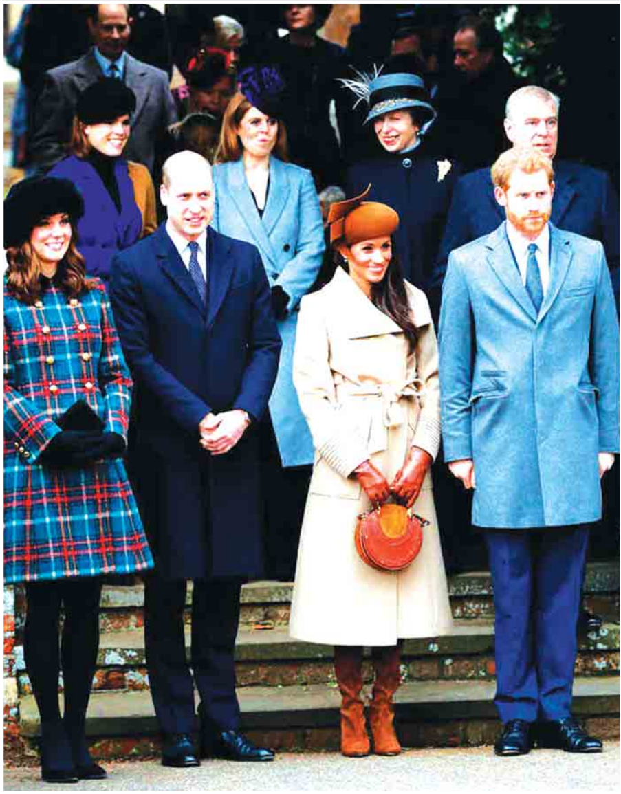
မင်းသား ဟယ်ရီနှင့် ခေမာမတ်တို့အား ချီးမြှင့်ပေးသော အခမ်းအနားမှာ ပထမဆုံးအကြိမ် ပါဝင်ဆင်နွှဲခဲ့တဲ့ ဟောလိဝုဒ်မင်းသမီး မက်ဂန်မာကယ်လ်အား မင်းသား ဝီလျံ၊ ဇနီးဖြစ်သူ ကတ်ထရစ်မီဒယ်တန်၊ မင်းသား ဟယ်ရီ တို့နှင့်အတူ ပြီးခဲ့တဲ့ ဒီဇင်ဘာ ၂၅ ရက်က စိန့်မယ်ရီမက်ဒယ်လင်းဘုရားကျောင်းမှာ ပြုလုပ်ခဲ့တဲ့ ခရစ္စမတ်နေ့ အခမ်းအနားမှာ တွေ့ရစဉ်။ (ယင်းအခမ်းအနားသို့ ဘုရင်မကြီး အဲလိဇဘတ်(၂)နှင့် မင်းသား ဖိလစ်တို့လည်း တက်ရောက်ခဲ့ကြသည်။)