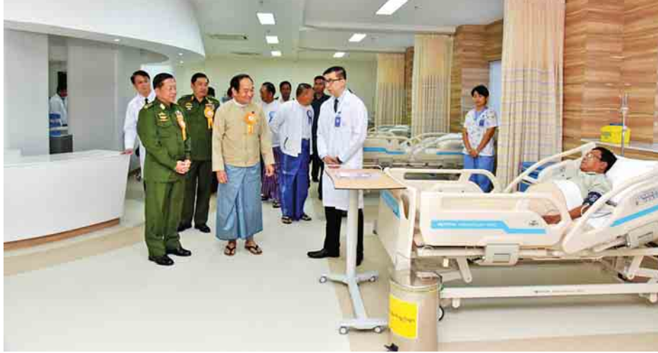
International Specialist Hospital သည် ရန်ကုန်မြို့ အမှတ် (၈၇) ပြည်လမ်း ၆ မိုင်ခွဲ အင်းလျားကန်ပေါင်အနီး၌ တည်ရှိသည်။

မြန်မာ့စီးပွားရေးကော်ပိုရေးရှင်း၏ Kan Thar Yar International Specialist Hospital ဖွင့်ပွဲ အခမ်းအနားကို ယနေ့နံနက်ပိုင်းက ရန်ကုန်မြို့ အမှတ်(၈၇) ပြည်လမ်း ၆ မိုင်ခွဲ အင်းလျားကန်ပေါင်အနီးရှိ အဆိုပါ အထူးကုဆေးရုံကြီး၌ ကျင်းပရာ တပ်မတော် ကာကွယ်ရေးဦးစီးချုပ် ဗိုလ်ချုပ်မှူးကြီး မင်းအောင်လှိုင် တက်ရောက်ဖွင့်လှစ်ပေးသည်။