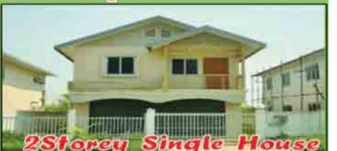
2Storey Single House