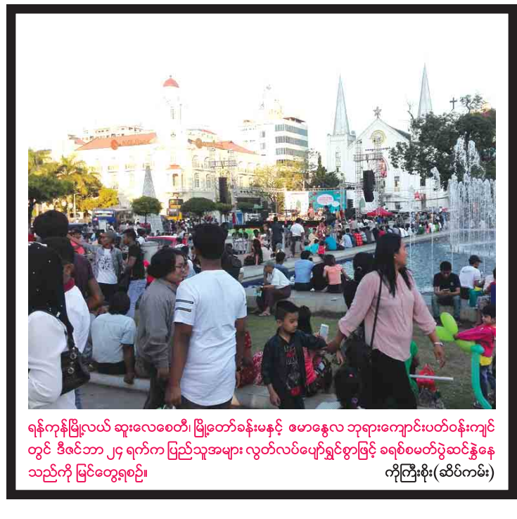
ရန်ကုန်မြို့လယ် ဆူးလေစေတီ၊ မြို့တော်ခန်းမနှင့် ဧမာန္တလ ဘုရားကျောင်းပတ်ဝန်းကျင် တွင် ဒီဇင်ဘာ ၂၄ ရက်က ပြည်သူများ လွတ်လပ်ပျော်ရွှင်စွာဖြင့် ခရစ်စမတ်ပွဲဆင်နွှဲနေ သည်ကို မြင်တွေ့ရခြင်း။