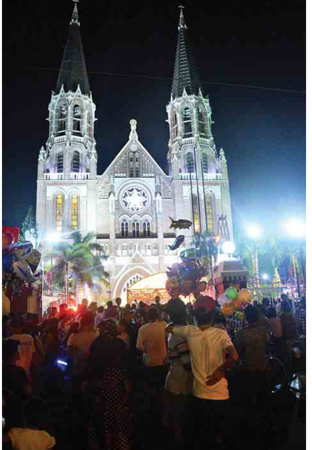
ဒီဇင်ဘာ ၂၅ ရက်(ခရစ္စမတ်နေ့) ညပိုင်းတွင် ဗိုလ်အောင်ကျော်လမ်းရှိ စိန့်မေရီဘုရားကျောင်း၌ လူအများစည်ကားလျက်ရှိသည်ကို တွေ့ရစဉ်။

ခရီးသွား သော့ချိတ်များနှင့် စားစရာများကို စတုဒိသာဝေပေးခြင်းများ ပြုလုပ်ခဲ့သည်။ “ဒီနေ့ မိသားစုနဲ့အတူ လျှောက်သွားတယ်။ စတိတ်ရှိုးတွေ လိုက်ကြည့်တယ်။ ဈေးဝယ်စင်တာတွေ သွားတယ်။ ဘယ်နေရာကြည့်ကြည့် တခြား မိသားစုတွေလည်း ညီမတို့လိုပဲ သွားနေကြတာ တွေ့ရတယ်။ မီးရောင်စုံတွေနဲ့ ဓာတ်ပုံရိုက်ရတာ၊ အတူမုန့်စားကြတာ ဘာပဲပြောပြော ခရစ္စမတ်အရသာကို ခံစားမိစေတာပဲ။ ပျော်ဖို့ကောင်းတယ်” ဟု သယ်နန်းကျွန်းမြို့နယ်နေ မမသော်က ပြောသည်။ ဒီဇင်ဘာ ၂၅ ရက်သည် ခရစ်ယာန်ဘာသာဝင်များ၏ နေ့ထူးနေ့မြတ် ဖြစ်သည်။ ထို့နေ့တွင် လူသားအားလုံးကို အပြစ်အပေါင်းမှ ကယ်ချွတ်ရန် မွေးဖွားလာခဲ့သည့် သခင်ယေရှု၏ မွေးနေ့ပွဲတော်ကို ကျင်းပခြင်း ဖြစ်သည်။ မွေးနေ့ပွဲမှသည် လူသားအားလုံးငြိမ်သက်အေးချမ်းခြင်းနှင့်အတူ ချစ်ခြင်းမေတ္တာကို ရရှိစေရန်အလို့ငှာ ခရစ်ယာန်ဘာသာဝင်များသည် ယခုကဲ့သို့ နှစ်စဉ်မပျက် ခရစ္စမတ်ပွဲတော်ကို အမြတ်တနိုးတန်ဖိုးထား ကျင်းပကြခြင်း ဖြစ်သည်။ သတင်း-ခင်ဇော်၊ ဓာတ်ပုံ-အေးမင်းသူ