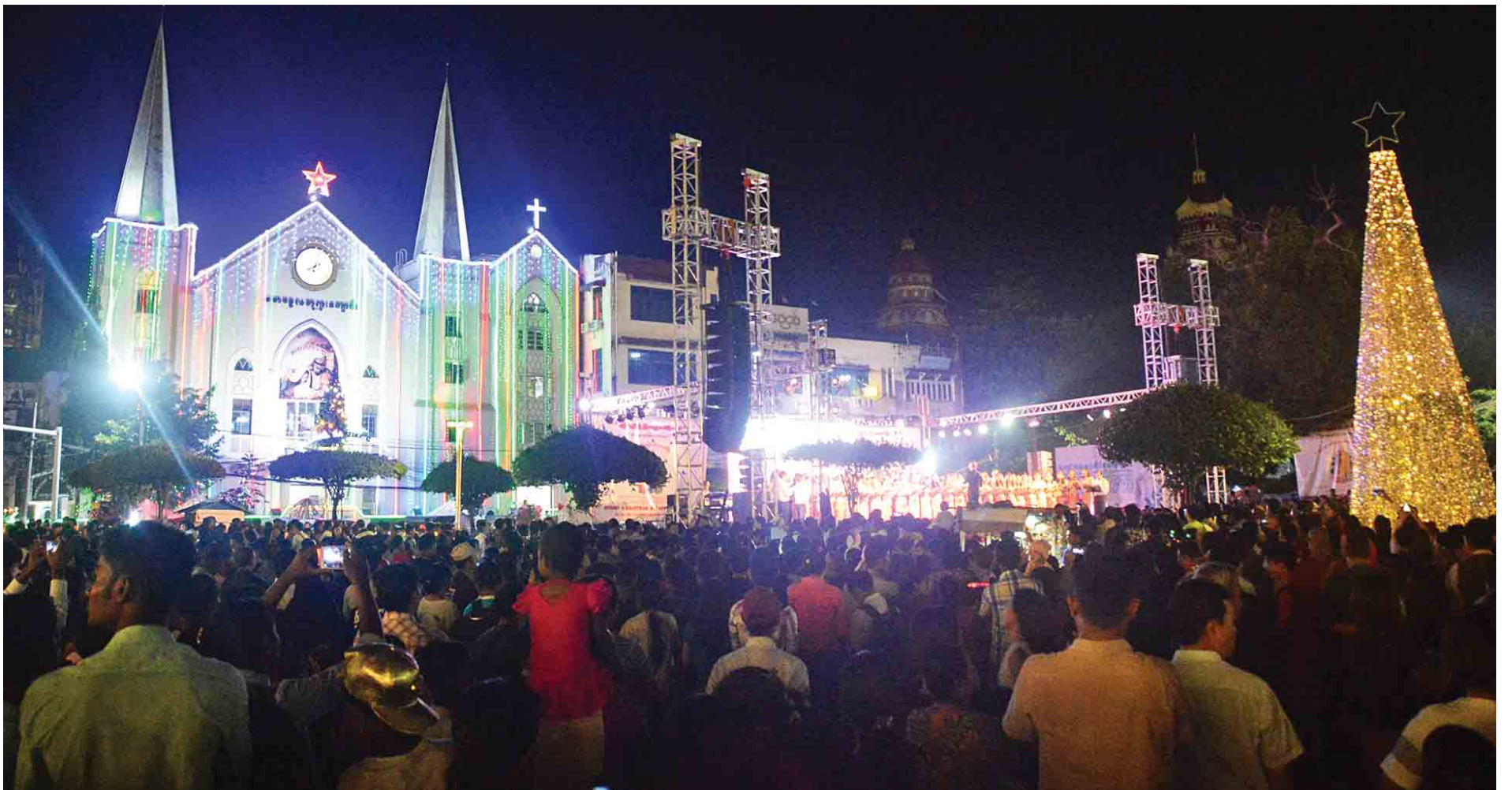
ဒီဇင်ဘာ ၂၅ ရက်(ခရစ္စမတ်နေ့) ညပိုင်းတွင် ရန်ကုန်မြို့၊ မြို့တော်ခန်းမအနီးရှိ မောဇွေလဘုရားကျောင်းနှင့် တေးဂီတဖျော်ဖြေမှုတို့တွင် လူအများ စည်ကားလျက်ရှိသည်ကို တွေ့ရစဉ်။

ယင်းနေရာများတွင် ယနေ့ညနေ ၆ နာရီမှ ည ၁၀ နာရီထိ နိုင်ငံကျော် တေးသံရှင်များက တေးသီချင်းများဖြင့် သီဆိုဖျော်ဖြေခြင်း၊ Carol Singing သီဆိုခြင်း၊ ခရစ္စမတ်နိပါတ်တော်များ ပြသခြင်းနှင့် ခရစ္စမတ်သင်္ကေတ လက်ဆောင်များ၊ ဦးထုပ်များ၊ စာမျက်နှာ ၈ ကော်လံ ၅ သို့ □