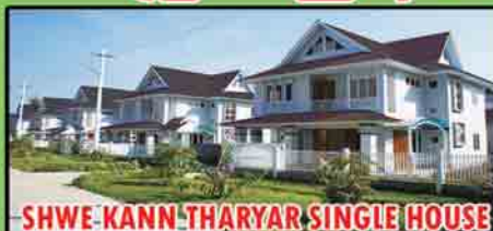
SHWE-KANN-THARYAR SINGLE HOUSE