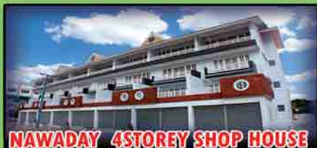
NAWADAY 4STOREY SHOP HOUSE