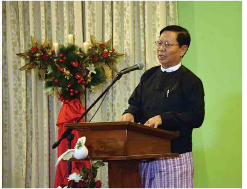
မြန်မာနိုင်ငံ ဧဝံဂေလိခရစ်ယာန် မဟာမိတ်အဖွဲ့ချုပ်(MECA) ၏ ခရစ်တော်မွေးနေ့(ခရစ္စမတ်)အကြို ဝတ်ပြုဆုတောင်းခြင်းနှင့် ကျေးဇူးတော်ချီးမွမ်းခြင်းအခမ်းအနားသို့ ဒုတိယသမ္မတ ဦးဟင်နရီဗန်ထီးယူနှင့် ဇနီး ဒေါက်တာရွှေလွမ်းတို့ တက်ရောက်စဉ်။ (ဝဲပုံ) နှင့် ပြည်ထောင်စုဝန်ကြီး သူရဦးအောင်ကိုက ခရစ္စမတ်နှုတ်ခွန်းဆက်စကား ပြောကြားစဉ်။ (ယာပုံ)