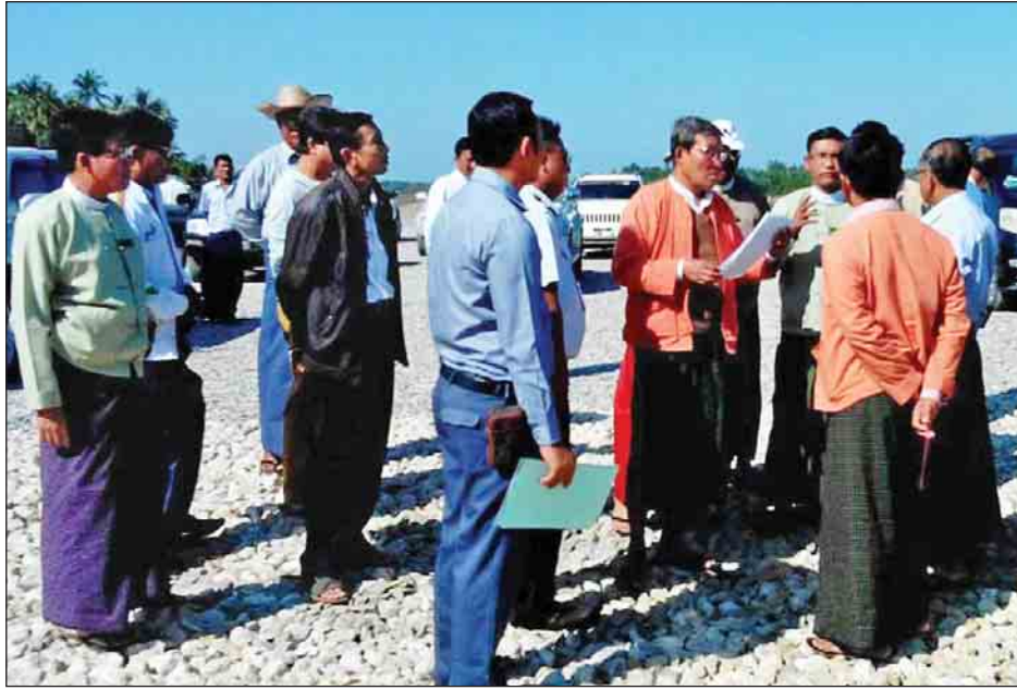
မာန်အောင် ဒီဇင်ဘာ ၂၄

ရခိုင်ပြည်နယ်ဝန်ကြီးချုပ် ဦးညီပုနှင့် ပြည်နယ်ဝန်ကြီးများသည် ယနေ့နံနက်ပိုင်းတွင် မာန်အောင်မြို့နယ်ခန်းမ၌ မြို့နယ်ဌာနဆိုင်ရာ တာဝန်ရှိသူများနှင့် တွေ့ဆုံပြီး ဒေသဖွံ့ဖြိုးရေးလုပ်ငန်းများနှင့် စပ်လျဉ်း၍ ဆွေးနွေးကြသည်။