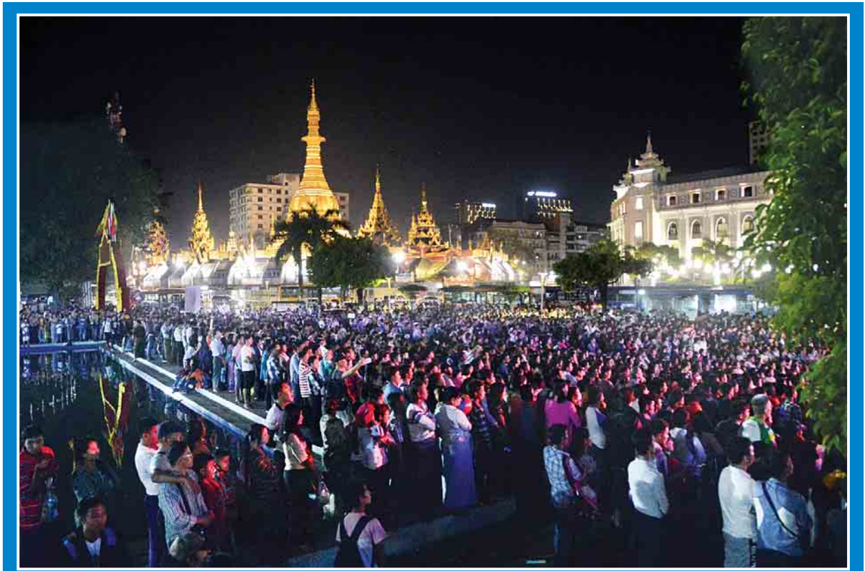
ဒီဇင်ဘာ ၂၄ ရက်(ခရစ္စမတ်အကြို) ညပိုင်းတွင် ရန်ကုန်မြို့ မြို့တော်ခန်းမရေရှိ တေးဂီတဖျော်ဖြေမှုကို လာရောက်ကြည့်ရှုသူများဖြင့် စည်ကားနေသည်ကို တွေ့ရစဉ်။

ယင်းနောက်တပ်မတော်ကာကွယ်ရေးဦးစီးချုပ်နှင့် အဖွဲ့ဝင်များသည် တပ်တော်ဝင် စစ်ရေယာဉ်များဖြစ်သော သံချပ်ကာယာဉ်များတင်ဆောင်ထား သည့် ၅၆ မိတာတင်ကားတင် ကမ်းထိုးရေယာဉ်များနှင့် ၂၉ မိတာကမ်းထိုး ရေယာဉ်များအား ကြည့်ရှုစစ်ဆေးသည်။ စာမျက်နှာ ၉ ကော်လံ ၁ သို့ ❁