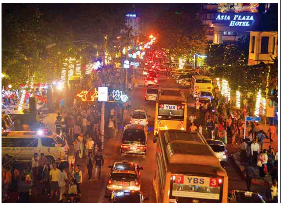
ဒီဇင်ဘာ ၂၄ ရက် (ခရစ္စမတ်အကြို) ညပိုင်းက ရန်ကုန်မြို့ ဗိုလ်ချုပ်အောင်ဆန်းလမ်းတစ်လျှောက်တွင် ခရစ္စမတ်ရောင်စုံမီးများဖြင့် စည်ကားနေသည်ကို တွေ့ရစဉ်။