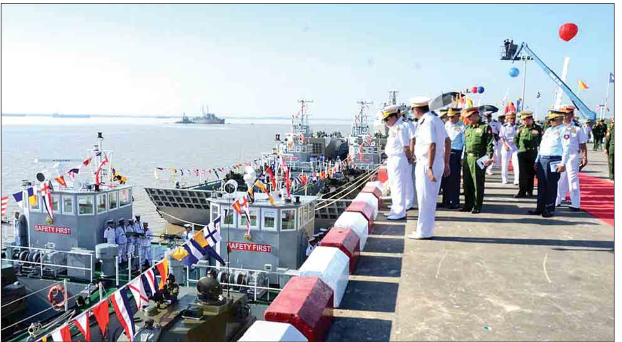
ကင်းလှည့်ရေယာဉ်တစ်စင်း၊ ၅၆ မီတာ တင့်ကားတင်ကမ်းထိုးရေယာဉ် နှစ်စင်းနှင့် ၂၉ မီတာ ကမ်းထိုးရေယာဉ်လေးစင်း စုစုပေါင်း ခုနစ်စင်းတို့တပ်တော်ဝင်ခြင်းဖြစ်သည်။ ထို့အတူ တပ်မတော်ကာကွယ်ရေးဦးစီးချုပ်နှင့် အဖွဲ့ဝင်များသည် နံနက်ပိုင်းကလည်း ရေတပ်သင်္ဘောကျင်းဌာနချုပ်၌ တပ်မတော်(ရေ)မှ ထုတ်လုပ်ထားရှိသည့် တပ်မတော်(ရေ)အသုံးအဆောင်ပစ္စည်းများ ရေတပ်သင်္ဘောကျင်းဌာနချုပ်ပြတိုက်နှင့် ရေတပ်သင်္ဘောကျင်းအတွင်း စစ်ရေယာဉ်များတည်ဆောက်နေမှုကို ကြည့်ရှုကြကြောင်း သတင်းရရှိသည်။ သတင်းစဉ်

ယနေ့ကျင်းပသည့် နှစ်(၇၀)ပြည့် တပ်မတော်(ရေ)နှစ်ပတ်လည်နေ့ အထိမ်းအမှတ် စစ်ရေယာဉ်များတပ်တော်ဝင်ခြင်းအခမ်းအနားတွင် ကမ်းလွန်