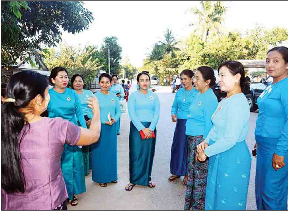
အဖွဲ့ချုပ်(ဗဟို)ဥက္ကဋ္ဌနှင့် အဖွဲ့အား အမျိုးသမီးရေးရာအဖွဲ့ ဥက္ကဋ္ဌ ဒေါက်တာမေမတ်ပယ်အောင်တို့က မြဝတီခရိုင်အမျိုးသမီးရေးရာအဖွဲ့၊ ဥက္ကဋ္ဌ ဒေါ်ယဉ်ယဉ်သိန်းနှင့် မြို့နယ် စီမံချက်ဆောင်ရွက်ထားမှု အခြေအနေများကို လိုက်လံရှင်းလင်းပြသ ခဲ့ကြောင်း သိရသည်။ ထိန်လင်းအောင်(ပြန်/ဆက်)

မြဝတီ ဒီဇင်ဘာ ၂၄ မြန်မာနိုင်ငံ အမျိုးသမီးရေးရာ အဖွဲ့ချုပ်(ဗဟို)ဥက္ကဋ္ဌ ဒေါက်တာ သက်သက်ဇင်သည် ယမန်နေ့က မြဝတီမြို့ရှိ ကျေးလက်ဒေသ အမျိုးသမီးများ ဖွံ့ဖြိုးတိုးတက်ရေး စီမံချက်ဆောင်ရွက်သည့် ကျေးရွာ များရှိ စီမံချက် အကောင်အထည်ဖော် ဆောင်ရွက်မှု အခြေအနေများကို ကြည့်ရှုစစ်ဆေးသည်။ ရှေးဦးစွာ ဝေ့ရှမ်းကျေးရွာသို့ ရောက်ရှိပြီး စီမံချက်အကောင်အထည် ဖော် စည်းရုံးဆောင်ရွက်လျက်ရှိသည့် ဆယ်အိမ်စုတိုက်စားလှယ် အမျိုးသမီး များနှင့် တွေ့ဆုံဆွေးနွေးသည်။ ယင်းနောက် မင်းလက်ပံ ကျေးရွာသို့ ရောက်ရှိပြီး ကျေးလက် အမျိုးသမီးများနှင့် ဆွေးနွေးခြင်း၊ နေအိမ်များအား နေအိမ် မီးဖိုချောင် သန့်ရှင်းရေး၊ ဝန်းကျင်သန့်ရှင်းရေးနှင့် စိမ်းလန်းစိုပြည်ရေး ဆောင်ရွက်ထားမှု အခြေအနေများကို ကြည့်ရှုသည်။ မြန်မာနိုင်ငံ အမျိုးသမီးရေးရာ