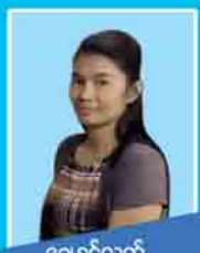
ခရုစင်လတ် ၈/ထာဝက(နိုင်)၀၆၄၆၀၀