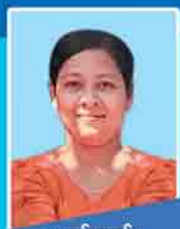
မတင်ဇာဝင်း TME 038048