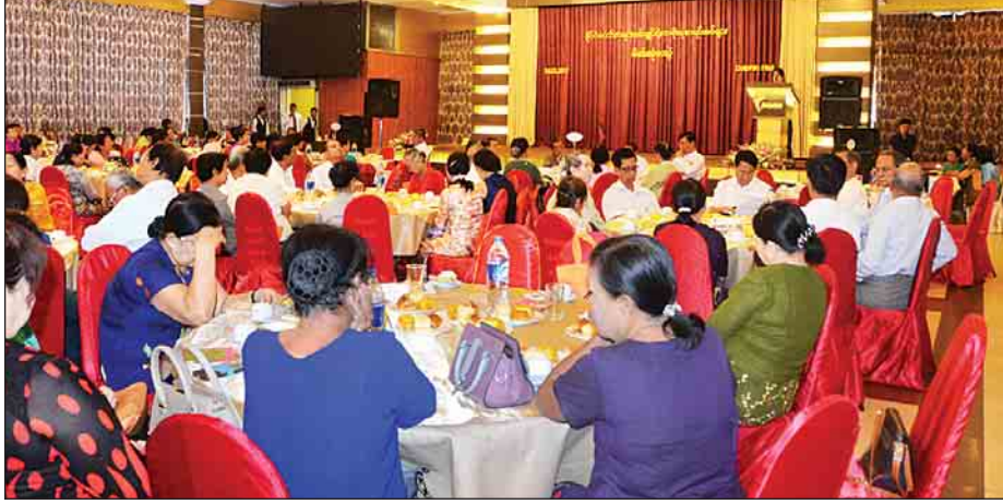
ရပ်များတွင် ထောက်ပံ့ကြေးငွေချီးမြှင့်ရန် စသည့် လုပ်ငန်း စဉ်များ ဆောင်ရွက်သွားမည်ဖြစ်ကြောင်း သိရသည်။ ယနေ့ အခမ်းအနားသို့ ပြည်ထောင်စုစာရင်းစစ်ချုပ် ဦးမော်သန်းနှင့် တာဝန်ရှိသူများ၊ လက်ရှိတာဝန် ထမ်းဆောင်ဆဲဝန်ထမ်းများ၊ တိုင်းဒေသကြီးနှင့်ပြည်နယ် အသီးသီးရှိ စာရင်းစစ်ဝန်ထမ်းဟောင်းများနှင့် ဖိတ်ကြား ထားသူများ တက်ရောက်ကြသည်။ သတင်း-ဇော်ညွှန်မောင်၊ ဓာတ်ပုံ-အေးမင်းသူ

ထမ်းဆောင်နေပါတယ်။ အသင်းဖွဲ့စည်းရတဲ့ ရည်ရွယ် ချက်ကတော့ စာရင်းစစ်တွေအားလုံးက အပြင်စာရင်းစစ် လောကကြီးမှာ လှုပ်ရှားနေတဲ့အချိန်မှာ တိုးတက်လာတဲ့ ခေတ်နဲ့အညီ စာရင်းစစ်ပညာ၊ စာရင်းကိုင်ပညာ ဒီဆရာ သမားတွေနဲ့ လက်လှမ်းမီ အချိတ်အဆက်မပြတ်အောင် လုပ်ကိုင်နိုင်ဖို့အတွက် အဓိကပါ။ နောက်ဆိုရင် စာရင်းစစ် ဝန်ထမ်းတွေကို ဖိတ်ခေါ်မယ်။ စာရင်းစစ်လုပ်ငန်းနဲ့ ပတ်သက်တာတွေ သိချင်တာတွေမေးမယ်။ ဆွေးနွေးကြ မယ်”ဟု ဒေါ်ချိုချိုက ပြောသည်။ ဝန်ထမ်းဟောင်းများအသင်းအနေဖြင့် အစိုးရ စာရင်းစစ်များနှင့် အစိုးရစာရင်းစစ်ပညာလေ့လာသူများ အတွက် စာကြည့်တိုက်ထူထောင်ရန်၊ အစိုးရစာရင်းစစ် ပညာဖွံ့ဖြိုးတိုးတက်ရန်အတွက် သက်ဆိုင်သူများထံမှ စာတမ်းများဖိတ်ခေါ်၍ ပုံနှိပ်ထုတ်ဝေရန်၊ အသင်းရန်ပုံငွေ ကျပ်သန်း ၂၀ ပြည့်ပါက အသင်းသားများ၏ နာရေးကိစ္စ