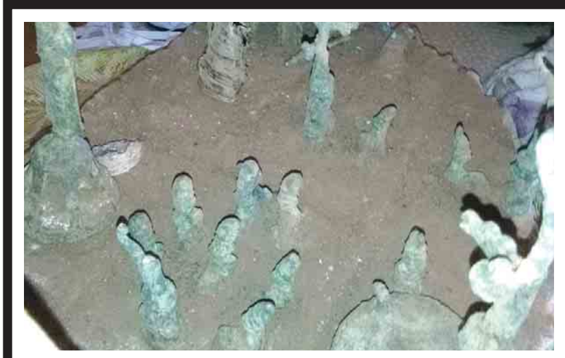
စစ်ကိုင်းတိုင်းဒေသကြီး မင်းကင်းမြို့နယ် ပသေးတိုက်နယ် ပသေးကျေးရွာ ပသေး အ - ဝ - က အနီး လယ်ကွင်းစပ်၌ ဒီဇင်ဘာဒုတိယပတ်ကတူးဖော်ရရှိခဲ့သော ညွှန်တော်တစ်ပေရှိ ကြေးဆင်းတု၊ စကျင်ဆင်းတု ရုပ်ပွားတော်သုံးဆူနှင့် အခြားငွေဆင်းတုရုပ်ပွားတော် စုစုပေါင်း ၅၀ ကိုတွေ့ရစဉ်။ ရန်လင်း